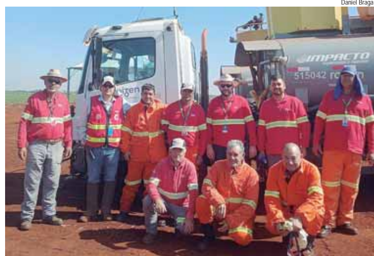
Companhia conta com uma rede de pessoas prontas para proteger vidas, operações e o meio ambiente

em infraestrutura turística da história de São Pedro. Cada obra foi planejada para valorizar nossas vocações, preservar nosso patrimônio natural e preparar a cidade para um novo ciclo de crescimento, a fim de consolidar São Pedro como um dos principais destinos turísticos do Estado de São Paulo", disse.