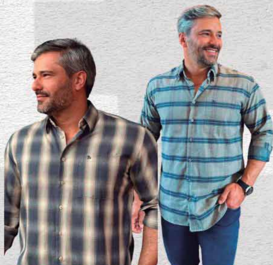
FLANELA MASCULINA R$ 299,90