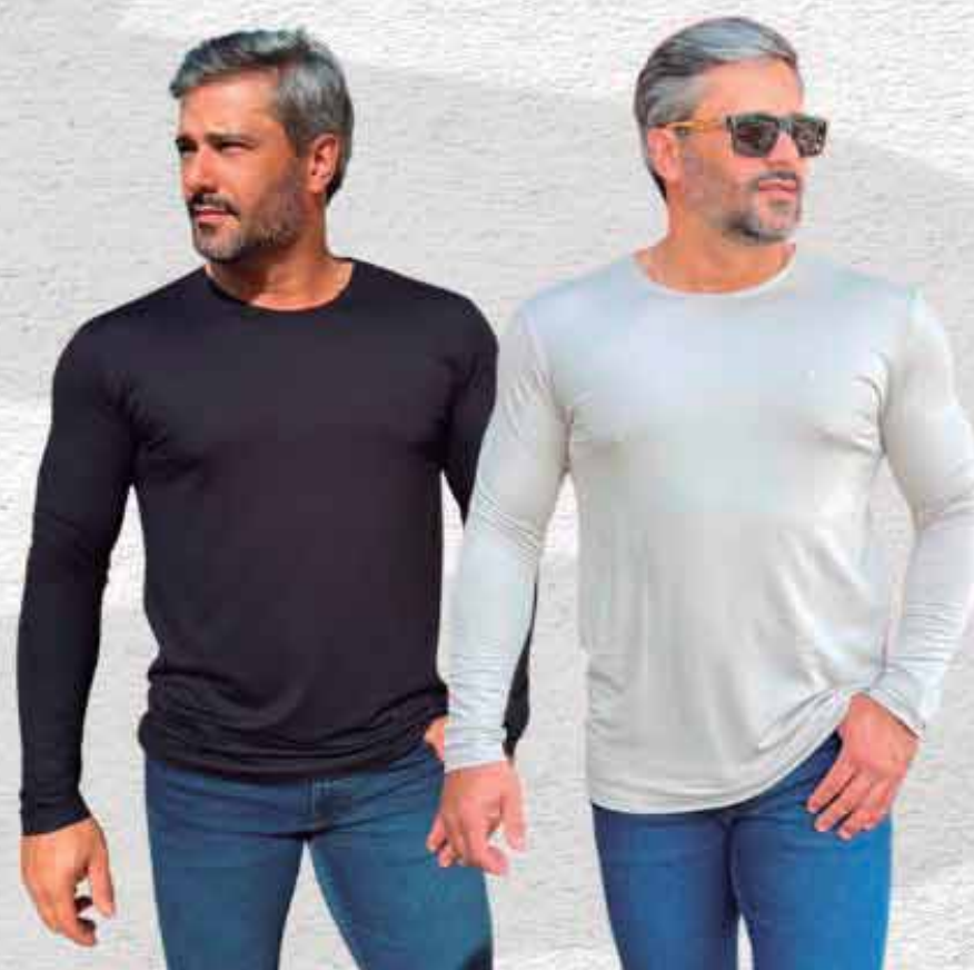
BLUSA MOLETINHO R$ 199,90