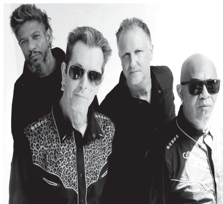
Programação acontece nos dias 25 e 26 de julho, no Engenho Central

A escolha do Engenho Central como sede da primeira edição traz a proposta de realizar o evento em um local que faz parte da história e da identidade de Piracicaba. Reconhecido como um dos principais cartões-postais do município, o espaço sedia regularmente eventos culturais e tem capacidade para receber público de toda a região. Além da programação musical, o festival também terá caráter solidário. Os alimentos arrecadados serão destinados a ações sociais, unindo entretenimento à arrecadação de donativos para pessoas em situação de vulnerabilidade. A expectativa da organização é