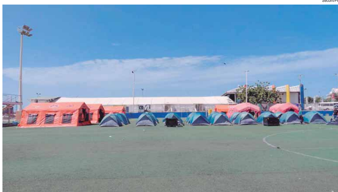
Equipe brasileira já montou acampamento em território venezuelano. Primeiras operações resgataram pelo menos duas pessoas com vida

ASSISTÊNCIA HUMANITÁRIA - O Governo do Brasil está mobilizado no esforço internacional de resposta à emergência humanitária na Venezuela. Sob a coordenação da Agência Brasileira de Cooperação (ABC), do Ministério das Relações Exteriores (MRE), o país permanece à disposição das autoridades ve-