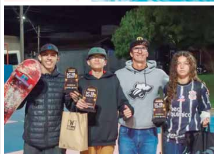
Representando São Pedro, os competidores do projeto Manobra Perfeita conquistaram títulos e boas colocações