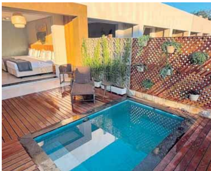
Novas acomodações contam com serviço de concierge, piscina privativa climatizada e arquitetura sustentável

Os hóspedes poderão usufruir também de todo o ecossistema do Santana's Ranch, incluindo programação recreativa, atividades ao ar livre, espaços de lazer, gastronomia, contato com animais, passeios e experiências voltadas ao bem-estar e à convivência familiar. A proposta busca unir a exclusividade de uma hospedagem privativa à ampla estrutura de entretenimento e serviços já reconhecida pelo público que visita a pousada. O projeto também reforça o compromisso do Santana's Ranch com a sustentabilidade e a responsabilidade ambiental. As novas edificações foram concebidas com soluções que contribuem para a redução dos impactos ambientais, incluindo sistemas de captação e reaproveitamento de água da chuva e coberturas verdes compostas por vegetação natural. Além de favorecer o conforto térmico das acomodações, a estrutura auxilia na retenção das águas pluviais, reduz a absorção de calor e contribui para uma integração mais harmoniosa com a paisagem local. A inau-