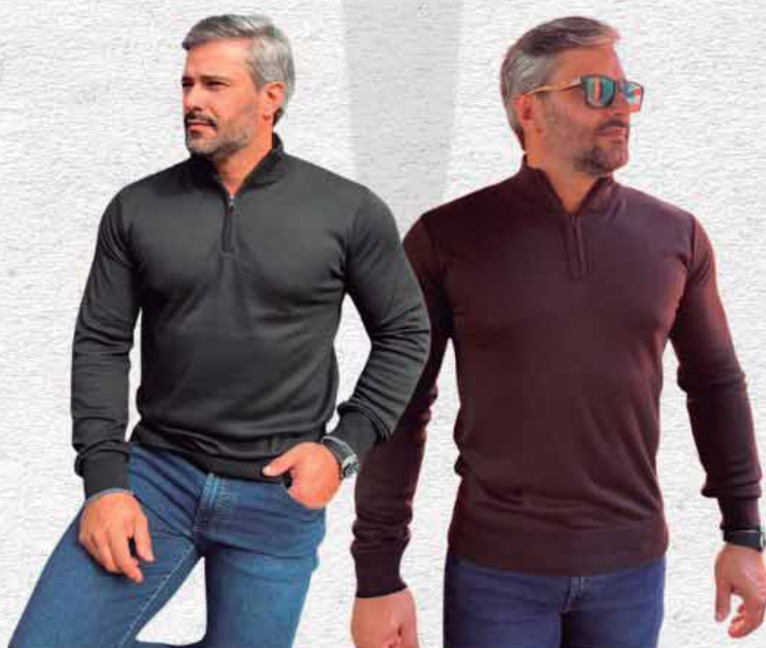
SUÉTER ZIPER R$ 199,90

LOJA 1 R. Dr. João Conceição, 974 Paulista 📞 19 99903.3344