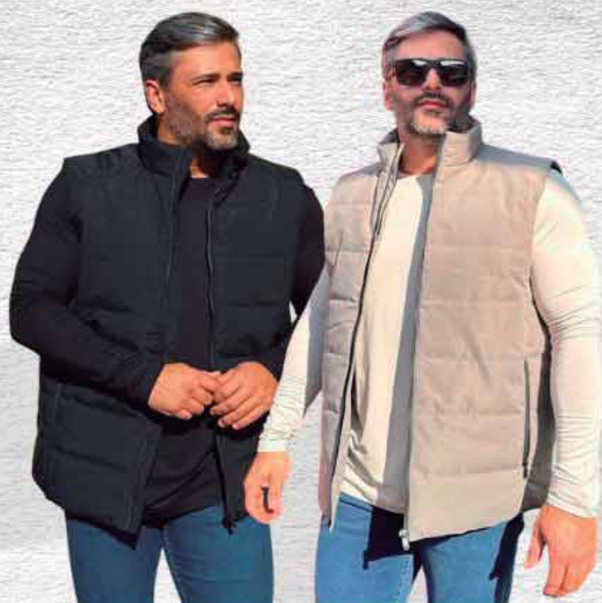
COLETE MASCULINO R$ 399,90