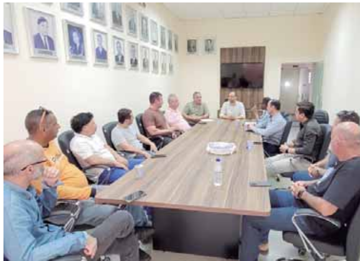
A reunião aconteceu terça-feira (30), na Câmara Municipal de São Pedro; o objetivo da força-tarefa é de remover cabearios irregulares e sem uso