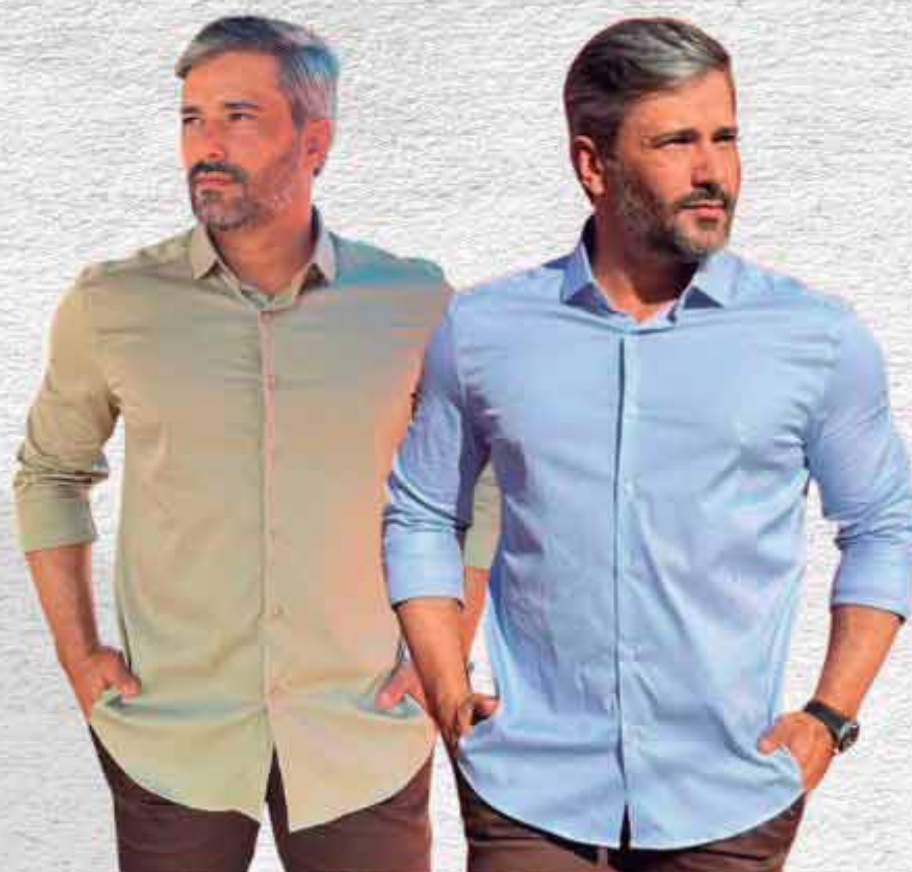
CAMISA FIO 100 R$ 399,90