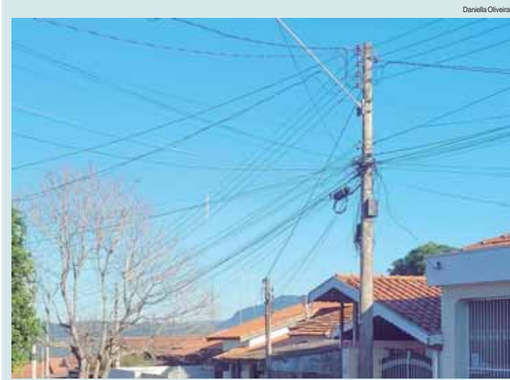
O objetivo da força-tarefa é de remover cabeios irregulares e sem uso