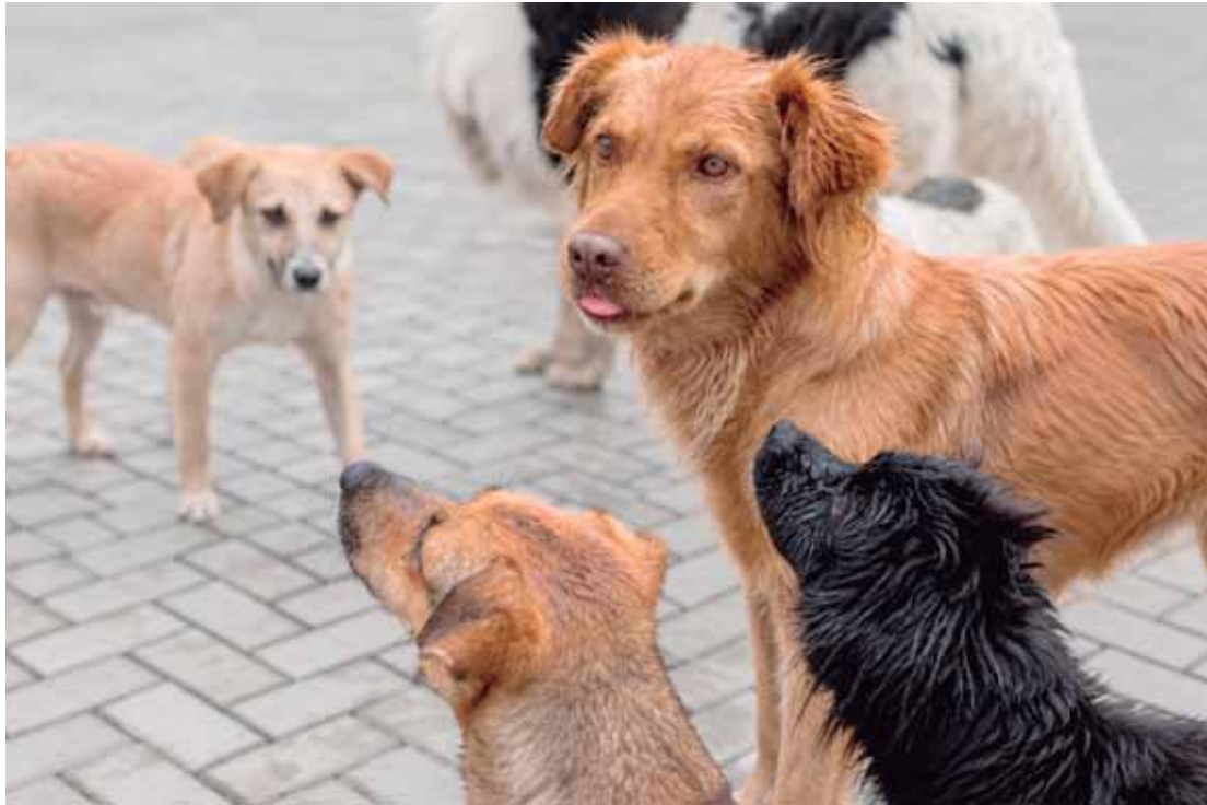
Evento reúne pets resgatados nas rodovias, além de oferecer atrações para as famílias e ações de conscientização

A programação contará ainda com a participação do projeto Patinhas Amigas de São Pedro, desenvolvido pela clínica Mazzoneto & Bortoloto. A iniciativa leva às escolas atividades educativas que estimulam o respeito, o cuidado e a responsabilidade com os animais, além de conscientizar crianças so-