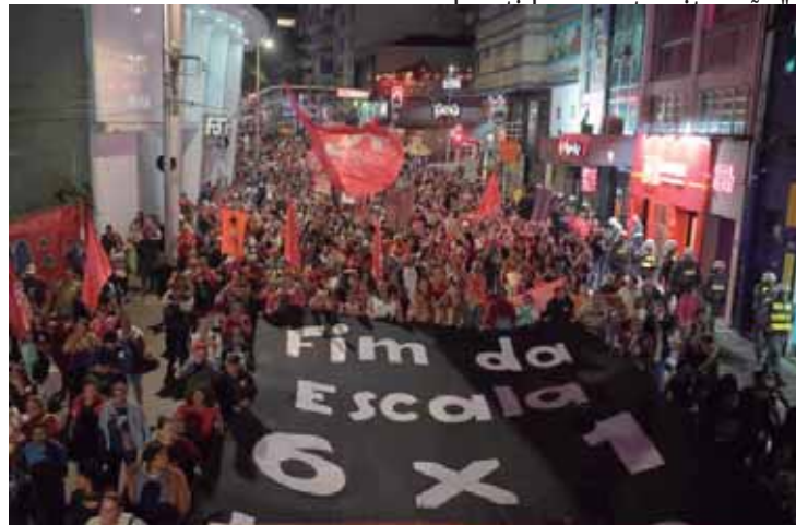
A manifestação na capital paulista aconteceu na noite de terça-feira, 30