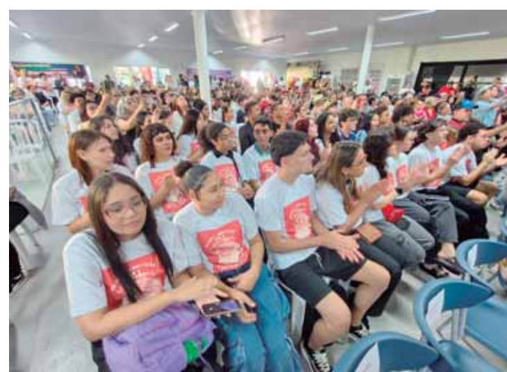
26-Os estudantes do cursinho Paulo Freire também estiveram acompanhando a atividade no Instituto Federal