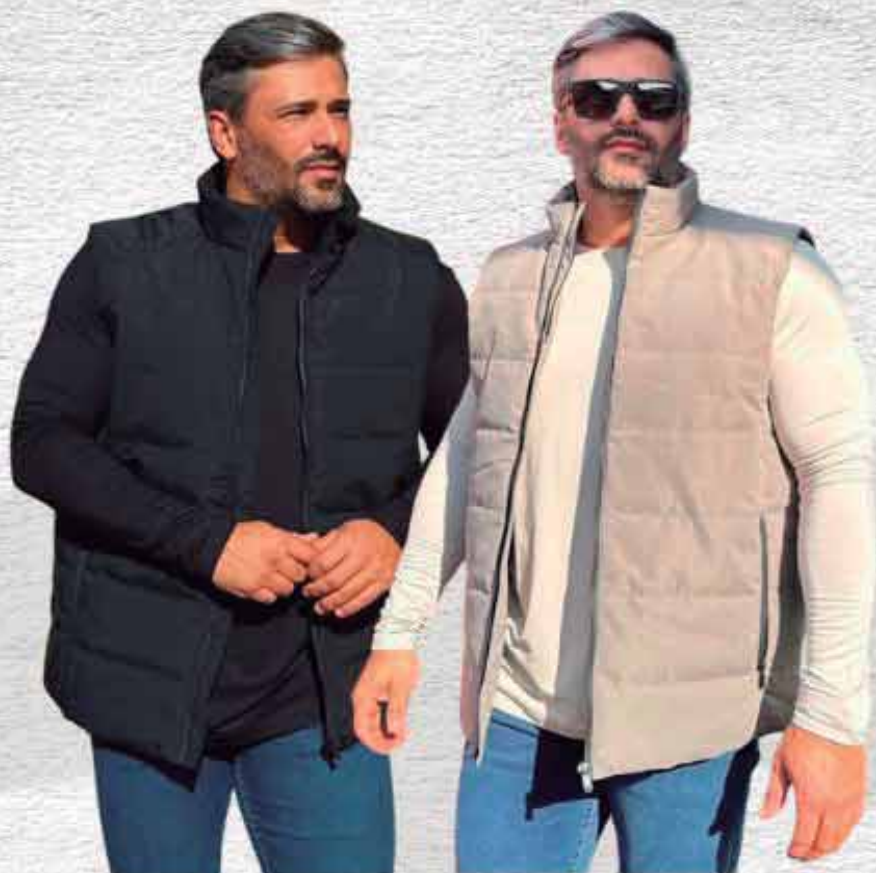
COLETE MASCULINO R$ 399,90