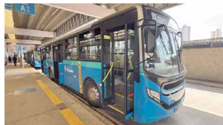
As linhas 408, 415 e 430 têm novos horários a partir deste fim de semana

Os usuários do transporte público devem ficar atentos às mudanças e consultar os horários oficiais pelo site: piramobilidade.com.br .