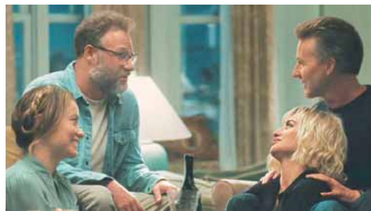
No elogiado filme O Convite, dois casais se reúnem num jantar que toma rumo inesperado e tudo pode acontecer

soas do Andar de Cima", que por sua vez foi adaptada de uma peça teatral. Antes dos Estados Unidos, o filme espanhol teve várias refilmagens, como na Itália em 2022,