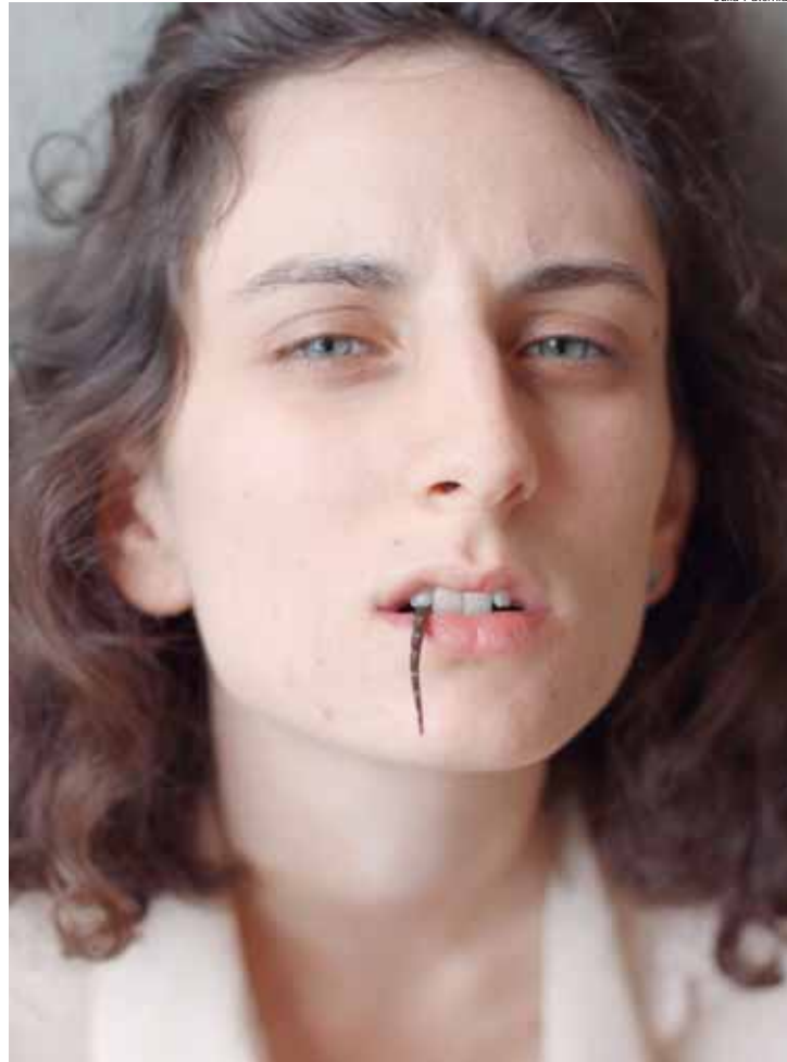
Tectoniza lança obra neste sábado, 4, no Sebo Clube do Livro

Lançamento do livro "Diarreia das Flores", de tectoniza (editora Urutau). Sábado, 4/7, às 19h30, no Sebo Clube do Livro - Raros e Loucos (R. XV de Novembro, 1600, Centro), em Piracicaba. A entrada é gratuita e exemplares estarão à venda