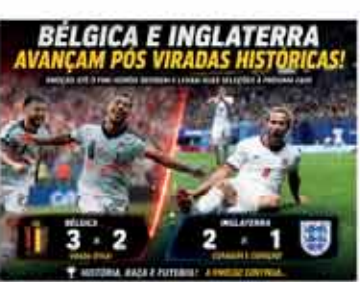
Belgica e Inglaterra avanças após viradas históricas na copa do mundo

Os resultados reforçam o equilíbrio desta Copa do Mundo, em que nenhuma seleção consegue avançar sem enfrentar grandes dificuldades. As equipes africanas voltaram a mostrar competitividade e estiveram muito próximas de surpreender duas das principais potências europeias, mas a experiência e o poder de decisão falaram mais alto nos momentos decisivos. Com as classifica-