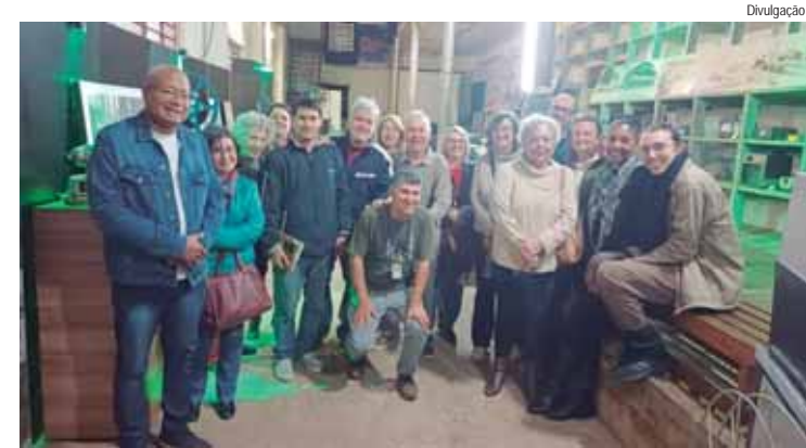
Participantes conheceram aspectos culturais, artísticos, históricos e cinematográficos do município

PATRIMÔNIO HISTÓRICO - Fundado em janeiro de 1881 pelo Barão de Rezende, o Engenho Central foi um dos primeiros complexos industriais do país a modernizar a produção açucareira. Em funcionamento até 1974, o espaço foi tombado em 1989 pelo Conselho de Defesa do Patrimônio Cultural de Piracicaba.