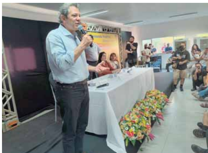
Fernando Haddad deixou claro que é preciso investir na educação pública para o desenvolvimento do país e do Estado de São Paulo