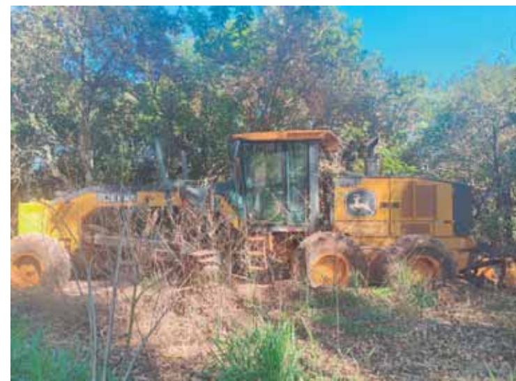
A máquina agrícola foi localizada em uma área de eucalipto no bairro Ibituruna

SERVIÇO 200ª Festa do Divino Espírito Santo. De 5 a 12/07, no largo dos Pescadores (av. Beira Rio). Entrada gratuita. Mais informações no Instagram @irmandadedodivinopiracicaba