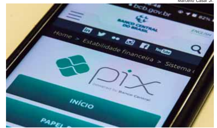
Estudo aponta que Pix já é o principal meio utilizado por criminosos para obter recursos das vítimas

de Piracicaba na Mega Artesanal 2026, de 11 a 15 de julho, das 10h às 18h, São Paulo Expo (Rod. dos Imigrantes, Km 1,5 - Água Funda, São Paulo/SP) - Rua 12C, Estande 391. Campanha de Apoio: share.google/6wbslh8XcMg1cL2r . Instagram: @oquebradacriativa