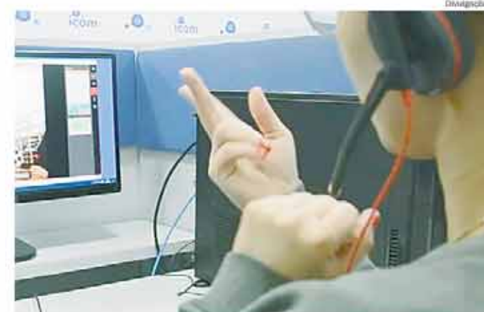
TRE-SP e governo estadual renovam acordo para uso da plataforma este ano