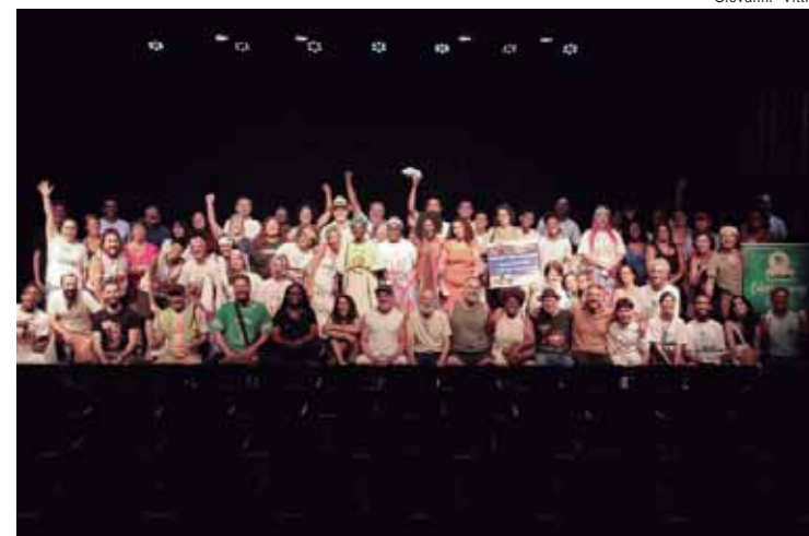
Evento reúne fazedores de cultura de diferentes municípios para debater políticas públicas

Os estudantes podem realizar seu cadastro gratuitamente a qualquer momento pelo site www.beem.sp.gov.br . Para inscrever-se no programa BEEM, é preciso: ter 16 anos completos na data de admissão do estágio; estar matriculado na 2ª ou 3ª série Ensino Médio Técnico da rede pública estadual; ter frequência regular igual ou superior a 85% no bimestre anterior à seleção; e ter feito, no ano anterior, o Prova Paulista Seriado.