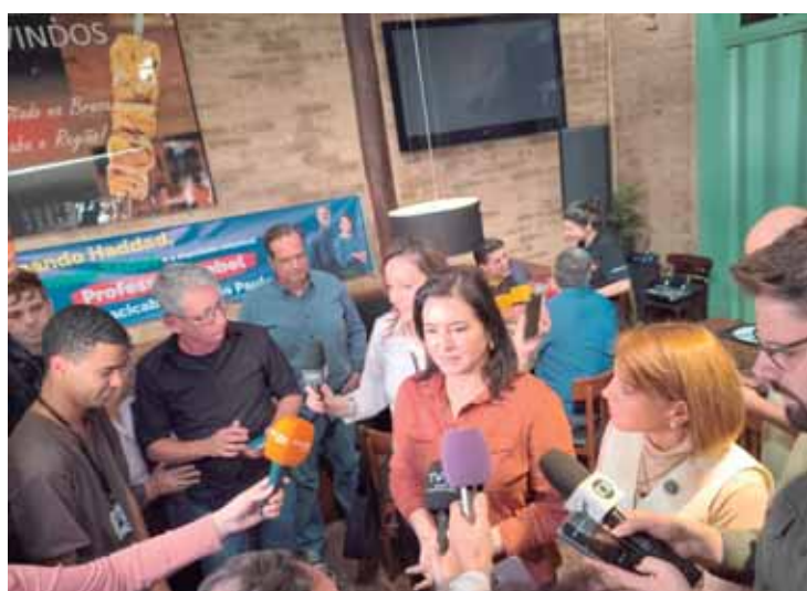
A senadora Simone Tebet durante entrevista à imprensa também falou do seu compromisso com o agronegócio