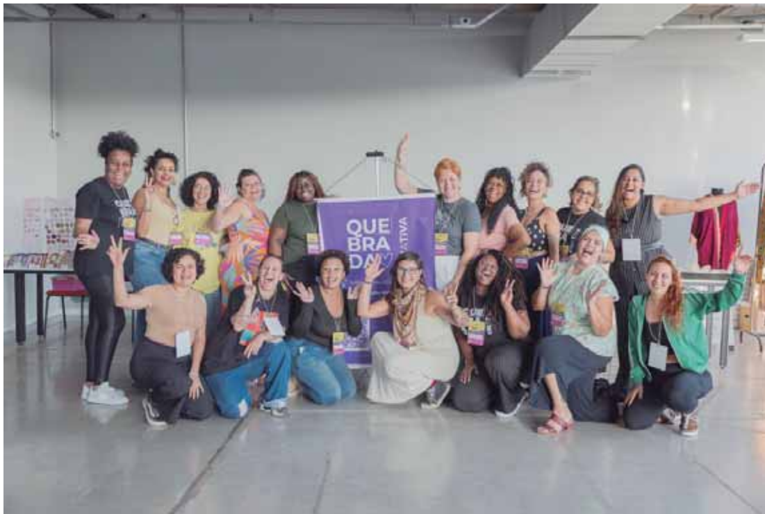
Coletivo Quebrada Artesanal vai expor na Mega Artesanal 2026