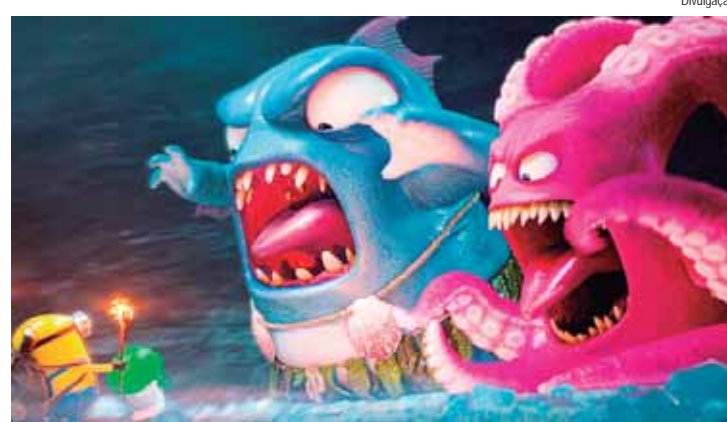
Em Minions & Monstros, os adoráveis amarelinhos Minions invadem Hollywood para rodar o filme que sempre sonharam

O CONVITE - (The Invite -- Estados Unidos, 2026) Está elogiadíssima comédia dramática só estreia nos cinemas brasileiros na próxima quinta-feira (9), mas chega antes em nossas telas. O filme é dirigido pela atriz e cineasta americana Olivia Wilde, que também faz parte do quarteto protagonista, ao lado de Seth Rogen, Edward Norton e a espanhola Penélope Cruz. A trama é centrada em dois casais que se encontram num jantar que toma rumos inesperados. O casamento de Joe (Seth Rogen) e Angela (Olivia Wilde) está por um fio. Quando eles convidam o enigmático casal de vizinhos do andar de cima, Hank (Edward Norton) e Pina (Penélope Cruz) para um jantar, a noite toma um rumo inesperado e tudo pode acontecer. Elenco maravilhoso numa comédia adulta de relacionamento que mistura humor ácido, tensão emocional e momentos comoventes. O longa é uma refilmagem em inglês da comédia espanhola de 2020 "As Pes-