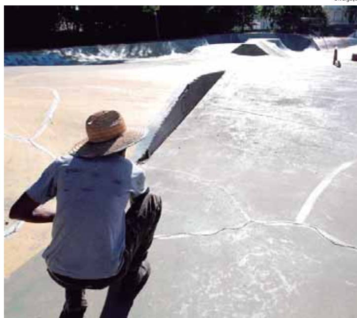
Nesse momento, ocorre o trabalho de tratamento das fissuras superficiais que apresentam algum desprendimento de material

PACOTE - O prefeito Helinho Zanatta assinou em março a ordem de serviço para reformas e melhorias em 14 espaços esportivos do município, entre ginásios, campos de futebol e a pista de skate, com investimento de R$ 3,5 milhões. São eles: ginásios da Vila Rezende e Santa Teresinha, campos de futebol do Parque Piracicaba, Cecap II, Tupi, Caxambu, Sol Nascente, Rua do Porto, Itapuã, Jupiaí, Santa Teresinha, Novo Ho-