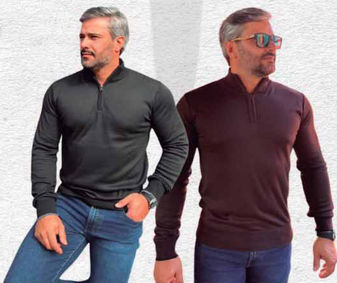
SUÉTER ZIPER R$ 199,90

LOJA 1 R. Dr. João Conceição, 974 Paulista