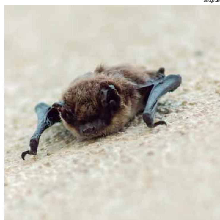
Morcegos encontrados não devem ser tocados