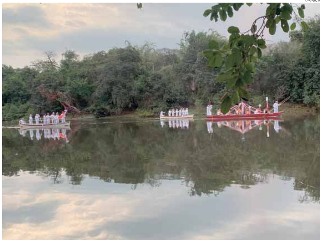
Após a bênção, os barcos seguem em romaria fluvial, em um rito que simboliza a fé, a proteção e as tradições da comunidade ribeirinha