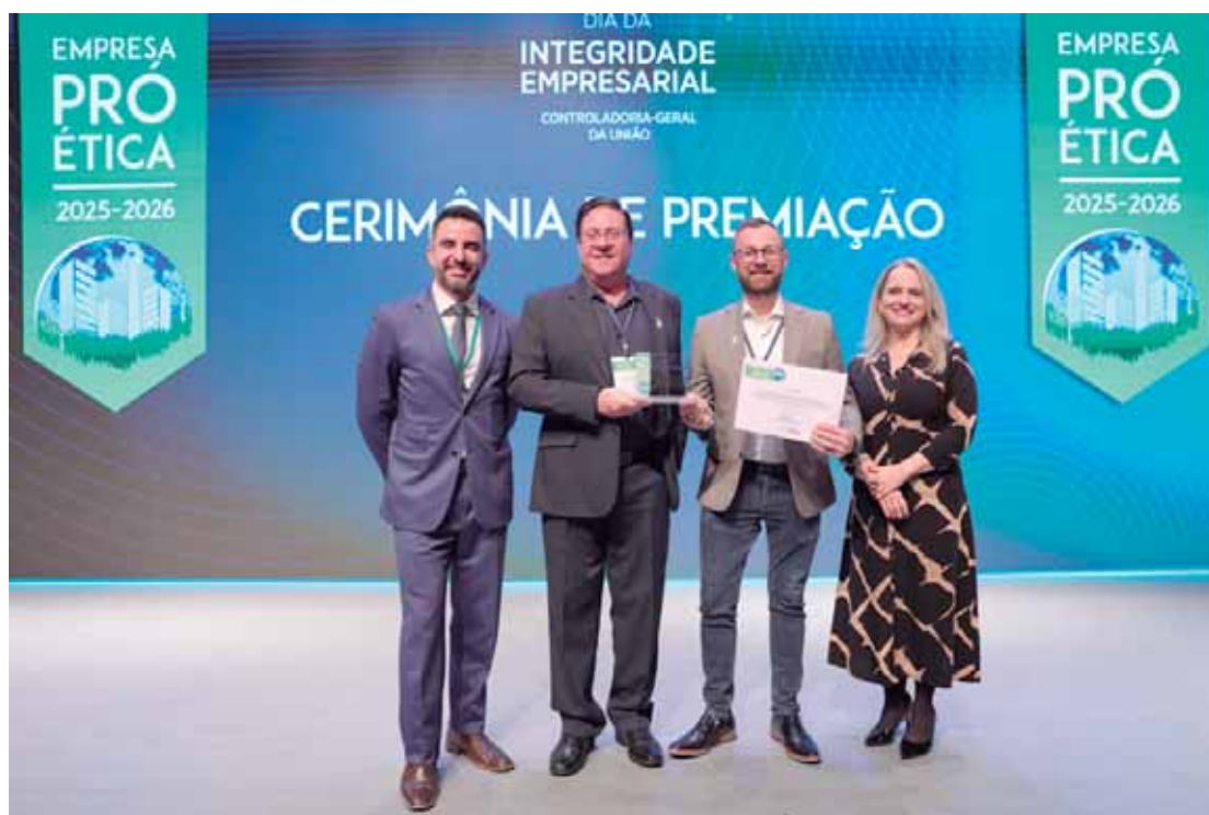
Em 2025, a Hyundai foi pioneira no setor ao assinar o Pacto Brasil pela Integridade Empresarial, também gerido pela CGU

O processo de avaliação é rigoroso e baseado em evidências práticas e comprováveis ao abranger temas como: governança corporativa e cultura ética; controles internos e auditoria; gestão de riscos de integridade; canal de denúncias e remediação; e responsa-