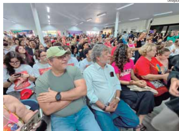
Lideranças, professores e estudantes foram ao Instituto Federal acompanhar o encontro com Fernando Haddad e Simone Tebet