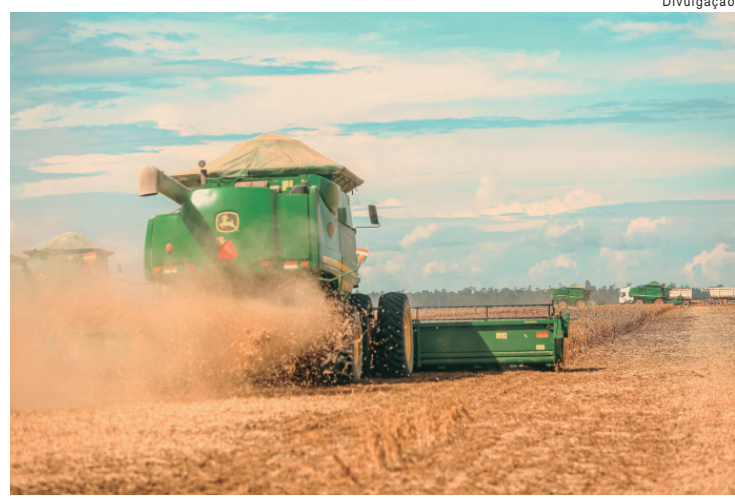
Arena Agro reúne produtores rurais para discutir inovação e oportunidades no agronegócio

O lançamento do primeiro Relatório de Sustentabilidade marca o início de um novo ciclo para o Supermercados Pague Menos, que passa a incorporar cada vez mais a sustentabilidade como vetor estratégico de crescimento e inovação. A Rede reforça que a publicação do documento será anual, ampliando a transparência e o acompanhamento de metas e indicadores, além de fortalecer o diálogo com seus públicos de interesse. O Relatório de Sustentabilidade 2025 do Supermercados Pague Menos já está disponível para acesso público no site da empresa. Acesse em: https://www.superpaguemenos.com.br/relatorio-sustentabilidade/