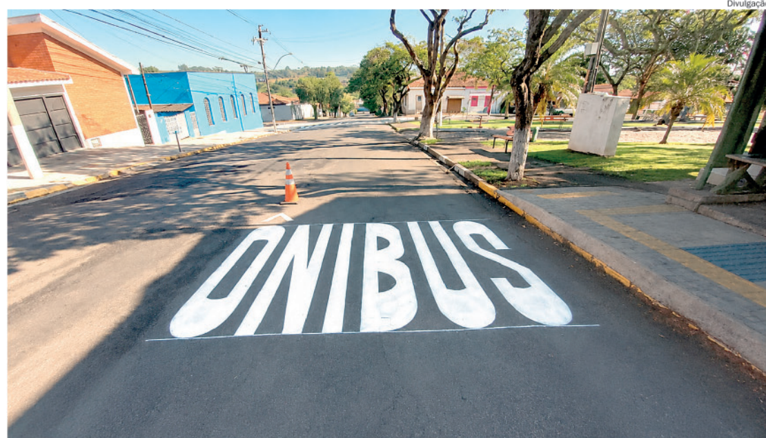
A Rua Nove de Julho, no bairro Tupi, foi uma das 50 vias que recebeu serviços na sinalização

As equipes também realizaram a instalação de dispositivos redutores de velocidade,