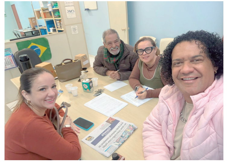
Reunião da Comissão de Fiscalização aconteceu no último dia 19

A celebração dos 55 anos apresenta um marco na história da igreja, reafirmando seu compromisso com a proclamação do Evangelho de Cristo, o serviço à comunidade e a formação de novas gerações de cristãos. A expectativa é de um culto especial, marcado pela gratidão a Deus pela trajetória construída desde 1971 e pela renovação do propósito de continuar servindo à cidade de Piracicaba.