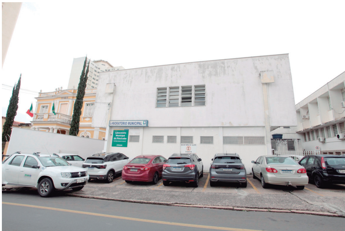
Reestruturação do Laboratório Municipal garante mais eficiência na aplicação de recursos públicos

Outro ponto importante é que não haverá prejuízo aos usuários em relação aos prazos de entrega dos resultados. Os