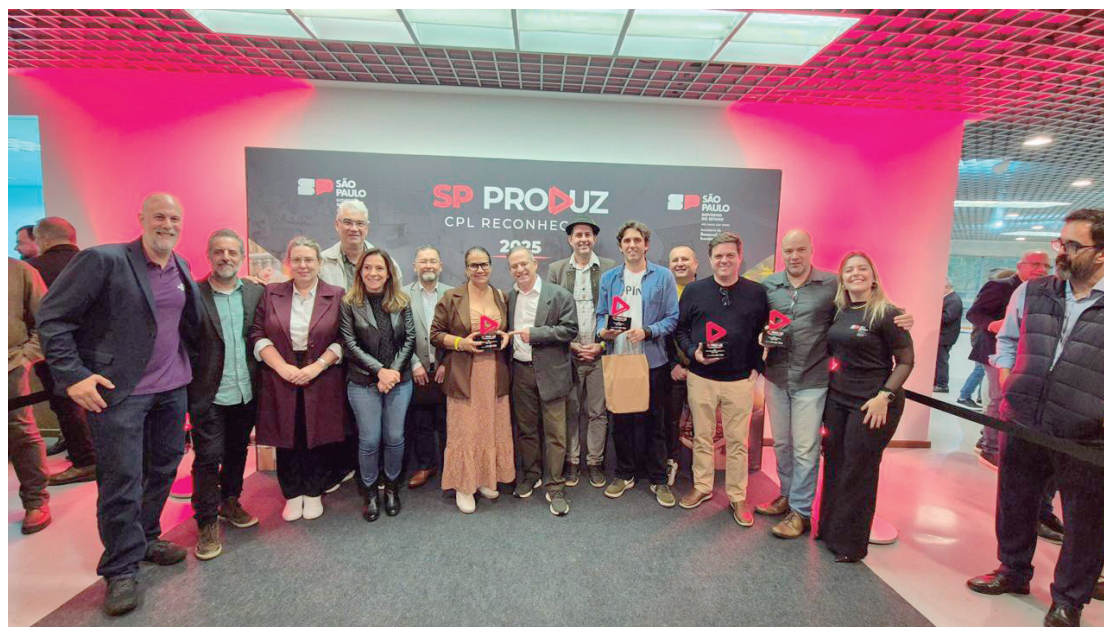
O reconhecimento de quatro novas cadeias produtivas locais de Piracicaba foi oficializado durante cerimônia do programa SP Produz 2025

O reconhecimento resultou de um trabalho de articulação entre poder público, instituições de ensino e entidades representativas. Participaram do processo a Secretaria de Desenvolvimento Econômico, Indústria e Comércio, a Faculdade de Tecnologia do Estado (Fatec), o Arranjo Produtivo Local do Álco-