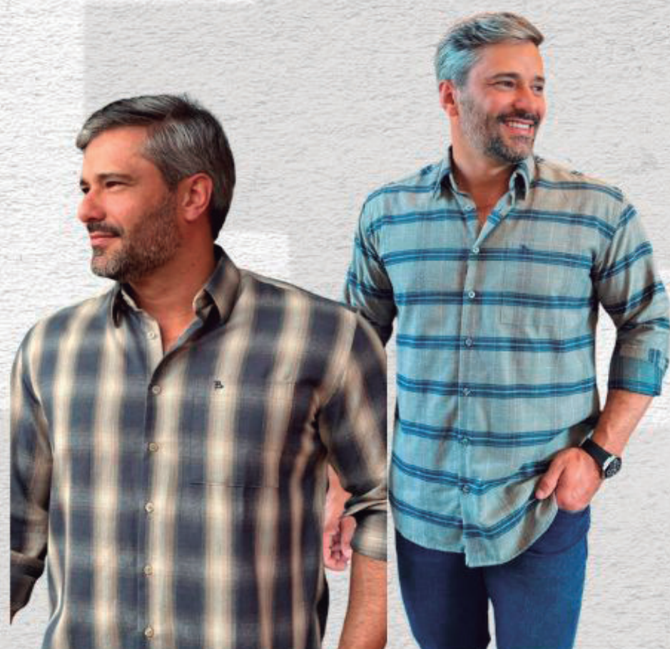
FLANELA MASCULINA R$ 299,90