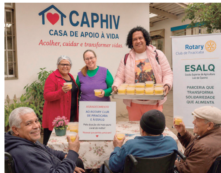
Sobremesa foi servida aos acolhidos pela entidade e conquistou o paladar de todos