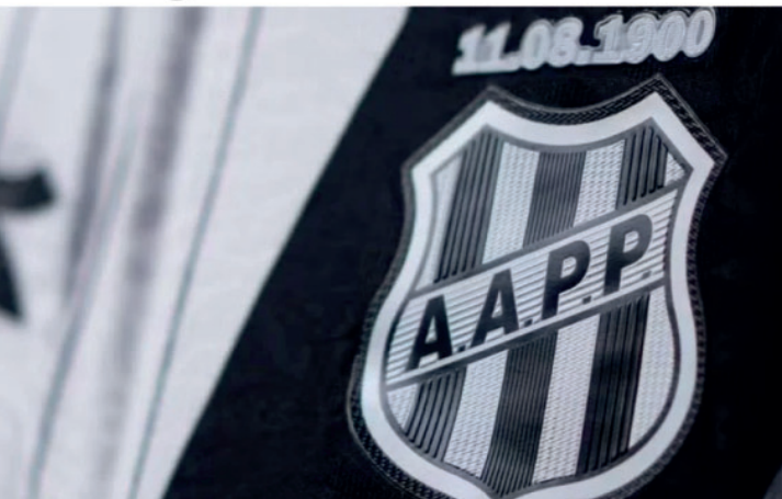
Equipe campeira busca estabilidade para escapar da parte de baixo da tabela.

Já a realidade da Ponte Preta é a mais pre-