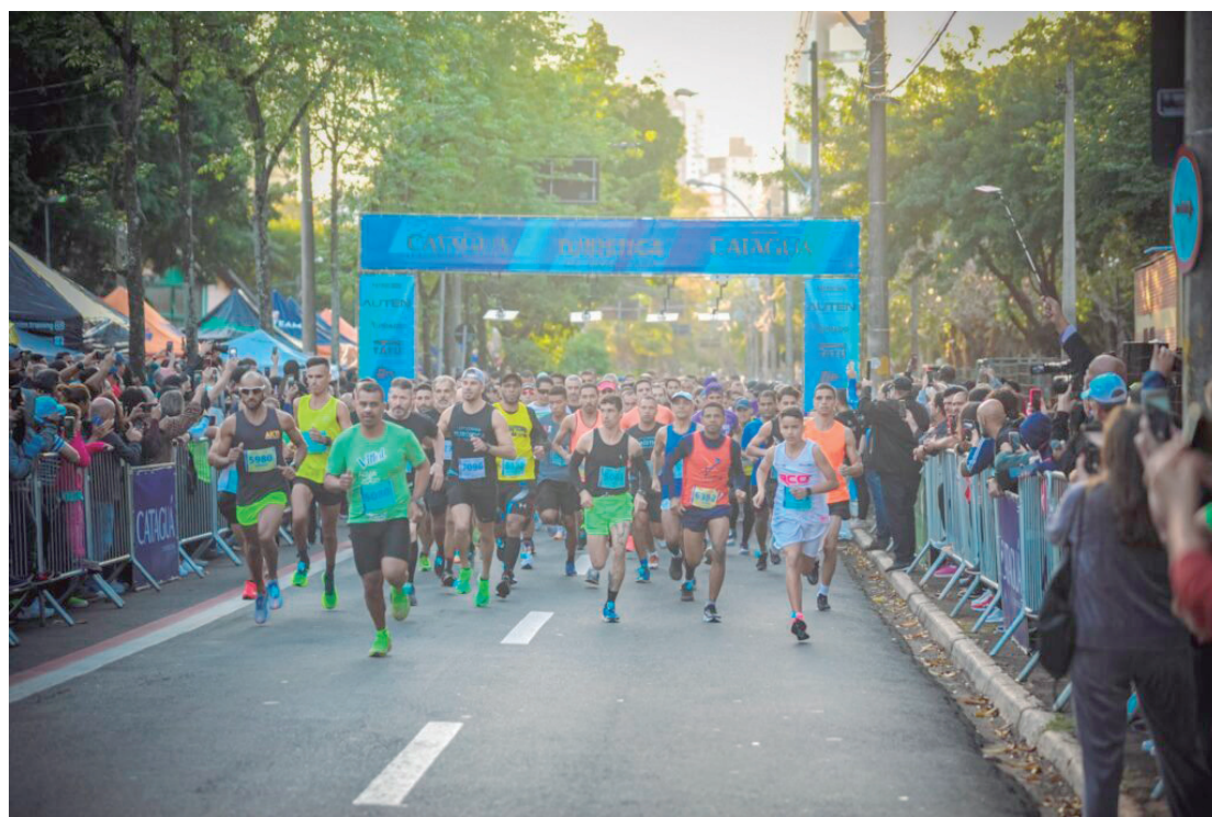
Evento será realizado no domingo (28), com percursos de 5,5 km, 10 km e desafio de 15 km; expectativa é reunir mais de 7 mil participantes

Além da prática esportiva, a corrida tem caráter solidário. Todo o resultado arrecadado será revertido ao Fundo Social de Solidariedade de Piracicaba para o atendimento de pessoas em situa-