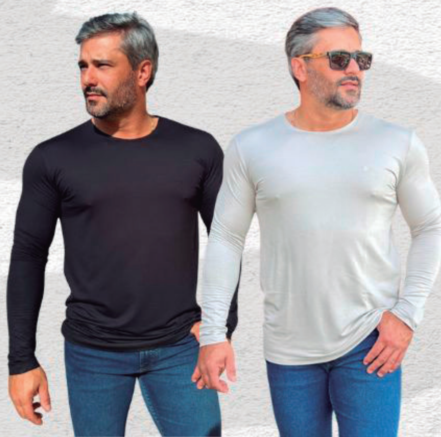
BLUSA MOLETINHO R$ 199,90