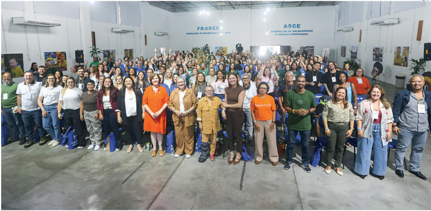
Paraná visitou a base descentralizada do Samu que começou a funcionar desde o último dia primeiro, no Vila Sônia