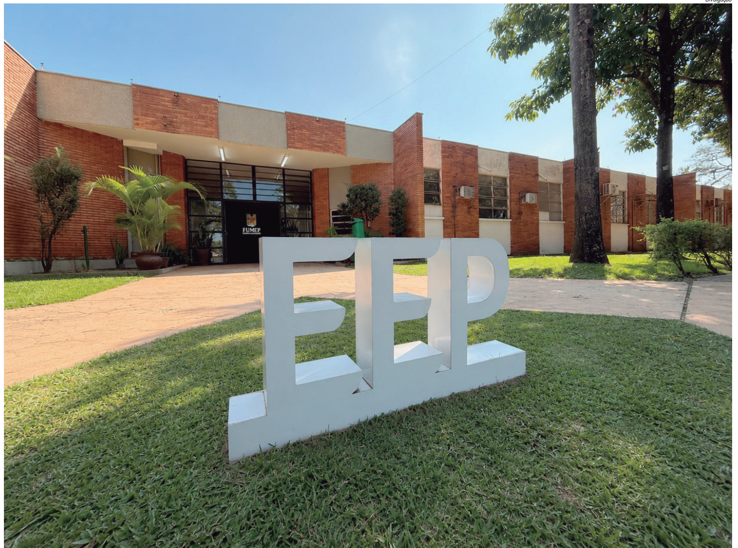
Reconhecimento renovado garante a continuidade do curso da EEP alinhado aos padrões de qualidade do ensino superior

to, que será feito em parceria com o Sindicato dos Condutores de Americana e Região, às 19h30, na Câmara Municipal da cidade de Santa Bárbara d'Oeste, na Rodovia Luís Ometto, (SP-306), 1001, no Residencial Dona Margarida, e faz parte das ações voltadas à implantação da tarifa zero no transporte público. A9