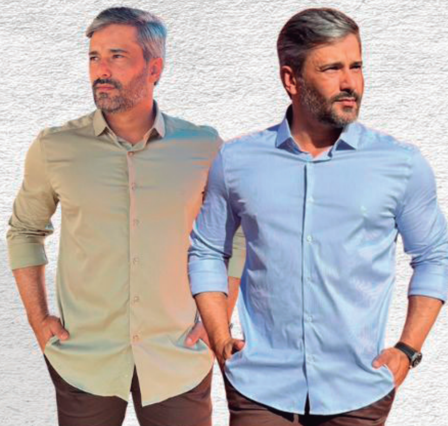
CAMISA FIO 100 R$ 399,90