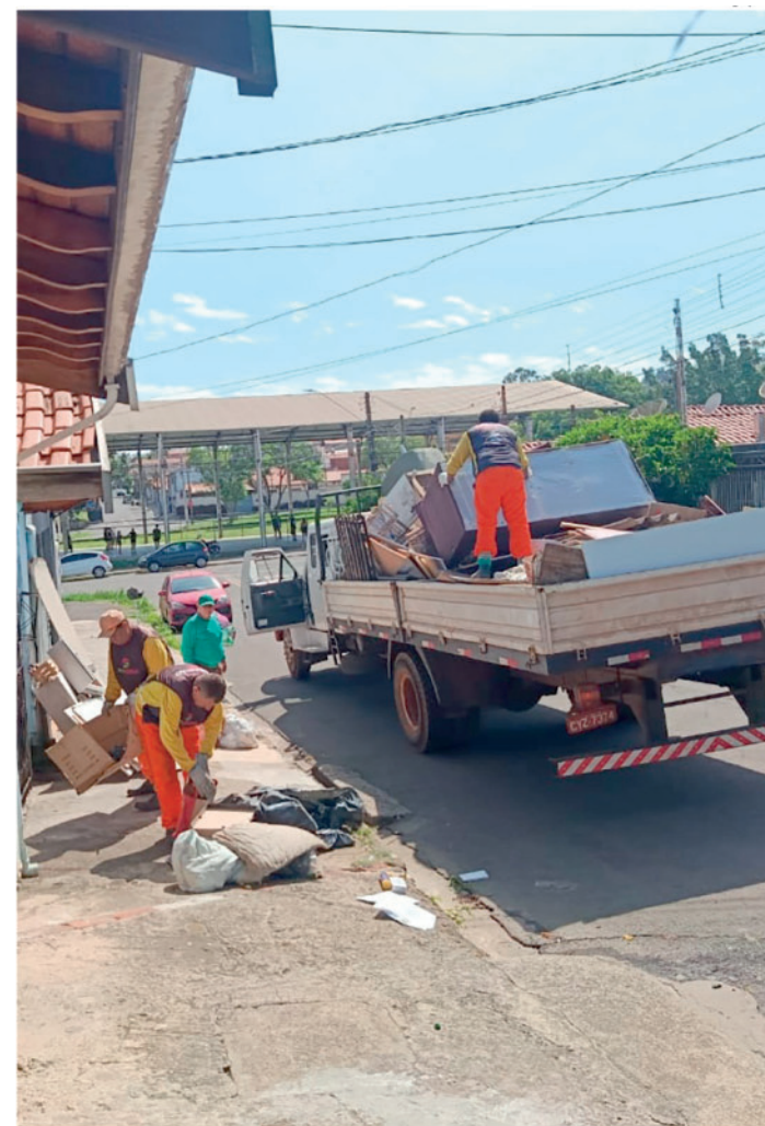
Materiais devem ser deixados na calçada para agilizar trabalho das equipes

Para obter informações sobre a marca, detalhes de todos os modelos Hyundai, consultar a lista completa de concessionárias e encontrar a loja mais próxima, acesse: hyundai.com.br .