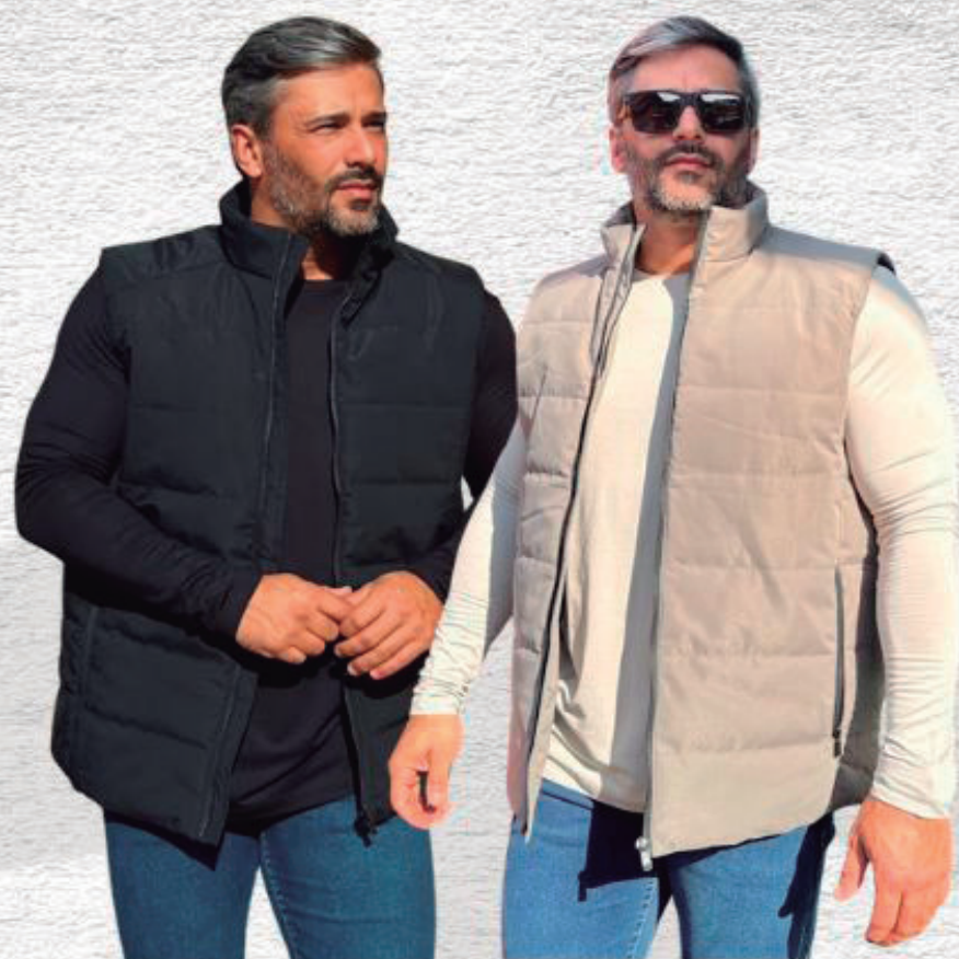
COLETE MASCULINO R$ 399,90