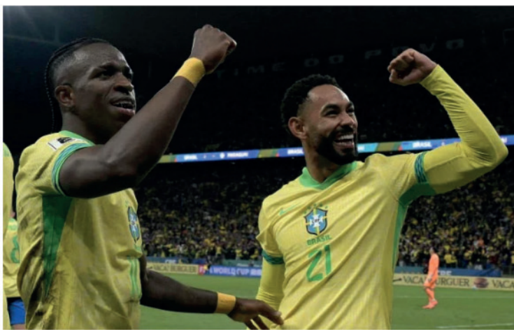
Dupla de ataque foi decisiva na melhor atuação do Brasil nesta Copa do Mundo.

marães, fechando a goleada por 3 a 0. A partida também marcou a estreia de Neymar na Copa. Recuperado de lesão, o camisa 10 entrou aos 30 minutos do segundo tempo e foi recebido com entusiasmo pelos mais de 64 mil torcedores presentes. Após o empate diante do Marrocos na estreia, o Brasil mostrou evolução constante ao longo da primeira fase. A vitória sobre o Haiti trouxe tranquilidade, mas foi diante da Escócia que a equipe apresentou seu futebol mais convincente. A principal mudança observada foi o crescimento coletivo do time. A dupla de volantes formada por Casemiro e Bruno Guimarães deu mais equilíbrio ao setor defensivo, enquanto o ataque ganhou mobilidade com Matheus Cunha. Acima de tudo, Vinicius Júnior