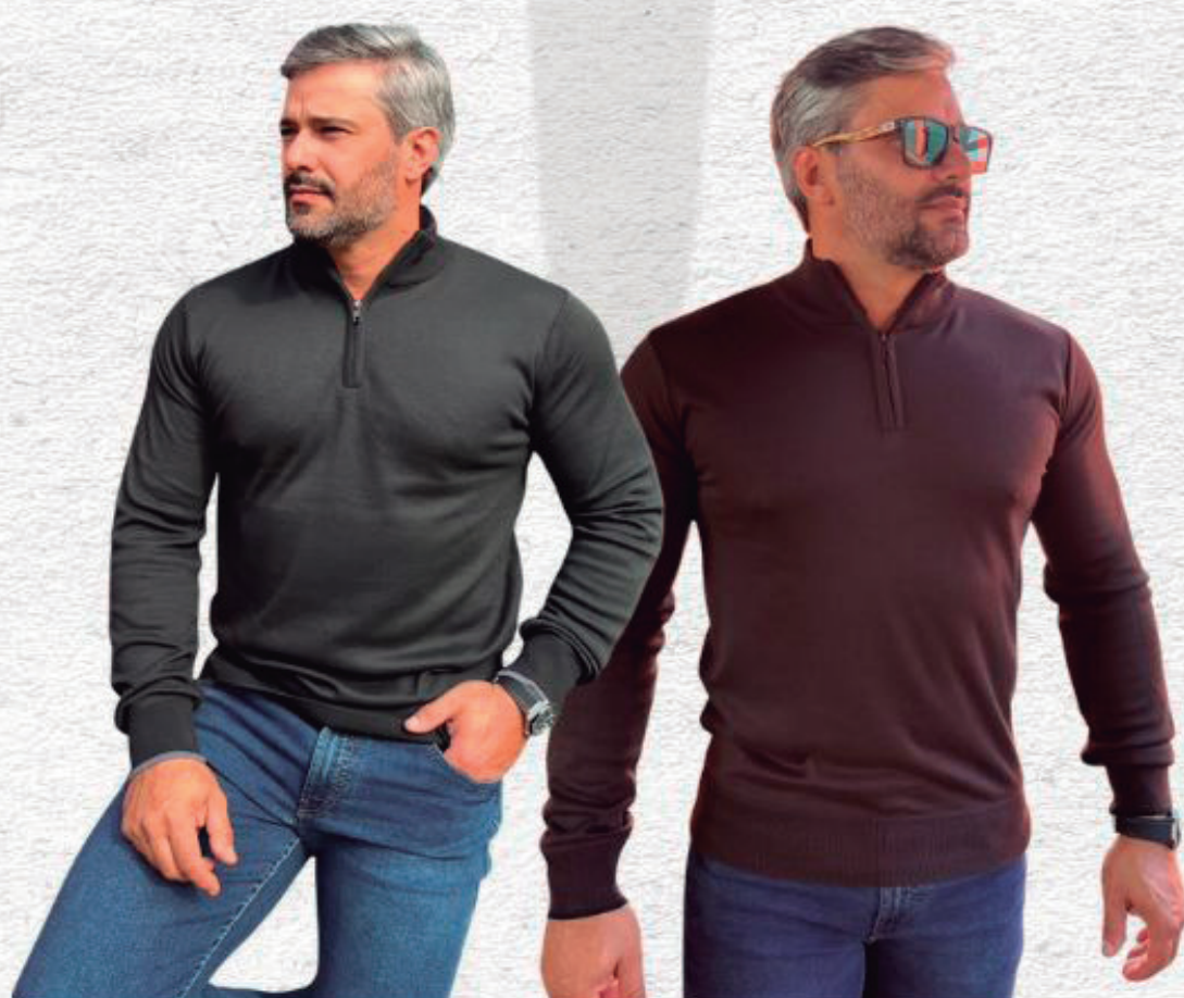
SUÉTER ZIPER R$ 199,90

LOJA 1 R. Dr. João Conceição, 974 Paulista