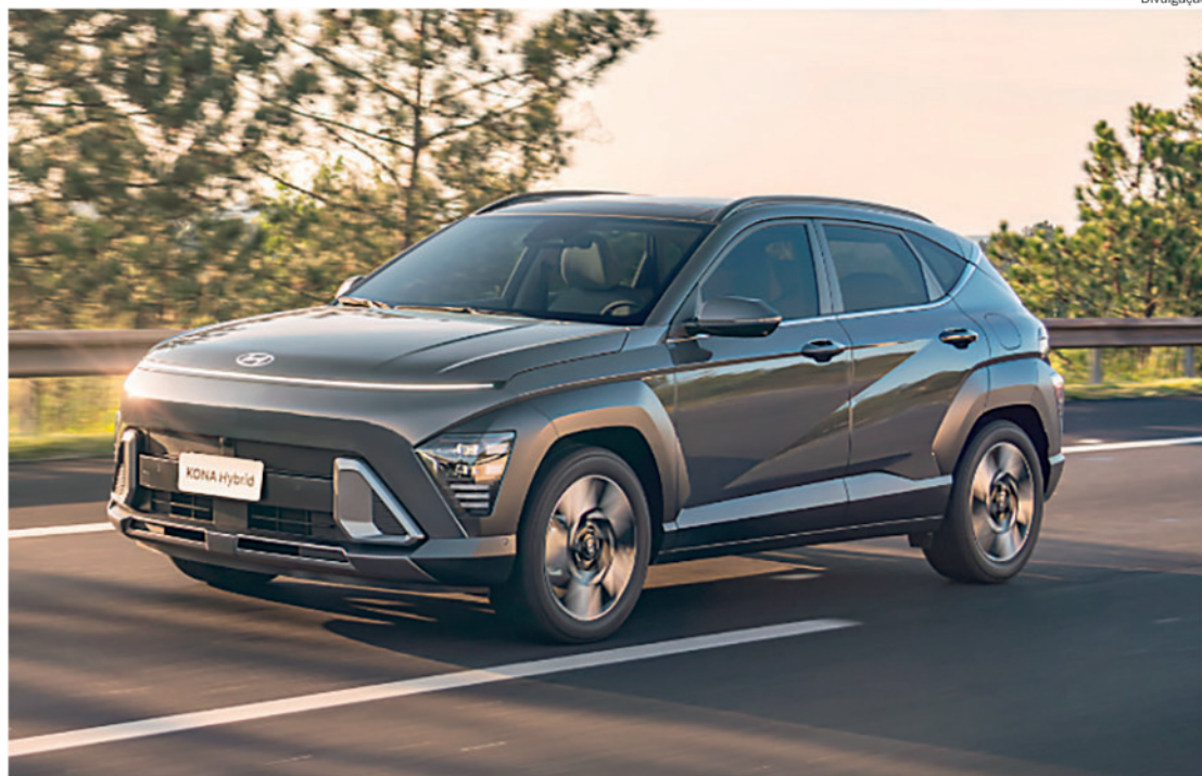
Kona Híbrido combina desempenho, tecnologia e economia de combustível, alcançando 18,4 km/l na cidade e 16 km/l na estrada

Ao todo, foram considerados mais de 900 modelos de 29 marcas presentes no mercado automotivo nacional, divididos em categorias como elétricos, plug-in, híbridos, flex, gasolina e diesel, além de levar em conta os tipos de carroceria e tamanhos. O Prêmio Mobilidade Limpa 2026 apurou todos os dados públicos disponíveis no Programa Brasileiro de Etiquetagem Veicular, do Inmetro, com data-base de março de 2026, e apontou o Kona Híbrido como vencedor em eficiência energética na sua respectiva categoria, com um índice de 1,21 MJ/km.