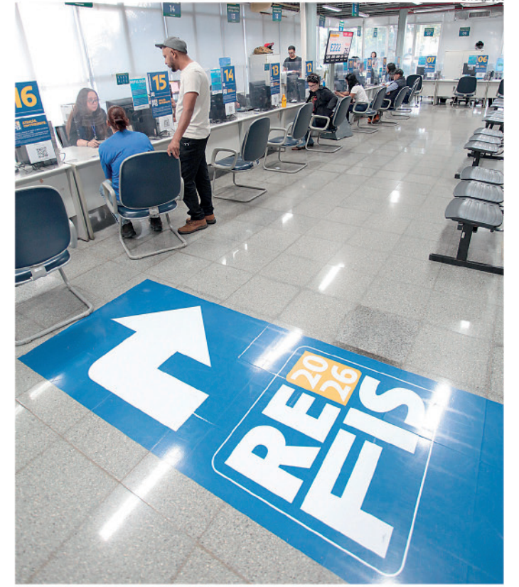
A Prefeitura prorrogou por mais 90 dias o prazo de adesão ao Refis

rio Franco, João Giusti, José Ferraz de Camargo, Manoel Correia Arzão, Nossa Senhora do Carmo, Nove de Julho, Paulo Setúbal, Professor José de Camargo, Prudente de Moraes, Ricardo Melotto, Samuel Neves, Santa Catarina, Santo Antônio, São José, Sergifredo P. de Almeida, Sud Menucci, Valentin Tozzi e São José; Estradas do Serrote e Antônio Dias Rodrigues; Rodovia Luiz Dias Gonzaga.