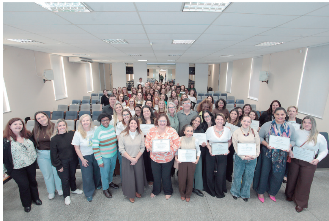
Proposituras homenageiam escolas premiadas pela Excelência Educacional e com destaque no Índice da Criança Alfabetizada (ICA)

Receberam os votos de congratulações as unidades escolares: EM João Oriani; EM João Otávio de Melo Ferraciú; EM Joaquim Carlos Alexandrino de Souza; EM Maria Benedicta Pereira Penezzi; EM Professor Alberto Thomazi; EM Professor Décio Miglioranza; EM Professor Fábio de Souza Maria; EM Professor João Batista Nogueira; EM Professor Luís Cláudio Alves; EM Professor Manoel Rodrigues Lourenço; EM Profes-