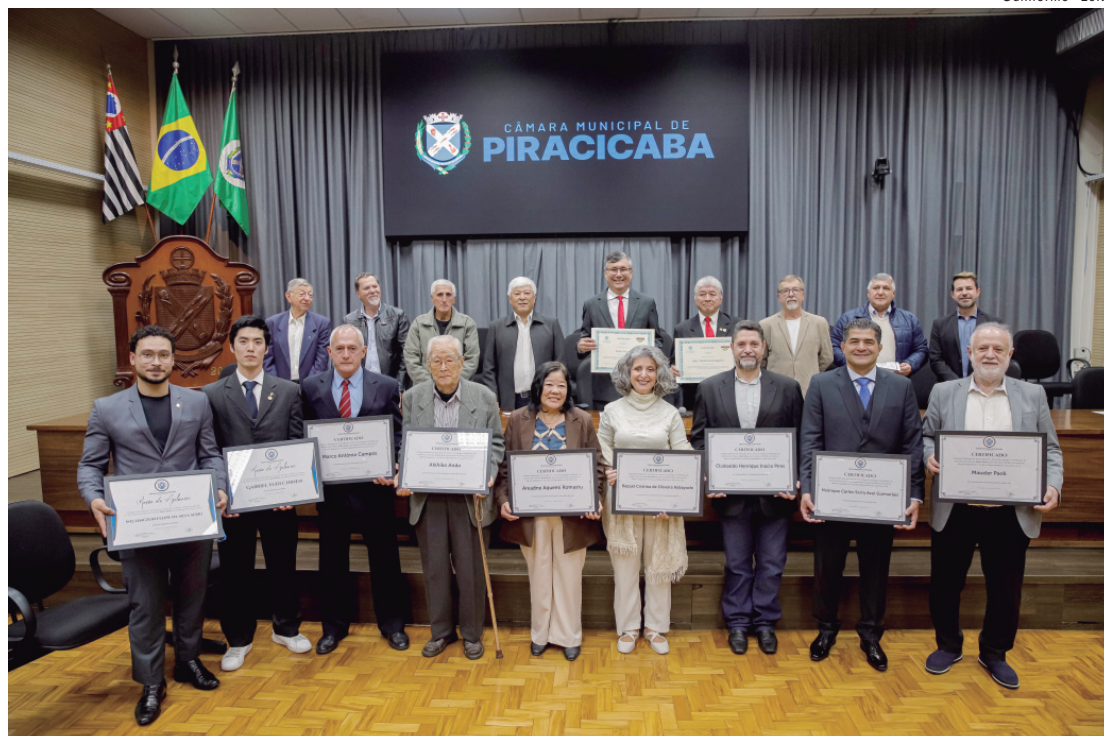
Reunião solene aconteceu na noite de terça-feira, na Câmara de Piracicaba