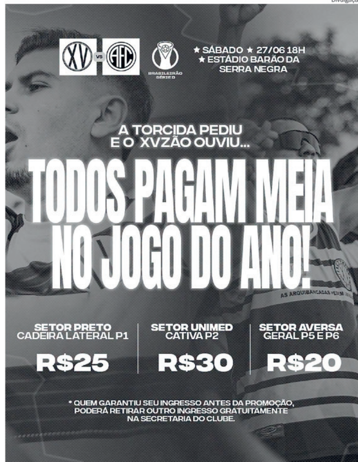
XV faz promoção para lotar o Barão em decisão contra o América-RJ

A expectativa da diretoria é de grande público no Barão da Serra Negra. O momento é tratado como um dos mais importantes da temporada, já que o XV segue sonhando com o acesso à Série C e vive uma