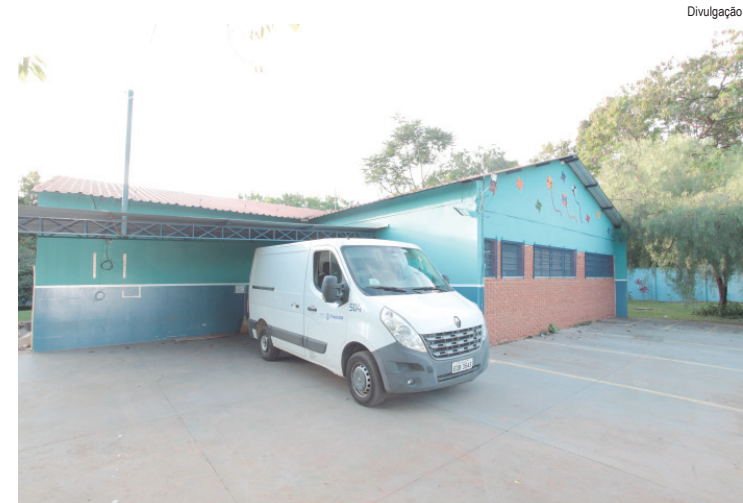
O Fundo Social passará a atender em novo endereço, na Avenida dos Marins, 100, a partir de segunda-feira, 29 de junho

A mudança tem como objetivo oferecer uma estrutura melhor para as atividades do Fundo Social e para o atendimento aos munícipes. O endereço antigo permanece com o atendimento referente a Farmácia de Alto Custo. Mais informações podem ser obtidas pelo WhatsApp do Fundo Social: (19) 3422-9677.