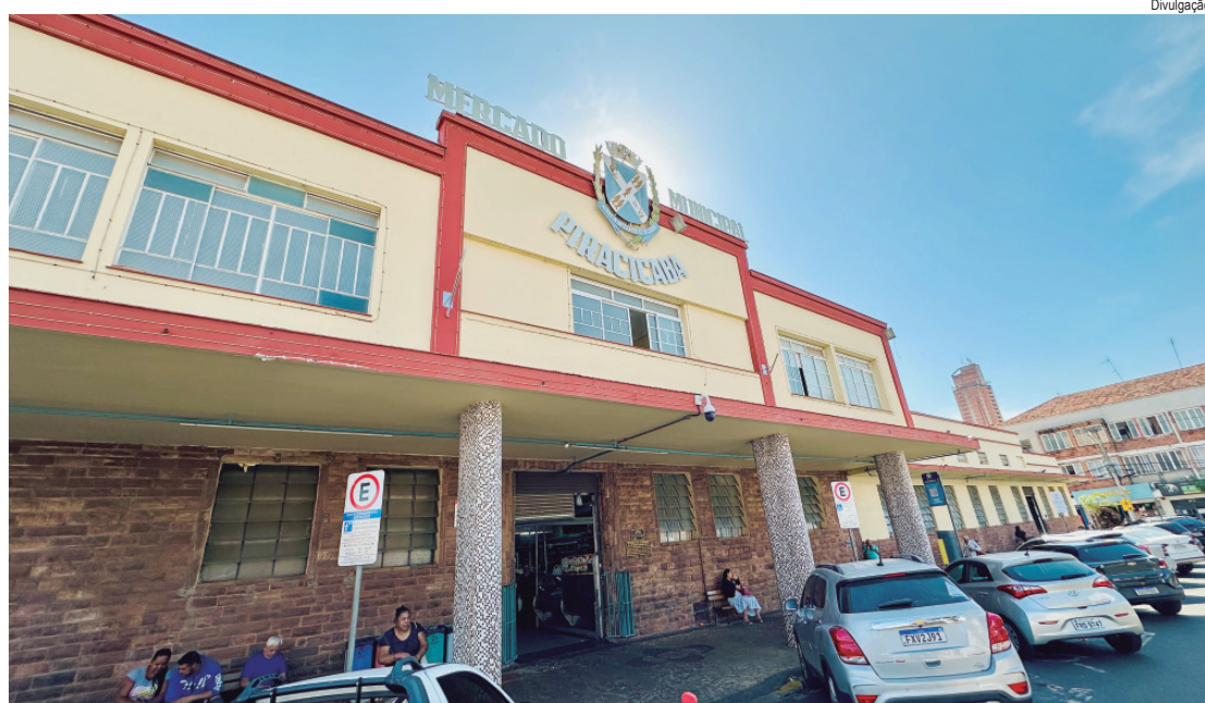
Prefeitura enviou à Câmara projeto de lei que destina R$ 1 milhão para finalizar reconstrução do Mercado Municipal

Os recursos do seguro foram utilizados integralmente na primeira fase da reconstrução, concluída com investimento de R$ 2,4 milhões. Nessa etapa, foram executadas a demolição e remoção das estruturas comprometidas pelo incêndio, reconstrução das paredes laterais e internas, instalação da estrutura metálica e da cobertura do telhado, retirada do piso antigo e das redes de água e esgoto, regularização do solo para implantação da nova infraestrutura hidráulica, construção das divisórias dos