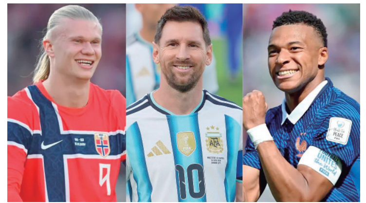
Corrida pela Chuteira de Ouro promete ser uma das mais emocionantes da história