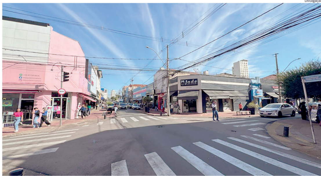
Procon Piracicaba realiza operação de orientação no comércio da cidade