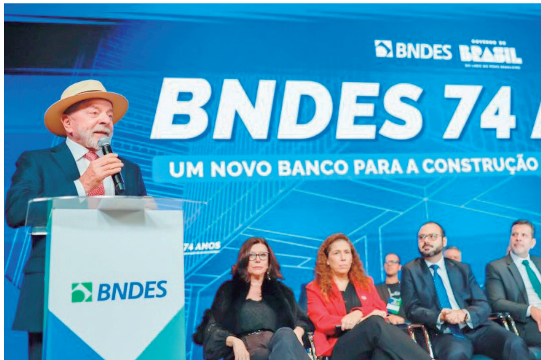
Presidente Lula participou da cerimônia em comemoração aos 74 anos do BNDES. Com o investimento, a Nova Indústria Brasil ultrapassará a marca de R$ 750 bilhões em recursos disponíveis entre 2023 e 2026

Ao apresentar o caminho percorrido pelo BNDES nos 74 anos, o presidente do banco, Aloizio Mercadante, destacou a ampliação do financiamento a projetos de sustentabilidade, por meio do chamado BNDES Verde. "O Fundo Clima aprovava uma média, no período anterior, de R$ 386 milhões por ano. Nós estamos fazendo agora R$ 25,6 bilhões por ano. Nós retiramos da economia, nesse período, com o Fundo Clima, 187 milhões de toneladas de CO 2 , o que é uma