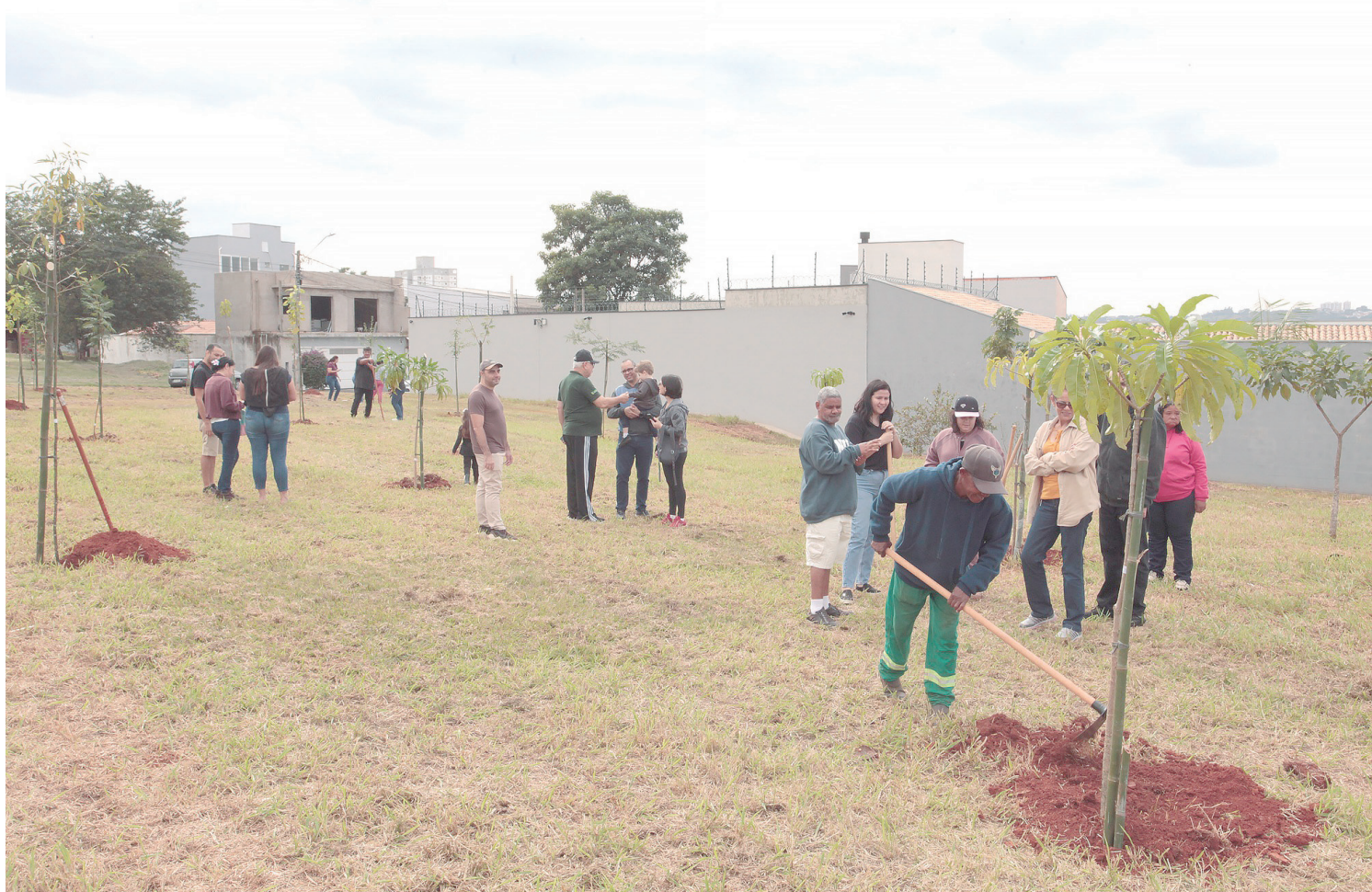
Programa reuniu famílias no bairro Água Branca e transformou o nascimento de bebês em um gesto de cuidado com o meio ambiente

Para a Professora Bebel, esse episódio - policiais militares que entraram armados na EMEI Antônio Bento, na Zona Oeste de São Paulo - também evidencia a importância das câmeras corporais para a transparência da atuação policial. AB