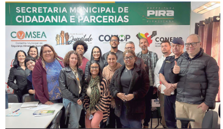
Reunião aconteceu no último dia 3, na Secretaria de Cidadania e Parcerias

Mais informações sobre os cursos podem ser obtidas pelo turismo@piracicaba.sp.gov.br ou (19) 3403-2648 (telefone) ou (19) 99697-5905 (WhatsApp).