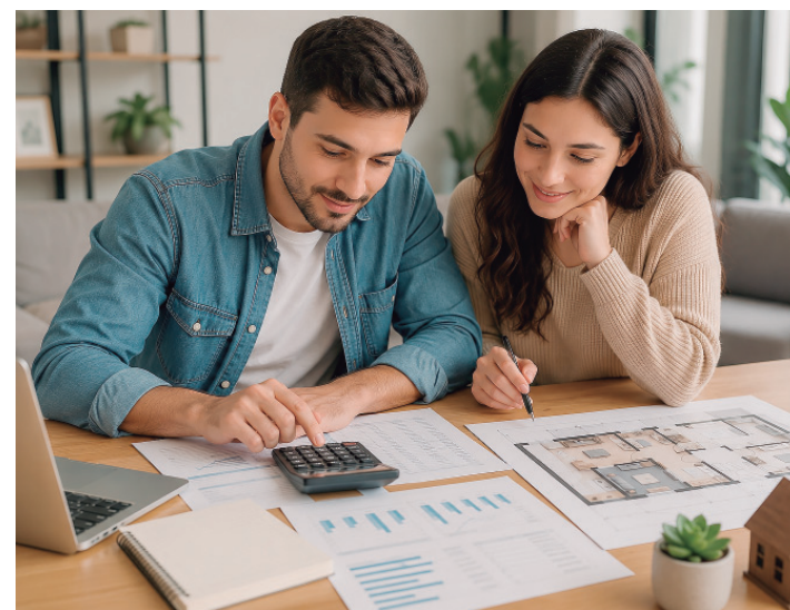
Importante é o entendimento em família para definir o que é a renda

Saber usar a renda familiar de forma estratégica pode ampliar bastante o leque de opções na