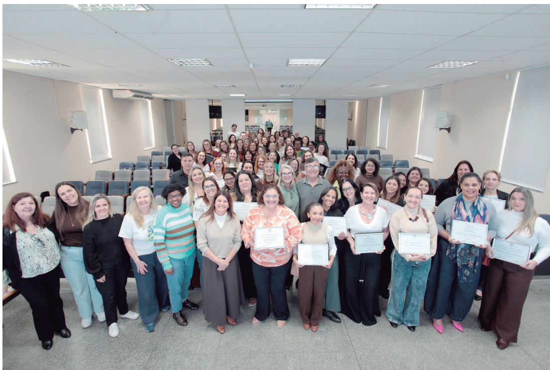
Reconhecimento às unidades escolares mostra que o processo de alfabetização no município é permanente e vem apresentando evolução consistente

O desempenho dessas escolas contribuiu para que Piracicaba conquistasse o Prêmio Excelência Educacional. As equipes gestoras receberam certificados de reconhecimento pelo trabalho desenvolvido e cada unidade premiada receberá um repasse de R$ 100 por aluno, em data a ser definida pela Secretaria de Educação do Estado de São Paulo. O IEE avalia o desempenho dos estudantes em Língua Portuguesa e Matemática, conside-