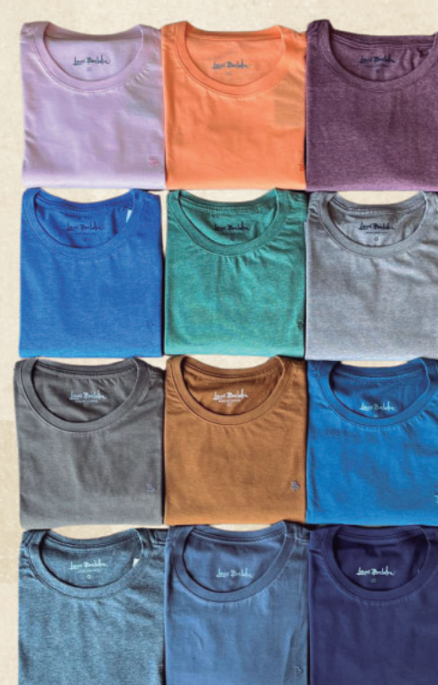
CAMISETA ALGODÃO À PARTIR R$ 99,90