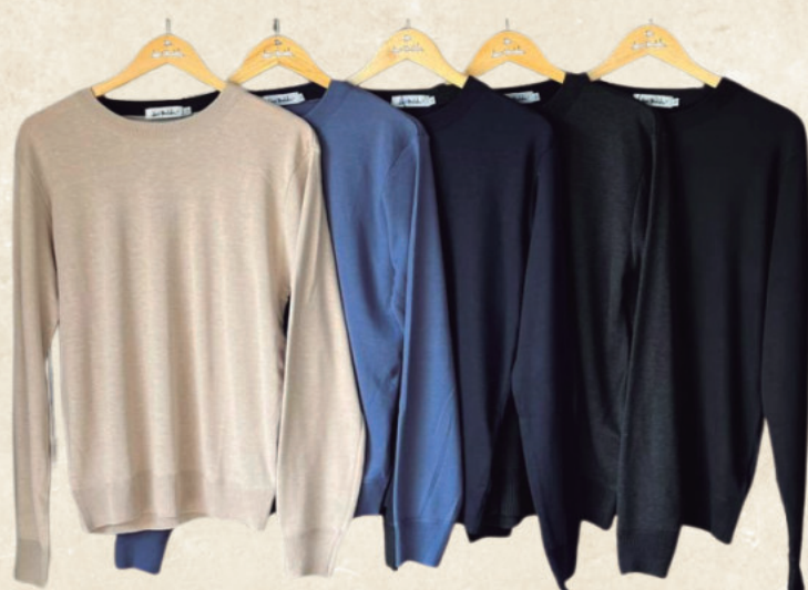
SUÉTER MASCULINO R$ 199,90