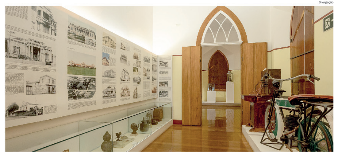
Entre histórias e memórias, Museu Prudente de Moraes abre espaço para encontro artístico que celebra a chegada do inverno

SERVIÇO – Sarau das Artes: Quando o Inverno Chegar. Quinta-feira (25), às 19h. No Museu Histórico e Pedagógico Prudente de Moraes (rua Santo Antônio, 641 – Centro). Entrada Gratuita. Informações: (19) 3422-3069 (WhatsApp).