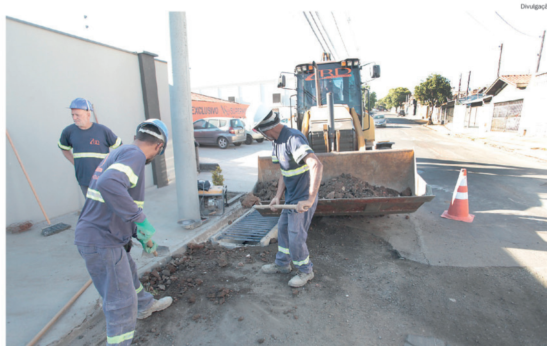
Equipes executam obras de drenagem, com instalação de novas bocas de lobo, na rua Buenos Aires, no Água Branca

Desde 2025, já foram recapeados 81 quilômetros em Piracicaba, em 43 vias, entre ruas e avenidas. Entre elas estão a avenida Rio das Pedras, avenida Raposo Tavares, rua Dom Pedro I, rua Benjamin Constant, avenida Pompeia, avenida Saldanha Marinho, avenida Brasília, rua Dr. Lula, avenida Comendador Luciano Guidotti, avenida Dr. João Conceição, avenida Nove de Julho, avenida José Micheletti e avenida Santa Catarina.