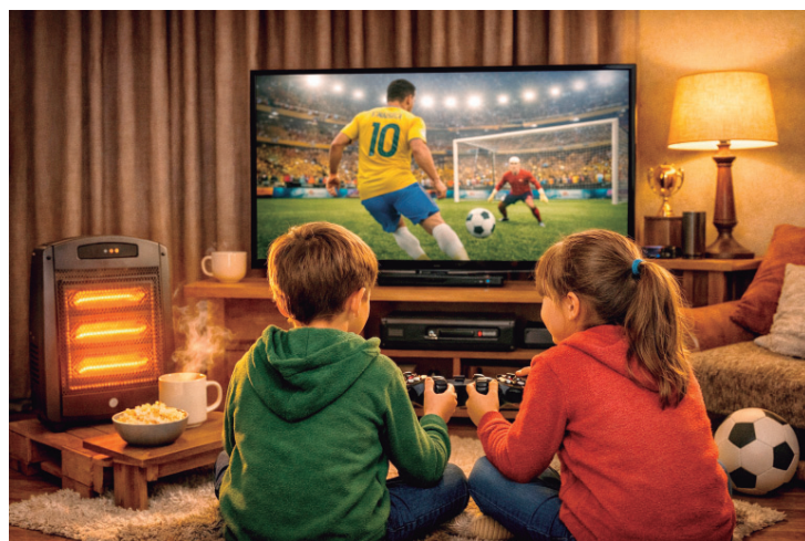
Copa e férias: mais tempo em casa

Dicas da CPFL Paulista: Usar a posição "Verão" ou "Morno" pode gerar economia de até 30%; Reduzir o tempo de banho; Optar por duchas eletrônicas com ajuste gra-