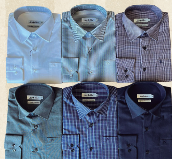
CAMISA M/L PREMIUM R$ 279,90