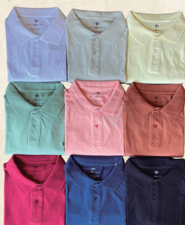
POLO ALGODÃO R$ 169,90