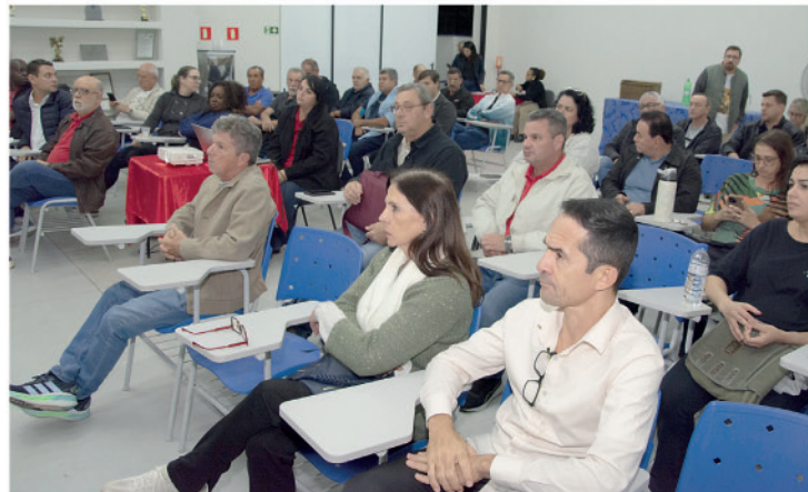
Categoria reunida busca garantir direitos e ampliar as conquistas