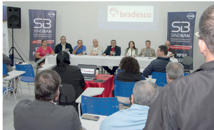
Bancários e bancárias tiveram a oportunidade de se colocarem durante a plenária

Encontro preparatório reforça participação na Conferência Nacional dos Bancários e define prioridades para a Campanha Nacional 2026; foi terça, daí 16