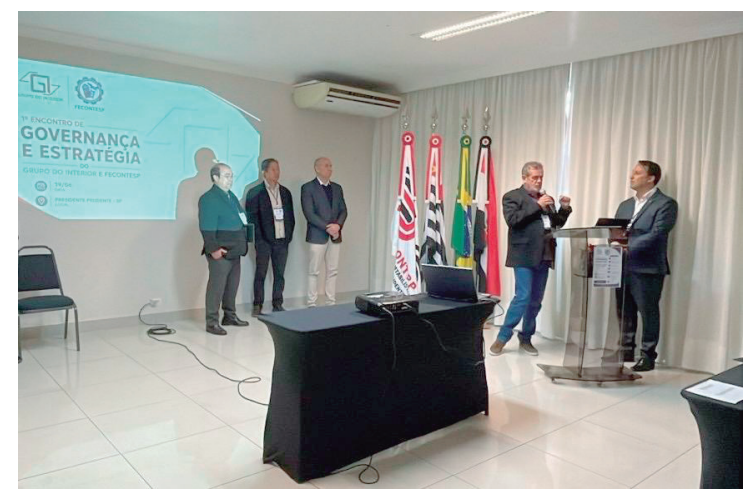
Presidente Prudente sediou encontro do Grupo do Interior e Fecontesp

O médico reforça que a alergia pode surgir tanto na infância quanto na vida adulta, sem aviso prévio. "Não existe um perfil único de paciente alérgico. Quanto mais cedo o diagnóstico for feito e o tratamento iniciado, maiores as chances de controle dos sintomas e de preservação da qualidade de vida. Procurar um especialista é o primeiro passo", conclui.