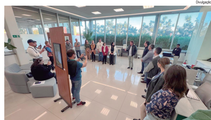
Exposição está aberta até dia 7 de julho

SERVIÇO - Mais informações pelo WhatsApp (19) 3437-2221, ou pelo telefone (19) 3437-2222. O CAT (Centro de Apoio ao Trabalhador), da Secretaria de Trabalho, Emprego e Renda, está localizado no Térreo 1 do Centro Cívico, na rua Antônio Corrêa Barbosa, 2.233.