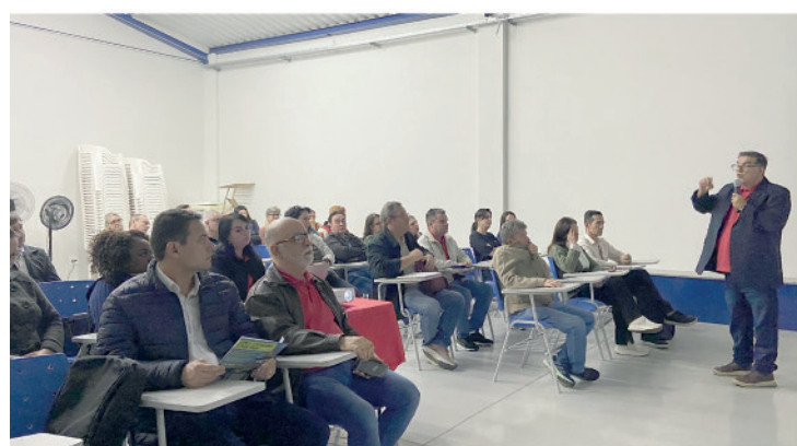
Sindicato tem promovido debates pautados no Programa PEA Participação, Escuta e Ação