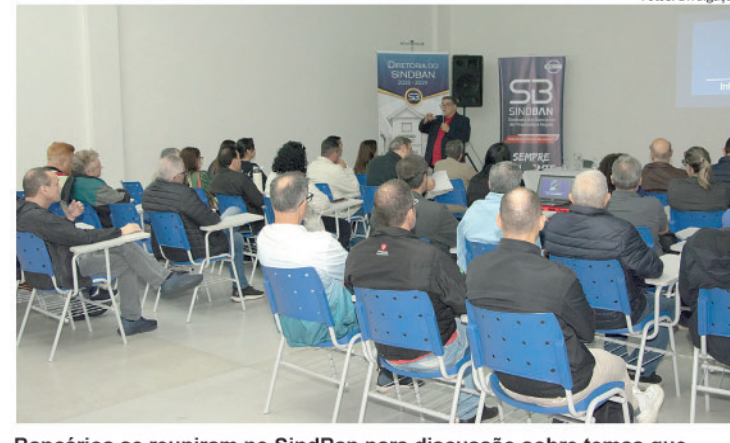
Bancários se reuniram no SindBan para discussão sobre temas que devem impactar a Campanha Nacional dos Bancários