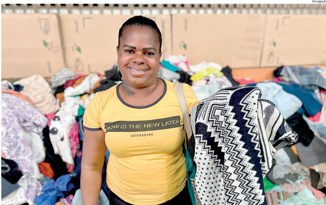
Solange participou da edição anterior do Varal Solidário e levou agasalhos para casa

O programa Agora Tem Especialistas integra um conjunto de ações do Ministério da Saúde voltadas à ampliação da oferta de consultas, exames e procedimentos especializados no Sistema Único de Saúde (SUS), contribuindo para a redução das filas e para a melhoria do acesso da população aos serviços de saúde.