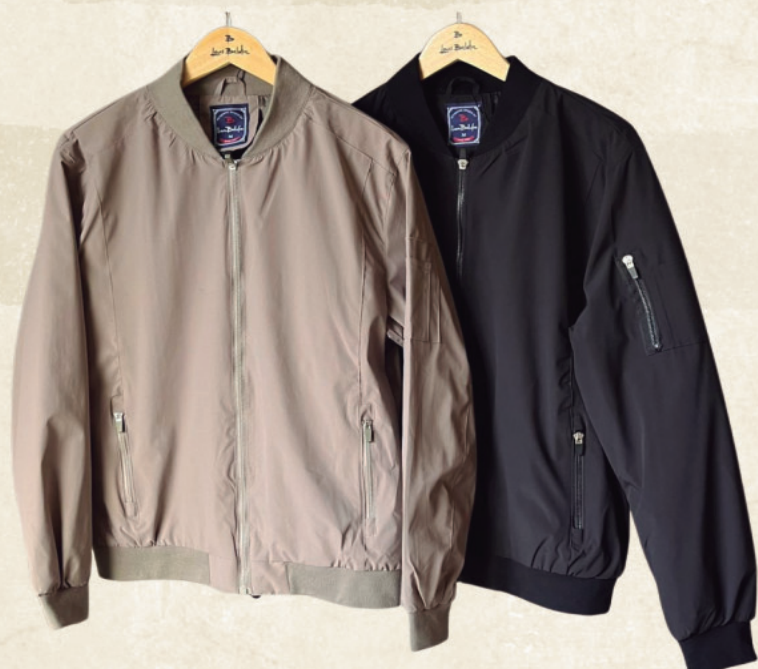
JAQUETA SOFT BROKS R$ 499,90

Arraial com estilo é aqui. Venha conferir!