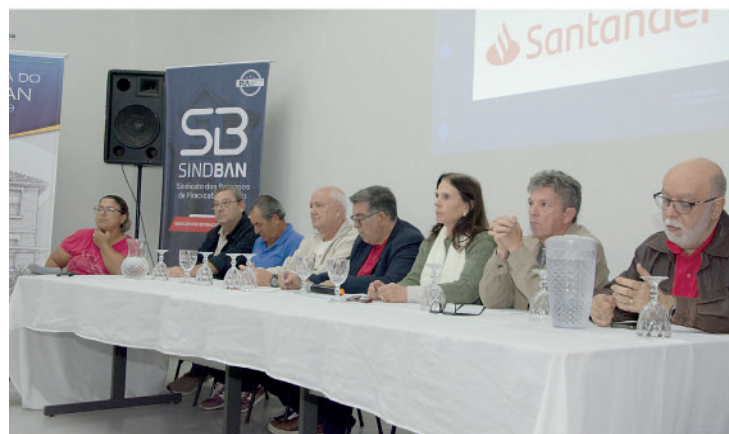
Diretores do SindBan na mesa de abertura da plenária