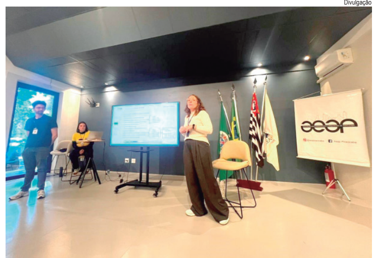
A programação do workshop abordou os aspectos legais e procedimentais da Reurb

A programação também abordou os aspectos legais e procedimentais da Reurb, incluindo legislação municipal, decretos, normativas técnicas, padronização documental e o papel do poder público nos processos de regularização. Já no segundo dia, o foco foi a aplicação prática da Reurb, com análise de projetos, apresentação das etapas do processo de regularização