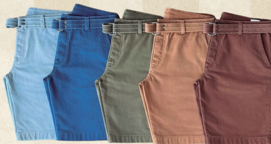
BERMUDA SARJA MASCULINA R$ 299,90