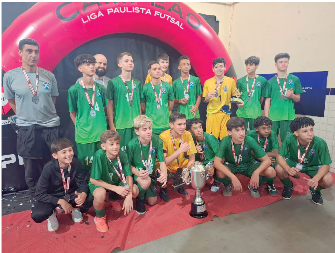
Futsal sub-15 de Piracicaba conquistou o vice-campeonato da Copa da Liga Paulista