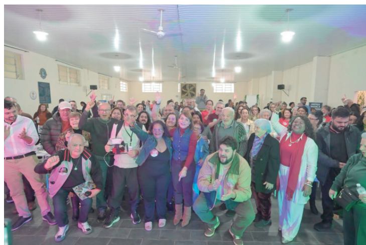
Plenária de Botucatu reuniu professores, apoiadores e lideranças da região