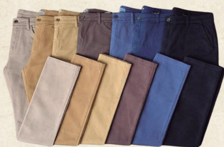
CALÇA SARJA MASCULINA R$ 299,90