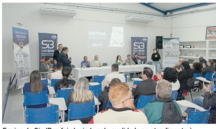
Equipe do SindBan foi elogiada pela qualidade no atendimento à categoria em várias frentes