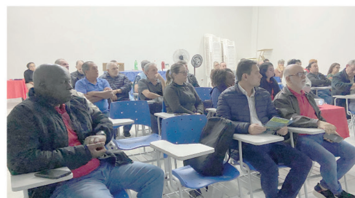
Sindicato tem promovido debates pautados no Programa PEA Participação, Escuta e Ação

A preparação para a 28ª Conferência Nacional dos Bancários é o foco principal da mobilização da categoria neste momento. Como etapa fundamental para a construção da Campanha Nacional dos Bancários 2026, o encontro reunirá representantes de bancárias e bancários de todo o país para definir as prioridades de luta, a pauta de reivindicações e os desafios que estarão no centro das negociações com os bancos.