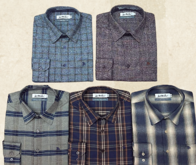
FLANELA MASCULINA R$ 299,90