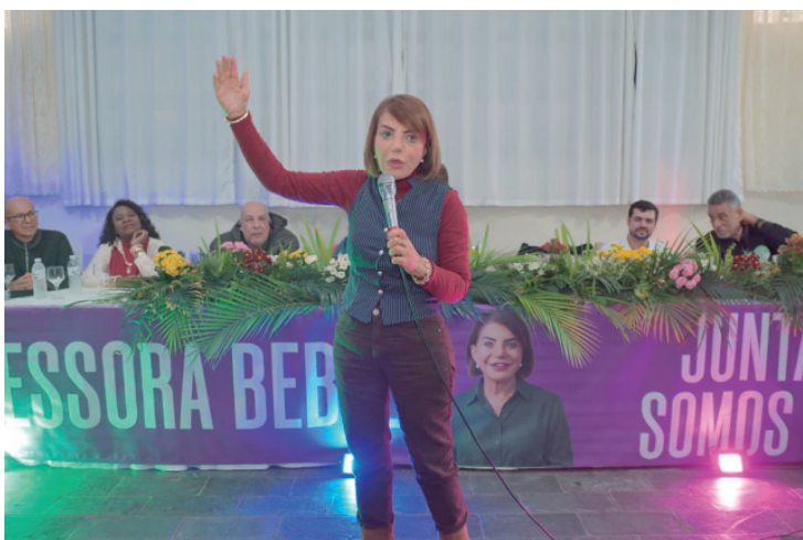
Na plenária de Botucatu, a deputada Professora Bebel falou do seu compromisso com a educação pública, com o jovem, o idoso e com todas as regiões do Estado

Ele igualmente questiona se Piracicaba tem participado ou pretende participar dos programas de capacitação promovidos pelo Ministério da Saúde e quais ações estão sendo desenvolvidas para ampliar o acesso da população ao método contraceptivo e divulgar sua disponibilidade na rede pública.