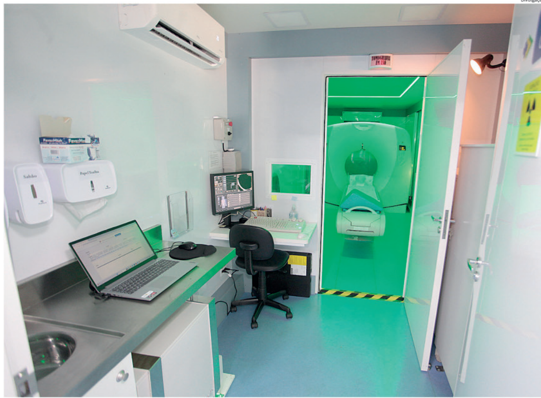
Carreta da Tomografia ficou no Shopping Piracicaba

Na rede privada, o exame pode custar até R$ 2.500,