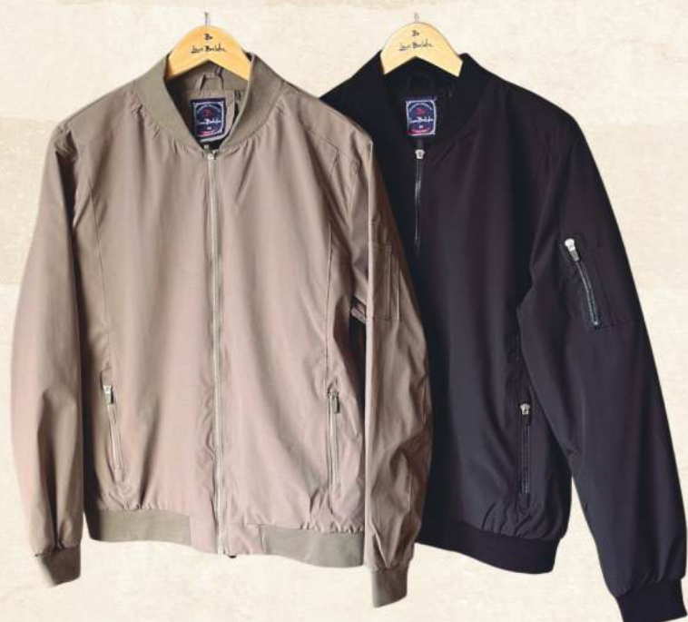
JAQUETA SOFT BROKS R$ 499,90

Arraial com estilo é aqui. Venha conferir!