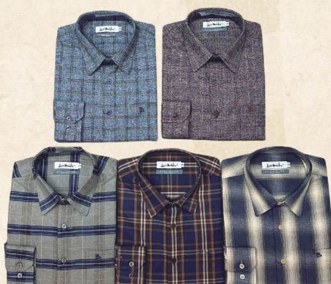
FLANELA MASCULINA R$ 299,90