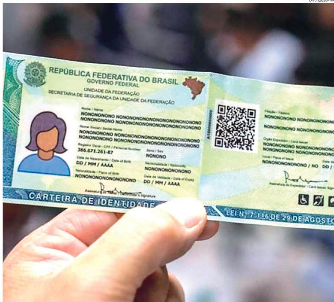
A primeira via da CIN é gratuita e pode ser emitida em todos os estados

A nova carteira incorpora mecanismos modernos de segurança, como o QR Code, que permite a verificação rápida da autenticidade do documento por meio do aplicativo de leitura da CIN, disponível gratuita-