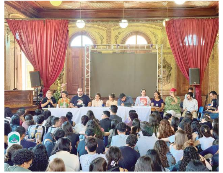
Aula inaugural do cursinho popular de Piracicaba, que está no seu sexto ano e é realizado na EE Sud Mennucci