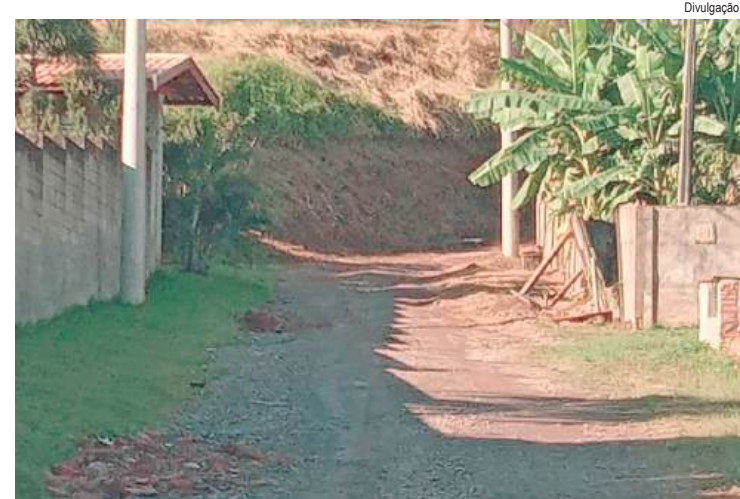
Pedro Kawai defende manutenção com cascalho em ruas do bairro para melhorar a segurança e trafegabilidade da população

O mamógrafo integra o rol de investimentos da Santa Casa de Piracicaba na modernização de sua estrutura, com impacto direto no atendimento ao Sistema Único de Saúde (SUS). A instituição atende 25 municípios da região e depende de parcerias como esta para ampliar a capacidade de diagnóstico e reduzir filas de espera para exames de rastreamento do câncer de mama.