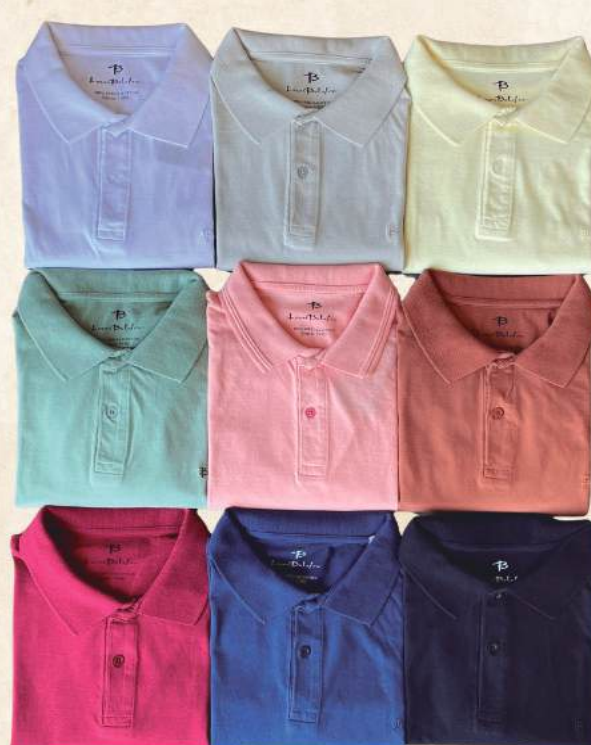
POLO ALGODÃO R$ 169,90