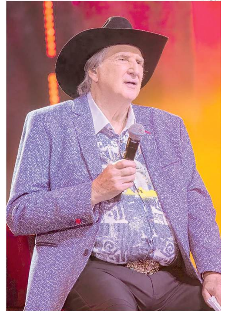
Evento com show de Sérgio Reis acontecerá no Clube Cristóvão Colombo

Em 2001, foi agraciado com a Medalha de Mérito Científico pelo governador do Estado de São Paulo. De 2019 a 2024, foi diretor de estratégias institucionais da Fundação Butantan. Atualmente, é gerente de relações institucionais da Fundação de Amparo à Pesquisa do Estado de São Paulo (FAPESP).