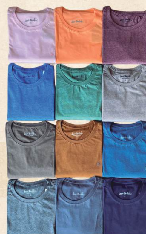
CAMISETA ALGODÃO À PARTIR R$ 99,90