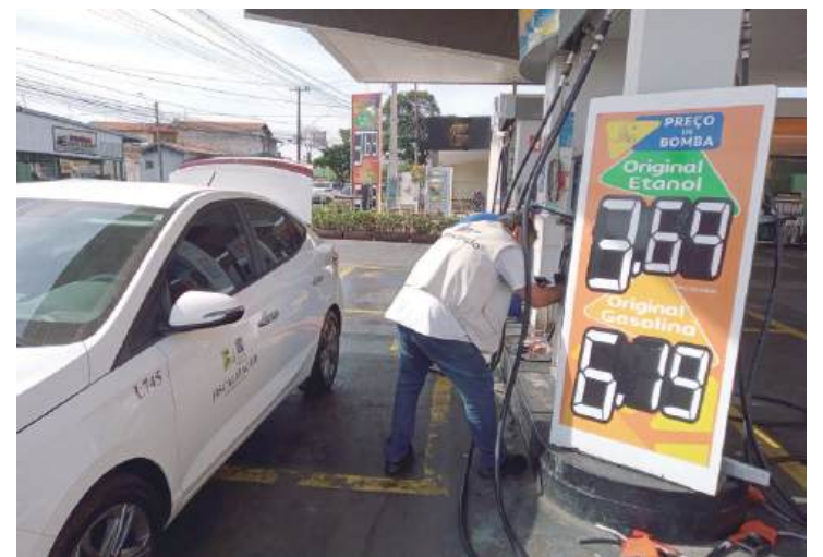
Em Piracicaba, Ipem realizou a Operação Olhos de Lince

tes formas de pagamento - dinheiro, crédito ou débito - podem resultar em valores diferenciados de cobrança; Verifique se a bomba de combustível inicia em zero; Aguarde o abastecimento começar e esteja atento até o seu término. Somente após a conclusão do abastecimento se dirija ao local de pagamento; Em caso de dúvidas, solicite a conferência da bomba por meio do aferidor de 20L que todos os postos são obrigados a ter. Fique atento para possíveis falhas de energia na bomba medidora após pedir esse ensaio e, antes de testar a bomba, verifique se o aferidor encontra-se lacrado e sem qualquer material em seu interior que possa reduzir seu volume; Tenha como referência os abastecimentos anteriores realizados em postos de combustíveis da sua confiança, pois, o volume nominal do tanque indicado no manual do veículo costu-