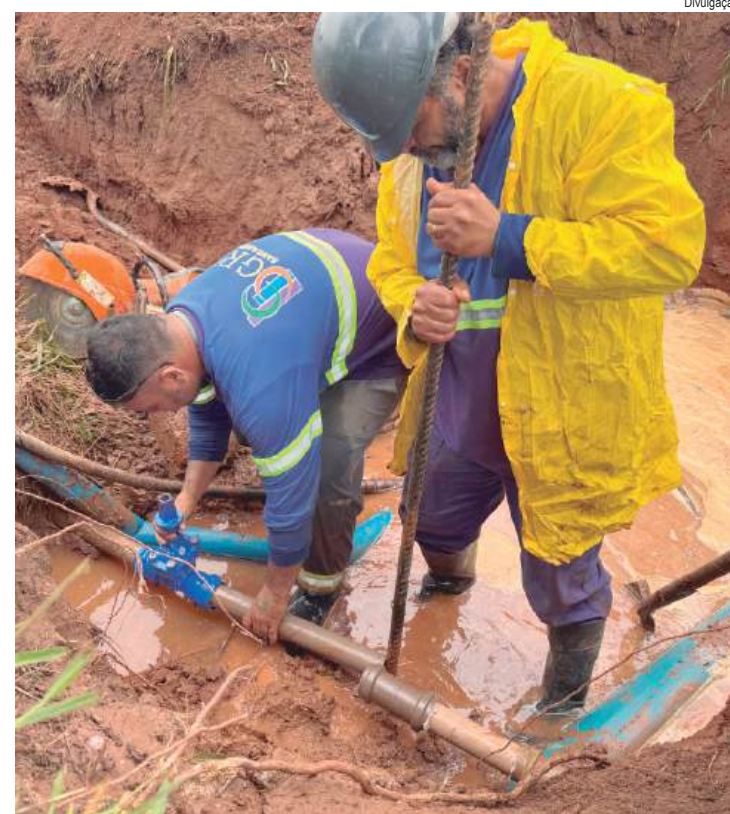
Equipes fazem a instalação de novo registro de rede na região do Santa Inês

Para ter acesso aos medicamentos, é necessário apresentar prescrição médica detalhada, laudos, exames e demais documentos exigidos pelos protocolos de atendimento. Os medicamentos são fornecidos pelo Governo do Estado de São Paulo e pelo Ministério da Saúde. A unidade atende, em média, 12 mil pacientes por mês. Entre os medicamentos disponibilizados estão os utilizados no tratamento de artrite reumatoide, esclerose múltipla, doença de Crohn, asma, DPOC, Parkinson, epilepsia, diabetes tipo 1 e esquizofrenia, entre outras doenças contempladas pelos Protocolos Clínicos e Diretrizes Terapêuticas (PCDT) do Ministério da Saúde.