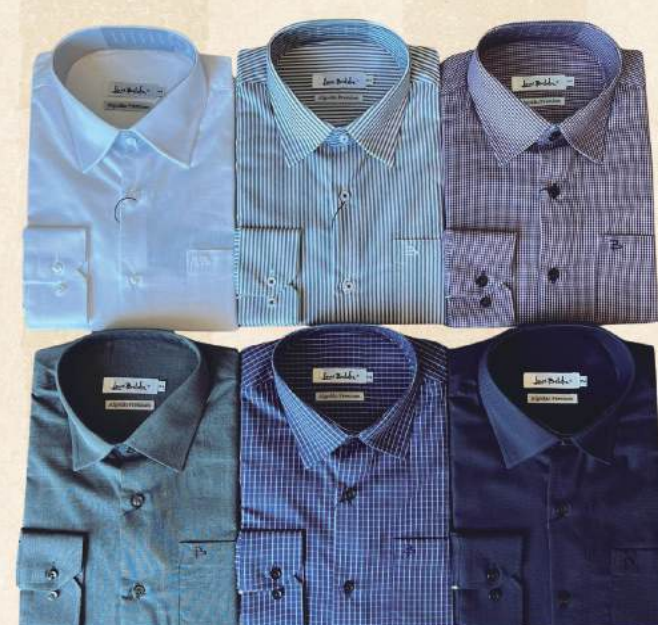
CAMISA M/L PREMIUM R$ 279,90