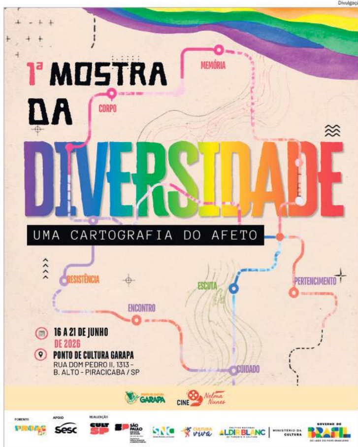
Com entrada gratuita, mostra reúne produções audiovisuais que abordam diferentes relações com o mundo

Realizada durante o Mês do Orgulho LGBTQIAPN+, celebrado internacionalmente em junho, a mostra integra um conjunto de iniciativas culturais que reconhecem a importância da arte e do audiovisual na promoção da visibilidade, da representatividade e do diálogo. A escolha do mês remete aos acontecimentos