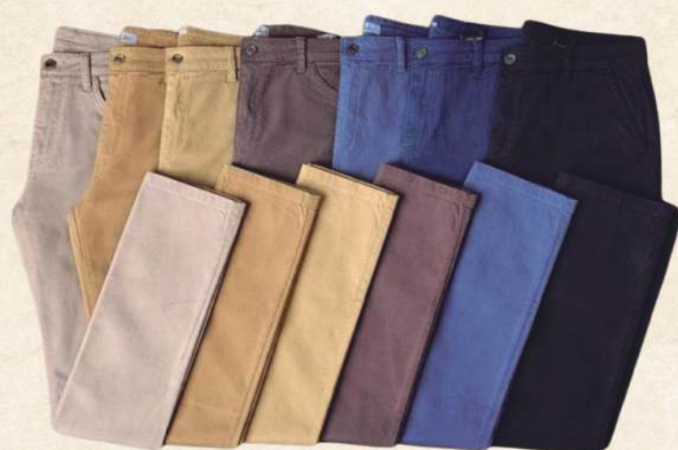
CALÇA SARJA MASCULINA R$ 299,90