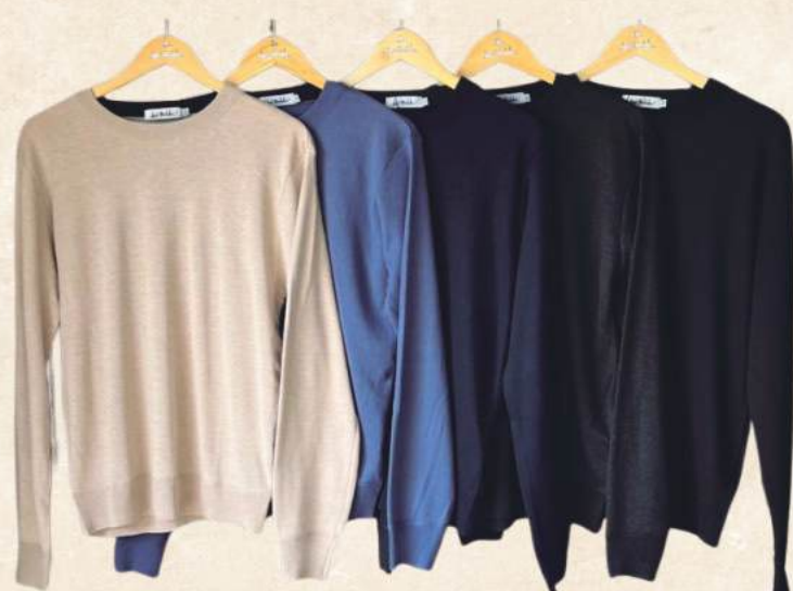
SUÉTER MASCULINO R$ 199,90