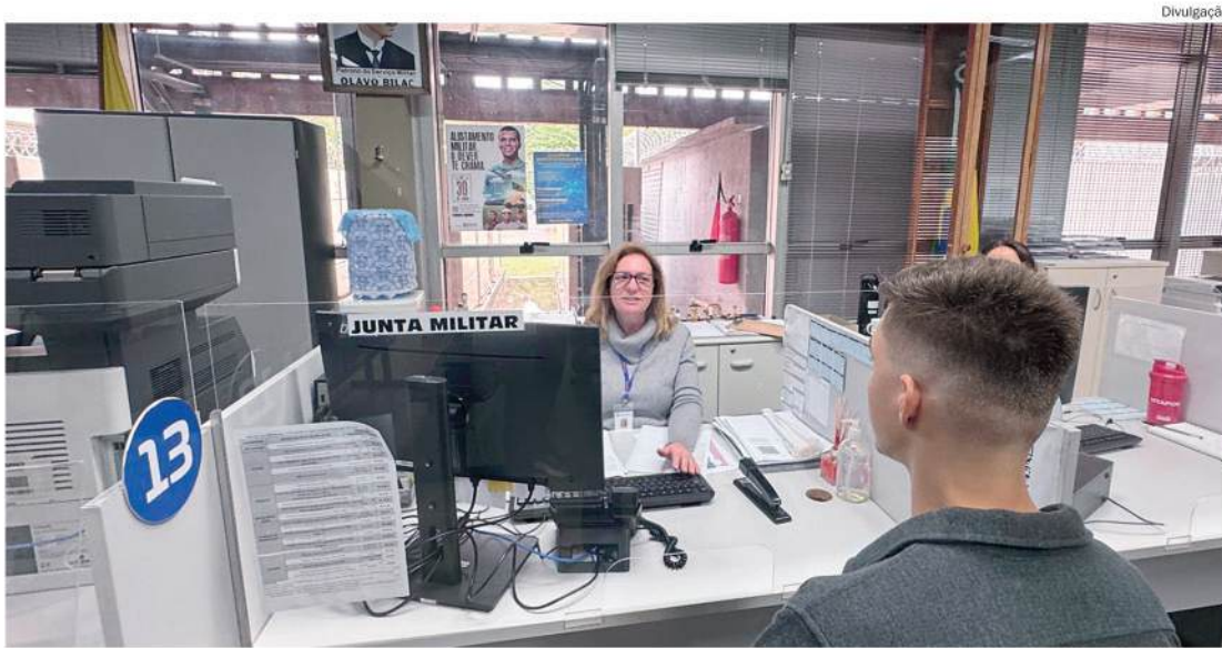
Inscrições podem ser feitas pela internet ou presencialmente na Junta de Serviço Militar

Jovens nascidos em anos anteriores a 2008 que não realizaram o alistamento no