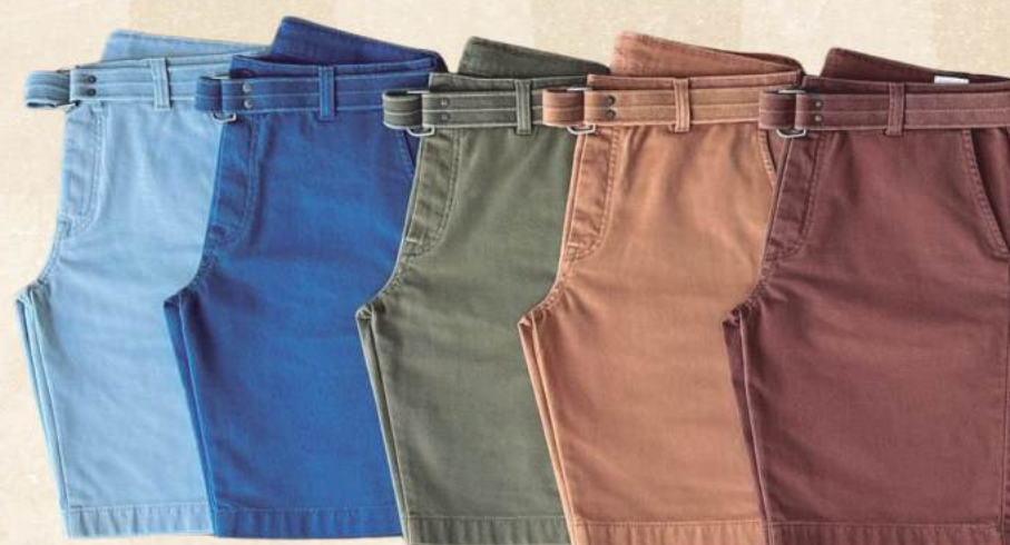
BERMUDA SARJA MASCULINA R$ 299,90