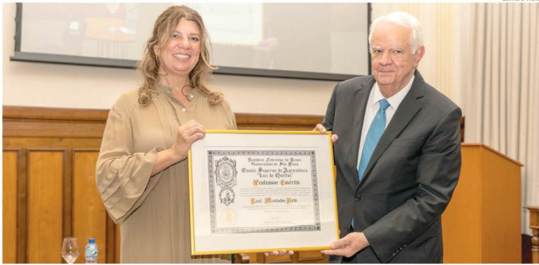
Ato de entrega da honraria integra a celebração dos 125 anos da Esalq

curso ressaltaram seu papel na consolidação da pesquisa científica na instituição, sua atuação em programas de internacionalização e sua contribuição para a criação de iniciativas acadêmicas inovadoras.