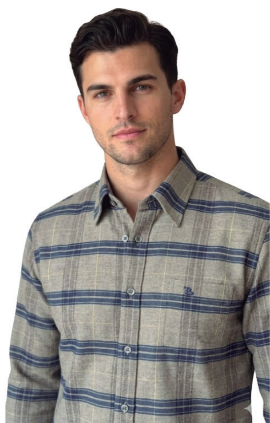
CAMISA M FLANELA R$ 299,90