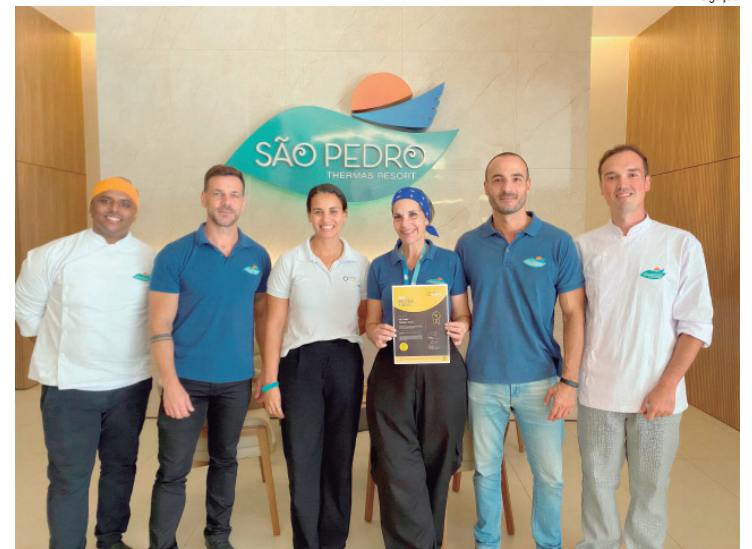
Reconhecimento destaca a qualidade da operação gastronômica do resort

Além da nova sede, o Campus Catalão possui outros empreendimentos em andamento. Pelo Novo PAC, está prevista a construção de um restaurante estudantil, com orçamento de R$ 1,7 milhão e execução física superior a 30%. Para aquisição de equipamentos, há previsão de mais de R$ 426 mil por meio do Novo PAC.