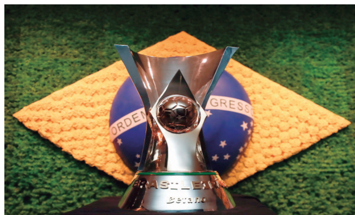
Brasileirão série A para suas rodadas para a disputa da Copa do Mundo 2026