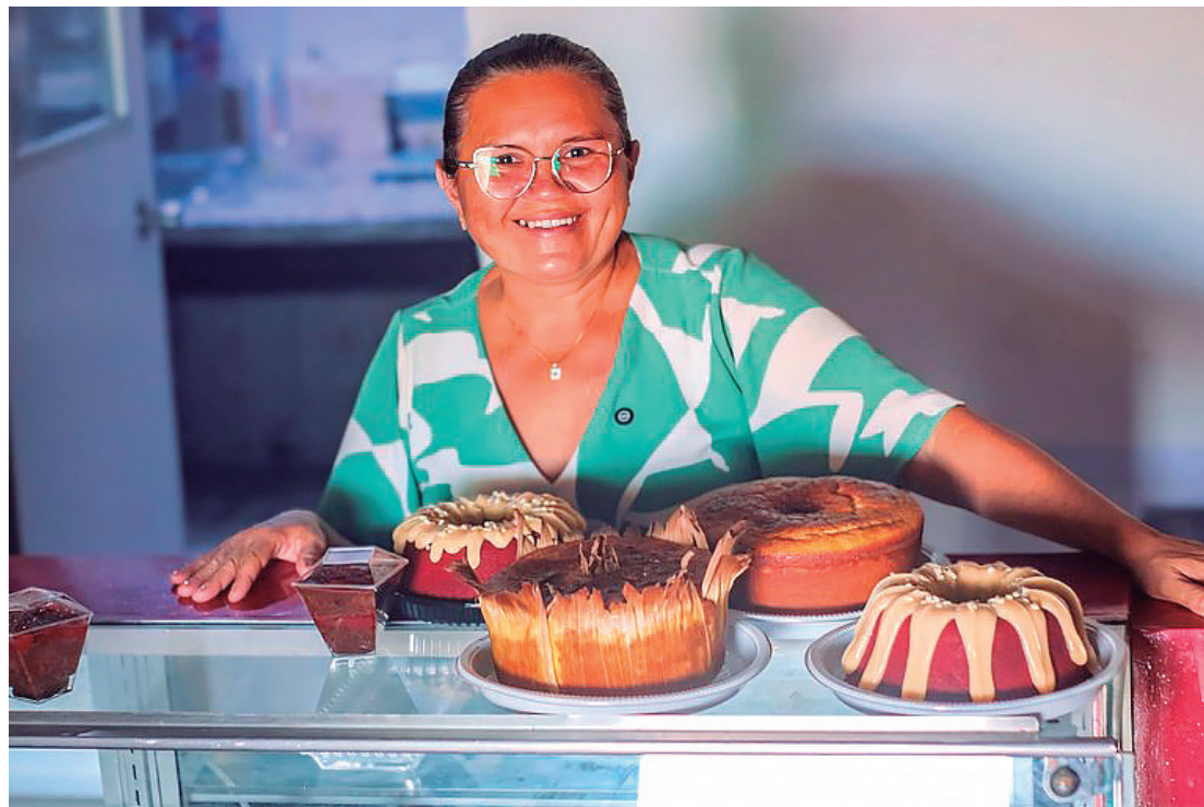
Em todo o país, mais de 5,1 milhões de famílias deixaram o Bolsa Família entre março de 2023 e maio de 2026 após ampliarem a renda familiar

Entre as capitais brasileiras, São Paulo registrou o maior nú-