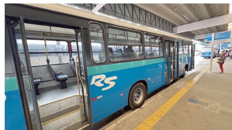
Transporte coletivo vai funcionar com horário de feriado na quinta-feira, Corpus Christi

pelos Sistema Único de Saúde", destaca o diretor. O evento também celebrou os 33 anos da implantação do curso de pós-graduação em Cirurgia Bucocomaxilofacial da FOP-Unicamp e os 32 anos de atuação da especialidade na Santa Casa de Limeira. A programação reuniu residentes, pós-graduandos, professores e profissionais de destaque nacional.