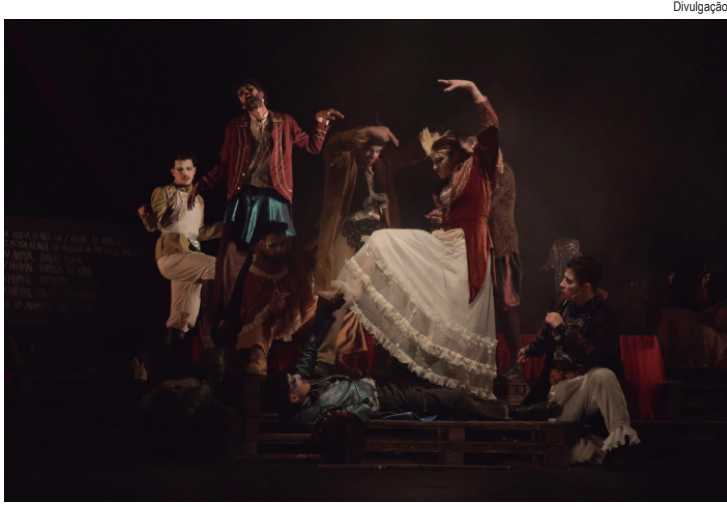
Inscrições abertas para 31ª edição do Festival Estudantil de Teatro do Estado de São Paulo do Conservatório de Tatuí