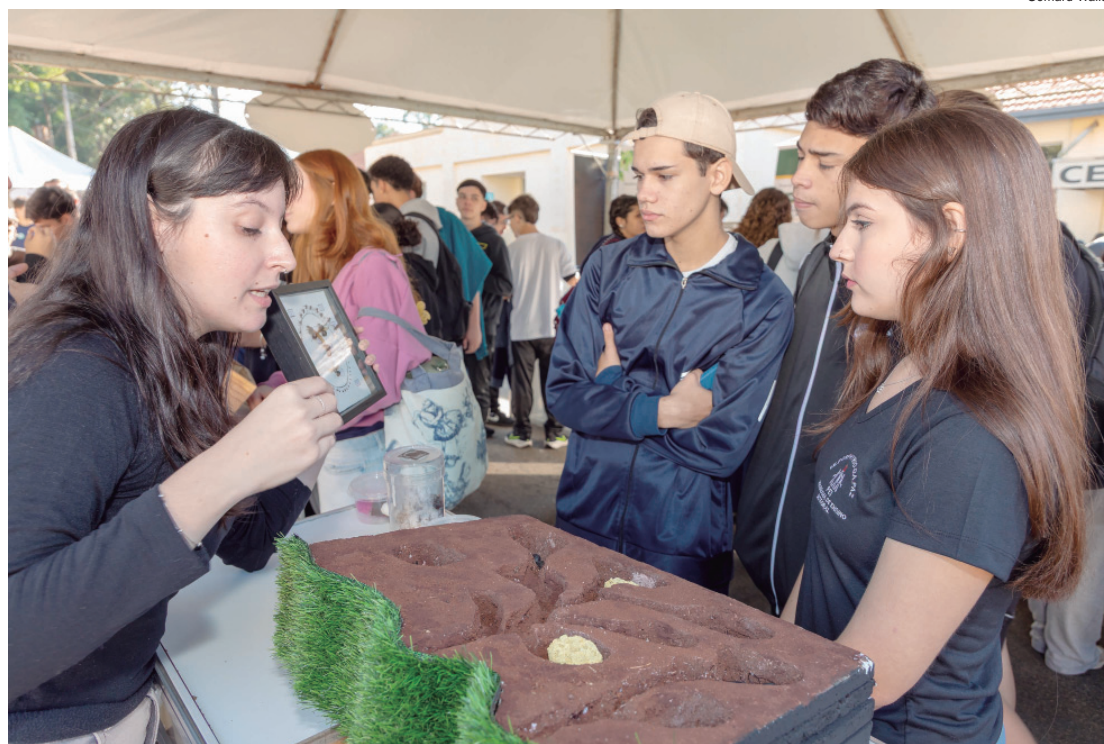
Evento se apresenta como uma grande exposição dos cursos, projetos e atividades culturais da Esalq