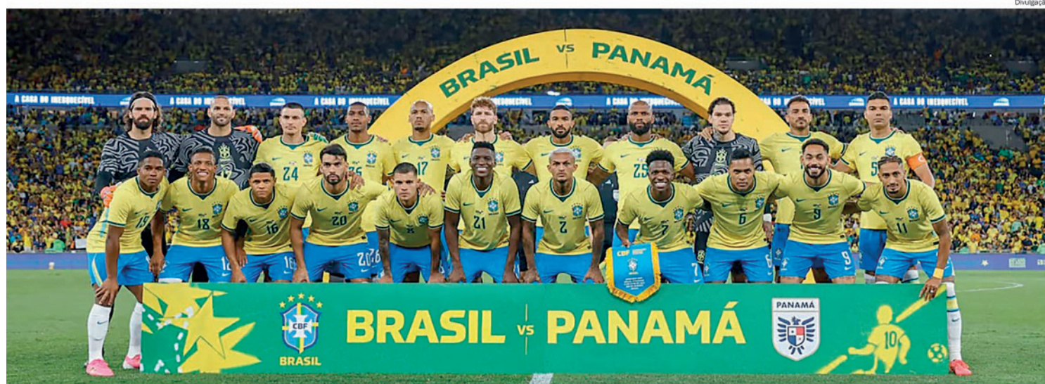
Despedida da seleção no Brasil foi com goleada contra o Panamá 6x2