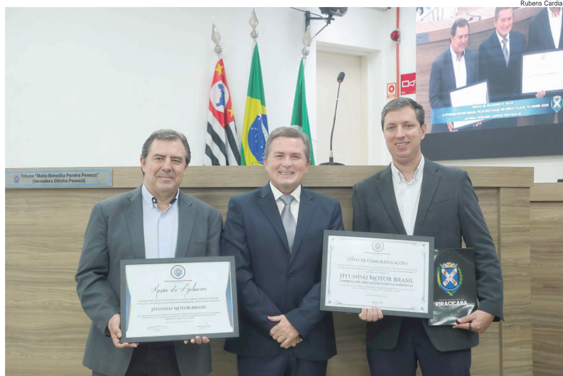
Entrega da moção de aplausos aconteceu na noite desta segunda-feira (1º)

MODERNIZAÇÃO - Como parte desse processo de modernização, a Prefeitura inaugurou o novo Centro Integrado de Perícias e Saúde do Servidor, instalado no T2 do Centro Cívico. A nova estrutura passa a concentrar os atendimentos médicos e psicológicos realizados pelo Sempem, oferecendo mais