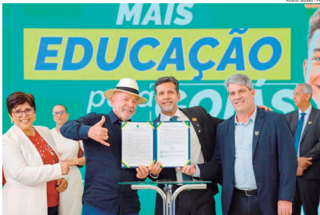
A nova sede definitiva do Campus Catalão amplia a capacidade de atendimento da unidade. O campus possui atualmente 1.210 matrículas

CAMPUS CATALÃO - A estrutura entregue inclui bloco administrativo e bloco pedagógico. Este último com 12 salas de