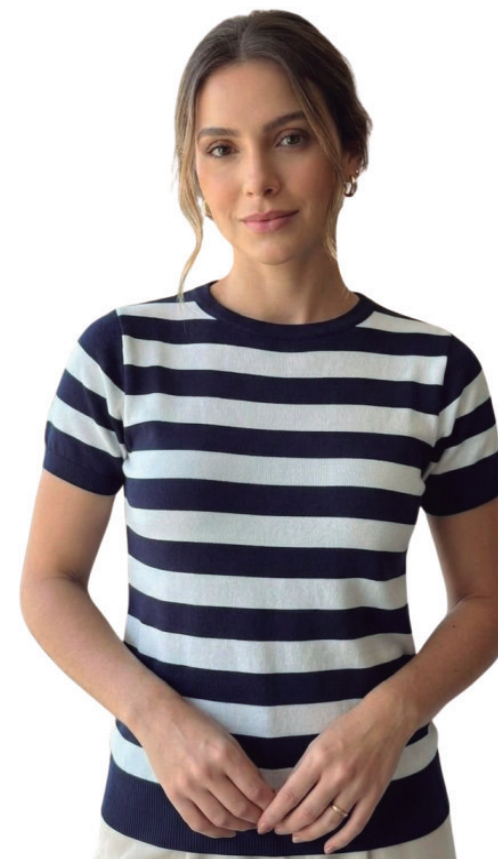
TRICOT F MANGA CURTA R$ 199,90