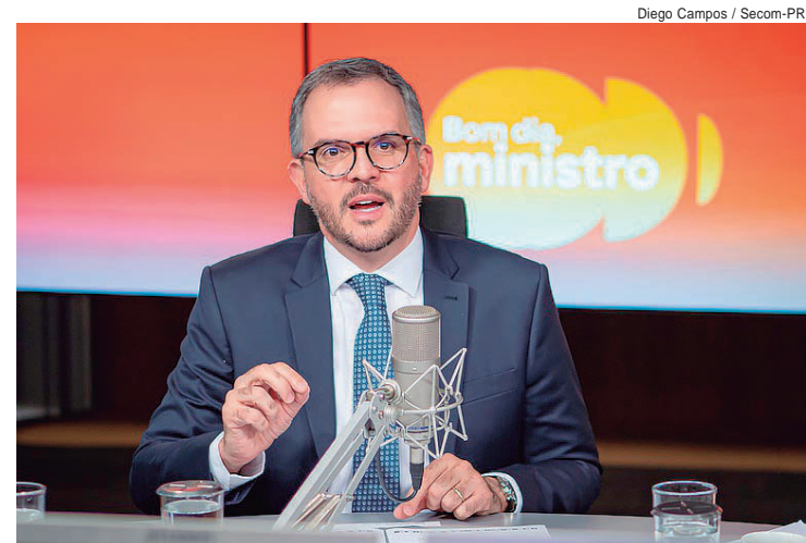
Tomé Franca destacou, durante o programa "Bom Dia, Ministro", que o Governo do Brasil agiu com rapidez para reduzir impactos da crise do combustível ao consumidor, diante da guerra entre os Estados Unidos e o Irã

mento para o crescimento da cidade. "Estamos investindo em tecnologia para reduzir perdas, diminuir rompimentos e melhorar a eficiência da distribuição de água para a população", destacou.