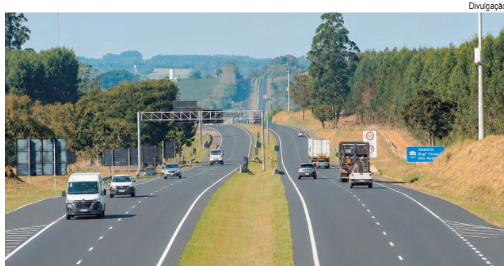
Projeção abrange o trecho de Piracicaba a Panorama, com expectativa de tráfego intenso entre quarta e segunda

O atendimento pode ser acionado pelo usuário a qualquer momento pelo telefone 0800 170 8998, também disponível via WhatsApp, ou pelo aplicativo da Eixo SP. A concessionária oferece ainda cobertura de Wi-Fi gratuito em toda a malha sob concessão, facilitando o acesso aos serviços e informações em tempo real.