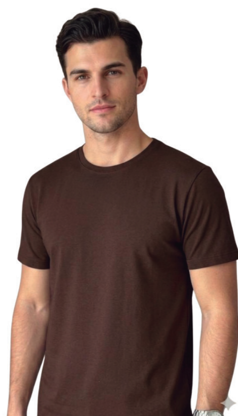
CAMISETA ALGODÃO PIMA R$ 199,90

Concorra a R$ 1.000 EM COMPRAS A CADA R$250,00 EM COMPRAS DOS DIAS 01/06 A 12/06 VÁLIDO PARA AS DUAS UNIDADES