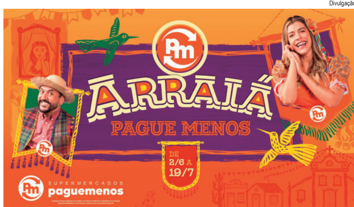
O Arraiá Pague Menos acontece de 2 de junho a 19 de julho