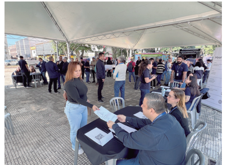
A 2ª Ação de Empregabilidade reuniu cerca de 500 pessoas na Praça José Bonifácio

Estudo da FGV Social aponta ainda que a renda do trabalho das pessoas mais pobres cresceu 10,7% em 2025, acima da média nacional, impulsionada pela geração de empregos formais e pela Regra de Proteção do programa.