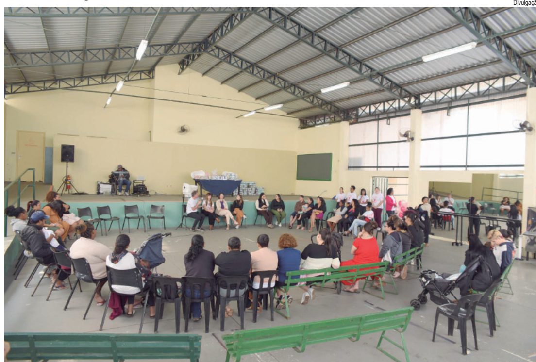
O evento aconteceu no Centro Cultural Zazá, espaço da Secretaria Municipal de Cultura

A iniciativa foi planejada para proporcionar um ambiente acolhedor e informativo, aproximando as famílias dos serviços públicos e ampliando o acesso a informações fundamentais sobre gestação, parto, puerpério e saúde mental materna. Durante toda a manhã, pro-