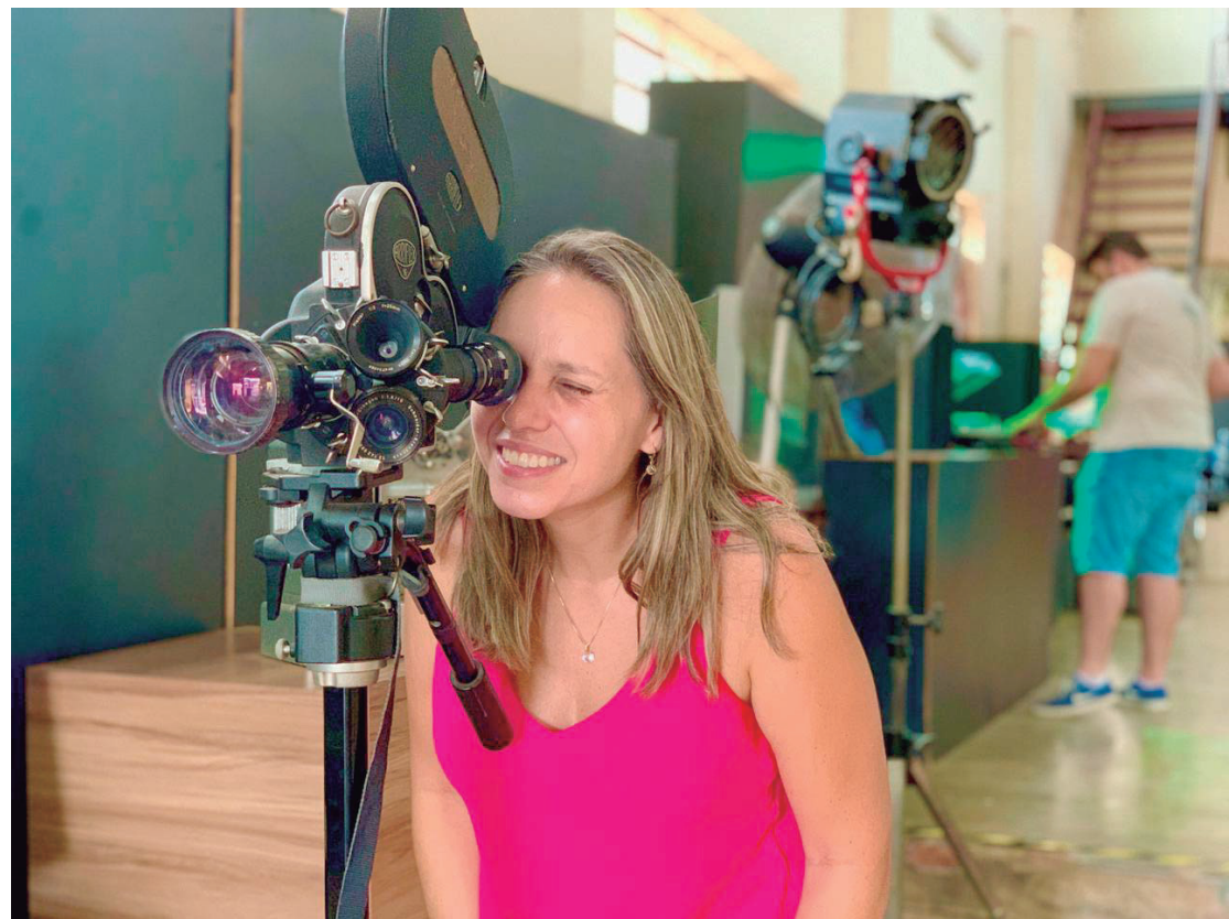
Acervo do MISP destaca a evolução do audiovisual por meio de peças históricas e recursos interativos.

Para quem deseja conhecer mais sobre a história de Piracicaba, o Museu Histórico e Pedagógico Prudente de Moraes, em uma sala central da cidade, é outra alternativa. Instalado na antiga residência do primeiro presidente civil da República, o local é um