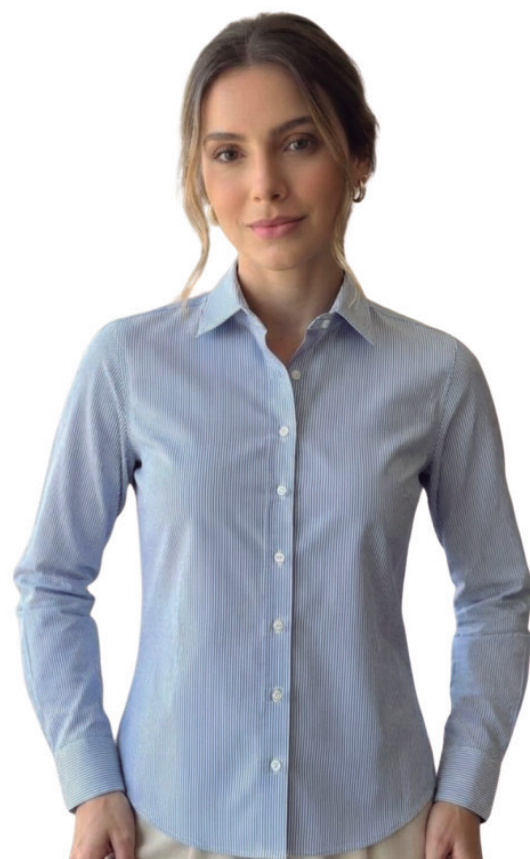
CAMISA F ALGODÃO COM LINHO R$ 329,90