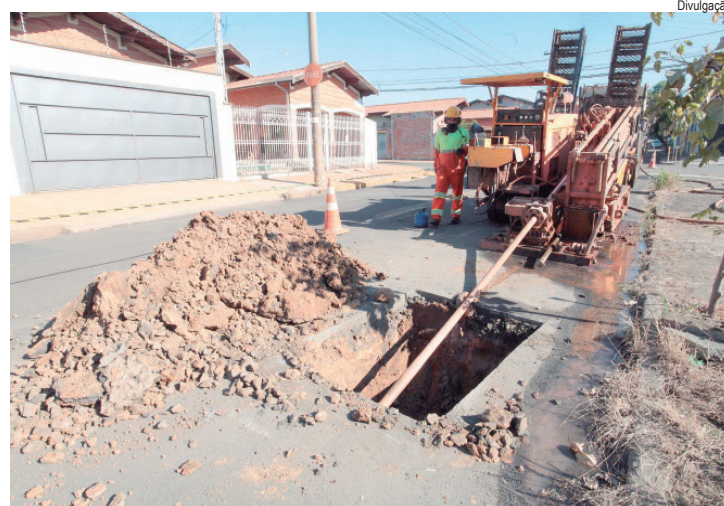
Tecnologia a favor: troca de rede pelo método MND causa menos danos no pavimento

Nos próximos meses, o Sema também utilizará o sistema Pipe Bursting, tecnologia inédita no serviço de água de Piracicaba que per-