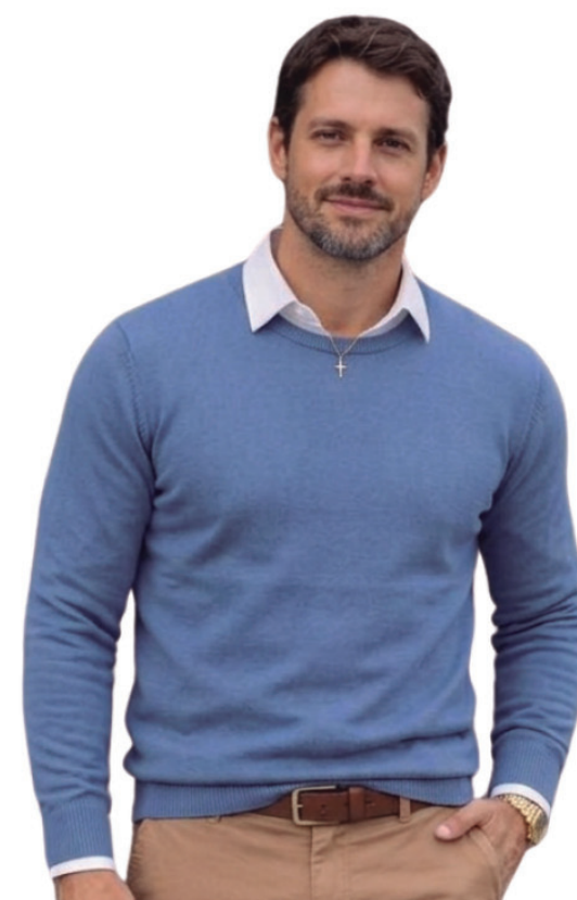
TRICOT MASCULINO R$ 199,90