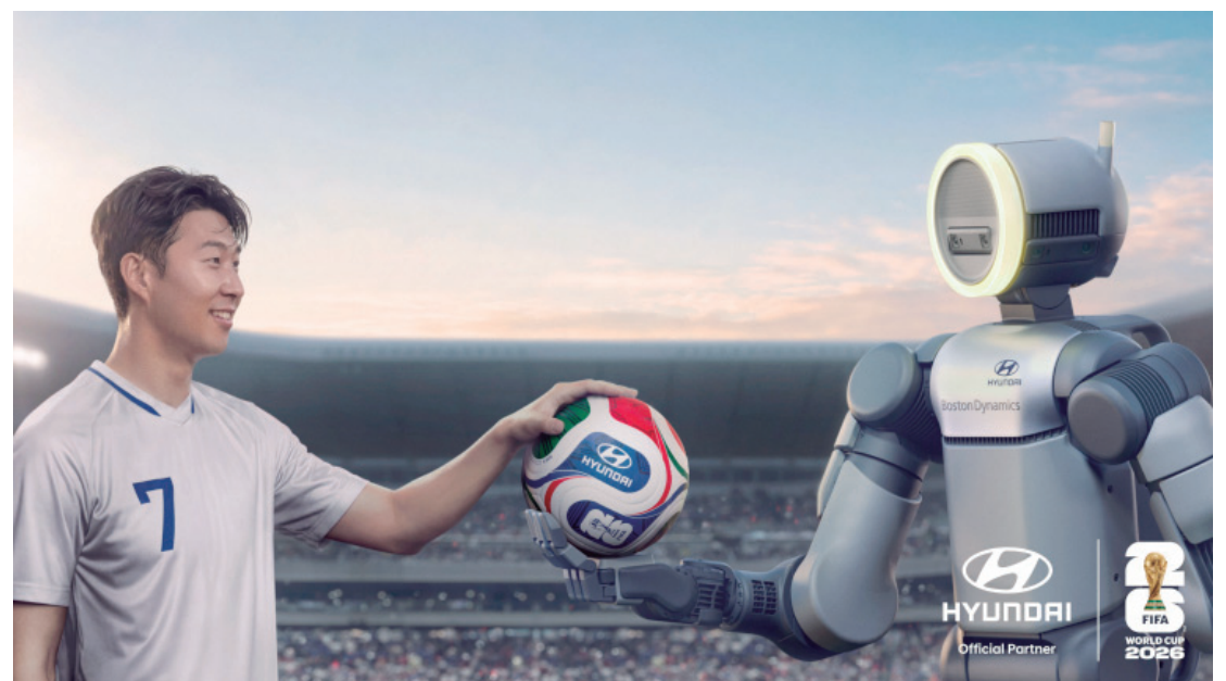
Hyundai Motor estreia a campanha global Next Starts Now para a Copa do Mundo FIFA 2026™

O filme destaca cinco talentos da próxima geração do futebol que já estão deixando sua marca nos gramados e redefinindo o que é possível no esporte. Cada atleta reflete o compromisso da Hyundai Motor em ultrapassar limites e desblo-