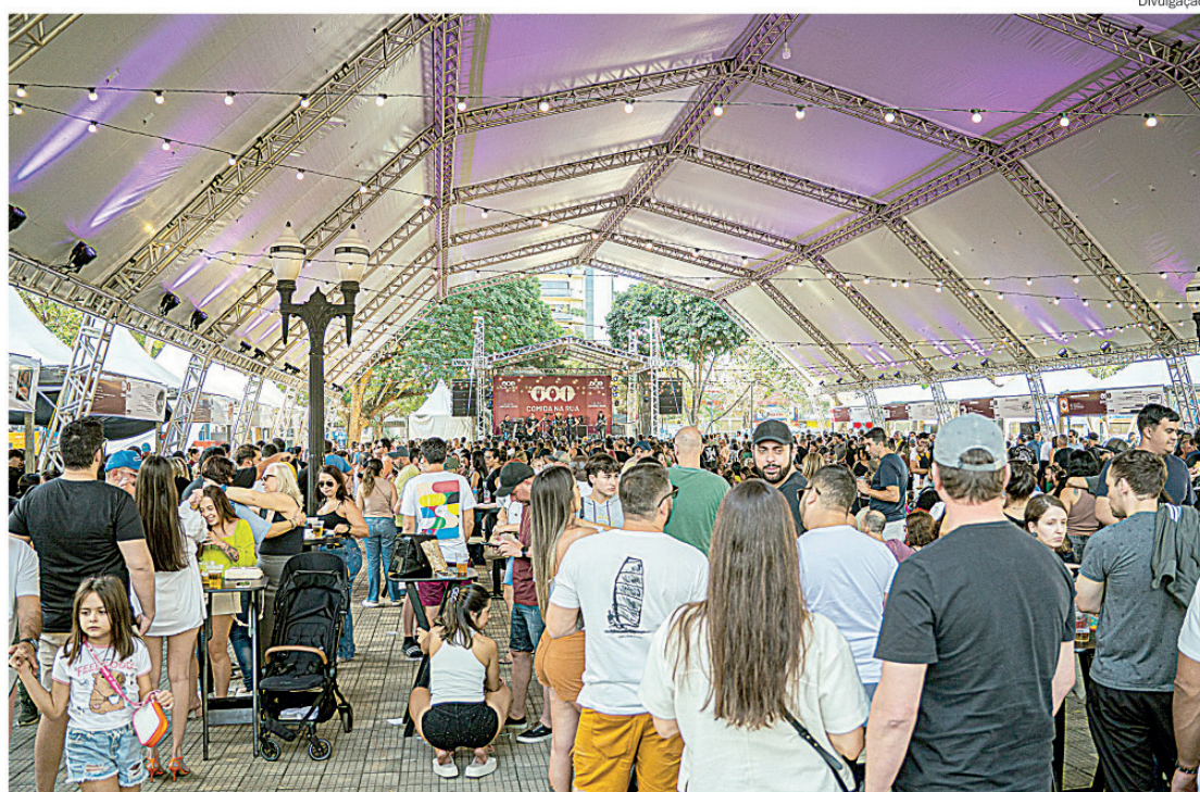
Evento será na praça José Bonifácio, com entrada gratuita ao público

Serão selecionados para esta edição até 33 participantes mediante avaliação durante o processo seletivo. Na categoria Gastronomia, os inscritos deverão apresentar cardápio com pratos entre R$ 20 e R$ 45 e um dos diferenciais como critério seletivo será o desenvolvimento de pratos exclusivos para o festival. Já as cervejarias artesanais deverão comercializar cervejas próprias, com preços entre R$ 12 e R$ 30, incluindo obrigatoriamente uma Pilsen no valor de R$ 12. E na categoria bikes, carrinhos e balcões, poderão participar empreendimentos de sorvetes, vinhos e drinks, com