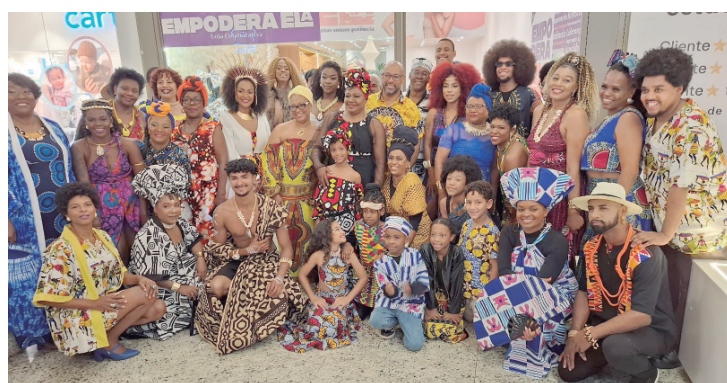
Evento no Shopping Piracicaba marcou o Dia Mundial da África, em 25 de maio, data estabelecida pela ONU pela defesa da liberdade do continente africano

Militante e conselheira da Sociedade Beneficente Treze de