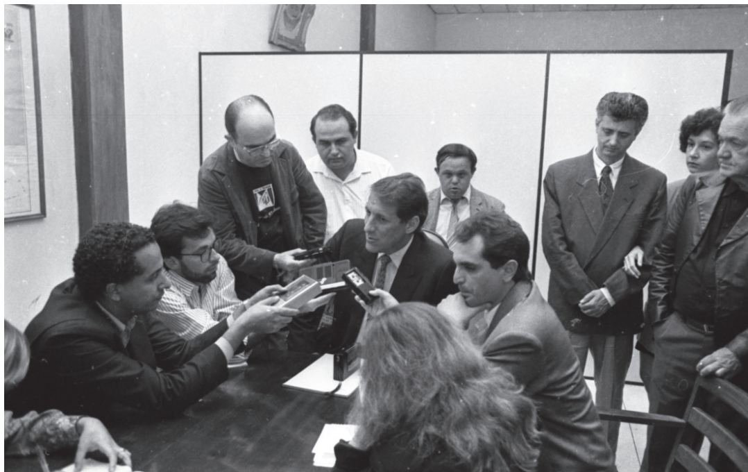
Um dos materiais incorporados ao acervo retrata a solenidade quando Orestes Quêrcia recebeu o título de Cidadão das Águas de São Pedro

O acervo também reúne imagens do período eleitoral de 1994, incluindo visitas de lideranças como Franco Montoro, então candidato a deputado federal por São Paulo, além de