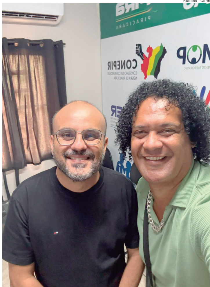
Medida estabelece novas diretrizes para a participação social no conselho

A resolução também reforça o papel do Conselho Municipal do Idoso como espaço de discussão, formulação e acompanhamento das políticas públicas destinadas à garantia de direitos da população idosa em Piracicaba.