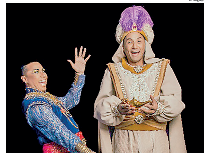
Musical é domingo, 31, às 16 horas, no Teatro Municipal Erotides de Campos

Sábado, 30/05, a partir das 9 horas, na Estação Experimental de Tupi. Endereço: Rodovia Luiz de Queiroz, km 149 - Piracicaba. Entrada gratuita