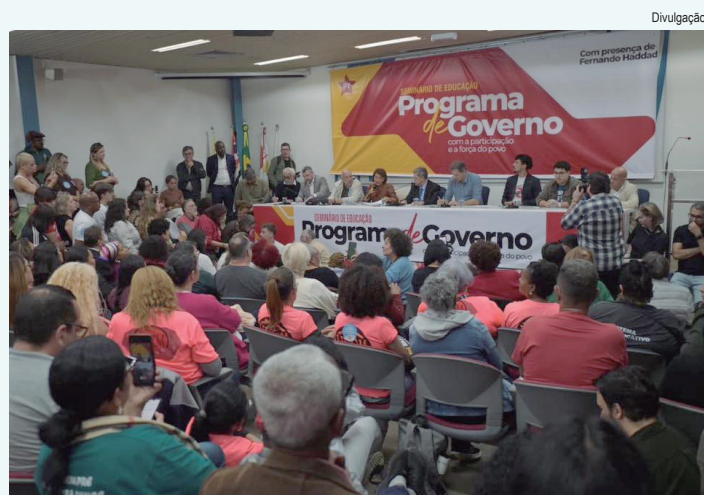
O debate para a área da educação foi realizado no auditório do Sindicato dos Engenheiros