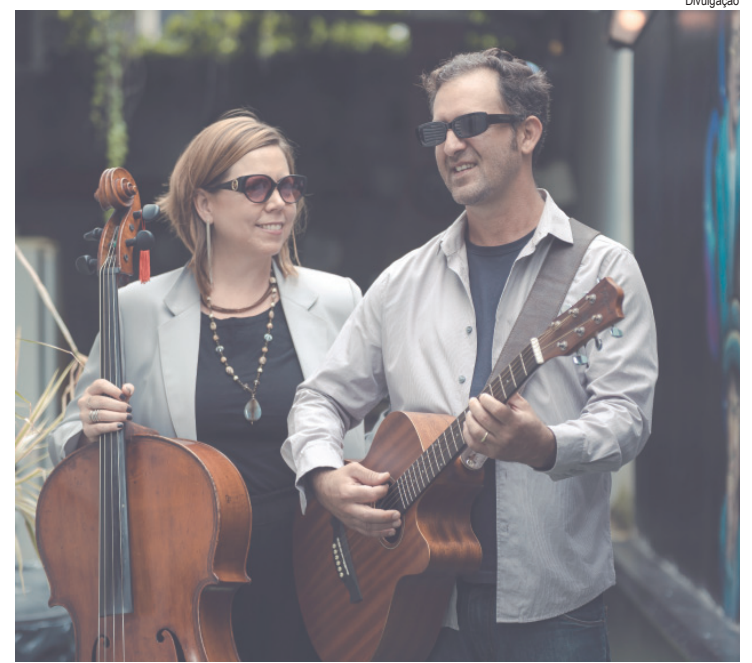
A união das vozes com violão e violoncelo define a identidade acústica do Duo MM

O concurso deste ano vai além de promover um senso de realização e motivação entre as crianças; reflete a campanha global "Next Starts Now", da Hyundai Motor, e seu compromisso em avançar rumo a um futuro melhor ao lado da próxima geração. Por meio da iniciativa, a marca demonstra que vozes jovens e visões criativas são vitais para construir um futuro melhor. Ela posiciona os jovens não como espectadores passivos, mas como contribuintes ativos que moldam o mundo que eles herdarão e liderarão amanhã.