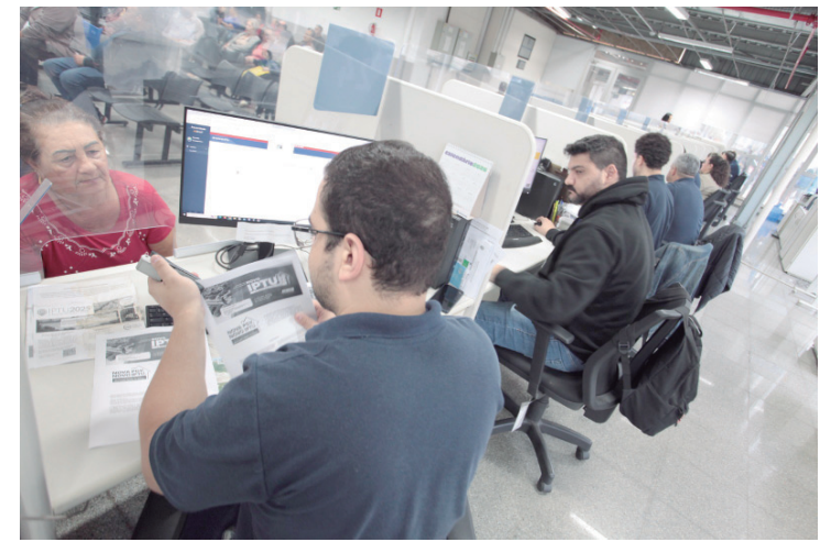
Atualização da Planta Genérica de Valores resultou em redução do valor do IPTU para cerca de 60% dos imóveis

trabalho com os documentos iconográficos não é uma tarefa fácil e, muitas vezes, a memória é a única ferramenta existente para identificação de fatos e pessoas", afirma. O Setor de Gestão de Documentação e Arquivo orienta que os cidadãos que reconheçam pessoas ou identifiquem possíveis inconsistências nos registros entrem em contato com o setor para contribuir com a atualização das informações do acervo.