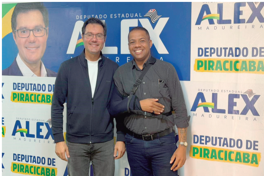
Recurso de R$ 500 mil foi conquistado através de emenda parlamentar do deputado Alex Madureira (PL)

"A educação precisa ser prioridade, e investir em estrutura é