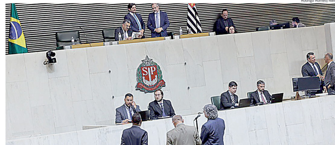
Projeto de lei do Executivo busca ampliar participação de estudantes em competições

Ainda de acordo com o texto, a estimativa de impacto orçamentário para a realização das Olimpíadas do Conhecimento é de R$ 206,6 milhões para os exercícios de 2026 a 2028. As despesas decorrentes da implantação do programa serão custeadas por meio do orçamento da Secretaria da Educação.