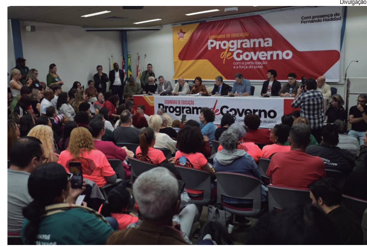
O debate para a área da educação foi realizado no auditório do Sindicato dos Engenheiros