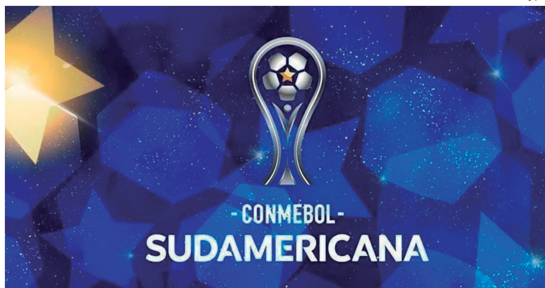
Santos quer voltar a ser grande na Copa Sul-americana

Precisando vencer e ainda torcer por uma combinação de