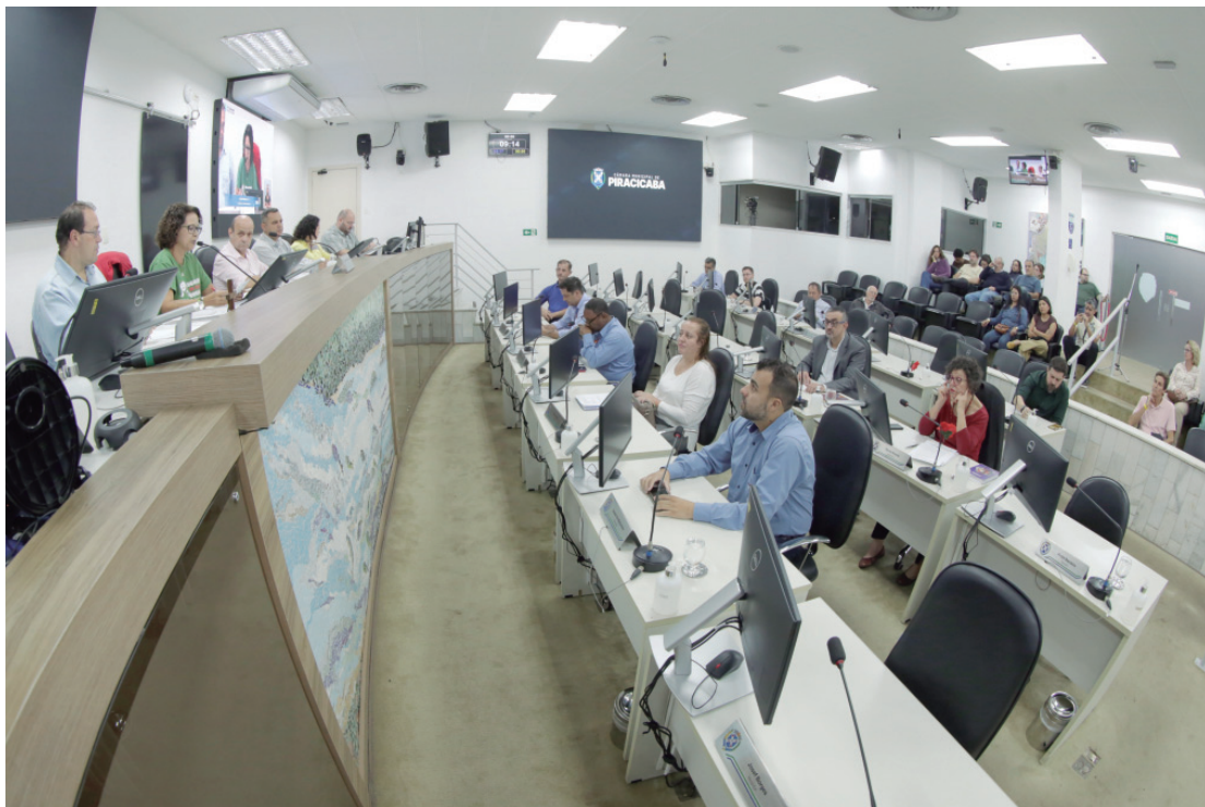
Audiência pública aconteceu na noite desta terça-feira (26)