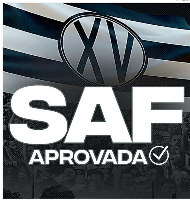
Mais um capítulo na história do XV de Piracicaba com a proposta de SAF aprovada

A SAF passou a ser vista por muitos clubes brasileiros como alternativa de profissionalização, fortalecimento financeiro e modernização estrutural. Porém, ao mesmo tempo, exige responsabilidade na condução do projeto e equilíbrio entre gestão empresarial e