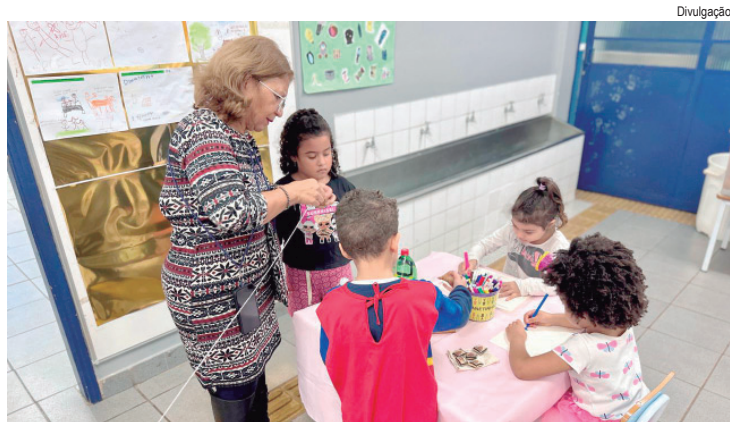
As atividades da programação foram desenvolvidas pela comunidade escolar