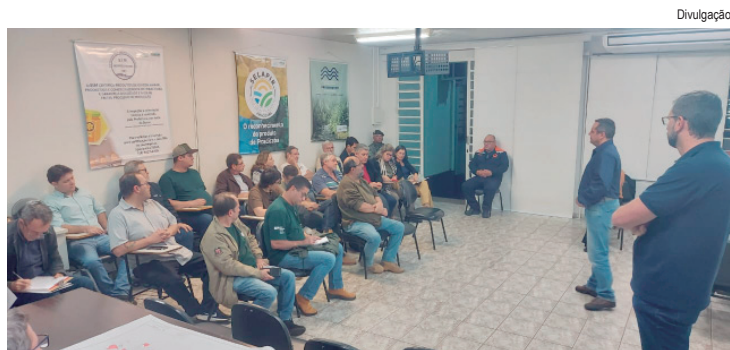
Encontro teve como foco a articulação de medidas voltadas à recuperação das áreas atingidas por incêndios e apoio aos proprietários rurais