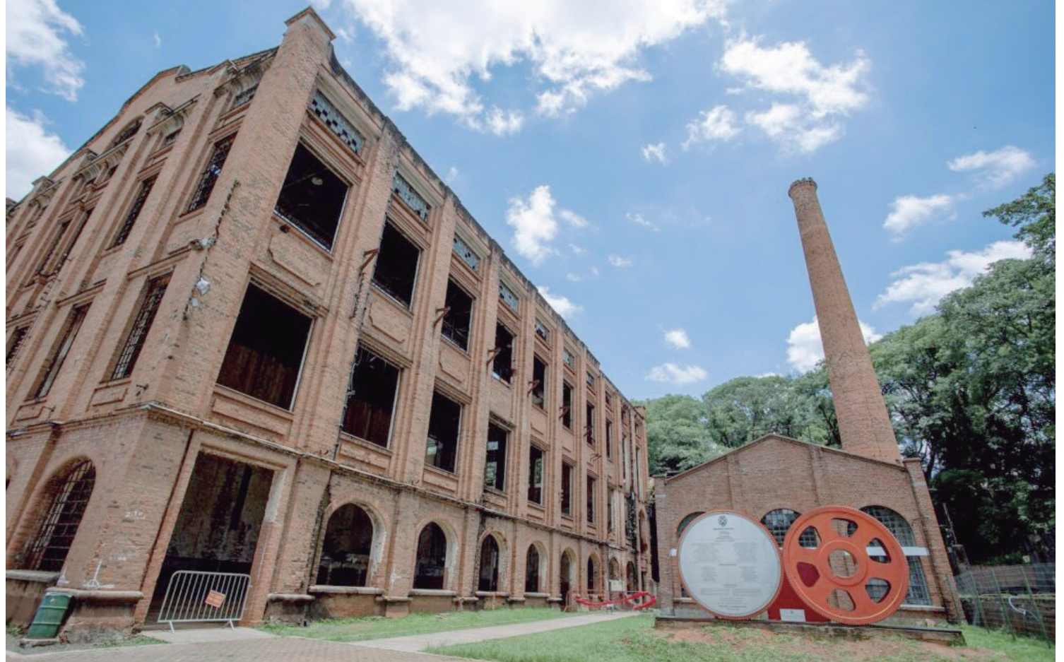
Passeio propõe uma conexão com a memória e a história de Piracicaba

ATENDIMENTO - VI O curioso é que ninguém é contra ajudar a população. O problema é quando a função do Legislativo começa a se confundir com a de balcão administrativo da Prefeitura. Se continuar nesse ritmo, em breve teremos vendedor anunciando atualização cadastral, parcelamento de dívida ativa e talvez até troca de lâmpada em poste com protocolo e carimbo. Isso não é bom.