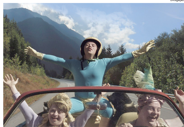
Filme convida o público a refletir sobre amizade, liberdade, sonhos e inclusão

A vereadora também defendeu a ampliação das áreas de plantio de árvores e a aprovação de projeto de lei, de sua autoria, que lança as bases para "infraestruturas verdes e soluções baseadas na natureza". "É um projeto que pensa em parques lineares, microflorestas, jardins de chuva. Não é implantado de uma hora para a outra, mas já ficam as diretrizes", explicou a parlamentar, que defendeu que a arborização seja tratada como política pública permanente. "Árvore não dá voto, mas precisamos deixar um legado para as futuras gerações", concluiu a vereadora.