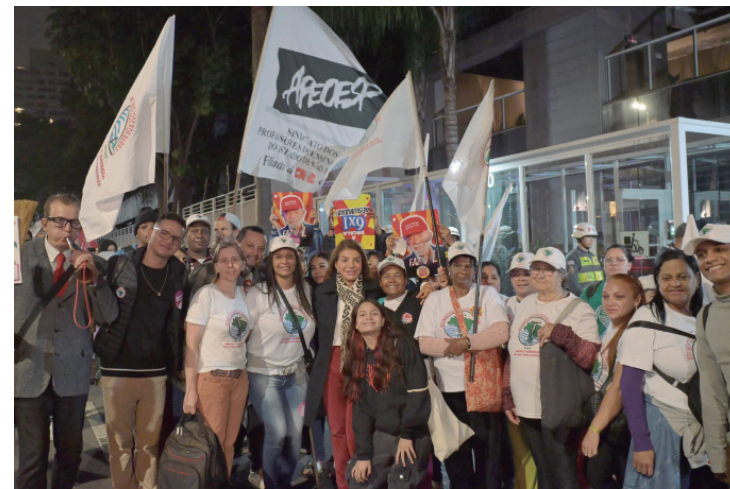
A deputada Professora Bebel com manifestantes no ato público na avenida Paulista, em São Paulo