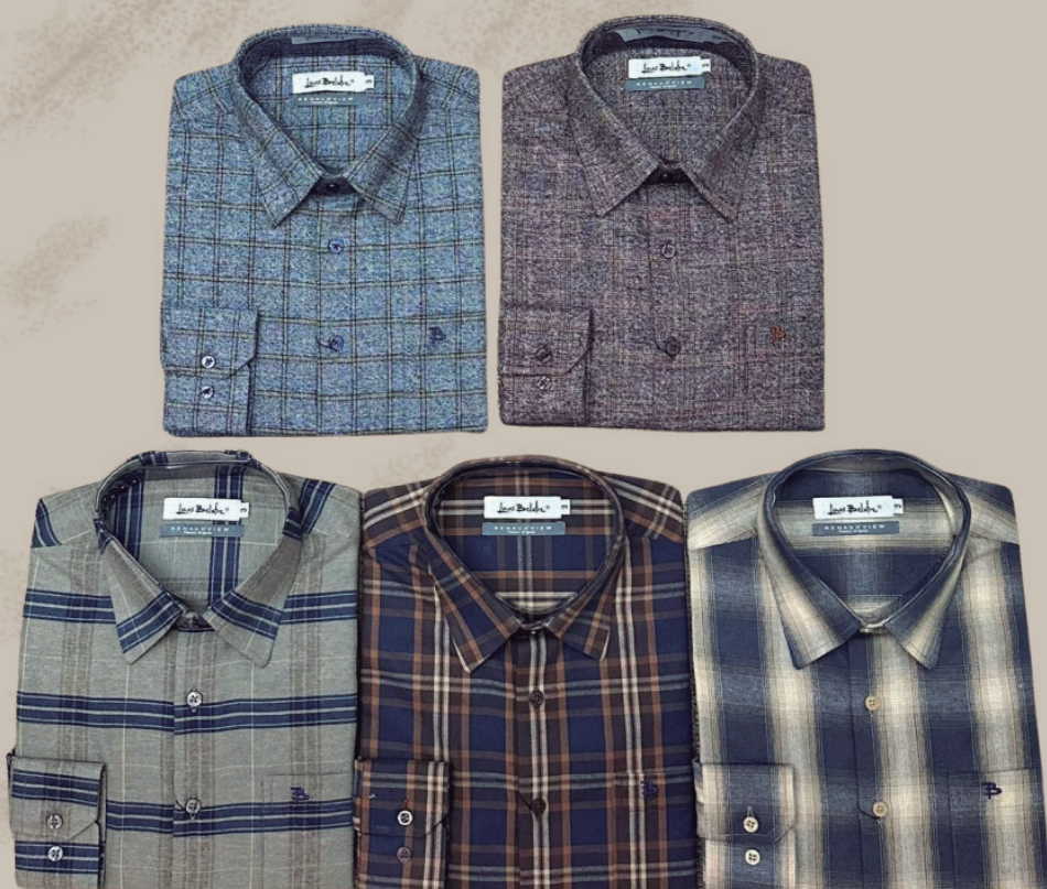
CAMISA FLANELA MANGA LONGA R$ 299,90