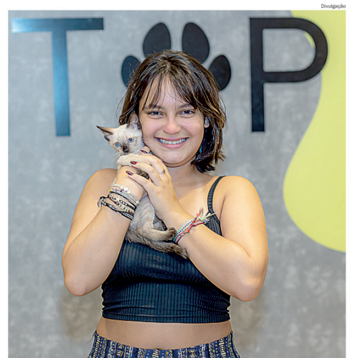
Ação incentiva a adoção responsável de cães e gatos resgatados e promove conscientização sobre bem-estar animal

Além da adoção, a iniciativa também oferecerá suporte e informações aos futuros tutores. Os animais adotados receberão bandanas e kits com itens básicos, como ração e potinhos. A equipe do Hospital Veterinário