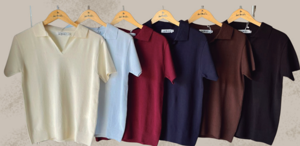
BLUSA POLO TRICOT R$ 199,90