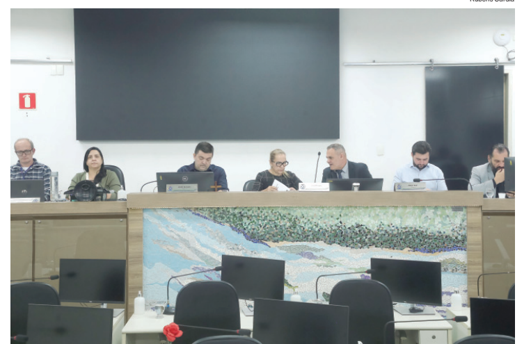
Audiência pública aconteceu na tarde desta terça-feira (26)

Emerson afirmou ainda que o Semae vem adotando política de austeridade financeira. "Tendo recursos, estamos investindo; não tendo, estamos buscando executar de outras maneiras", declarou. Ele explicou que as despesas também ficaram abaixo do previsto, acompanhando a redução das receitas. A audiência também discutiu a parceria