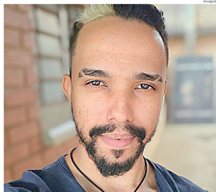
Ação incentiva a adoção responsável de cães e gatos resgatados e promove conscientização sobre bem-estar animal

Com classificação indicativa de 16 anos, Os Designios do Artífice reúne elementos de horror cósmico, crítica social e narrativa cinematográfica, além de dialogar com o universo dos jogos de RPG. A obra também destaca o protagonismo negro e propõe discussões sobre os impactos da violência