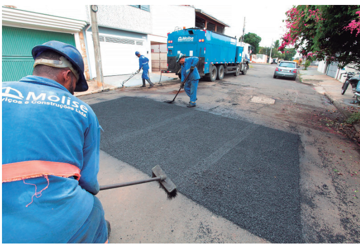
Equipe em execução do serviço de requadramento ao redor do buraco na rua Athaulpa Vaz de Mello