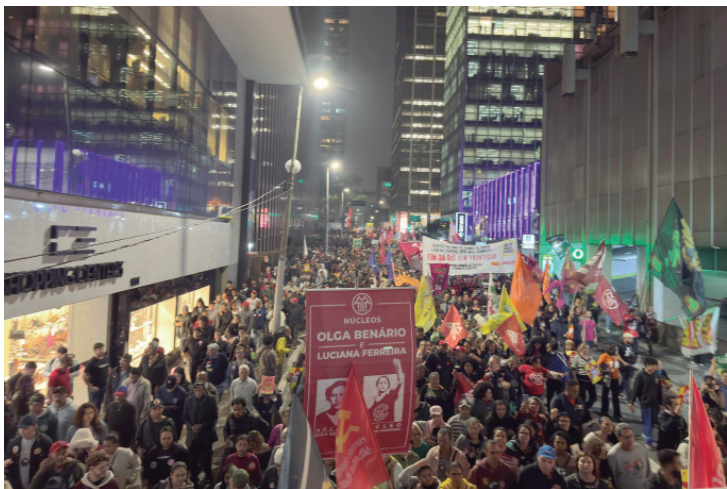
A manifestação reuniu milhares de pessoas na avenida Paulista, em plena segunda-feira