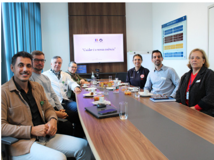
Encontro reuniu gestão municipal da Saúde, diretoria do HRP-Unicamp, gerências hospitalares e coordenação da UTI

O encontro reforçou o compromisso conjunto entre hospital, município e instituição de ensino na construção de soluções regionais, com foco em uma saúde pública mais integrada, resolutiva e humanizada.