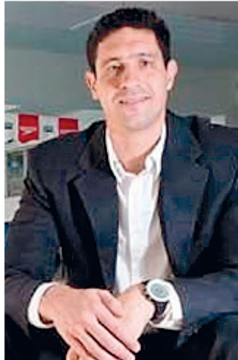
O medalhista olímpico Gustavo Borges abordará motivação, concorrência e trabalho em equipe em sua participação no 20º Congresso Empresarial da Acipi

A tecnologia como ponte das relações humanas. Nunca como substituta. É com essa proposta que o 20º Congresso Empresarial da Acipi (Associação Comercial e Industrial de Piracicaba) apresenta, na próxima terça-feira (2), das 16 às 23 horas, no Teatro Municipal Dr. Losso Netto, uma ativação inédita baseada em inteligência artificial, pensada para transformar a forma como os participantes se conectam antes, durante e após o evento.