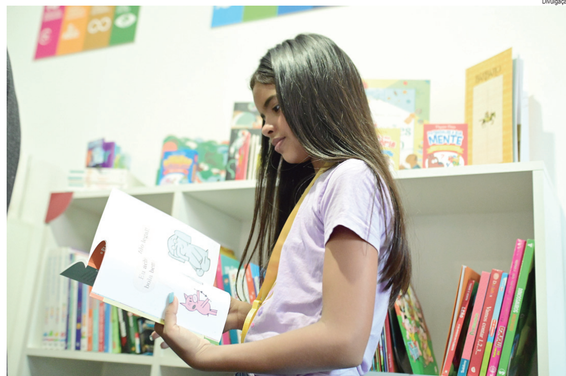
Chegada dos projetos vai beneficiar cerca de 880 estudantes

"O projeto Laboratório de Leitura e CTC nas Escolas vem ao encontro da nossa proposta de valorização dos espaços educativos e de incentivo à leitura. Com um ambiente moderno e acolhedor, acreditamos que nossos alunos se sentirão mais motivados a frequentar o espaço. Um grande diferencial é a doação de livros para diferentes faixas etárias, incluindo obras específicas para os cursos técnicos em Agronegócio, Enfermagem