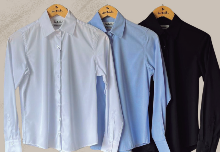
CAMISA FEMININA FIBRA DE BAMBU R$ 279,90

*CONSULTE VALORES DOS TAMANHOS ESPECIAIS