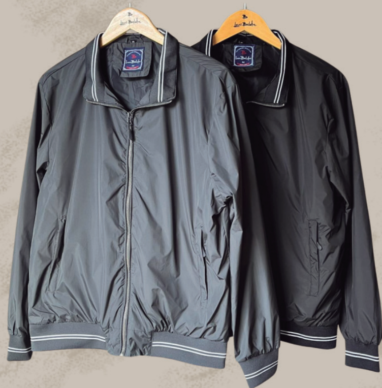
JAQUETA MASCULINA CORTA VENTO R$ 499,90