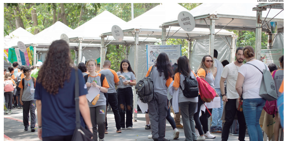
Evento com visitação gratuita acontecerá nos próximos dias 29 e 30 de maio, na USP em Piracicaba

"A expectativa é muito positiva. Conseguimos mobilizar mais de 200 pessoas da própria Esalq entre professores, funcionários, alunos e voluntários, todos envolvidos para receber o público da melhor forma possível. O evento é resultado de um trabalho muito grande de orga-