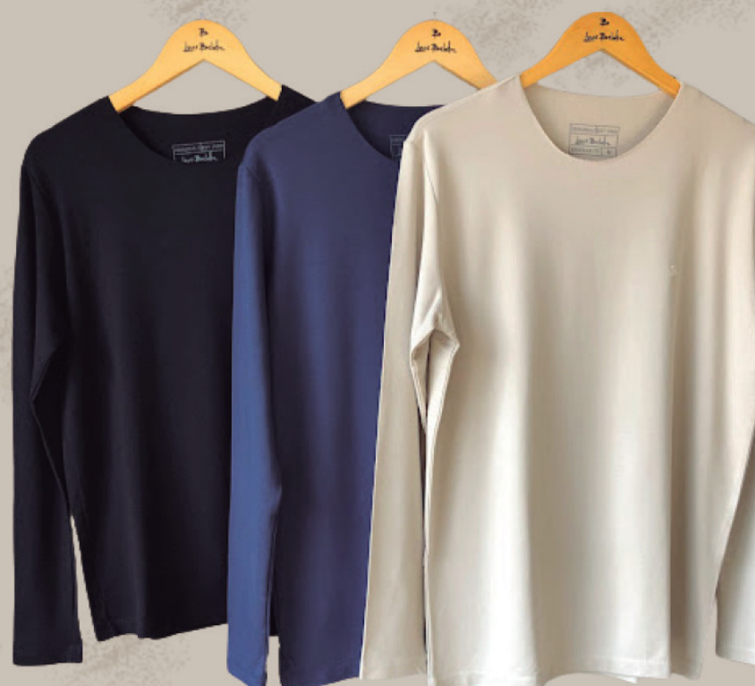
BLUSA MASCULINA MOLETINHO R$ 199,90