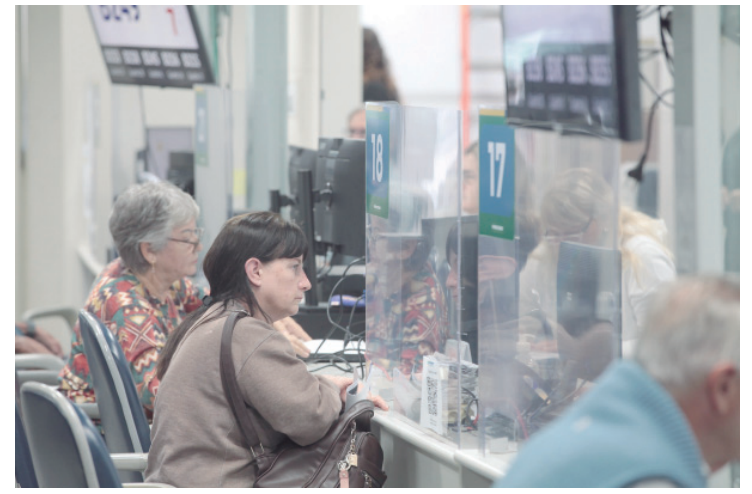
A prefeitura estendeu o horário de atendimento até sexta-feira, das 8 às 18 horas

Laboratório de Leitura - O projeto estreou em duas escolas de Piracicaba em 2025, reconhecendo o potencial da escola como espaço de produção artística e cultural e de educação ambiental e científica. A iniciativa propõe a criação de espaços lúdicos e agradáveis de educação e socialização em escolas públicas, que incluem laboratório de ciências, sala de leitura e acesso a um acervo variado de livros como estímulo ao conhecimento e à pesquisa.