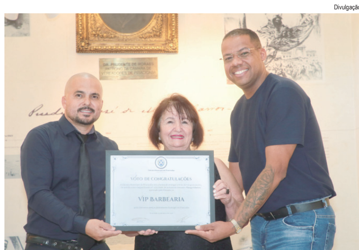
VIP Barbearia recebeu homenagem pelos relevantes serviços prestados