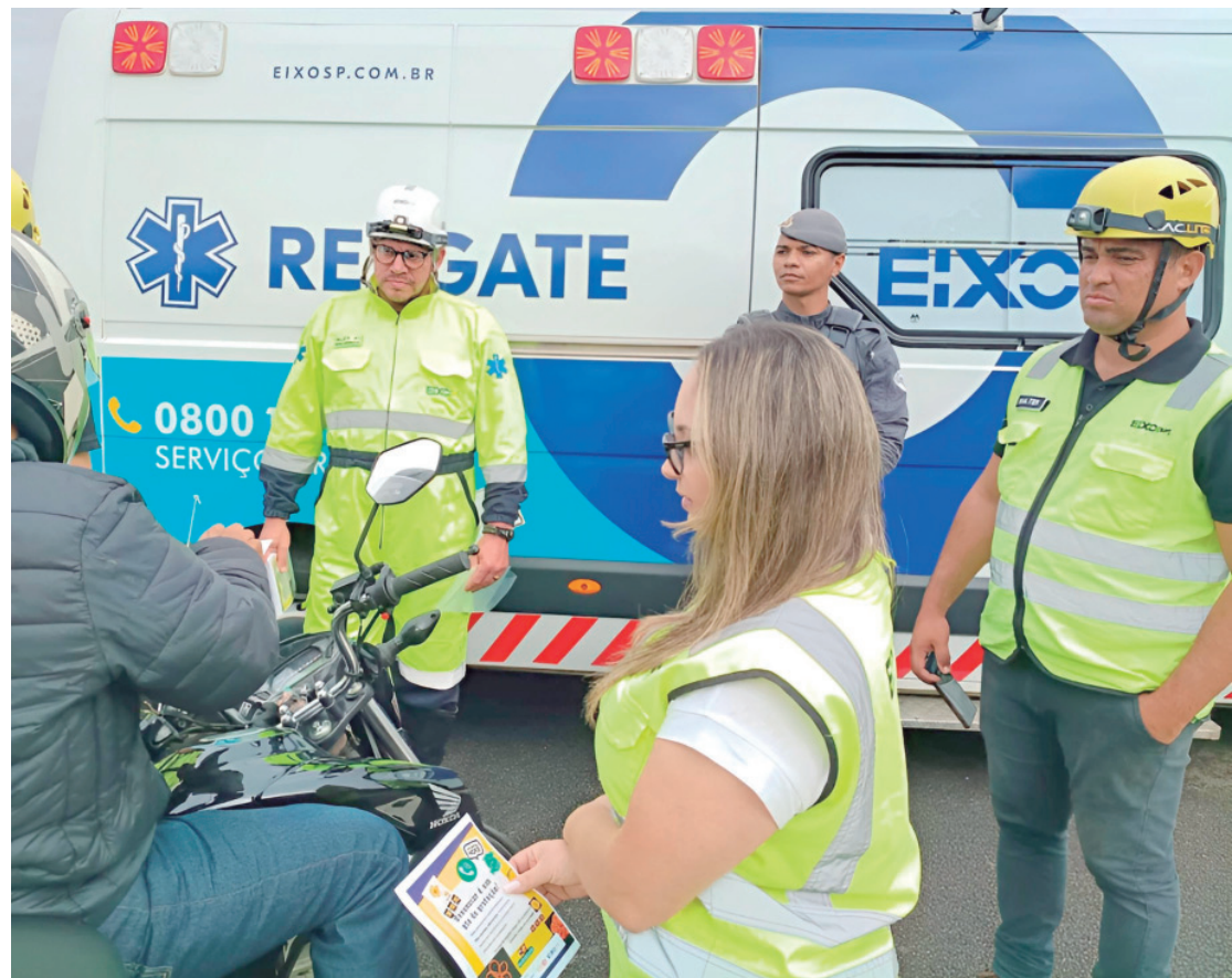
Concessionária une-se à iniciativa para prevenir e enfrentar a violência sexual infantojuvenil

Entre as ações previstas estão campanhas contínuas de prevenção e conscientiza-