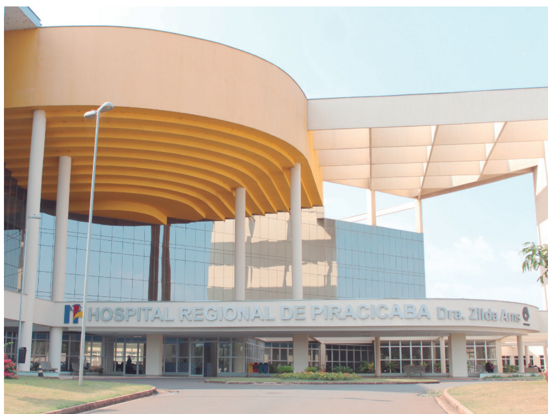
Hospital Regional é referência para 26 municípios da macrorregião de Piracicaba

A premiação é realizada em parceria com entidades de referência na área da saúde pública,