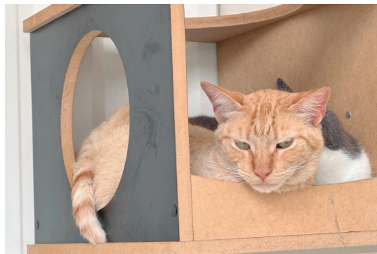
As inscrições já estão abertas e cada CPF pode registrar até três animais

"A gente aprende muito sobre humildade, sobre respeito, sobre ter compreensão e empatia pelo próximo. É isso que vivemos diariamente dentro dos quartéis, desenvolvendo amizades, cada um com as suas capacidades, o que contribui para formar o nosso espírito de corpo, a nossa coesão, e nós precisamos estar unidos para defender o nosso país de qualquer ameaça. Muito obrigado", concluiu.