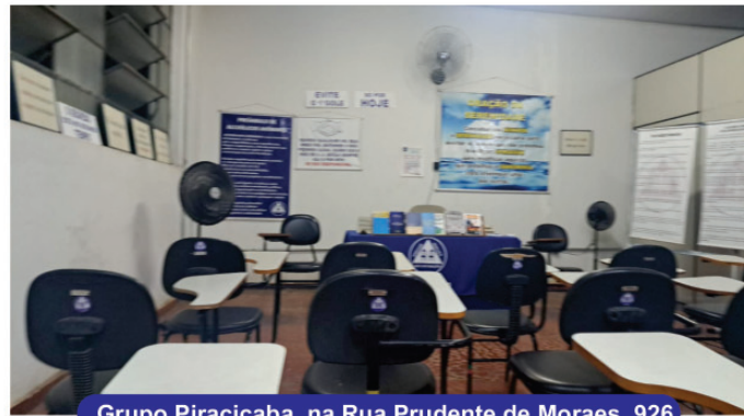
Grupo Piracicaba, na Rua Prudente de Moraes, 926

Vamos estar publicando fotos das salas de A.A. do 4.º Distrito, pois muitos não conhecem e não tiveram oportunidade de conhecer, mas são salas simples, como é o A.A., sem nenhuma ostentação, onde você pode se sentir a vontade, venha conhecer e tomar um cafezinho conosco. O Grupo Piracicaba tem suas reuniões às quartas e sextas feiras, às 20 horas e aos domingos às 9 horas. Os grupos que quiserem que seja publicada a sua sala, nos envie a foto.