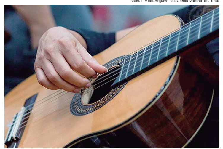
A iniciativa visa estimular aspectos técnicos e artísticos relacionados à prática do violão

time responsável por mais de 40 mercados nas Américas Central e do Sul, coordenando soluções em veículos com foco na melhor performance e eficiência. Esta equipe também tem a missão de definir o portfólio de modelos mais apropriado em cada país conforme as preferências dos clientes, rentabilidade das operações e estratégia de longo prazo para o futuro da mobilidade, o que incluiu conectividade veicular, eletrificação e uso de hidrogênio.