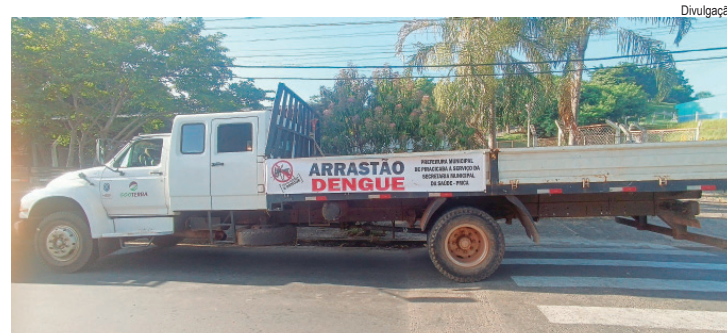
Principal objetivo do arrastão é recolher potenciais criadouros

VACINA - A vacina contra dengue segue disponível na rede municipal de saúde para grupos especí-