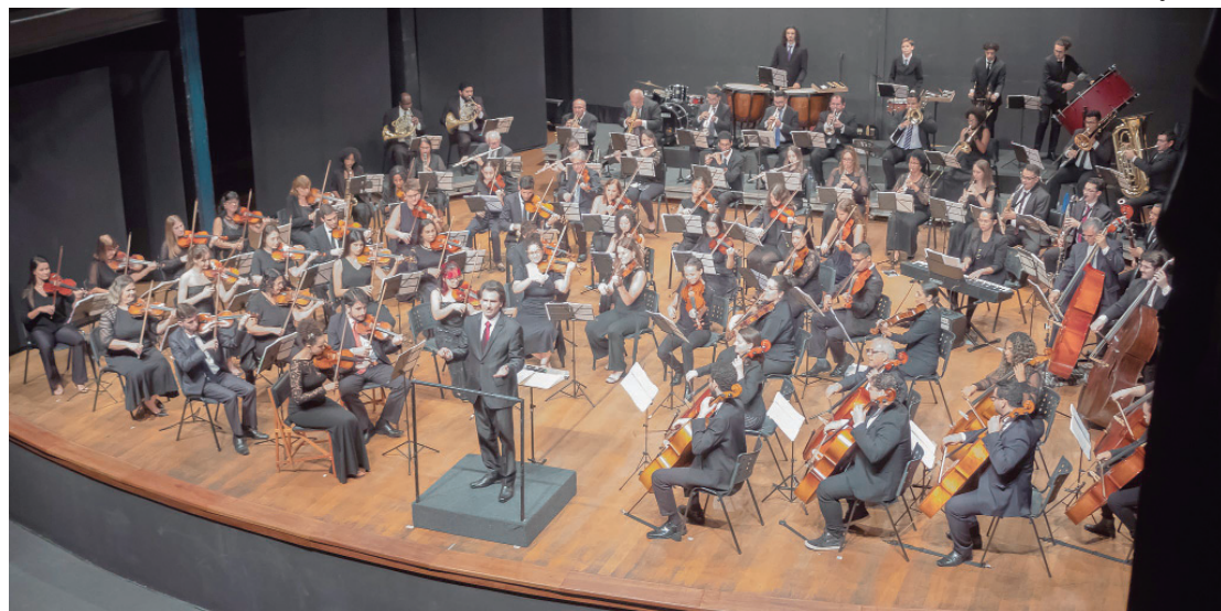
OEP faz concertos com trilhas sonoras de filmes no Teatro Municipal

FOMENTO E REALIZAÇÃO - Este concerto conta com fomento da Lei Rouanet e patrocínio da Cerâmica Villages, Turbimaq Turbinas e Máquinas e Samapi Distribuidora de Produtos Farmacêuticos. A iniciativa tem apoio da Prefeitura de Piraci-