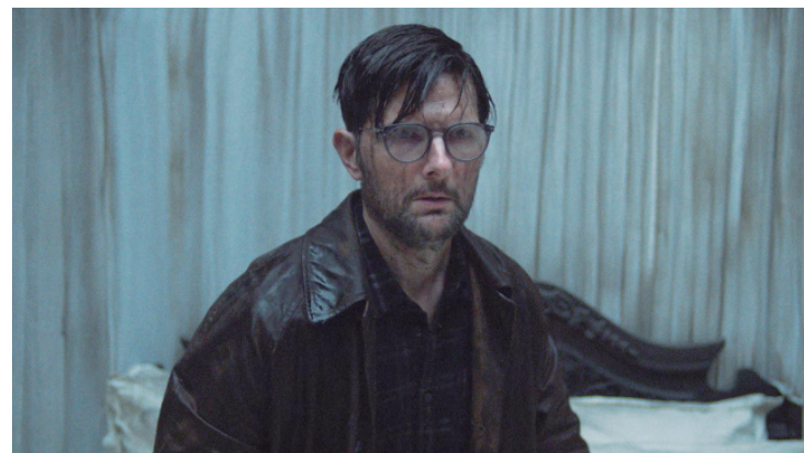
No terror Hokum - O Pesadelo da Bruxa, Adam Scott cruza com forças malignas numa casa assombrada por antiga bruxa

sita uma estalagem irlandesa para espalhar as cinzas de seus pais, sem saber que o local é considerado assombrado por uma antiga bruxa. Nos Estados Unidos o público