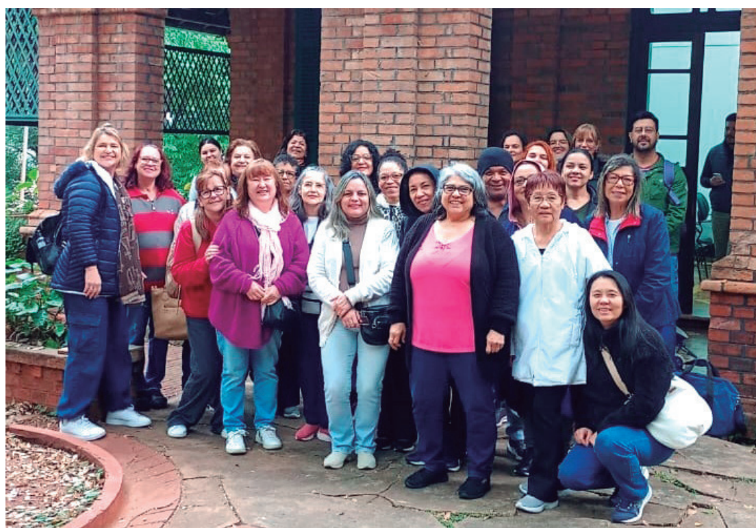
Artesãos aproveitaram transporte fornecido pela Secretaria de Turismo

O transporte oferecido sairá às 8h do estacionamento da sede da Pasta, no Engenho Central, com retorno previsto para as 16h e chegada a Piracicaba estimada para as 18h. Os ingressos para acesso à feira devem ser adquiridos pelos participantes diretamente no site oficial do evento