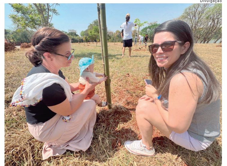
Famílias são convidadas para nova edição do Plante Vida

O Anuário da Cerveja 2026 reúne dados sobre registros, produção, comércio exterior e emprego e funciona como referência estatística do setor no país.