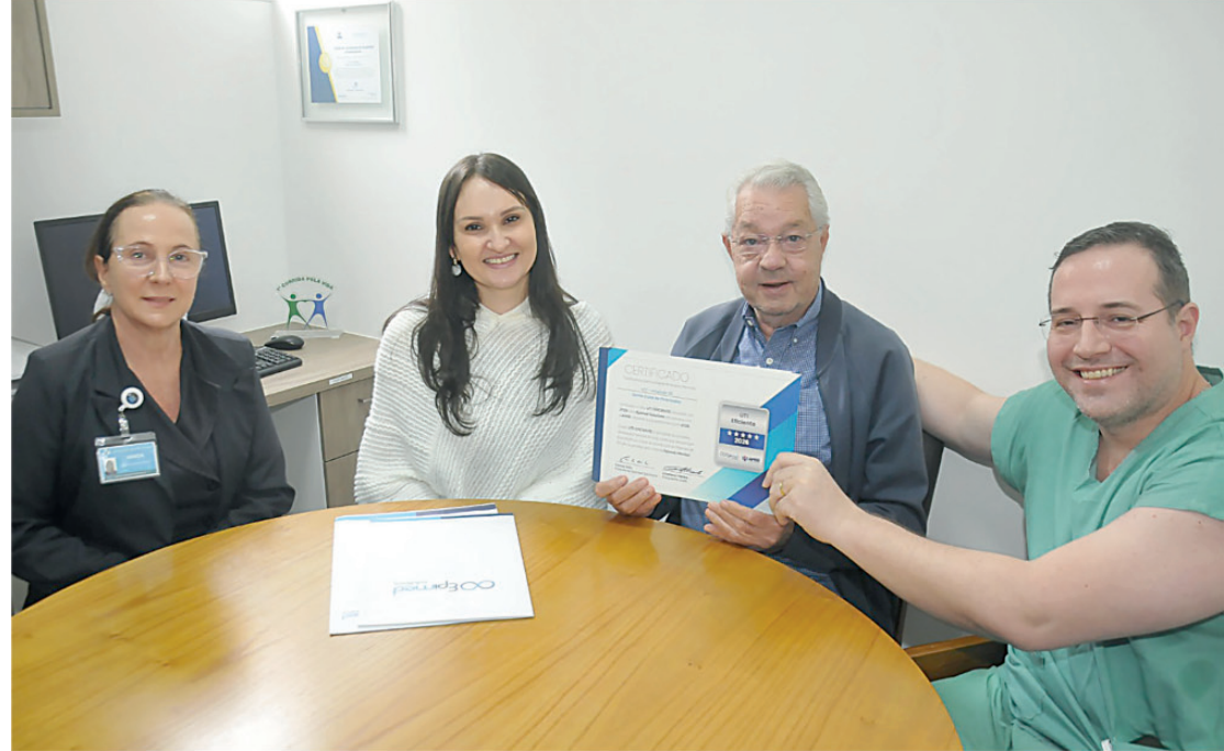
Reconhecimento ao trabalho de todas equipes da Santa Casa de Misericórdia de Piracicaba

Enquanto a ‘Lei Daniel Vorcaro’ funciona a base de negociação feita com dinheiro de um banco construído a partir de um esquema fraudulento que envolve o investimento de fundos de pensão de Estados e municípios brasileiros, a maioria