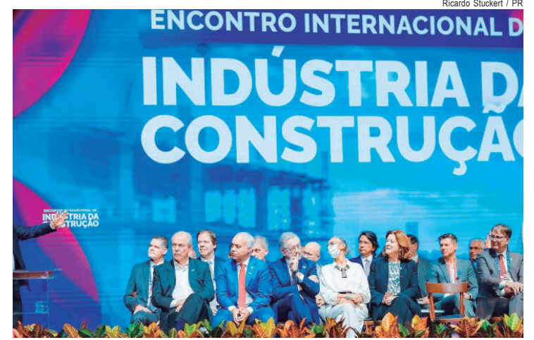
Evento voltado ao setor da construção civil reuniu governo e empresários em São Paulo