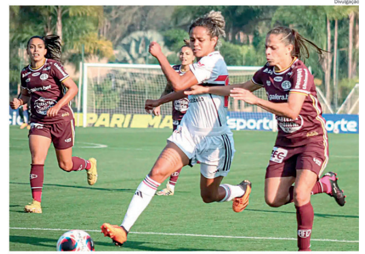
Atletas de São Paulo e Ferroviária em ação pelo brasileiro sub-20

GRUPO 2 - 1ª rodada - 19/07 (domingo) - 16h - União São João x XV de Piracicaba - Araras; 2ª rodada - 26/07 (domingo) - 16h - XV de Piracicaba x Comercial - Piracicaba; 3ª rodada - 02/08 (domingo) - 16h - XV de Piracicaba x Noroeste - Piracicaba; 4ª rodada - 09/08 (domingo) - 16h - Noroeste x XV de Piracicaba - Bauru; 5ª rodada - 16/08 (domingo) - 16h - Comercial x XV de Piracicaba - Ribeirão Preto; 6ª rodada - 22/08 (sábado) - 15h - XV de Piracicaba x União São João - Piracicaba. As datas e os horários exatos ainda serão confirmados pela Federação Paulista de Futebol.