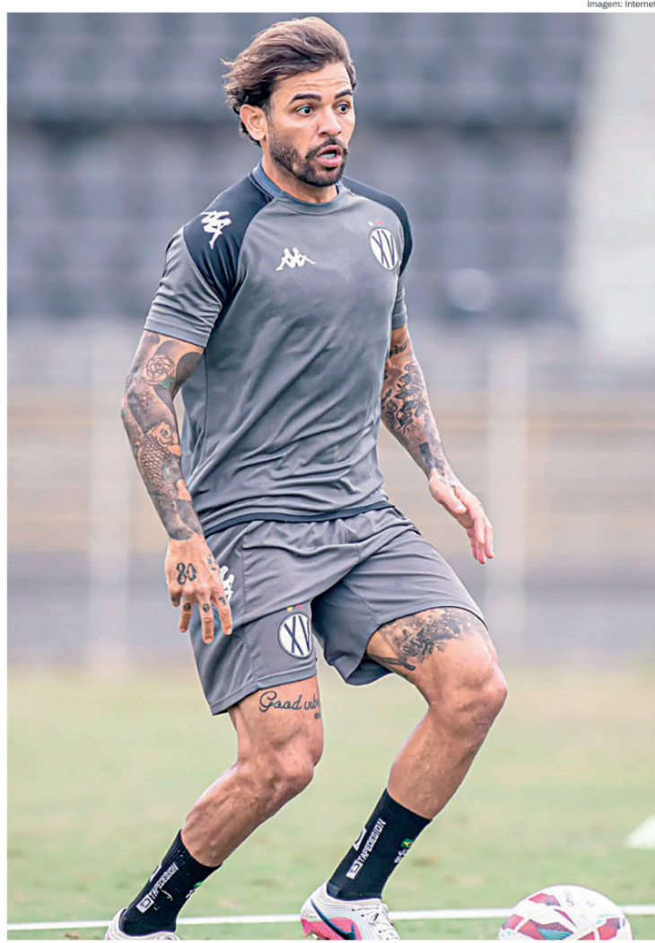
Elenco do Nhô-Quim já se prepara para a disputa das duas competições e aumento das partidas

A divisão ocorreu de forma igualitária na primeira fase, ou seja, com quatro integrantes em cada grupo, e de forma regionalizada. O grupo 1 conta com Bandeirante de Birigui, Linense, Grêmio Prudente e Marília. No gru-