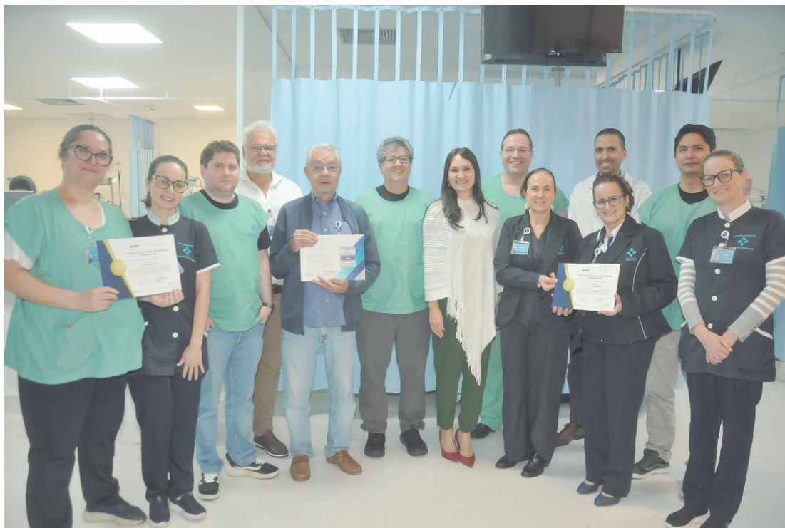
Cerimônia de entrega do Certificado reuniu dirigentes do Hospital, médicos, enfermeiros e equipes de apoio assistencial