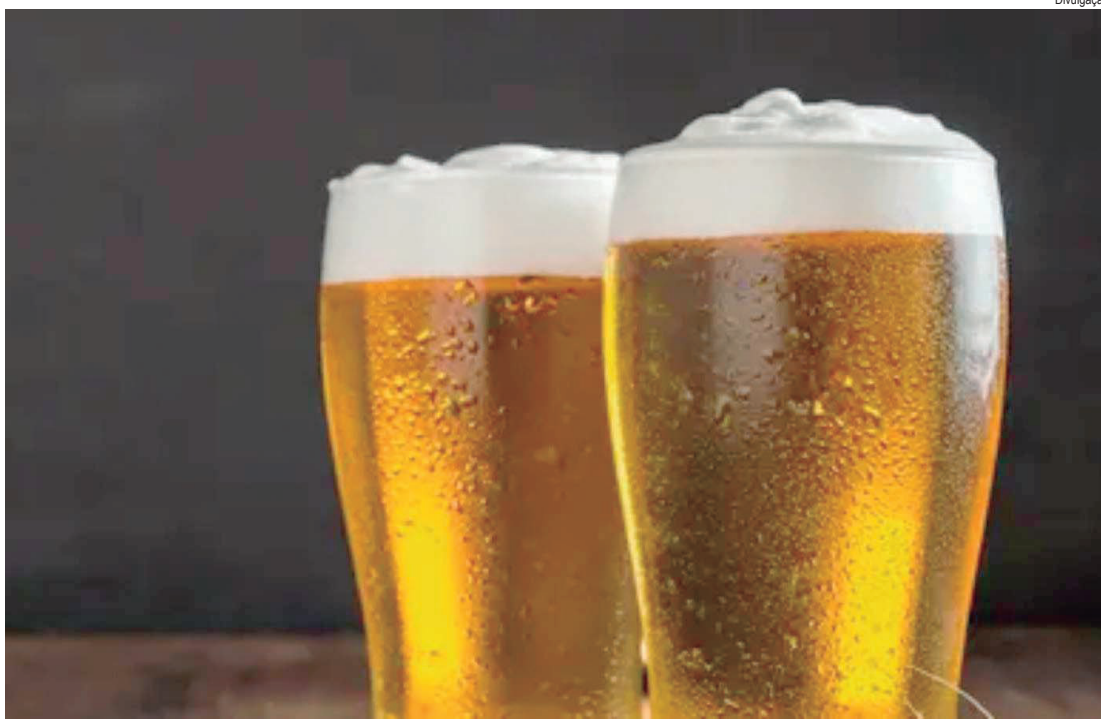
País alcançou recorde no valor das exportações do setor