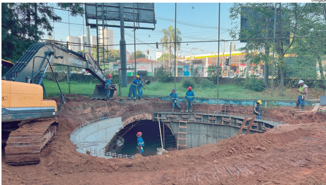
Também está sendo construído poço de deflexão, com nove metros de diâmetro, que servirá como conexão

Outro ponto importante da obra foi a construção de um poço de deflexão com nove metros de diâmetro, responsável pela conexão entre a nova galeria e a parte anti-