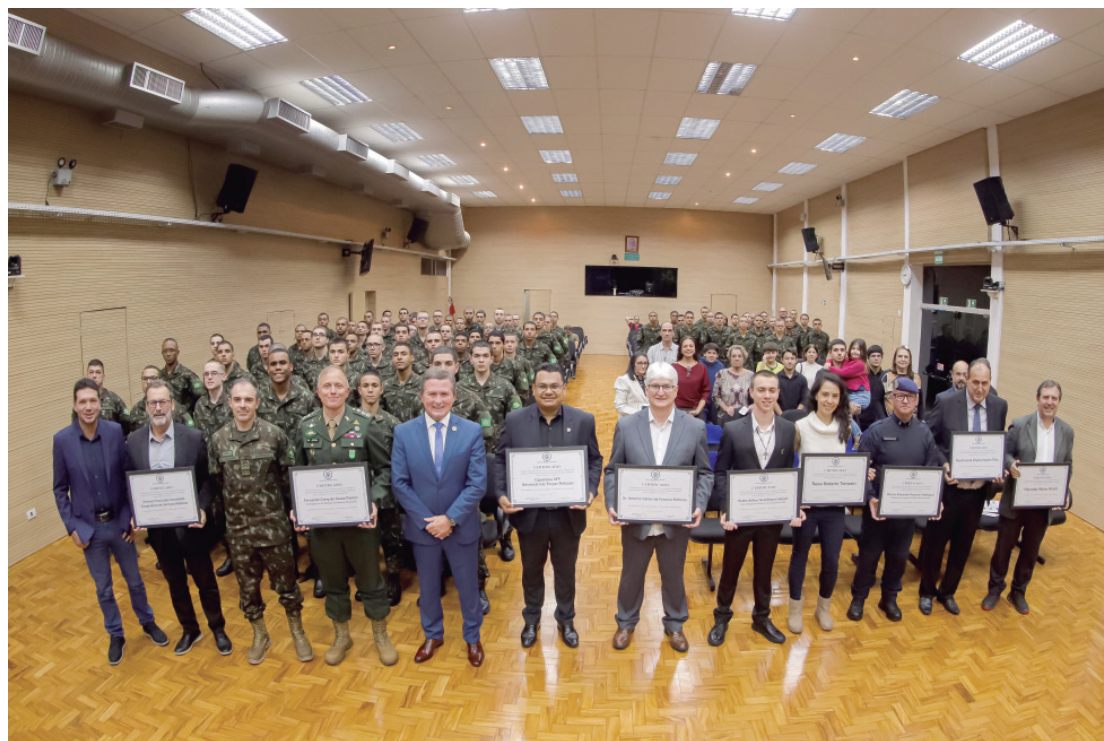
Solenidade aconteceu na noite de quarta-feira (20), no Salão Nobre da Câmara

O tenente-coronel destacou a importância do Tiro de Guerra de Piracicaba (TG) na formação de reservistas que, em uma situação de crise, podem ser convocados para defender o Brasil. Ele também