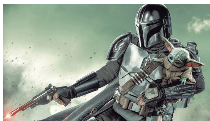
A icônica dupla Din Djarin e seu pupilo Grogu deixam as telinhas da TV para estrear sua própria aventura em O Mandaloriano e Grogu

"HOKUM - O PESADELO DA BRUXA" (Hokum -- Irlanda/Estados Unidos, 2025) é um filme de terror e suspense perturbador e cheio de ação, escrito e dirigido pelo irlandês Damian McCarthy. Na trama, um escritor amargurado (interpretado por Adam Scott) vi-