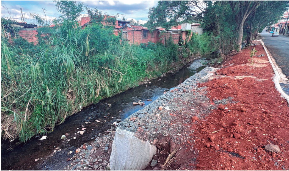
Muro de gabião evita o avanço da erosão às margens do córrego do Enxofre