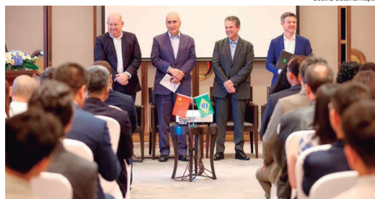
A missão teve início no último domingo, 17, em Xangai