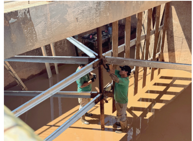
Semae conclui manutenção na ETA Capim Fino e amplia eficiência no tratamento de água

Diante de tantas responsabilidades, a valorização do papel do pedagogo e o investimento na formação contínua desses profissionais deixa de ser um diferencial e passa a ser uma necessidade. "O pedagogo é peça-chave para a construção de uma educação de qualidade. Reconhecer sua importância, oferecer condições adequadas de trabalho e investir em desenvolvimento profissional são passos essenciais para assegurar a transformação da educação, contribuindo para a formação de indivíduos mais críticos, conscientes e preparados para o futuro", finaliza Lívia.