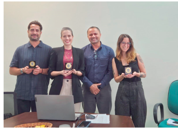
Encontro aconteceu em BH e reuniu representantes de 14 corporações de diferentes municípios do país

o Executivo possui registros formais de reclamações sobre vandalismo, uso de drogas e práticas inadequadas no local; se o Parque possui monitoramento por câmeras ou existe estudo ou proposta para implantação de câmeras de monitoramento ou outras medidas de segurança; como é feita a fiscalização de atos de vandalismo e depreciação do espaço; se existe uma comissão comunitária para acompanhar a gestão do Parque; e se Poder Executivo tem planejamento para a reforma geral do espaço.