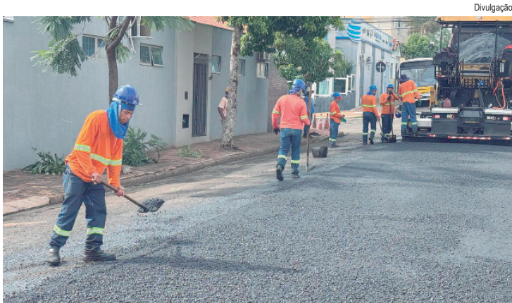
A rua Cristiano Cleopath entrou em uma nova etapa das obras de recuperação viária com o início da aplicação da nova massa asfáltica