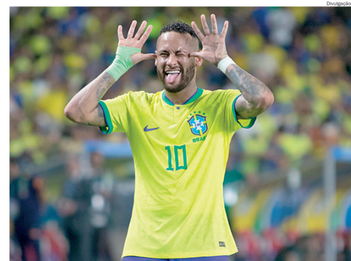
Neymar em sua 4ª Copa do Mundo ainda será o protagonista

vermelho recebido na sexta rodada), haverá: Nova Iguaçu x Noroeste, às 17h, no Estádio Jânio Moraes; e Sampaio Corrêa x Maricá, às 19h, no Estádio Lourival Gomes de Almeida, em Saquarema. O plantel do Alvinegro Piracicabano volta a treinar nesta terça-feira, em dois períodos.