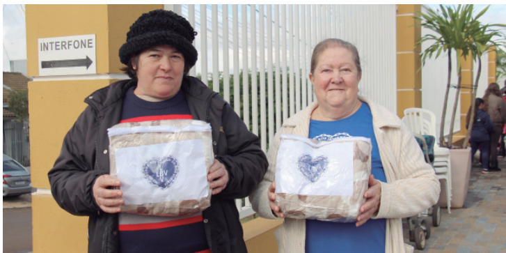
Campanha da LBV: Diga SIM!