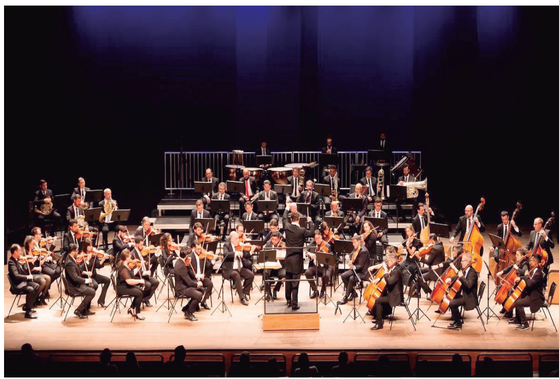
Programa se inicia com a Abertura em Dó maior, de Fanny Mendelssohn, obra que evidencia contribuição da compositora para o repertório sinfônico do século XIX

PROGRAMAÇÃO - O programa se inicia com a