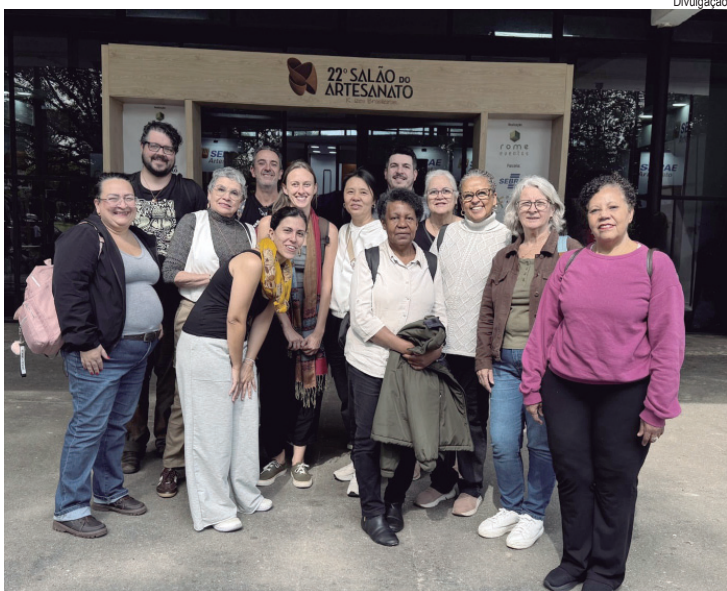
Artesãos de Piracicaba foram ao evento na capital paulista com transporte fornecido pela Secretaria de Turismo