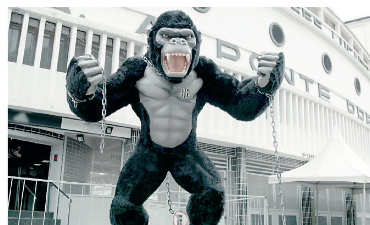
Ponte Preta vive momento delicado na série B do brasileiro. Jogadores protestam por melhores condições

Agora, a responsabilidade passa a ser compartilhada. Diretoria, comissão técnica e atletas precisarão encontrar rapidamente um caminho para reconstruir o clima interno e devolver competitividade à equipe. Porque no futebol, resultados ruins machucam. Mas quando eles começam a contaminar o ambiente, a crise normalmente se torna muito maior do que apenas um placar.