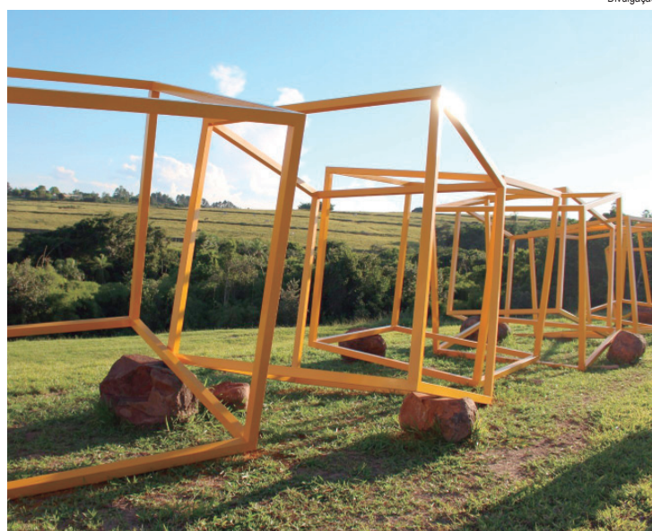
O Aramat, um Parque Cultural de Arte e Natureza, tem inauguração prevista para o próximo dia 30 de maio