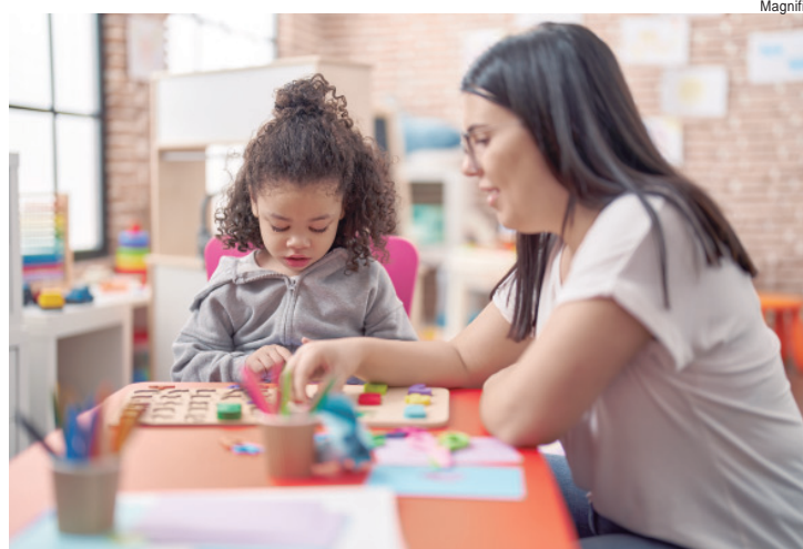
Mudanças no perfil dos alunos ampliam a atuação dos pedagogos dentro e fora da sala de aula

"Além do desempenho acadêmico, o trabalho pedagógico