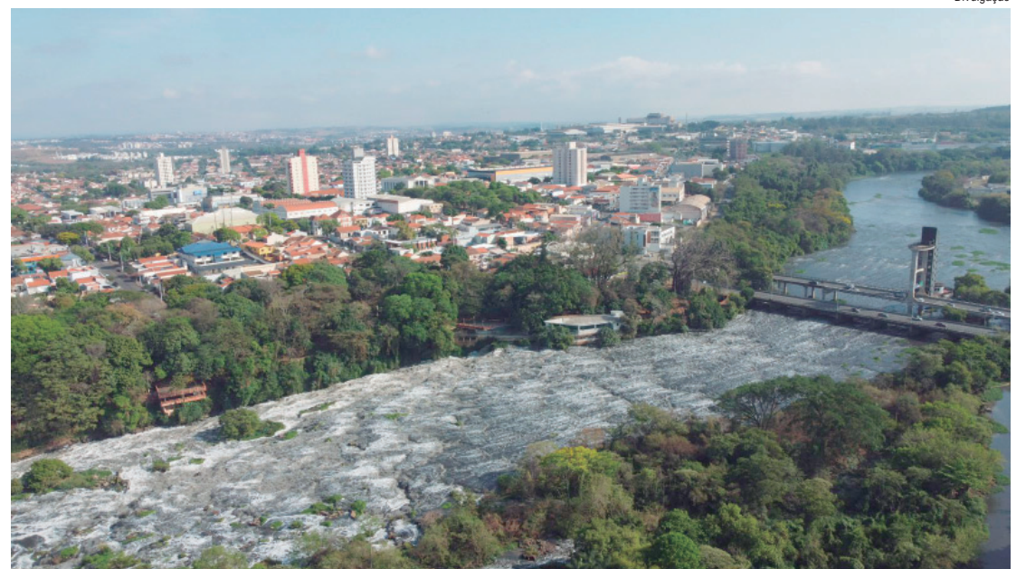
A primeira parcela e a cota única vencem no dia 29 de maio

Além da redução para parte dos imóveis, o novo modelo amplia os benefícios para quem mantém os tributos em dia. O contribuinte poderá obter até 15% de desconto no