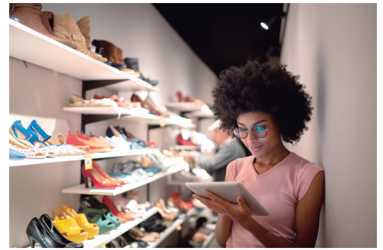
Programa é realizado pelo Sebrae-SP, com apoio do Senac e Sincomércio Piracicaba