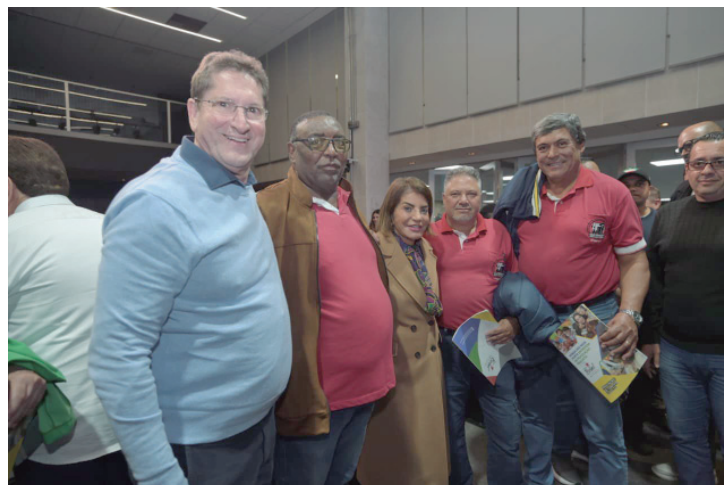
Auditório Franco Montoro ficou lotado por defensores da tarifa zero