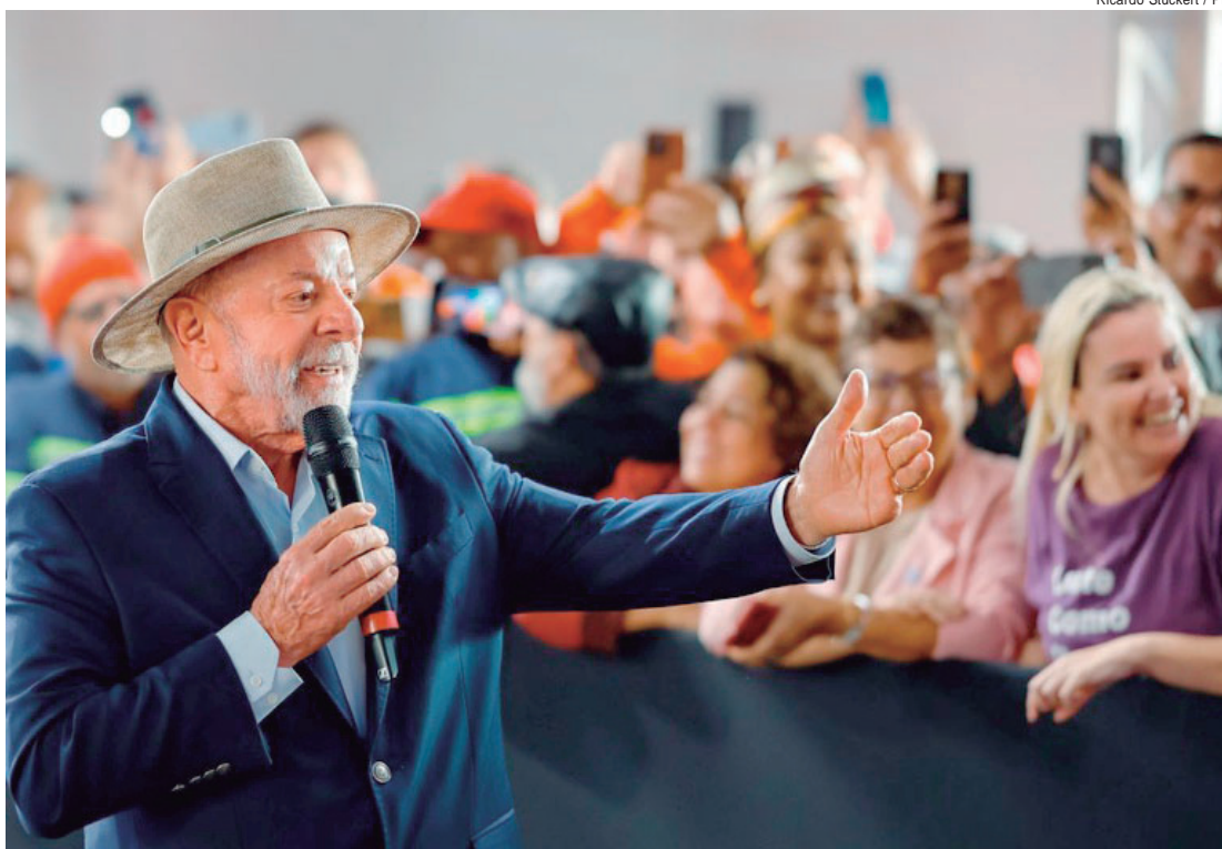
Com os investimentos, cerca de 38 mil postos de trabalho diretos e indiretos serão gerados pela iniciativa

INVESTIMENTOS EM SÃO PAULO - valor a ser investido fortalece a posição da Petrobras no estado, com destaque para projetos inovadores em refino, biorrefino, E&P, descarbonização e geração de energia sustentável. Parte do investimento (R$ 6 bilhões) será aplicada na refinaria, a maior da Petrobras, responsável pelo abastecimento de mais de 30% do território brasileiro. Por seu fa-