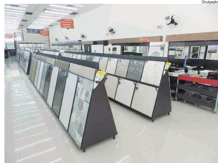
Ação reforça orientações para garantir transparência e respeito aos direitos do consumidor

Transmissão ao vivo - As reuniões ordinárias são transmitidas ao vivo pela TV Câmara (sintonizada nos canais 11.3 em sinal aberto digital, 4 da Claro/Net e 9 da Vivo Fibra), no site camarapiracicaba.sp.gov.br/TV e nos perfis no Facebook e no YouTube. As sessões camarárias são também transmitidas, a partir das 20 horas, pela Rádio Educativa 105,9 FM.