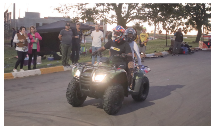
A entrada para o evento é gratuita

para apresentações de motos, carros, quadriciclos e outros veículos em manobras de tirar o fôlego e emocionar os espectadores. A copa este ano leva o nome de Lurrique Ferrari, piloto que faleceu em um trágico acidente durante uma apresentação no parque Beto Carrero World. A entrada do evento é gratuita.