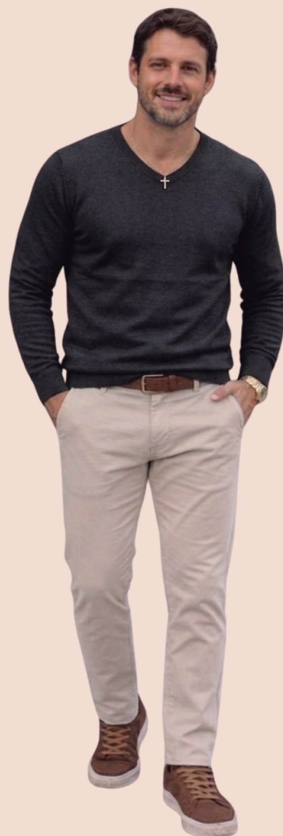
CALÇA DE SARJA R$ 299,90