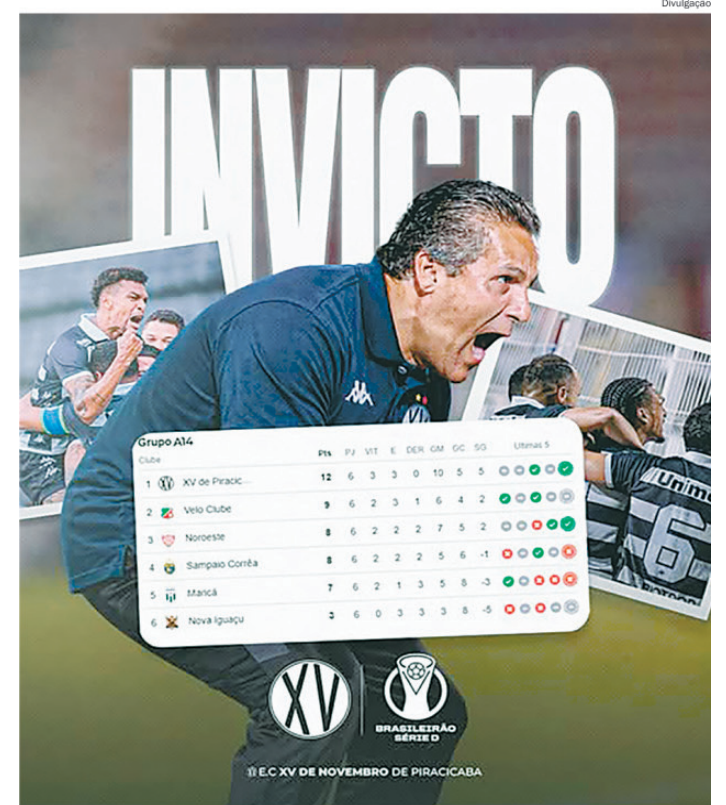
XV segue líder do grupo 14 após seis rodadas, e mantém a invencibilidade no Brasileiro

Santander SRUN Piracicaba. Domingo, 17, no Parque Regional de Lazer do Bongue Orlando Louvandini (Avenida Jaime Pereira, 710). Horário da largada: 7h. Site oficial: www.circuitosrun.com.br/piracicaba/unica