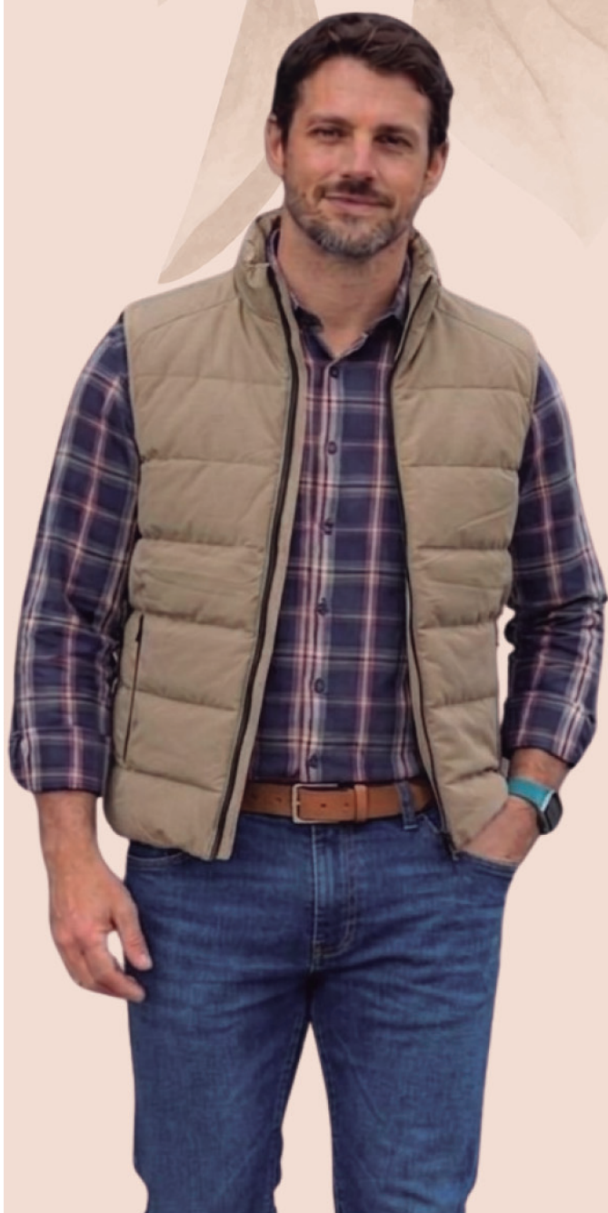
CAMISA ALGODÃO PREMIUM R$ 279,90