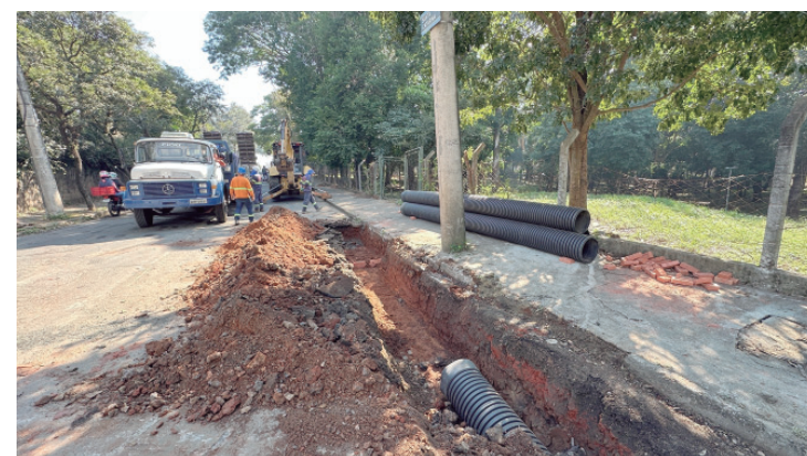
Outra frente de trabalho foi iniciada na rua Santa Catarina, no bairro Nova América, com serviços de adequação da rede de drenagem

Os trabalhos são executados pela Prefeitura de Piracicaba, por meio da Secretaria Municipal de Obras, Infraestrutura e Serviços Públicos. Durante as intervenções, a orientação é para que moradores e motoristas evitem estacionar veículos nas vias em obras, contribuindo para o bom andamento dos serviços e evitando interrupções nas etapas de execução.