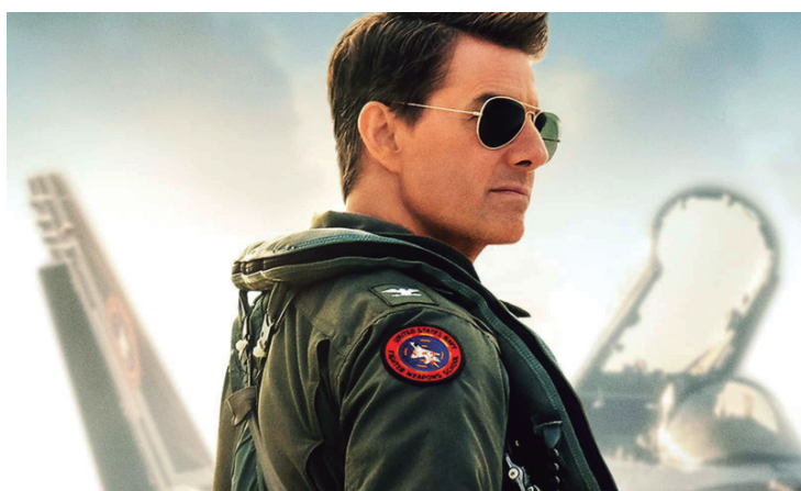
Agora como Capitão, Tom Cruise retorna no relançamento de Top Gun Maverick para treinar grupo de pilotos para uma missão especial