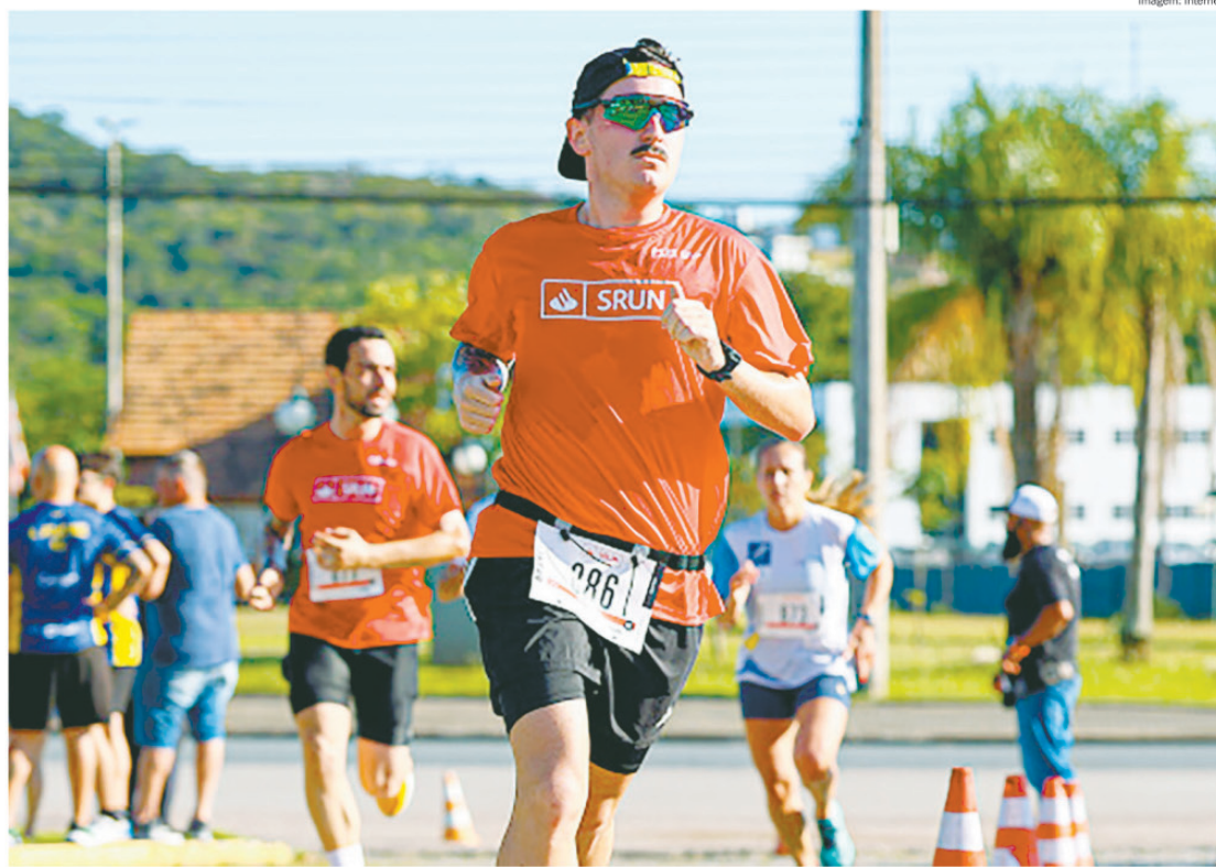
Prova convida desde iniciantes até atletas experientes a desafiarem seus próprios limites

O evento terá divisão dos participantes em pelotões de largada, organizados conforme o ritmo médio de corrida dos últimos 12 meses. "Temos o compromisso em promover o bem-estar e a qualidade de vida das