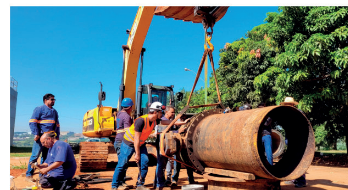
Equipes do Semaef trabalhando na troca de Válvula de 1000mm na ETA Capim Fino

Fórum Permanente de Cultura e Patrimônio — Primeira Edição, de 18 a 20 de maio, em Piracicaba (SP). Realização: Laboratório de Inovação Urbana e Ciência Cidadã (IUCC.Lab) e Sesc Piracicaba. Programação completa: https://www.iuclab.com