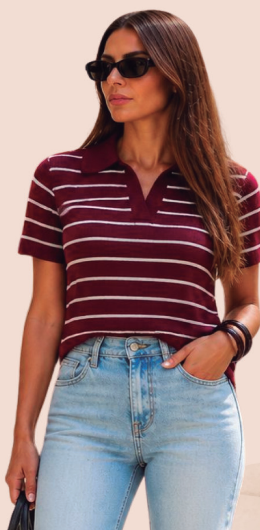
TRICOT MANGA CURTA R$ 199,90