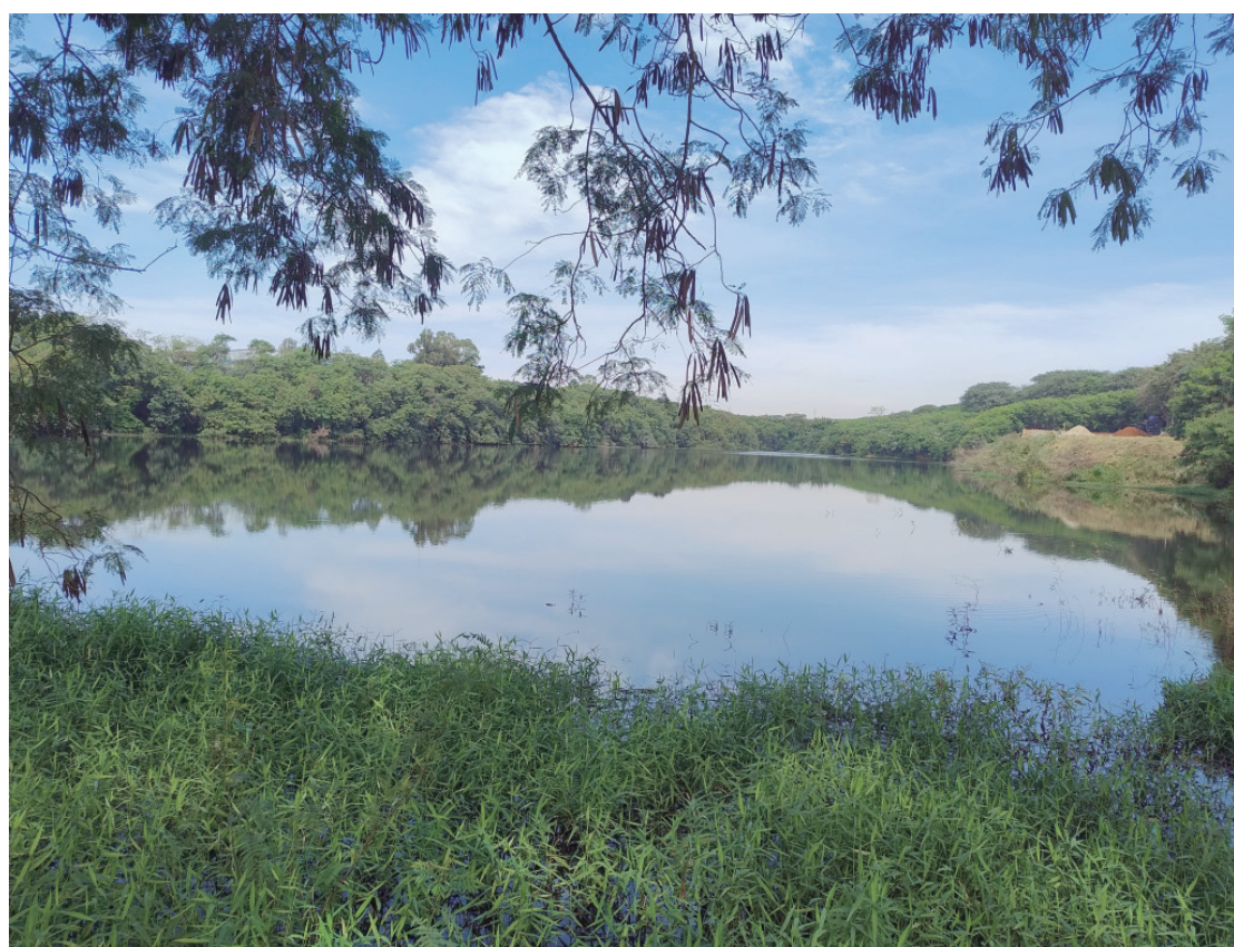
Tancão é um dos reservatórios em área urbana de Rio das Pedras

Em outros anos que a quantidade de água era a mesma nesta época, a cidade pôde passar com tranquilidade, afastando cada vez mais o risco de racionamento.