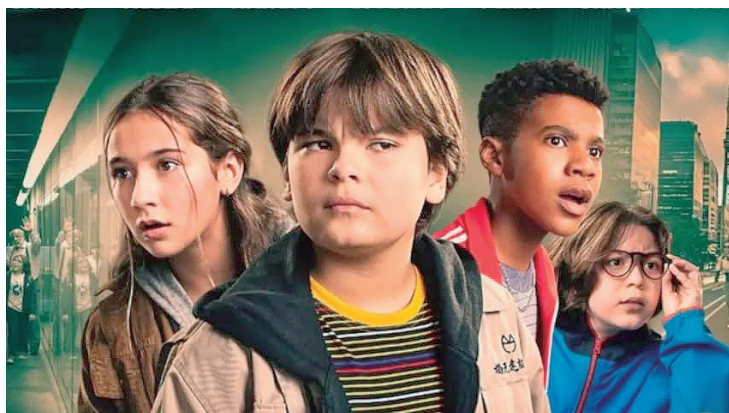
Na aventura infanto juvenil O Gênio do Crime, a Turma do Gordo tenta descobrir falsificação de figurinhas da Copa do Mundo 2026

Cruise ganha um esperado relançamento. Foi um sucesso estrondoso na época, tendo faturado cerca de 1,4 bilhão de dólares mundialmente. Nesta sequência do filme original "Top Gun - Ases Indomáveis", de 1986, Tom Cruise repete seu papel como o aviador naval Pete "Maverick" Mitchell. Após mais de 30 anos como aspi-