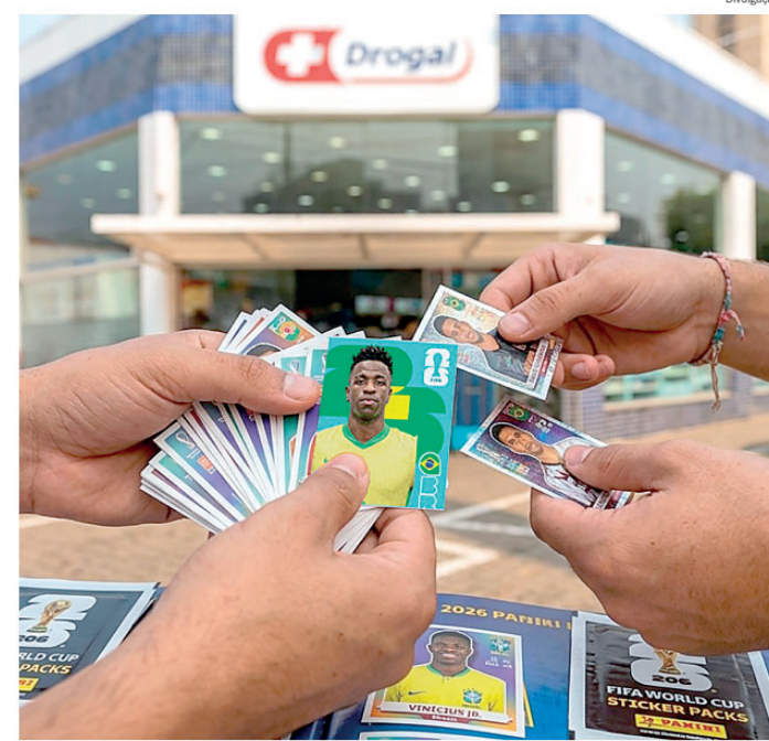
Rede de farmácias promove ações voltadas ao colecionismo, a partir deste mês