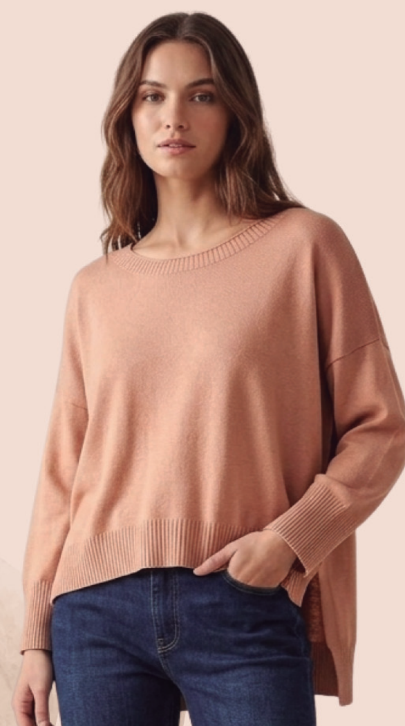
TRICOT ZARA R$ 159,90

*CONSULTE VALORES DOS TAMANHOS ESPECIAIS