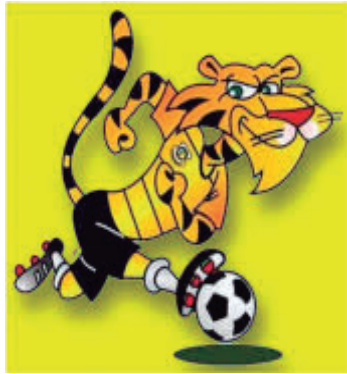
O Tigre do ABC é líder do Campeonato Brasileiro da série B 2026

A equipe também mostra força coletiva, sem depender exclusivamente de individualidades. O elenco vem respondendo bem à proposta de jogo e sustentando desempenho competitivo rodada após rodada. Assumir