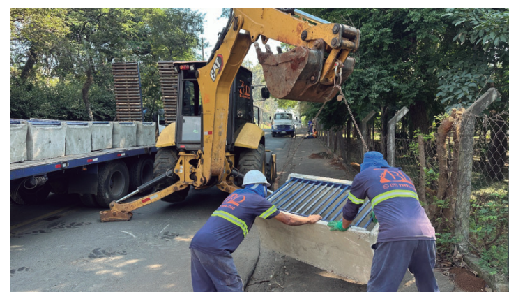
Rua Uchôa teve os serviços finalizados

INGRESSOS E ACESSIBILIDADE - Os ingressos custam R$30 (inteira) e R$15 (meia) e estarão disponíveis pelo site Sympla ( www.sympla.com.br ), com abertura das vendas no dia 15 de maio, às 10h30. O espetáculo aceitará ingressos gratuitos de 130 ingressos, uma hora antes de cada concerto, destinada a pessoas de baixa renda, estudantes e idosos, além do público geral, conforme disponibilidade. A apresentação de sábado contará com intérprete de Libras. A OSP também disponibilizará, na entrada do teatro, programas confeccionados em braile, ampliando o acesso do público à experiência musical. Serviço Mais informações sobre a Orquestra Sinfônica de Piracicaba podem ser obtidas nas redes sociais Instagram e Facebook: @sinfonicapiracicaba e site https://osp.art.br/ .