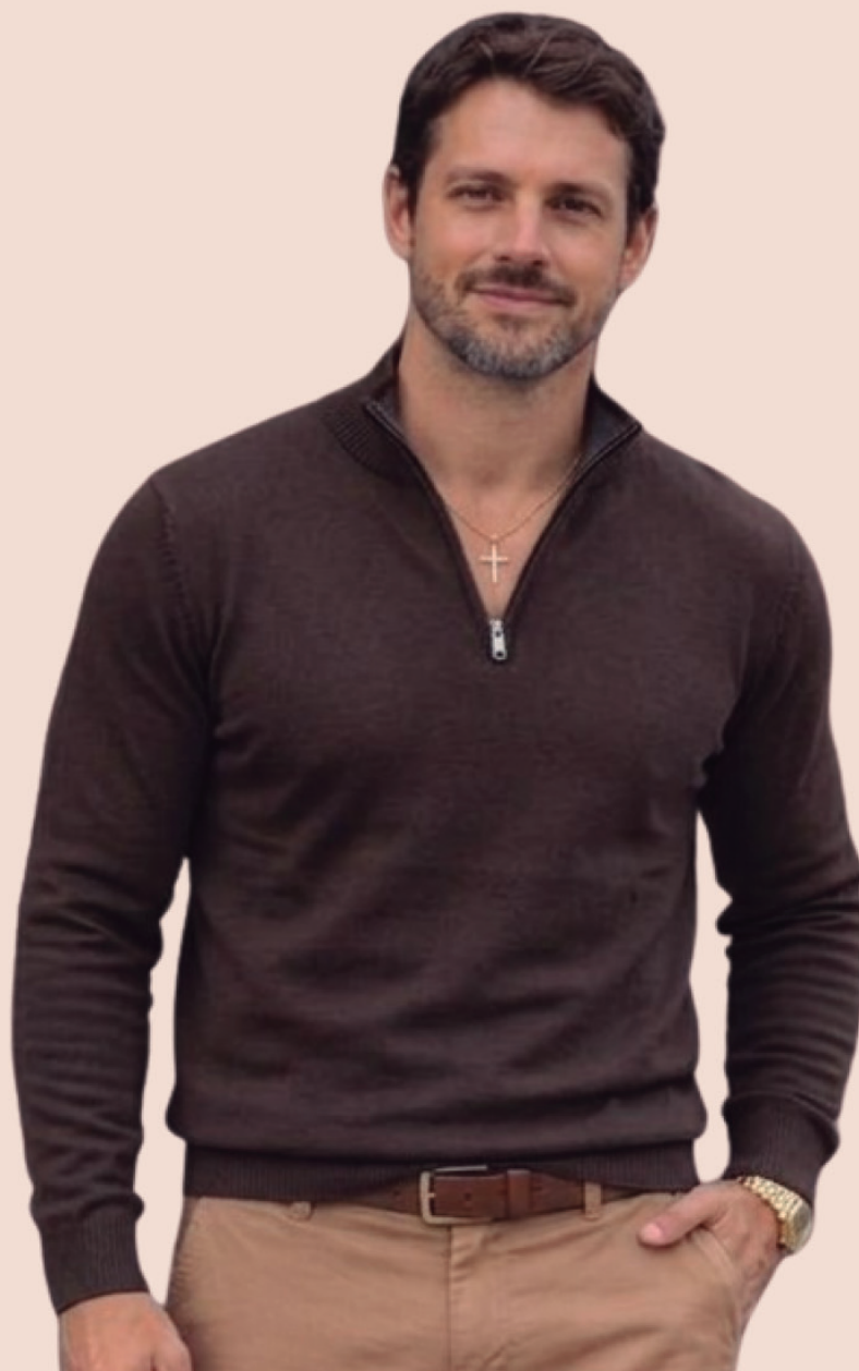
TRICOT GOLA ZIPER R$ 229,90