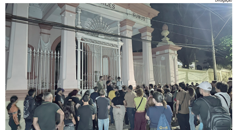
Cerca de 80 pessoas estiveram no roteiro na última sexta-feira