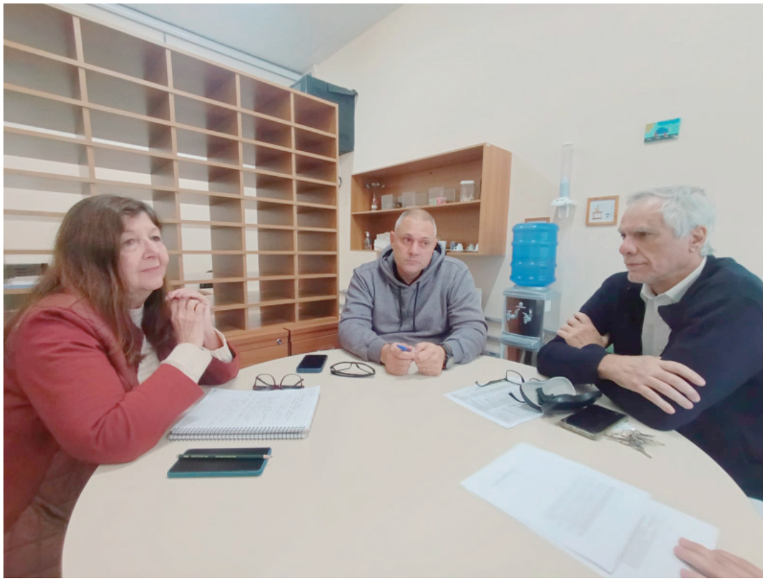
Vereador se reuniu com secretária executiva no último dia 11

De acordo com o vereador, a diminuição no quadro e na jornada dos profissionais gerou sensação de insegurança entre pais e responsáveis, especial-