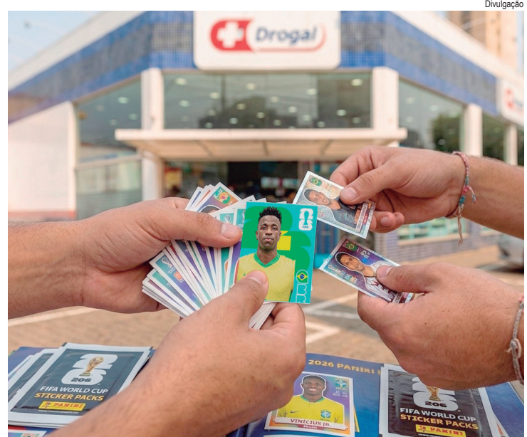
Rede de farmácias promove ações voltadas ao colecionismo, a partir deste mês

Outra ação marca a parceria entre Drogal e Panini em Piracicaba neste período. Trata-se da Mega Troca de Figurinhas, que acontecerá em duas datas no mês de junho. Os colecionadores poderão trocar cromos do Álbum da Copa do Mundo no campo da Rua do Porto, aos sábados, nos dias 06/06 e 27/06. O esquema será o mesmo: compra e troca de figurinhas, além do controle de figurinhas gratuito. A participação é aberta ao público. Os endereços de todas as lojas estarão disponíveis no site da Drogal, na seção Seleção de Ofertas ( www.drogal.com.br/selecao-de-ofertas ).