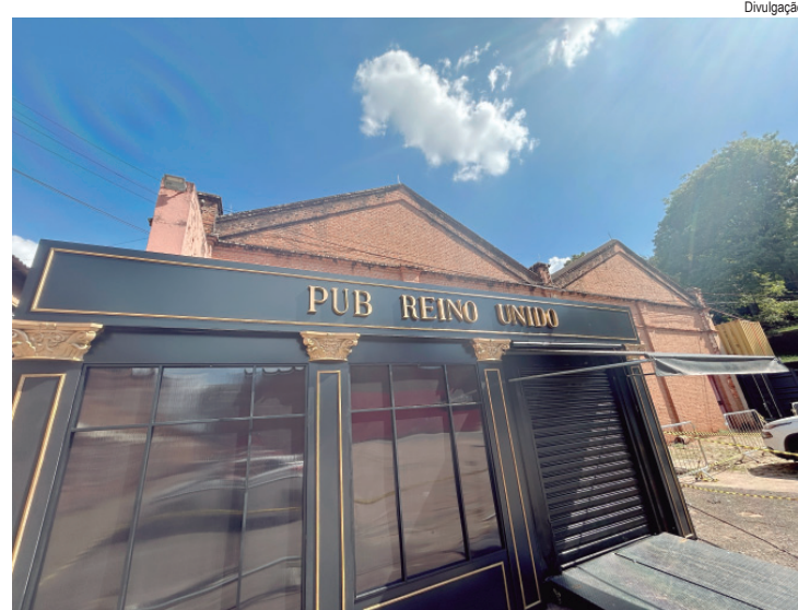
Pub traz o melhor da gastronomia britânica e shows com dez bandas ao vivo ao longo do evento

Os visitantes também podem provar um cardápio de doces como Banoffee (sobremesa inglesa à base de banana e doce de leite); Trifle de