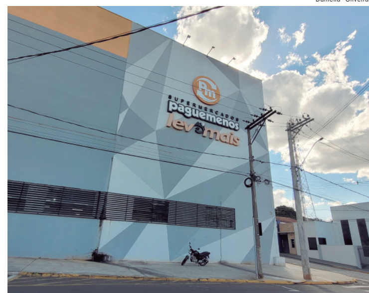
Saldão Especial Dia das Mães acontece nos dias 8 e 9 de maio, nas 39 lojas físicas do Supermercados Pague Menos

A Secretaria Estadual de Saúde orienta que, neste momento, a vacina contra a dengue não seja aplicada simultaneamente com outros imunizantes. Vacinas inativadas podem ser feitas após intervalo mínimo de 24 horas. Já vacinas atenuadas devem respeitar intervalo de 30 dias.