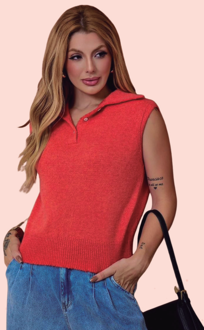
COLETE TRICOT R$ 199,90