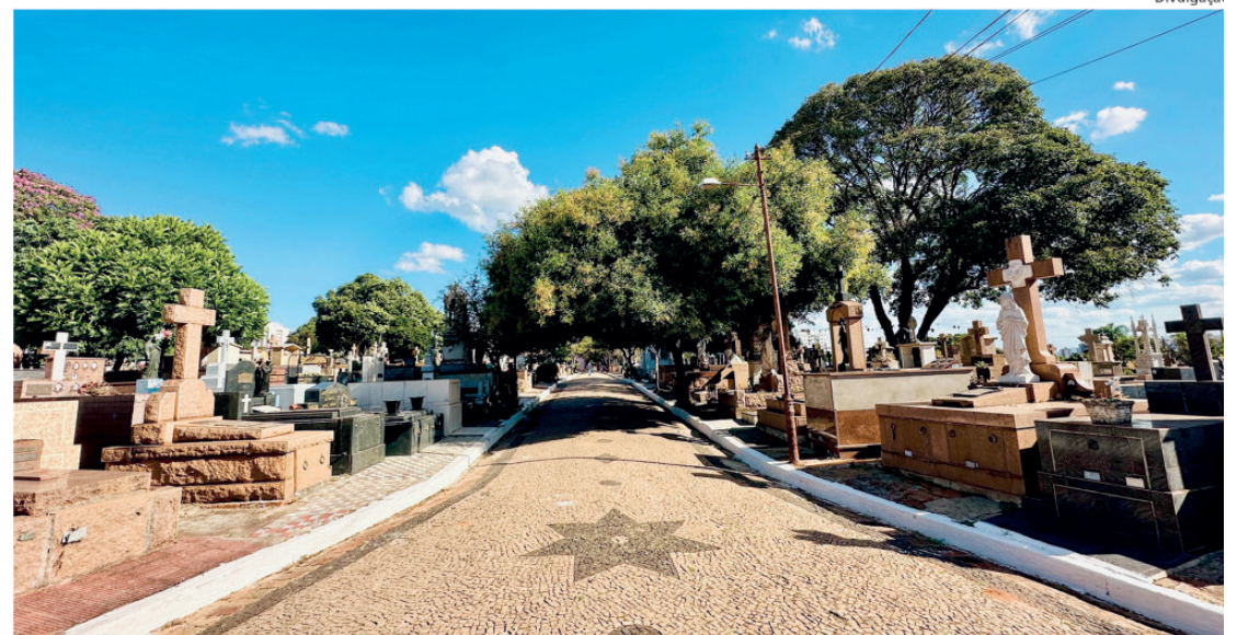
A Secretaria de Obras, Infraestrutura e Serviços Públicos realizou a pintura de guias nos Cemitérios Municipais

“A Festa das Nações é feita por pessoas. Quando cada um doa um pouco do seu tempo, o resultado é algo muito maior: união, cuidado com o próximo e construção de uma cidade mais humana e solidária”, completou. O vereador fez o convite para que todos os interessados possam atuar como voluntários durante o tradicional evento.