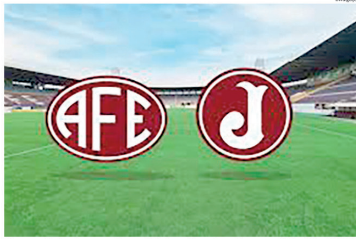
Um empate basta para a Ferroviária levantar a taça de campeã da série A2 2026

Nos minutos finais, o confronto ficou aberto, com os dois times buscando a vitória, mas sem eficiência nas finalizações. O empate sem gols manteve o equilíbrio da decisão e aumentou a expectativa para o jogo de volta em Araraquara. Antes da grande final, a Ferroviária ainda tem