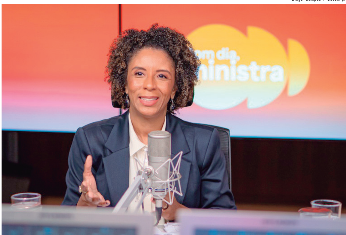
Para ministra Rachel Barros, a criação do Ministério da Igualdade Racial é uma resposta firme do governo e do presidente Lula a todas as ações contrárias a políticas de cotas

RACISMO RELIGIOSO - Sobre o racismo ainda presente na sociedade, Rachel Barros defendeu o fortalecimento de políticas públicas que promovam a igualdade racial. Ela citou o exemplo da