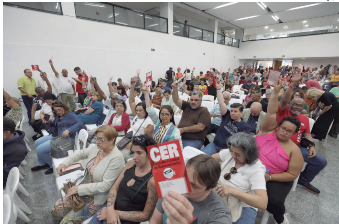
Conselheiros da Apeoesp aprovam novas ações voltadas ao fortalecimento do Iamspe no Interior do Estado de São Paulo