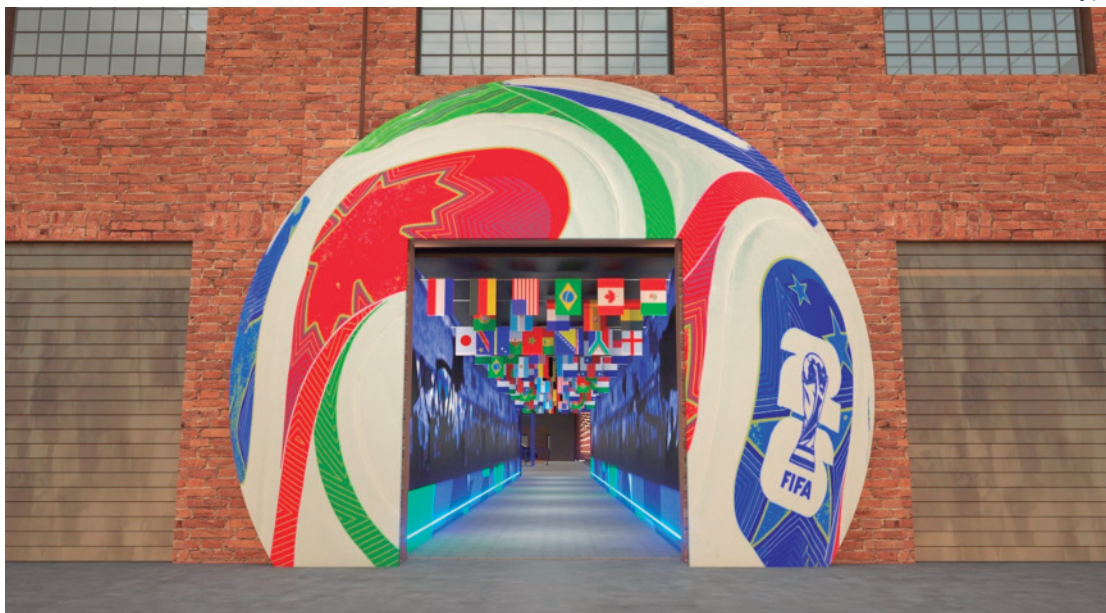
Parceira da festividade municipal desde 2010, fabricante promove nova experiência no local após sucesso da exposição "Luzes da Coreia", realizada no mesmo espaço em 2024

"A Hyundai tem como propósito de todos os anos na Festa das Nações aproximar o público dos elementos culturais que unem Brasil e Coreia do Sul. E, sem sombra de dúvidas, um destes é a paixão pelo futebol. Em 2026, temos a oportunidade de ativar novamente o espaço do túnel que leva ao nosso pavilhão para promover uma experiência adicional aos visitantes, de grande importância cultural e social. É um presente que enriquece a experiência de quem comparecer ao evento e se transforma em um ambiente 'instagramável', que ajuda a promover o evento tanto para quem está presente como para