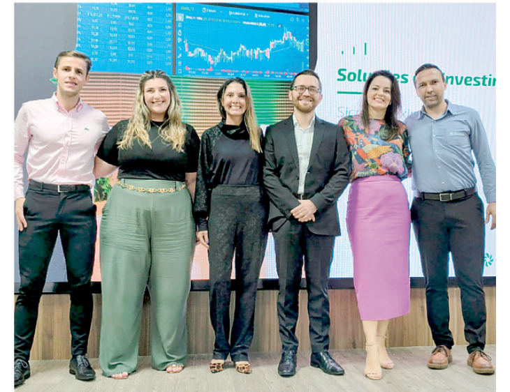
Assessor trouxe análise do cenário nacional e internacional

apresentações do Show Tropical, da Dançart Entretenimento, seguido pelo tradicional Show de Tango, com a RC Arte, encerrando a noite com show da Banda Área. No sábado (30), a programação também começa às 19h30, reunindo o espetáculo “Brasil com S”, apresentado pelo Reviver Estúdio de Dança, além do Nipo Show Japonês e show musical com o Grupo 1, 2 e 3 Pin. Já no domingo (31), as atrações terão início às 11h, com apresentações da Anima Cia de Dança, dança do ventre com o Estúdio Elisângela Fraga, show do Grupo Itinerante City Jazz Band e encerramento com Samba da Aninha.