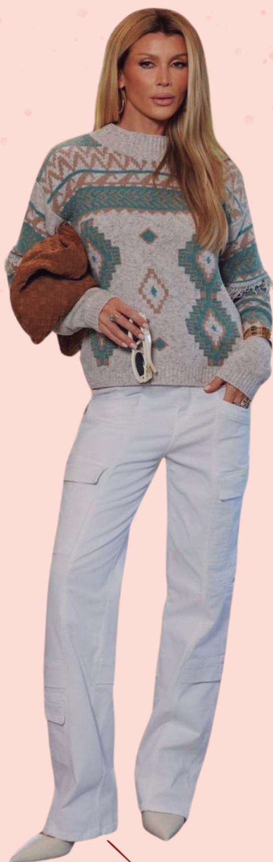
TRICOT MOUSSE R$ 229,90