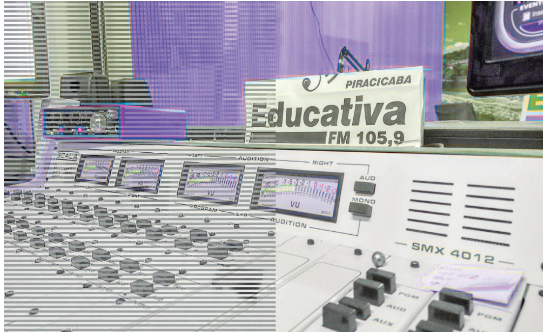
Educativa FM alcança diversos municípios da Região Metropolitana de Piracicaba