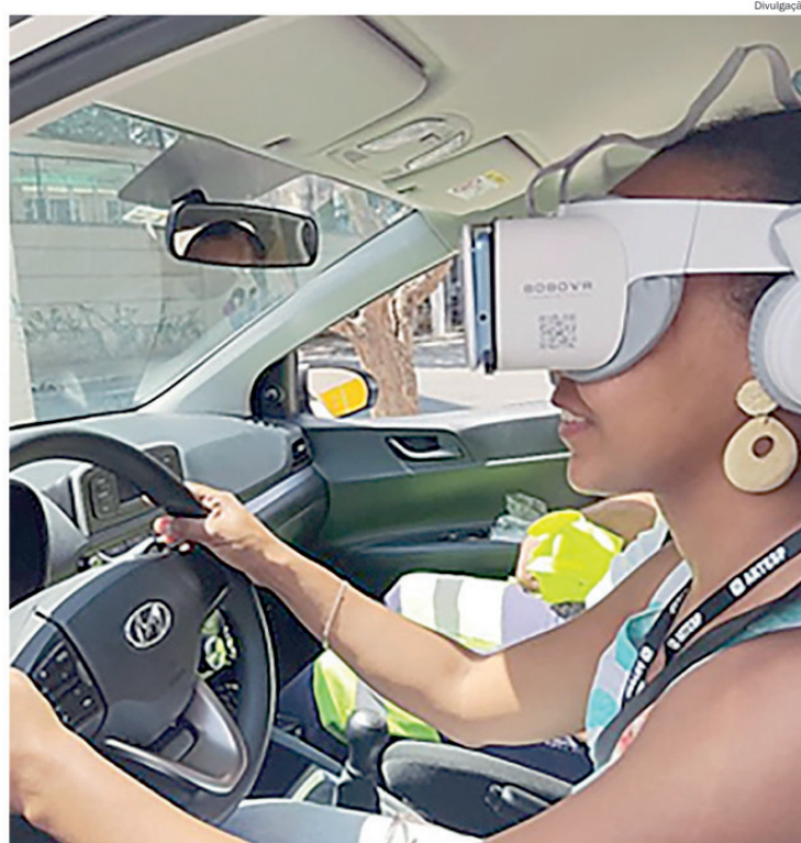
Equipes das concessionárias realizam palestras, atividades específicas e práticas com orientações sobre segurança nas rodovias

“A redução de acidentes passa, necessariamente, pela mudança de comportamento dos usuários. Por isso, estamos fortalecendo ações que