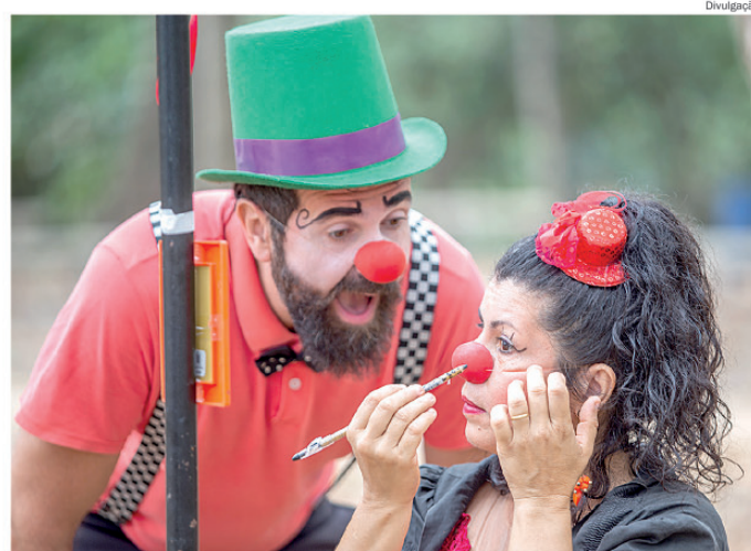
Palhaços Tampa e Panela

Com forte atuação nas ruas e espaços públicos, a Cia Atitude Teatro se con-