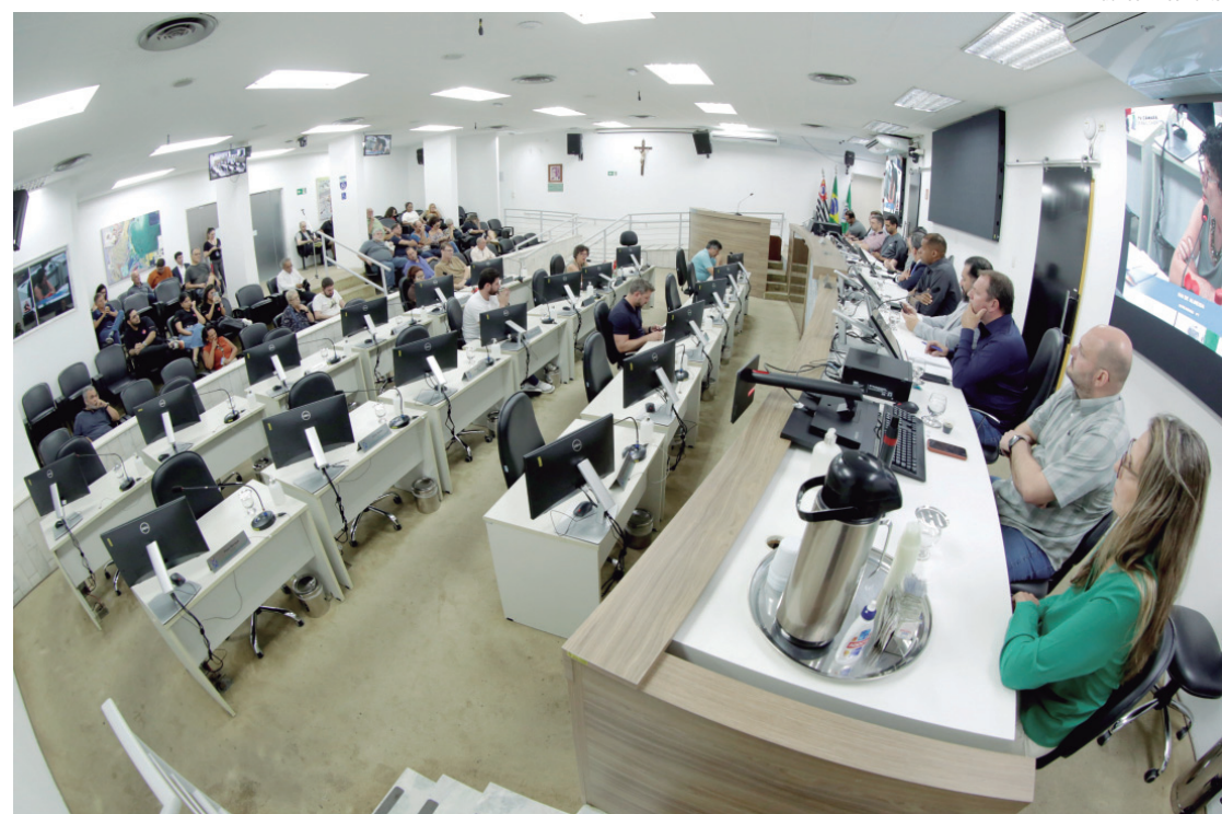
Tema foi abordado em audiência pública promovida pela Câmara Municipal de Piracicaba, nesta quarta-feira (6), por iniciativa das comissões de Obras, Serviços Públicos e Atividades Privadas e de Legislação, Justiça e Redação