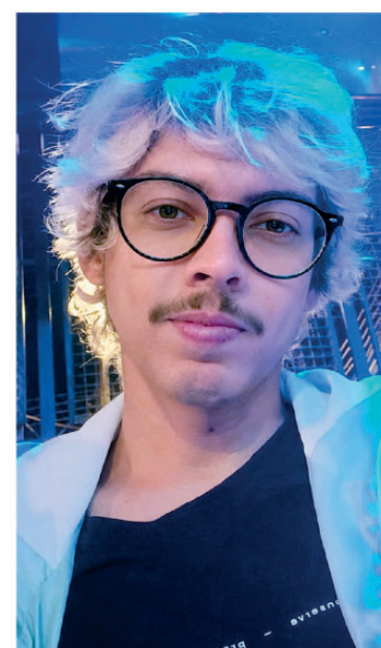
Edição CCPZ Douglas Souza - jornalista responsável

A Pirarazzi passa a integrar o projeto como apoiadora, reforçando seu compromisso com a valorização dos artistas e da produção cultural de Piracicaba e região.