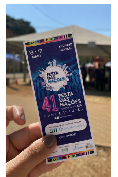
Oji Papéis reforça apoio à Festa das Nações de Piracicaba com doação de papel para ingressos