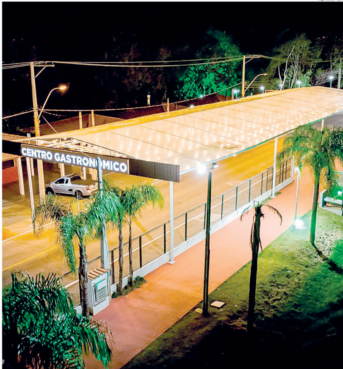
Evento contará com mais de 30 experiências gastronômicas e 10 atrações culturais

Entre os países e representantes confirmados estão Argentina, representada pela Oficina do Churrasco; Alemanha, com o Leuven (cerveja e chopp); Itália, com o Centro Universitário Senac Águas de São Pedro, que também será responsável pelas oficinas gastronômicas e apoio educacional;