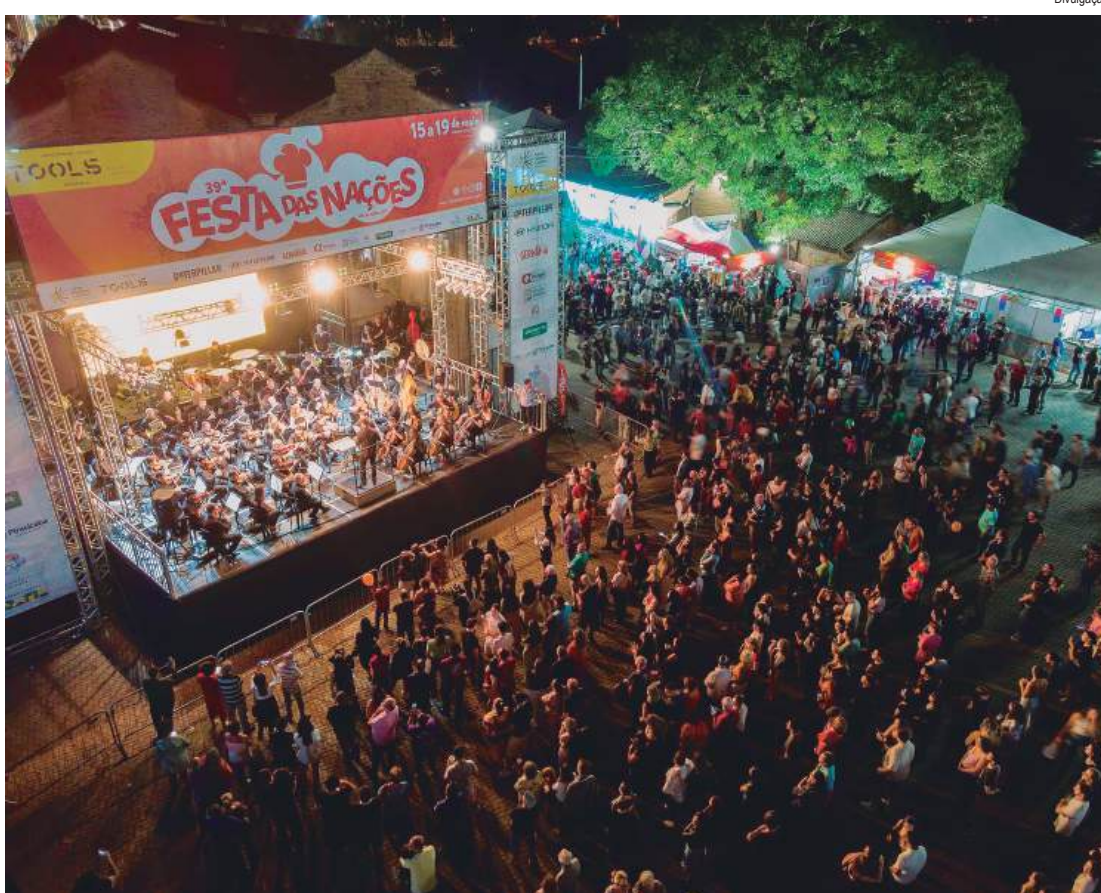
Festa acontece entre 13 e 17 de maio, no Engenho Central

No processo seletivo, entre os critérios a serem avaliados por equipe técnica designada pela Secretaria Municipal de Turismo, junto da Fenapi (Associação Cultural Festa das Nações), estão: referência à cultura popular, criatividade, linguagem própria, tradição, expressão contemporânea, inovação, consciência ambiental e apresentação. No dia 05/05 será divulgada no site turismopiracicaba.com.br a lista dos nomes dos selecionados, por ordem de classificação.