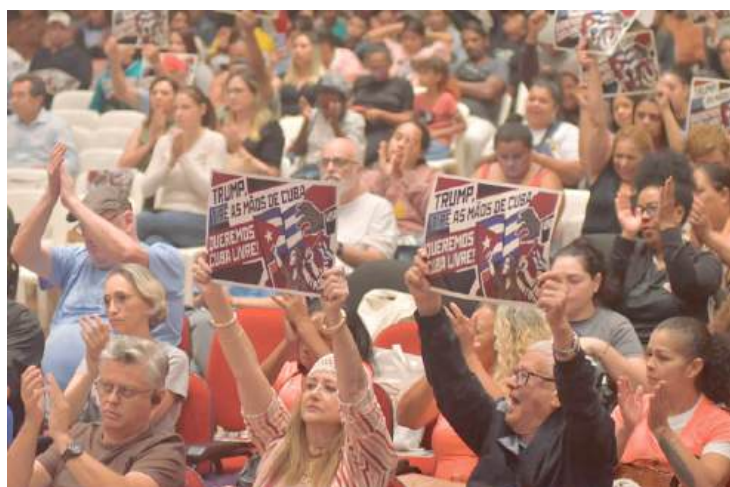
Durante o ato, que reuniu quase 40 entidades, foram feitas diversas manifestações em solidariedade ao povo cubano

A dimensão internacional da luta também apareceu de forma recorrente, com a situação de Cuba sendo relacionada a outros conflitos e processos políticos no mundo, defendendo a unidade entre os povos e o enfrentamento ao que classificaram como avanço do imperialismo. A solidariedade a Cuba foi apresentada como parte de uma agenda mais ampla de defesa da autodeterminação.