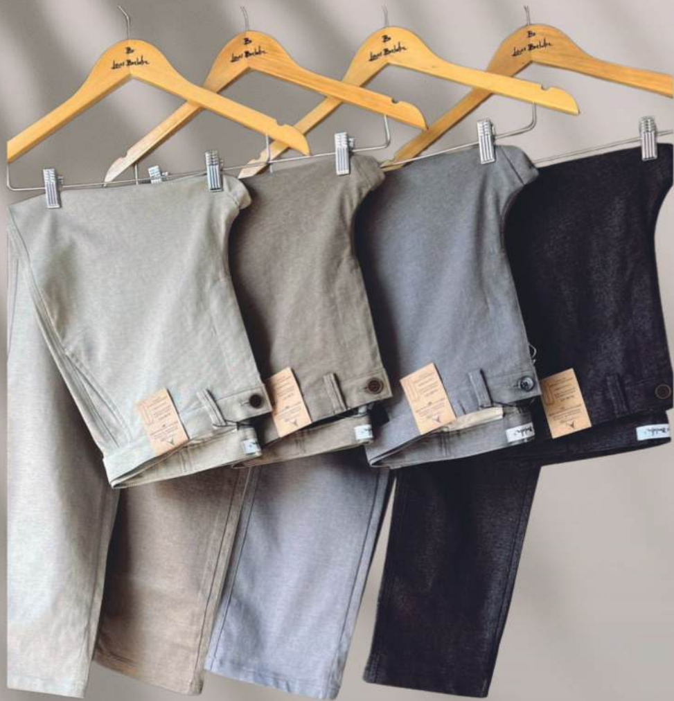
CALÇA MASCULINA MOOVEXX R$ 429,90