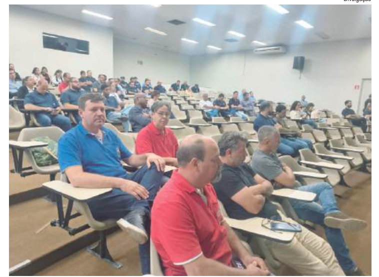
Dirigentes sindicais de diversos sindicatos ligados ao Instituto Sindical participaram da atividade

em Literatura Brasileira pela USP, onde se graduou em Letras. Pós-graduado em Ciências da Religião pelo Instituto Prominas, é professor e Doutor honoris Causa pelo Movimento Cultural Negro Ginga - IEG, de Limeira - SP e pela Fecbacla - RJ. Eleito para a cadeira 62 da Academia Independente de Letras, da qual se tornou patrono (divisa "Axé"). Recebeu diversos prêmios e comendas por sua intensa atividade cultural.