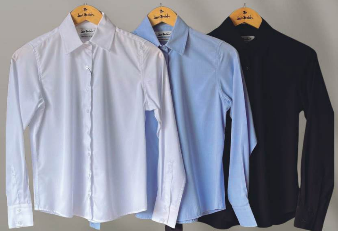
CAMISA FIBRA DE BAMBU FEMININA

MANGA LONGA R$ 299,90 MANGA CURTA R$ 259,90