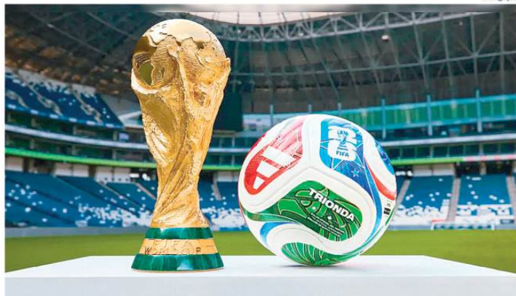
Trionda a bola oficial para a Copa, e novas regras da Fifa tentam valorizar ainda mais a disputa em campo

A mudança leva em consideração o novo formato da Copa do Mundo, que em 2026 contará com 48 seleções e uma fase eliminatória adicional, os 32-avos de final. Com o aumento do número de jogos, cresce também o risco de atletas importantes ficarem fora de confrontos decisivos por