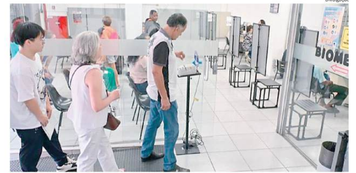
Antes de ir ao cartório, TRE-SP orienta as pessoas a verificar a situação do título ou da biometria

Para o mês de setembro, está programada a Missão de Negócios da Jornada Exportadora do Artesanato, em Paris, na França, com inscrições a serem abertas em breve. Já em dezembro, os artesãos participarão da Feira Internacional Expoartesanias, em Bogotá, na Colômbia, por meio do Programa +Feiras, ampliando a presença do setor em mercados estratégicos internacionais.