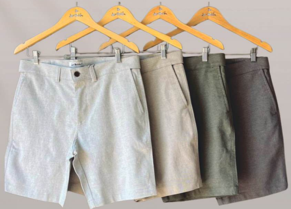
BERMUDAS MASCULINA MOOVEXX R$ 359,90