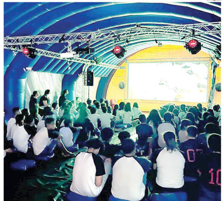
Para o projeto Cine e Cultura será montada uma estrutura inflável de cinema

"Acreditamos na arte como um instrumento potente de formação e consciência. Ao estimular a expressão criativa dos jovens, abrimos caminhos para o desenvolvimento do pensamento crítico e para uma compreensão mais ampla dos desafios sociais