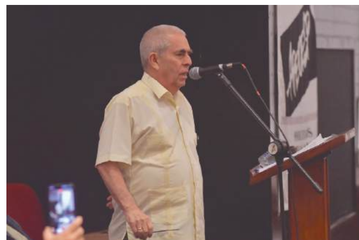
O embaixador cubano Benigno Pérez Fernández disse que Cuba é um Estado cercado