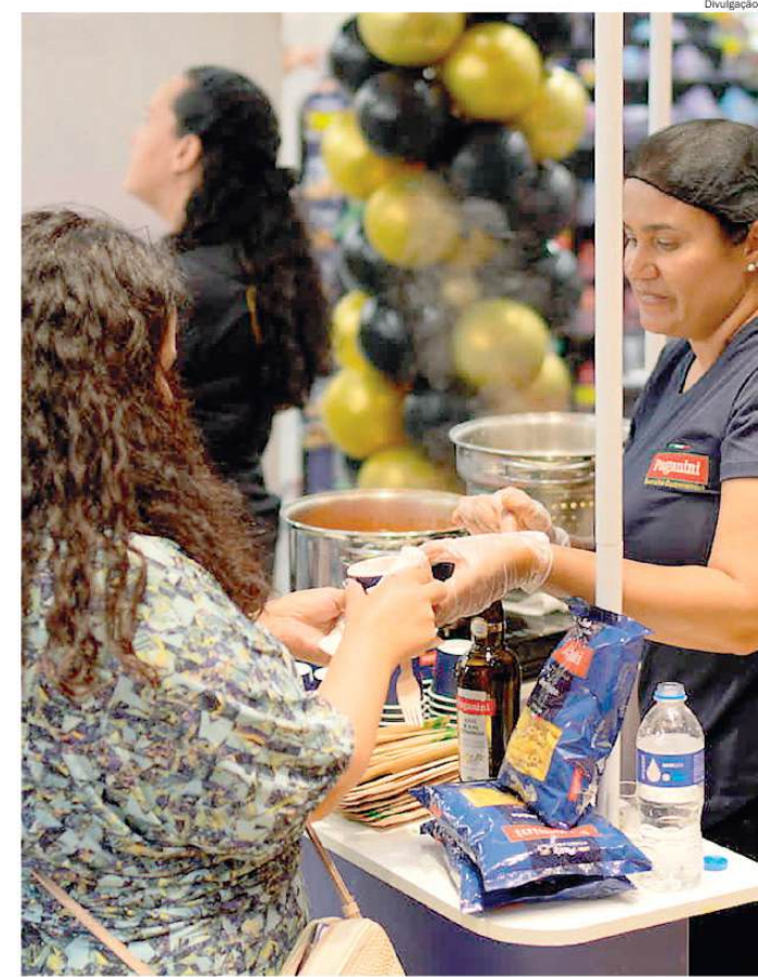
Ao longo de quatro horas de evento, cerca de 300 clientes passaram pelo espaço

O cenário aponta para continuidade do crescimento moderado, condicionado à manutenção do acesso ao crédito e à estabilidade econômica, mantendo o mercado imobiliário como um dos principais termômetros sociais e econômicos da região.