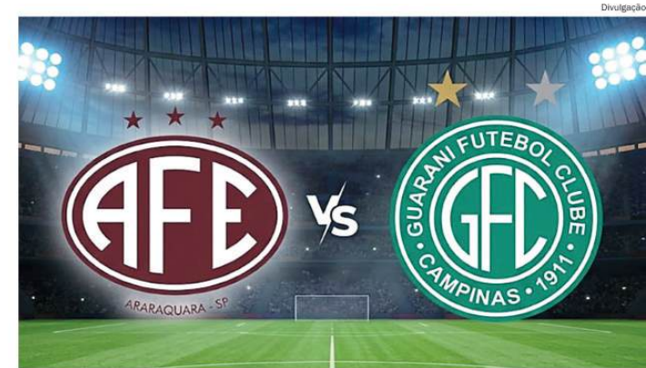
O empate em 2x2 é o termômetro do duelo entre os clubes paulistas no Brasileiro da série C

Caso aprovada, a nova regra deve alterar a estratégia das equipes ao longo da competição, especialmente no controle disciplinar de seus atletas, em um torneio que promete ser o maior da história em número de participantes e partidas.