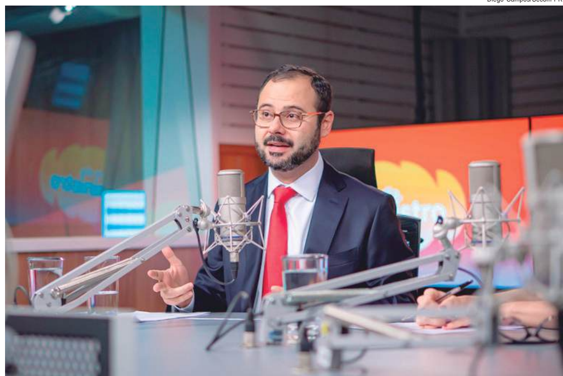
O ministro Paulo Pereira destacou a forte presença feminina no empreendedorismo. Segundo dados dos novos painéis do Mapa de Empresas, quase 40% das 25 milhões de empresas ativas no Brasil são lideradas por mulheres

O projeto é realizado em parceria com Institutos Federais em cinco estados até o momento: São Paulo, Goiás, Acre, Rio Grande do Sul e Pernambuco. A jornada inclui aulas presenciais, formação de grupos, elaboração de plano de negócios, auxílio mensal de R$ 600 por estudante, suporte psicológico, desenvolvimento de produto mínimo viável, testes de mercado, premiação de R$ 20 mil para os melhores projetos e mentoria por seis meses após a premiação. Foram destinados cerca de R$ 5,8 milhões ao projeto.