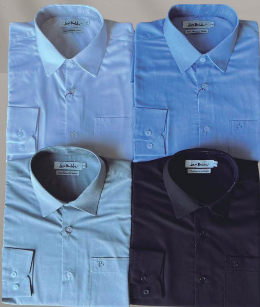
CAMISA FIBRA DE BAMBU MASCULINA

MANGA LONGA R$ 299,90 MANGA CURTA R$ 259,90