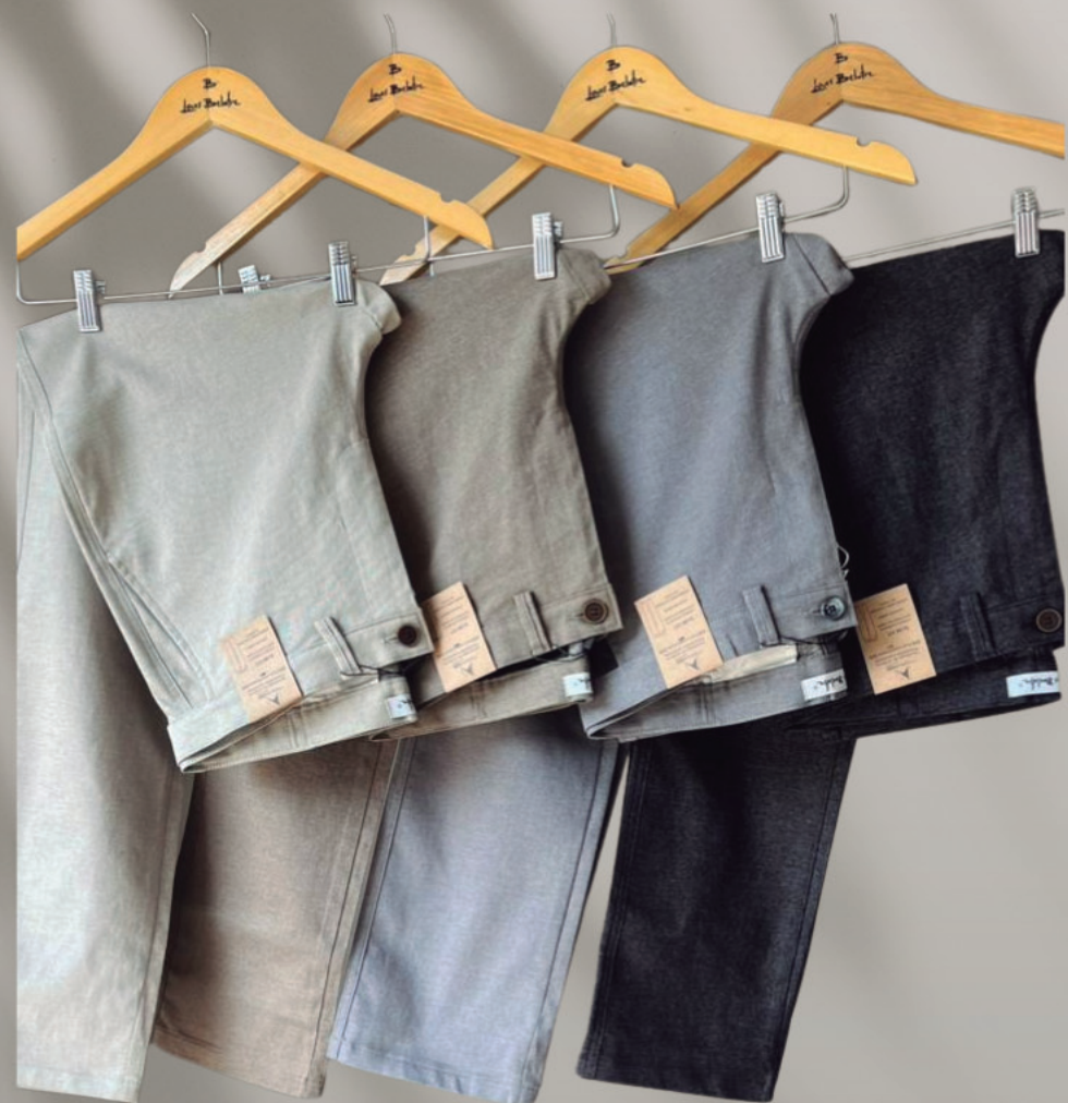
CALÇA MASCULINA MOOVEXX R$ 429,90