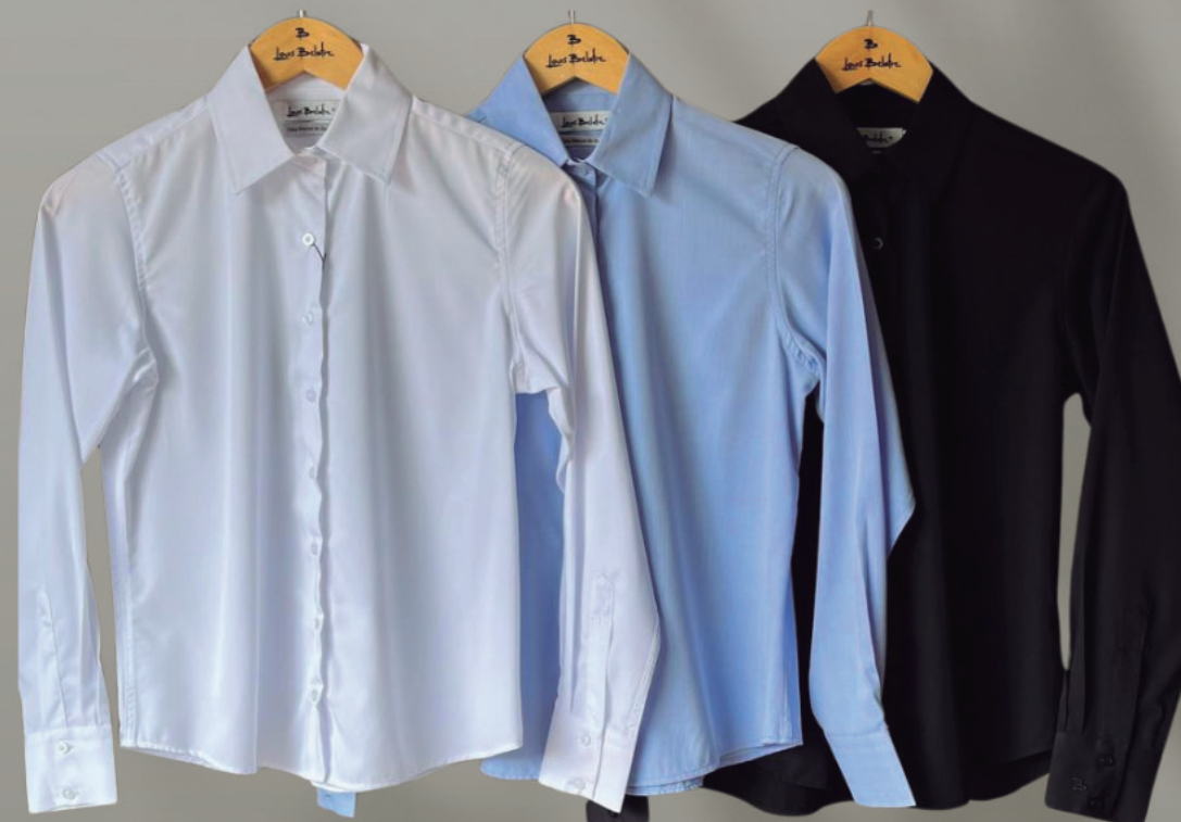
CAMISA FIBRA DE BAMBU FEMININA

MANGA LONGA R$ 299,90 MANGA CURTA R$ 259,90