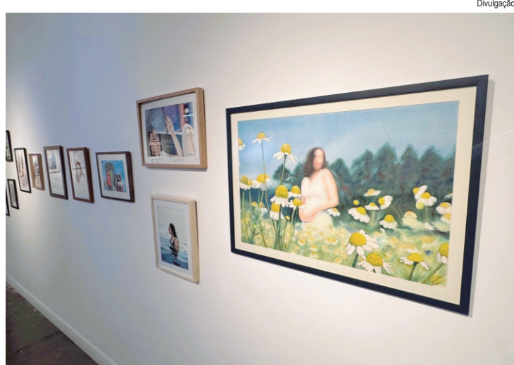
Referência nacional, Pinacoteca abre 9º Salão de Aquarelas de Piracicaba