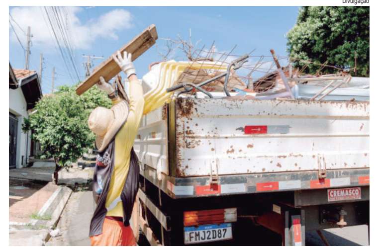
Até março, arrastões realizados pela Prefeitura recolheram 80,5 toneladas de inservíveis

Completando a programação, o GEDCAL (Grupo de Extensão em Divulgação do Curso de Ciências dos Alimentos) apresenta informações sobre o curso de Ciências dos Alimentos da Esalq, destacando sua trajetória, oportunidades profissionais e ações de extensão. O grupo também promove um quiz interativo com curiosidades sobre alimentos, estimulando o aprendizado de forma lúdica.