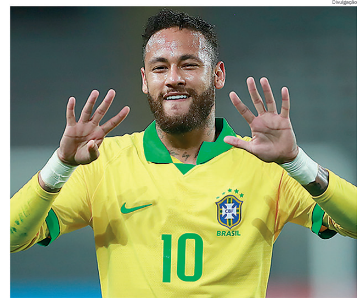
Neymar Jr. ainda é a esperança de título para o Brasil

Mais informações acesse: www.xvipiracicaba.com.br .