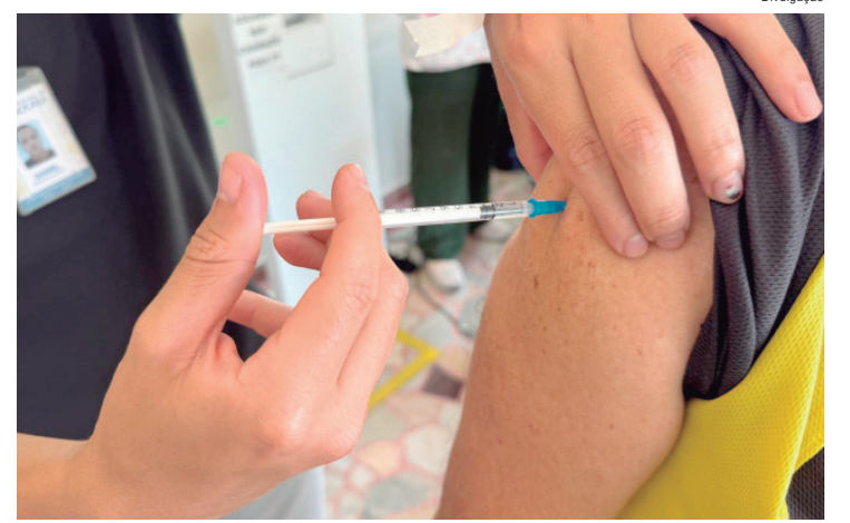
Abertura das unidades das 17h às 20h tem objetivo de ampliar o número de pessoas imunizadas

O processo para destinação é simples e feito diretamente no programa da declaração. Após o preenchimento dos dados, o contribuinte deve acessar a opção de doações diretamente na declaração, selecionar os fundos municipais e emitir o Documento de Arrecadação de Receitas Federais (DARF), que deve ser pago até o último dia do prazo da declaração, em 29 de maio. Mais informações sobre o IR no site: gov.br/receitafederal.