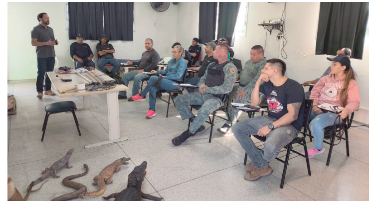
Participantes revisaram protocolos de abordagem, técnicas de contenção humanitária e medidas de biossegurança

A capacitação técnica evidenciou um cenário cada vez mais presente: a convivência entre cidade e natureza. Com a expansão urbana, o contato com esses animais tende a se tornar mais frequente, o que exige respostas rápidas, responsáveis e baseadas em conhecimento atualizado. Dessa forma, a iniciativa contribuiu para qualificar o atendimento à população e fortalecer ações que priorizam o manejo adequado e o respeito à fauna silvestre.