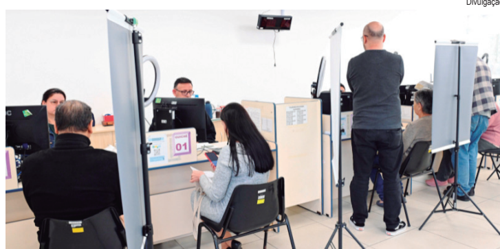
Unidades do TRE-SP abrem de forma ininterrupta no feriado, no fim de semana e na última semana para tirar o título ou cadastrar a biometria

DOCUMENTOS NECESSÁRIOS - Quem vai tirar o primeiro título deve comparecer ao cartório eleitoral levando um do-