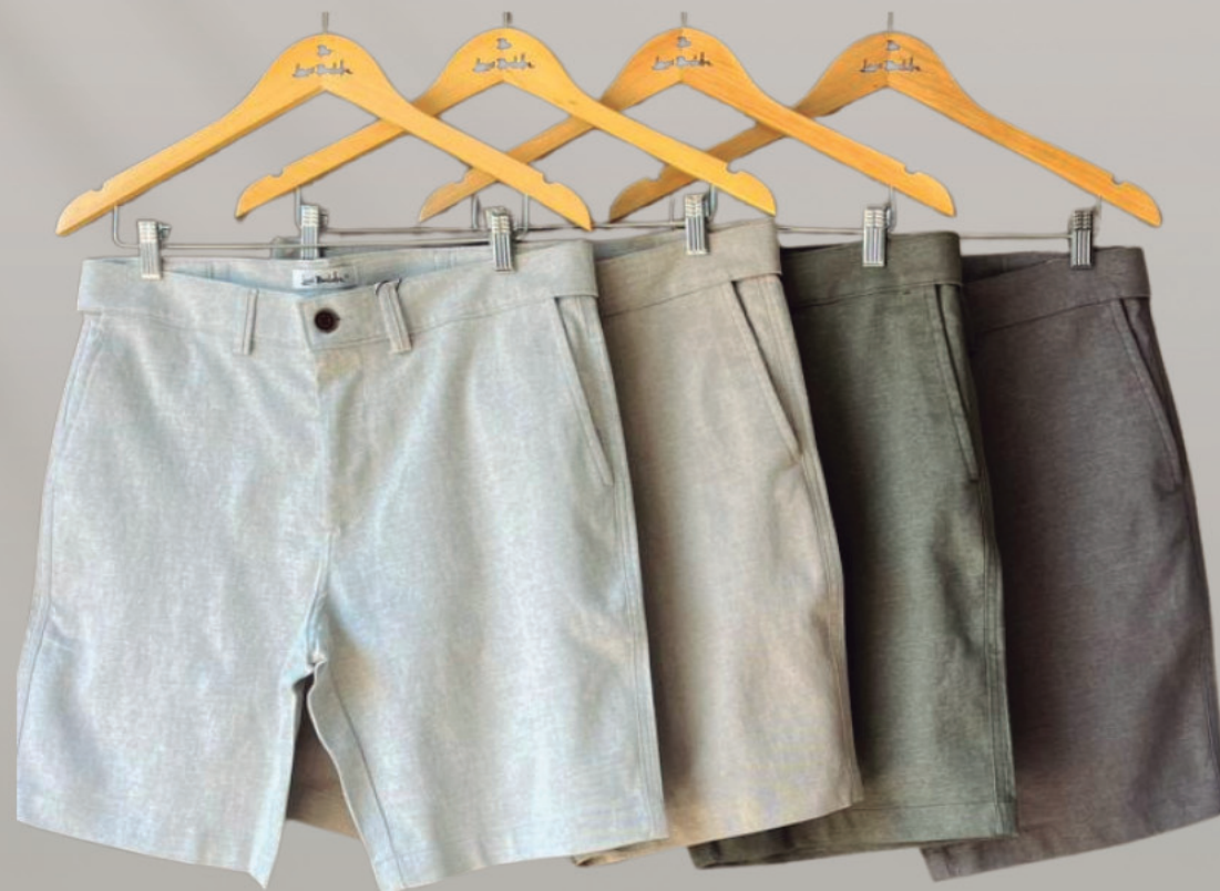
BERMUDAS MASCULINA MOOVEXX R$ 359,90