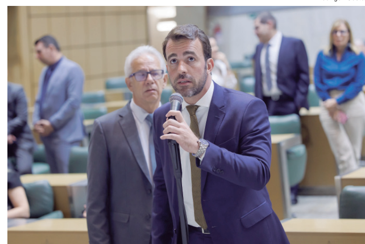
Novo redação de legislação deve garantir recursos para que o fundo possa contratar serviços, bens e tecnologias

Todos os serviços eleitorais são gratuitos, sendo cobradas, eventualmente, apenas as multas devidas por quem não votou nem justificou a ausência às urnas. A consulta de débitos está disponível no Autoatendimento, na aba "Consultas". Caso a eleitora ou o eleitor tenha dúvida ao solicitar algum serviço, o TRE-SP disponibiliza o telefone 148 (Central de Atendimento ao Eleitor) e o chatbot Lina. A assistente baseada em Inteligência Artificial pode ser acessada pelo site do TRE-SP ou WhatsApp: (11) 3130-2200.