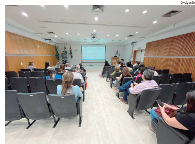
Primeira reunião discutiu diretrizes do plano voltado a crianças e adolescentes para o período de 2026 a 2036

SERVIÇO 20ª Semana Italiana de Cascalho, Cordeirópolis/SP, de 25 de abril a 2 de maio. Instagram: @atmcascalho. Reservas para o Almoço das Famílias: (19) 3546-2440 ou (19) 98416-0165