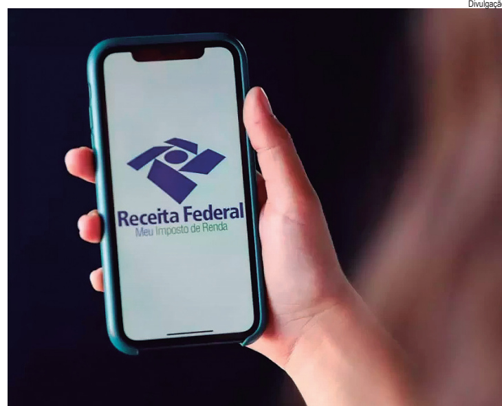
Estudantes orientarão os contribuintes sobre o preenchimento correto da declaração

Orientações sobre a declaração da IRPF 2026 para a comunidade. Dia 12 de maio, das 19h30 às 22h30, na Fundação Municipal de Ensino de Piracicaba (av. Monsenhor Martinho Salgot, 560 - Areião). Gratuito