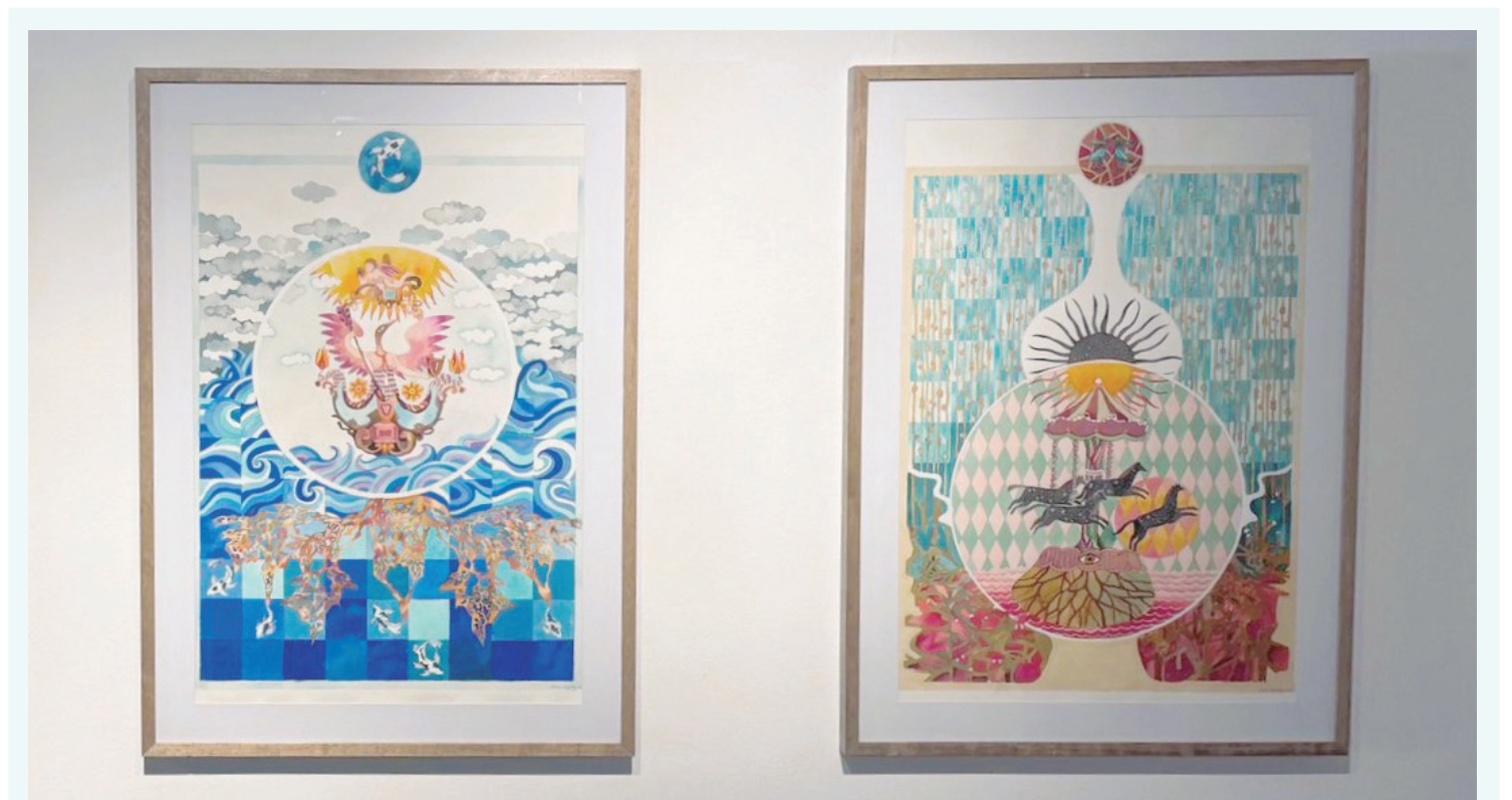
Aquarela se destaca pela leveza e transparência

proteger o recém-nascido contra doenças graves. A partir daí, o calendário vacinal segue ao longo da vida, com doses e reforços em cada fase. A5