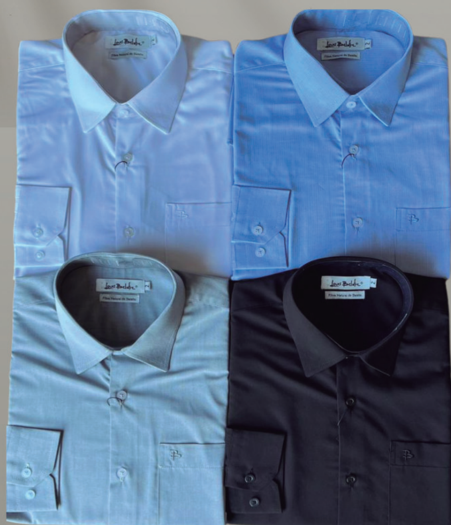
CAMISA FIBRA DE BAMBU MASCULINA

MANGA LONGA R$ 299,90 MANGA CURTA R$ 259,90