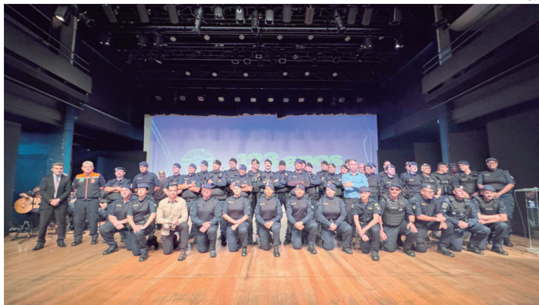
A cerimônia que celebrou os 123 anos de fundação da GCM foi realizada no Teatro Erotides de Campos