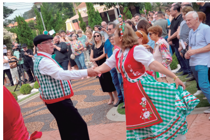
Evento em Cordeirópolis celebra tradição de mais de um século da imigração italiana

"Ao completar 20 edições, a Semana Italiana reforça o papel de Cascalho como um importante símbolo da presença italiana na