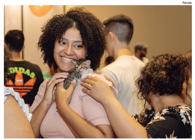
Evento acontece nos dias 25 e 26 de abril, com orientação especializada para adoção responsável