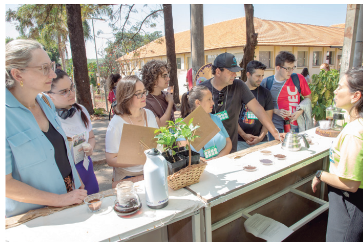
Com visitação gratuita, projeto traz atividades interativas, demonstrações práticas e experiências sensoriais

Já o GEQPC (Grupo de Extensão em Qualidade e Processamento de Carnes) aposta na interação com o público por meio de um quiz sobre carnes, apresentação de pesquisas desenvolvidas no laboratório e degustação de produtos, destacando a importância do equilíbrio entre alimentos de origem animal e vegetal na dieta.