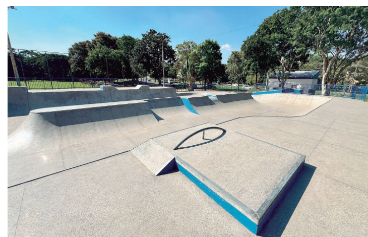
A pista de skate Alexandre Peverari será reinaugurada dia 09 de maio