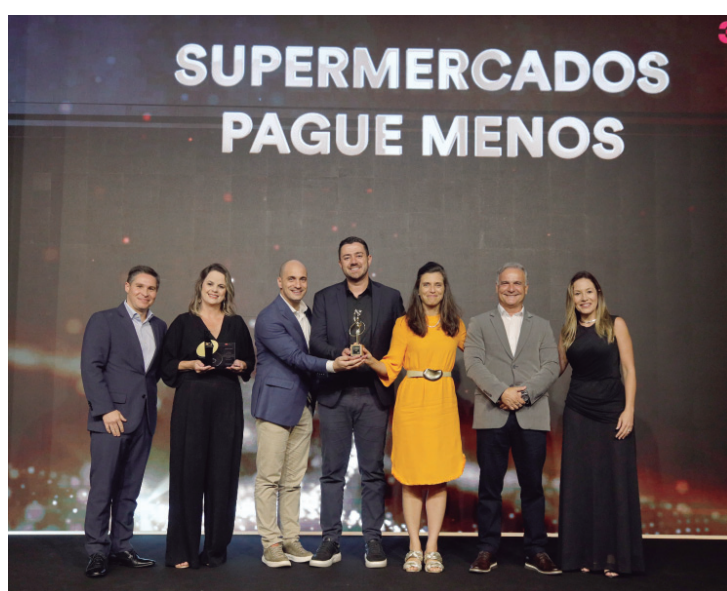
Rede de Supermercados Pague Menos consolida sua posição como referência no setor

Mais do que um troféu, a conquista simboliza o reconhecimento de uma trajetória pautada por eficiência, relacionamento de longo prazo e foco no consumidor. Ao