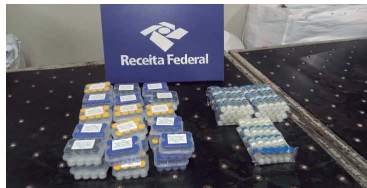
Foram interceptadas mais de 700 remessas expressas que ingressavam no país com falsa declaração de conteúdo.

A operação evidencia o crescimento do mercado ilegal de produtos voltados a desempenho físico e estético. A atuação da Receita Federal reforça o papel da fiscalização aduaneira na proteção da sociedade, no combate ao comércio irregular e na prevenção de riscos aos consumidores.