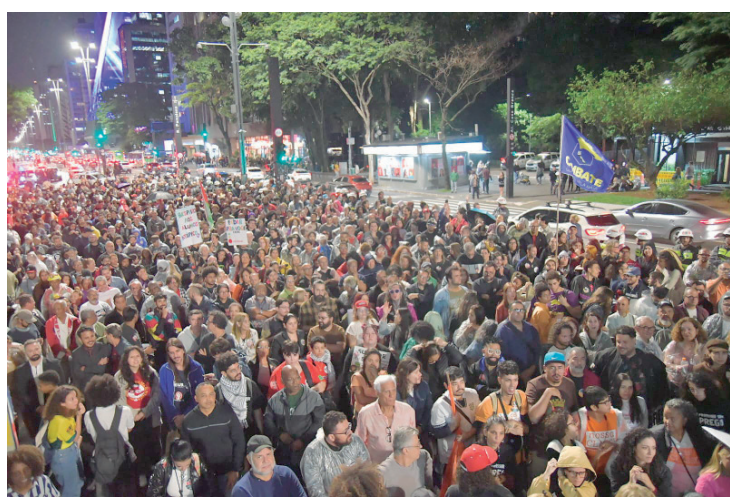
Professores em greve, na avenida Paulista, no início da noite do último dia 10