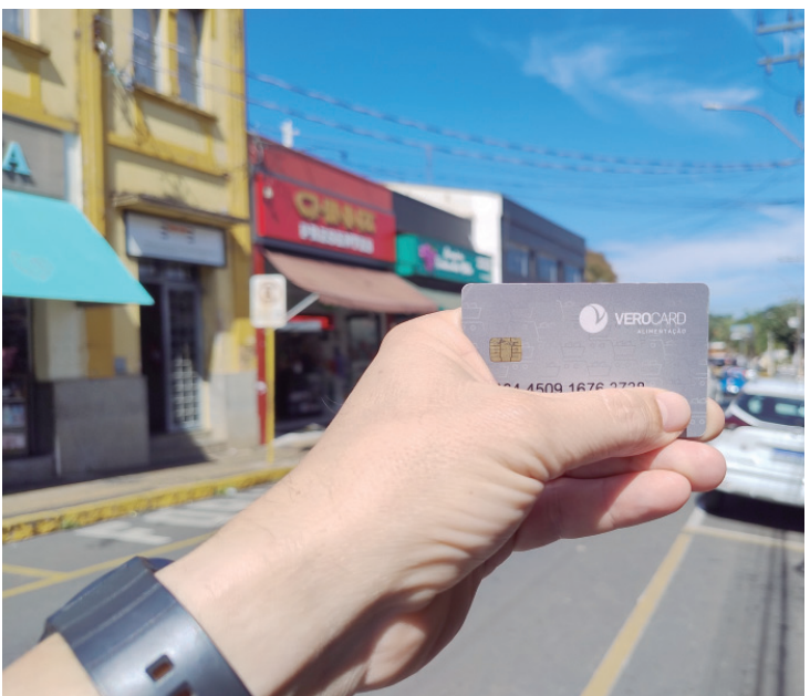
Vale Alimentação também terá reajuste

dos servidores. A medida representa um incremento de aproximadamente R$ 6 milhões na economia, gerando impacto direto no desenvolvimento da cidade além de garantir que o funcionalismo tenha seus salários ajustados de forma justa.