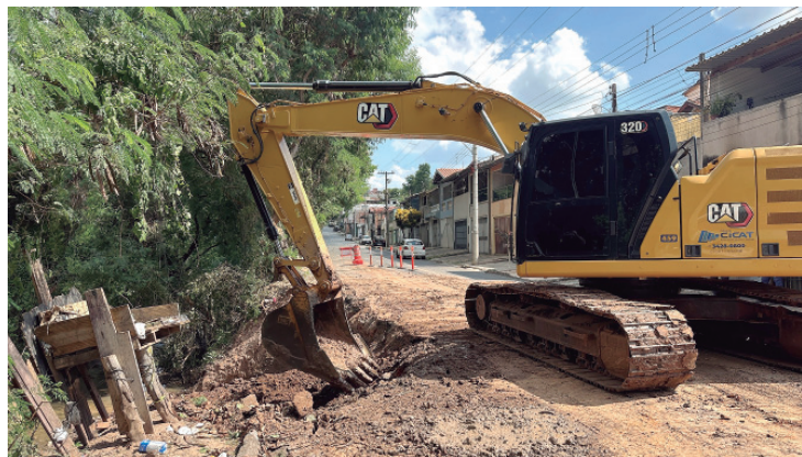
O trabalho tem como principal objetivo conter o avanço da erosão e estabilizar a margem do córrego, evitando que o processo natural de desgaste continue se aproximando