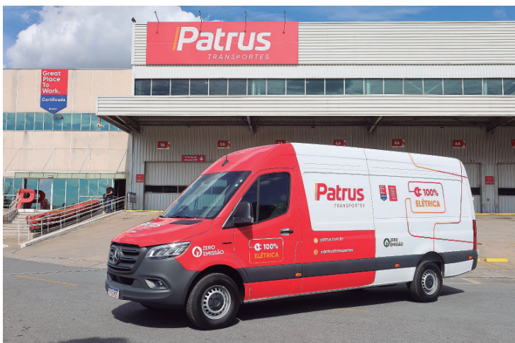
Nova frota da Patrus Transportes reduz impactos ambientais nas operações de last mile