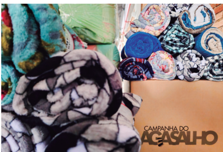
Iniciativa arrecada roupas e cobertores para atender pessoas em situação de vulnerabilidade durante o inverno