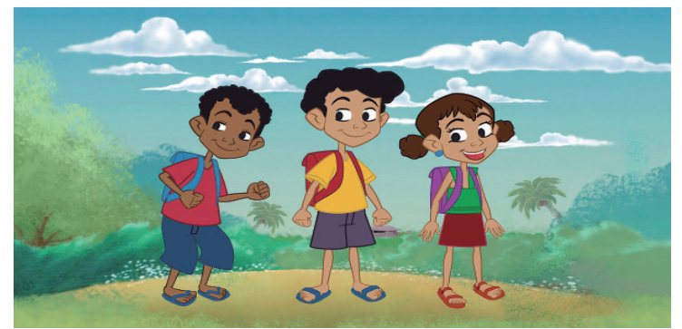
A Baleia Mágica retrata amizade e descobertas na infância