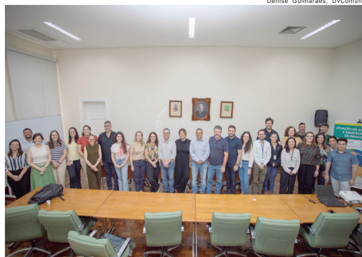
Prefeitura e Esalq alinham ações para impulsionar a agricultura no município

A expectativa é que a articulação entre a Universidade de São Paulo (USP), por meio da Esalq, e a administração municipal resulte em iniciativas inovadoras, capazes de impulsionar o desenvolvimento rural de forma integrada e sustentável em Piracicaba. "O