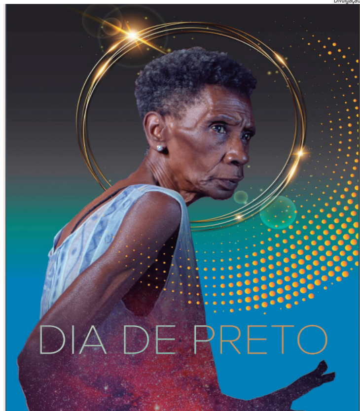
Filme Dia de Preto propõe um olhar sensível e crítico

público, visando a restabelecer as condições adequadas de uso da praça para garantir mais segurança, bem-estar e qualidade de vida para os moradores da região.