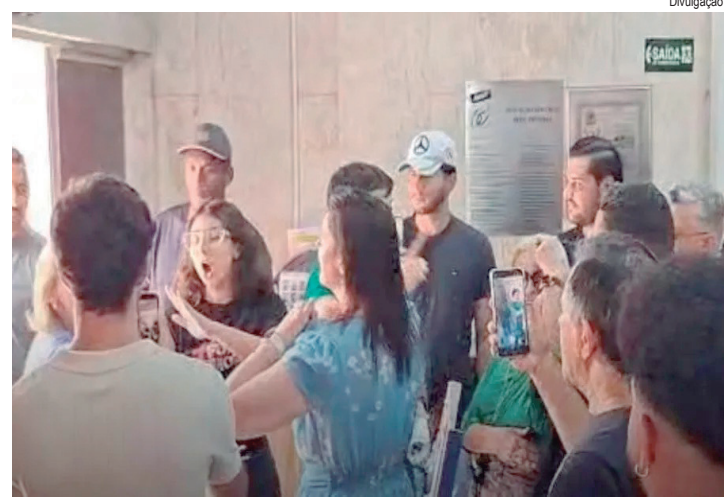
Vereadores do PL invadiram a sede da Apeoesp e jogaram pés de frango nos funcionários