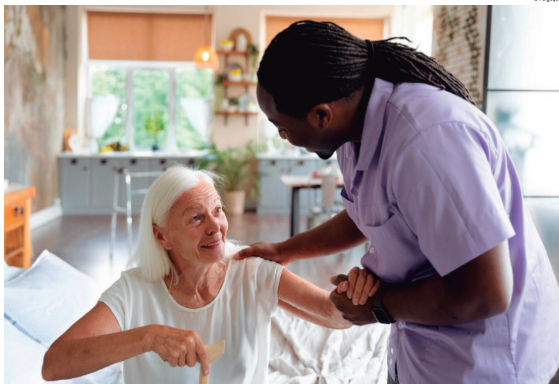
Especialistas alertam para sinais aparentemente inofensivos

"Na maioria dos casos, esse processo ocorre de forma lenta e progressiva. O que costuma aparecer primeiro são pequenas variações no ritmo do idoso: ele passa a caminhar mais devagar, se cansa com mais facilidade ou começa a evitar atividades que antes fazia naturalmente. Quando percebidas no