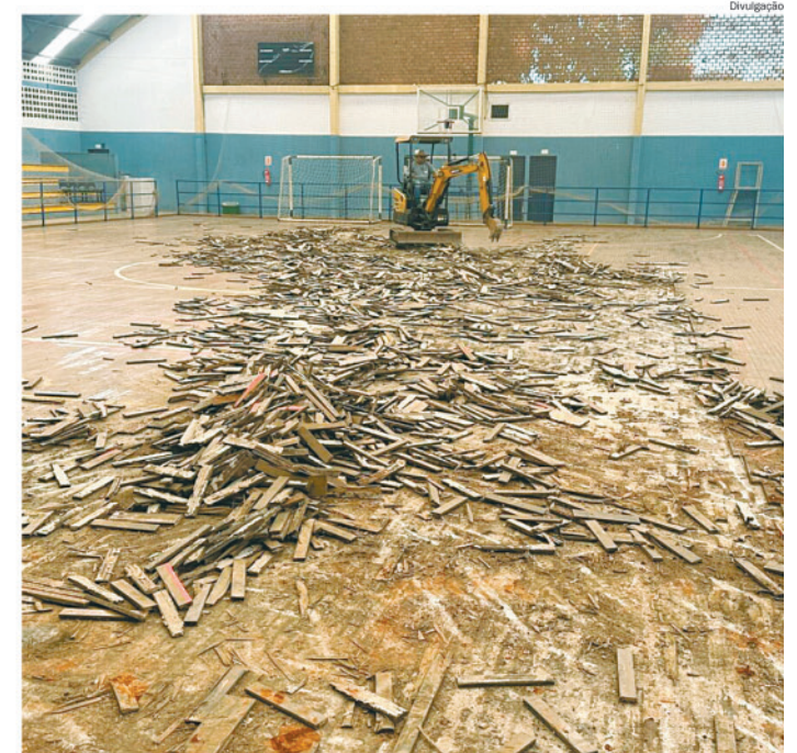
Ao todo, 14 espaços esportivos do município serão beneficiados