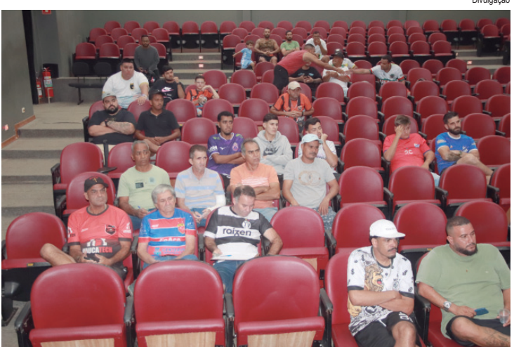
Sorteio foi acompanhado por representantes das equipes

Na segunda-feira, dia 13, foram realizados os sorteios dos confrontos na primeira fase. O sorteio foi acompanhado pelos representantes dos times e também transmitido ao vivo pelas redes sociais da Prefeitura para dar transparência ao todo processo. Os jogos têm início dia 26 de abril, às 8 horas, no Estádio Massud Coury.