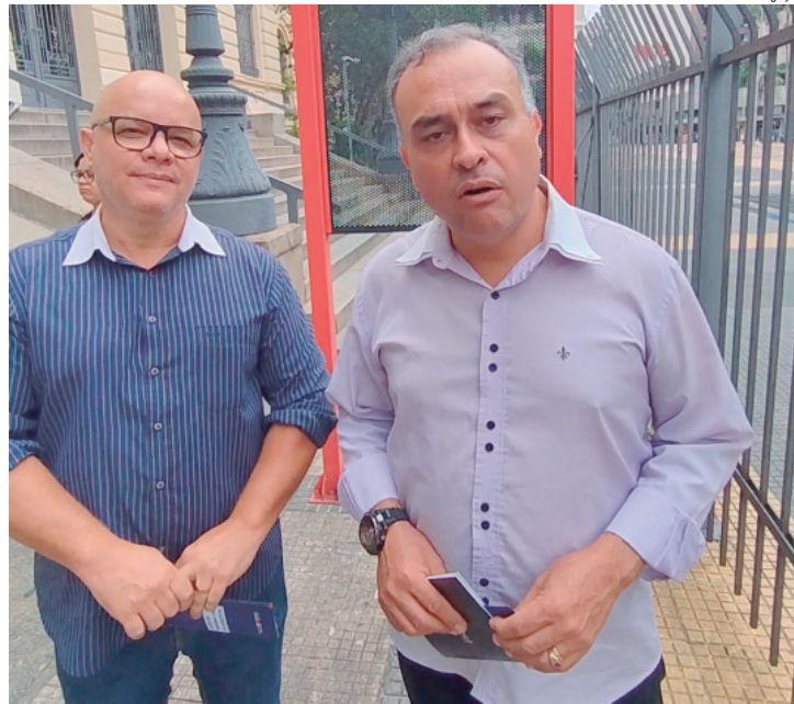
Secretário municipal e presidente da Câmara foram até São Paulo cobrar governo do estado

A notícia que trouxeram foi que os convênios foram renovados e que o estado irá dar andamento na construção.