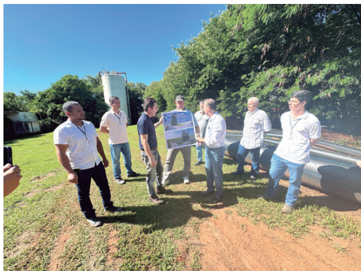
Prefeito Helinho Zanatta durante visita as obras de nova adutora e das instalações de dois novos reservatórios na região da Torre de TV

Os novos reservatórios, com investimento de R$ 10,7 milhões, terá início em breve. Atualmente, a estrutura existente é insuficiente para atender à demanda crescente, o que reforça a necessidade da ampliação. "Esses dois novos reservatórios vão beneficiar os pi-