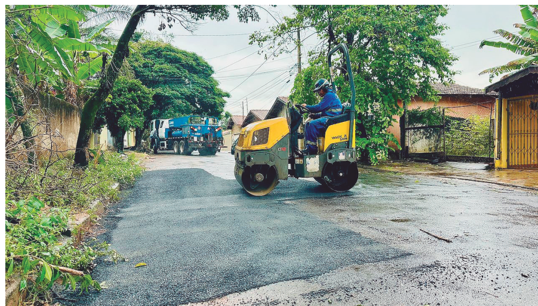
Rua Amadeu Castanho, no Vila Fátima, foi uma das vias a receber a operação tapa-buraco

Confira os bairros e respectivas vias atendidas: Água Branca - Avenida Laudelina Cotrim de Castro, Edne Rontani Bassette, Alcebiades Camolesi, Macapá e Santa Catarina; Alto da Pompeia - rua João Stella Júnior; Areão - avenida Rio Claro; Bosques do Lenheiro - rua das Oliveiras e das Sapucaias; Caxambu - rua Ernani Braga; Centro - rua Professor Benedito Dutra Teixeira; Dois Córregos - rua Professor José Agostinho Forti; Garças - avenida José Alvorada Castro e Elias de Almeida Prado; Jaraguá - rua Botucatu e rua Santos; Jardim Brasil - rua Ruth da Silva Corrêa; Jardim Camargo - rua Presidente Venceslau Braz; Jardim Elite - rua Riachuelo; Jardim Itapuã - Rua Bastos, Cafelândia, Feliciano Ferreira da Cunha, Garça, Rancharia e Pedro Haberchian; Jardim Nova Iguaçu - rua Felisberto Pinto Monteiro e João Miguel Japur; Jardim Tatuapé - avenida Jaú; Jardim Alvorada - rua Sargento Laércio Pinto; Jardim Astúrias - rua João Tedesco; Jardim Monumento - rua Acácio do Canto; Mário Dedini - rua Josaphat