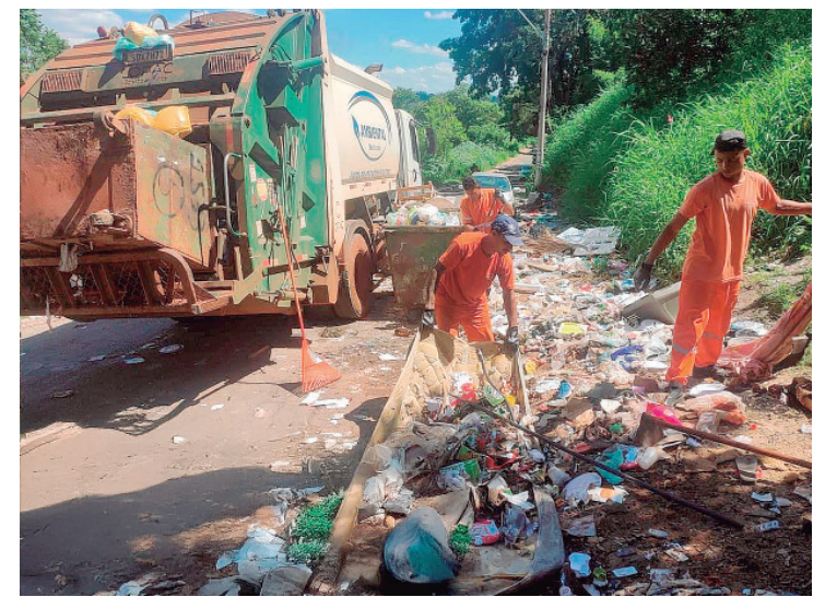
A área estava tomada por lixo; limpeza teve início no sábado, 11

SERVIÇO Mais informações sobre a Orquestra Sinfônica de Piracicaba podem ser obtidas nas redes sociais: Instagram, Facebook: @sinfonicapiracicaba e site https://osp.art.br/