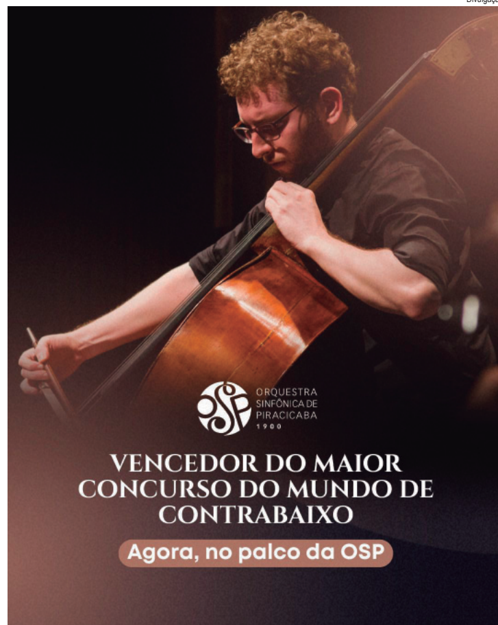
Público também poderá participar do Prelúdio OSP, realizado às 18h45

Assinantes OSP - O programa Assinantes OSP - Temporada 2026 oferece acesso antecipado aos concertos, sem burocracias ou filas, com assento fixo ao longo da temporada. Entre os benefícios estão a prioridade de renovação para 2027, o recebimento do CD OSP - Concerto Místico para Cello e Orquestra, participação no Prelúdio OSP e o compromisso social: