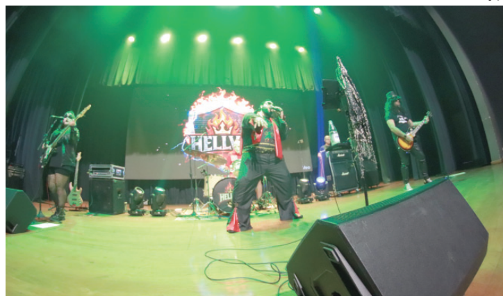
Rock Beneficente teve apresentação das bandas Clube dos 27 e Hellvis