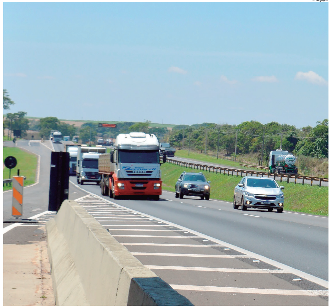
Concessionária recomenda cautela aos motoristas principalmente nos períodos em que o trânsito é mais intenso

Obras suspensas - Em função do aumento significativo no número de veículos, a programação