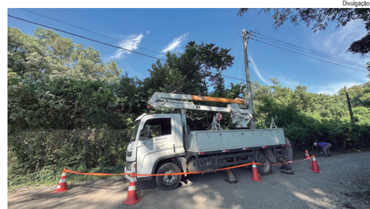
Melhorias no sistema de iluminação alteram horário de funcionamento do Engenho Central

LEIA A TRIBUNA EM NOSSO SITE: www.tribunapiracicabana.com.br