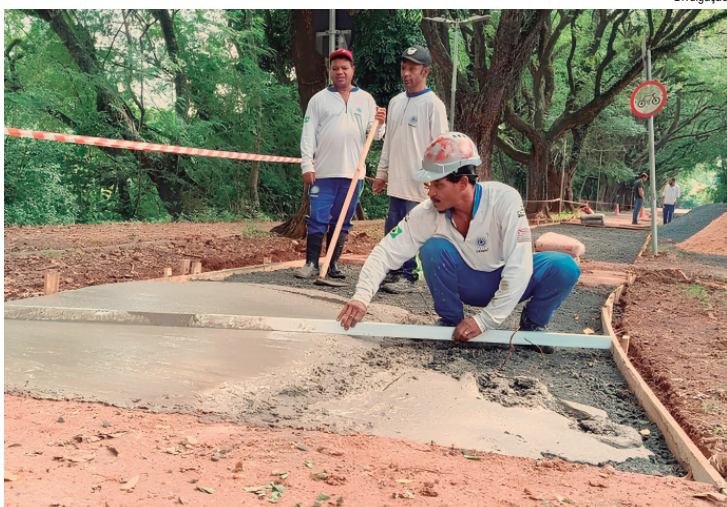
Etapa inclui nivelamento do trecho para garantir uma superfície lisa e uniforme

Os recursos podem apoiar projetos apresentados por órgãos da administração pública direta e indireta no âmbito estadual e municipal; organizações não governamentais; organizações sociais; organizações da sociedade civil de interesse Público; e entidades civis sem fins lucrativos que tenham por finalidade a atuação nestas áreas.