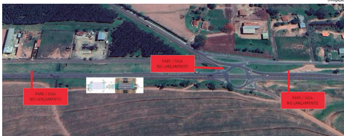
Operação será nesta quinta-feira e terá Pare e Siga para garantir segurança durante içamento das estruturas

A Eixo SP informa que todo o trecho estará devidamente sinalizado, com o objetivo de alertar e orientar os motoristas. A concessionária recomenda que os condutores redobrem a atenção e respeitem a sinalização e as orientações das equipes operacionais durante a execução dos serviços.