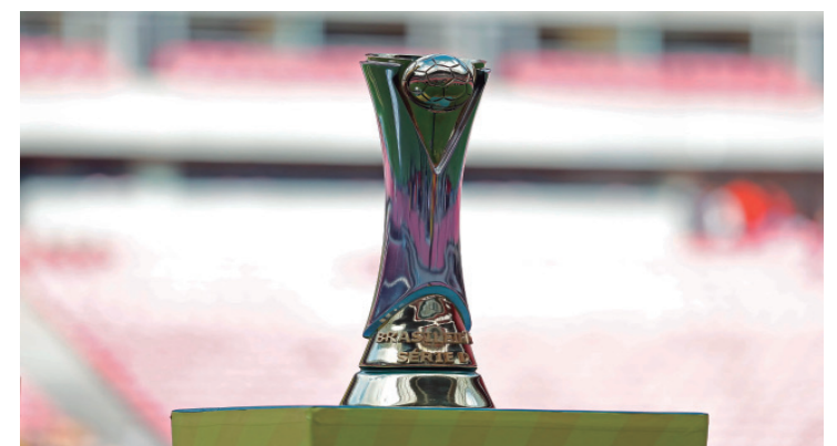
Objeto do desejo das 96 equipes em disputa, além do troféu, serão seis vagas para a série C 2027

Jogos grupo A13 - 11/04/2026 15h00 Madureira x Água Santa - Aniceto Moscoso RJ; 11/04/2026 19h00 Portuguesa x Pouso Alegre - Canindé SP. Jogos grupo A14 - 11/04 18h00 Noroeste x XV de Piracicaba - "Alfredão" SP; 11/04 19h00 Velo Clube x Sampaio Correa - "Benitão".