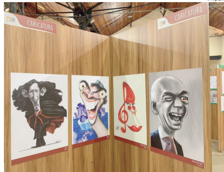
Humor estimula a criatividade e o pensamento crítico