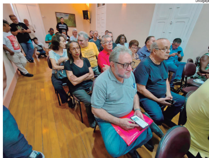
Lideranças de diversos segmentos participaram do lançamento do Comitê de Luta