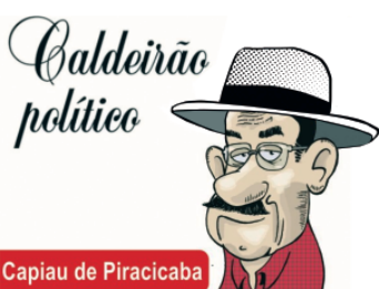
Capiau de Piracicaba

ficção com foto e o Cartão Nacional do SUS. A vacinação ocorre de segunda a sexta-feira, das 8h às 15h, em todas as Unidades Básicas de Saúde (UBSs) e Unidades de Saúde da Família (USFs), exceto a UBS Paulista (antigo Crab). Na UBS Centro, é possível fazer a vacinação também no horário estendido, das 17h às 20h. O esquema vacinal é composto por duas doses, com intervalo de três meses entre elas. Em feriados e pontos facultativos, não há vacinação. Também teve início a vacinação pra profissionais de saúde, com prioridade para os agentes comunitários de saúde.