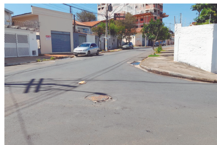
Indicação de autoria do vereador Pedro Kawai aponta problemas estruturais na drenagem da rua Valentim do Amaral e pede vistoria técnica no local

A revisão dos valores, que leva em conta as bandeiras tarifárias, reduz na prática a cobrança. Com a atualização, os valores para residências passam a ser de R$ 3,06 para consumo de 1 a 50 kWh, R$ 4,59 para 51 a 100 kWh e R$ 7,64