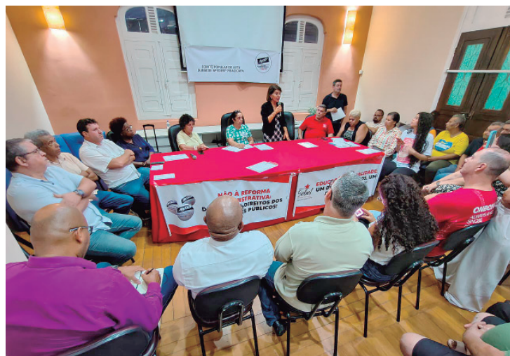
O lançamento do Comitê de Luta foi realizado na subsede da Apeoesp e reuniu lideranças da cidade e da região