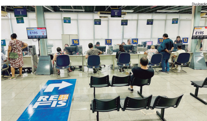
Atendimento especial no Centro Cívico facilita negociação de dívidas com descontos