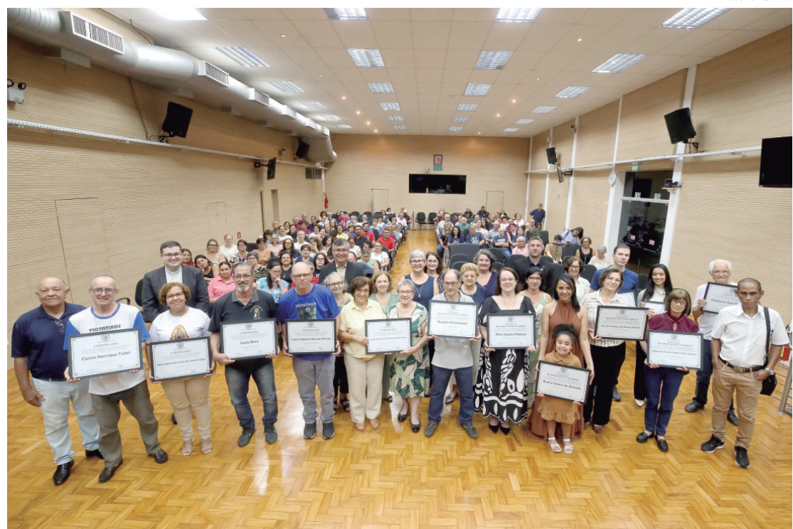
Solenidade aconteceu na noite de terça-feira (7), no Salão Nobre da Câmara