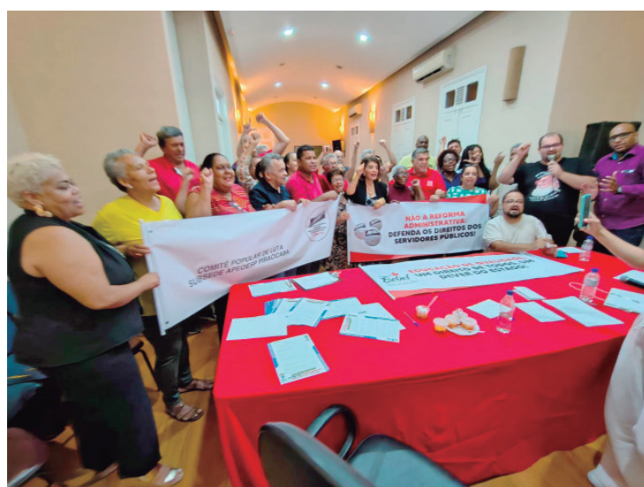
Lançamento do Comitê Regional de Luta reuniu lideranças de diversos segmentos da sociedade