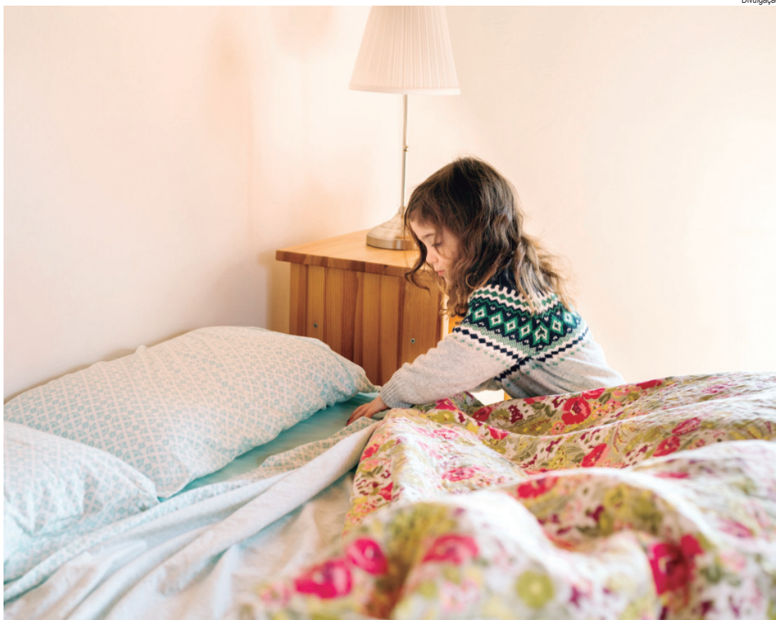
Participação na rotina da casa contribui para desenvolvimento emocional, senso de pertencimento e preparação para a vida adulta