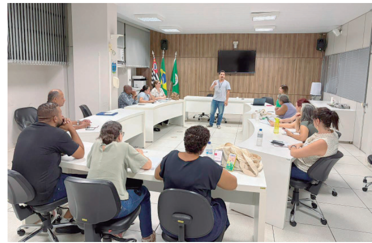
Capacitação em planejamento em saúde realizada para os integrantes do Conselho Municipal de Saúde

O aço ArcelorMittal está presente em grandes obras no Brasil e em alguns dos principais cartões-postais do país, como a Ponte Rio-Niterói (RJ), o Elevador Lacerda (BA), a Arena MRV (MG) e o Memorial da América Latina (SP).