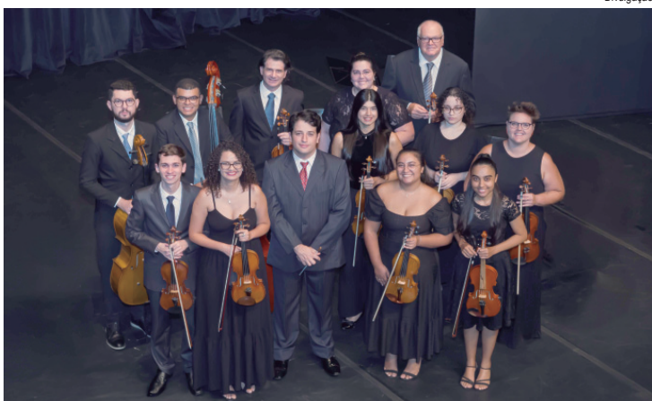
Concerto de domingo contará com duas serenatas de Mozart

Concerto Abertura de Temporada 2026 - Orquestra de Câmara de Cordas de Piracicaba, domingo, 12, às 16 horas, no Teatro Municipal Erotides de Campos (Av. Dr. Maurice Allain, 454). Duração: 50 minutos. Classificação: Livre. Ingressos Gratuitos em www.megabiheteria.com