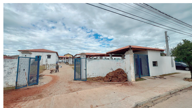
Unidade educacional terá nova estrutura e mais capacidade

Com presença consolidada em 21 cidades do interior paulista, a Rede de Supermercados Pague Menos segue investindo em ações que valorizam o consumidor e fortalecem a relação de confiança construída ao longo dos anos. O Super Saldão Pague Menos é mais uma dessas iniciativas que unem preço, qualidade e conveniência em um só lugar. Para conferir os endereços e horários de funcionamento, acesse o site oficial: superpaguemenos.com.br/unidades