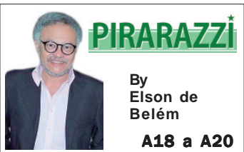
By Elson de Belém A18 a A20

A mensagem que formaliza a indicação de Jorge Messias foi enviada ao Senado pelo presidente Lula (PT) no último dia 31, mas estava parada desde então, em meio à relação desgastada entre Alcolumbre e o petista. Já o anúncio do nome havia sido feito há mais de quatro meses, no dia 20 de novembro.