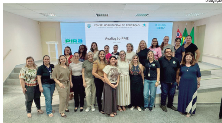
Avaliação do PME reúne representantes de diversos órgãos da educação