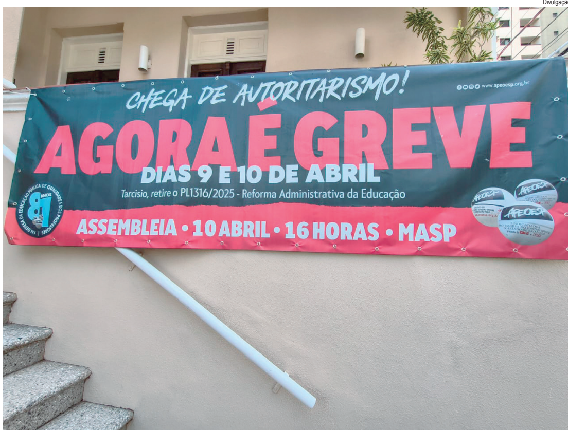
Faixa colocada na subseção da Apeoesp anuncia a greve dos professores da rede estadual de ensino

Neste movimento de greve, coordenado pela Apeoesp, os professores reivindicam reajuste salarial linear para todos, com aplicação do mesmo índice dos policiais, com impacto em toda a carreira; aplicação correta da jornada do piso, com divisão entre aulas com e sem estudantes; retirada do Projeto de Lei 1316/2025, que trata da reforma administrativa da Educação, com ataques ao estatuto do magistério; revogação do modelo de avaliação de desempenho considerado punitivo; garantia de atribuição de aulas de forma presencial e transparente; ampliação da oferta de aulas no período noturno, incluindo ensino regular e EJA; fortalecimento da educação especial inclusiva; convocação de mais professores concursados; pagamento de valores