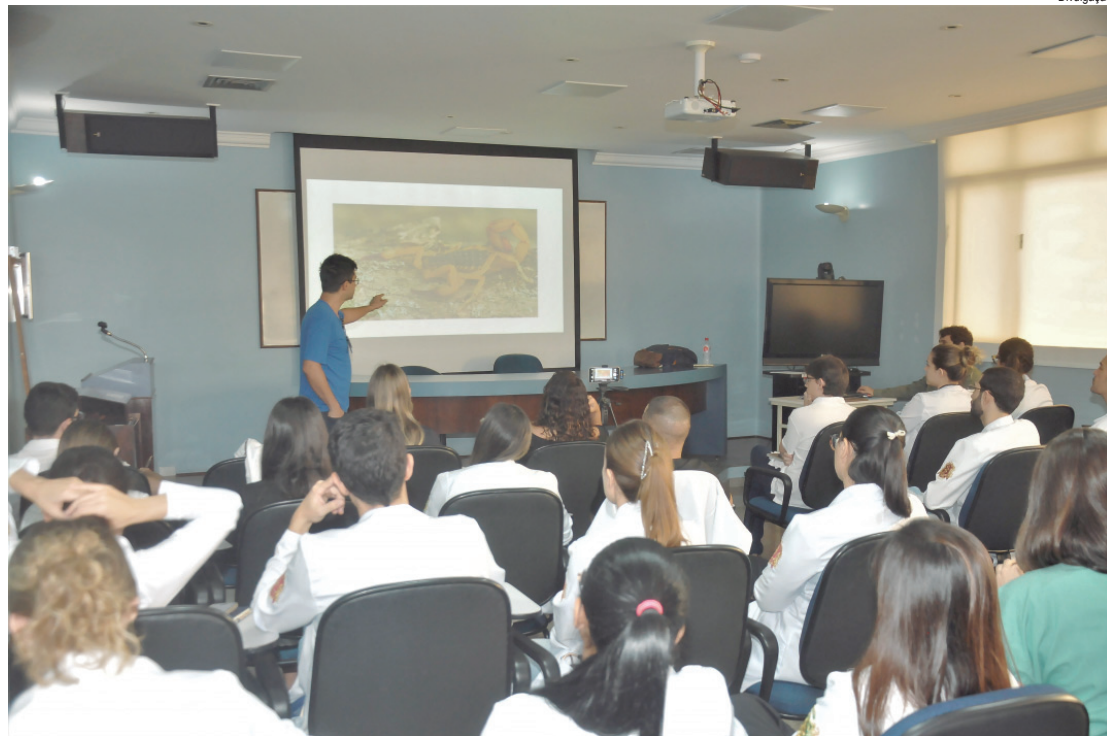
Aula aconteceu na quarta, 8, na Santa Casa de Piracicaba

A Santa Casa de Piracicaba é um dos Centros de Referência do DRS-10 (Departamento Regional de Saúde), que abrange 26 municípios para atendimento especia-