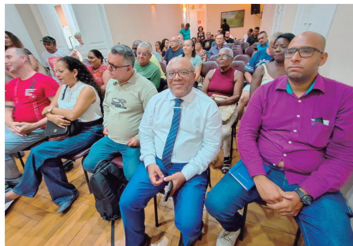
Professores, sindicalistas e lideranças de movimentos sociais participaram do lançamento do Comitê