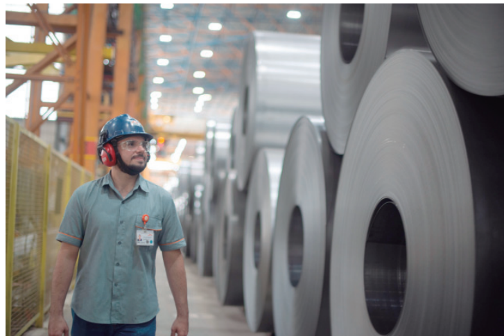
Produtos da maior fabricante de aço no Brasil estão presentes em setores como construção civil, automotivo, infraestrutura e energia

Com o Steligence, é possível reduzir o consumo de materiais,