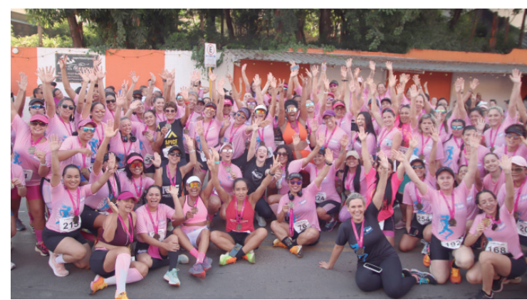
Largada acontece às 7 horas da manhã no estádio municipal