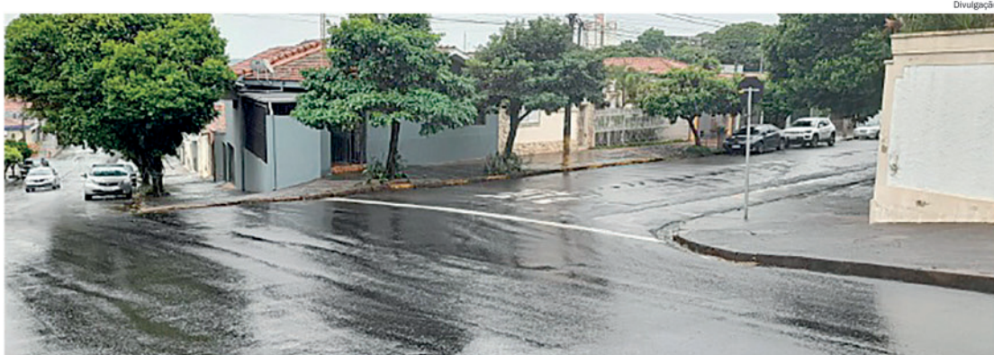
Preocupação é com a falta de canaletas para escoamento de águas pluviais

De acordo com o documento, os locais apresentam deficiência no sistema de drenagem superficial, o que tem causado acúmulo de enxurrada, principalmente durante períodos de chuvas intensas. A situação se agrava porque a água