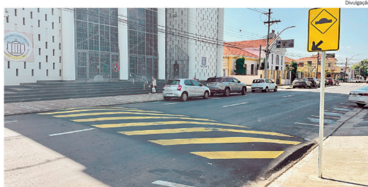
A Avenida Dona Lídia, na Vila Rezende, recebeu a instalação de uma nova lombada e mais cuidadosos, melhorou bastante”, afirmou.

“Já vi algumas colisões graves por aqui. Os veículos e motos passam em alta velocidade o dia todo. Com a lombada, parece que os motoristas estão mais atentos