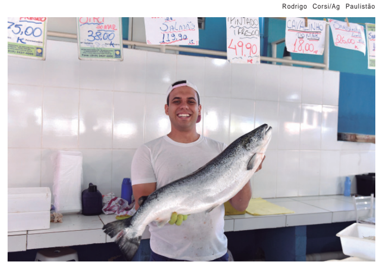
Entre os pescados que serão comercializados estão cascudo, curimatã, corvinas, pacu e tilápia, além de pescados mais nobres, como pintado, filhote e bacalhau fresco

Para reduzir a ocorrência desses episódios, hábitos simples fazem diferença na rotina. "O controle da rinite alérgica, a lavagem nasal com soro fisiológico e o uso de hidratantes ajudam a manter a mucosa saudável, principalmente em períodos secos ou durante infecções respiratórias", orienta. A médica finaliza com um alerta prático: "Evitar ambientes com ar muito seco, como ventiladores fortes e ar-condicionado, além de orientar a criança a não remover crostas ou cutucar o nariz, são medidas importantes na prevenção".