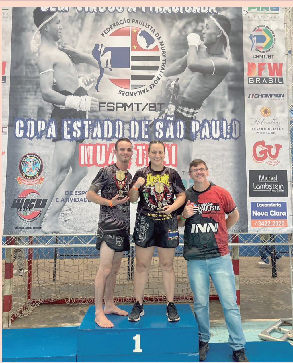
Atletas locais trouxeram cinco medalhas para Rio das Pedras