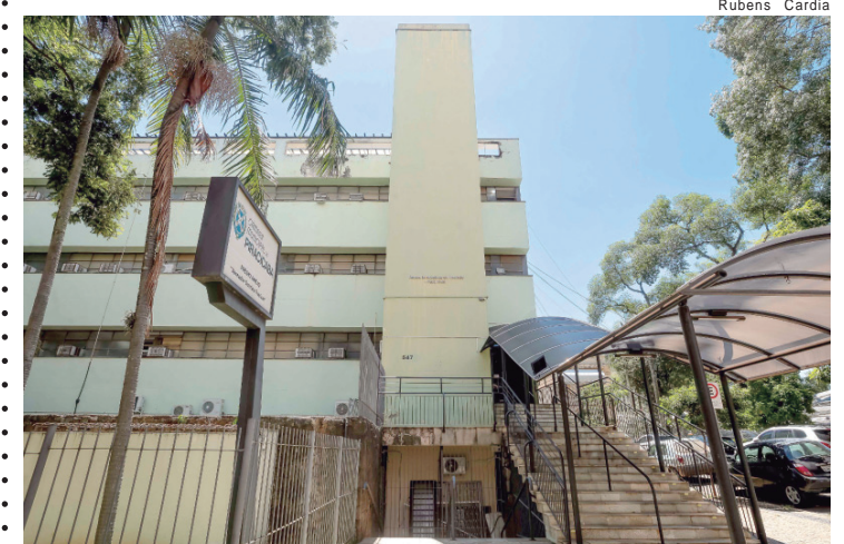
Posse será realizada na sala de reunião do prédio anexo da Câmara

O conselho também atua como espaço de participação social, garantindo que a população tenha voz nas decisões relacionadas à organização e à qualidade do atendimento na rede pública.