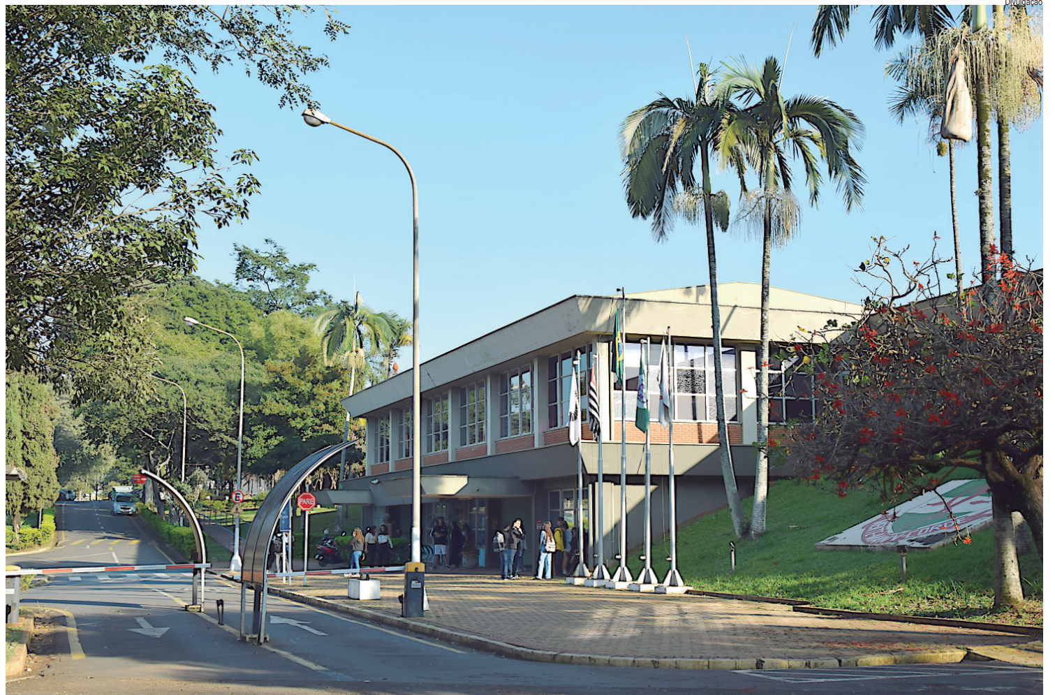
Entre as melhores no mundo, a Faculdade de Odontologia de Piracicaba (FOP) integra a Universidade Estadual de Campinas (Unicamp)