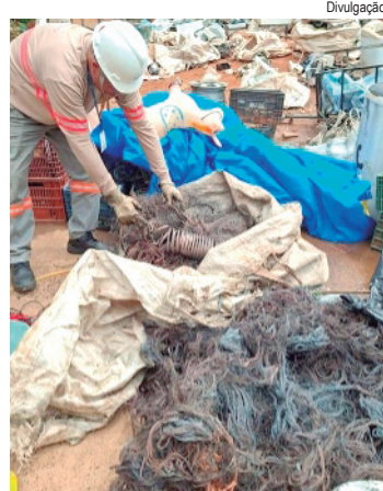
Mais de 6 mil interrupções de energia para clientes foram provocadas por esses crimes em 2025

A CPFL Energia registrou no ano passado um total de 354 equipamentos subtraídos, alta de 26% em relação a 2024. Os furtos de materiais da rede elétrica nas áreas da concessão em São Paulo (CPFL Paulista, CPFL Piratininga e CPFL Santa Cruz) apresentam indícios de profissionalização das ações criminosas e levaram a empresa a ampliar medidas de prevenção e resposta, integrando áreas internas e intensificando a cooperação com as forças de segurança pública.