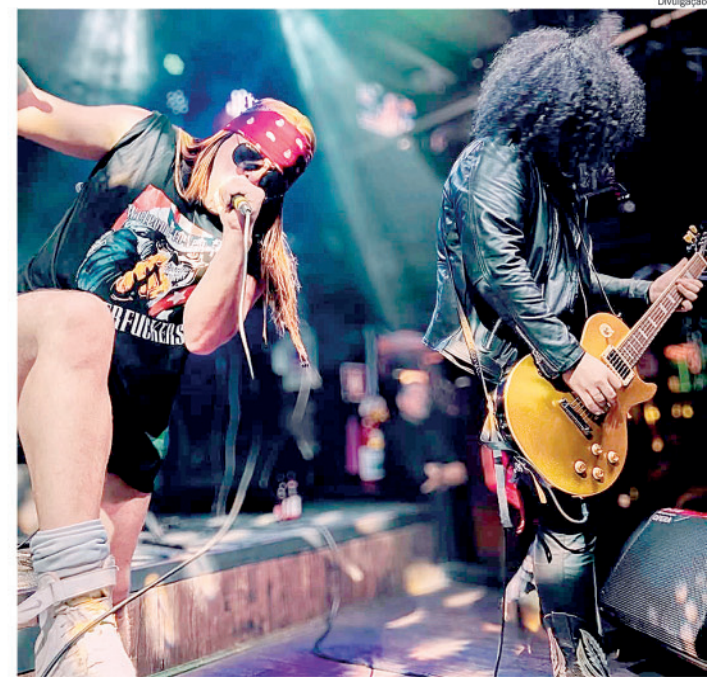
Cover do Guns'n'Roses é uma das atrações deste sábado

No domingo (29), das 9h às 17h, acontecerá o último ensaio para o espetáculo, com todo o elenco, arquibancadas e palcos já montados e demarcando os espaços no Engenho Central.