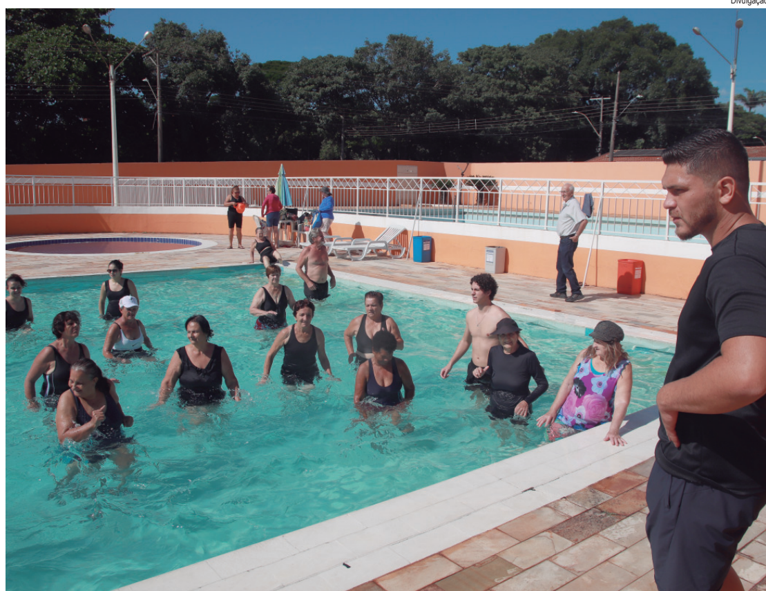
As atividades acontecem todas as quartas-feiras