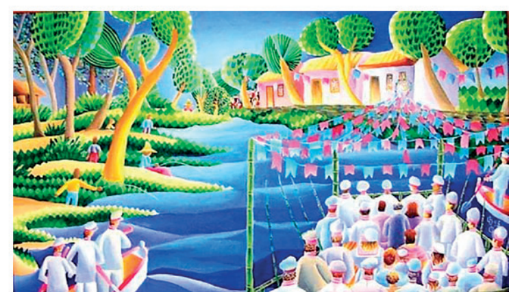
Quadro sobre a Festa do Divino, de autoria de Ciro de Oliveira, CAPA DO LIVRO SOBRE A 197ª FESTA DO DIVINO DE PIRACICABA