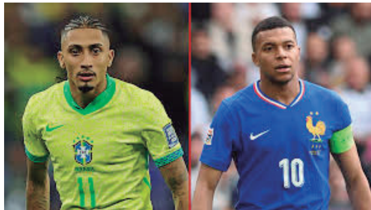
Brasil x França, duelo de grandes forças do futebol mundial e de grandes craques

A França, adversária do Brasil hoje, também tem problemas e