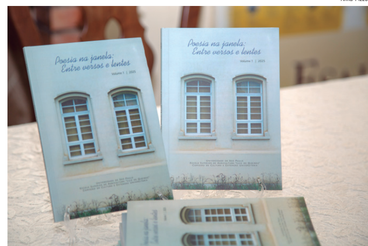
Livro Poesia na Janela: entre versos e lentes