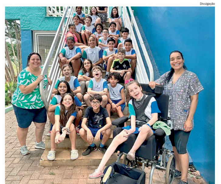
Vagas de cuidador são para atuação nas escolas da rede municipal

VIAS - Avenidas: Primeiro de Agosto, Armando de Salles Oliveira, Dona Francisca, Dona Lídia, Jaime Pereira, Limeira, Luiz de Queiroz, Nilo Peçanha, Pádua Dias, Pompeia, Ralf Benatti, São Paulo, Arquimedes Dutra, Barão de Serra Negra, Av. Antonio Correa Barbosa. Ruas: Bom Jesus, Edu Chaves, João Paulino de Almeida, Adelfo Cavagioni, Altinópolis, Alvares Florence, Américo de Campos, Atibaia, Batatais, Cajuru, Carlos de Campos, Cincinato da Silva Braga, Do Porto, Governador Pedro de Toledo, Moraes Barros, Ignacio da Cunha Caldeira, Jacupiranga, João Tedesco, Padre Fernando Guarda, Tambaú, Samuel Neves, São Tomaz de Aquino. Estrada Rural: Fazenda Santo Antônio.