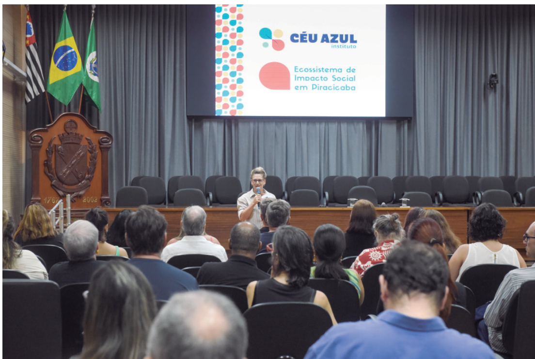
Primeiro encontro, realizado nesta terça-feira (24), abordou o tema: "Fundamentos do Terceiro Setor, Constituição de Organizações e Coletivos"