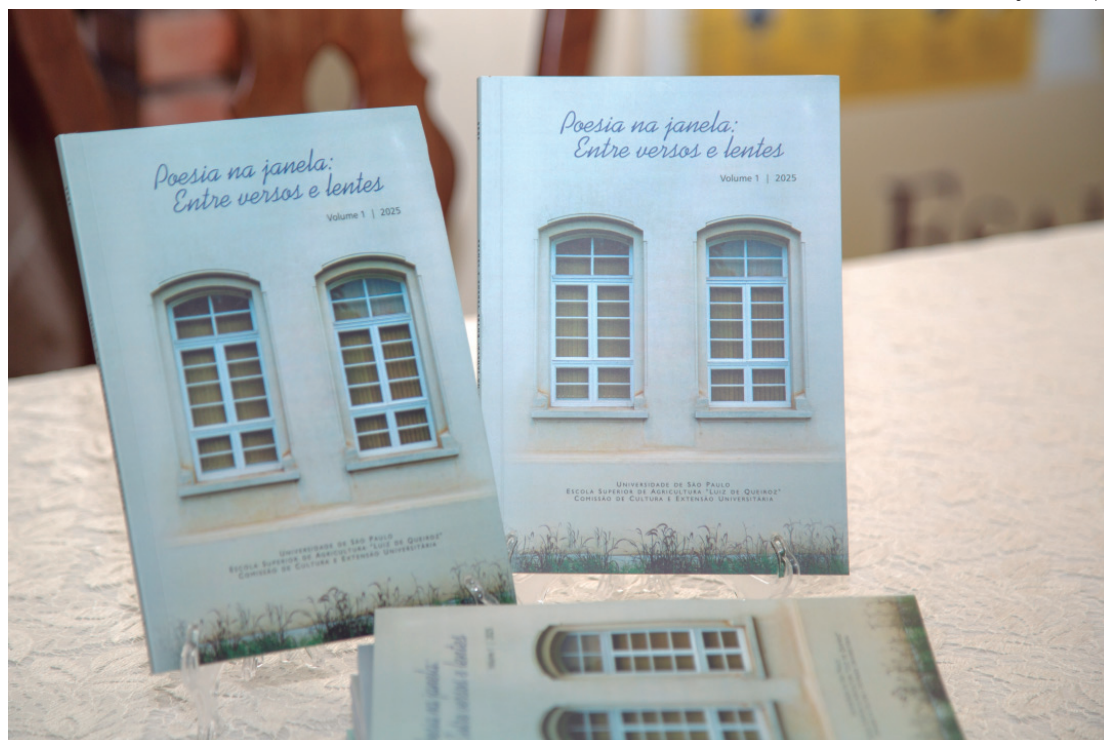
Especialista explica causas mais comuns, relação com alterações no nariz e quando a situação merece investigação

Apesar de ser uma alteração estrutural, a cirurgia nem sempre é a primeira escolha, principalmente entre os pequenos. "A correção cirúrgica deve ser evitada na infância, pois a face ainda está em desenvolvimento. Em situações com maior repercussão clínica, pode ser considerada uma abordagem conservadora, preservando ao máximo a es-