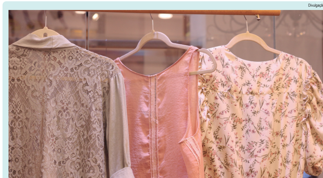
Ação do Procon Piracicaba vai até o dia 2 de abril, especialmente lojas de vestuário e bijuterias

indicador quantifica a exposição institucional em veículos de mídia de alta autoridade indexados no SCImago Media Rankings (SMR). A metodologia detalhada deste indicador pode ser consultada na seção de indicadores. ( https://www.scimagoir.com/methodology.php )