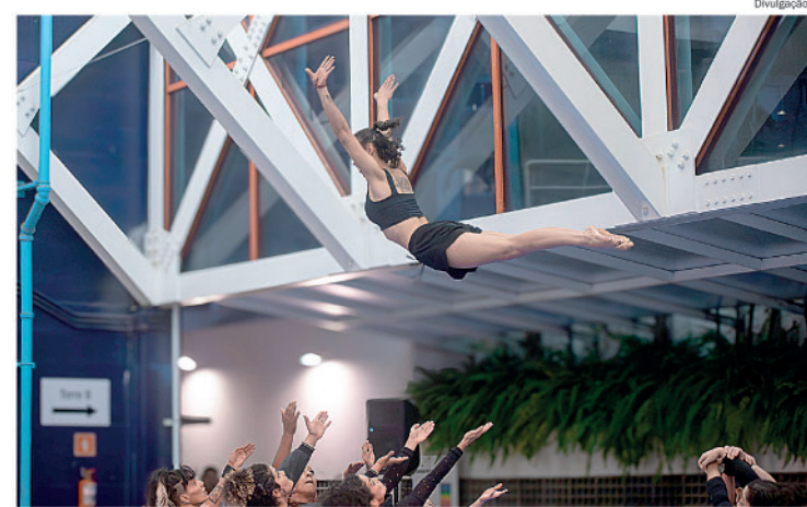
Ao todo, 23 unidades estão envolvidas na realização do projeto