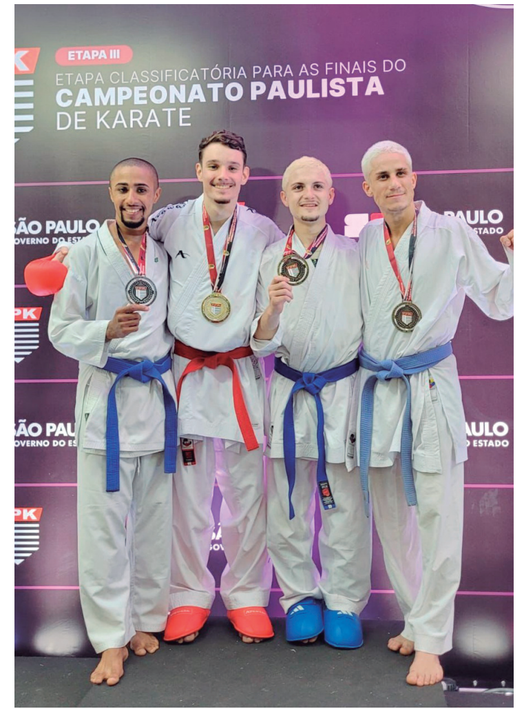
Medalha no peito e classificação à final garantida para o karatê de Piracicaba

Liga Inglesa, Europa League, Conference League e Supercopa da Inglaterra. O zagueiro terá a primeira chance na seleção principal e vai brigar por um espaço na lista final para a Copa do Mundo. Vale lembrar que o elenco francês já havia perdido o atacante Bradley Barcola, cortado por uma lesão no tornozelo, sofrida em jogo do PSG.