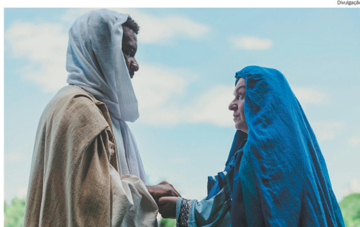
Despedida de Maria

Outra novidade é a inclusão de uma cena inédita: o teste de fé do discípulo Tomé. O episódio, que retrata a dúvida do apóstolo diante da ressurreição de Cristo, será apresentado pela primeira vez na montagem piracicabana, ampliando a abordagem dramática e teológica da encenação.