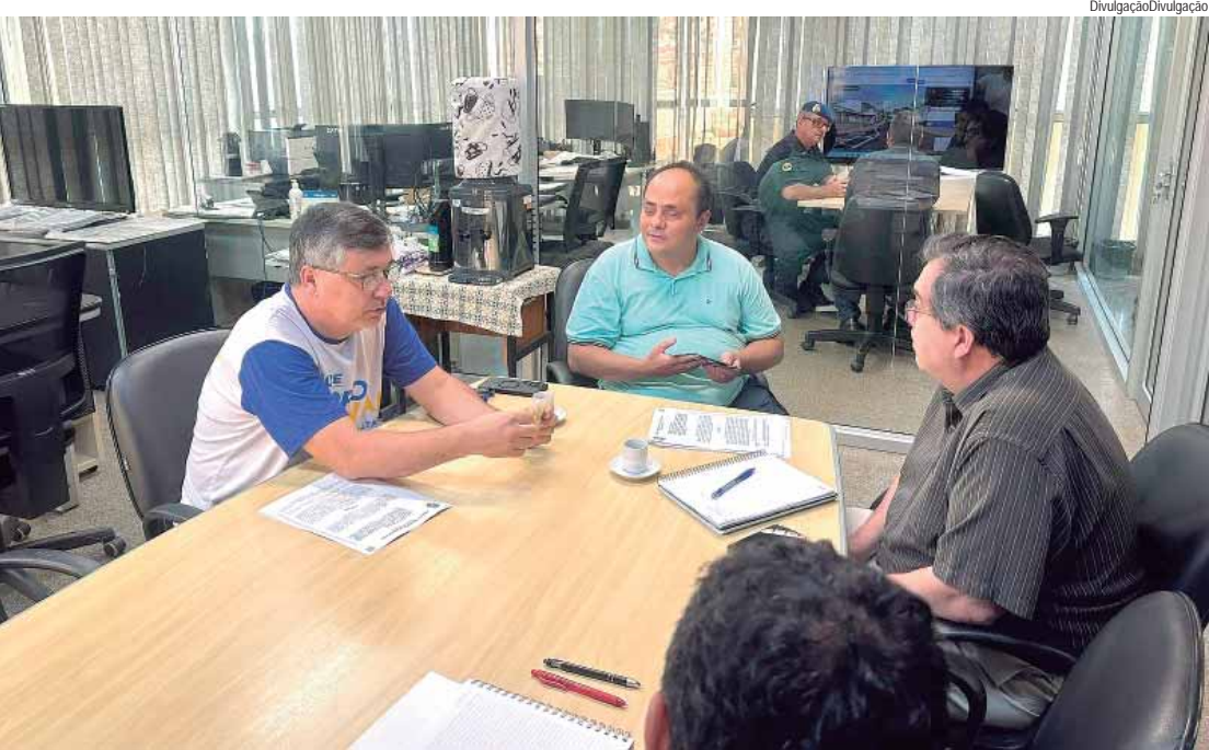
Cartão do transporte coletivo poderá ser renovado sem a necessidade de reapresentação de laudo médico por pessoas com deficiência irreversível

(PT), defendeu emprego para os professores, atribuição de aulas justas, fim das resoluções autoritárias, como a avaliação de desempenho punitiva e o cumprimento do piso salarial nacional para toda categoria. A9