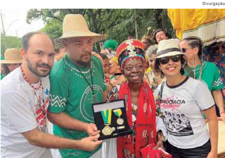
Mama África recebeu a honraria em nome da filha, durante o cortejo pré-carnaval do Baque Caipira