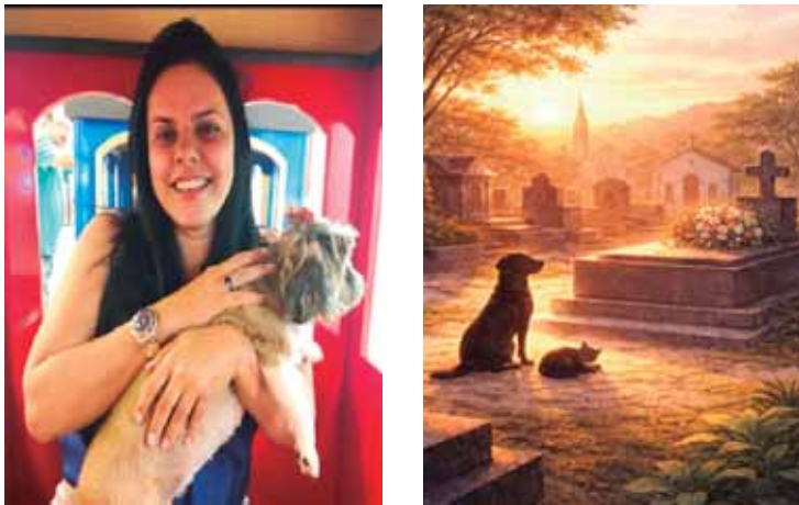
Lei Estadual foi publicada dia 7 de fevereiro de 2026