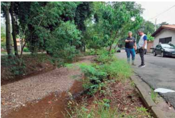
Documentos solicitam zeladoria, limpeza e drenagem no bairro

A indicação 1068/2026 solicita limpeza e desassoreamento do canal do ribeirão localizado entre trechos da Avenida José Ramiro. Segundo relatos de moradores, o ribeirão apresenta elevado nível de assoreamento, reduzindo a capacidade de vazão das águas pluviais. Como consequência, em períodos de chuvas intensas têm ocorrido transbordamentos ao final da avenida, com registros de enchentes e prejuízos à mobilidade urbana. O documento também destaca processo erosivo