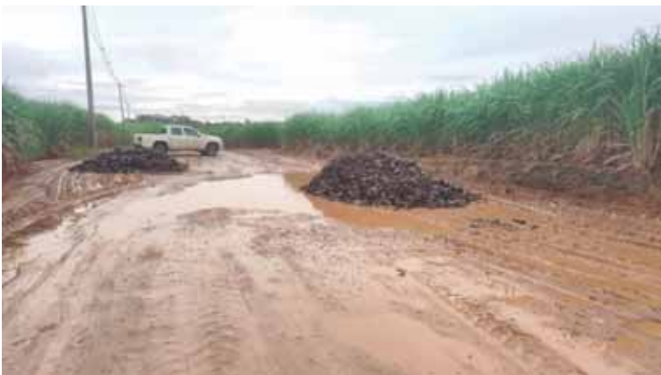
Intervenções seguem após danos provocados pelas fortes chuvas das últimas semanas

Com os pareceres favoráveis, as proposições seguem em tramitação pelas demais comissões da Casa. Já o parecer contrário será encaminhado para votação em Plenário. Se for mantido, o projeto será arquivado. Se o parecer for derrubado pela maioria dos vereadores, a matéria segue em tramitação até voltar ao Plenário para deliberação do mérito.