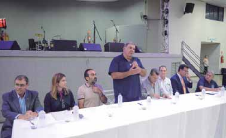
Mesa diretora formada por autoridades no ato da posse