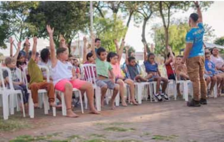
Iniciativa alia tradição cultural, aprendizado e momentos de lazer

SERVIÇO Caminhos Secretos: Caça ao Tesouro. Sábado, 14/02, às 15h. Na Biblioteca Pública Municipal Ricardo Ferraz de Arruda Pinto (Rua Saldanha Marinho, 333 - Centro). Gratuito. Informações: (19) 3433-3674