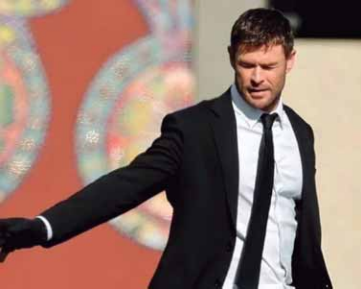
Caminhos do Crime promete ser um grande suspense policial com foco no jogo de gato e rato entre um criminoso e a polícia