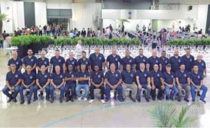
Diretoria eleita gestão 2026-2030