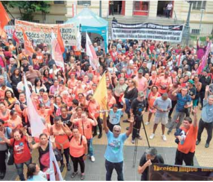
Professores, estudantes, pais e lideranças sociais durante a manifestação em defesa da educação pública de qualidade no Estado de São Paulo