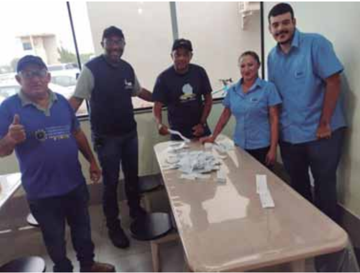
Representantes do Sindicato junto com os trabalhadores