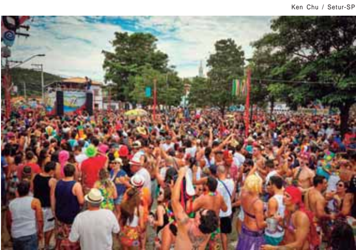
Carnaval em São Luiz do Paraitinga, no Vale do Paraíba, atrai mais de 150 foliões nos cinco dias de folia