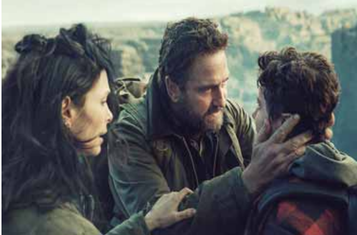
Destruição Final 2 traz Gerard Butler, Morena Baccarin e Roman Griffin Davis vivendo uma família em fuga de um mundo destruído