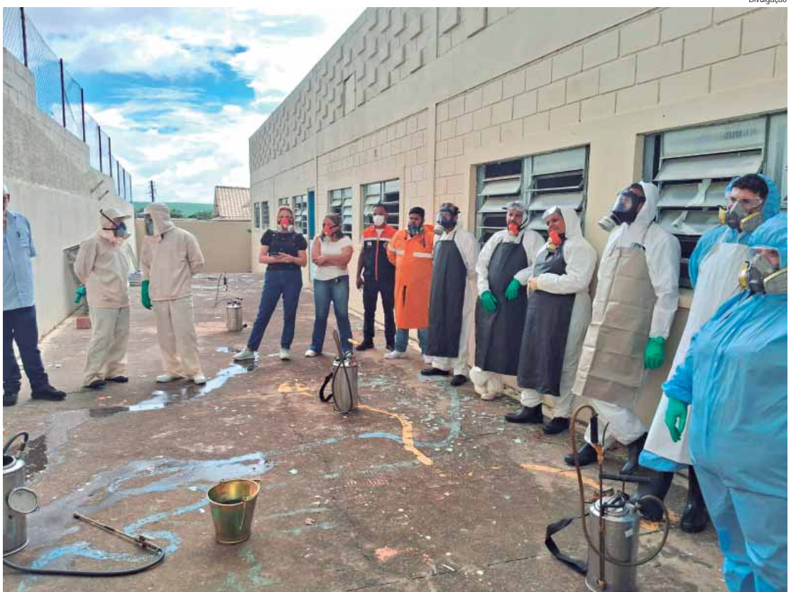
A capacitação foi realizada em parceria com o Governo do Estado

Após fechar 2025 com um dos menores índices de dengue do estado de São Paulo, Rio das Pedras voltou a ser destaque regional no enfrentamento às arboviroses ao sediar um importante treinamento da técnica de Borrifação Residual Intradomiciliar, estratégia utilizada no controle do mosquito Aedes aegypti , transmissor da dengue. A capacitação foi realizada em parceria com o Governo do Estado, por meio do Grupo de Vigilância Epidemiológica (GVE) e da Coordenadoria de Controle de Doenças (CCD), reunindo profissionais dos municípios de Piracicaba, Capivari, Saltinho, Mombuca, Rafard e Elias Fausto. A técnica é aplicada de forma estratégica, principalmente em áreas com maior risco de transmissão, reforçando as ações de bloqueio e prevenção dentro dos imóveis. O treinamento teve como objetivo padronizar procedimentos, atualizar protocolos e fortalecer o trabalho técnico das equipes da região. Ser escolhida como sede do encontro demonstra o reconhecimento do trabalho que vem sendo desenvolvido pela Vigilância Epidemiológica de Rio das Pedras, que tem investido constantemente em qualificação, planejamento e ações preventivas. O com-