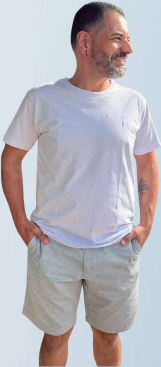
BERMUDA MOOVEXX R$289,90