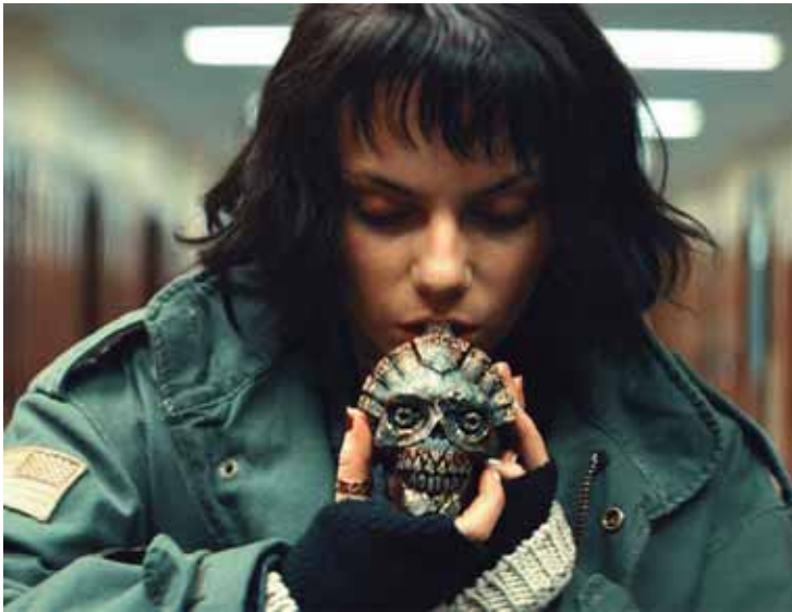
No filme de terror O Som da Morte um grupo de estudantes desajustados invoca uma maldição mortal através de uma lenda asteca