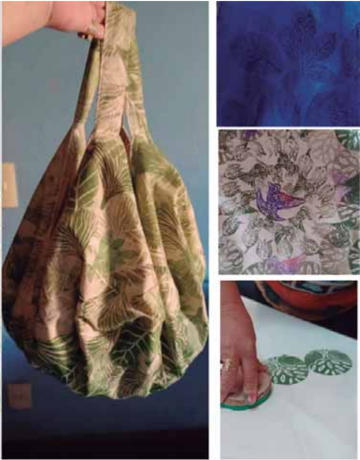
Lilian traz para esta exposição uma síntese de sua maturidade artística