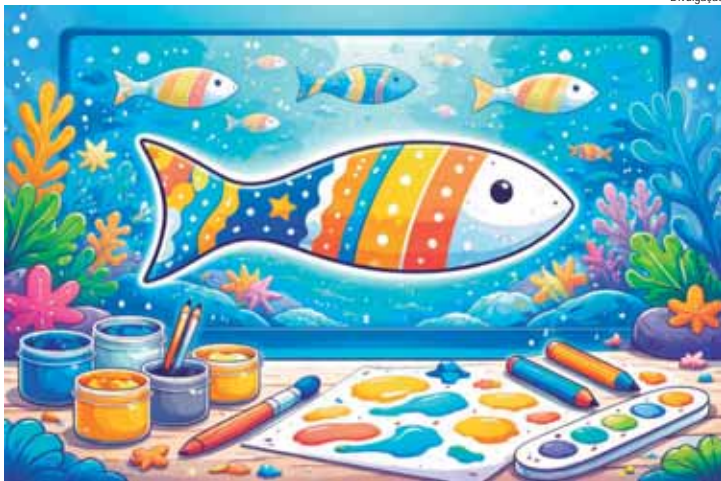
No Aquário Digital, após você colorir um peixe no papel, o verá surgir em 3D