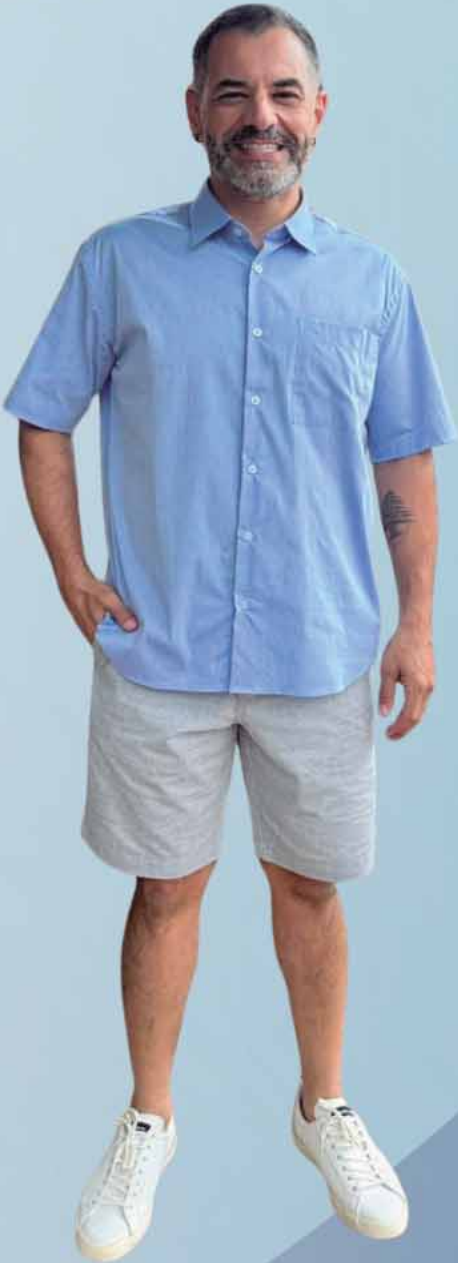
CAMISA FIO EGÍPCIO R$ 259,90