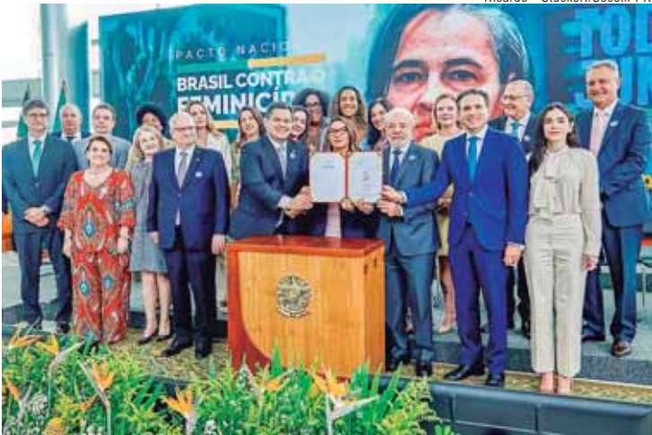
O Pacto Nacional - Brasil contra o Femicídio é uma resposta dos Três Poderes à escalada da violência de gênero, traduzida na alarmante estatística de quatro vítimas de feminicídio a cada 24 horas no país

PRIORIDADE - Ao unir os Três Poderes em uma ação coordenada e permanente, o pacto reforça a prioridade do tema na agenda nacional e convoca estados, municípios e a sociedade a atuarem de forma conjunta no enfrentamento à violência contra mulheres e meninas. A iniciativa estabelece uma atuação inédita, coordenada e permanente en-