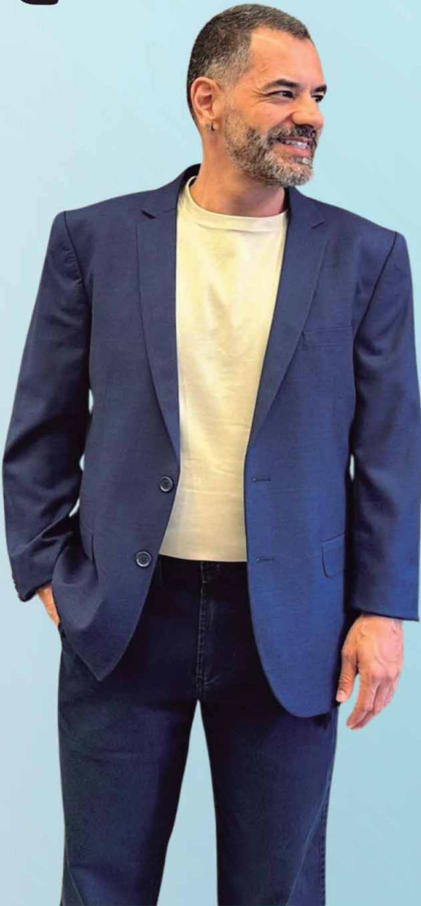
BLAZER R$ 1199,90