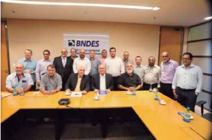
Sindicalistas reunidos com o vice-presidente Geraldo Alckmin na sede do BNDES em São Paulo

Esse encontro visou contribuir para a construção de políticas públicas mais eficazes, que conciliem desenvolvimento econômico, justiça social e valorização dos trabalhadores, reforçando o papel do setor da alimentação como pilar essencial para o crescimento do país.