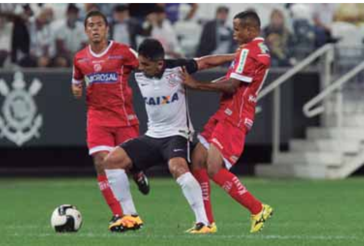
Na história entre os dois clubes, só deu Corinthians com duas vitórias em dois jogos

A programação de trabalhos segue ao longo da semana, com foco total no duelo fora de casa, em mais um compromisso importante do Nhô-Quim na busca pelos objetivos na competição estadual.