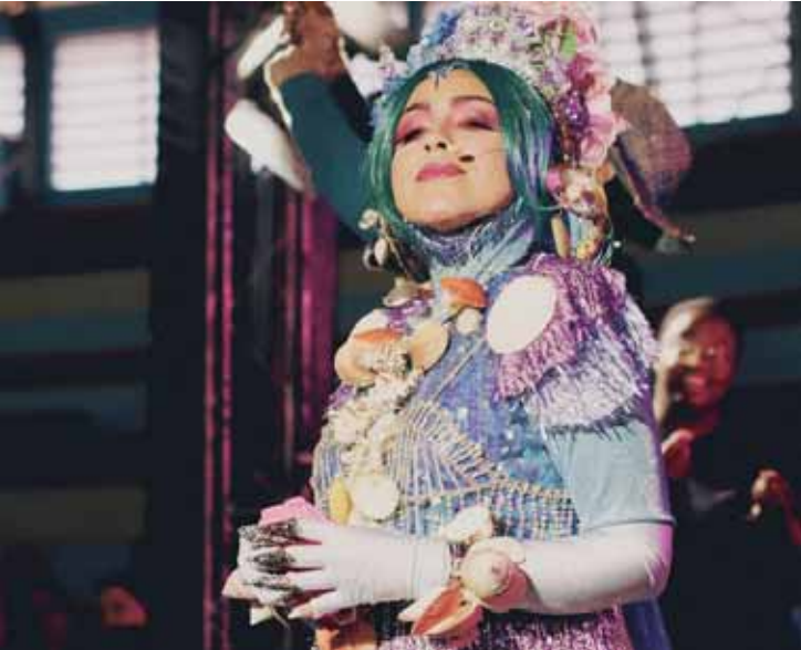
Cultura popular e preservação do meio ambiente norteiam o projeto artístico

Circuito Cultura e Família: Aldeia Encantada. Sábado, 7/02, das 16h às 20h. Galpão 10, do Engenho Central (Av. Dr. Maurice Allain, 454 - Vila Rezende). Gratuito. Informações: @circuito.culturafamilia