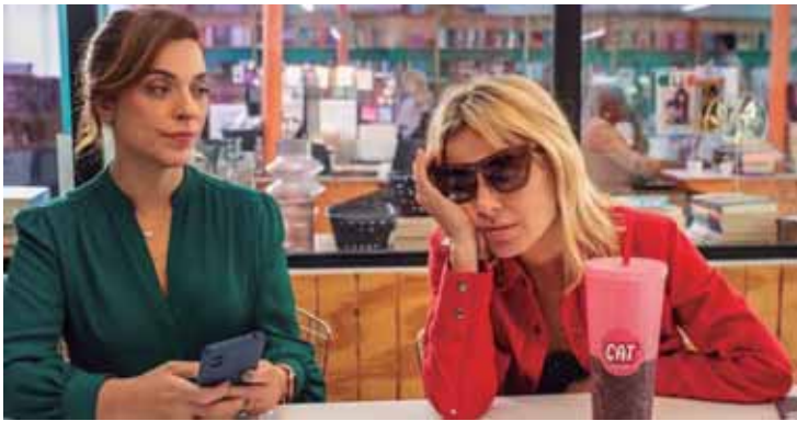
Em sua melhor atuação no cinema, Carolina Dieckmann retrata a luta de uma mulher contra o alcoolismo no intenso drama Descontrole

"STRAY KIDS: THE DOMINANT EXPERIENCE" é um filme-concerto que registra os bastidores e as performances icônicas dos shows esgotados da boy band sul-coreana "Stray Kids" (SKZ), composta por oito integrantes. O grupo é uma das maiores sensações do K-pop. O filme oferece um retrato íntimo e inédito da conexão da banda com seus fãs e da jornada pessoal de cada integrante.