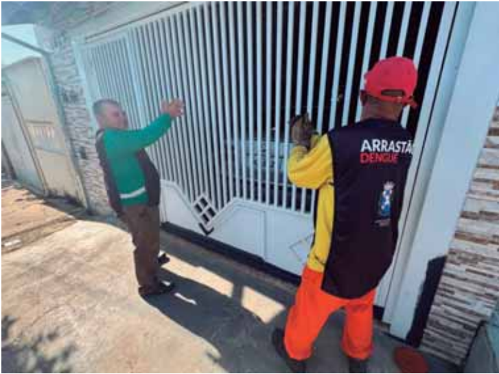
Equipes percorrem bairros nos arrastões realizados durante todo o ano

A campanha Juntos contra a Dengue está em sua 9ª edição e foi