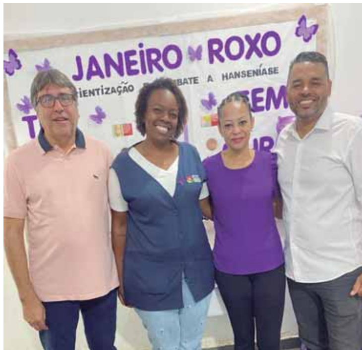
A campanha reforça a importância de ficar atento aos sinais e sintomas

de buscar atendimento nas unidades de saúde. O diagnóstico precoce e o tratamento adequado, oferecidos gratuitamente pelo SUS, são essenciais para evitar complicações e garantir mais qualidade de vida. A principal recomendação é que mesmo após o término da campanha, o cuidado deve continuar o ano todo.