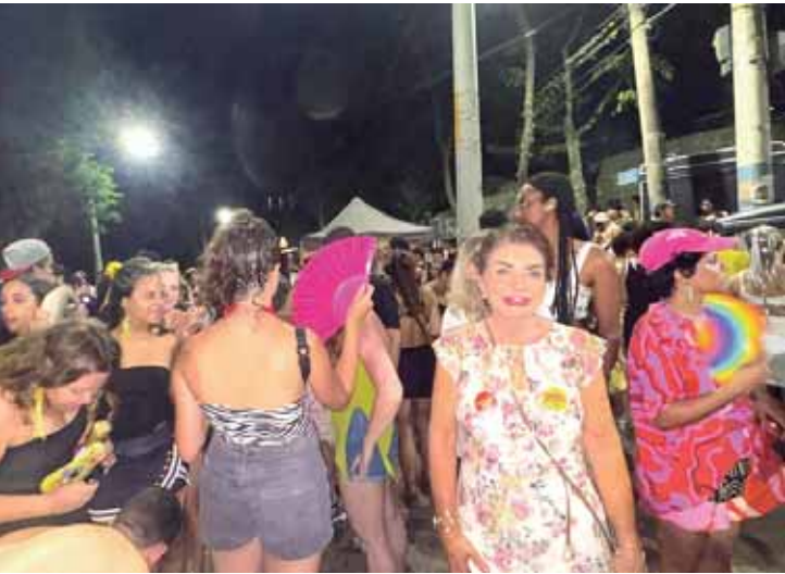
Bebel prestigiando o carnaval de rua de Piracicaba, na noite de segunda-feira