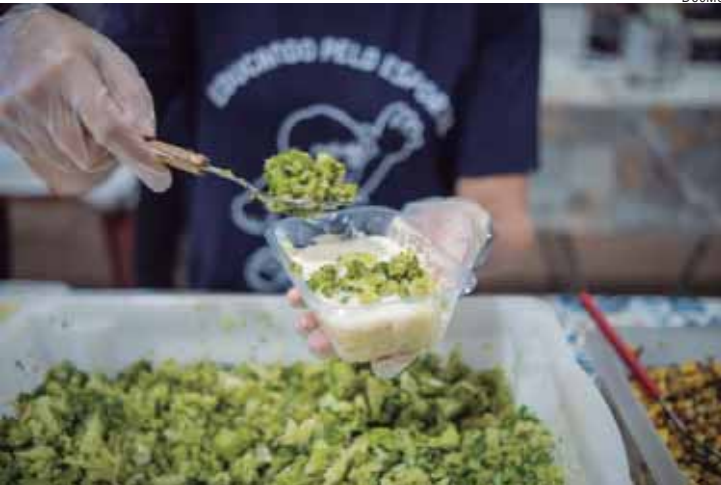
Festa da Batata acontece no Engenho com shows, gastronomia e ação solidária

UMA FESTA QUE GERA IMPACTO SOCIAL – Realizada pelo Instituto Educando pelo Esporte, a Festa da Batata mantém sua essência solidária. A arrecadação do evento contribui para o atendimento de centenas de crianças e adolescentes, oferecendo acesso à prática esportiva em diversas modalidades, além de atividades de música, tecnologia e cultura, como teatro, biblioteca, brinquedoteca e artes manuais. [A entrada e o estacionamento são gratuitos. O público pode colaborar com a ação solidária doando 1 kg de alimento não perecível.