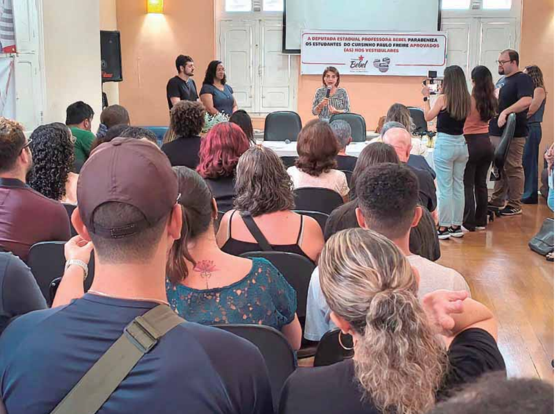
O lançamento do Fórum Estadual reuniu mais de 30 representantes de cursinhos populares de diversas regiões do Estado