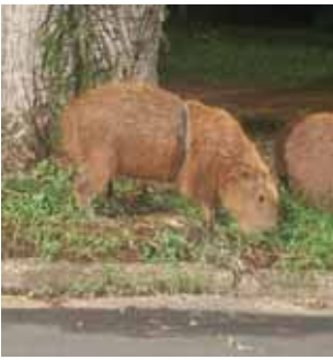
Prefeitura estrutura área para manejo de capivara com artefato preso ao tórax

A Prefeitura de Piracicaba avança nas ações para o resgate da capivara que está com um artefato preso ao tórax. A Secretaria de Agricultura, Abastecimento e Meio Ambiente, por meio da Divisão de Proteção Animal, preparou uma área de manejo e contenção em local específico - próximo de onde a capivara já frequentava - para possibilitar a retirada do objeto.