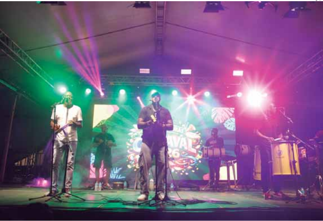
Diferentes artistas animaram o carnaval de Rio das Pedras

Na mesma data, na parte da noite, o grupo Dois Dobrado transformou a avenida num carnaval nordestino tradicional, com forrós, xotes e outras músicas que embalaram o público até o final da apresentação.