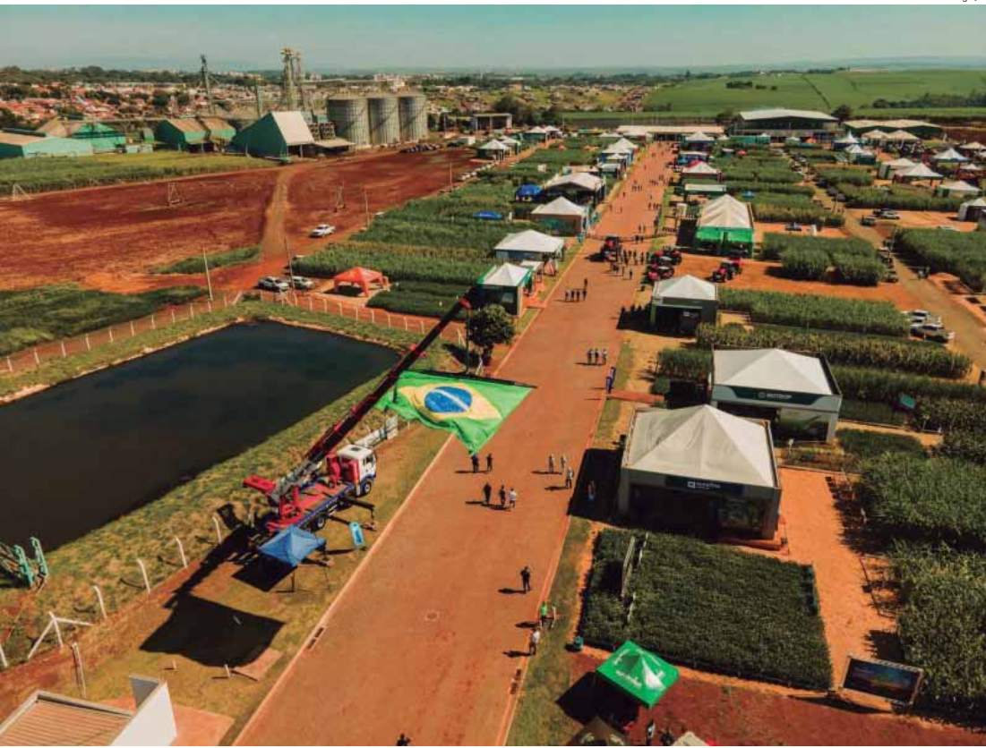
Afocapi vai abordar diferentes temas do agronegócio na Coplacampo 2026

Reserve essa data e planeje sua participação na Coplacampo 2026 como um momento estratégico para o seu negócio. Estar presente é ampliar o olhar sobre novas práticas, acessar informações técnicas relevantes e fortalecer o relacionamento com parceiros e instituições que atuam diretamente no desenvolvimento do setor.