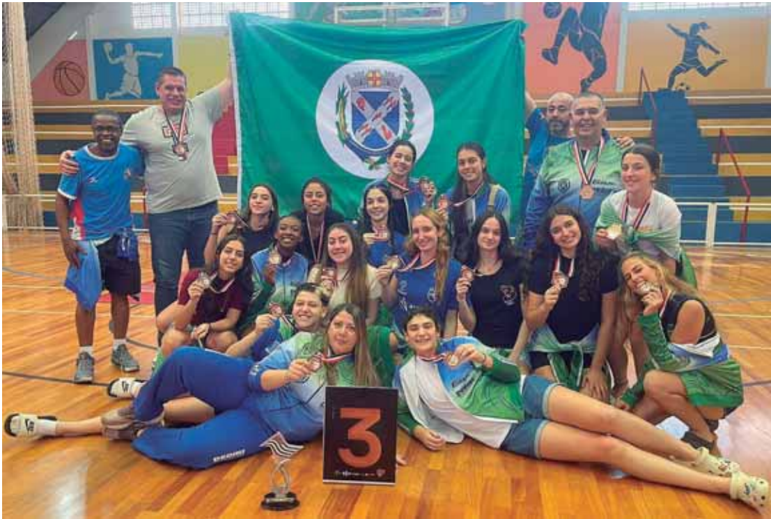
No ano passado, Piracicaba voltou ao pódio dos Jogos Regionais

14h45 - Atalanta x Borussia - TNT / Space / HBO Max 17h00 - Juventus x Galatasaray - TNT / HBO Max 17h00 - PSG x Mônaco - HBO Max 17h00 - Real Madrid x Benfica - TNT / HBO Max