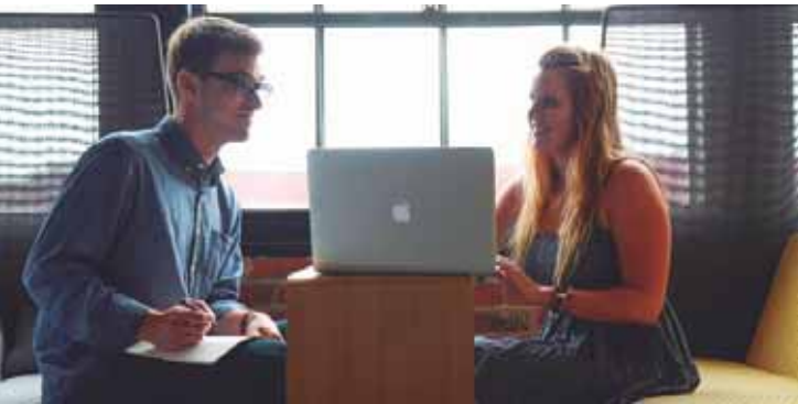
Iniciativa gratuita tem 100 vagas restantes e é voltada para empresas interessadas em inovação

Interessados em incentivar a Angelina e ajudar sua família com as despesas da viagem e do concurso, podem contribuir com qualquer quantia pelo pix em nome de Renata Poloniato: (19) 99927-4346.