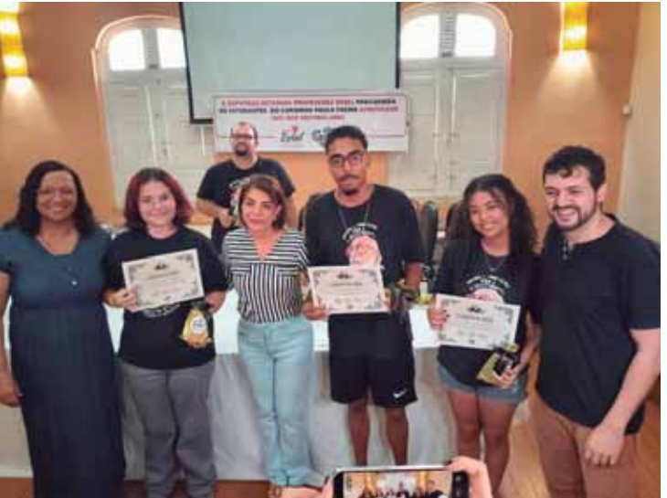
Na solenidade, alunos aprovados em vestibulares foram homenageados pela deputada Professora Bebel