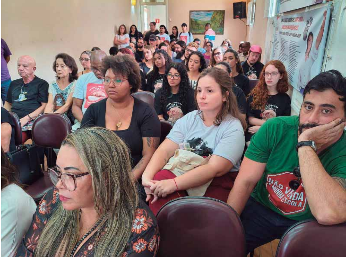
O lançamento do Fórum de Cursinhos Populares aconteceu no último sábado e reuniu estudantes e professores