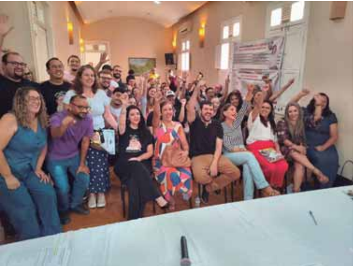
Alunos, professores e familiares comemoram as 86 aprovações do cursinho popular Paulo Freire