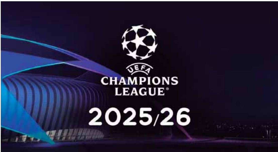
UEFA Champions League 2025-2026. Só os fortes sobreviverão