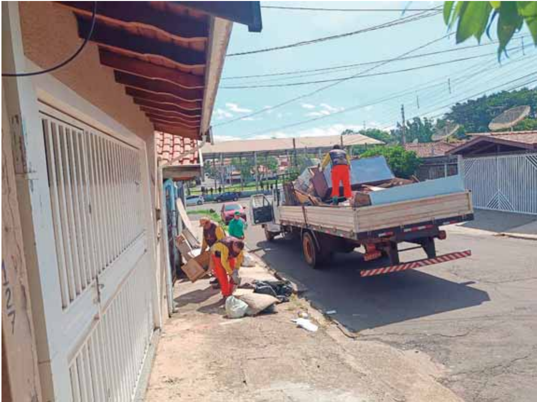
Materiais devem ser deixados na calçada para agilizar trabalho das equipes

É importante também receber bem os agentes de saúde e de endemias que vão até as casas para orientar e vistoriar. Eles são alia-