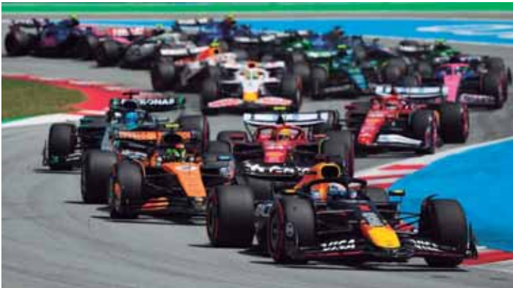
Fórmula-1 2026 está com novas regras

Palmeiras x Capivariano. Dia 22 de fevereiro (domingo), às 16 horas, Novorizontino x Santos e às 21h30, Portuguesa x Corinthians. O mata-mata começou e no Paulistão, erro não tem volta.