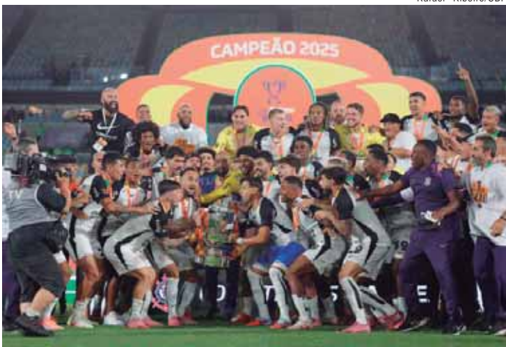
Corinthians paulista foi o campeão da edição da Copa do Brasil 2025

Em 2026, a Copa do Brasil terá pela primeira vez final única - data-base é 6 de dezembro -, alinhando-se ao padrão de outras competições internacionais de formato similar e garantindo apelo esportivo, turístico e comercial com um evento