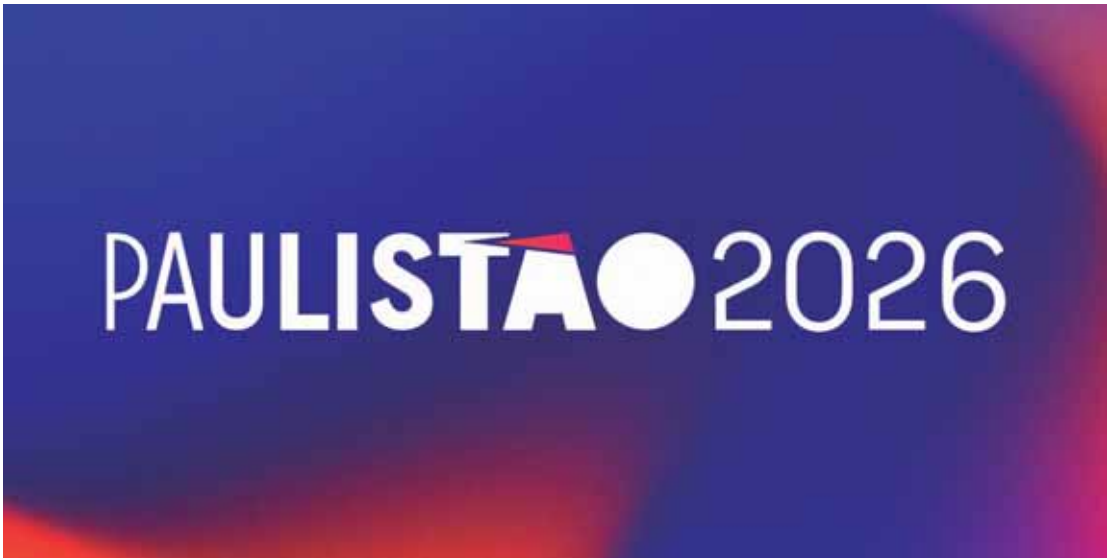
Paulistão: confrontos definidos para as quarta de final

Fechando os confrontos, o São Paulo terá pela frente o Red