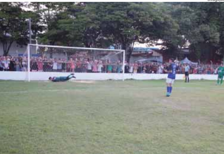
SespeI promove peneira junto ao XV de Piracicaba

Promovida junto a Secretaria de Esportes, o time do XV de Piracicaba fará uma avaliação de jogadores locais. A ação popularmente conhecida no futebol como "Peneira" visa conhecer e selecionar jovens talentos que podem vir a se tornar jogadores profissionais.