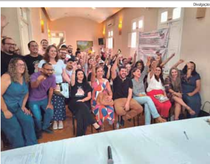
Alunos, professores e familiares comemoram as 86 aprovações do cursinho popular Paulo Freire