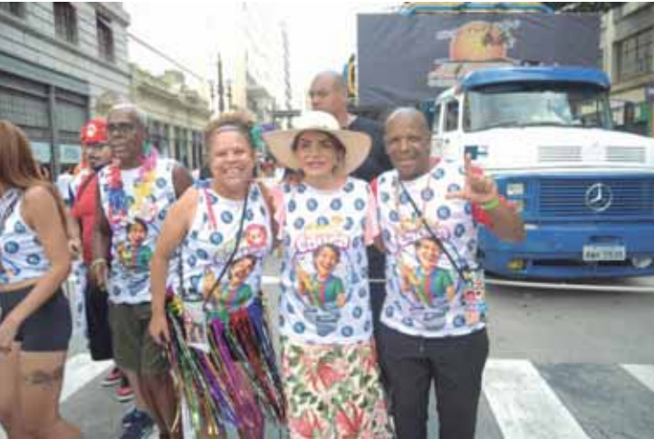
Muita alegria e disposição no Bloco Educa, da Apeoesp