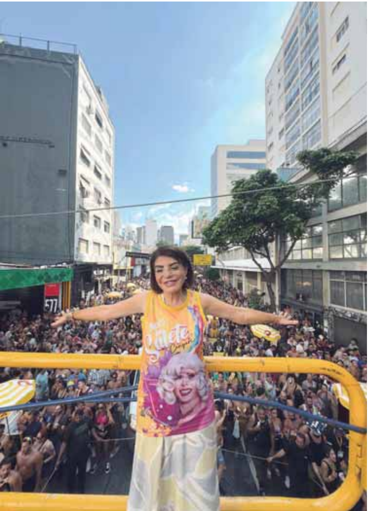
-Bebel prestigiando o Bloco da Salet Campari, em São Paulo