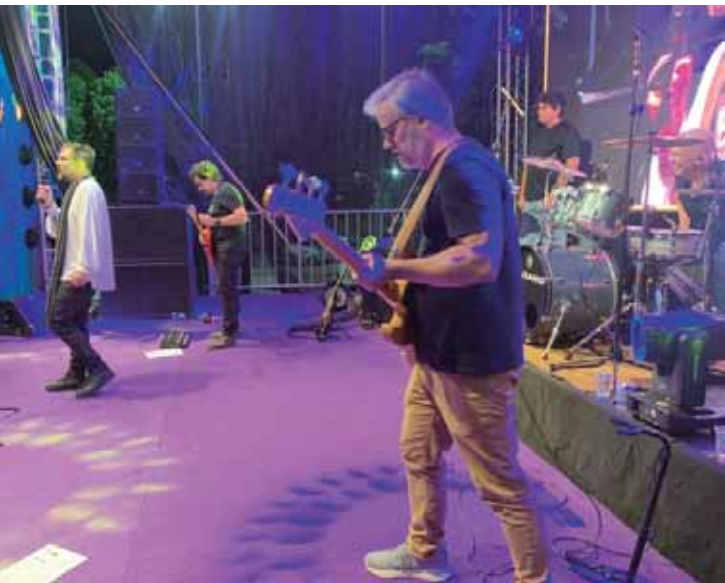
Banda cover do Legião Urbana se apresentou em Águas de São Pedro