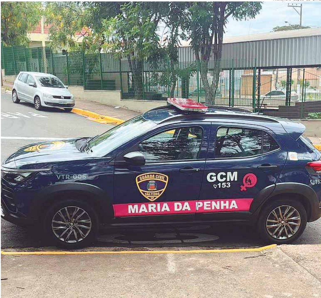
O novo veículo será utilizado no monitoramento de medidas protetivas e atendimentos emergenciais