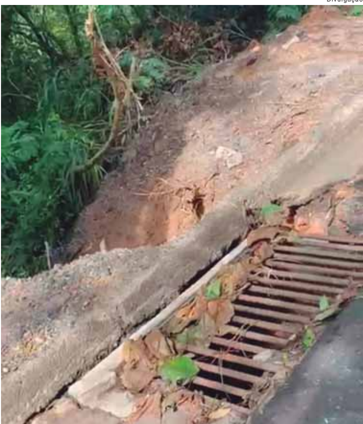
O vereador solicitou vistoria técnica urgente e adoção de medidas emergenciais

Com a nova gestão, as estâncias turísticas do estado esperam ampliar suas ações de promoção, qualificação e diálogo com o setor público e privado, reforçando a importância do turismo como vetor de desenvolvimento regional e fortalecimento das economias locais.