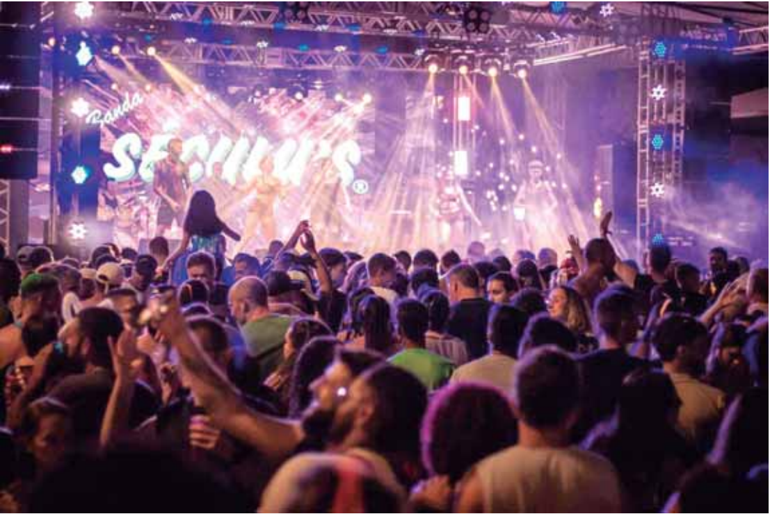
As inscrições devem ser realizadas entre 20 de janeiro e 10 de fevereiro, na Secretaria de Turismo e Cultura