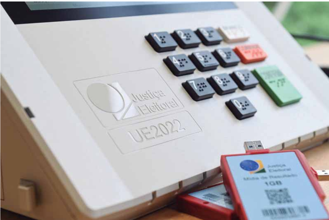
30 anos da urna eletrônica: tecnologia de votação é adotada em ao menos 34 países

Nesses países que adotam máquinas de votação eletrônica de gravação direta, o voto é digitado e gravado digitalmente na máquina. Em alguns casos, adota-se um sistema híbrido, no qual a urna eletrônica também imprime um comprovante físico do voto. No Brasil, já houve a impressão do voto pela urna eletrônica nas eleições de 1996 e de 2002, mas o seu