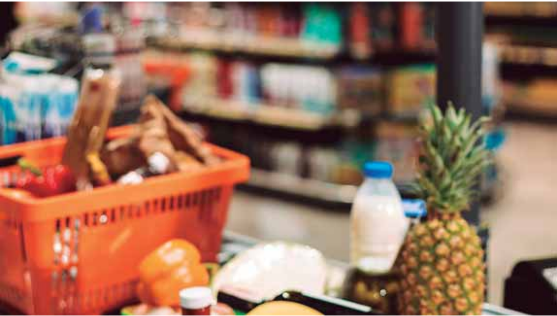
ABRAS projeta crescimento de 3,2% no consumo nos lares em 2026

faixa de isenção do Imposto de Renda, o reajuste real do salário-mínimo, a manutenção de programas de transferência e apoio à renda devem reforçar o poder de compra, com impacto mais perceptível ao longo do ano.