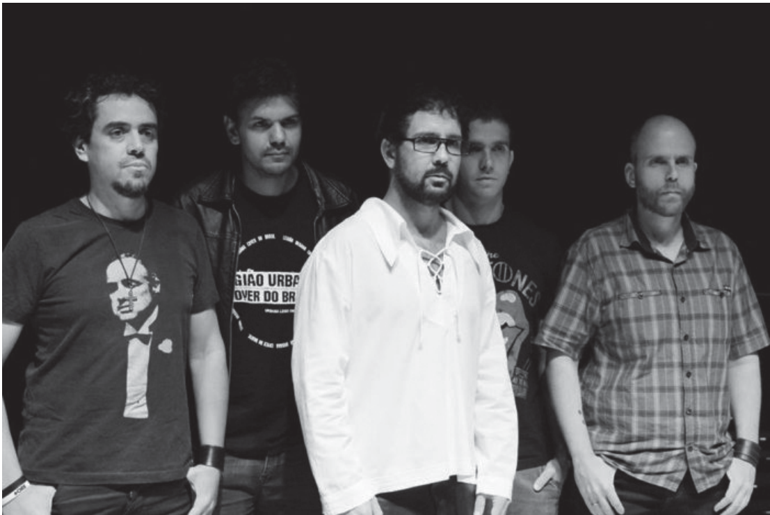
Show com Legião Urbana Cover do Brasil será das 20h30 às 23h, na Praça Prefeito Wilson Modesto

A agenda continua na sexta-feira (23), das 21h às 23h30, com a Banda Themplus, que sobe ao palco da Praça Prefeito Wilson Modesto com um repertório variado, prometendo agradar diferentes públicos. No sábado (24) a música começa às 20h, com a Banda 1,2,3 Pin, trazendo MPB e pop rock até as 21h. Em seguida, das 21h30 às 23h30, a