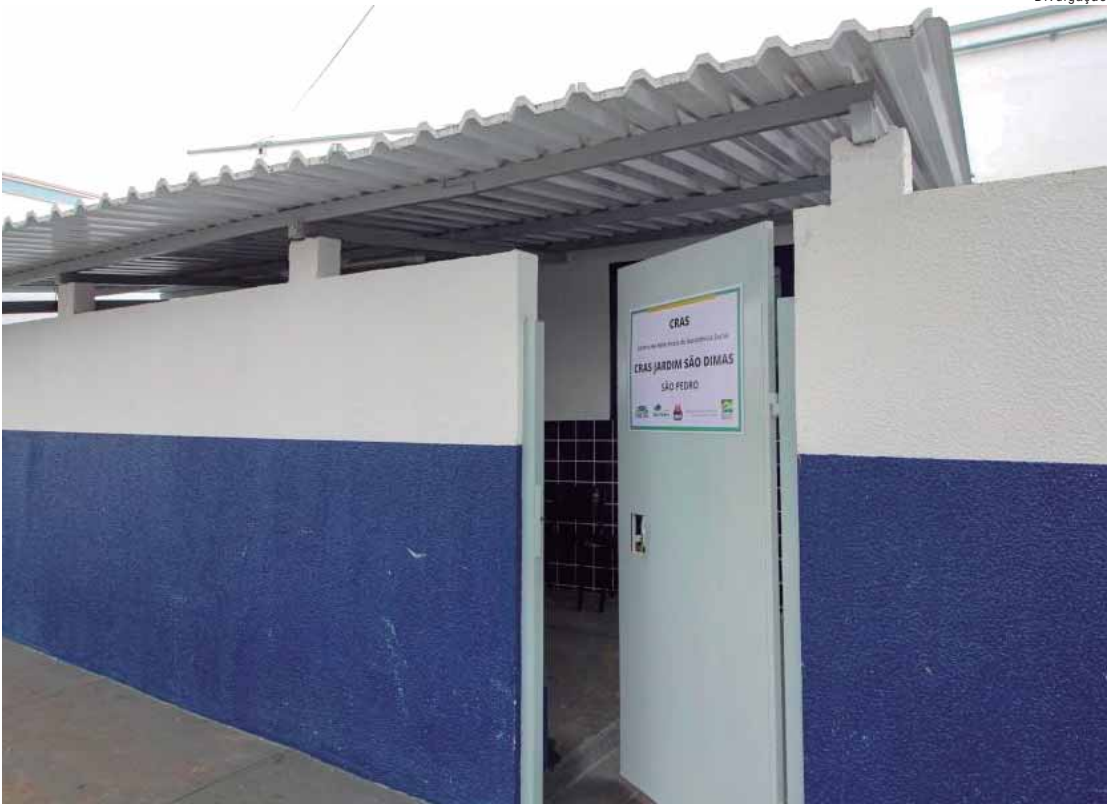
São Pedro está na lista dos 31 municípios contemplados com expansão do CRAS

Os Centros de Referência de Assistência Social são a principal porta de entrada do SUAS e exercem papel estratégico na prevenção de situações de vulnerabilidade social. Atuando de forma descentralizada e territorializada, os CRAS promovem o fortalecimento de vínculos familiares e comunitários, a escuta qualificada e o acompanhamento sistemático das famílias, contribuindo para a redução das desigualdades sociais e para a garantia de direitos.