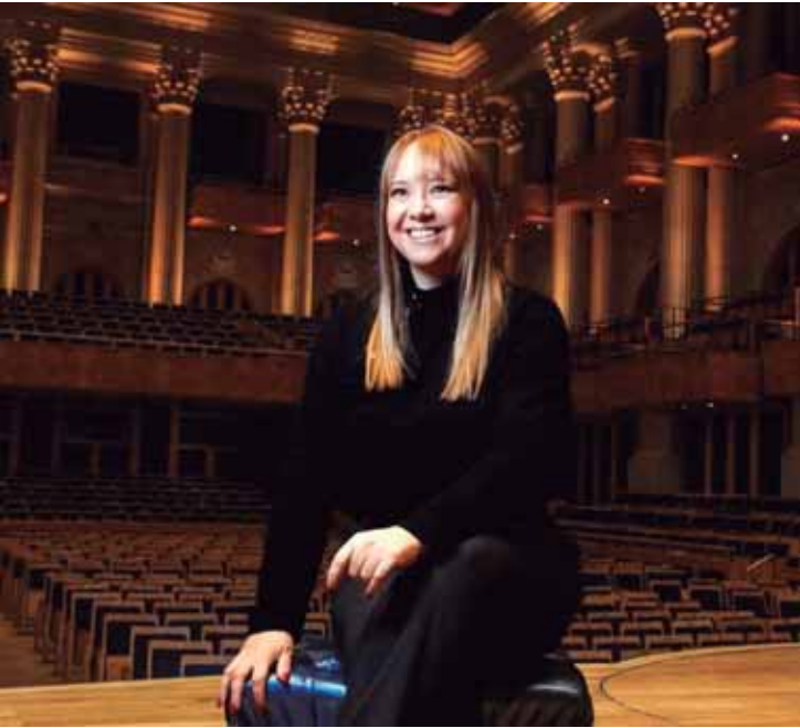
O encontro também permitirá a apresentação de novos projetos culturais desenvolvidos em Águas de São Pedro

O encontro também permitirá a apresentação de novos projetos culturais desenvolvidos em Águas de São Pedro, além da discussão sobre possibilidades de captação de recursos, viabilidade de novas parcerias e futuras ações conjuntas entre o município e o governo estadual.