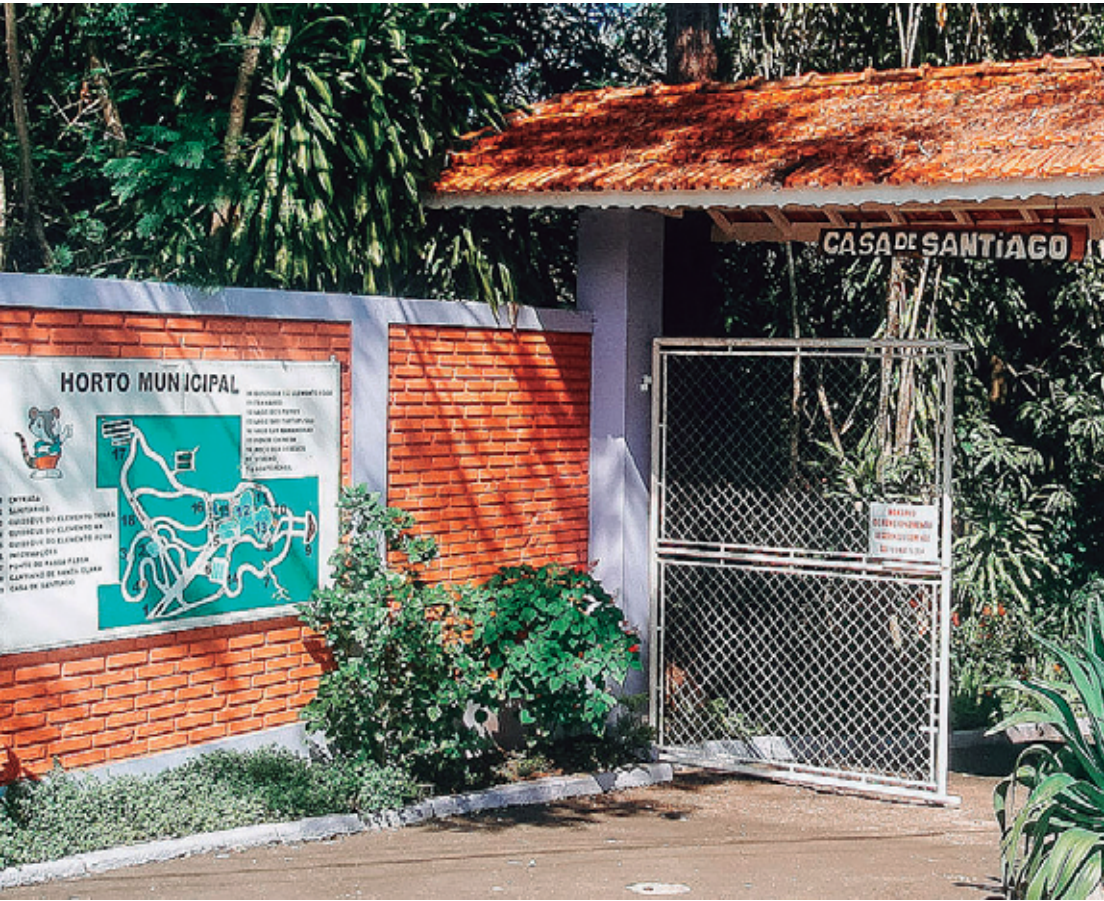
O projeto tem como objetivo principal a produção de mudas de espécies nativas

O Mini Horto e a fase que inclui entidades reforçam o caráter educativo do projeto, envolvendo os estudantes na preparação do substrato, semeadura, germinação, envase e rustificação das mudas. Nesta fase também haverá interação e colaboração da Melhor Idade de Águas de São Pedro.