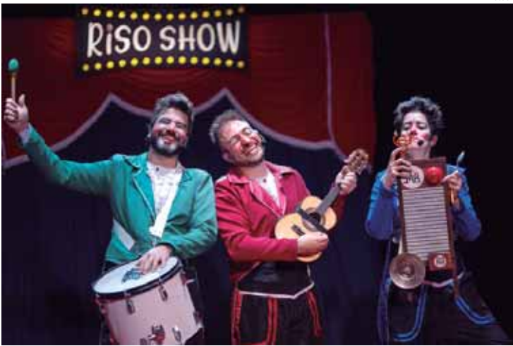
Festival contará com espetáculos de companhias que trabalham a arte circense de diferentes maneiras