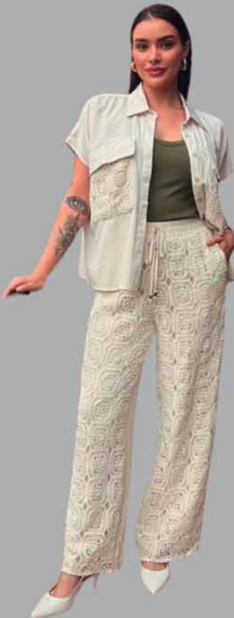
CAMISA COM CROCHE CALÇA COM CROCHE