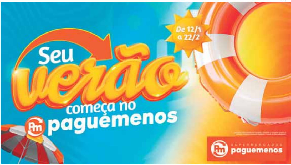
A campanha reúne preços competitivos e ofertas especiais