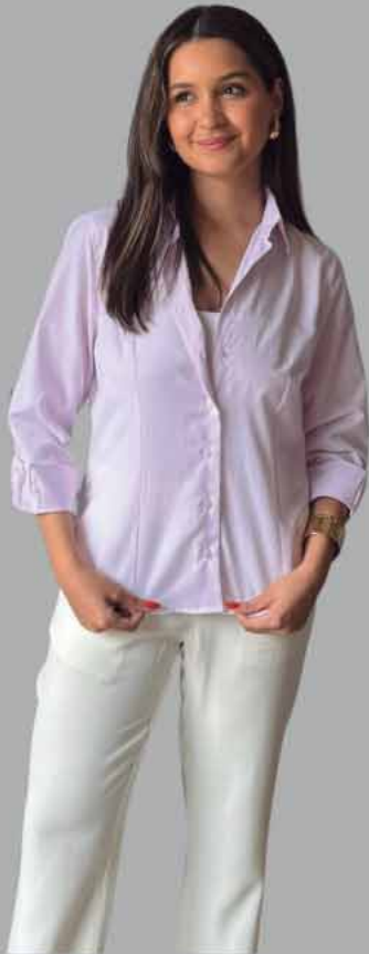
CAMISA FEMININA MANGA LONGA