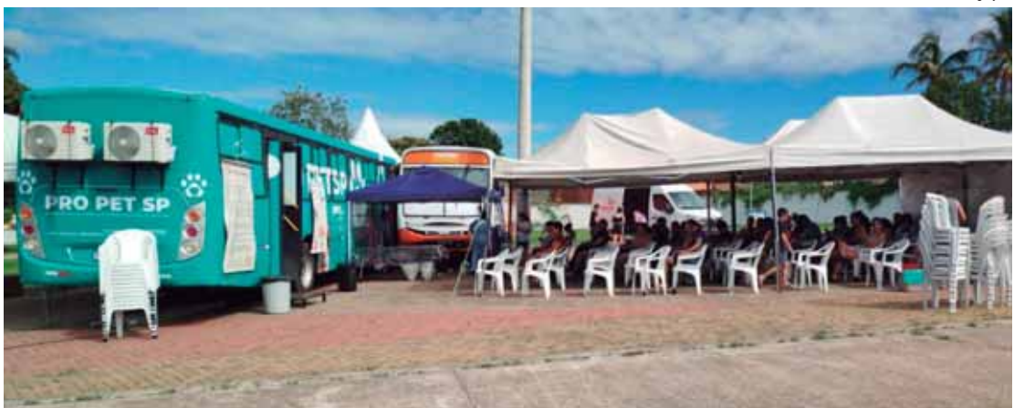
A ação contou com apoio da prefeitura e resultou na castração de 207 cães e 122 gatos

O mutirão foi viabilizado a partir de emenda parlamentar do deputado estadual Alex Madureira (PL/SP) e contou com o apoio da equipe do Centro de Controle de Endemias, da Secretaria de Saúde e Desenvolvimento Social. A ação reforça o compromisso da prefeitura de São Pedro com o bem-estar animal, o controle populacional responsável e o apoio às famílias tutoras, ampliando o acesso a serviços essenciais de saúde pública veterinária.