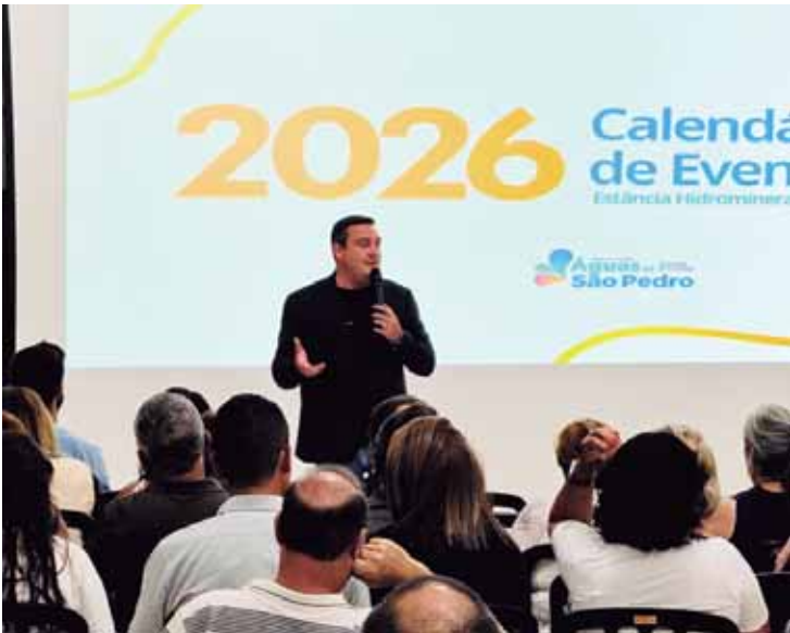
Calendário foi divulgado nesta terça-feira (13), no Centro de Convenções