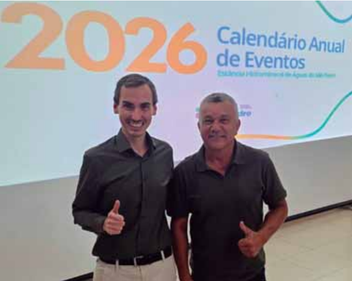
A presença dos vereadores reforça o compromisso do Legislativo em acompanhar de perto o planejamento da cidade

Ônibus da Oftalmologia Data: 24 de janeiro Local: Centro de Convenções - Águas de São Pedro Horário: Das 8h às 16h Requisitos: Apresentar Cartão Cidadão Idade mínima para atendimento: 6 anos Limite máximo de 200 pacientes atendidos.