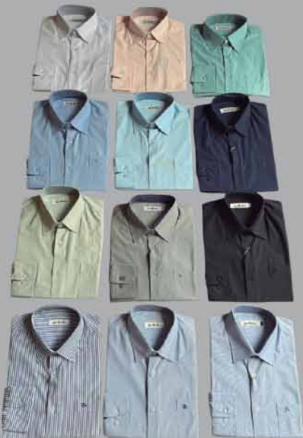
CAMISA EASY COTTON MANGA LONGA