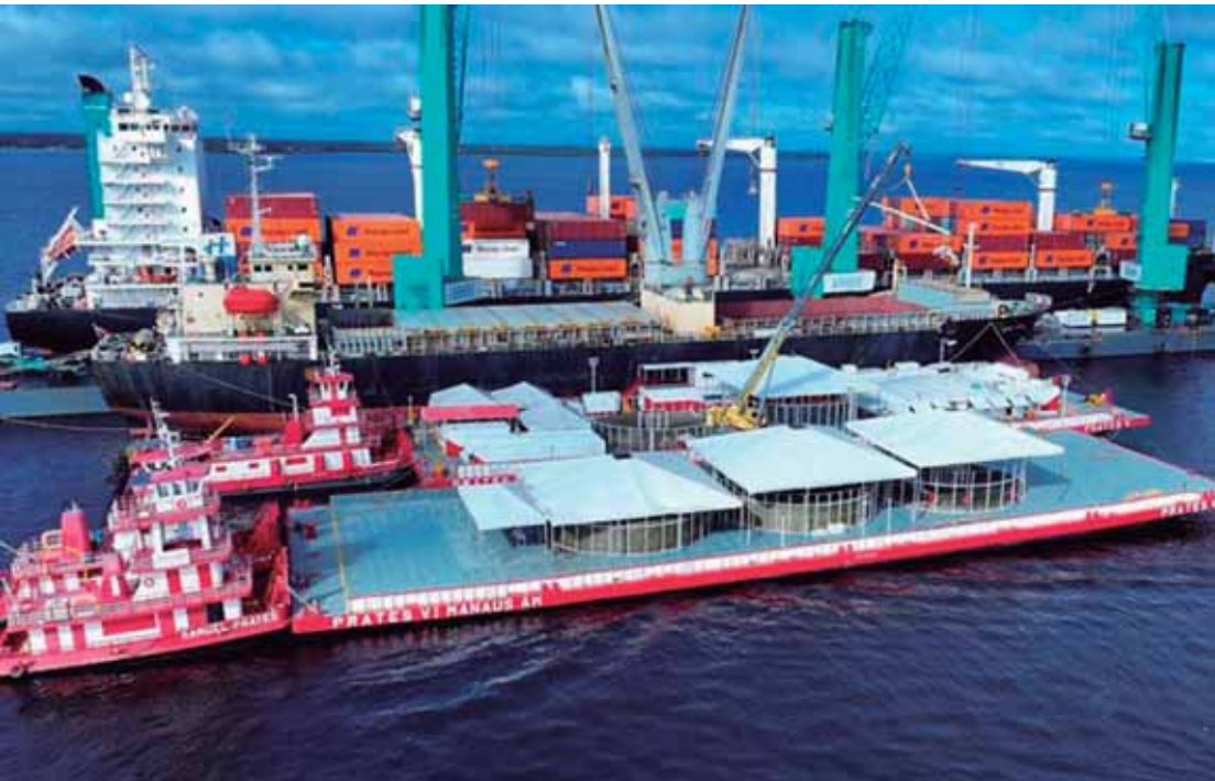
Brasil recebeu 3.170 quilômetros de cabos de fibra óptica provenientes da China

Para o ministro das Comunicações, Frederico de Siqueira Filho, o projeto vai além da infraestrutura. "Ele promove desenvolvimento social e econômico, conecta escolas, unidades de saúde, órgãos públicos e, principalmente, leva oportunidades à população amazônica. É conectividade como instrumento de cidadania e inclusão", afirmou. De acordo com o ministro, os