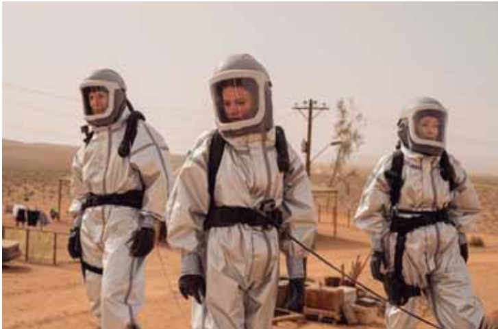
No terror e ficção científica Alerta Apocalipse um fungo parasita vaza de uma base militar abandonada causando estragos no mundo