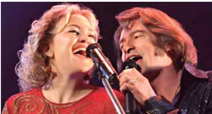
No nostálgico e cativante drama musical Song Sung Blue, Kate Hudson e Hugh Jackman formam uma banda tributo a Neil Diamond