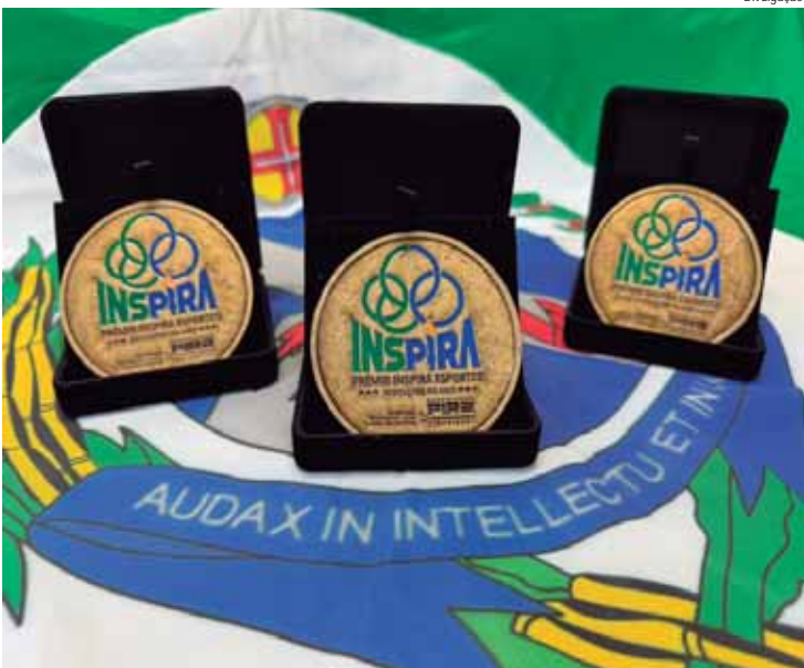
Premiação acontece em 28 categorias, de professores e entidades esportivas que se destacaram no ano passado