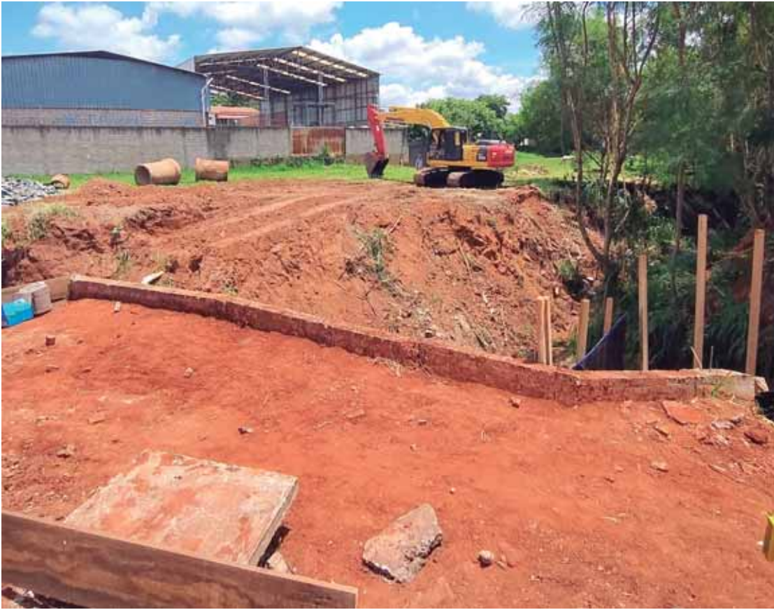
Secretaria realiza obras de reforço e prevenção a desmoronamentos

Após as fortes chuvas terem causado um afundamento no asfalto na Avenida Serafina Luca Marino, a Prefeitura começou a dar atenção especial ao caso, além de se precaver para que outros afundamentos não aconteçam em casos de chuvas fortes atingirem a cidade. Na semana passada, o prefeito acompanhado por secretários municipais e representantes da empresa responsável pela obra, estiveram no local para estudar o caso e os procedimentos a serem tomados. O local foi interditado e recebeu sinalização. Também foi constatada a necessidade urgente de manutenção na ponte que existe nas ruas Ricardo Degaspere e João Evaristo Petrini. O local é um ponto estratégico de encontro de dois bairros e deve receber a manutenção preventiva, caso a cidade volte a ter chuva com grandes volumes de água. Após o término dessas obras, as equipes vão se deslocar até o ponto onde houve o afundamento do asfalto.