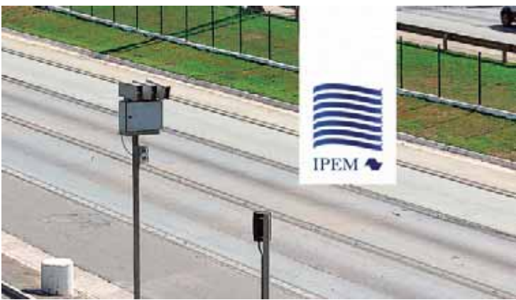
Objetivo é verificar se a leitura dos radares está em conformidade com a velocidade permitida na via pública

Educação afrontam o estatuto do magistério, conforme explica Bebel. "Portanto, você professor, não desanime, vamos, juntos, agir com a força que sempre tivemos para enfrentar o governo de Tarcísio de Freitas. A Apeoesp está do seu lado nesta luta em defesa do magistério e da educação pública de qualidade", completa.