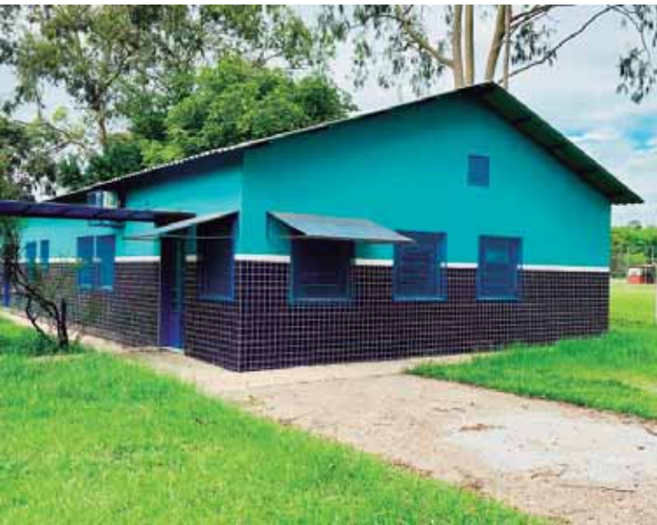
USF São José foi reformada e agora vai realizar também atendimento odontológico da UBS Vila Cristina

NOVA ESTRUTURA - As obras da USF São José garantiram a reforma de todos os sanitários, com acessibilidade para os da recepção; novo revestimento na cozinha e um novo abrigo de gás na área externa, além de revestimento cerâmico nas salas de curativo, vacina, dentista e fachada. As mudanças incluem ainda troca de piso e da parte elétrica, mudanças na cobertura e pintura nas áreas interna e externa.