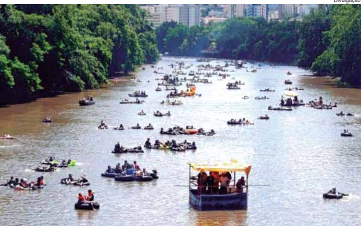
Projeto de Lei de autoria de Renan Paes busca reconhecer oficialmente o passeio anual de boia no Rio Piracicaba como Patrimônio Imaterial do município