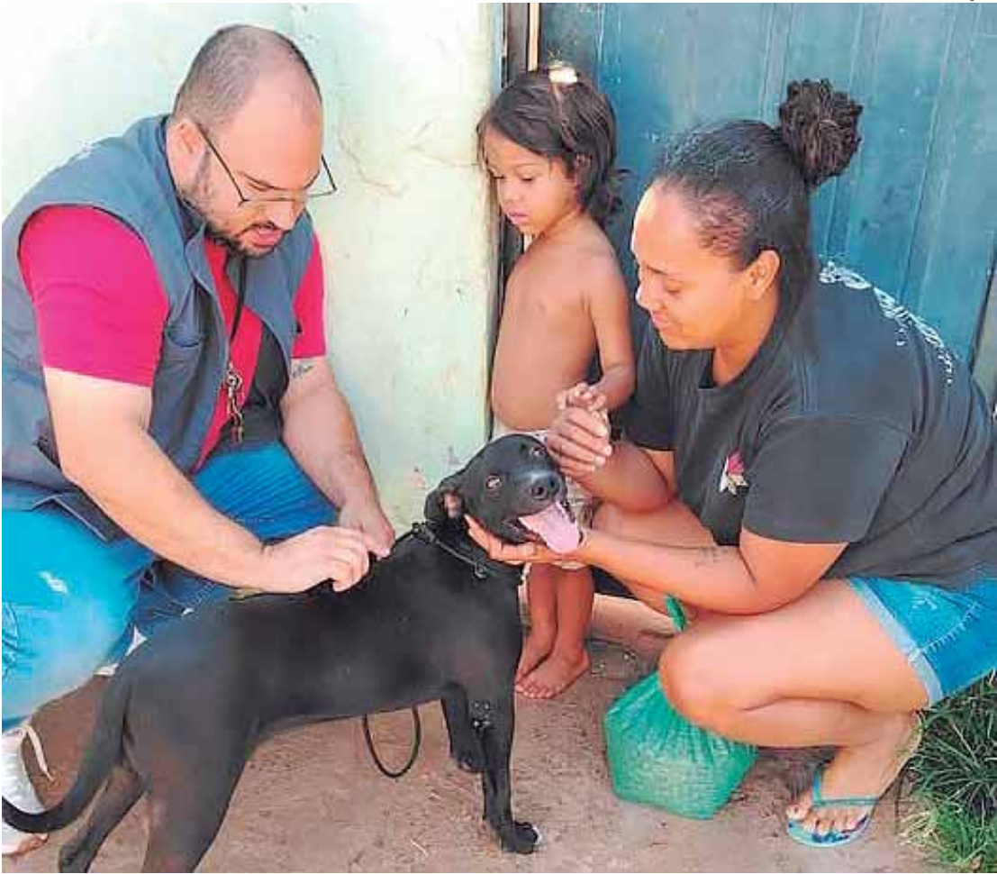
Cãozinho já ganhou uma nova família

Enquanto todo o país se comove com a história envolvendo maus tratos e assassinato do cachorro Orelha, em Santa Catarina, Rio das Pedras apresenta dois exemplos de atenção e cuidado com os animais abandonados. Nos últimos dias, dois resgates chamaram a atenção da população e das redes sociais. Em um dos casos a GCM resgatou um cachorro que estava no Ribeirão Tijuco Preto sob o risco de se afogar. Graças a ação de moradores, a Guarda foi avisada sobre o caso e imediatamente entrou em ação para realizar o resgate. Outro caso que ganhou destaque foi de um cachorro abandonado nas ruas do Bairro São Cristóvão, que estava muito debilitado e com infestação de pulgas e carrapatos. O cãozinho foi acolhido por funcionários da Secretaria de Saúde, que de imediato começaram o tratamento com remédio e reabilitação. Poucos dias depois o animal já apresentava outra aparência, pois ganhou banho doado por um pet shop da cidade. Logo após a divulgação nas redes sociais, uma família que se comoveu com a história fez a adoção, dando uma nova vida ao cachorro.