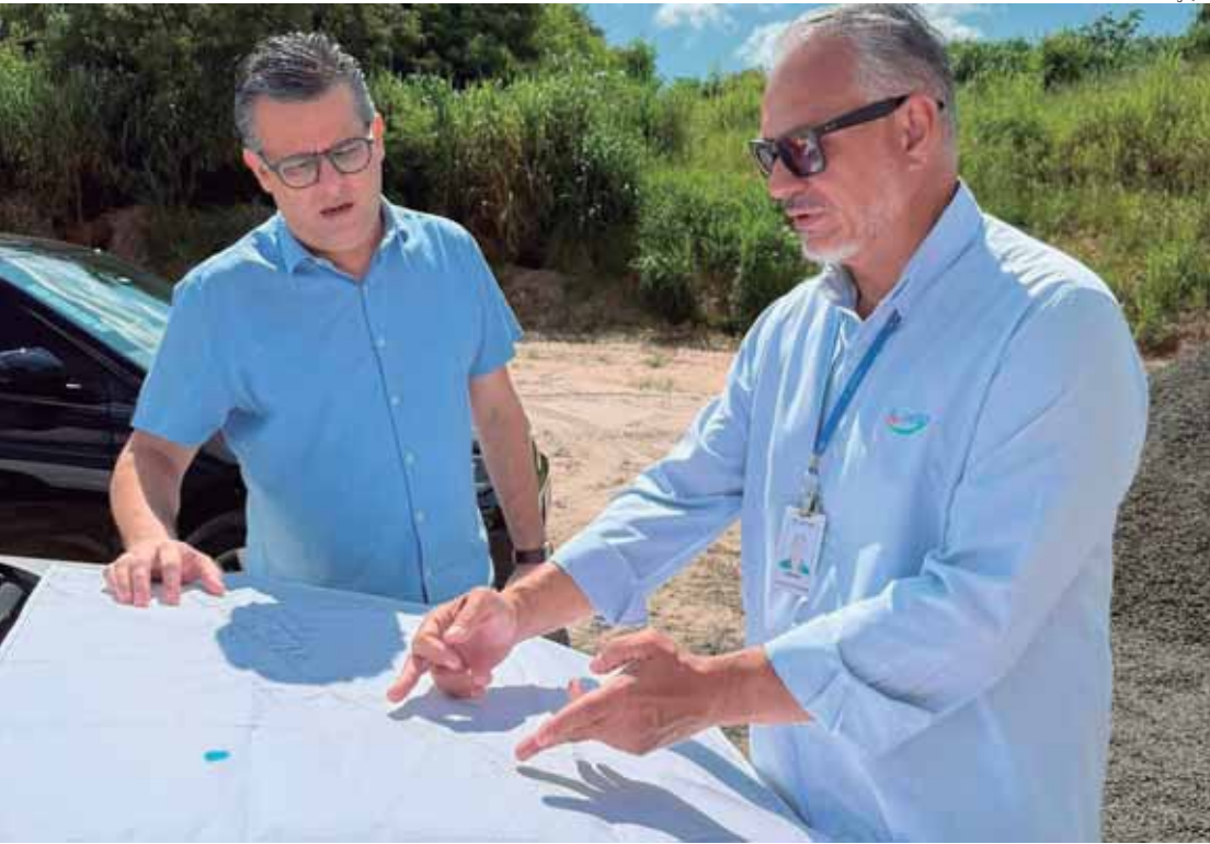
Vereador esteve no Sema para apresentar as demandas de moradores

Segundo o documento, a reavaliação do sistema de distribuição, acompanhada das manutenções adequadas, permitirá identificar pontos críticos