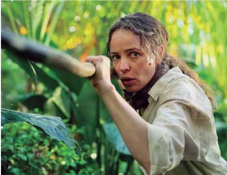
No ótimo suspense Socorro, uma funcionária oprimida e seu chefe irritante ficam presos numa ilha deserta após um acidente de avião