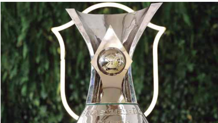
A disputada taça de campeão do Brasileirão série A 2026

A expectativa interna é de que, com reforços pontuais e maior estabilidade, o Santos consiga retomar o protagonismo e apresentar um desempenho mais consistente na sequência da temporada.