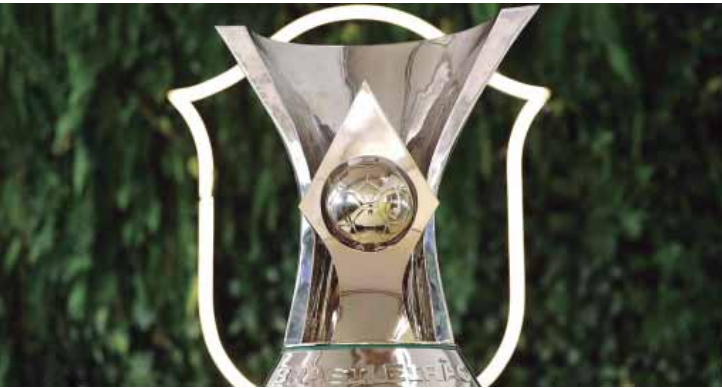
Disputa da Supercopa Rei é neste domingo, 01, no estádio Mané Garrincha