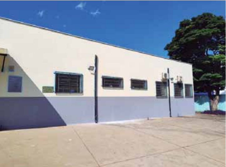
Todas as escolas devem passar por pequenas reformas

lação e limpeza de ar condicionado, manutenção de ventiladores estão entre as atividades feitas na maioria das escolas. Além das pequenas manutenções, reformas maiores incluem troca de piso e reforma de teto, que já estão orçados e logo devem ter início em diversas unidades, entre elas as escolas do Barão de Serra Negra e Immaculada Grecco Civolani.