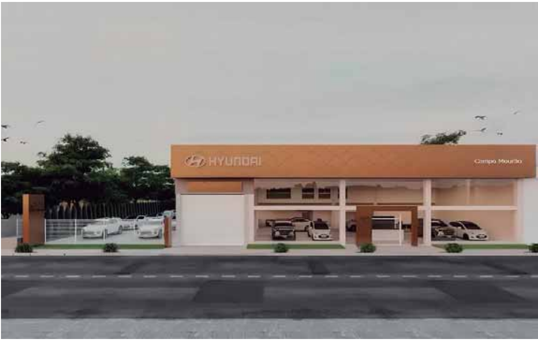
A nova unidade conta com sistema de tratamento de efluentes, 1.500 m² de área construída e um showroom de 250 m²

A Hyundai Motor Brasil (HMB) e o Grupo Open inauguraram nesta terça-feira (27) sua nova concessionária na cidade de Campo Mourão (PR). A Hyundai Open Campo Mourão segue os mais modernos padrões de arquitetura adotados globalmente pela montadora sul-coreana e é a quarta unidade controlada na região pelo Grupo Open, que representa a marca desde janeiro de 2015, com lojas em Cascavel, Foz do Iguaçu e Umuarama. A revenda conta com 1.500 m² de área, sendo 250m² dedicados exclusivamente ao showroom, e está equipada com sistema para tratamento de efluentes, em linha com as iniciativas de sustentabilidade da montadora.