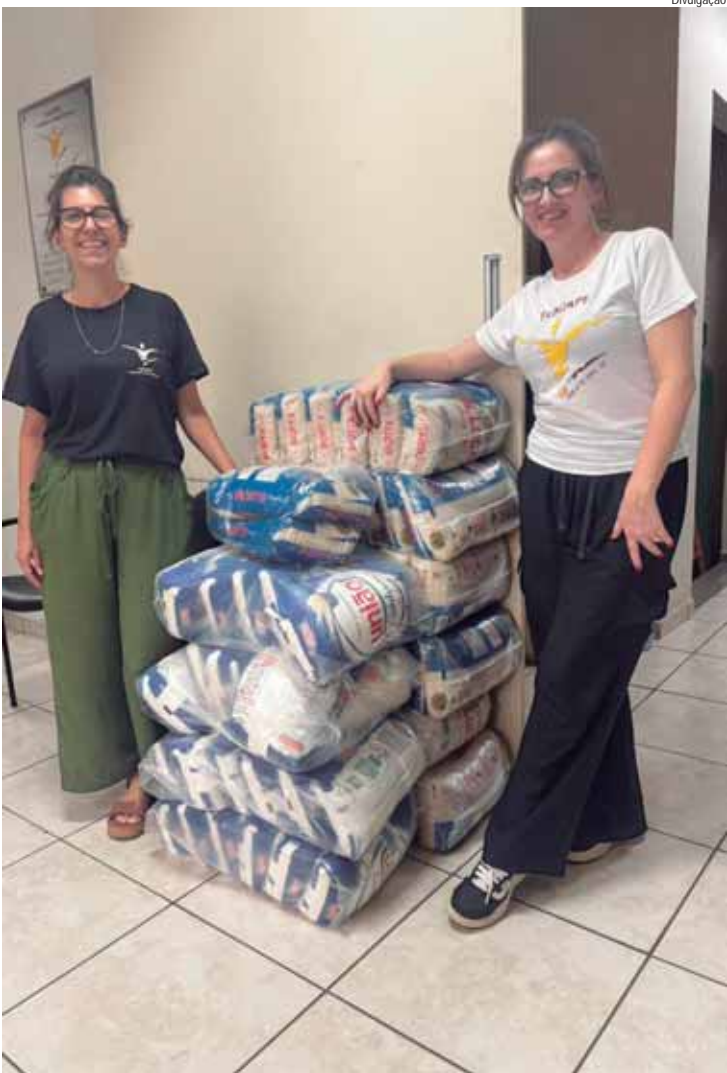
A Funjape foi uma das entidades beneficiadas com a doação de alimentos