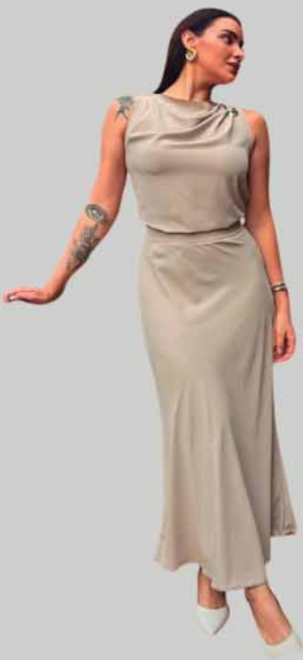
BLUSA E SAIA EM CREPE