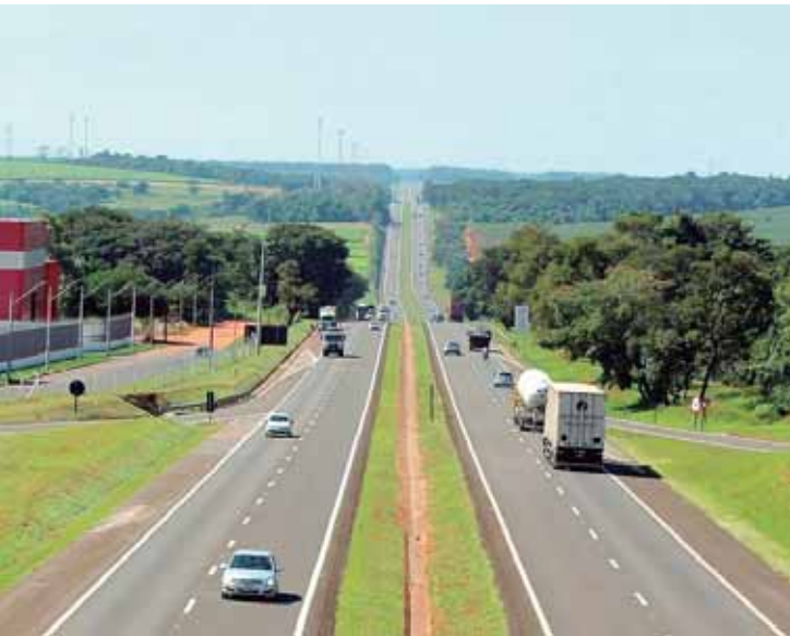
Concessionária apoia campanhas Janeiro Roxo e Janeiro Branco com mensagens nos painéis eletrônicos