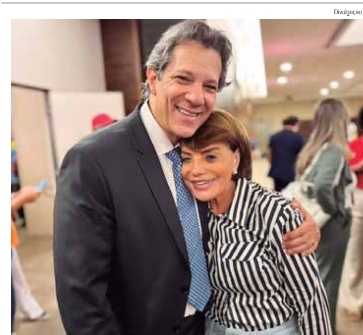
Professora Bebel diz que Fernando Haddad é um gigante e que deve ser o candidato ao Governo do Estado de São Paulo