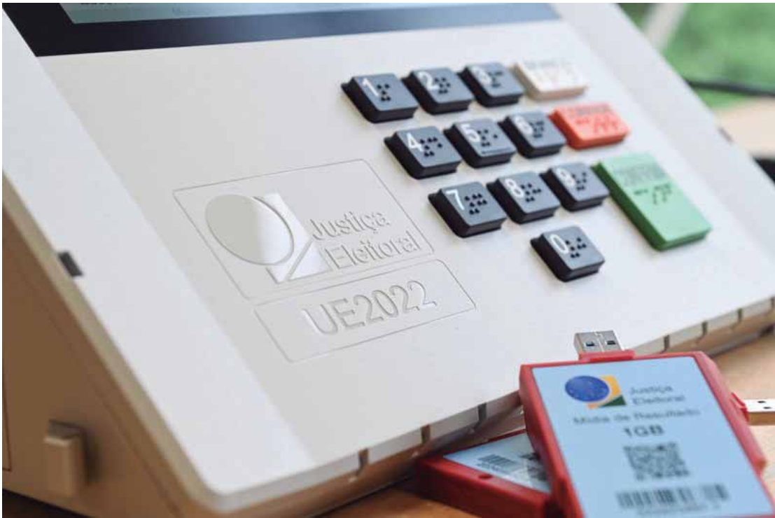
30 anos da urna eletrônica: tecnologia de votação é adotada em ao menos 34 países

Nesses países que adotam máquinas de votação eletrônica de gravação direta, o voto é digitado e gravado digitalmente na máquina. Em alguns casos, adota-se um sistema híbrido, no qual a urna eletrônica também imprime um comprovante físico do voto.