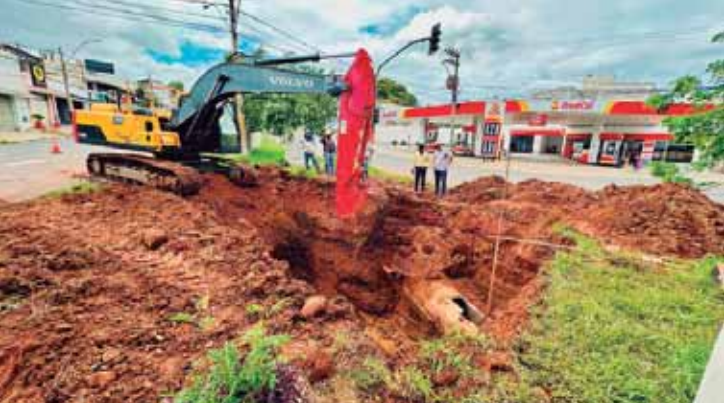
Rede é antiga e não suporta mais o fluxo de água; cerca de 150 metros de tubulação serão trocados

Por isso, a Pasta determinou a reconstrução completa do sistema, com a implantação de uma nova rede de drenagem ao lado da existente. A obra tem previsão de duração superior a 20 dias e exigirá monitoramento constante, especialmente em função das condições climáticas. Durante a execução dos serviços, será avaliada a necessidade de interdição parcial ou total da avenida, com a implantação de desvios no trânsito.