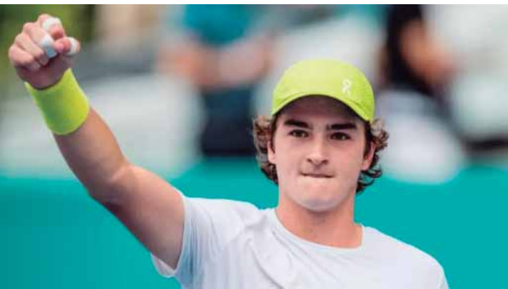
Joao Fonseca foi eliminado na primeira rodada do Australian Open

A carga é limitada e os ingressos devem ser retirados com o máximo de antecedência possível. No caso das crianças até 14 anos, o responsável é quem deve fazer a retirada, apresentando o documento dela. Após encerrada essa carga, o torcedor que se enquadrar em alguns dos itens mencionados acima poderá adquirir o ingresso meia (metade do preço total), o qual também é limitado.