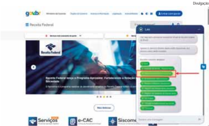
Acionamento do Bot RTC por meio do Leo, Assistente Virtual da Receita Federal do Brasil

A Estônia é outro país referência mundial em votação digital. Desde 2005, é permitido o voto eletrônico remoto pela internet. Em março de 2023, 51% dos eleitores estonianos votaram on-line, superando pela primeira vez a votação presencial e consolidando um modelo baseado em identidade digital criptografada.