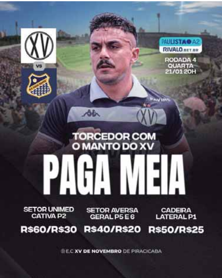
XV faz promoção de meia entrada para a partida de hoje

Meia-entrada: Têm direito a pagar metade do valor total do ingresso as seguintes pessoas: Torcedor com camisa do XV; Estudantes (exceto de cursos profissionalizantes); Professores da rede pública de ensino; Aposentados (devidamente documentados); Acompanhantes de pessoas com deficiência - PCDs; Proprietários de cadeiras cativas (o ingresso deve ser retirado na secretaria do clube com, no mínimo, 24 horas de antecedência ao