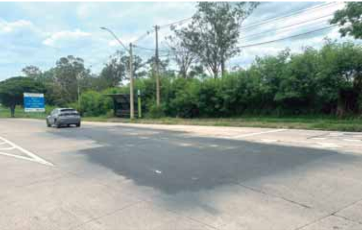
Pedido por manutenção no pavimento de concreto da avenida do Rio Claro havia sido apresentado ao Executivo pelo vereador Pedro Kawai na indicação 6.215/2025

orientação ao consumidor e aprimoramento dos serviços de atendimento, contribuindo para o fortalecimento da cidadania e para relações de consumo mais equilibradas e transparentes. A participação é gratuita, rápida e aberta a todos os consumidores.