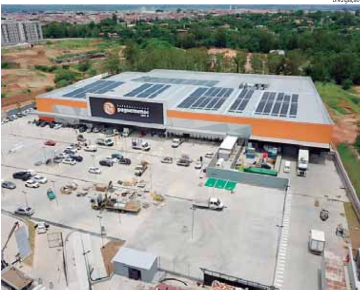
A chegada da nova loja amplia a presença do Supermercados Pague Menos no município