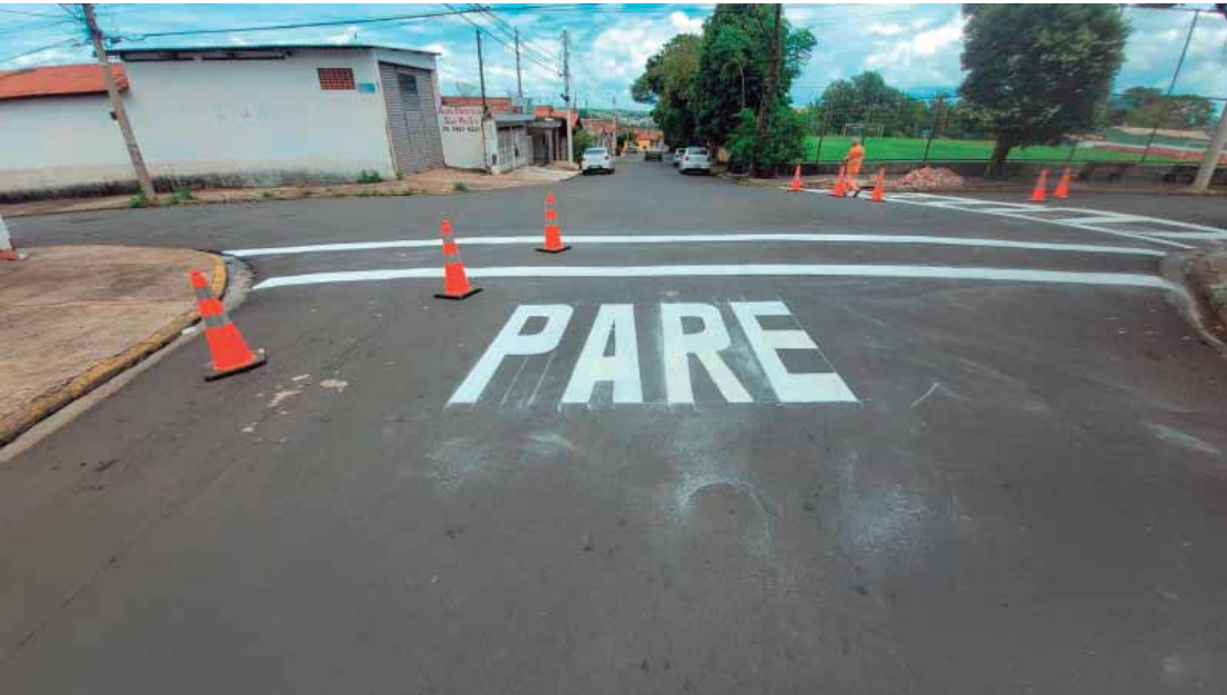
Rua Terenzio Galesi, no Algodão, recebeu reforço na sinalização de trânsito

Endereços atendidos de 01 a 11/01: Av. Armando de Salles Oliveira; Av. Brasília; Av. Cristóvão Colombo;