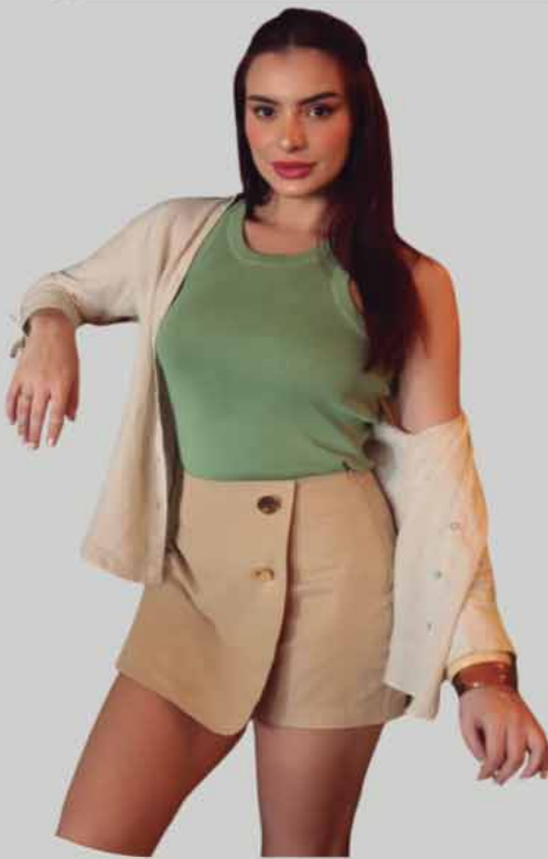
SHORTS SAIA BLUSA TRICOT CAMISA