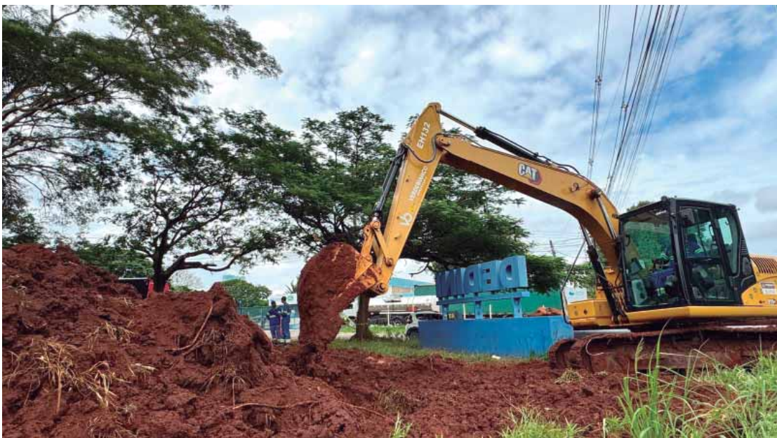
Obra da nova adutora Capim fino a Torre de TV chega em sua reta final

Com investimento de R$ 1,99 milhão, a nova adutora terá cerca de 1,4 quilômetro de exten-