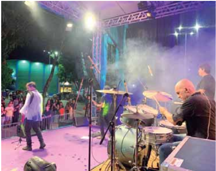
Banda cover do Legião Urbana se apresentou em Águas de São Pedro

O evento reforça a vocação cultural de Águas e a proposta do Festival de Verão, que busca oferecer entretenimento gratuito e de qualidade à população e aos turistas. Mais do que um tributo, o show foi uma celebração da permanência da obra da Legião Urbana no imaginário coletivo. A banda segue com agenda ativa. O próximo show acontece em Limeira, no dia 6 de fevereiro, seguido por apresentações na região de São Paulo.