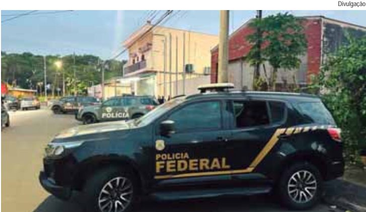
Foram cumpridos 12 mandados de prisão e 24 mandados de busca

A PF apurou que os criminosos traziam a cocaína de Santa Cruz de La Sierra, na Bolívia. Acondicionada em cápsulas, a droga era ingerida por pessoas que seguiam de ônibus até São Paulo/SP. Dali elas eram levadas de carro para chácaras no interior do estado, onde expeliam a droga, que era distribuída aos pontos de venda.