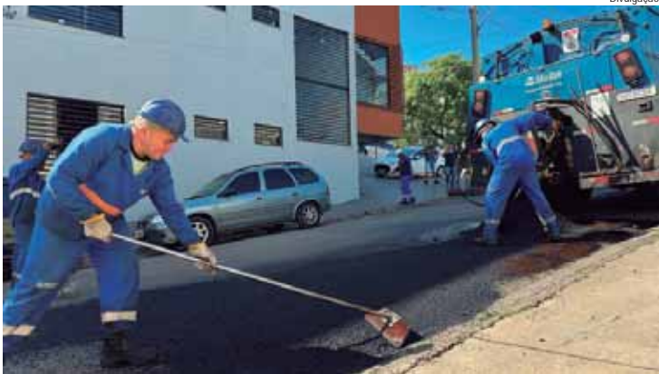
Equipes priorizam regiões estratégicas de mais urgência

preenchendo com bica corrida (conjunto de pedra britada, pedrisco e pó-de-pedra) e finalizando com a massa asfáltica, nos buracos que precisem de intervenção mais profunda. Os bairros e vias atendidas foram: Paulista: rua da Glória, Santa Teresinha: travessa João Degaspari e rua José Blumer, Terras de Piracicaba: alameda Cavaleiro Bonilha e alameda Carolina Mendes Thame, Vila Rezende: avenida Américo Brasileiro e Vila Sônia: avenida Corcovado.