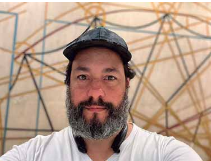
Natural da Baixada Santista, o premiado diretor será o responsável pela direção do espetáculo encenado pelo grupo durante a temporada 2026