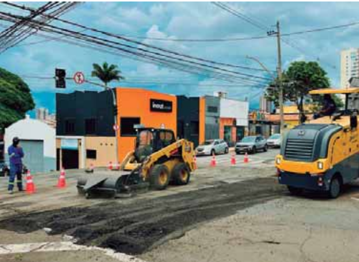
Na avenida Saldanha Marinho, além das adequações no sistema de drenagem, está sendo realizada a fresagem do asfalto existente

no sistema de drenagem, está sendo realizada a fresagem do asfalto existente. Esse procedimento consiste na remoção da camada superficial do pavimento, preparando a via para receber o novo recapeamento de forma mais eficiente e segura. A Prefeitura reforça a necessidade de que moradores e visitantes evitem deixar seus veículos estacionados nas vias durante as obras, de forma a não interromper o andamento dos serviços de recape e não ocasionar em "recortes" no asfalto. As intervenções fazem parte do plano de melhorias na malha viária, com foco em segurança e fluidez do trânsito. A programação pode ser alterada a qualquer momento e as obras podem ocasionar desvios e bloqueios para o trânsito.