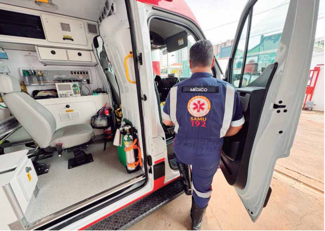
Frota é formada por dois tipos de viaturas, escolhidas conforme as características do atendimento