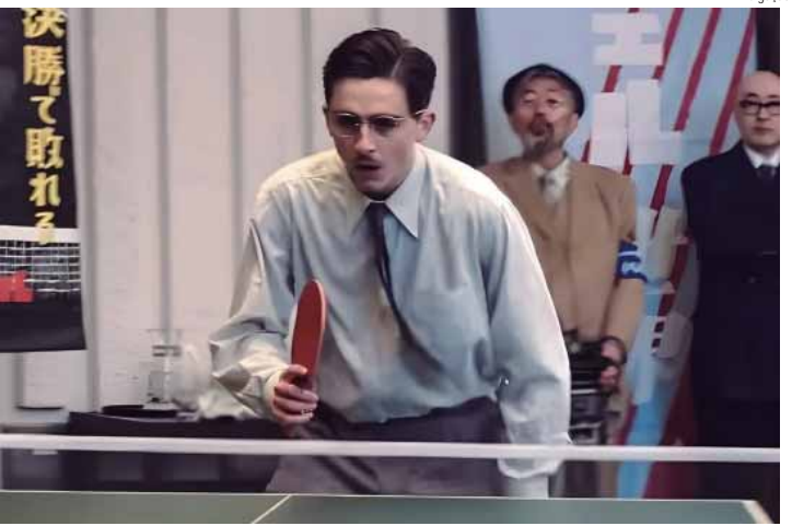
Timothée Chalamet, vencedor do Globo de Ouro, arrasa como o traficante que se tornou um ícone do tênis de mesa no filme Marty Supreme