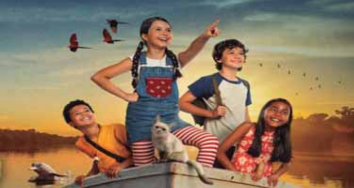
A aventura infantil O Diário de Pilar na Amazônia leva crianças e adolescentes a refletirem sobre a preservação da floresta amazônica

"EXTERMINIO: O TEMPLO DOS OSSOS" (28 Years Later: The Bone Temple -- EUA, 2025), dirigido por Nina DaCosta, é um filme de terror pós-apocalíptico e o quarto capítulo da franquia "28 Days Later". Nesta sequência de "Exterminio: A Evolução" (2025), décadas após um vírus ter devastado a humanidade, um grupo de