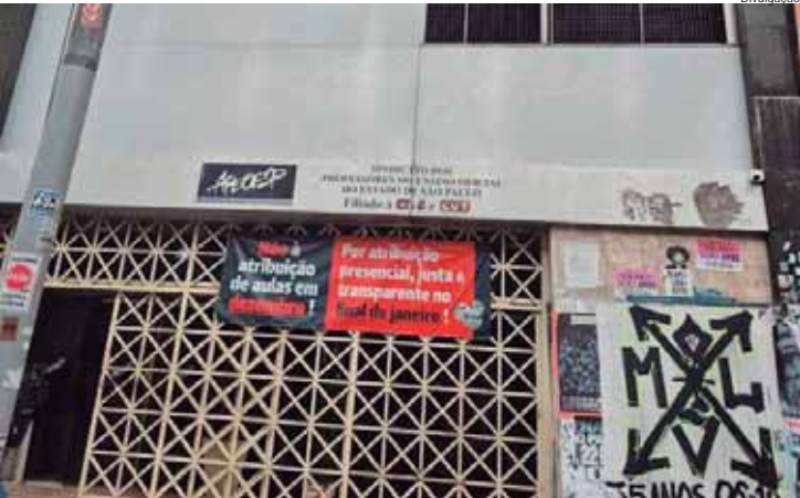
A deputada Professora Bebel repudiou a invasão à sede da Apeoesp, em São Paulo