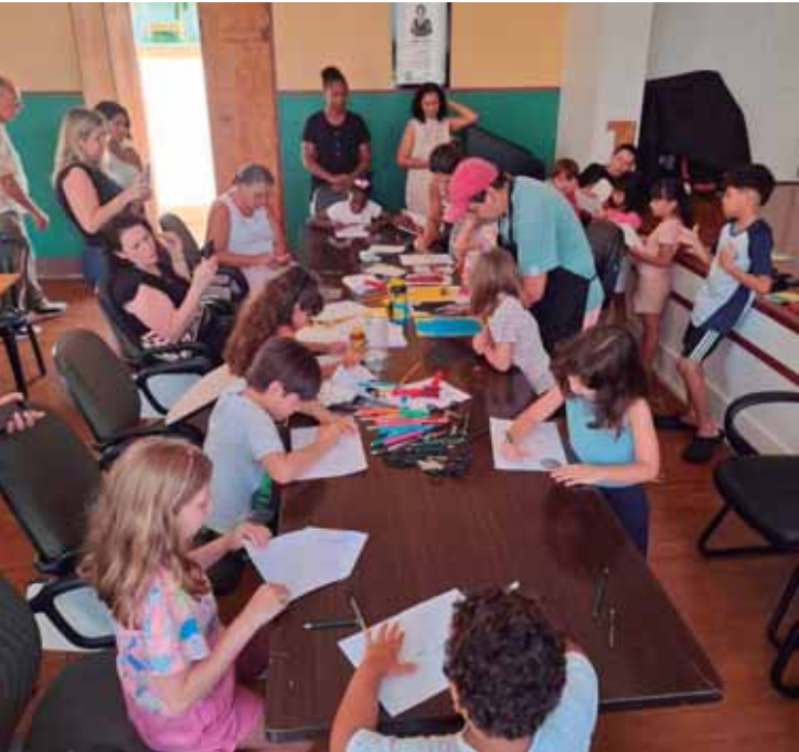
A programação de férias do Museu é voltada para crianças de 6 a 12 anos

SERVIÇO Férias no Museu Prudente de Moraes. Datas: 20/01, às 10h; e 22/01, às 14h. Participação gratuita. Local: Museu Prudente de Moraes (Rua Santo Antônio, nº 641, Centro). Agendamentos: (19) 3422-3069 (WhatsApp)