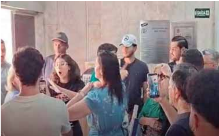
Vereadores do PL invadiram a sede da Apeoesp e jogaram pés de frango nos funcionários da entidade