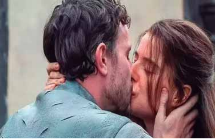
Paul Mescal e Jessie Buckley como o casal Shakespeare em luto pela perda do filho em Hamnet, Globo de Ouro de Melhor Filme e Atriz