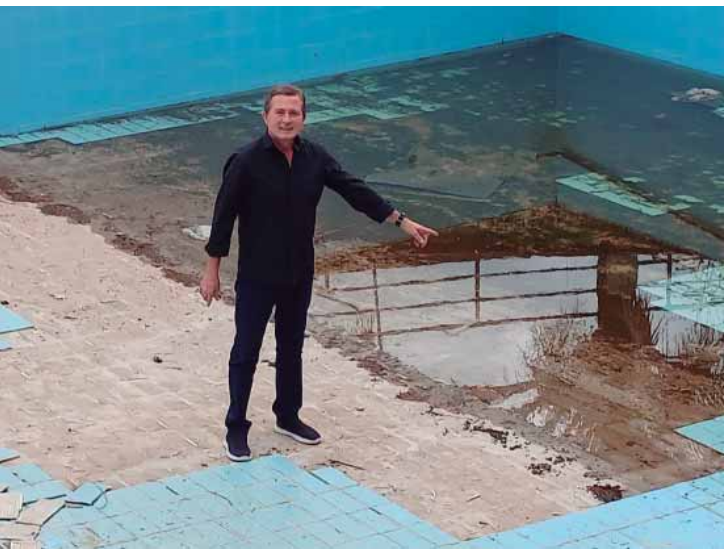
Estrutura deteriorada, acessibilidade comprometida e piscinas inoperantes evidenciam falta de gestão no esporte municipal, aponta Trevisan Jr.

"Piracicaba não pode permitir que um patrimônio público tão representativo permaneça negligenciado. Seguiremos cobrando ações concretas para que o Complexo Aquático Municipal volte a atender a comunidade com dignidade", completou o vereador.