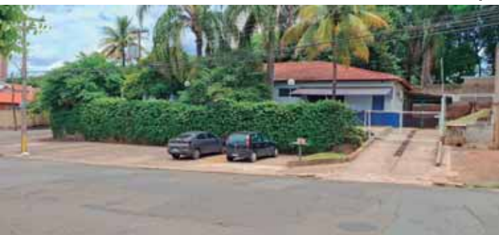
Imóvel localizado na rua Floriano Carraro, na Nova Piracicaba, tem melhor estrutura para abrigar o CAPS Infantojuvenil

aprimorar o manejo de crises, ampliar o número de salas e diversificar as atividades terapêuticas oferecidas ao público infantojuvenil do município. A nova sede conta com ampla recepção, sala de acolhimento, banheiros com acessibilidade, refeitório para os pacientes, sala de enfermagem, dois consultórios médicos, sala administrativa, quatro salas para grupos, espaço para oficinas de ambientação, área externa arborizada, além de estacionamento em frente ao imóvel e pontos de ônibus próximos, garantindo maior acessibilidade à população atendida. O CAPS IJ atende crianças e adolescentes de 5 a 18 anos com transtornos psiquiátricos graves e persistentes e funciona no modelo de porta aberta, conforme a Portaria nº 3.088 do Ministério da Saúde - o que garante atendimento de qualquer pessoa, sem necessidade de encaminhamento prévio ou agendamento. O serviço ofere-