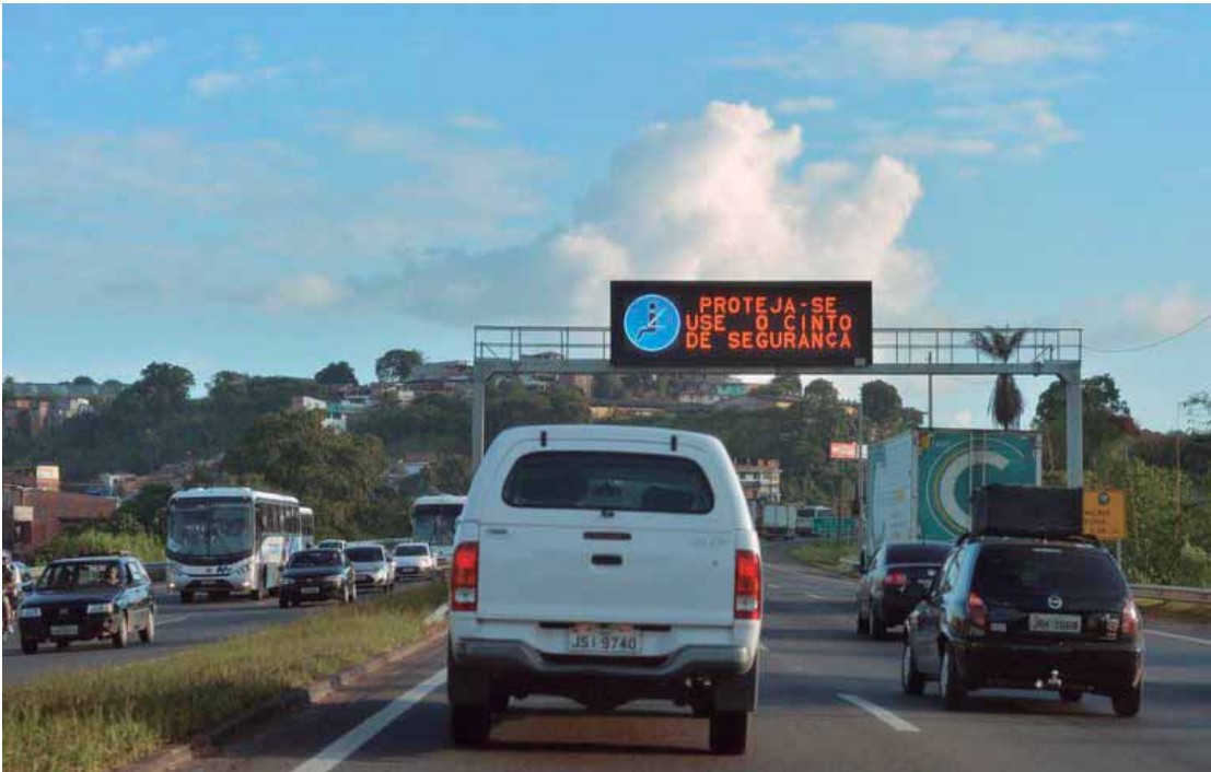
Motoristas que não cometeram infrações nos últimos 12 meses e estão inscritos no Registro Nacional Positivo de Condutores (RNPC) foram beneficiados pela renovação automática de CNH

lidade da CNH reduzido por recomendação médica, em casos de doenças progressivas ou condições que exigem acompanhamento de saúde, assim como os motoristas com a CNH vencida há mais de 30 dias, conforme prevê a legislação de trânsito. MODERNIZAÇÃO - A modernização dos serviços de trânsito acompanha a crescente adesão da população às ferramentas digitais. Mais de 2,3 milhões de brasileiros já abriram requerimento para a primeira carteira de motorista pelo aplicativo CNH do Brasil. A abertura do processo acontece diretamente pelo aplicativo da CNH do Brasil. A partir daí, o interessado tem a liberdade de escolher como prefere se preparar: pode estudar o conteúdo teórico gratuitamente pela plataforma digital, frequentar uma autoescola tradicional ou combinar as duas opções. Com o novo modelo, o processo de obtenção e gestão da Carteira Nacional de Habilitação passa a ser centralizado em uma plataforma digital única, que acompanha o motorista desde a formação até a renovação do documento. A proposta reduz burocracias, amplia o acesso à informação e contribui para diminuir gastos dos cidadãos com taxas e deslocamentos. Du-