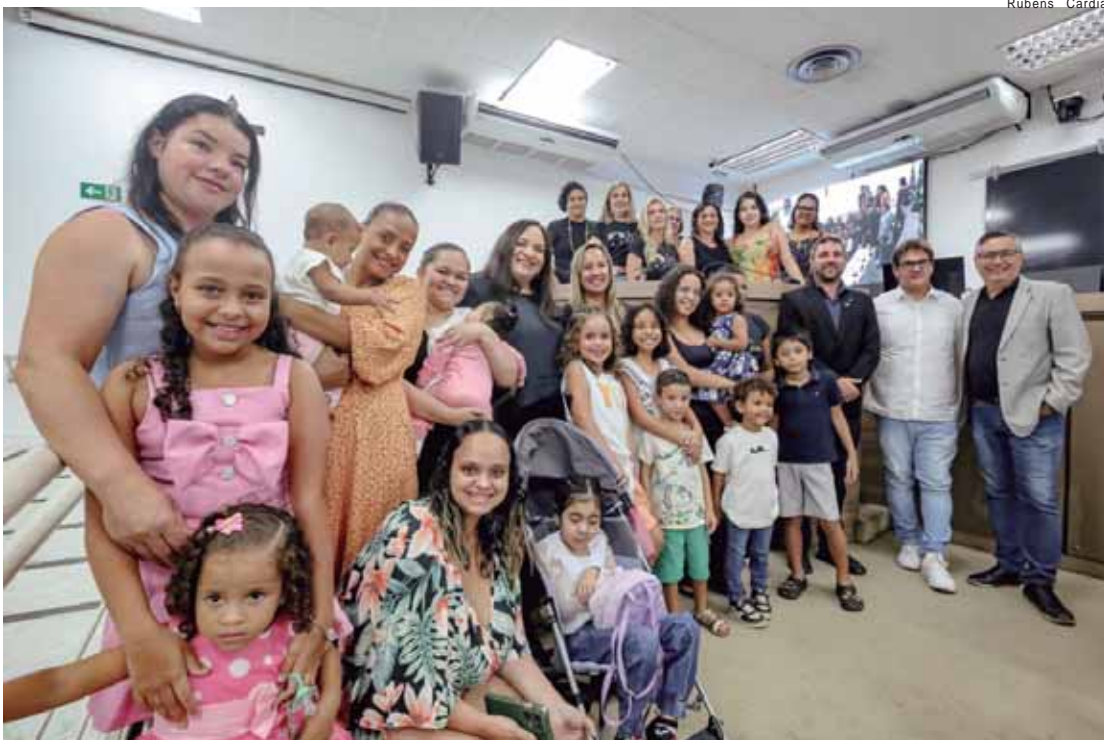
Reunião solene aconteceu na noite desta quarta-feira (14), no Plenário "Francisco Antonio Coelho"