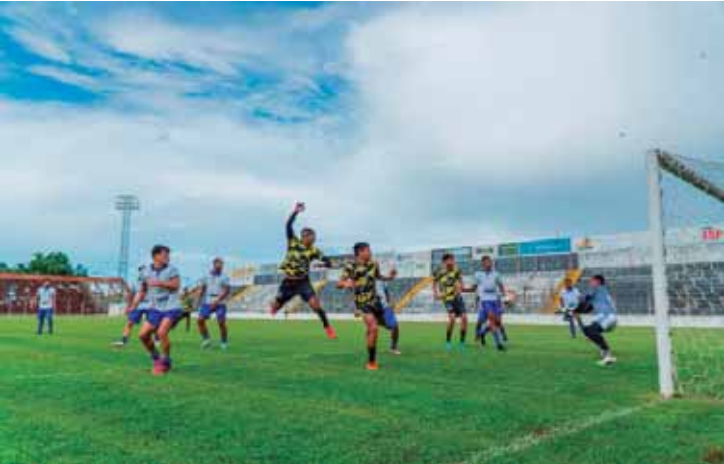
jogo treino União Barbarense 0x3 Lemense

A equipe volta a campo no próximo dia 17 de janeiro para o último jogo-treino antes do início da Série A3. O adversário será o Ecus Suzano, novamente com portões fechados para a imprensa e para os torcedores. (Colaborou Júlio Victorino)