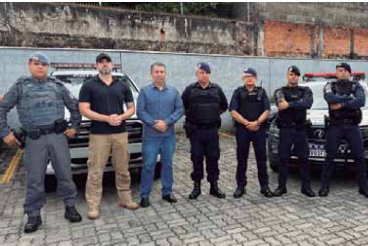
A operação também atuou no combate e na coibição de roubos e furtos de fiação, problema recorrente denunciado pelo vereador Renan Paes

ação reforça o compromisso do poder público com políticas sociais e de reinserção. Além do caráter social, a operação também atuou no combate e na coibição de roubos e furtos de fiação, problema recorrente denunciado pelo vereador e que tem causado prejuízos à população e à infraestrutura urbana. Ainda segundo o parlamentar, durante a ação, foi realizada a captura de um indivíduo que foi beneficiado na "saldinha" temporária e não retornou ao sistema prisional, onde cumpria pena por infração ao art. 157 do Código Penal (roubo). Para Renan Paes, a iniciativa demonstra a importância da atuação conjunta entre os órgãos públicos, unindo ações sociais e de segurança pública, para garantir mais dignidade, ordem e qualida-