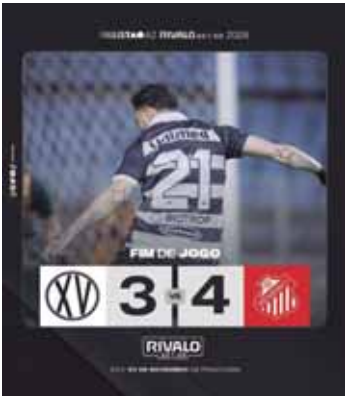
A derrota expõe mais uma vez as falhas de posicionamento e de cobertura do setor defensivo