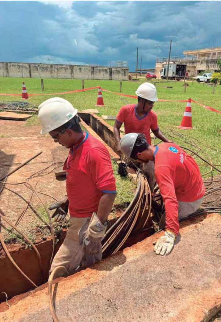
Equipes trabalharam na troca de cabos de energia para resolver problema de pane elétrica na casa de bombas da ETA Capim Fino

Os moradores também podem entrar em contato com a autarquia pelos canais de atendimento: WhatsApp 24h (19) 3403-9608; Central 24h 0800 772 9611 ou disque 115 (somente telefone fixo).