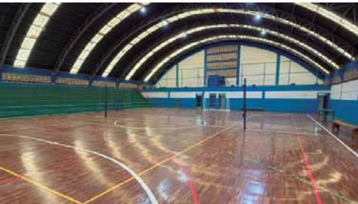
Com obra concluída, local oferecerá mais segurança, conforto e qualidade aos atletas e à população