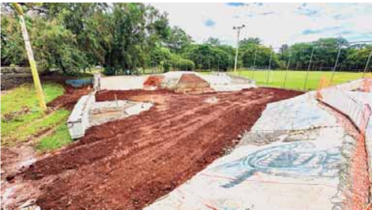
Área do street segue com as obras avançando

SERVIÇO Em caso de necessidade, a população pode acionar diretamente os órgãos de emergência. O atendimento dos Bombeiros está disponível pelo telefone 193, enquanto a Defesa Civil pode ser contatada pelo número 199; A Guarda Civil pode ser acionada no 153 e a Polícia Militar 190