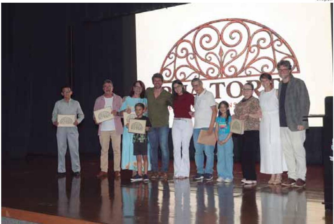
Exibição foi no Centro Pedagógico de Rio das Pedras