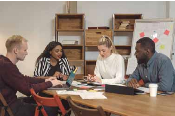
As vagas são exclusivas para pessoas com dezoito anos completos

Mais informações ou auxílio na inscrição com o Sebrae Aqui, localizado no Centro Cívico (rua Antônio Correa Barbosa, 2233, térreo 1), pelo telefone: (19) 3437-2222 ou WhatsApp: (19) 3403-1111.