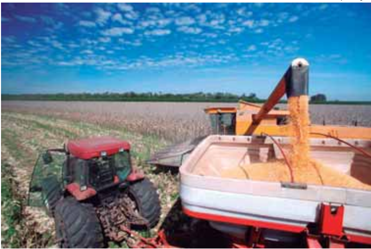
Recursos poderão ser utilizados por produtores rurais, cooperativas e agricultores familiares para custeio e investimento em diversas finalidades

O BNDES é um dos principais apoiadores do setor agropecuário. No Plano Safra 2025-2026, o Banco já aprovou R$ 26,4 bilhões no âmbito dos PAGF e atendeu a solicitações de mais de 105 mil operações por meio de operações indiretas,