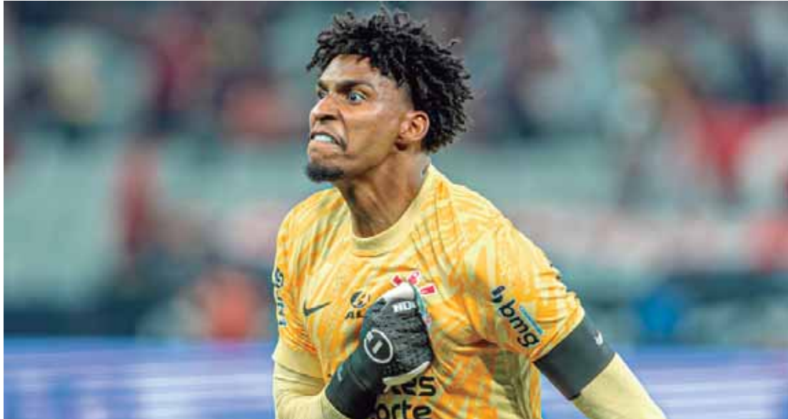
Hugo Souza pode desfalcar o Corinthians contra o Bragantino na partida de hoje, às 19 horas, em Bragança Paulista

O treinador do Timão tentou acalmar os torcedores e comentou sobre a situação: "O elenco do Corinthians é muito bom, é claro que não poder ter a disposição atletas que estão vetados pelo DM muda algumas configurações táticas, mas quem está entrando, vem dando conta do recado", comentou Dorival.