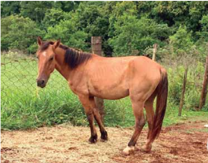
Os interessados podem comparecer livremente ao Disk Animais para conhecer e escolher os equídeos