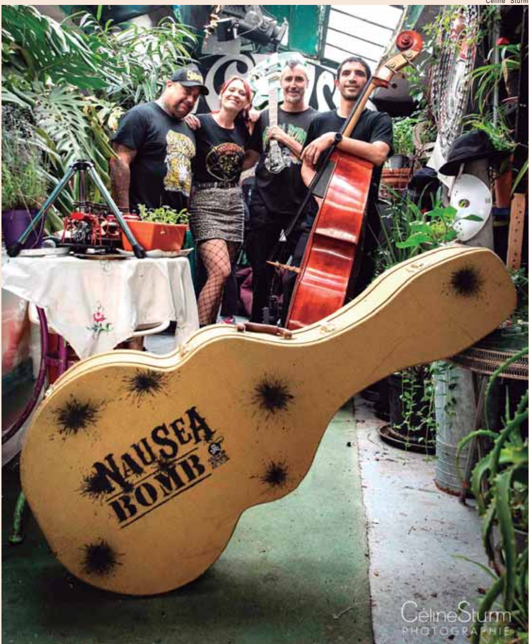
Banda Nausea Bomb faz show em Piracicaba