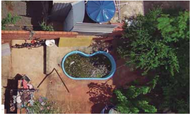
Rio das Pedras quer seguir como exemplo de combate à dengue

Com o apoio da população e as ações da Secretaria, Rio das Pedras quer seguir como exemplo de combate à dengue em 2026.