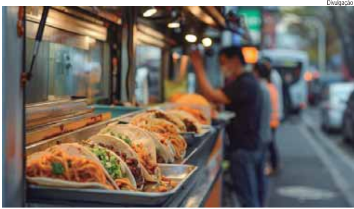
Inscrições para foodtrucks são gratuitas; evento será no Engenho Central

A Prefeitura de Piracicaba, por meio da Secretaria Municipal de Cultura, recebe inscrições para participação de foodtrucks no evento denominado Carnaval no Engenho, que será realizado nos dias 30 de janeiro, das 19 às 22 horas, e 15 e 17 de fevereiro, das 17 às 22 horas, no Parque do Engenho Central. A inscrição é gratuita e deve ser feita até 21 de janeiro, com preenchimento do formulário online disponível em https://forms.gle/WiZCXYBiTn43Ng87 . Serão selecionados até cinco foodtrucks.