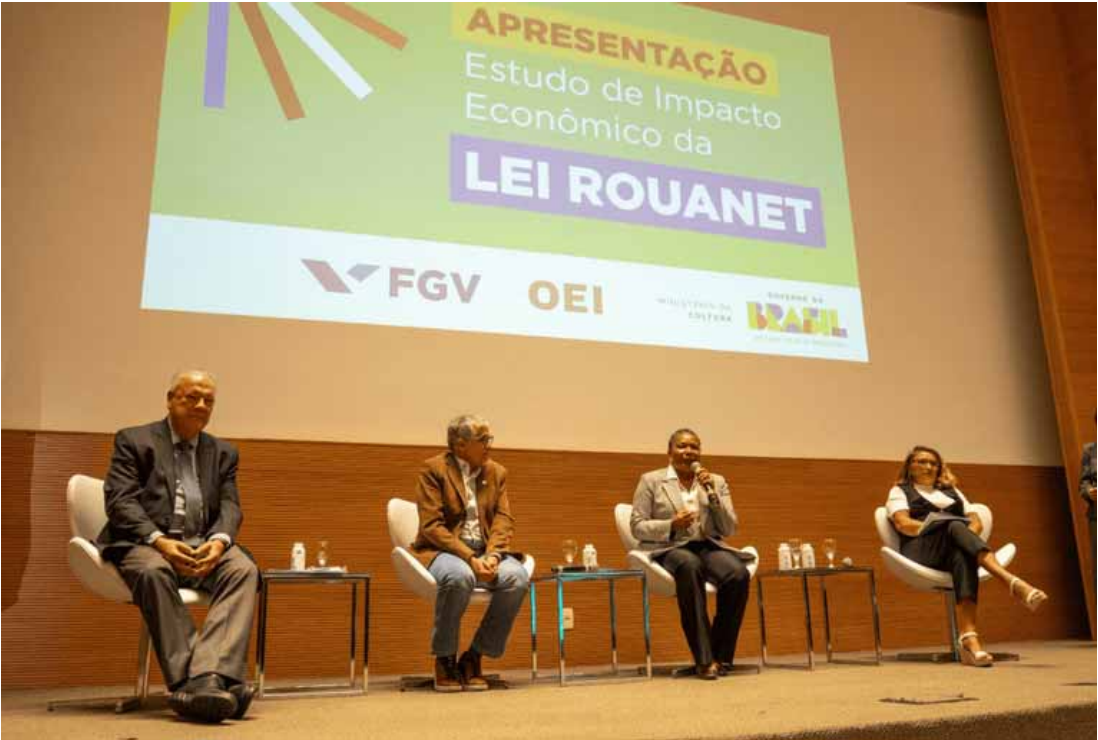
A pesquisa revela que, para cada R$ 1 investido por meio da renúncia fiscal, R$ 7,59 retornaram para a economia e para a sociedade

Além do crescimento histórico no volume de renúncia fiscal registrado em 2024, a metodologia adotada nesta edição passou a considerar, de forma mais ampla, os gastos do público que frequentam eventos culturais e os investimentos de outras fontes atraídos pelos projetos incentivados.