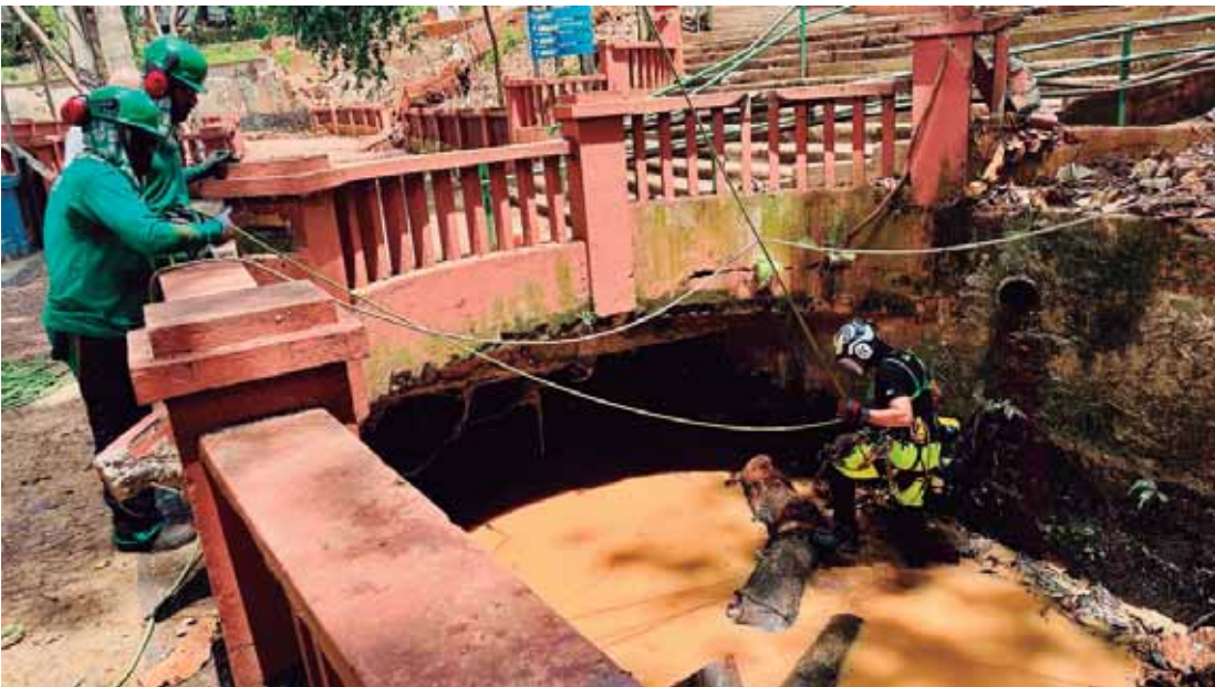
As equipes no Parque do Engenho Central na limpeza e na recolha de galhos

SAÚDE - Na Unidade Básica de Saúde (UBS) Vila Cristina, o atendimento odontológico