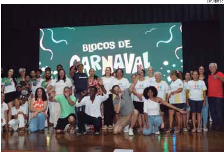
Blocos ganharão premiação em dinheiro