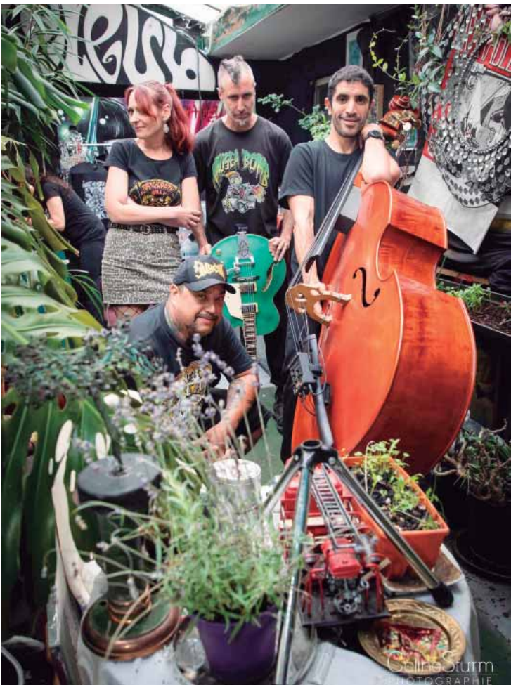
Banda Nausea Bomb se apresenta em Piracicaba

Nausea Bomb (França) e The Mullet Monster Mafia, 06/02, 19 horas. Convidados: R$ 20,00. O Nômades Beer Garden fica na Av. Dr. João Conceição, 429, no Bairro Paulista