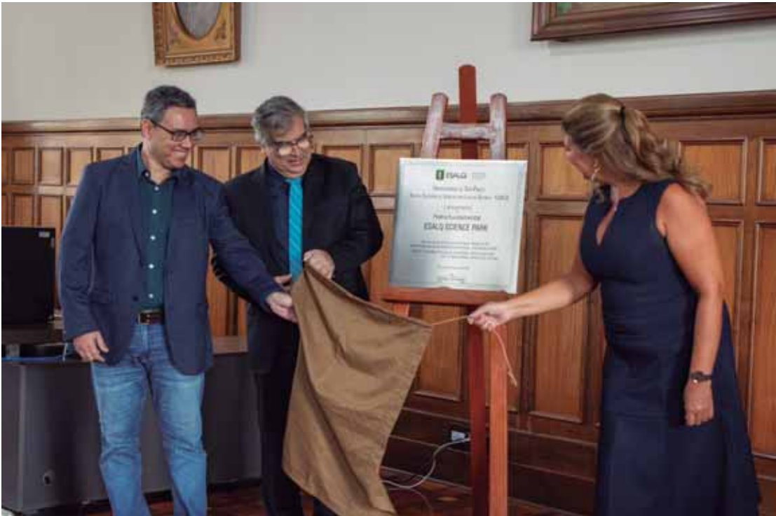
Ato marca início de uma nova etapa na consolidação de um ambiente estratégico dedicado à pesquisa

O Esalq Science Park tem como objetivo impulsionar o desenvolvimento científico e tecnológico por meio da atração de projetos de pesquisa, desenvolvimento e inovação (PD&I),