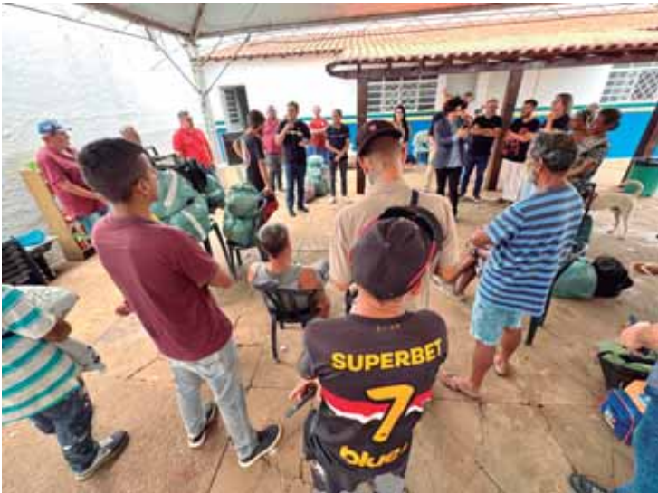
Prefeito e secretários de Criciúma, de Santa Catarina, estiveram no Centro Pop

O grupo também pôde conhecer de perto os serviços que são ofertados pelo município para a população em situação de rua, ressaltando as ações de