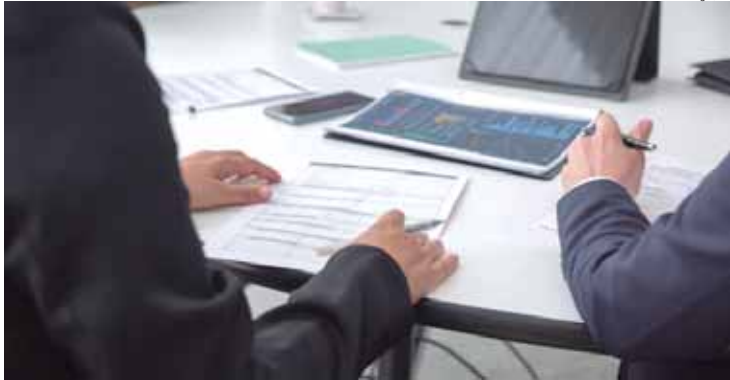
Piracicaba tem inscrições abertas para cursos gratuitos de Logística e Almoхарife

As inscrições devem ser realizadas pelo site do Qualifica SP: qualificasp.sp.gov.br . O interessado deve acessar a opção "Vagas Abertas", selecionar "Novo Emprego", escolher o formato presencial, o município de Piracicaba, o turno e o curso desejado, e clicar em "Inscrever-se". Para concluir o processo, é necessário fazer login com a conta Gov.br (CPF) e aguardar o e-mail de convocação.