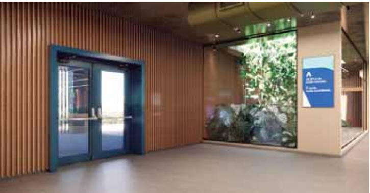
Ao todo, serão 1.600 metros quadrados de área remodelada, ampliando a funcionalidade e a capacidade de atendimento da Acipi