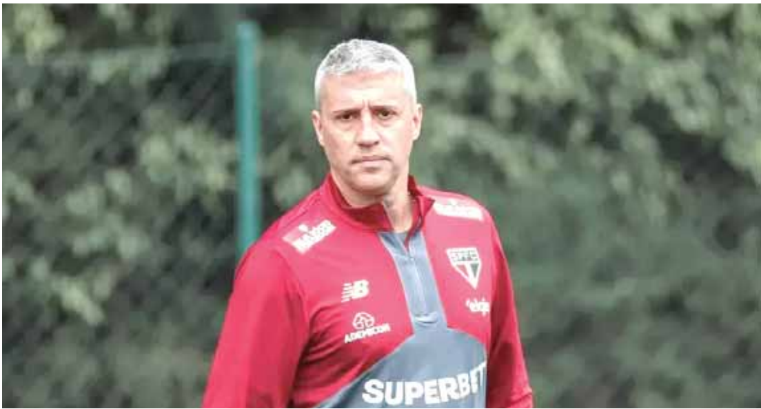
Hernan Crespo pede jovens do sub-20 por falta de opções do elenco principal

O São Paulo volta a campo nesta quinta-feira (15), às 21h45, quando enfrenta o São Bernardo, no Morumbi, pela segunda ro-