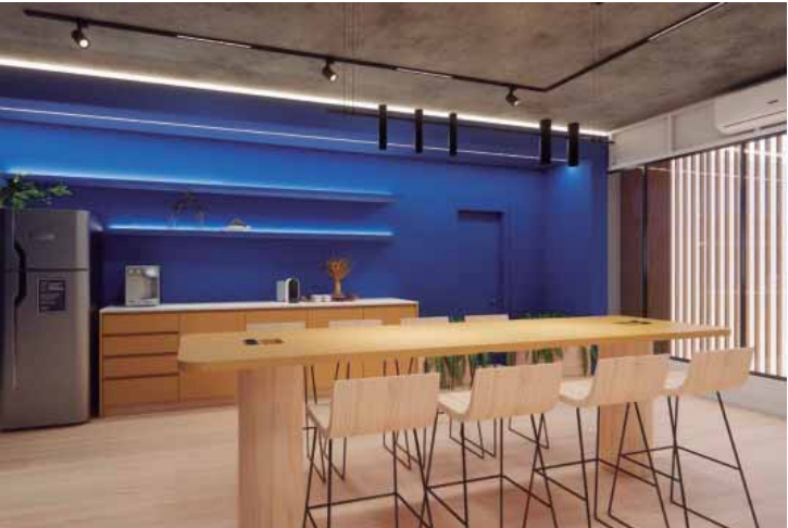
A ocupação do prédio antigo tem o objetivo de atender às necessidades das empresas associadas