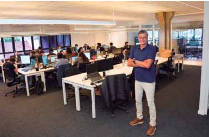
Retrofit - Área remodelada concluída no prédio da rua do Rosário, que já está recebendo clientes

COMO SE ASSOCIAR - As empresas interessadas em se associar à Acipi ou conhecer detalhes das soluções disponíveis podem acessar o link da bio (@acipiracicaba) ou entrar em contato pelo whats (19) 3417.1766.