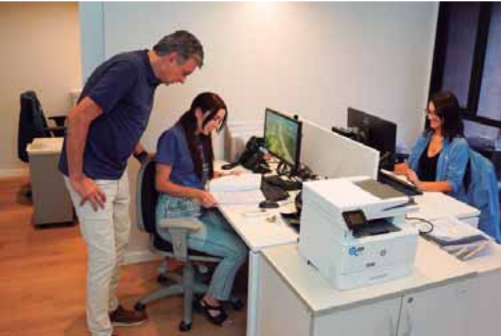
Retrofit - A Jucesp comemora os números positivos de 2025 em novas instalações, resultado da remodelações de espaços internos na Acipi