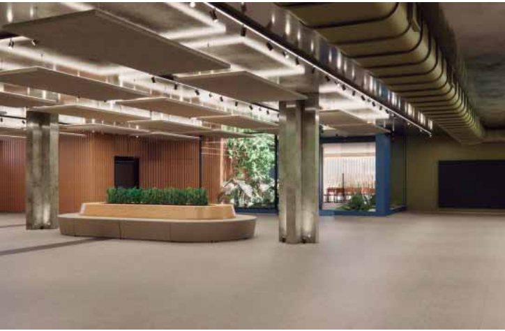
A Acipi somou 7.500 empresas associadas e deu a largada ao retrofit das instalações da rua do Rosário, conhecido como prédio antigo da Acipi