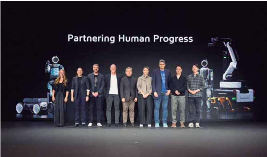
Parceria entre humanos e robôs colaborativos marca o início da era da robótica com IA co-mecendo em ambientes de manufatura

O Grupo Hyundai Motor está construindo uma Rede de Valor - a estratégia central de robótica com IA que aprovei-ta as capacidades do Grupo. No centro dessa rede está uma cadeia de valor ponta a ponta (E2E) em robótica com IA, que utiliza a infraestrutura de produção automotiva de clas-se mundial do Grupo, seu know-how em segurança e confiabilidade, e as diversas