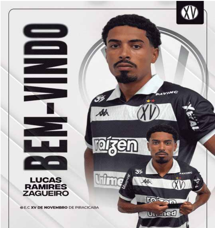
Além do zagueiro, Nhô Quim continua no mercado em busca de reforços

A diretoria alvinegra segue atenta ao mercado da bola, com o objetivo de montar um elenco equilibrado e competitivo, capaz de brigar por protagonismo em todas as competições da temporada.