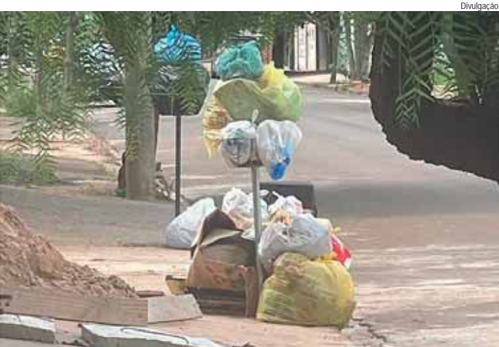
De acordo com moradores do bairro São Luiz, falta de coleta de lixo já ultrapassa duas semanas

Em caso de suspeita de dengue, a orientação é procurar o mais rápido possível a unidade de saúde mais próxima e evitar a automedicação.