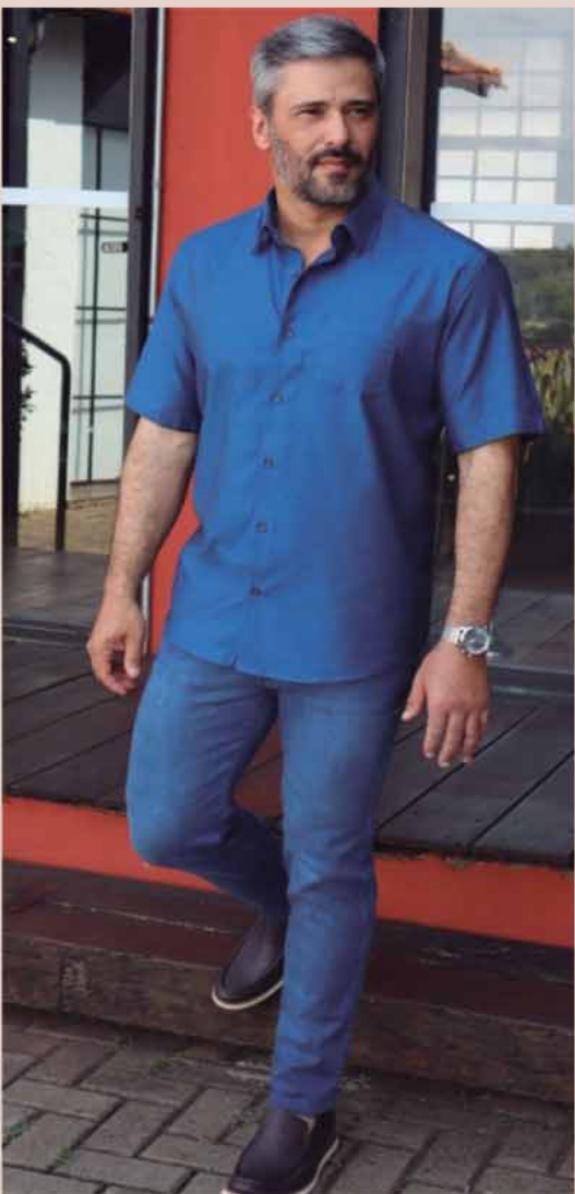
CAMISA M/C FIO EGIPCIO R$259,90 CALÇA JEANS R$299,90