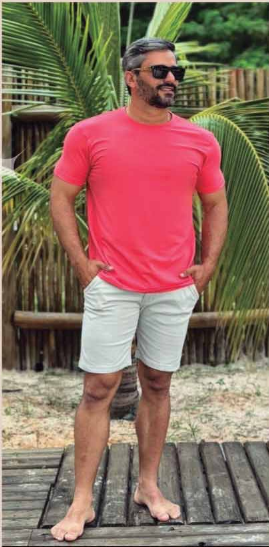
CAMISETA BÁSICA R$99,90 BERMUDA SARJA R$269,90