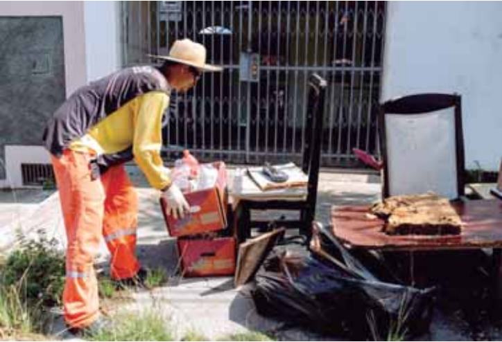
Arrastão recolhe bens que podem se transformar em criadouros

Entre as ações realizadas pela Secretaria Municipal de Saúde em 2025 no enfrentamento da dengue e de outras arboviroses está o lançamento da Cam-