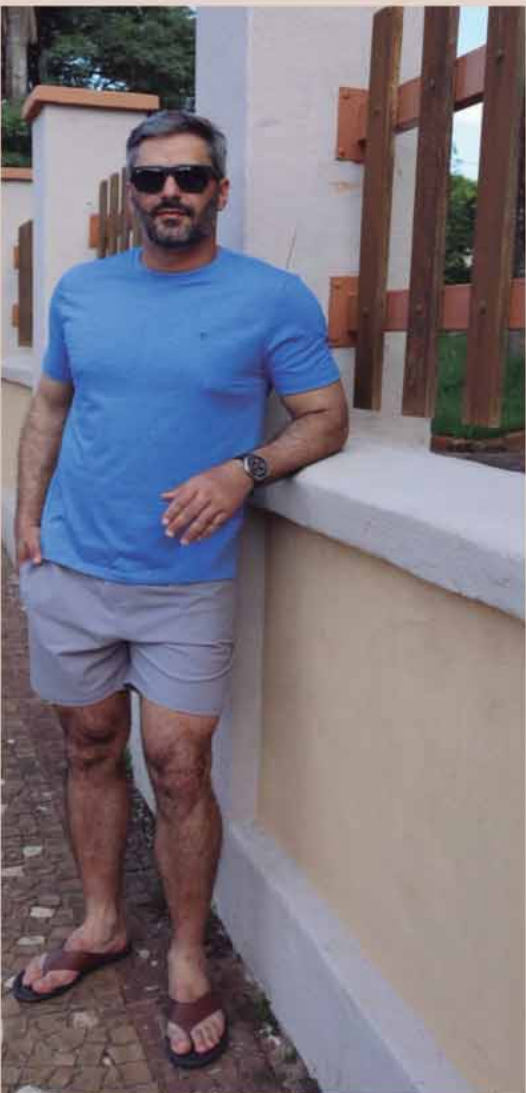
CAMISETA VINTAGE R$139,90 SHORTS BEACH R$169,90