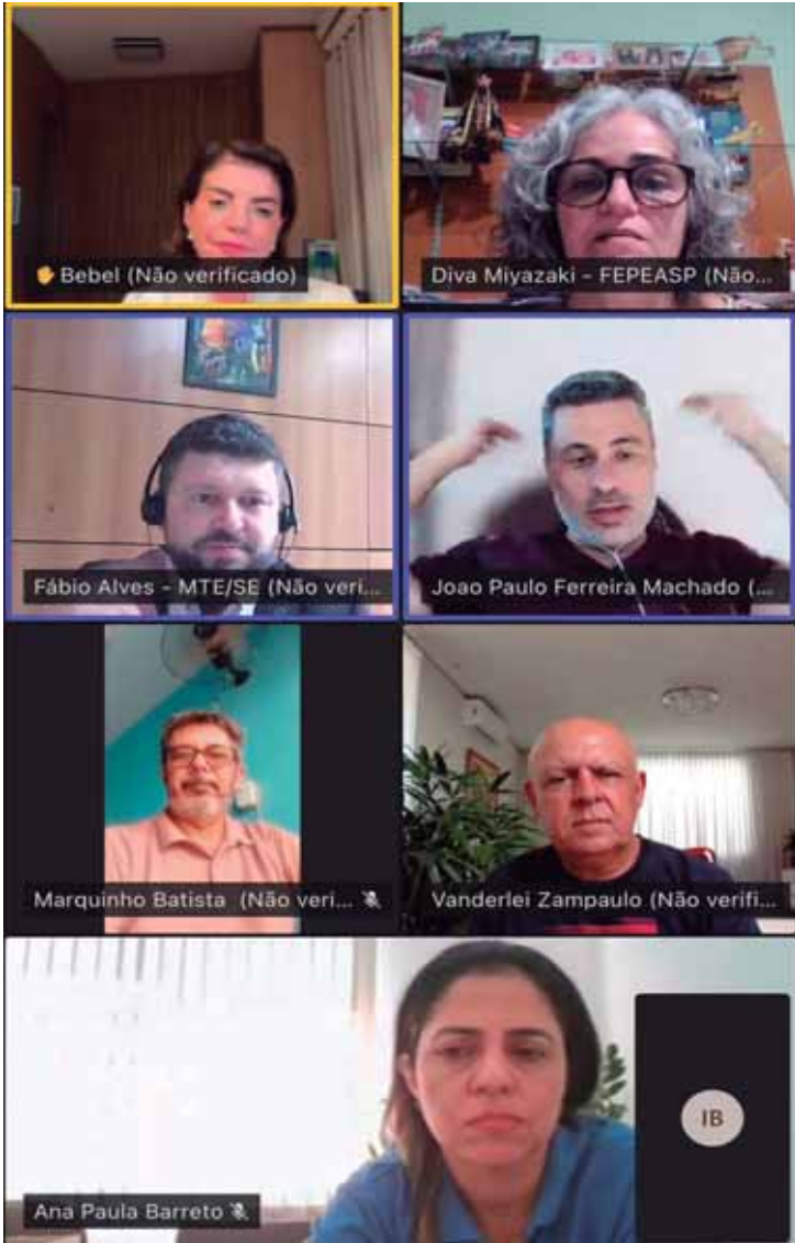
Na reunião online, foram relatados os problemas que estão sendo enfrentados por pescadores para recebimento do seguro-defeso