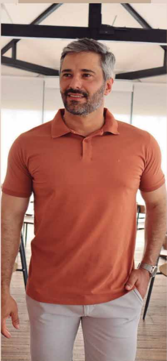
POLO ALGODÃO R$169,90