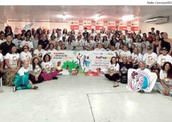
Edital vai selecionar movimentos sociais para criar 450 turmas em 17 unidades da Federação

AGRO - A Agropecuária também apresenta saldo positivo, de +85.276 postos de trabalho em 2025, com destaque para o Cultivo de Laranja (+14.446), o Serviço de Preparação de Terreno, Cultivo e Colheita (+8.979) e Cultivo de Soja (+8.059).