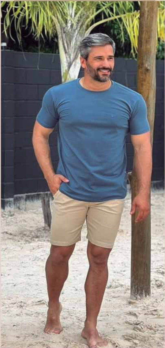
CAMISETA STONE R$139,90 BERMUDA SARJA R$269,90