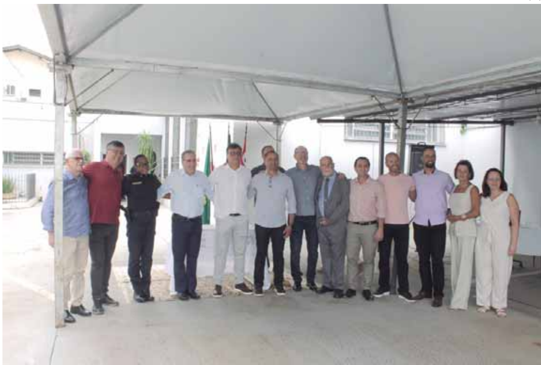
Autoridades, presidente e conselheiros do IPASP durante a cerimônia de posse

De acordo com a Lei Nº 10.360, de 15 de setembro de 2025, que altera a Lei Nº 2.840/1987 referente à estrutura administrativa do IPASP, "reorganiza os seus serviços e o seu respectivo quadro administrativo e dá outras providências", a escolha para a presidência do Instituto passou a ser indicação do poder