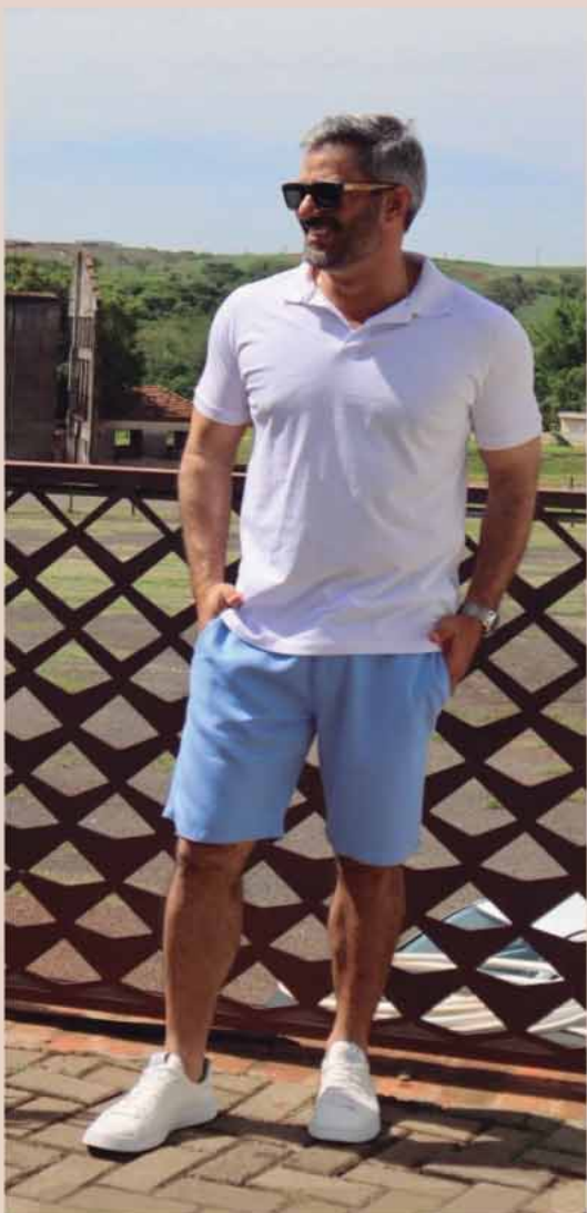
POLO ALGODÃO R$169,90 BERMUDA LINHO R$289,90