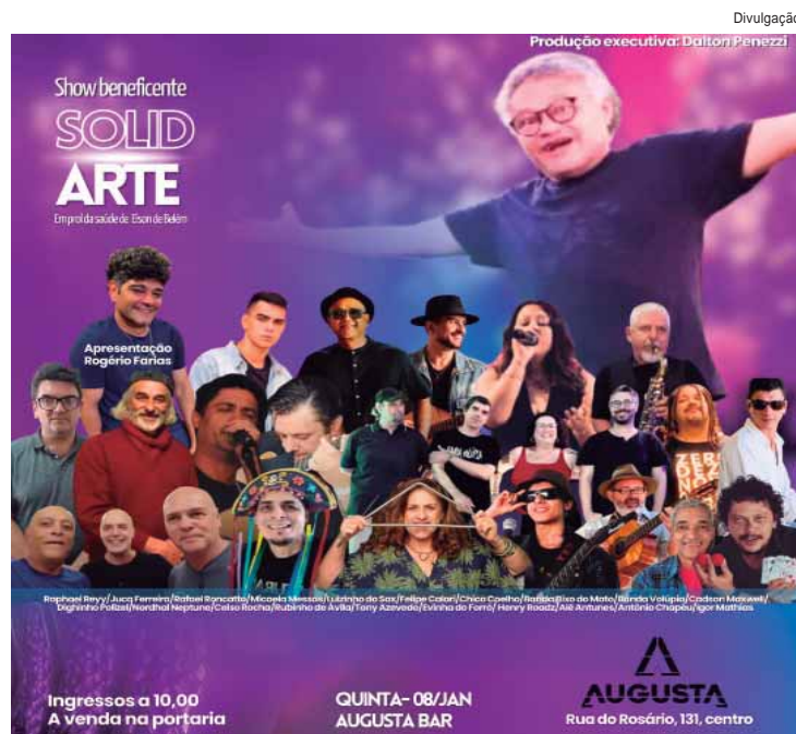
SolidARTE será realizado amanhã, 8, no Augusta Bar

A gestão também pretende fortalecer o papel social da entidade, que já desenvolve ações comunitárias e projetos de qualificação de jovens em situação de vulnerabilidade, além de aprofundar o diálogo com o poder público em todas as esferas. "Ninguém avança sozinho. É pela união e pela cooperação que vamos fortalecer a indústria regional", resume o novo presidente.