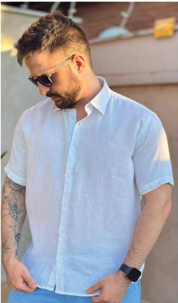
CAMISA LINHO PURO MANGA CURTA R$ 429,90