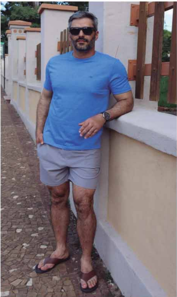
CAMISETA VINTAGE R$139,90 SHORTS BEACH R$169,90