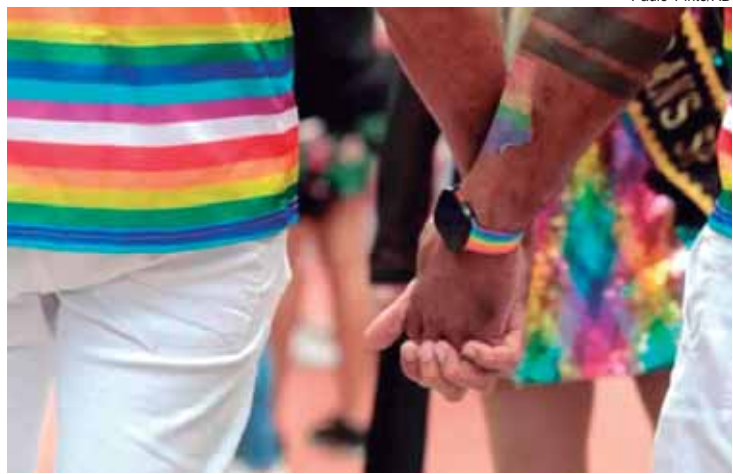
Proposta amplia a produção de dados e pesquisas sobre cultura LGBTQIA+.