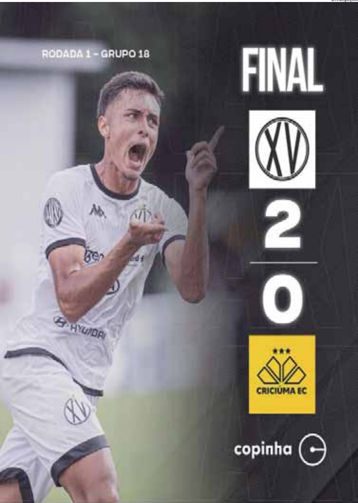
Nhô-Quim venceu o Criciúma por 2 a 0, em uma atuação segura e eficiente