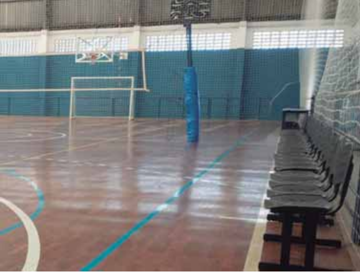
Ginásio Garcia Neto, o mini-ginásio, já recebeu os novos bancos de longarina