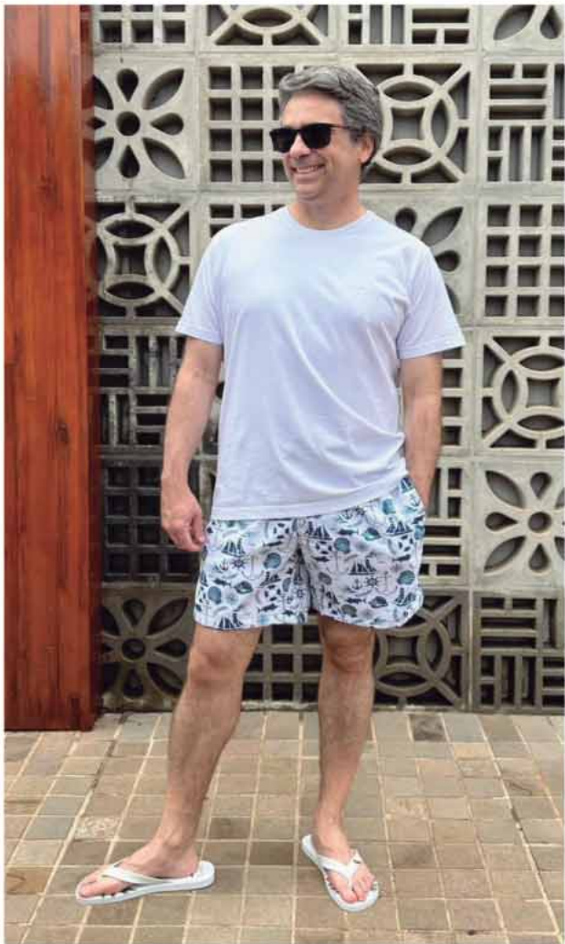
CAMISETA BÁSICA R$99,90 SHORTS BEACH ESTAMPADO R$179,90

“DICAS DE LOOK, PARA CELEBRAR A VIRADA DE ANO!”