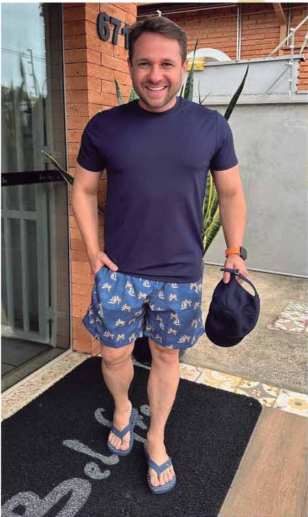
CAMISETA GO FRESH R$149,90 SHORTS BEACH ESTAMPADO R$179,90