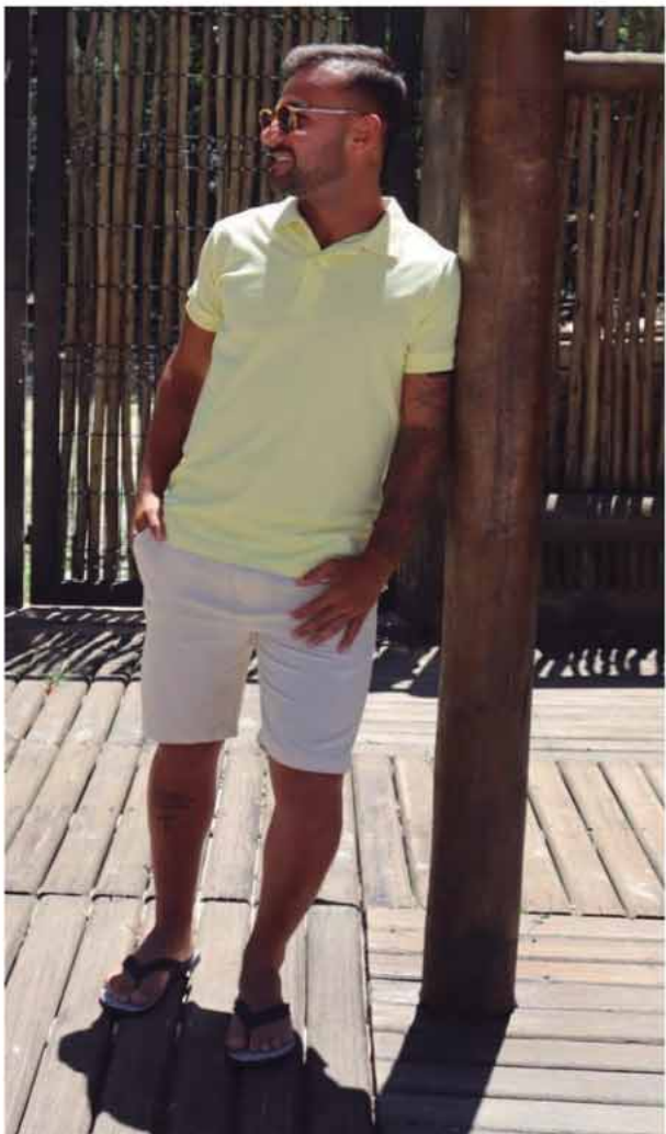
POLO ALGODÃO R$169,90 BERMUDA LINHO R$ 289,90