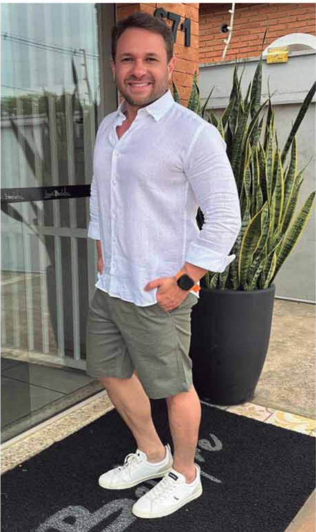
CAMISA LINHO PURO MANGA LONGA R$ 529,90 BERMUDA MOOVEXX R$339,90