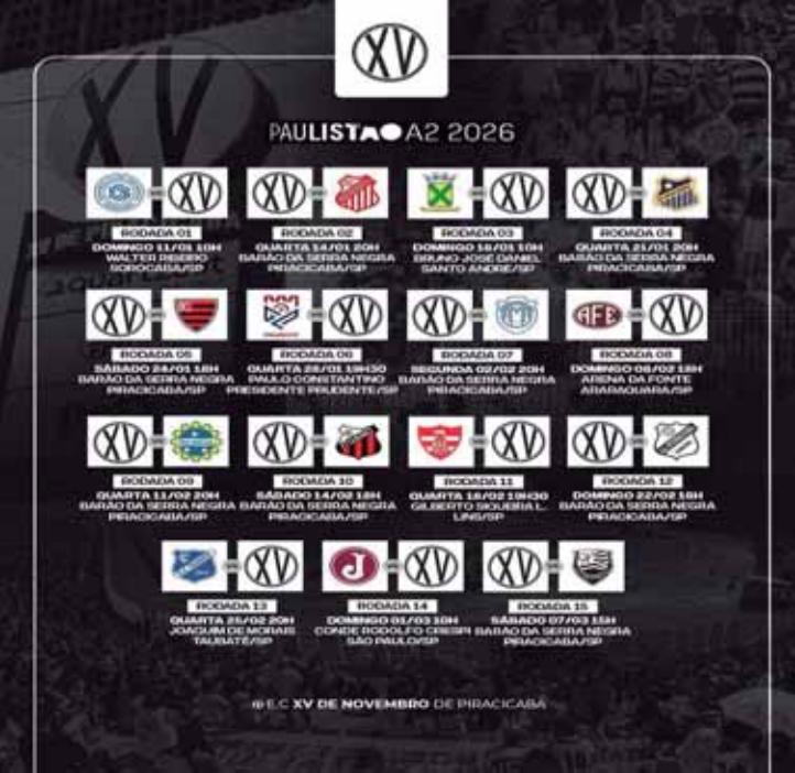
Calendário Série A2 com os confrontos do XV de Piracicaba