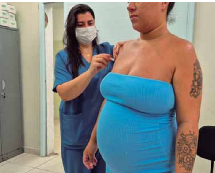
A iniciativa faz parte de um programa nacional do Sistema Único de Saúde (SUS)

Pré-Mirim Misto; e 18 de dezembro, com as decisões das categorias Masculino Série Prata e Masculino Série Ouro.