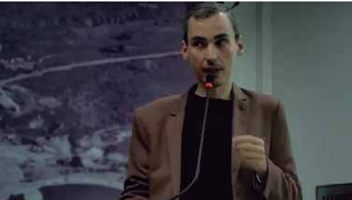
Segundo o vereador, o primeiro ano foi marcado por resultados concretos e por uma postura firme na defesa do interesse coletivo

"Foi um ano intenso, de muito aprendizado e dedicação. Há muito mais que já fizemos e continuaremos fazendo. O compromisso permanece: servir a população com honestidade, transparência e responsabilidade".