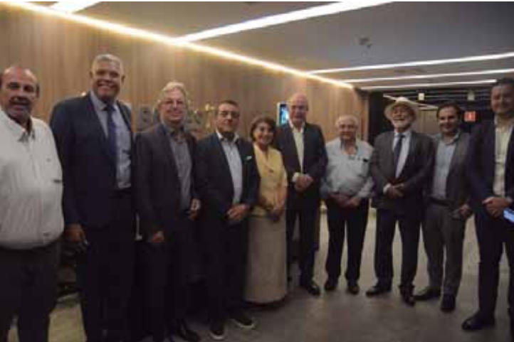
Comitiva da que apresentou demandas ao presidente do BNDES, Aloizio Mercadante