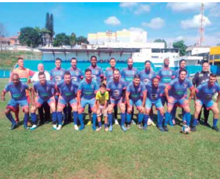
Ano foi marcado com competições municipais, estadual e regional em futebol, futsal, voleibol e corrida

para os próximos dias. As rodadas tiveram início em 11 de outubro e se encerrarão neste sábado (13), totalizando 28 jogos, sempre realizados aos sábados. A programação final contará com os seguintes confrontos: Campo Mourão x Tubarão (Dentinho), Joaçaba x Joinville (Fraldinha), Umuarama x Minas (Dentinho) e São José x Cascavel (Fraldinha). Já no domingo 14 de dezembro, acontece a final do Campeonato Municipal de Futebol Veterano, às 8h, entre S.C. Caveiras x Terceirinho F.C., competição que contará com 250 inscritos. Ainda no domingo, 14 de dezembro, São Pedro realiza mais uma edição da Corrida de São Pedro, evento que reúne corredores da cidade e de toda a região, fortalecendo o calendário esportivo regional e incentivando a prática da modalidade entre iniciantes e atletas experientes. A semana também marca as decisões do 1º Campeonato Municipal de Voleibol, que reunirá 250