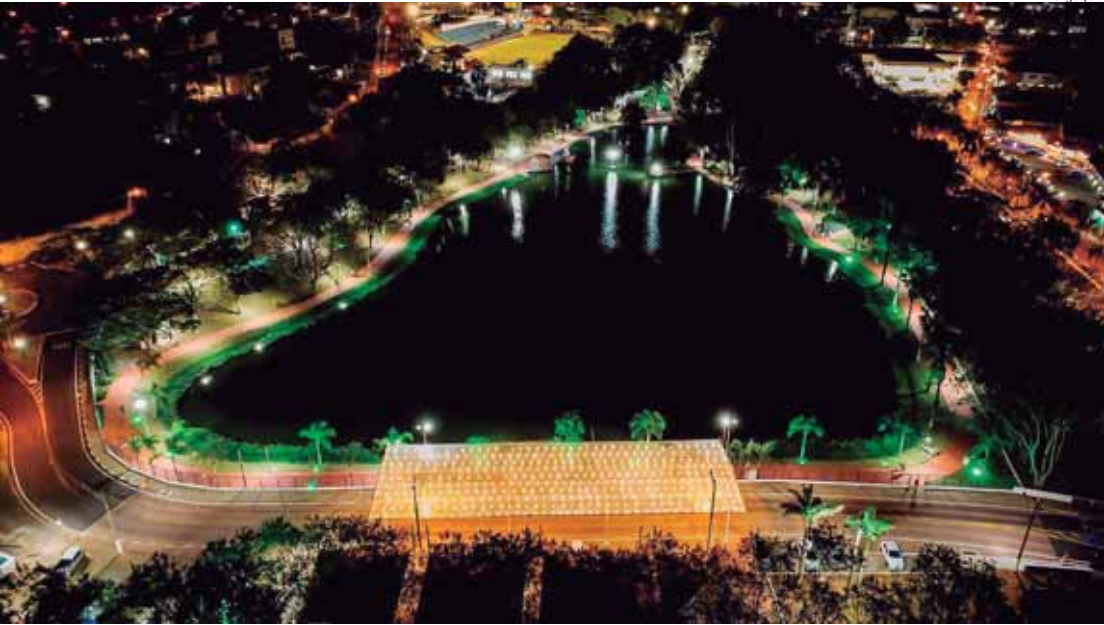
A iniciativa reúne uma das transformações mais amplas já realizadas no setor turístico local

A cidade de São Pedro também apresentou resultados expres-