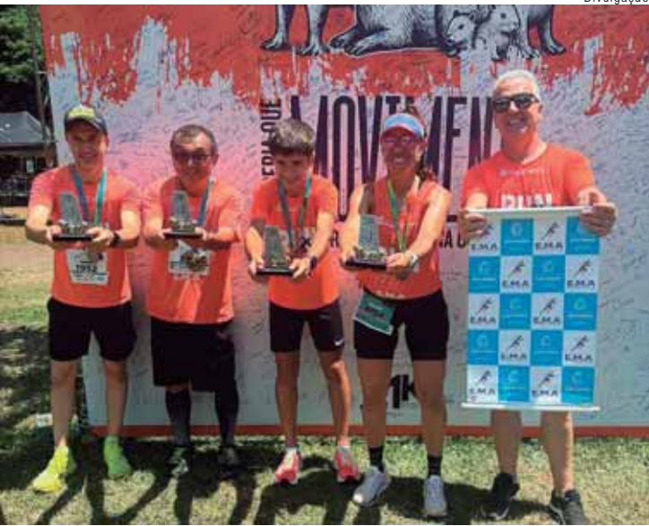
São Pedro conta hoje com uma delegação de atletismo formada por 180 alunos inscritos