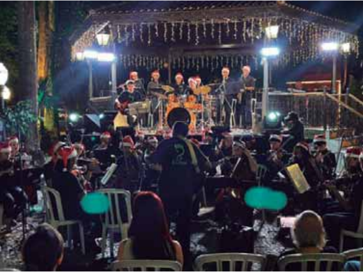
A agenda contempla mais de 10 atrações gratuitas ao longo do mês