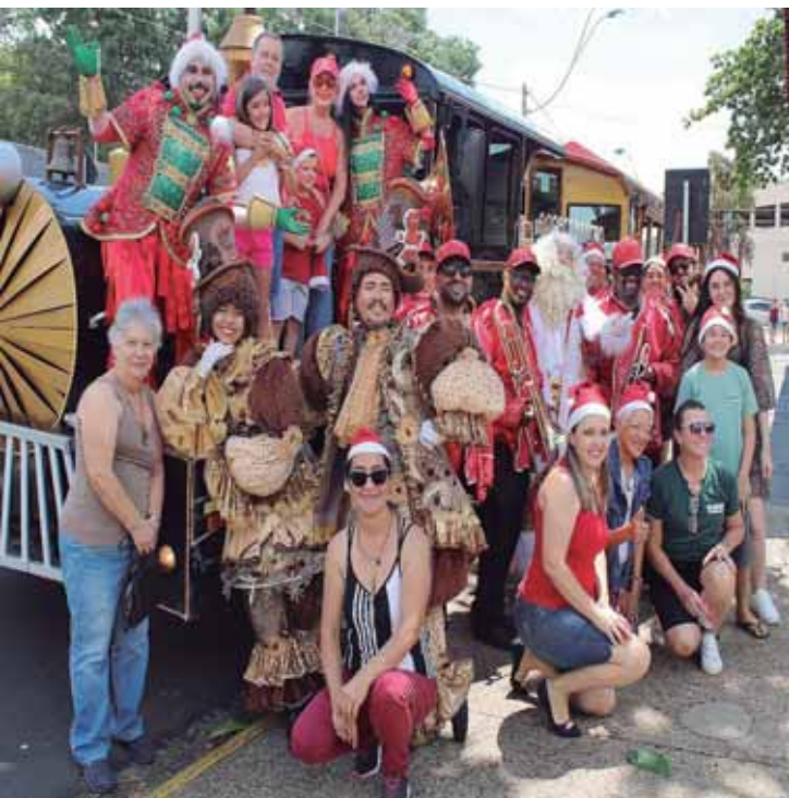
Primeira semana de passeios foi um sucesso

ta: 18h30 às 22h30 (último embarque às 22h) Sábados: 16h às 19h30 e 20h30 às 22h30 (último embarque às 22h) Domingos: 18h30 às 21h30 (último embarque às 21h) Pontos de troca de brinquedos: Acisp, Art's Trama, Casa Jardim, Casa do Eletricista, Casa Matarazzo, Copy Center Cândida, Delta Center Vídeo, Doce + Doce, Jap Casa do Encanador, Loja Amália, Losso Magazine, Nova Ótica, Opção Presentes, Papelaria Kleal, Parati Materiais Elétricos, Quick Fit, Shopping do Bebê, Sorveteria Doce Mel, Supermercado Scoton, Zambello Gelateria. O Trenzinho do Natal Solidário oferece à população a oportunidade de aproveitar momentos especiais em família e, ao mesmo tempo, contribuir com quem mais precisa. Regulamento completo: www.acipspsaopedro.com.br