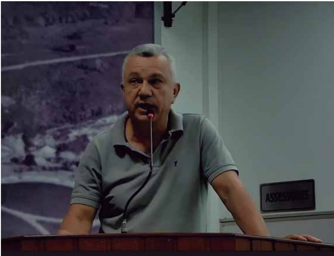
Vereador apresentou balanço do primeiro ano de mandato com foco em transparência, fiscalização e justiça social

Fiscalização ativa - O vereador destacou ainda sua atuação constante como fiscalizador, visitando escolas, a unidade de saúde, obras municipais e diversos setores públicos. As visitas resultaram em requerimentos e cobranças por