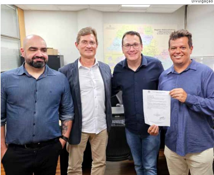
O recurso chega em um momento estratégico e fortalece o atendimento prestado à população.

COMPROMISSO - Ao concluir a apresentação, o vereador destacou que 2025 foi o início de um projeto maior de dedicação ao município. "Encerramos o primeiro ano com muito trabalho e consciência do que ainda precisa ser feito. O compromisso permanece: estar ao lado da população, defender nossos animais e fiscalizar com honestidade e firmeza. Meu mandato é e continuará sendo para servir Águas de São Pedro", declarou.