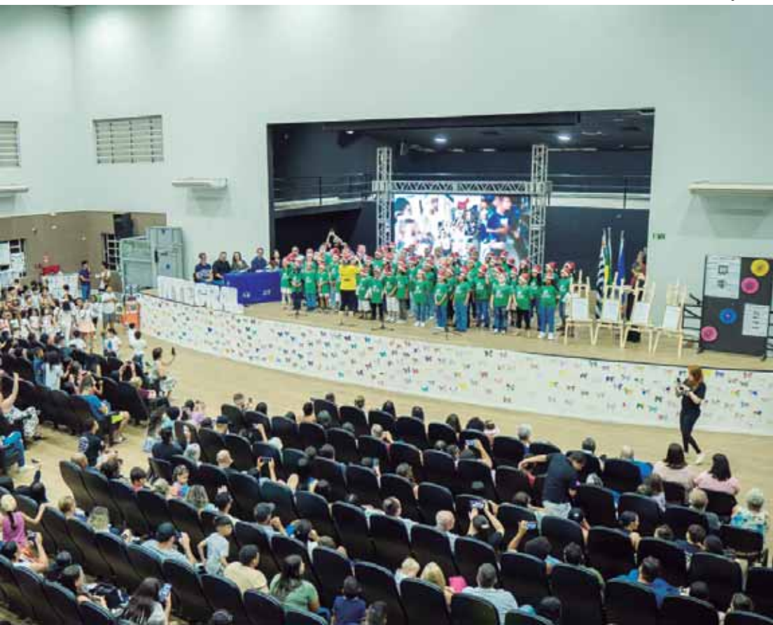
A cerimônia, aberta ao público, apresentou o resultado de um ano de trabalho

Premiações - Quatro escolas da Rede Municipal receberam do Governo do Estado de São Paulo o selo Escola Ouro: Emeb Celso Silveira Melo, Emeb Gentila Iolanda