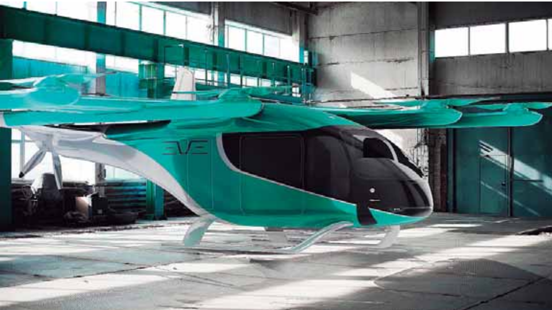
Eve Air Mobility é uma subsidiária da Embraer

"Esse financiamento acelera uma etapa crítica do nosso programa: a integração do sistema de propulsão elétrica, que garantirá desempenho, segurança e confiabilidade à nossa primeira aeronave certificável. Agradecemos ao BNDES pela confiança e pelo apoio contínuo à