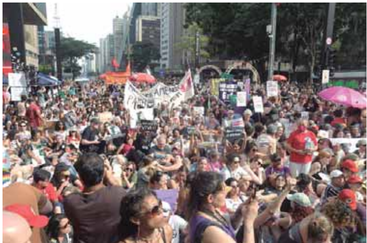
Ato na avenida Paulista, em São Paulo, reuniu mais de nove mil participantes