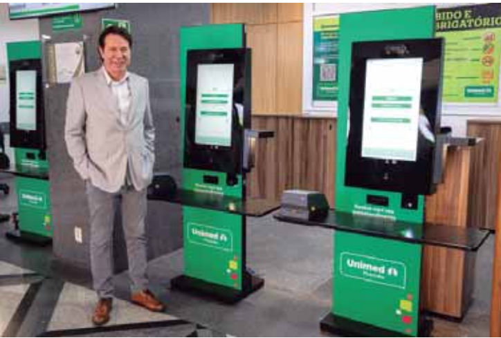
Ferramenta otimiza o fluxo hospitalar e qualifica a jornada do paciente desde o primeiro contato

O fluxo começa antes mesmo do procedimento. Dois dias antes da internação eletiva, o paciente recebe, automaticamente via WhatsApp, uma mensagem para confirmação. Após essa etapa, são encaminhadas orientações, o manual do paciente e um QR