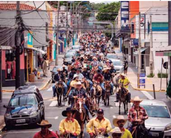
Cavaleiros e amazonas de diferentes idades desfilaram pelas ruas da cidade