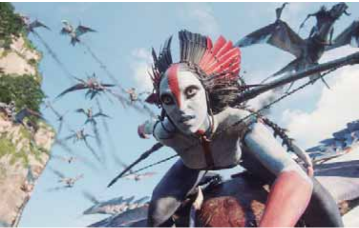
Oona Chaplin, neta do lendário Charlie Chaplin, vive em Avatar 3 a feroz Varang, líder da nova e agressiva tribo Povo das Cinzas

"A EMPREGADA" (The Housemaid -- EUA, 2025) é um eletrizante e perturbador suspense psicológico que terá pré-estreia neste fim de semana no Cine Araújo. O filme só será lançado nos cinemas brasileiros no próximo dia 1º de janeiro de 2026. Dirigido por Paul Feig, é uma adaptação de Rebecca Sonnenshine do romance best-seller de 2022 da autora Freida McFadden. Na perturbadora trama, a jovem Mellie (Sydney Sweeney) é uma ex-presidiária que está em liberdade condicional. Passando por dificuldades e tentando escapar do passado, ela aceita um emprego como empregada doméstica na casa dos ricos Winchester, Nina (Amanda Seyfried) e Andrew (Brandon Skener). Mas o que começa como o emprego dos sonhos, rapidamente se transfor-