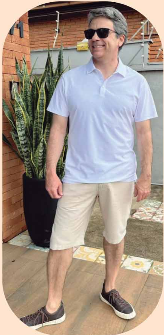
POLO ULTRA FRESH R$189,90 BERMUDA R$239,90