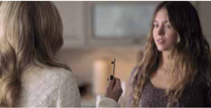
O eletrizante suspense A Empregada só estreia no Brasil dia 1º de janeiro, mas terá pré-estreia em Piracicaba neste fim de semana

ma em algo muito mais sombrio e perigoso: um jogo sexy e sedutor de segredos, escândalos e poder. Por trás das portas fechadas dos Winchester esconde-se um mundo de reviravoltas chocantes. Millie descobre que a casa esconde segredos muito mais perigosos do que os seus. Os críticos america-