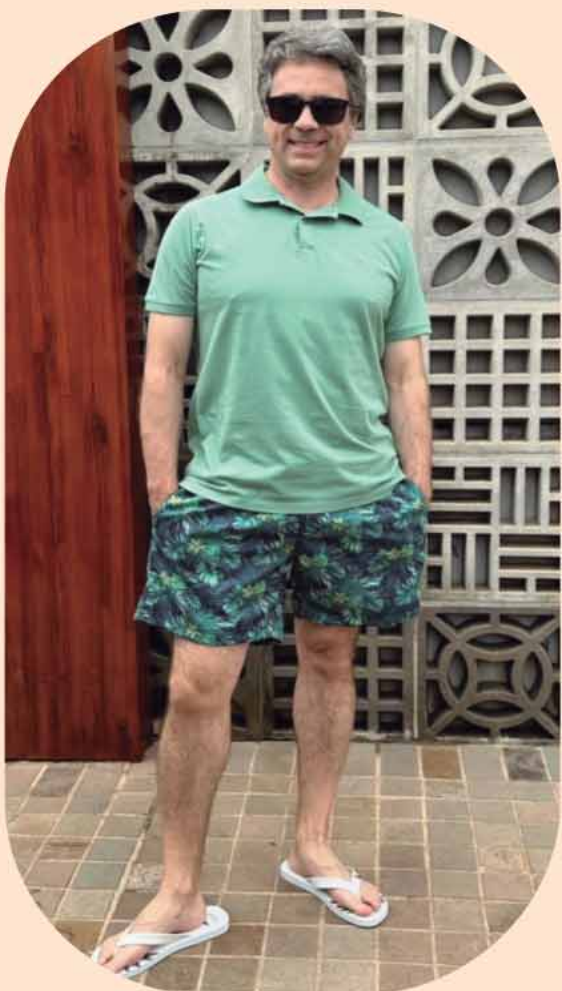
POLO ALGODÃO R$ 169,90 SHORTS BEACH R$179,90