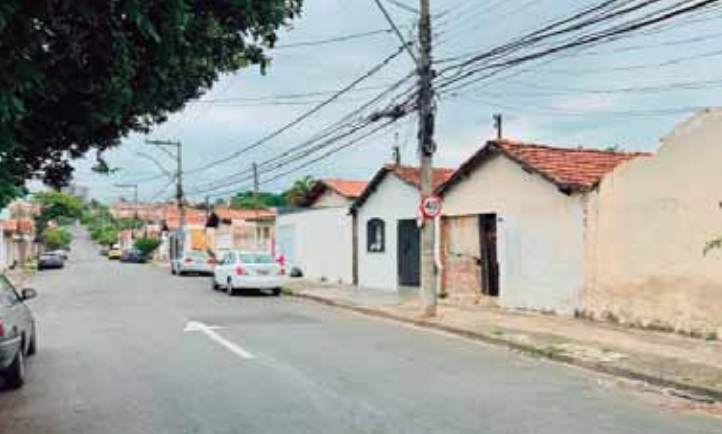
Intervenções serão executadas conforme a demanda técnica, atendendo diferentes regiões de Piracicaba, como a rua Dr. Jorge Silveira, no bairro Morumbi

As intervenções serão executadas conforme a demanda técnica, atendendo diferentes regiões de Piracicaba, como, por exemplo, a rua Dr. Jorge Augusto da Silveira, no bairro Morumbi, que sofreu com alagamento na última sexta-feira (12), em decorrência das fortes chuvas. Os serviços contemplam a execução, recuperação e ampliação de galerias de águas pluviais, além da implantação e manutenção de dispositivos essenciais para o funcionamento do sistema de drenagem, como bocas de lobo, poços de visita, drenos, sarjetas, sarjetões e estruturas complementares. O projeto também prevê obras de recomposição viária e recuperação de áreas afetadas pelas intervenções, garantindo a funcionalidade urbana após a conclusão dos trabalhos.