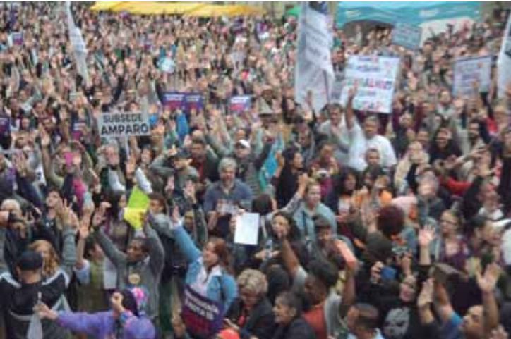
Manifestação reuniu mais de cinco mil participantes em frente à Secretaria