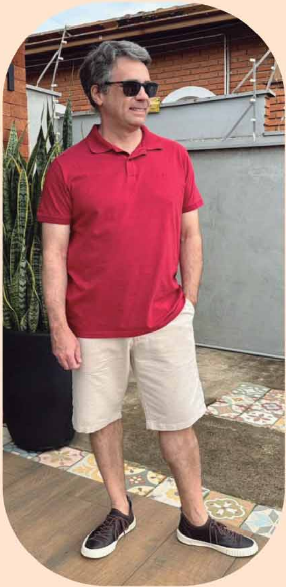
POLO ALGODÃO R$169,90 BERMUDA R$239,90