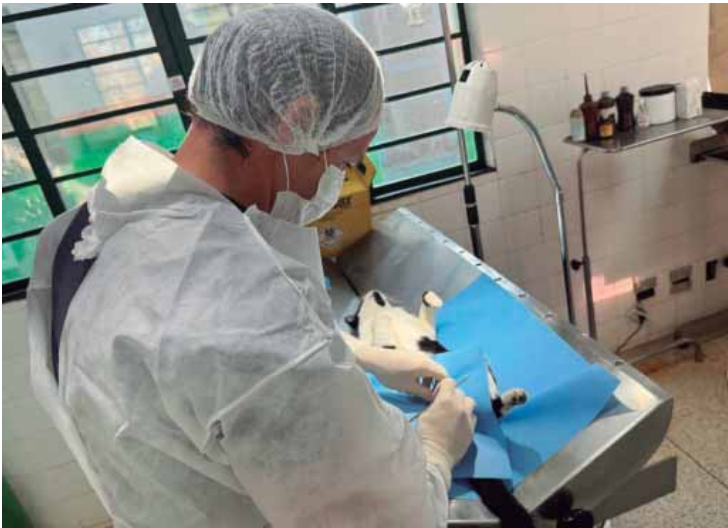
Prefeitura promove campanha de castração gratuita para cães e gatos