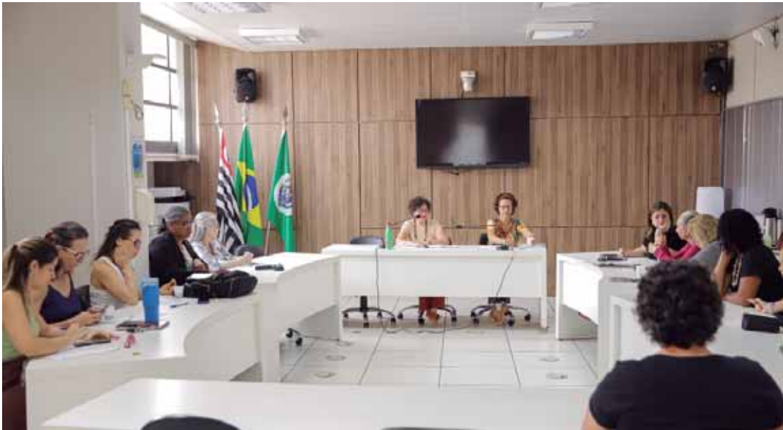
Última reunião da rede aconteceu na tarde de quarta-feira (17)

"É o Executivo que tem orçamento e a caneta na mão. Fazemos um esforço tremendo de todos os meses nos reunirmos, tirarmos ações e fazermos o debate. Mas sinto falta da presença do pessoal da Prefeitura. Se há uma coordenadoria, ela deveria estar aqui para discutir estratégias e o