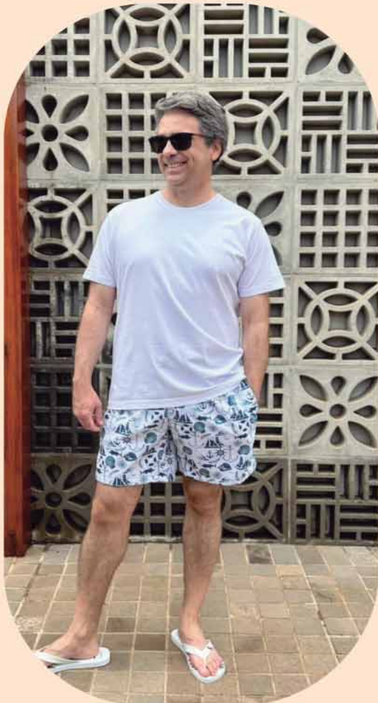
CAMISETA R$ 99,90 SHORTS BEACH R$179,90