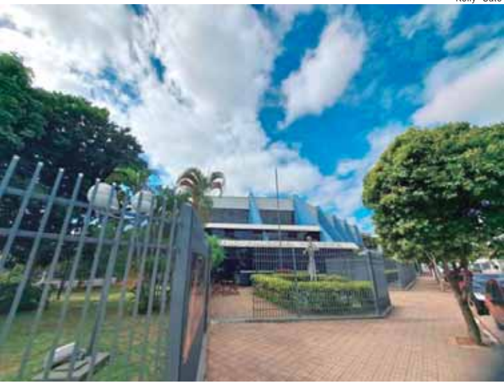
Fachada do Teatro Procópio Ferreira