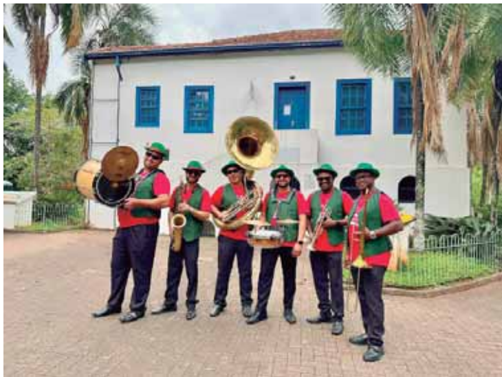
Na segunda-feira, às 19 horas, tem Máfia do Jazz, com o Jazz Natalino