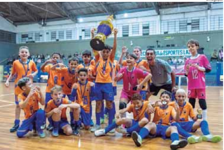
Equipe de Piracicaba com o troféu do vice-campeonato da Copa Campinas de Futsal