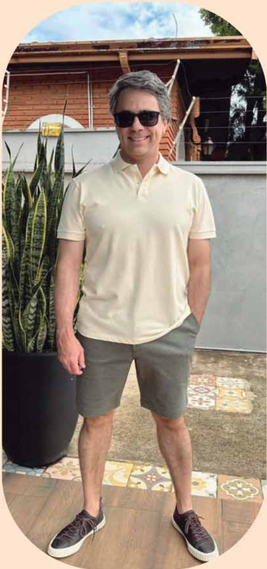
POLO PIQUET R$169,90 BERMUDA MOOVEXX R$339,90