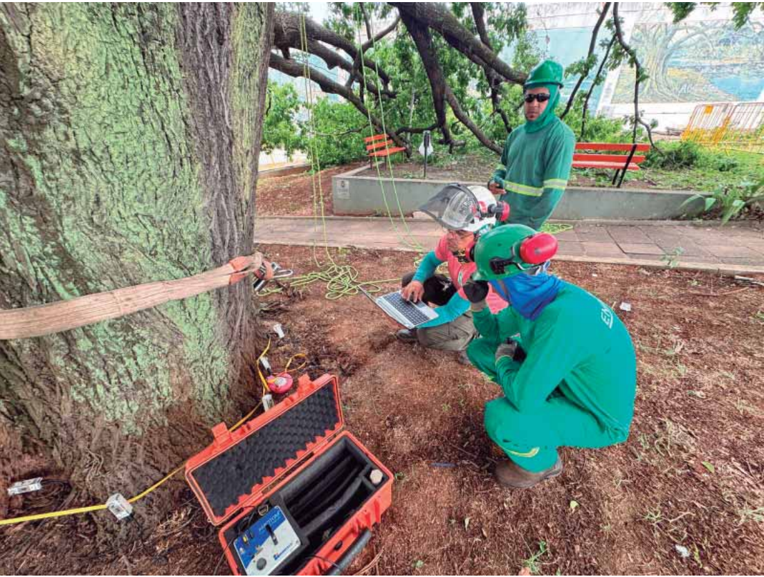
Prefeitura realiza tomografia na Sapucaia para avaliar saúde da árvore

Ele acrescentou que a próxima etapa será a realização de penetragrafia nos galhos, nas áreas de junção. "Esse procedimento será executado para avaliar de forma mais detalhada a condição dos galhos. Mas, até o momento, os