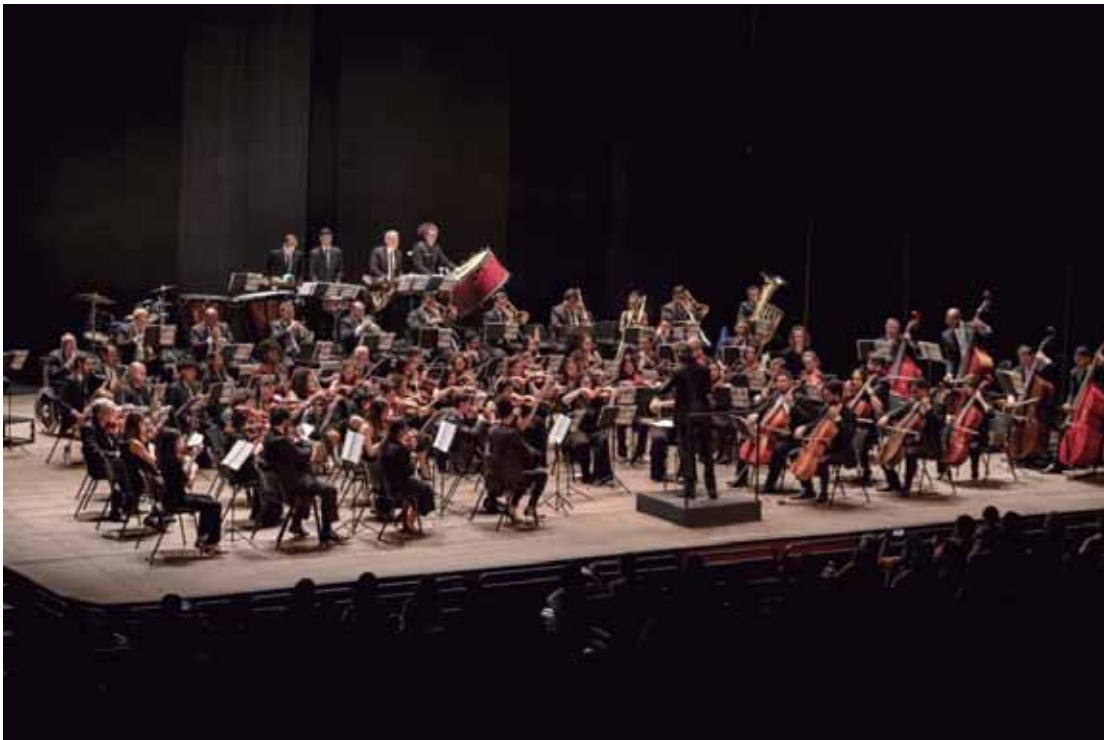
OEP se apresenta domingo, às 18h, na Estação da Paulista

"Estamos preparando um espetáculo repleto de emoção para fechar nosso