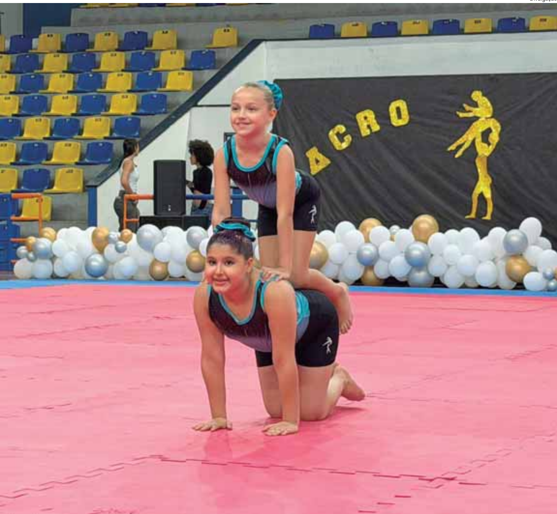
Dezenas de apresentações levantaram o público formado por cerca de 1.500 pessoas, no último sábado

A ginástica acrobática é praticada por meninos e meninas e consiste na execução de exercícios sem a utilização de aparelhos em atividades que exigem de seus praticantes controle corporal, equilíbrio, força e flexibilidade. Ao lon-