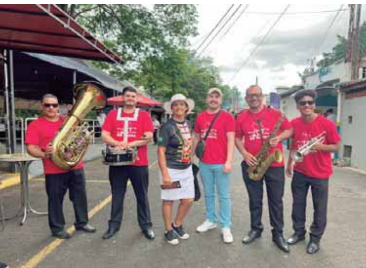
Projeto da Secretaria de Turismo leva bandas itinerantes para Rua do Porto