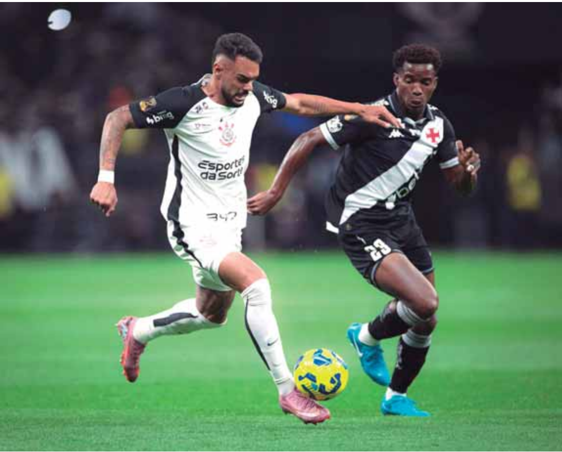
Corinthians x Vasco: decisão da Copa do Brasil em aberto para domingo

Dorival Júnior, do Corinthians, e Fernando Diniz, do Vasco, enxergam na Copa do Brasil a oportunidade de apagar as marcas negativas deixadas pelas campanhas fracassadas nas Eliminatórias para a Copa do Mundo de 2026. Após o jogo, Dorival demonstrou insatisfação com a atuação da equipe e pediu respeito: