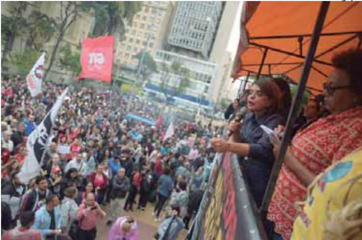
Na manifestação na Praça da República, a deputada Professora Bebel fez duras críticas ao governador Tarcísio de Freitas