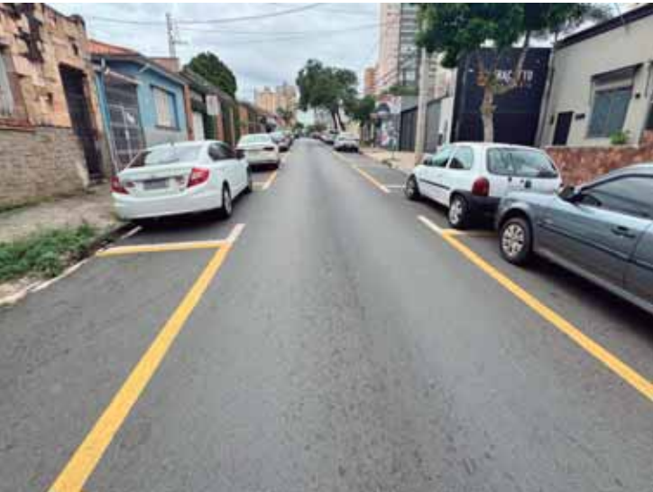
A Rua Voluntários de Piracicaba recebeu nova pintura para demarcação de vagas

vo ao longo dos anos em razão de aposentadorias, falecimentos e falta de reposição de pessoal. Segundo ele, mesmo diante das dificuldades estruturais, o compromisso com a segurança pública permanece diário e constante. "Eu tento fazer o meu melhor todos os dias", afirmou o comandante, ao reforçar que segue empenhado em trabalhar com responsabilidade, dedicação e apoio da família, que considerou essencial para enfrentar as exigências da função e continuar servindo à população piracicabana.