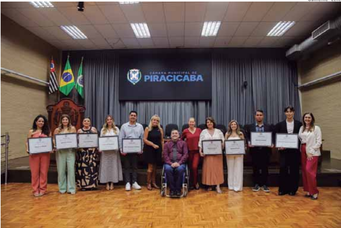
Solenidade aconteceu na noite de terça-feira (9), no Salão Nobre da Câmara

A Semana Municipal da Beleza foi celebrada, em reunião solene promovida pela Câmara de Piracicaba, nesta terça-feira (9), através de homenagens a profissionais que se destacam como especialistas na área da imagem, mas cujo ofício também permite uma conexão com a autoestima dos clientes. A solenidade foi realizada por iniciativa do vereador André Bandeira (PSDB), em atendimento ao Decreto Legislativo nº 39/2014 e ao requerimento nº 1271/2025. "Essas pessoas no seu dia a dia se dedicam a trabalhar pelo próximo, a proporcionar autoestima e mais qualidade de vida para as pessoas, a aumentar o amor próprio de cada um", enfatizou o parlamentar. "Este reconhecimento é pelo trabalho que fazem, mas que sirva também como incentivo para tudo que há por vir ainda".