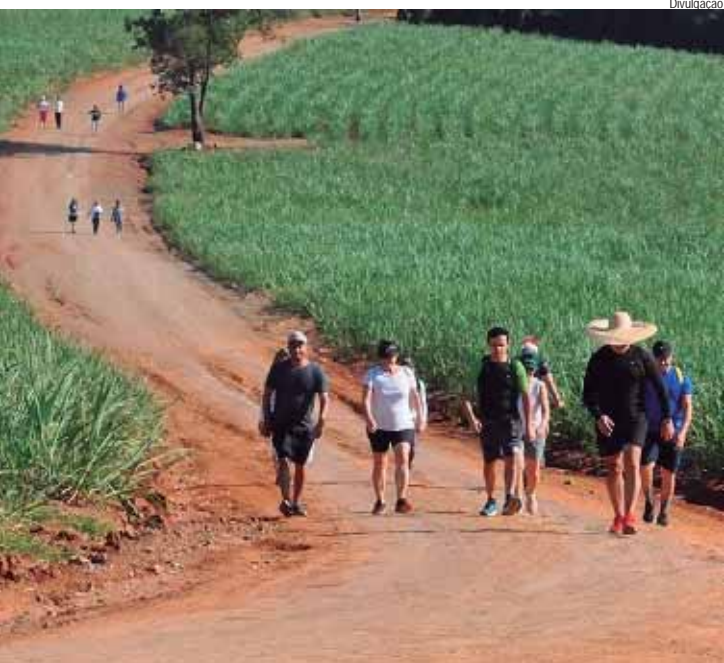
Com percurso de 21,5 km, caminhada está com inscrições abertas

SERVIÇO Caipirandando. Sábado (13/12), com saída, às 6h, em frente ao Ginásio Municipal Waldemar Blatkauskas (Rua Treze de Maio, 2.122, Bairro Alto) com destino ao Alambique Alambari e com passagem pela Cachoeira Verdinha. Inscrições gratuitas pelo telefone para o número (19) 99667-5183