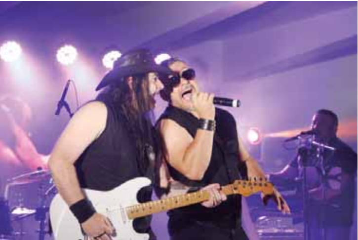
Motoclube Redneck Riders comemorou o aniversário de 6 anos com rock

O motoclube Redneck Riders comemorou o aniversário de 6 anos trazendo um festival de rock e comidas de rua na praça de Rio das Pedras. O evento, que aconteceu nas noites de sexta, sábado e domingo, trouxe diversas bandas e muitas opções de alimentação. Da abertura na sexta até o encerramento no domingo o even-