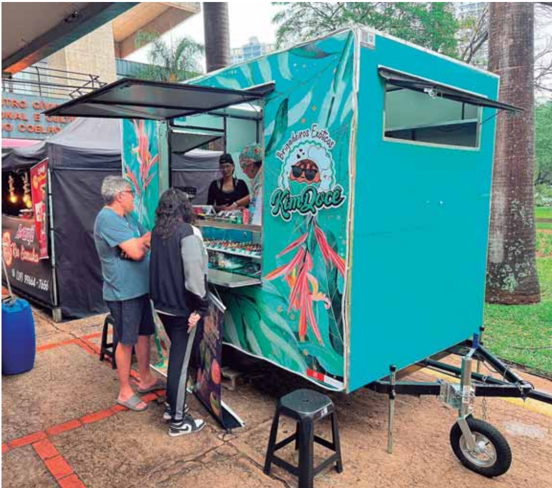
Próxima edição do Sabores na Rua será realizada no dia 19, na rampa do Centro Cívico

A seleção irá considerar critérios como documentação, conservação dos equipamentos, variedade de produtos e adequação de preços. É obrigatório que os comerciantes sejam estabelecidos em Piracicaba, e a prioridade será para quem possui autorização do setor de Economia Informal. Mais informações podem ser consultadas na edição de ontem, 04/12, do Diário Oficial: https://diariooficial.piracicaba.sp.gov.br .