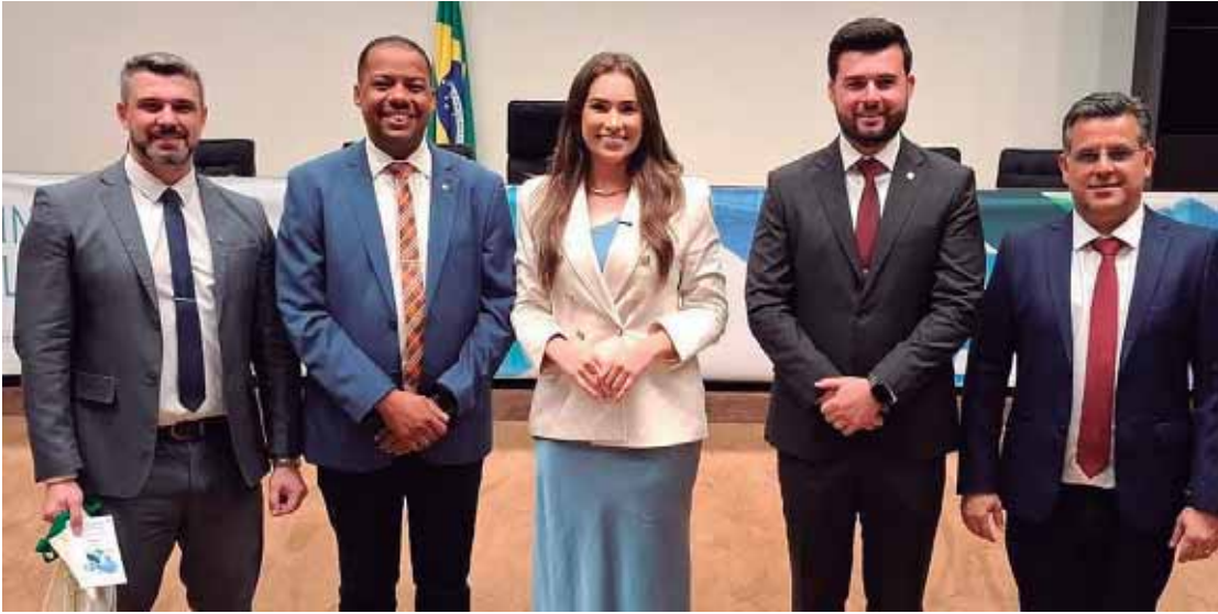
Entre os mais de 58 mil vereadores do Brasil, somente 100 parlamentares foram convidados

Os vereadores terão a oportunidade ainda de assistir aos trabalhos das comissões parlamentares da Câmara, participar de palestras e debates sobre governança, transparência e mo-