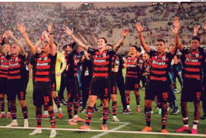
Flamengo classificado para semifinais da copa intercontinental 2025