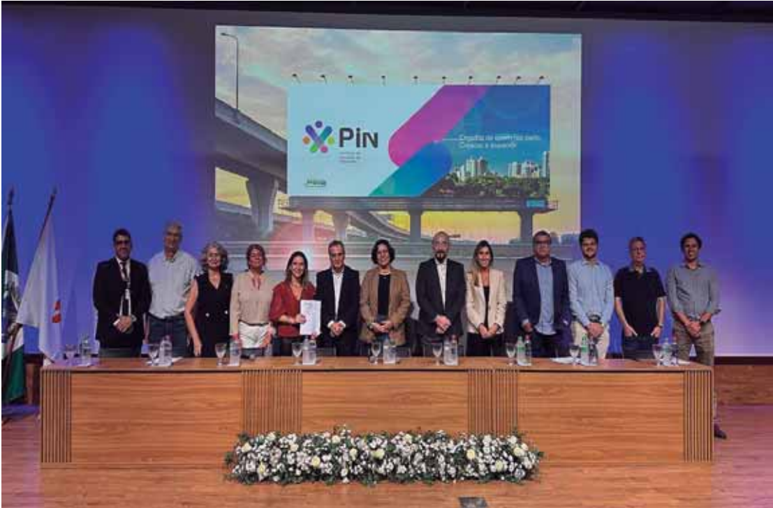
Prefeitura lança marca do Território de Inovação de Piracicaba e formaliza compromisso coletivo com mais de 20 instituições

A estrutura do Território de Inovação será organizada em três dimensões integradas: Território físico - envolve infraestrutura estratégica, como a expansão planejada do Parque Tecnológico, o projeto de cidade universitária integrada e o distrito de biotecnologia em estudo com o Governo do Estado; o Território institucional, que abrange diagnósticos, métricas, governança baseada em dados, ambiente regulatório e instrumentos de fomento à inovação; e