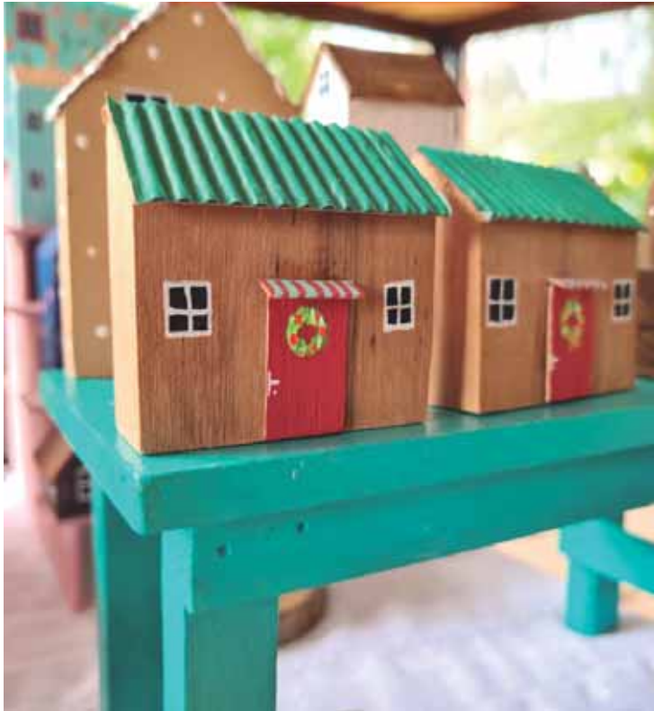
Mercado Mix apresentará produtos criativos para presentear

SERVIÇO 12º Mercado Mix. Dias 16 e 17 de dezembro, das 9h às 20h, no Salão e Cristal do Clube de Campo de Piracicaba. Av. Torquato da Silva Leitão, 297 - São Dimas, Piracicaba (SP). Entrada gratuita. Informações: @mercadomix_