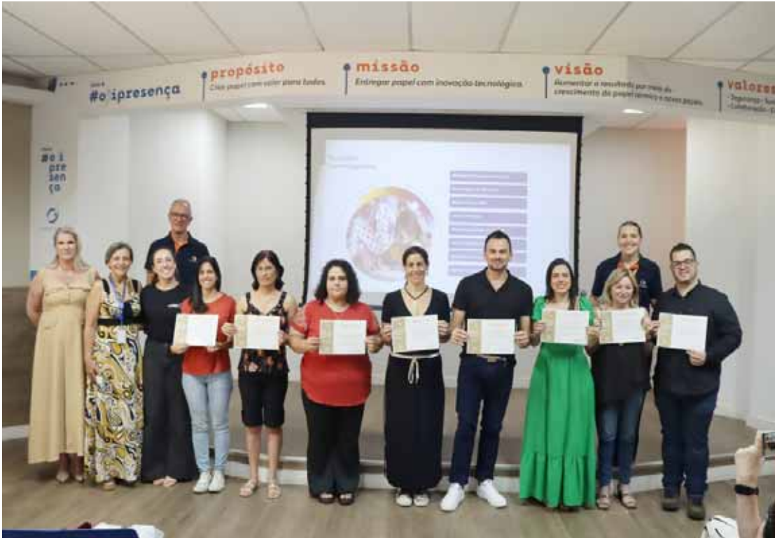
Cerimônia aconteceu no último dia 5

Engajamento e impacto social - Neste ano, dezenas de escolas públicas de Piracicaba participaram do Concurso Cultural, cujo tema foi "Como a inovação, o papel e a era digital estão transformando a vida das pessoas". Os estudantes produziram trabalhos que abordaram tecnologia, sustentabilidade, inclusão e mudanças sociais, demonstrando sensi-