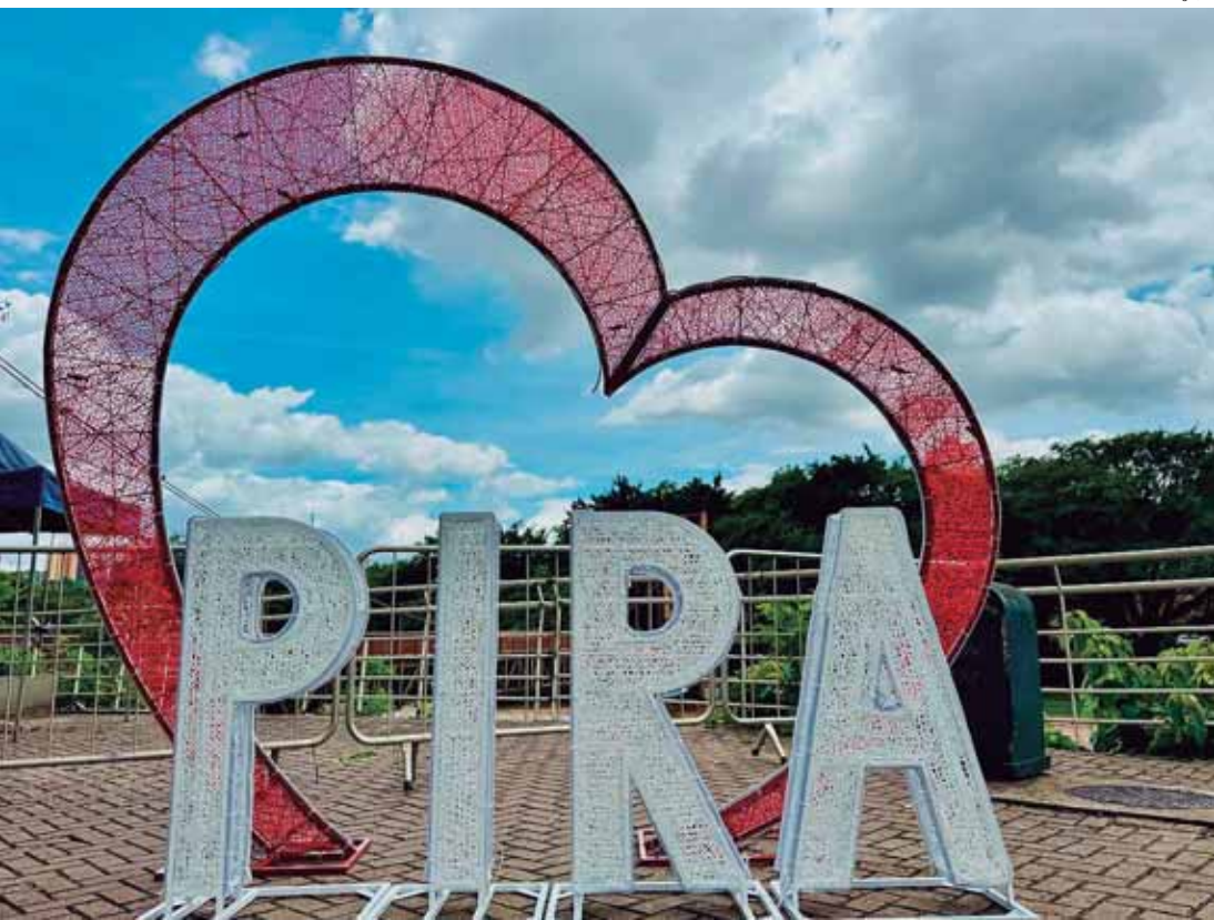
Decoração natalina começou a ser montada no Engenho Central

Quanto à decoração natalina, ela contém elementos iluminados que remetem à data celebrativa e referências à cidade e ao novo ano que terá início. "O Engenho Central é um