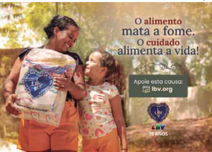
Legião da Boa Vontade deu início à entrega das cestas de alimentos