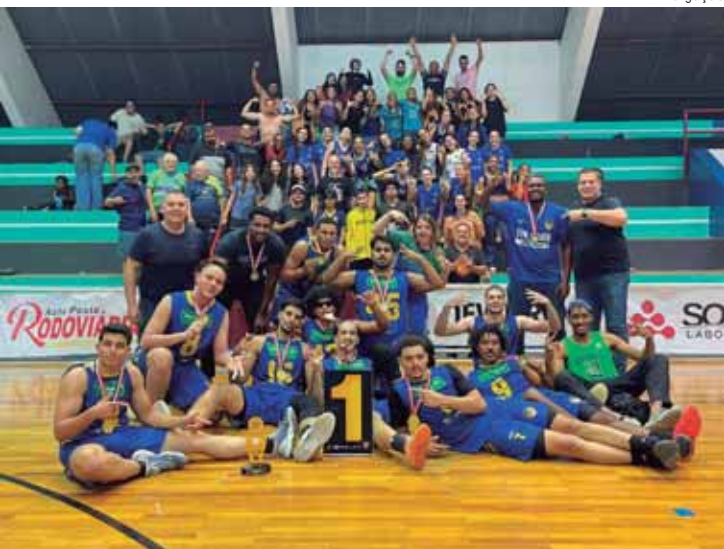
Basquete masculino sub-21 conquistou o título dos Jogos Regionais e está presente nos Abertos