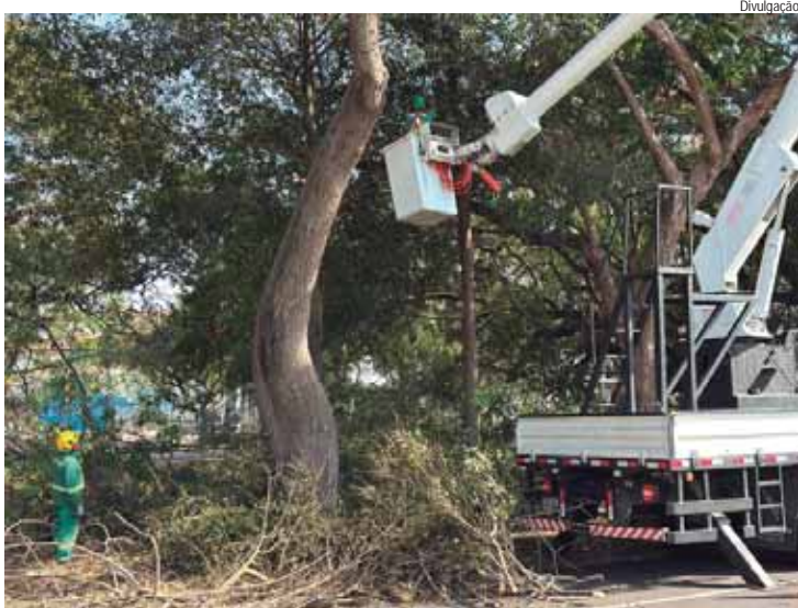
Objetivo é atualizar profissionais credenciados sobre procedimentos, normas e diretrizes técnicas que orientam o manejo das árvores no município