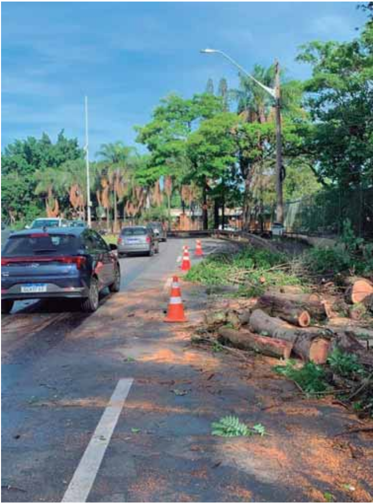
Av. Centenário foi desobstruída após trabalho da força-tarefa da Prefeitura