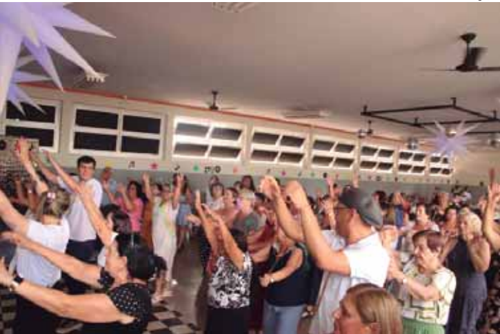
Evento aconteceu graças à parceria entre o CCI e o Projeto Solzinho da Painco

com o Bando de 2, DJ, a presença do robô que iluminou o baile, além de comes e bebes. Cada participante recebeu um copo térmico como lembrança desse dia especial. O baile também serviu para marcar a doação de 50 metros de tatames, que farão toda diferença nas atividades, garantindo segurança, conforto e dignidade para nossos idosos. O CCI atende às pessoas acima de 65 anos com atividades, cursos e passeios, de forma gratuita.