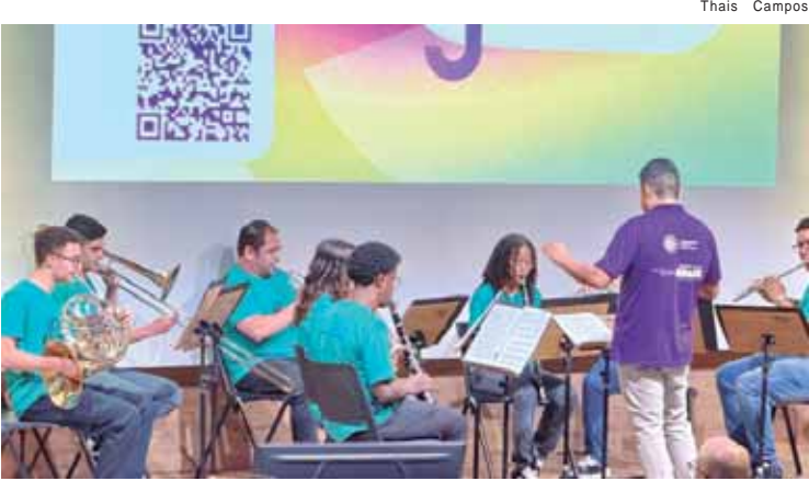
Concertos na Comunidade terão apresentações das Orquestras Juvenis de Cordas e de Sopros

"Ao participar dessa iniciativa, a Piracerva mostra que o nosso setor está atento aos desafios ambientais e comprometido com soluções práticas. Reunimos 11 cervejarias e a entidade tem trabalhado para fortalecer as boas práticas entre as cervejarias da região, incentivando eficiência no uso de água e energia, redução de resíduos e a adoção de processos produtivos mais responsáveis", informou. Seguimos empenhados em apoiar e disseminar iniciativas que tornem a cerveja artesanal cada vez mais sustentável, competitiva e alinhada ao futuro que queremos construir", concluiu.