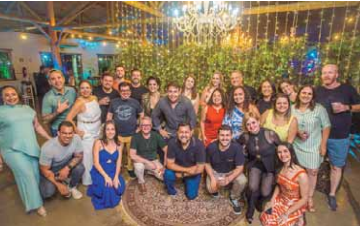
Confraternização da Frias Neto na Vila Felicitá

buíram para tornar a celebração ainda mais inesquecível. Foi uma noite luminosa, marcada por integração, música, sorrisos e muitos bons momentos, uma verdadeira celebração do compromisso, da união e dos resultados conquistados. A Frias Neto brindou ao presente e renovou as energias para um novo ciclo que se aproxima.