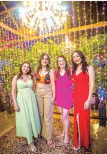
Time Recursos Humanos