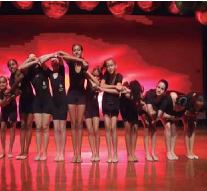
Cerca de 300 pessoas prestigiaram belíssimas apresentações

prestigiaram as belíssimas apresentações das alunas. Cada coreografia demonstrou dedicação, disciplina e muito brilho. A entrada foi solidária, com a doação de 1 kg de alimento, e graças ao apoio da população, todos os itens arrecadados serão destinados ao Fundo Social de Solidariedade, auxiliando famílias em situação de vulnerabilidade.