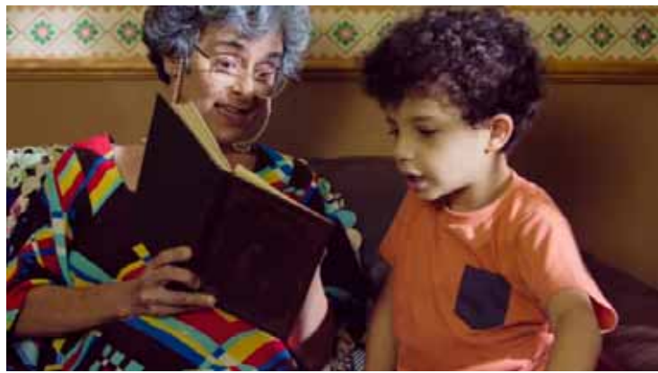
Trecho do filme Teca e Tuti - Uma noite na biblioteca