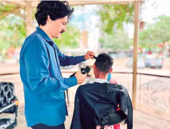
Voluntários realizam corte de cabelo gratuito para pessoas em situação de rua

nidades reais e devolver dignidade para quem deseja recomeçar", afirmou. SERVIÇOS - Com o projeto, a população em situação de rua passa a contar com serviços como abordagem social, acolhimento, escuta ativa, inclusão no Cadastro Único e programas sociais, encaminhamento para emissão de documentos, avaliação médica, atendimento pelo Consultório na Rua e CAPS AD, tratamento em clínicas credenciadas, cadastro para vagas de emprego e cursos de qualificação. Além disso, os atendidos recebem kits de higiene com uma troca de roupa, toalha e itens como sabonete, escova e pasta de dente. COMO AJUDAR - A população pode auxiliar na identificação e informar sobre as pessoas em situação de rua pelos telefones: (19) 99694-1768, (19) 99705-4663, (19) 99446-4389 (Serviço de Abordagem Social), pelo 153 da Guarda Civil Metropolitana e pelo (19) 3426-5979 (Centro Pop).