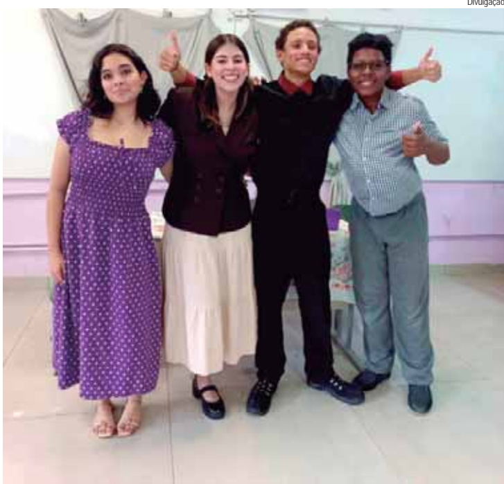
O Teatro do Sesi Piracicaba recebe o espetáculo O Pedido de Casamento, da Cias. HPC de Teatro Estudantil e Nós da Cena