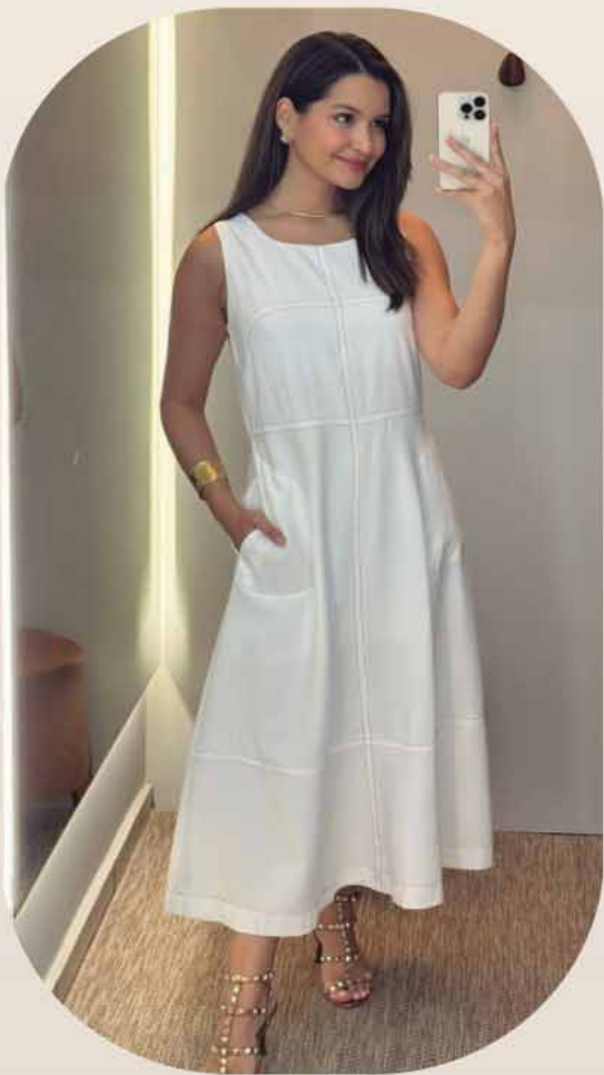
VESTIDO MIDI PESPONTO R$379,90