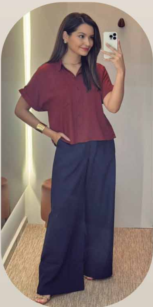
CAMISA MC R$ 189,90 CALÇA ALFAIATARIA R$ 279,90