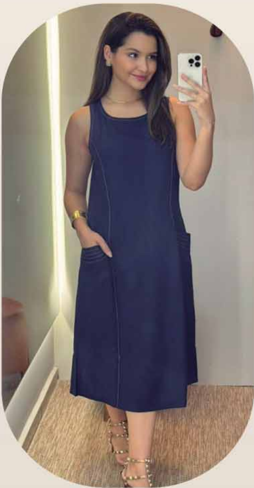
VESTIDO MIDI LINHO PESPONTO R$379,90