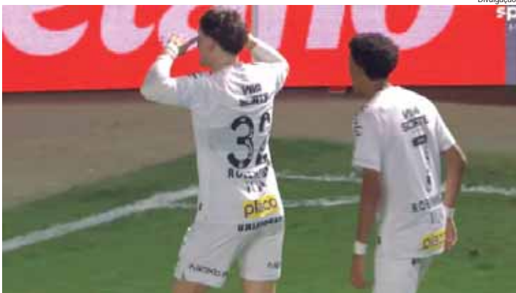
Time da baixada santista foi melhor durante toda a partida contra um desfigurado Verdão, e gol vem no final