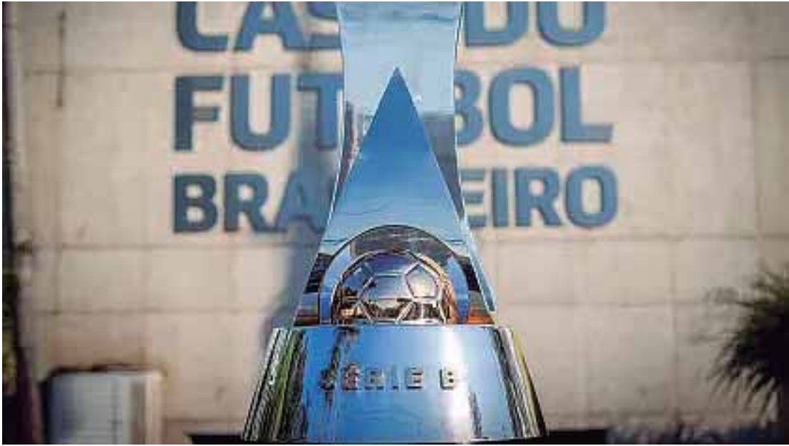
Coritiba já é o campeão; cinco times lutam por três vagas para o acesso. Uma vaga no Z4 resta para três clubes

Atualmente, Athletico-PR (62), Criciúma (61) e Goiás (61) ocupam