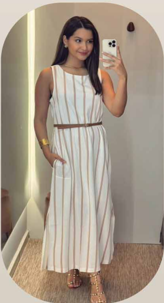
VESTIDO MIDI LINHO LISTRA R$379,90

RUA DR. JOÃO CONCEIÇÃO, 974 - PAULISTA - 1999909-3344 AV. DONA LÍDIA, 671 - VILA REZENDE - 1998136-1010