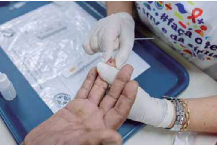
Testes são importantes para diagnóstico precoce