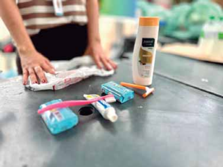
O Fundo Social de Solidariedade entrega kits de higiene para as pessoas em situação de rua