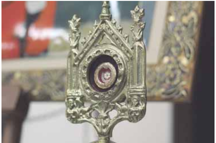
Programação teve início na Paróquia Nossa Senhora Aparecida

O bispo reforçou a importância de diferenciar veneração e adoração: "É importante distinguir: