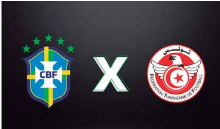
Ancelotti deve promover uma novidade no ataque e lidar com desfalque na defesa

O amistoso marca a última chance da comissão técnica para observações e ajustes antes da reta final de preparação para o Mundial. Após o confronto, a Seleção se reunirá novamente apenas em 2026, já no período pré-Copa.