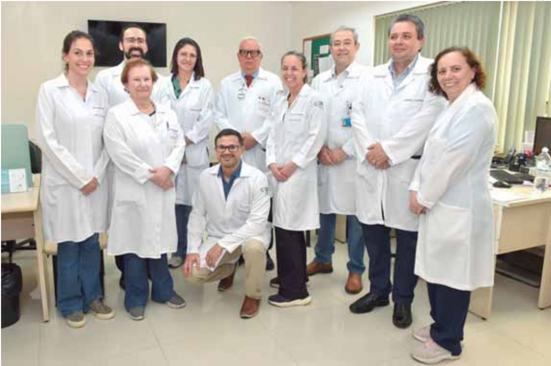
No último Sábado Sem Câncer de Próstata, o Cegan reuniu 342 homens em uma jornada de cuidado e prevenção

Nos atendimentos realizados, 15% apresentaram achados suspeitos no toque retal, resultando em encaminhamento imediato para exames comple-