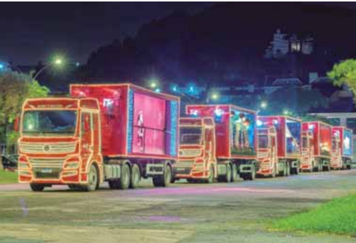
Caravana da Coca-Cola passa por Piracicaba nesta terça-feira, 18