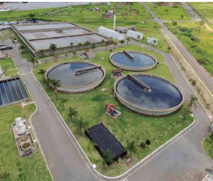
Estação de tratamento de esgoto Bela Vista