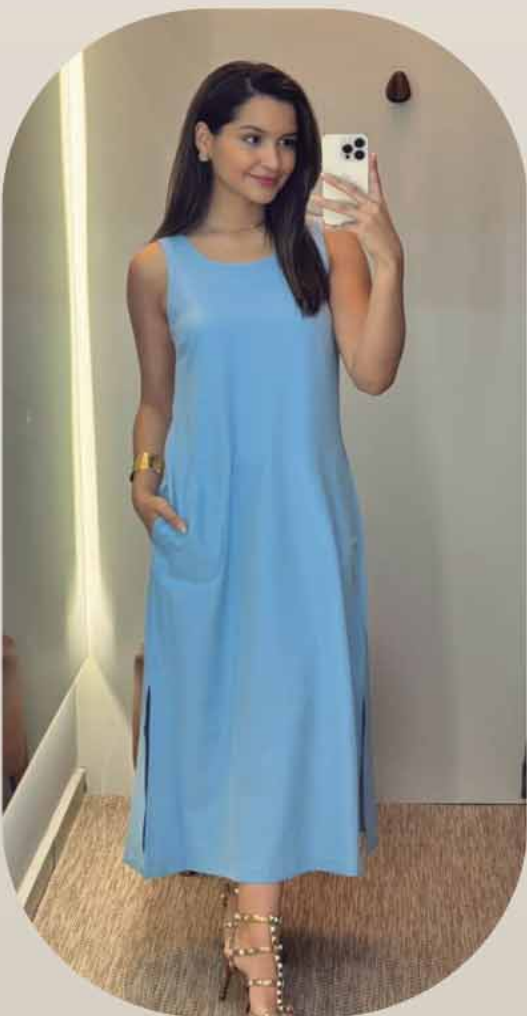
VESTIDO MIDI REGATA R$359,90