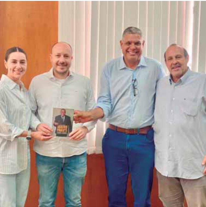
Aliança entre pré-candidatos foi anunciada ontem, 17

A proposta dos pré-candidatos busca fortalecer a região por meio de uma atuação alinhada entre Brasília e São Paulo, e garantir que a Região Metropolitana de Piracicaba - onde está Rio Claro - e o entorno possam competir por mais investimentos e políticas públicas.