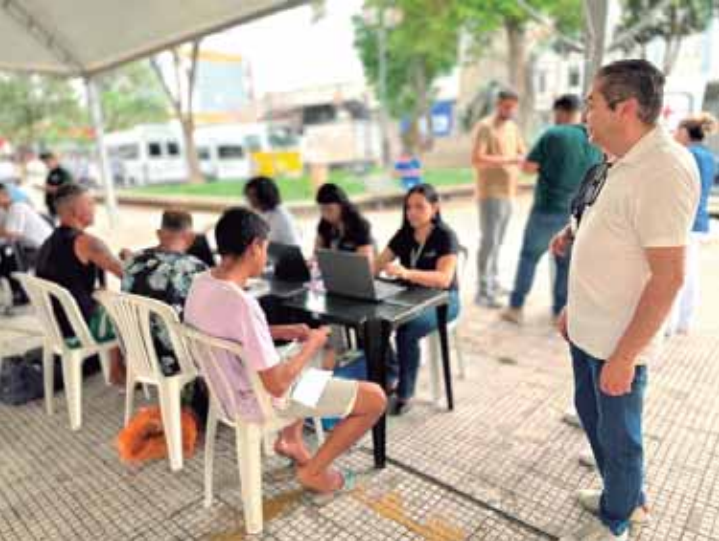
O primeiro dia do projeto Superação realizou 172 atendimentos na praça José Bonifácio