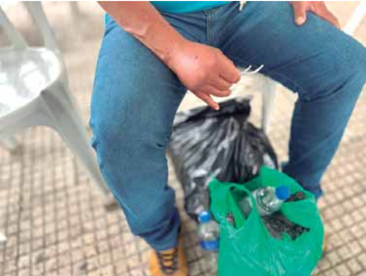
Paulo (nome fictício) estava em busca de uma vaga de trabalho