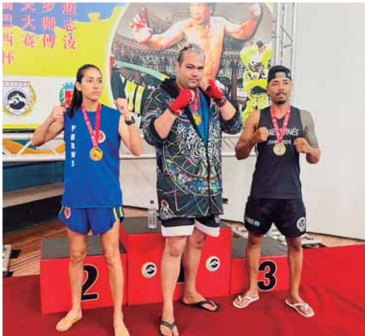
Atletas se destacaram em suas competições e subiram no lugar mais alto do pódio

Os três atletas retornaram campeões, marcando de forma brilhante a última competição do ano para Piracicaba. As conquistas reforçam o crescimento das artes marciais na cidade e a dedicação dos atletas e equipes locais.