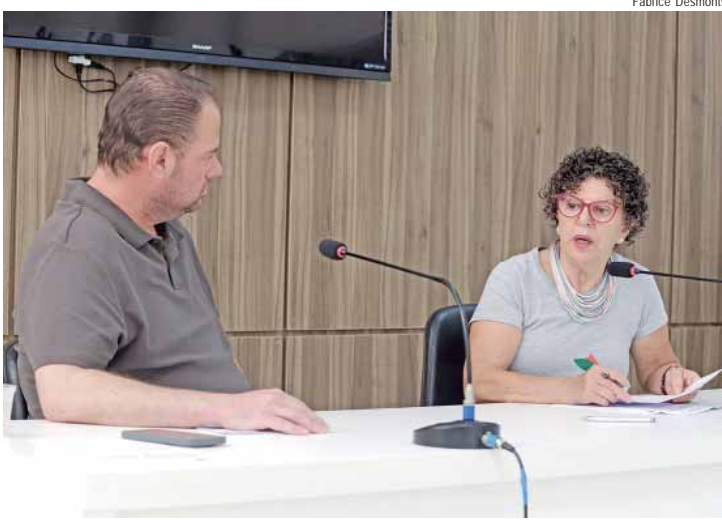
Proposituras destacam Frente Parlamentar pela Epilepsia, campanha para livrar crianças da exposição a telas e assistência hospitalar