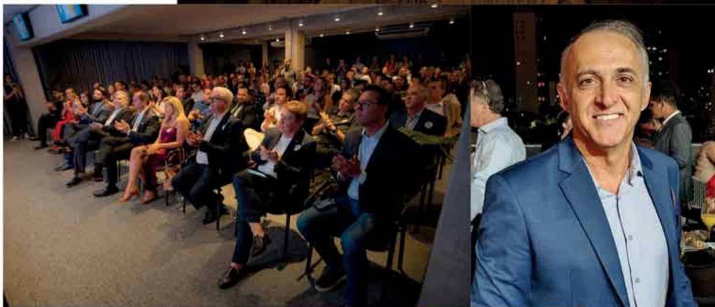
Bom público prestigiou o lançamento no Espaço Manifesta