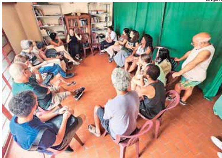
Ponto de Cultura Garapa é um dos certificados pelo Cultura Viva

As inscrições devem ser feitas de forma gratuita e exclusivamente pela Plataforma Eletrônica Sem Papel. Poderão participar organizações da sociedade civil sem fins lucrativos com CNPJ, que desenvolvam atividades culturais de forma contínua e comprovada há, pelo menos, três anos no município. Não é necessário já ter certificação como Ponto de Cultura, desde que a entidade atenda aos critérios de pré-certificação descritos no edital.