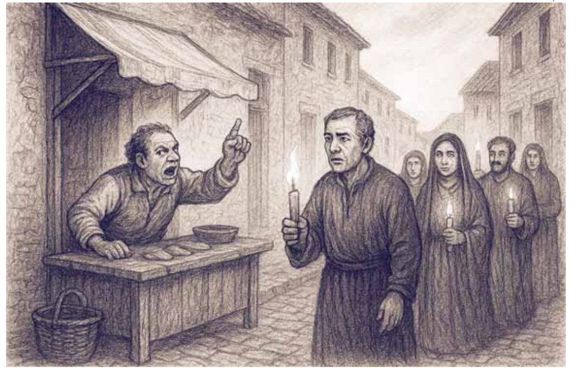
Briga de barraqueiro marcou Sexta-feira Santa no Século 19 e foi registrada em ata pela Câmara.

De qualquer forma, não é possível saber, ao certo, a ori-