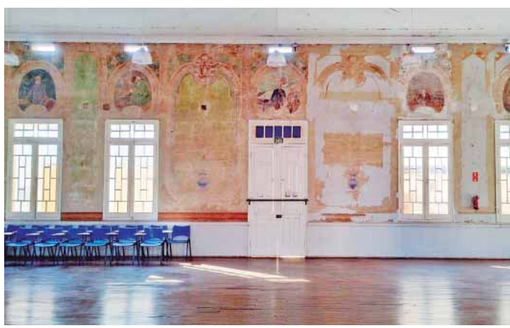
A campanha é aberta a toda a sociedade e foi lançada pelo Instagram da Societá