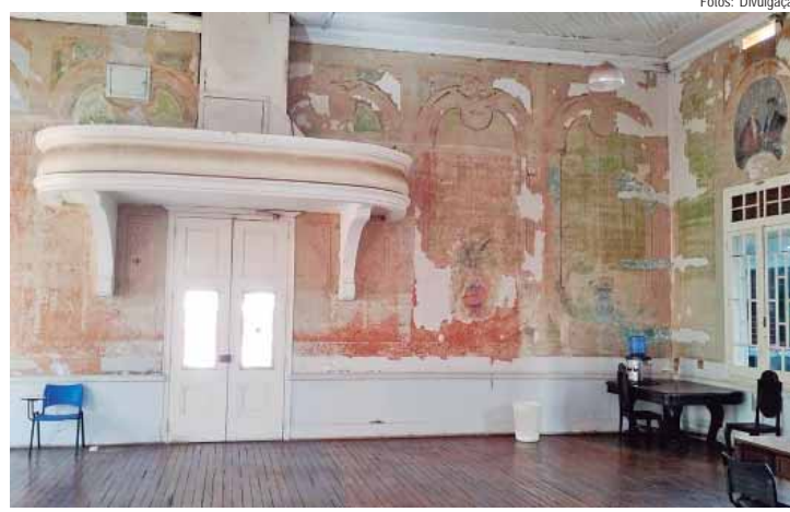
Campanha O enigma pode estar na sua casa busca recuperar vídeos, fotos e documentos