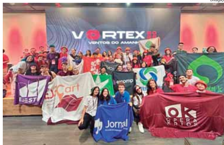
Cerca de 600 lideranças de quatro ramos empresariais jr. do Estado participaram do evento