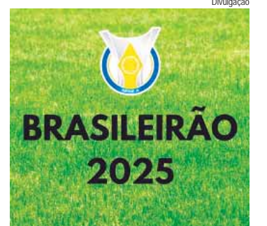
Rodada de Clássicos no Brasileirão

A terceira rodada do Brasileirão 2025 tem início no sábado, 12, com quatro jogos: Sábado, 12: Bragantino x Botafogo; Juventude x Ceará; Palmeiras x Corinthians; Vasco x Sport. Domingo, 13: