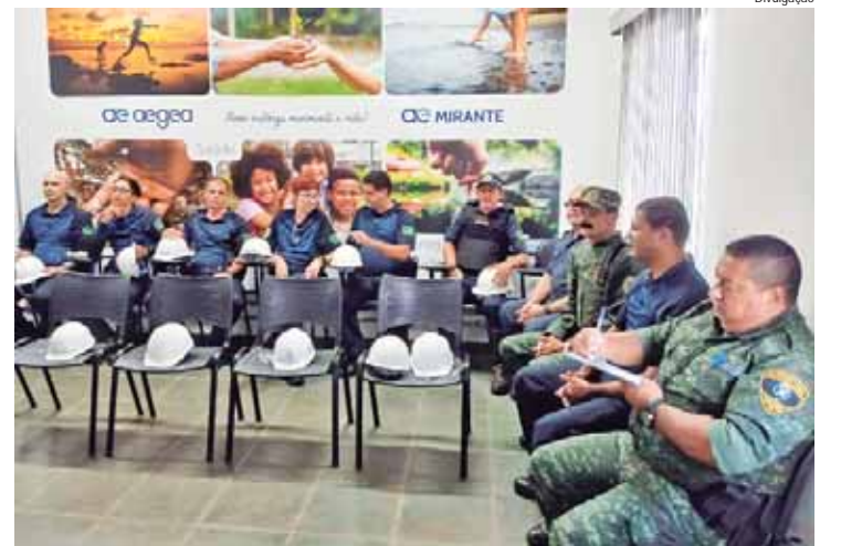
Guardas civis municipais conheceram também os programas de Responsabilidade Social da Mirante

"Saneamento é um tema que engloba saúde, qualidade de vida, preservação ambiental, mas também segurança pública. Ter a presença de integrantes da Guarda Civil visitando as instalações da Mirante PPP permite ampliar o conhecimento do trabalho que é realizado, dia a dia, por profissionais que estão comprometidos em pro-