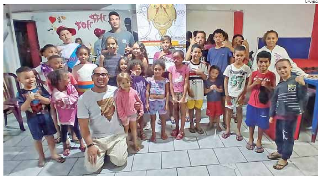
Obra de Evair Souza será distribuída gratuitamente para escolas e entidades de Piracicaba

Além da distribuição gratuita, o lançamento será acompanhado por sessões de contação de