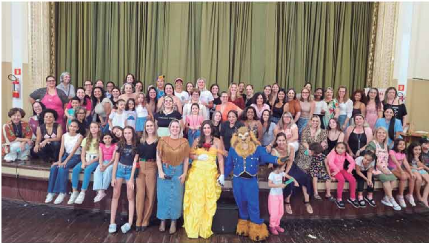
1ª EXPO DELAS