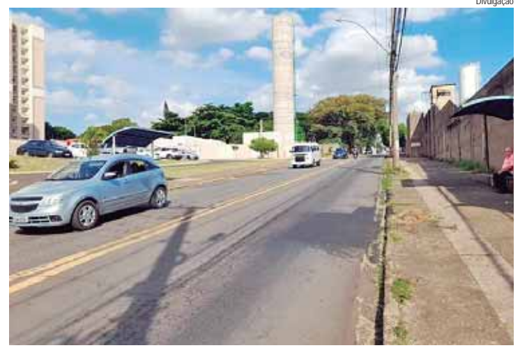
Objetivo é garantir a segurança de pedestres e motoristas

Com o objetivo de reforçar a segurança no trânsito e melhorar a mobilidade urbana no bairro Vila Industrial, o vereador Pedro Kawai (PSDB) protocolou duas indicações junto ao Poder Executivo, ambas voltadas à avenida Brasília, nas imediações do número 850.