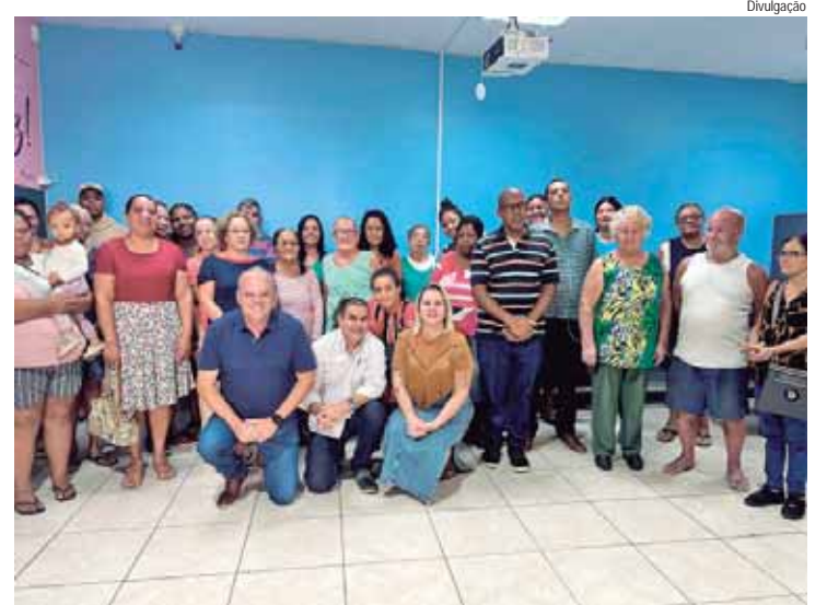
Funjape foi contemplada com projeto para modernizar parque de informática

zado tradicionalmente no mês de agosto, em homenagem ao aniversário da cidade, com o objetivo principal de promover conexões entre mulheres, oferecendo palestras, compartilhamento de histórias e um espaço para troca de experiências e aprendizado.