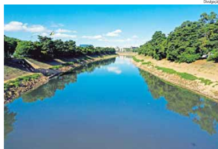
Ação vai combater morte de peixes no rio Tietê (foto); estações de monitoramento serão instaladas na bacia do Rio Piracicaba

O projeto segue para análise das comissões internas da Câmara, para então ser levado ao plenário para análise dos demais parlamentares.