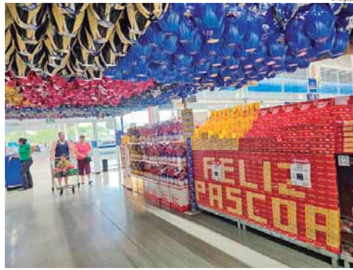
Assaí prepara-se para novidades e variedades

ECONOMIA — O Assaí também se destaca pela competitividade dos preços. Com um modelo de negócio de atacarejo, a rede consegue oferecer produtos com até 10% de economia em relação a outros canais de varejo. Isso permite que os clientes comprem mais gastando menos, seja para consumo próprio, revenda ou para presentear amigos e familiares. Além disso, os produtos sazonais da data (como