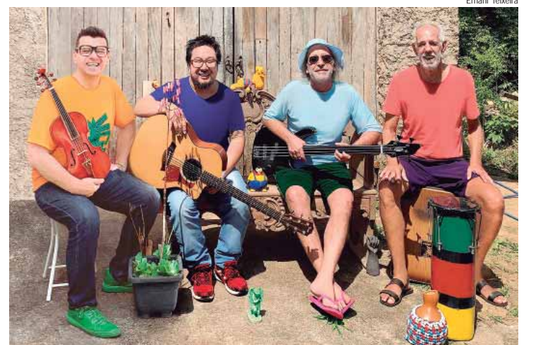
Os Cybertones trazem clássicos do country e bluegrass ao Sesc

VIVÊNCIA - Espelhos do eu! Autorretratos. Um espaço contínuo e consistente para o desenvolvimento criativo e cognitivo das crianças. Ao explorar as artes visuais de forma regular, elas ampliam sua capacidade de expressão, aprendem