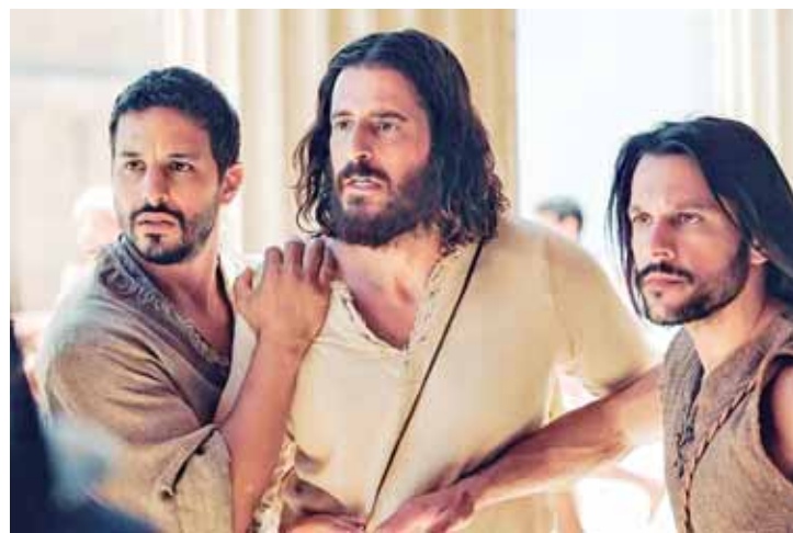
Os dois primeiros episódios da 5ª Temporada da icônica série The Chosen estreiam no cinema com Jonathan Roumie no papel de Jesus

ju No 8 inspirada no mangá homônimo de Naoya Matsumoto, exibida no Japão em 2024. A segunda temporada está prevista para chegar à televisão japonesa em julho deste ano -- e provavelmente nos cinemas brasileiros.