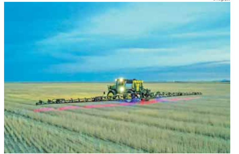
Tecnologia reduz em 2,3 vezes o custo de produção de soja e milho

Ferraz ressalta que a dependência da área tratada, o investimen-