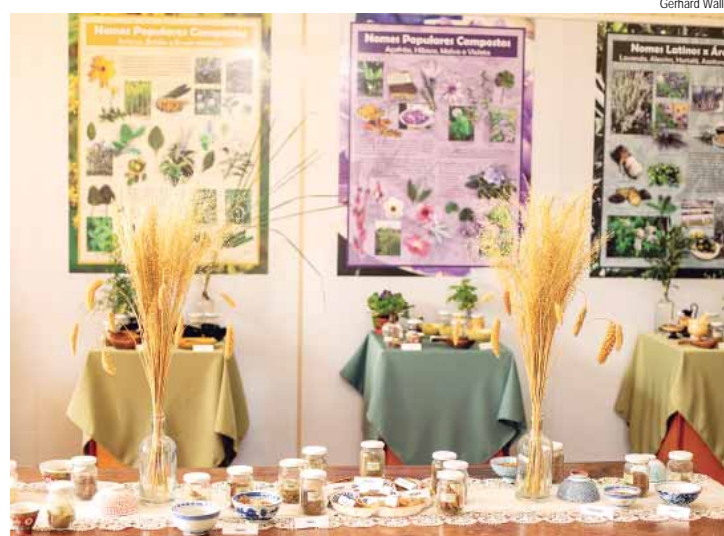
Mostra fica aberta ao público no Museu Luiz de Queiroz durante o mês de abril

Com acesso gratuito, a exposição pode ser visitada de segunda a sexta-feira, das 8h às 17h.