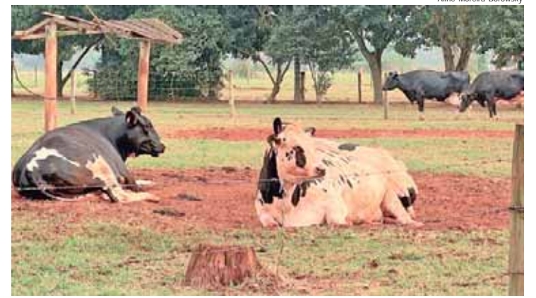
Propriedade leiteira na região Sudeste