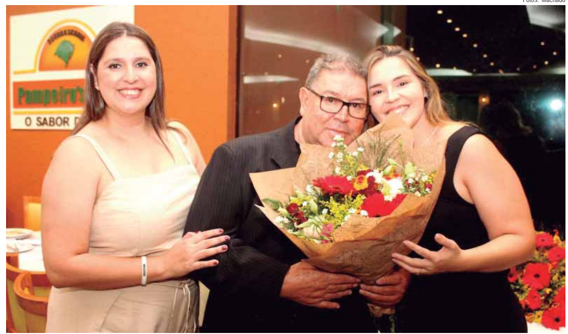
Idealizadores do evento Destaque Empresarial 2024