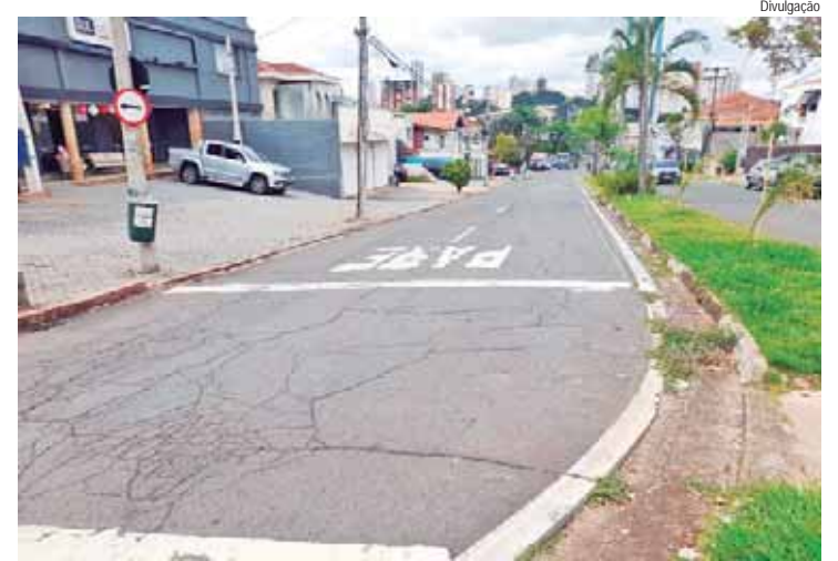
Dois indicações foram encaminhados ao Executivo

Lançamento do Programa Vivências Paradesportivas. Na Sede da Avistar – Av. Antonia Pazinato Sturion, 830. Dia 15/04, das 13h30 às 15h. Informações: (19) 99304-6203.