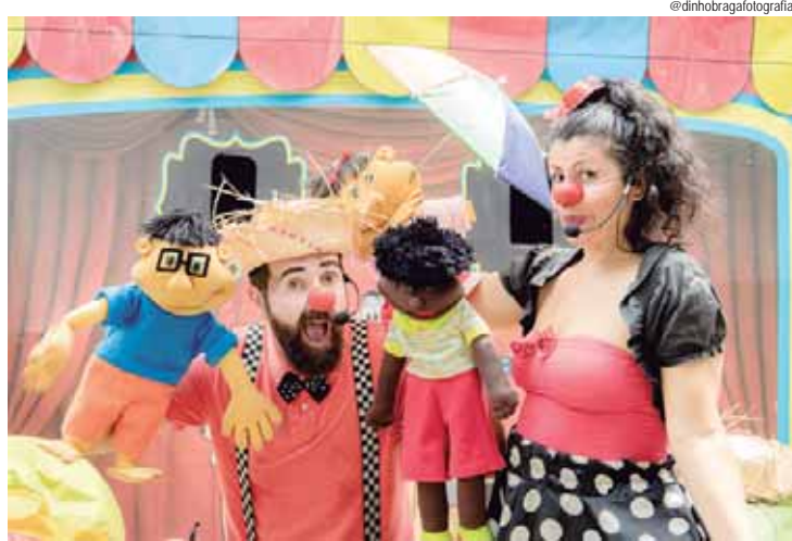
A programação começa com o espetáculo Kombi no Circo