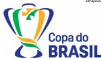
Datas e horários ainda serão definidos pela CBF

rie A): R$ 3.638.250, Grupo II (Série B): R$ 3.638.250 e Grupo III (clubes participantes da Série C, D e outros): R$ 3.638.250.