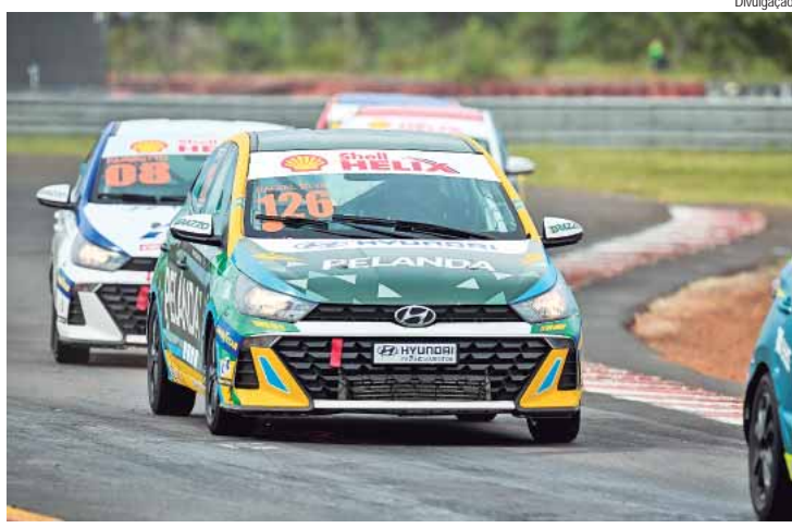
Categoria alcançará a marca de 100 corridas no circuito paranaense