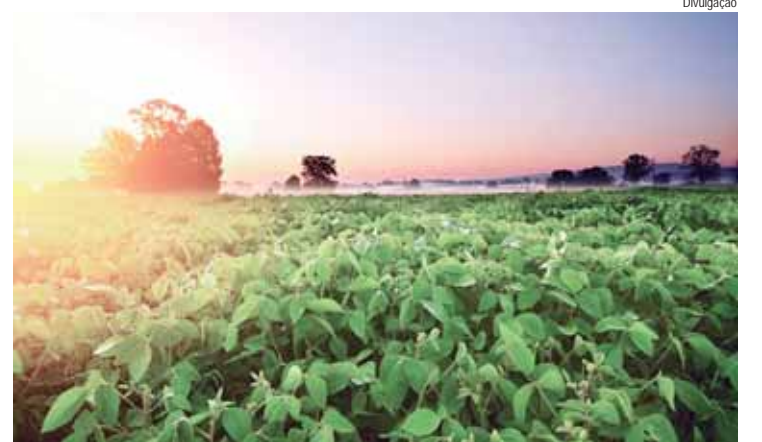
Antecipar o custeio da safra de soja pode ser um diferencial para garantir melhores condições

Com a antecipação do crédito, o produtor pode definir quantos hectares deseja financiar, garantindo a liberação imediata dos