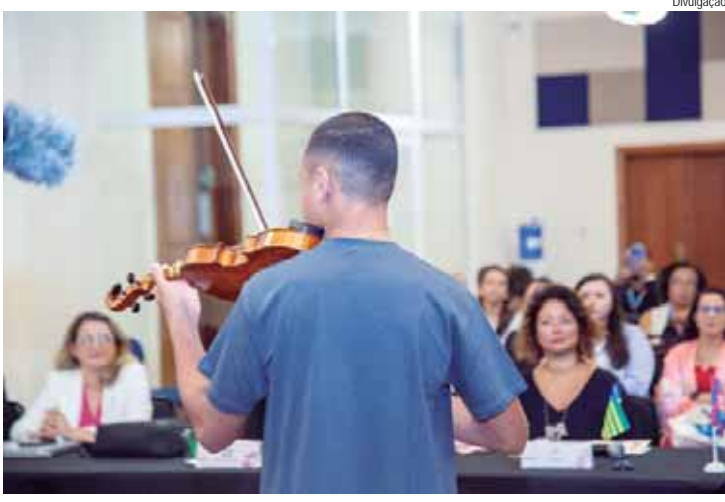
Após passar pela Fundação Casa, jovem integra o Baccarelli como violinista