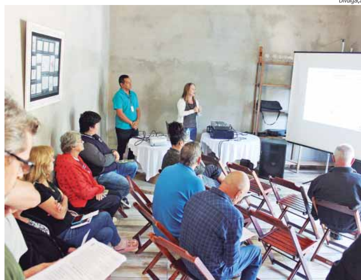
Em 2024, Santa Olímpia recebeu um dos seminários técnicos sobre o PMSR