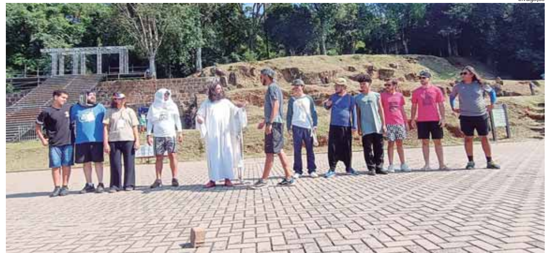
Distribuição gratuita será no Engenho Central de Piracicaba, das 9 às 12 horas

As apresentações terão acessibilidade, com tradução em libras e audiodescrição e área reservada para pessoas com mobilidade reduzida. O Parque