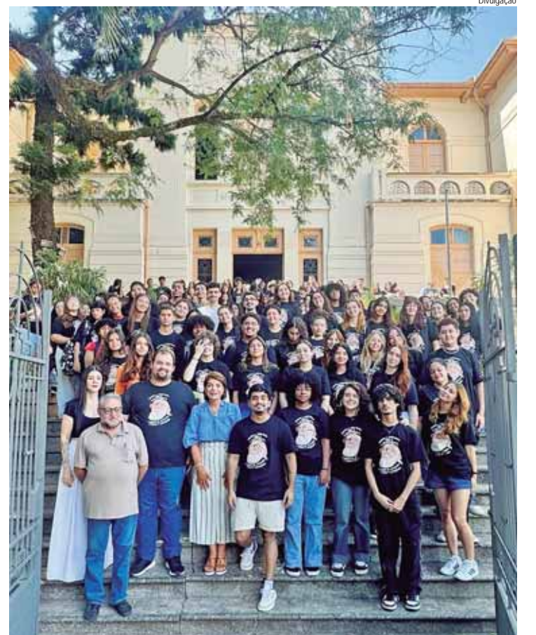
Alunos, professores e a deputada Bebel em frente à EE Sud Mennucci, onde foi ministrada a aula inaugural do cursinho popular Paulo Freire

Para Bebel, a aprovação desses alunos mostra o sucesso do cursinho e a certeza de que continuará defendendo escola pública de qualidade para os filhos e filhas da classe trabalhadora, e reafirma a importância e eficiência da escola pública, tanto que todos os professores do cursinho são da rede estadual de ensino. Lançado como projeto piloto na cidade, no ano de 2020, em plena pandemia da covid 19, e realizado de forma online, para atender as necessidades de jovens estudantes de baixa renda, oriundos da escola pública, o cursinho teve continuidade nos anos de 2022, 2023 e no ano passado, de forma presencial. "Agora, conseguimos ampliar