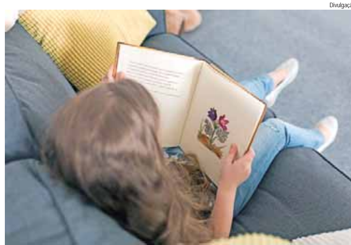
Infância é apontada por especialistas como fase crucial para a formação de leitores

4. "Marcelo, Marmelo, Martelo", de Ruth Rocha. Os personagens dos três contos do livro são crianças que vivem no espaço urbano. Elas resolvem seus impasses