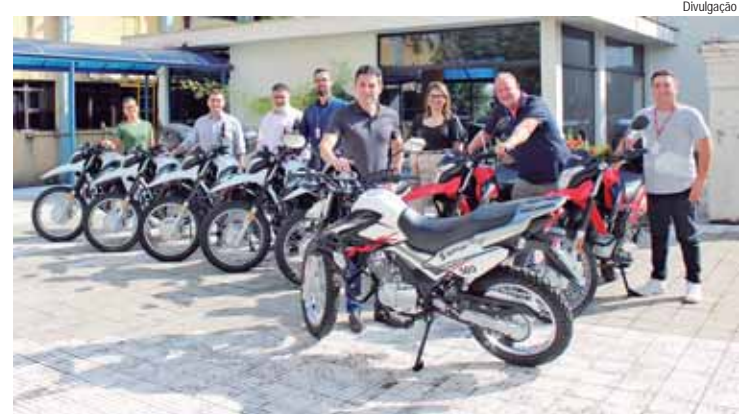
Nove novas motos foram entregues ao Semae Piracicaba

No final de fevereiro, o Semae recebeu 22 carros zero quilômetro, substituindo outros com idade média de 16 anos. O investimento foi de R$ 2,23 milhões e já permite maior rapidez na execução dos serviços operacionais, reduzindo o tempo de resposta às demandas da cidade. O Semae Piracicaba reforça seus canais de atendimento à população: WhatsApp 24h: (19) 3403-9608; Central 24h pelo 0800 772 9611 ou Disque 115 (somente telefone fixo); e site semaepiracicaba.sp.gov.br .