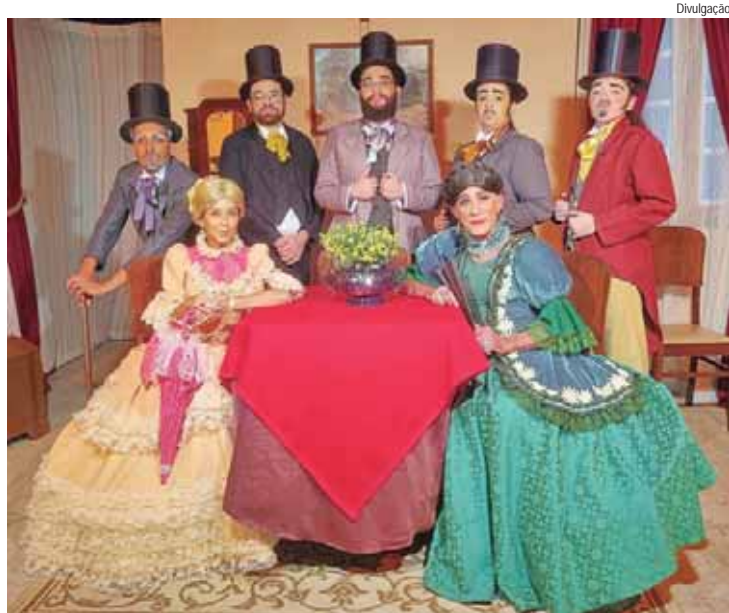
A peça é uma clássica comédia do século XIX