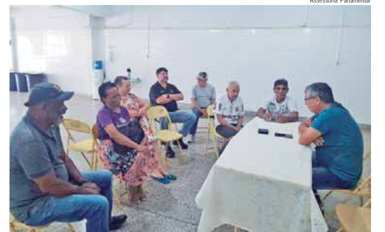
Demandas foram levantadas durante uma reunião com moradores