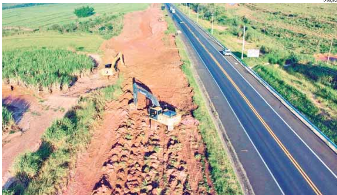
O projeto prevê 31 quilômetros de pistas duplicadas, entre São Pedro e Santa Maria da Serra