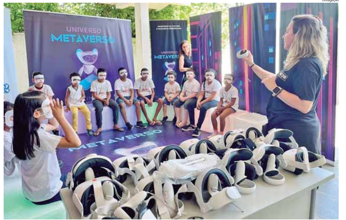
Projeto tem apresentação em Piracicaba até sexta, 4

SOBRE A MR2 CULTURAL - Fundada em 2012, a MR2 Cultural é uma referência em gestão de projetos culturais e produções artísticas, oferecendo soluções completas e inovadoras. Com uma