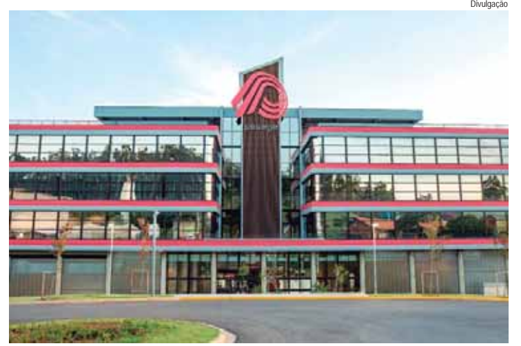
Tema do evento será A educação de hoje é suficiente para os desafios que enfrentaremos no futuro?