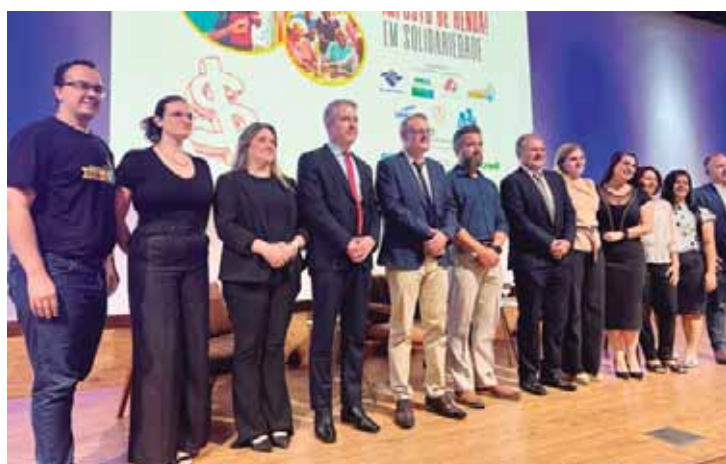
Apoiadores e organizadores do evento