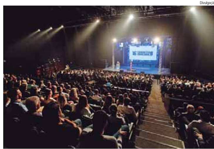
Congresso Empresarial da Acipi ocorrerá no Teatro Municipal Dr. Losso Netto