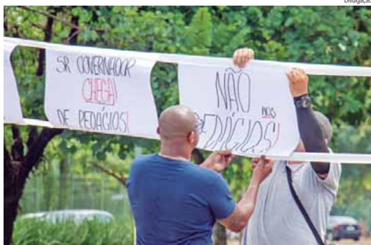
Manifestantes expressaram preocupações quanto a instalação de um pedágio poderia elevar significativamente os custos