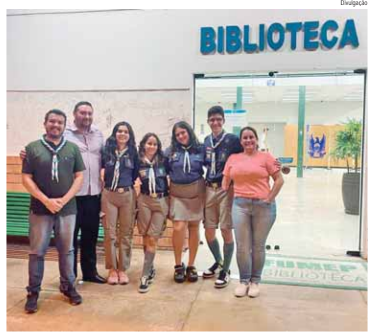
Os escoteiros também puderam conhecer o espaço reservado para exposições na Biblioteca

A Tropa Sênior do Grupo Escoteiro Tamandaré visitou a Biblioteca da Fundação Municipal de Ensino de Piracicaba (Fumep) na última quinta-feira, 20. O objetivo foi aprimorar habilidades do escotismo e conhecer o funcionamento do espaço. O grupo era composto por