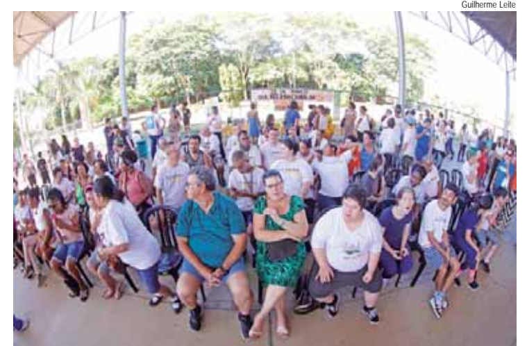
Mais de 100 pessoas, entre familiares e autoridades prestigiaram evento