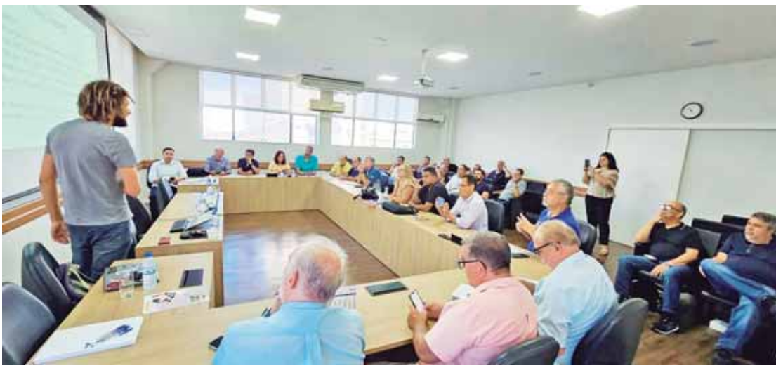
Após a exposição sobre o cenário do Saúde Caixa, os presentes puderam esclarecer dúvidas sobre o tema