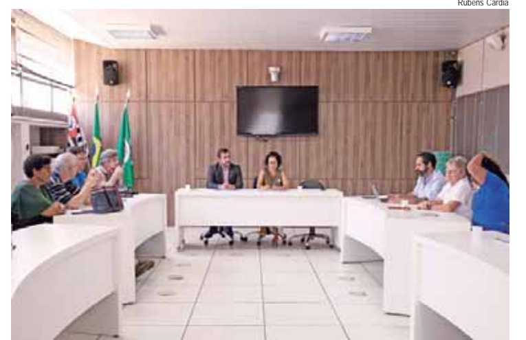
Mobilização de recicladores visa pagamento por serviços ambientais

Integrantes da Ecovida Piracicaba, uma cooperativa de reciclagem que surgiu no Santa Rosa, compareceram à reunião e prestaram rela-