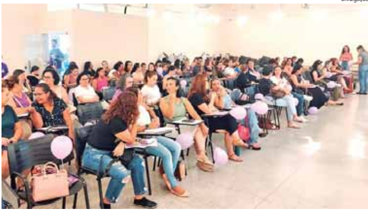
Com o tema "Epilepsia Direitos Já", atividade reuniu especialistas, autoridades, pacientes e familiares na antiga Pinacoteca