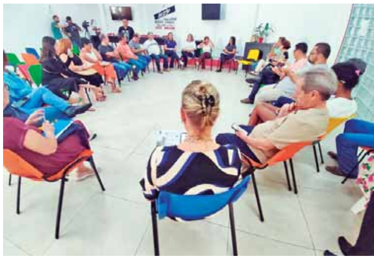
Lideranças de diversas cidades da região participaram da reunião que tirou diversas ações visando mobilizar a população e pressionar o governador Tarcísio de Freitas