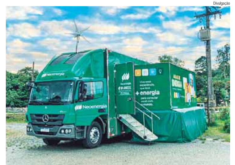
Com investimento de R$ 1,7 milhão, novo caminhão traz uma série de interações inovadoras e muita diversão

O caminhão do projeto Aulas de Energia é adaptado para funcionar como sala de aula e laboratório. A empresa investiu R$ 1,7 milhão na Unidade Móvel, que traz uma série de interações inovadoras, que unem conhecimento e diversão, como: cenografia interna com iluminação cênica e ambientação na temática do projeto; maquete de geração manual para demonstração do princípio de geração de energia elétrica; bicicleta que transforma energia mecânica em energia elétrica; sistema de geração solar com vitrine demonstrativa; casa virtual interativa com simulação dos ambientes,