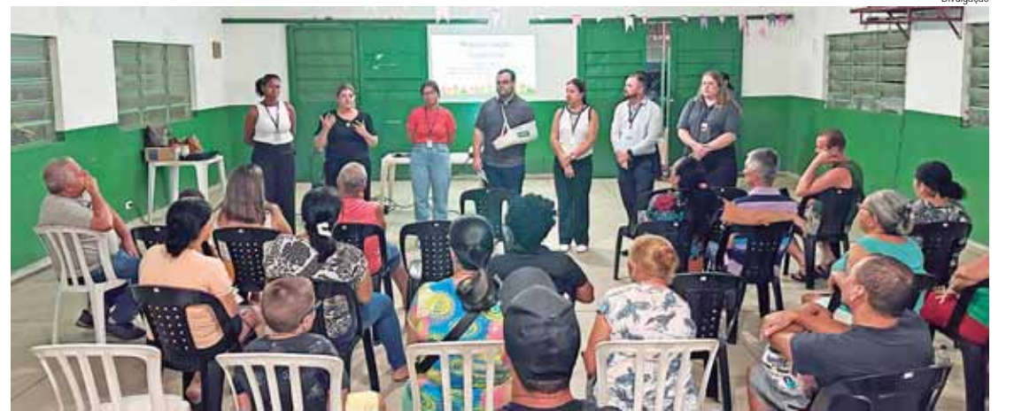
As assembleias aconteceram na sexta, 21, e no sábado, 22, no Jaraguá e no Jardim São Paulo

Segundo a Secretaria, os serviços contratados, no valor de R$ 346.200,00, abrangem desde o registro dos núcleos até a individualização das matrículas e emissão dos títulos de propriedade para os moradores. A empresa responsável já concluiu a etapa