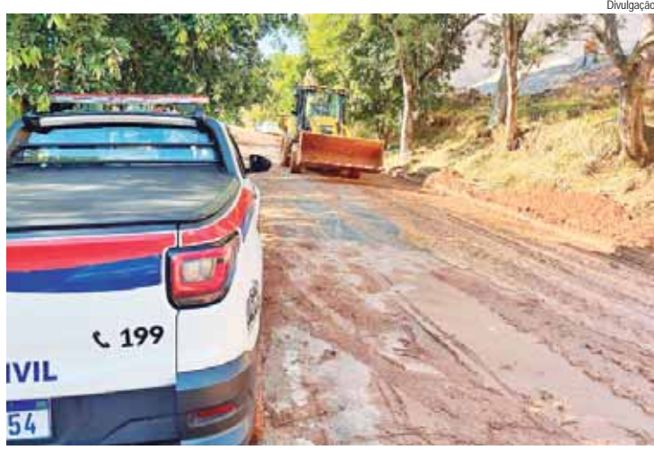
Equipe já realiza limpeza da rua em frente a Escola Municipal