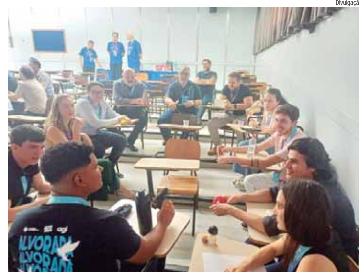
O Startup Day reuniu empreendedores, acadêmicos e representantes de instituições públicas e privadas