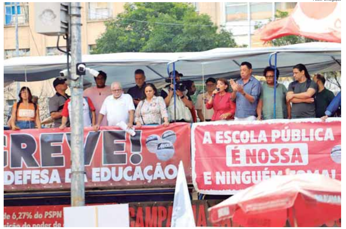
Na assembleia, Bebel chamou a atenção para a situação da categoria que está com perdas salariais