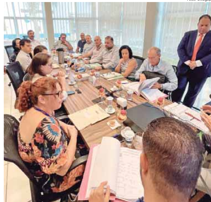
Conselho é composto por seis representantes dos contribuintes, seis da municipalidade