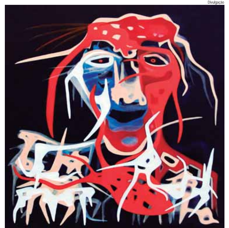
Exposição propõe uma imersão sensível nos conflitos, desejos e profundezas da alma humana