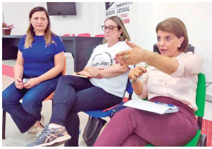
Na reunião, Bebel fez duras críticas ao governador Tarcísio de Freitas por propor a colocação de pedágios sem nenhuma discussão com a sociedade