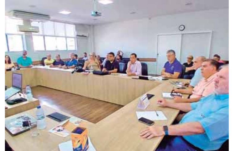
Reunião organizada pela FEEB discutiu o Saúde Caixa, presidente e diretores do Sindban estiveram no encontro