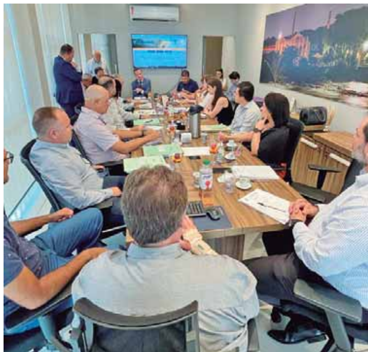
Conselheiros do Conselho dos Contribuintes em sessão na sede do Sincop

caba e seus contribuintes. O objetivo é a conciliação dos interesses do contribuinte com os da municipalidade, no que tange a impostos, taxas e contribuições municipais. Pelo menos quatro processos tiveram sustentação oral durante a sessão nesta segunda e foram encaminhados.