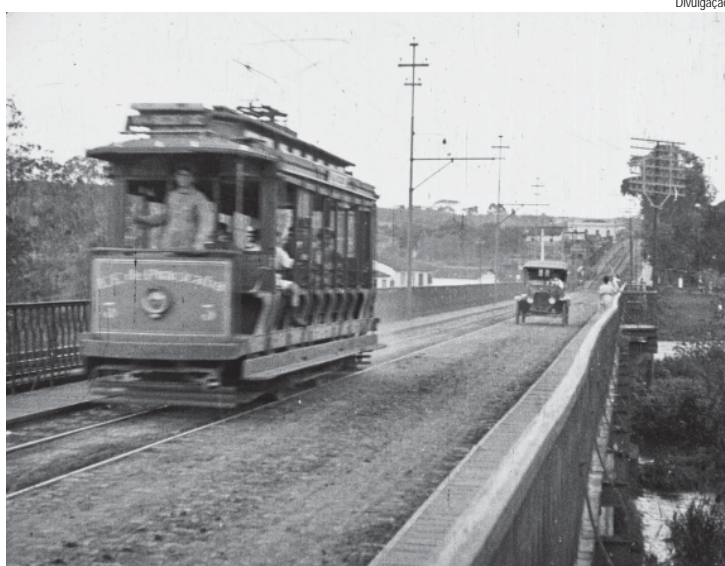
Exibição gratuita de 'Piracicaba' será no Galpão 8A do Engenho Central; produção é da Urgência Filmes

A produtora Urgência Filmes, em parceria com a Prefeitura de Piracicaba, por meio do Misp (Museu da Imagem e do Som de Piracicaba), realiza mais uma sessão gratuita do filme documental Piracicaba, rodado no ano de 1922 e considerado uma das primeiras produções deste gênero do interior paulista. A sessão é no sábado (29), às 19h30, em frente ao Galpão 8A do Parque do Engenho Central.