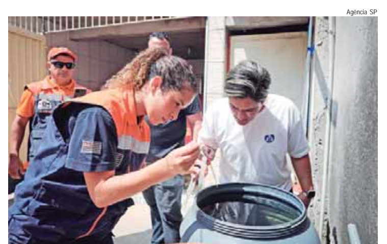
Defesa Civil realiza ações de prevenção da dengue

O Governo de São Paulo, por meio das Secretarias de Estado da Saúde e de Comunicação, lançou no último sábado, 22, uma iniciativa para combater a desinformação e conscientizar a população sobre dengue, chikungunya e Zika. Entre os dias 22 e 31 de março, das 10h às 16h, uma cabine interativa será instalada em cinco comunidades da capital: Heliópolis, São João, Cantinho do Céu, Paraisópolis e Jardim Planalto.