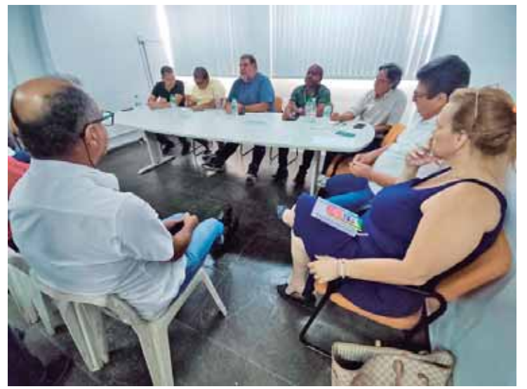
Na reunião, os dirigentes do Instituto Sindical destacaram que a isenção dos trabalhadores do pagamento do IR é uma antiga luta da entidade