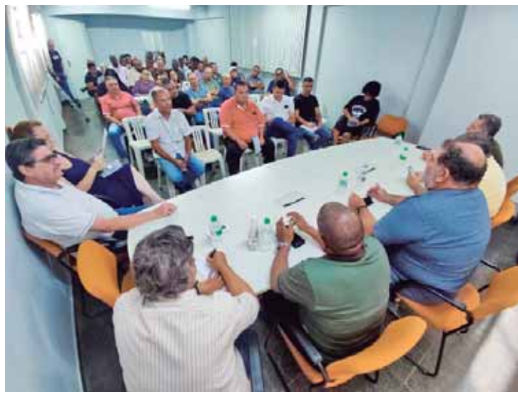
Dirigentes sindicais reunidos no Clube dos Metalúrgicos destacaram a importância do projeto, que trará ganho para os trabalhadores