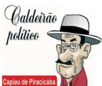
Capiou de Piracicaba

após a Assembleia Ordinária, realizada na sede, dia 15 de março: a partir da esquerda, Angolini, Neder, Storel e Mentem. Parabéns.