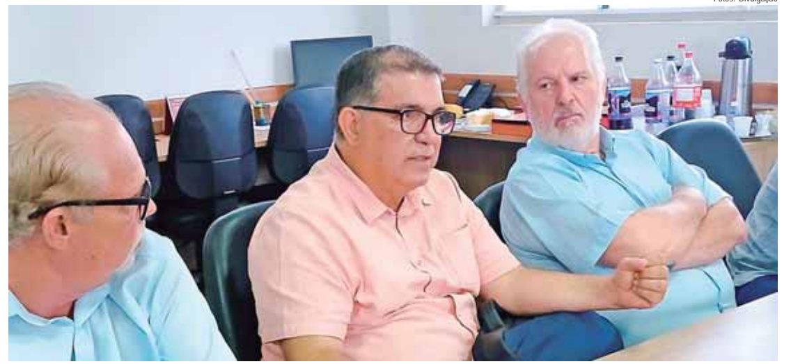
Paiva falou que é preciso garantir as conquistas dos bancários e lutar pelos planos de saúde