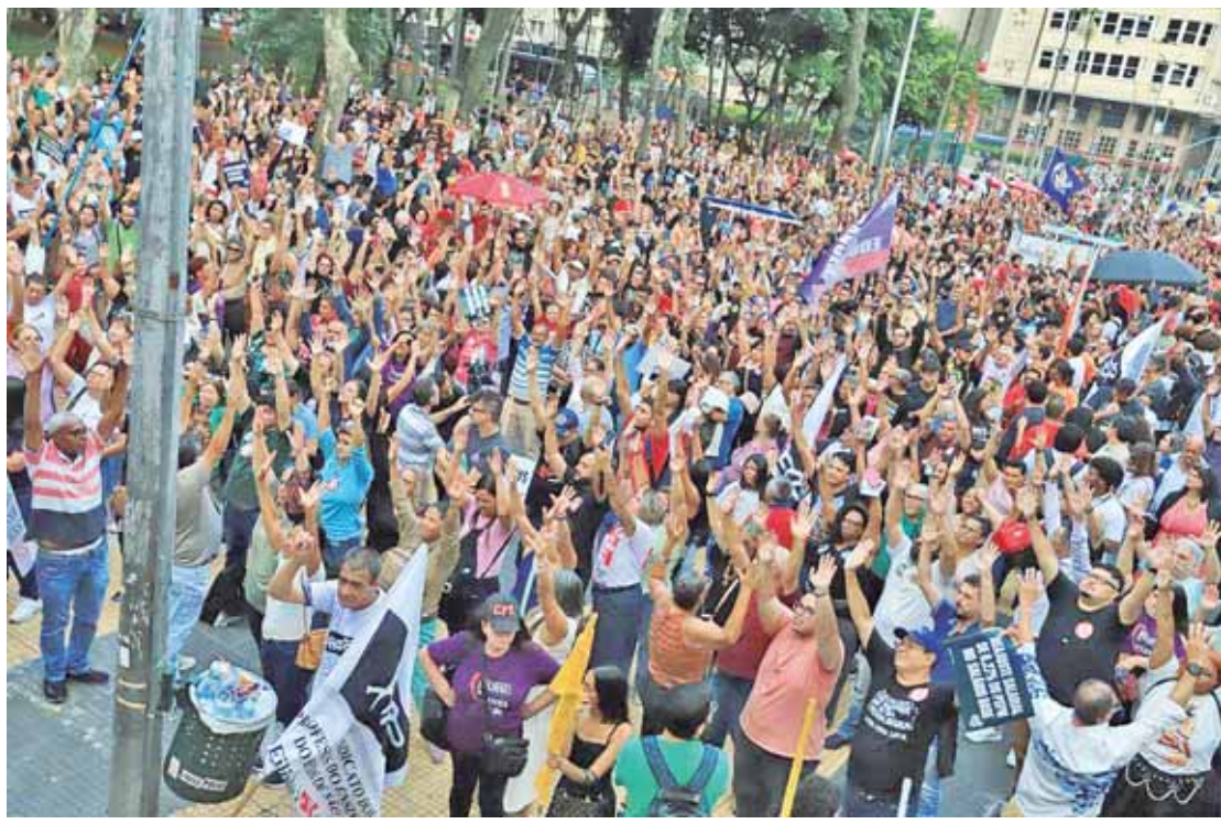
Professores votaram por unanimidade e demonstraram disposição para a greve