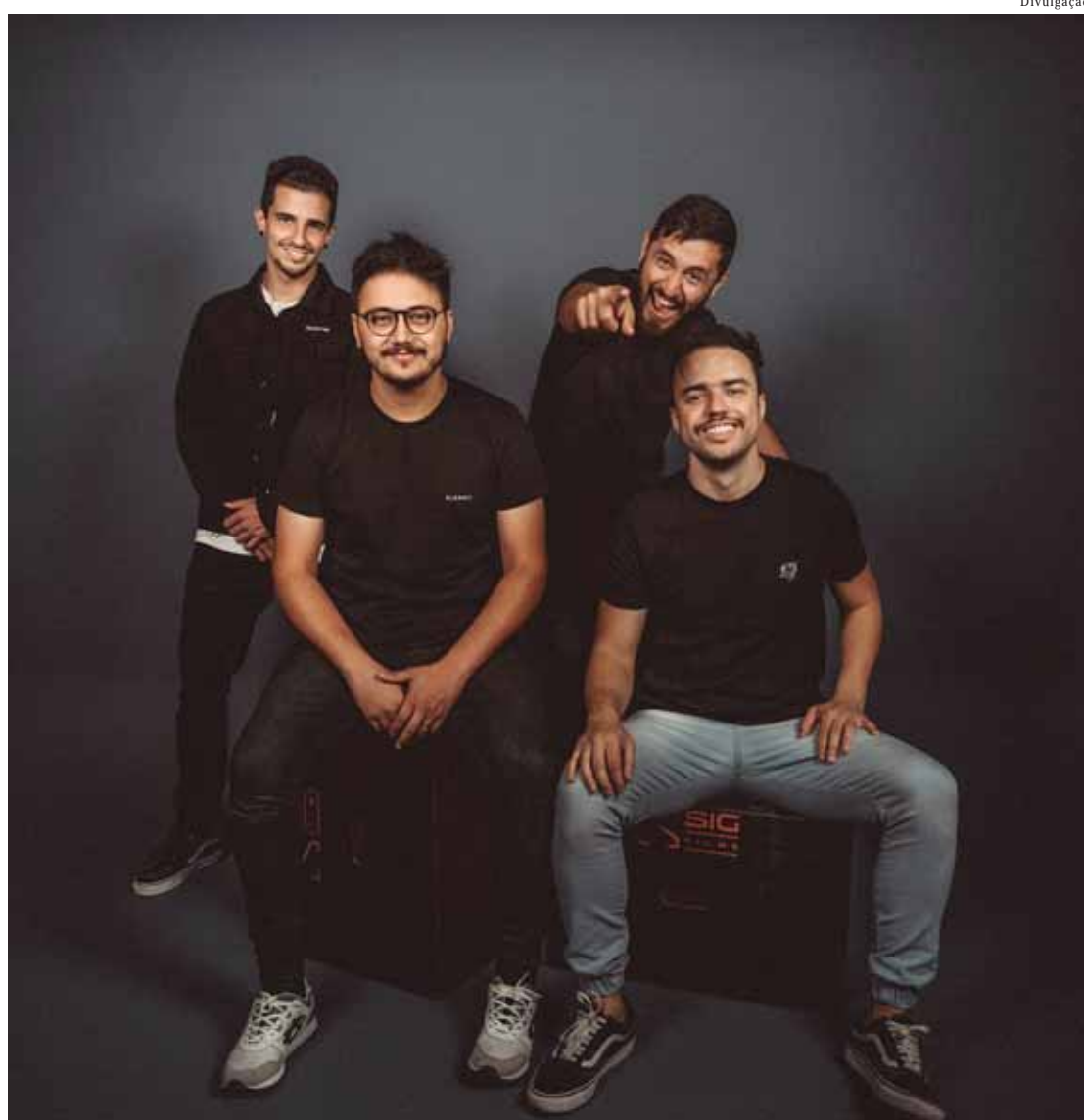
Show gospel com a banda Salvaon será às 21h, na Praça Matriz

ESPORTES - A Areninha integra as modalidades de futebol society e de basquete 3x3, com arquibancada e iluminação de LED, e faz parte de um projeto do governo do Estado. Já o Skate Park, também via-