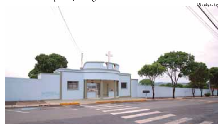
Herdeiros de pessoas falecidas precisam levar documentação ao Cemitério até o final do mês

Após o fim do prazo, caso não haja manifestação dos herdeiros, a concessão de uso será cancelada e o jazigo e benfeitorias voltam a ser patrimônio do município, que pode fazer nova concessão.