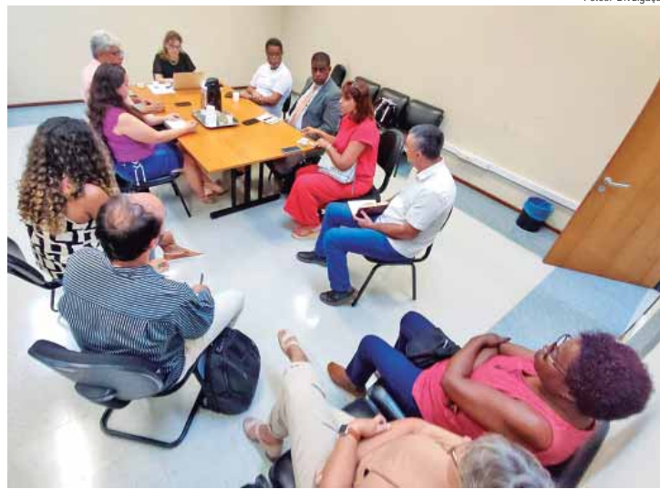
No encontro no MP, foi assegurado que nenhum aluno especial ficará sem o acompanhamento de professor auxiliar - Copia