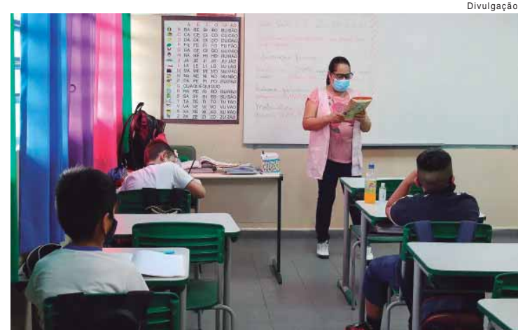
Vale destacar que a atualização no salário dos professores é obrigatória