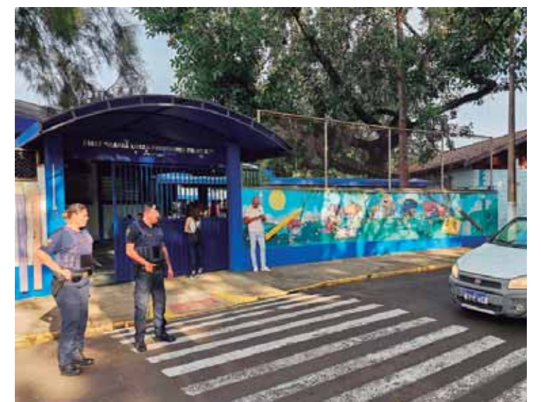
Durante a reapresentação dos alunos, a Guarda Civil Municipal (GCM) deu todo apoio no fluxo de trânsito

"Hoje atendemos com uma qualidade maior mesmo depois de implantarmos o ensino em tempo integral. Mantemos as parcerias com o Sesi e dispomos de um corpo docente com mais de 80 professores. No primeiro dia de aula já demos início à entrega dos materiais e na semana que vem também faremos também a entrega dos uniformes", pontuou. Durante a reapresentação dos alunos, a Guarda Civil Municipal (GCM) deu todo apoio no fluxo de trânsito, garantindo mais segurança nos arredores das escolas.