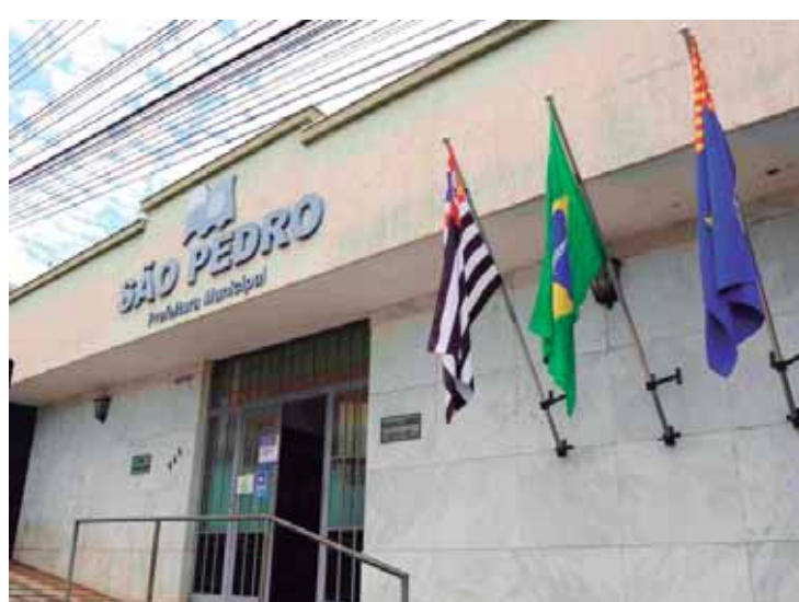
Profissionais de São Pedro terão mais facilidade para solicitar serviços de forma 100% digital e pela internet

Para utilizar o sistema é preciso acessar o site e fazer o cadastro gratuito em https://aprova.com.br/login . Em caso de dúvidas na utilização, o usuário deve recorrer ao suporte técnico da própria plataforma, que funciona em horário comercial. São Pedro é a 26ª cidade de São Paulo a utilizar a plataforma para tornar os serviços públicos mais eficientes. Mais de 120 municípios brasileiros aprovam a tecnologia.