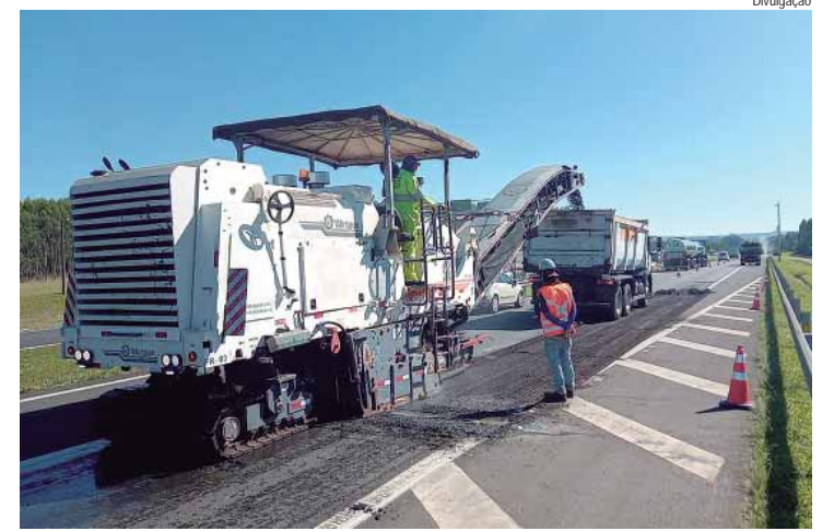
Recursos foram aplicados em obras de modernização, apoio ao usuário, segurança e ampliação da malha viária

A Eixo SP Concessionária de Rodovias investiu R$ 562 milhões em obras de melhorias em 2024. O montante abrange benfeitorias realizadas ao longo dos 1.221 quilômetros que compõem as 12 rodovias sob concessão, que se estendem desde a região de Piracicaba até Panorama, na divisa com Mato Grosso do Sul.