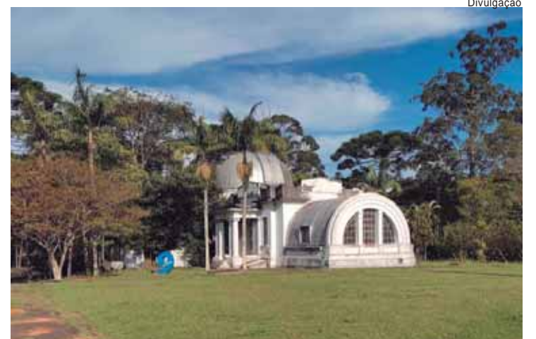
Jardim Botânico de São Paulo e Cientech são destinos programados nas excursões do Calendário Ambiental

Para garantir o acesso democrático às atividades, a Semagri solicita que, em caso de impossibilidade de comparecimento, os participantes cancelem suas inscrições com antecedência, permitindo que outras pessoas possam participar. Empresas e organizações interessadas nesta iniciativa podem buscar informações adicionais no site oficial ou Instagram da secretaria. O Calendário Ambiental 2025 tem entre principais objetivos reforçar o desenvolvimento sustentável e a educação ambiental, com criação de oportunidades de engajamento e transformação para toda a comunidade.