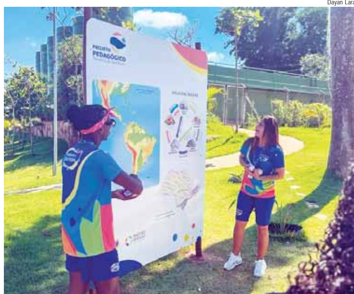
O parque abrirá as portas para que os participantes experimentem, na prática, as disciplinas que aprendem nas salas de aula

As imagens e os materiais apresentados no roteiro foram cuidadosamente elaborados para promover o desenvolvimento de habilidades fundamentais, como identificar, reconhecer, relacionar, comparar, analisar, avaliar e propor