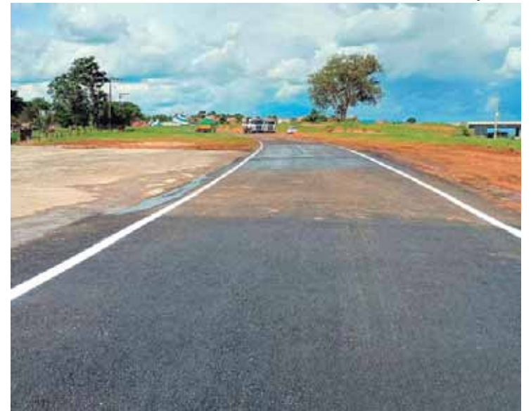
Trânsito na via de acesso à SP 304 voltou ao normal nesta quarta-feira

Os cursos, totalmente gratuitos, são realizados em Ambiente Virtual de Aprendizagem (AVA), plataforma on-line na qual os estudantes desenvolvem atividades acadêmicas, que incluem assistir a videoaulas, acessar material didático, bibliotecas digitais e tirar dúvidas do conteúdo com facilitadores. Já os polos, são espaços físicos onde os alunos contam com infraestrutura (computadores, impressoras e acesso à internet) e realizam atividades, como provas e discussões em grupo. No local, também podem ser solicitados serviços de secretaria acadêmica e esclarecimento de dúvidas. Todas as videoaulas também podem ser acessadas pelo canal do YouTube: https://www.youtube.com/user/univesptv . Saiba mais sobre os cursos em univesp.br/cursos .