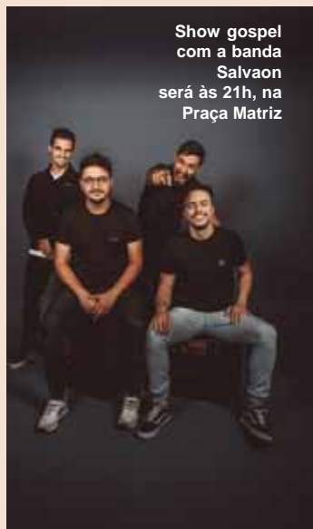
Show gospel com a banda Salvaon será às 21h, na Praça Matriz

A programação que vai celebrar os 144 de emancipação política de São Pedro, no dia 22 de fevereiro, começa às 9h, com a inauguração do projeto Areninha "Luiz Antônio Bília" e da pista de skate "Iraí Batista da Cruz Boucault", além de uma cerimônia de comemoração no Complexo Turístico, Esportivo e Cultural Paulo Passos, do qual fazem parte o Ginásio de Esportes Antônio Carlos Siloto Filho, o Bordadão; o Parque Hípico Itagiba LeiteFilho e o Centro de Convenções Jacintho José Fávoro, na avenida Paschoal Antonelli. A15