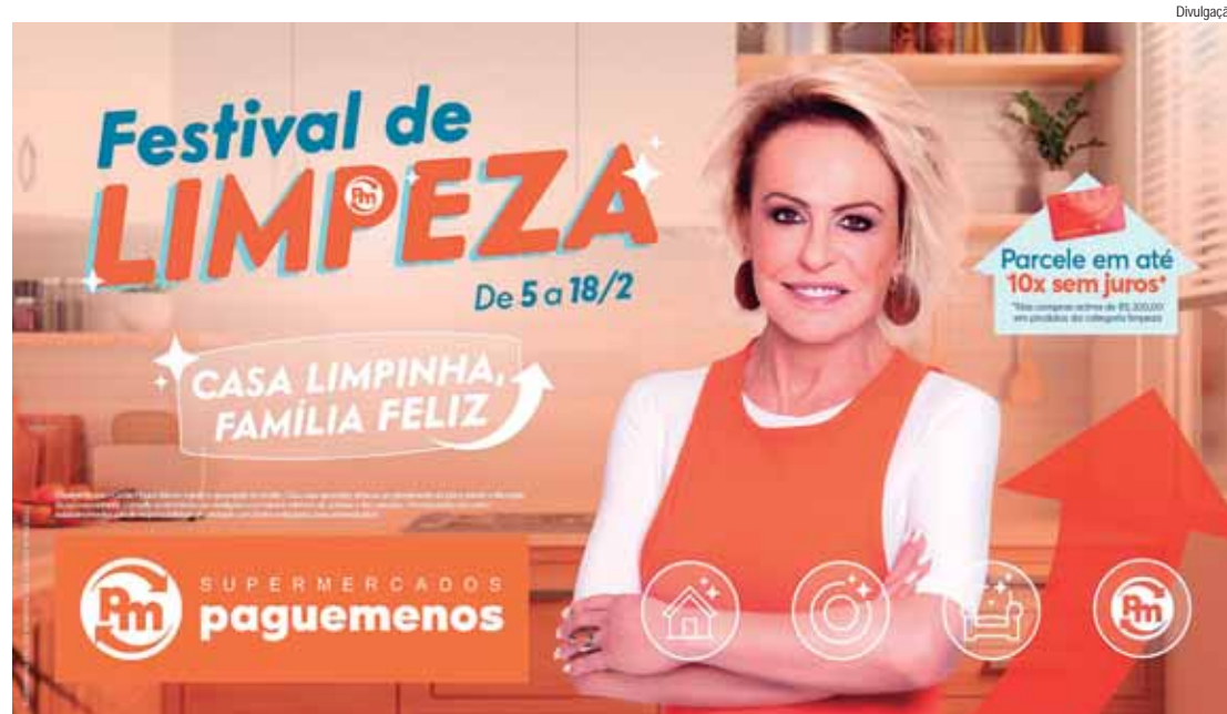
O Festival de Limpeza da Pague Menos acontece simultaneamente nas 37 lojas