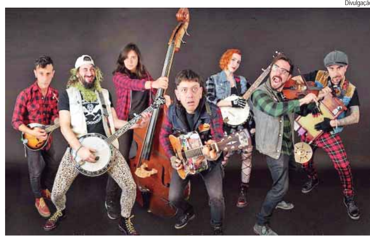
Angry Zeta vai encerrar a programação do dia 28