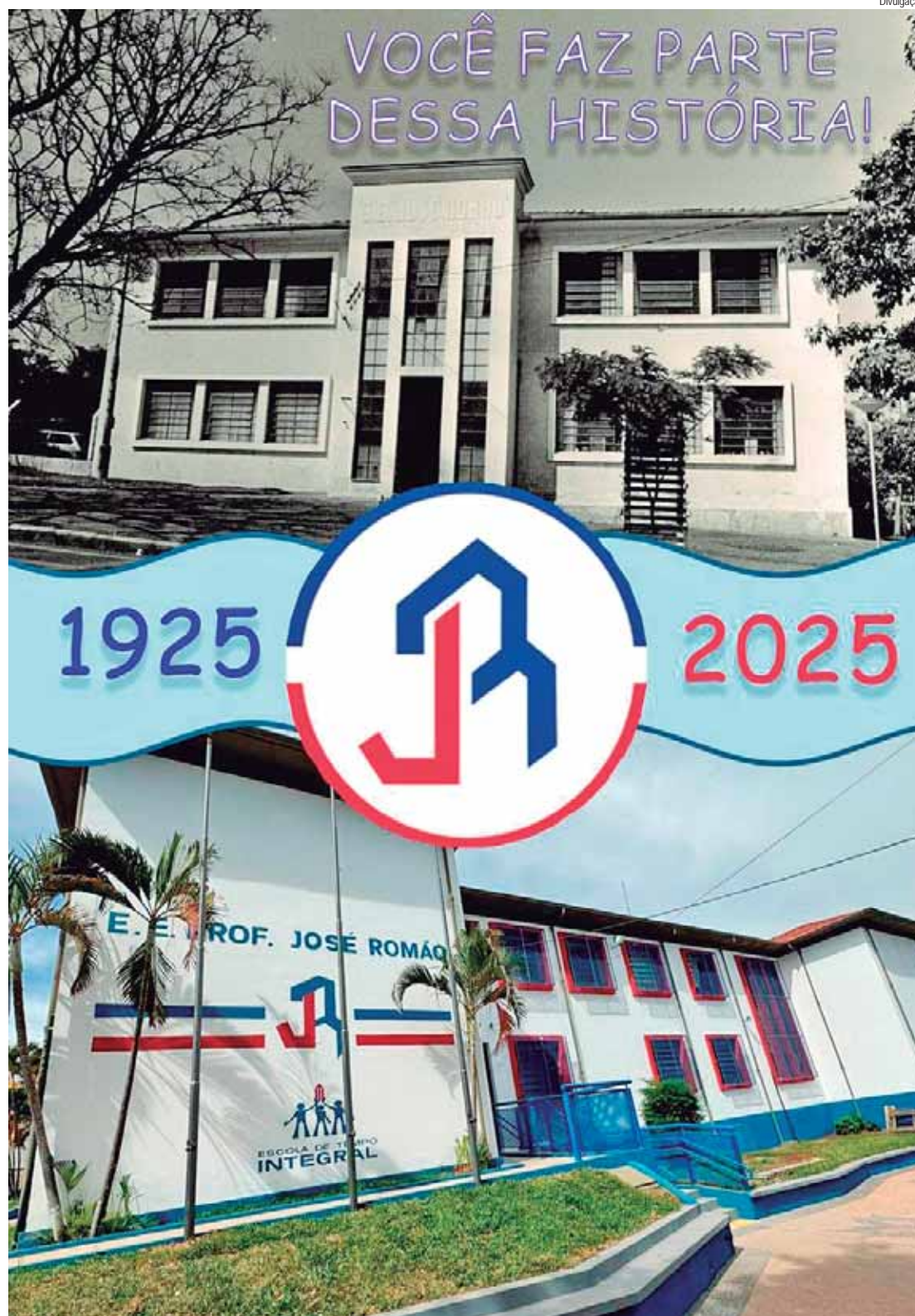
Escola José Romão apresenta cápsula do tempo neste sábado, 22, para a comunidade

Para encerrar o ano do centenário da escola José Romão, equipe escolar vai fechar cápsula do tempo com trabalhos de alunos e ex-alunos da primeira escola da Vila Rezende