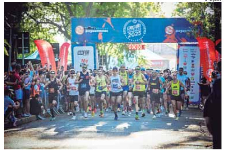
Além da corrida, participantes concorreram a vales-compras do Supermercados Pague Menos

Pela segunda vez, Limeira foi palco do Circuito Corridas Pague Menos, proporcionando uma experiência inesquecível aos atletas. O percurso teve início no Horto Florestal, um dos símbolos da cidade, conhecido por suas paisagens únicas e atmosfera acolhedora. Mais do que um ponto de largada, o lo-