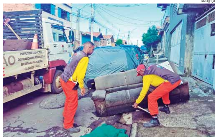
Os arrastões são uma das formas para se evitar a proliferação dos criadouros do mosquito da dengue

PREVENÇÃO – Alguns dos cuidados mais importantes para a prevenção da dengue são utilizar repelente, principalmente em lugares fechados; eliminar focos de água parada; manter os pratos de vasos de flores e plantas com areia até a borda; guardar garrafas com a boca virada para baixo; limpar sempre as calhas dos ca-