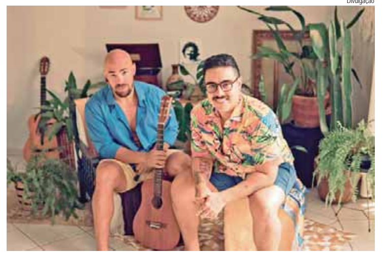
Bagaço anima o Carnaval da Green neste sábado

"O torcedor que vaiou o time na saída de campo é o mesmo que vai gritar o nome do jogador e pedir autógrafo nas vitórias e eles tem total direito de agir assim, são movidos por paixão e esperanças. Quem tem que criar estratégias e se preocupar com dificuldades somos nós, dentro do trabalho planejado e fazer com que o objetivo seja alcançado", finalizou o comandante quinzista, já focado na partida deste domingo, 25, quando o XV recebe o Ituano no Barão, pela 12ª rodada.