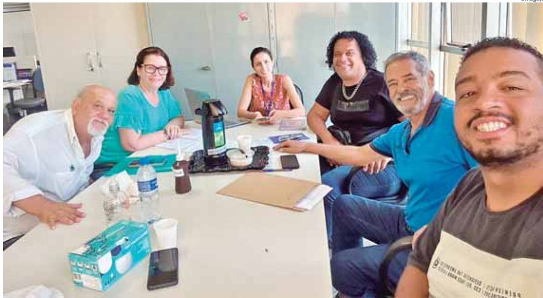
Reunião aconteceu na última terça-feira, 18