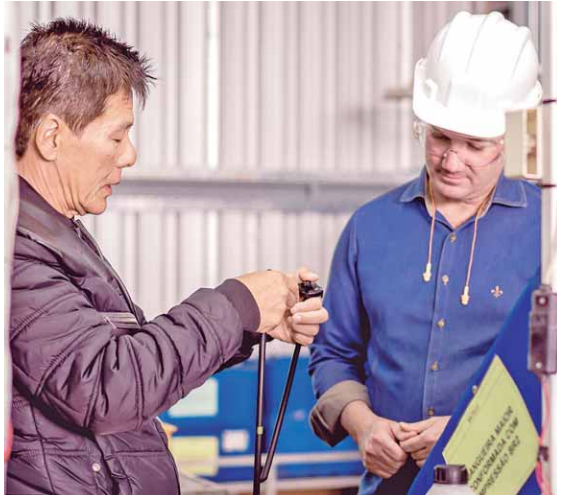
Prefeito Thiago Silva em visita à empresa do Distrito Industrial de São Pedro

Para o prefeito Thiago Silva, "São Pedro vai além das belezas naturais e trilha um caminho de desenvolvimento muito grande, com potencial altíssimo para os próximos anos. Essa evolução tem a ver com a nossa gestão e com um visão estratégica. Nossa cidade, que já é referência em saúde e educação, está com a economia consolidada e bem estruturada. O turismo, que sempre foi a base, vai crescer ainda mais com parcerias com municípios vizinhos. São Pedro chega aos 144 anos com muito a comemorar, mas principalmente com a responsabilidade, diante do crescimento da população, de se tornar a cidade do futuro que todos nós queremos".