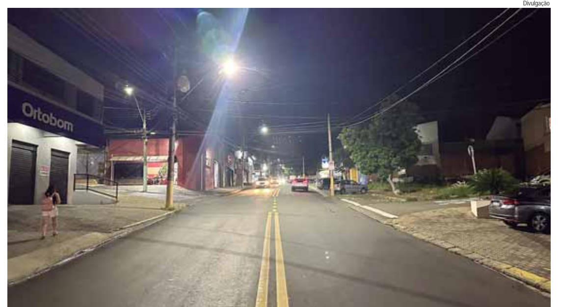
Avenida Rio das Pedras com nova iluminação

PARQUE ITAÍCI – O Parque Itaíci, localizada na região do Vila Sônia, também ganhará iluminação em LED. O local, que não