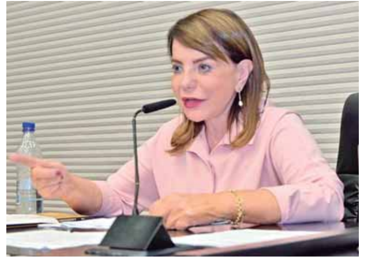
O projeto da deputada Professora Bebel institui o marco regulatório para o uso de ferramentas digitais de Inteligência Artificial no âmbito das escolas públicas e privadas do Estado de São Paulo

ciais, a certificação dos mecanismos de inteligência artificial para uso nas escolas públicas do Estado de São Paulo, assim como a edição de materiais periódicos de orientação de seu uso, planejamento de ações de aperfeiçoamento no conhecimento e capacitação dos mecanismos de inteligência artificial nas escolas públicas do Estado de São Paulo, a formulação de código de comportamento ético na utilização de tais mecanismos, além da constituição de fórum permanente entre a agência e as empresas mantenedoras de mecanismos de inteligência artificial, com o objetivo de conhecer tais mecanismos e entender as implicações de seu uso, bem como compreender o comportamento ético de cada um desses mecanismos, bem como os preceitos básicos de treinamento dos mecanismos de inteligência artificial e de seus mecanismos de proteção na coleta de dados para seu treinamento e formulação de conteúdo, de modo a evitar o uso de dados falsos ou fundados em preconceitos e conceitos socialmente inaceitáveis. Também estabelece a realização de avaliações periódicas do uso dos mecanismos de inteligência artificial nas escolas públicas do Estado de São Paulo.