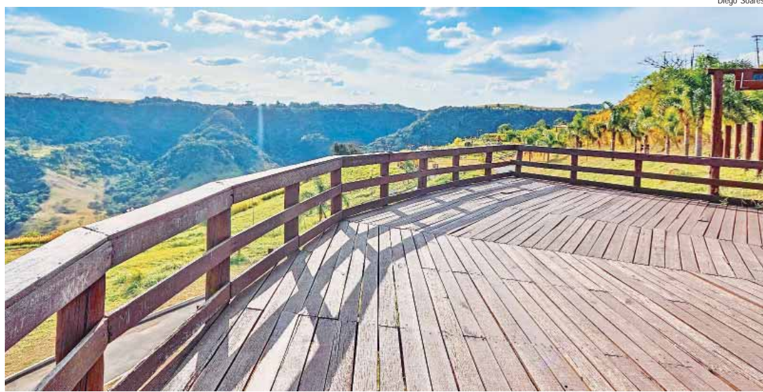
A programação de aniversário da cidade começa às 9h de hoje (22)