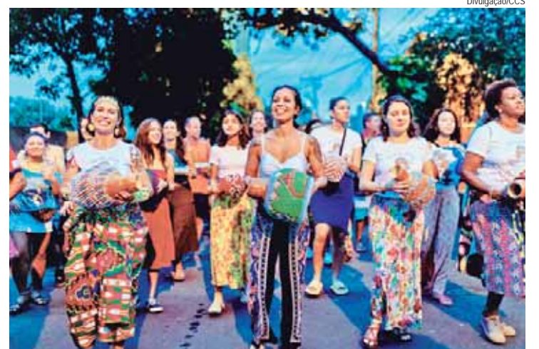
Bloco Vila África realiza desfile neste sábado