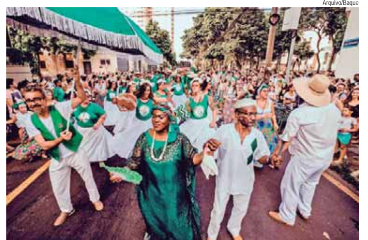
Baque Caipira é atração do domingo