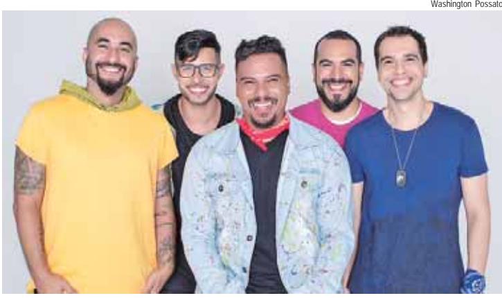
Sorriso Maroto faz show no Engenho, no sábado, 22