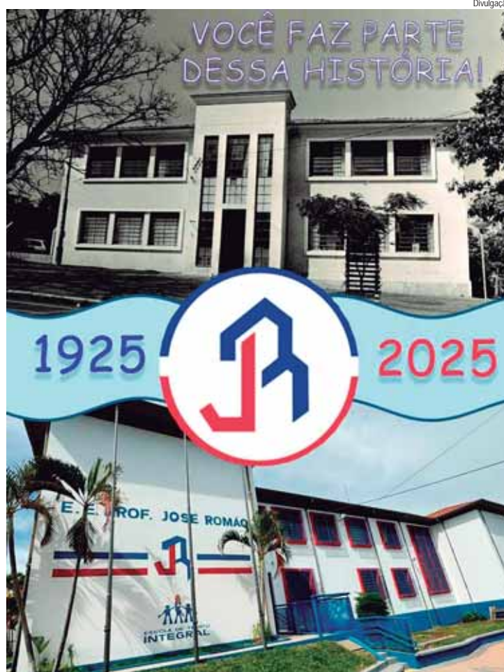
Escola José Romão apresenta cápsula do tempo neste sábado, 22, para a comunidade