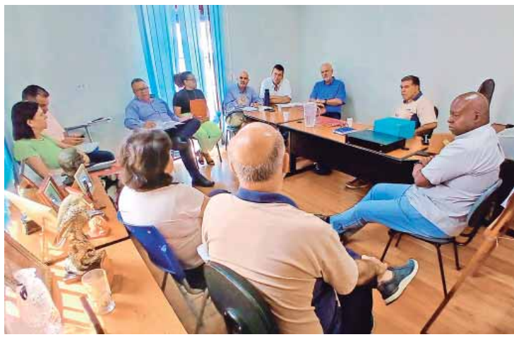
Integrantes do Sindicato de Sorocaba estiveram no SindBan em Piracicaba para trocas de experiências