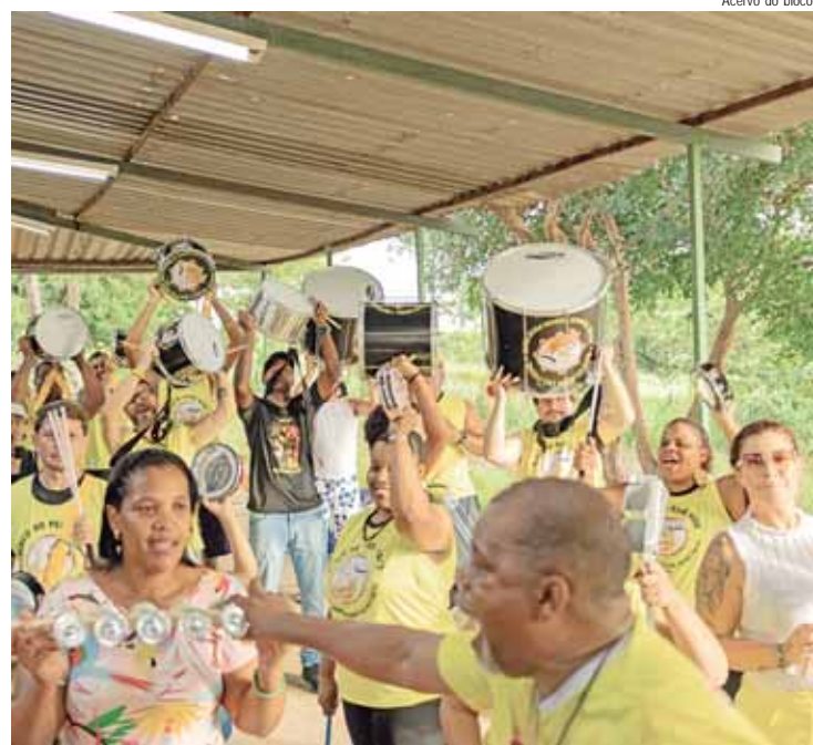
Integrantes do Bloco do Peixe Frito durante ensaio

O Carnaval de Piracicaba tem apoio da Secretaria Municipal de Segurança Pública, Trânsito e Transportes, da GCM (Guarda Civil Municipal) e Polícia Militar, além do Coletivo de Cordões e Blocos de Carnaval de Piracicaba e da Piracerva – Associação das Cervejarias Artesanais de Piracicaba.