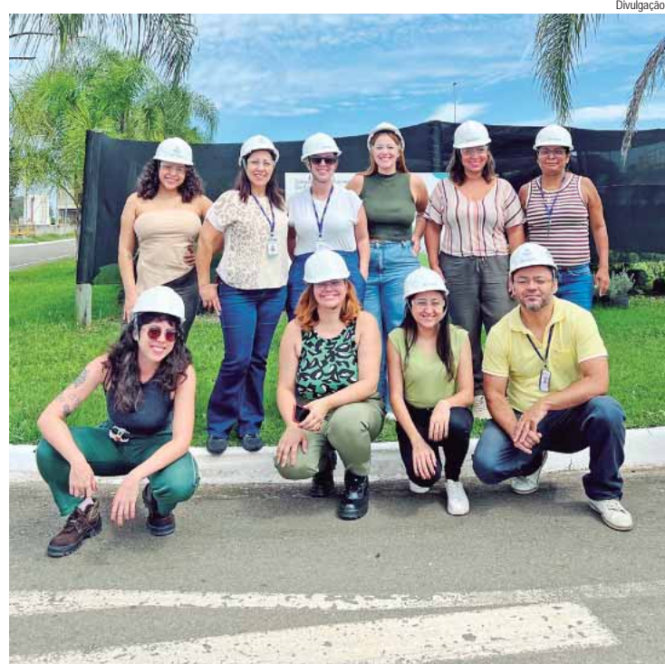
Encontro aconteceu na Estação de Tratamento de Esgoto Bela Vista