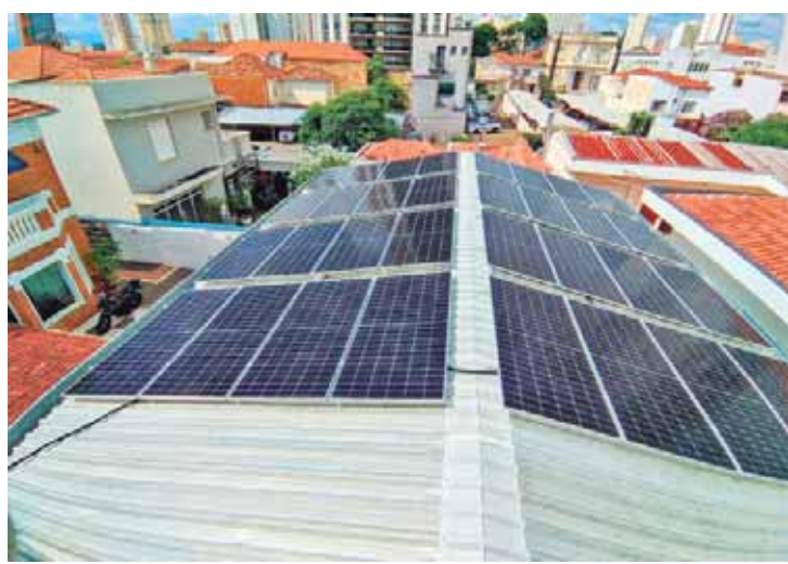
Painéis solares instalados no espaço de eventos do SindBan alimentará a sede e deve gerar excedente de energia