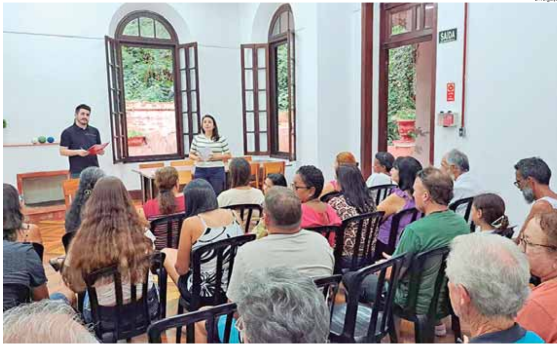
No início desta nova gestão, artesãos também participaram de reunião na Secretaria de Turismo

“É de fundamental importância estreitarmos nossos laços no intuito de desenvolver o turismo em Piracicaba. Nosso propósito é fazer uma gestão colaborativa, dando espaço a todos que queiram, de fato, colaborar para este propósito. Sugestões são sempre