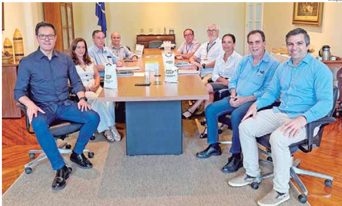
Reunião aconteceu na última quinta-feira, 13, na Esalq

“Esse é um passo fundamental para a contribuição do desenvolvimento de Piracicaba. A ampliação do aeroporto e a melhoria das vias de acesso são ações estratégi-