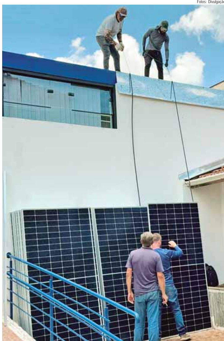
SindBan instalou painéis solares que devem gerar 2000 quilowatts de energia a cada mês