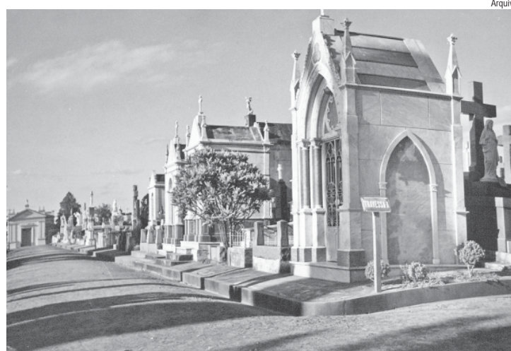
Em 1854, vereadores manifestaram preocupação sobre "hálito pestífero" exalado pelo cemitério

"O Snr. Ferraz indicou que o lugar que serve de matadouro nesta Vila é impróprio visto que já prejudica a salubridade pública, por isso que deve marcar-se outro no cemitério. Entrando em discussão foi deliberado que se marcasse hum quarteirão para esse fim, fazendo