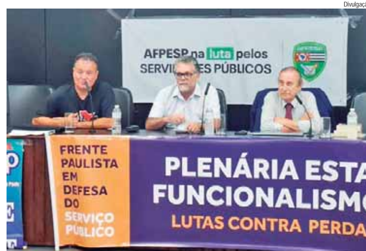
Como resultado dos debates, foram traçadas estratégias para fortalecer a defesa do funcionalismo

“A Afesp segue firme na defesa dos servidores públicos e na luta por melhores condições de trabalho e reconhecimento da importância do funcionalismo para a sociedade.