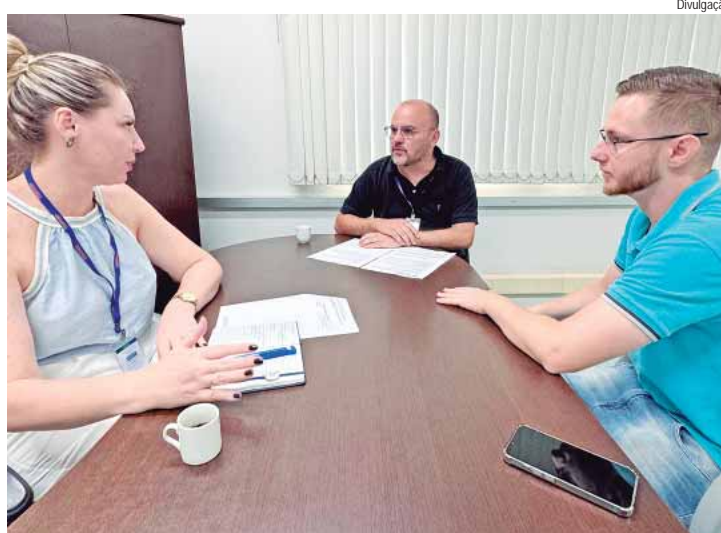
Vereador esteve na Secretaria de Assistência Social, Desenvolvimento e Família para fortalecer o diálogo com a pasta e apresentar ações do mandato

O parlamentar reforçou a importância de oferecer melhores condições de trabalho aos conselheiros tutelares, apoiando o papel fundamental que desempenham na