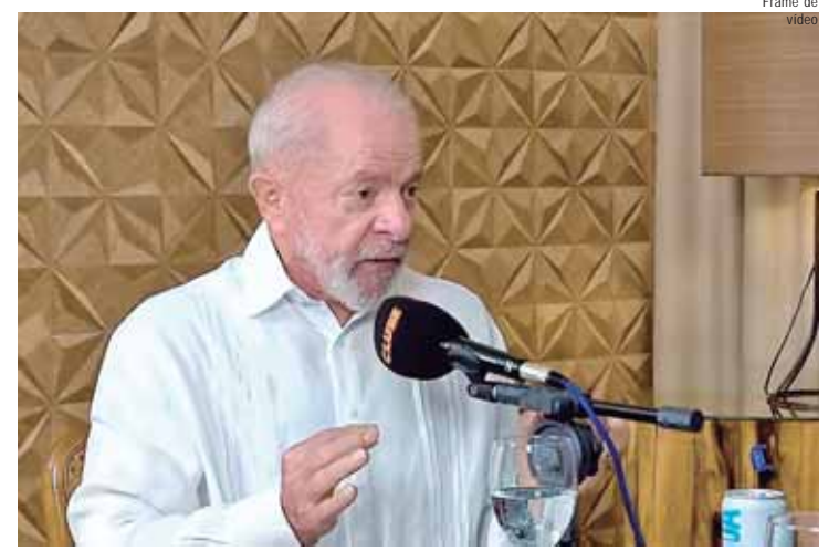
Lula durante entrevista à Rádio Clube do Pará: "Educação e moradia são duas coisas que eu carrego na alma"

Diante do cenário de aumento de casos, especialistas reforçam que a conscientização da população e a adoção de medidas preventivas são fundamentais para conter a propagação da dengue.