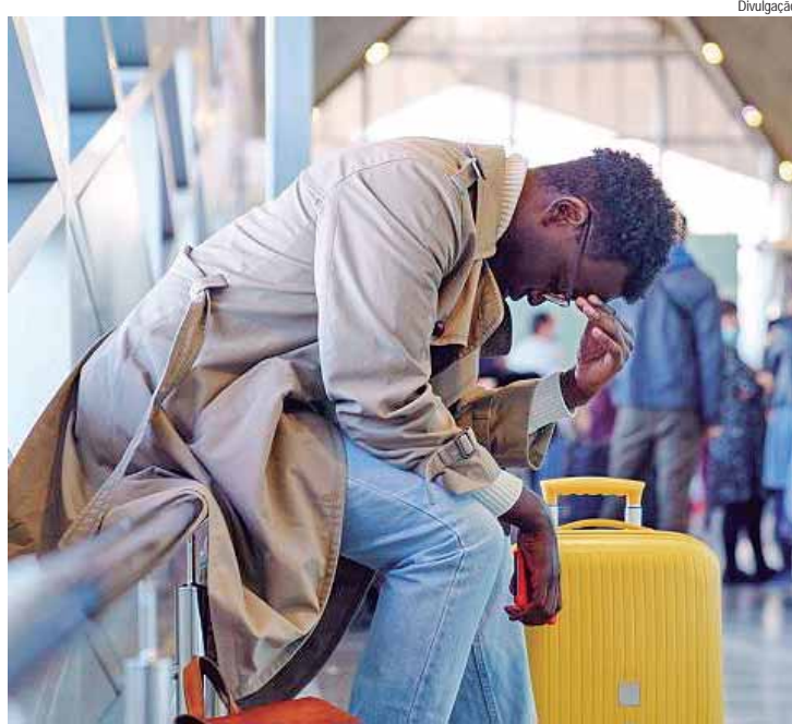
Viajantes têm protegido também as malas que embarcam no avião