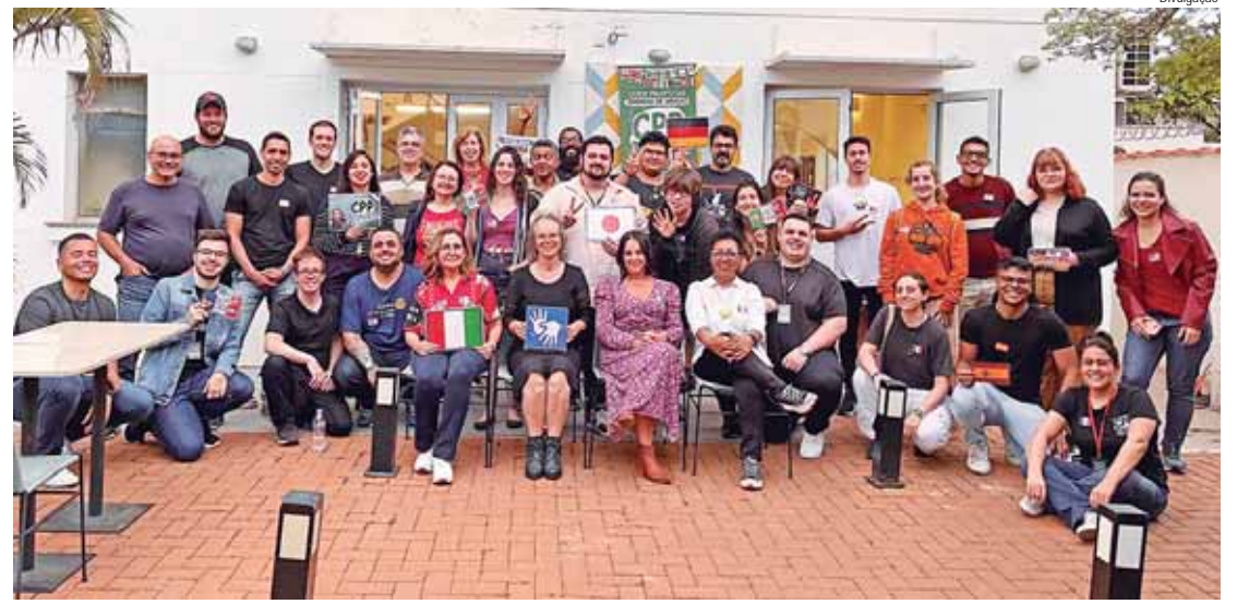
Encontros do CPP acontecem quinzenalmente na padaria Blém, não há cobrança de taxas

Há mais de um ano em funcionamento, o CPP tem oferecido a prática de inglês, francês, espanhol, italiano, alemão, japonês, português para estrangeiros e línguas e tem até quem esteja buscando a prática de sueco, eventualmente outros idiomas podem ser praticados, basta que as pessoas se reúnam e se integrem ao CPP.