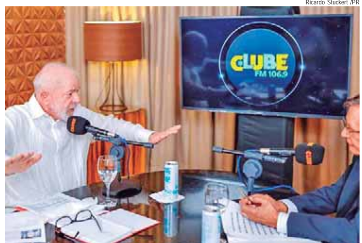
Em 2024, 24,7 milhões de brasileiros foram beneficiados pelo Farmácia Popular

Em 2024, o orçamento destinado ao programa alcançou R$ 3,6