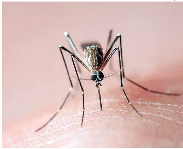
No estado de São Paulo, o número de casos já apresentou alta significativa nos primeiros 40 dias de 2025

Cuidado com as crianças - Os profissionais de saúde também devem estar atentos aos sintomas da doença, principalmente em crianças. "Os médicos precisam considerar a dengue no diagnóstico de qualquer paciente com febre e sintomas inespecíficos, principalmente diante do aumento expressivo de casos. O reconhecimento precoce é essencial para um acompanhamento adequado", destaca a especialista.