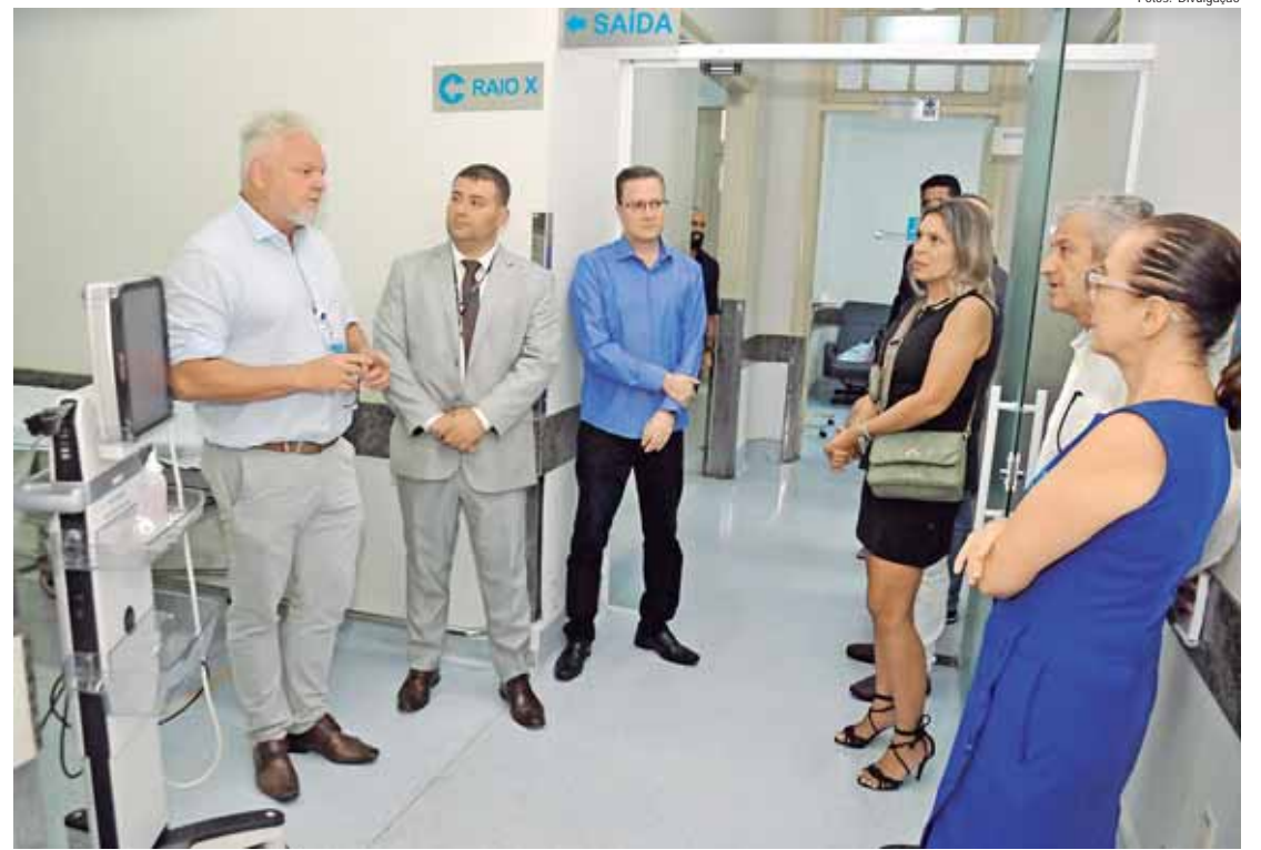
O objetivo do encontro foi conhecer o sistema de atendimento de urgência e emergência do hospital