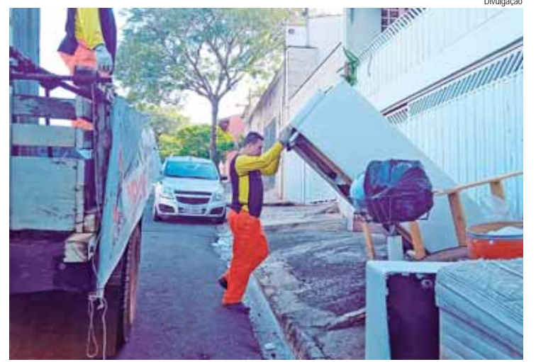
A Secretaria Municipal de Saúde reforça que o objetivo desta ação é o combate ao mosquito Aedes aegypti