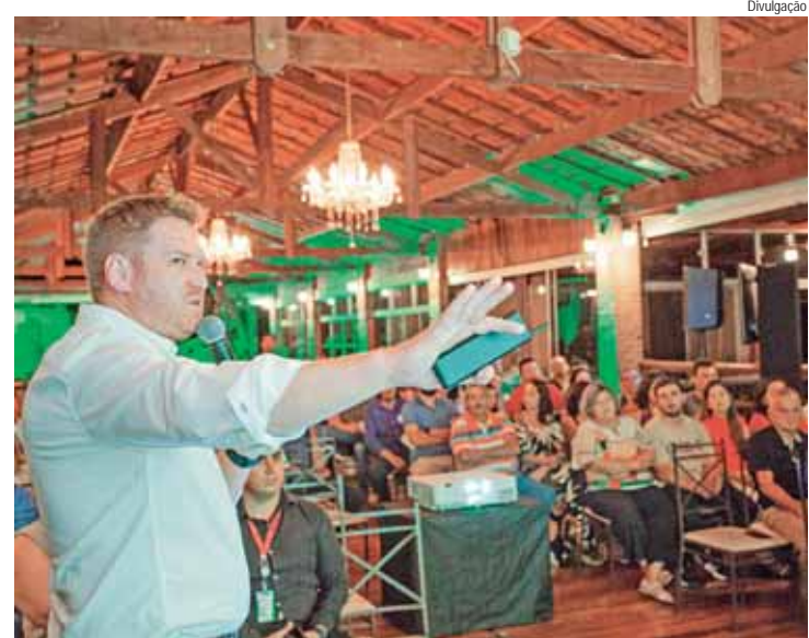
Sicredi Dexis encerrou a primeira semana de assembleias de prestação de contas nas regionais com 1070 associados participando dos eventos em oito cidades