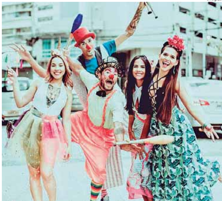
População deve se imunizar pelo menos 10 dias antes da viagem para áreas de risco

O Governo de São Paulo resalta a importância da vacinação contra a febre amarela para a população, principalmente aqueles que planejam viajar para áreas com transmissão do vírus ou para regiões rurais e de mata no Carnaval. No estado foram confirmados 10 casos humanos, sendo seis evoluídos para óbito, todos com histórico de não vacinação.