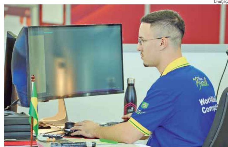
As vagas são para diversas áreas como telecomunicações, mecânica, tecnologia da informação, meio ambiente e automação

Senai é referência em educação profissional na América Latina - O Senai é o principal parceiro da indústria na formação de trabalhadores e na inovação. Maior rede privada de educação profissional do