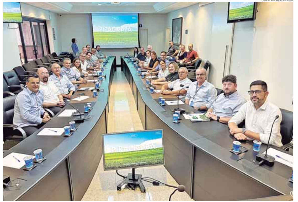
Encontro na Acipi reuniu representantes da Prefeitura, empresários e instituições