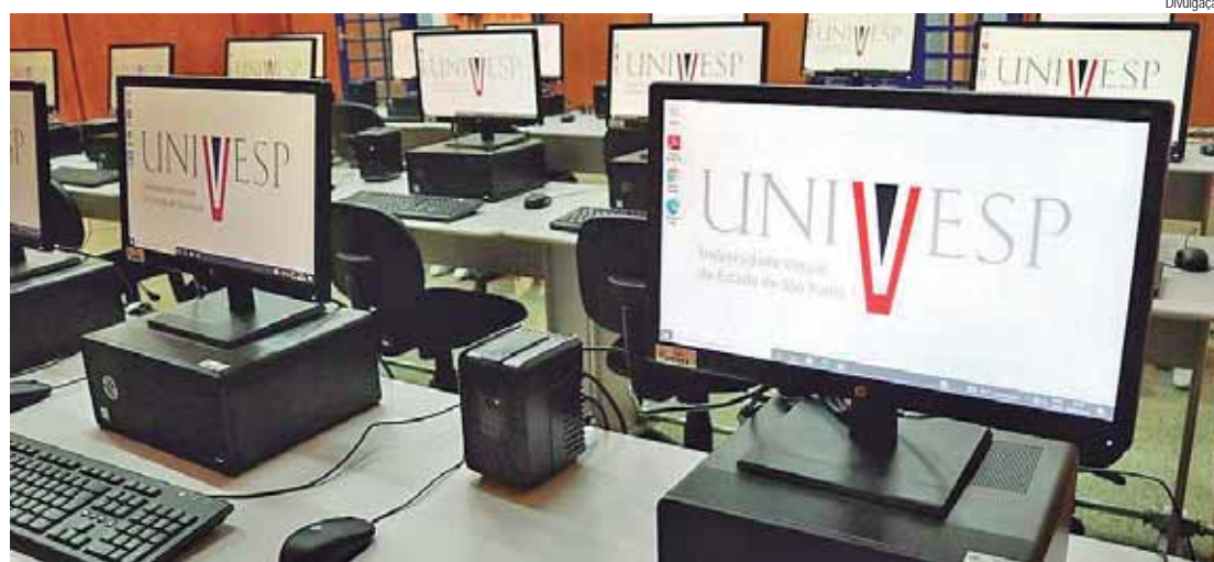
Processo seletivo oferece 135 vagas na cidade em cursos gratuitos; inscrições estão abertas até abril

No polo de Piracicaba, localizado na rua Idalina, 314, no bairro Pauliceia, há vagas para os cursos de Administração, Ciên-