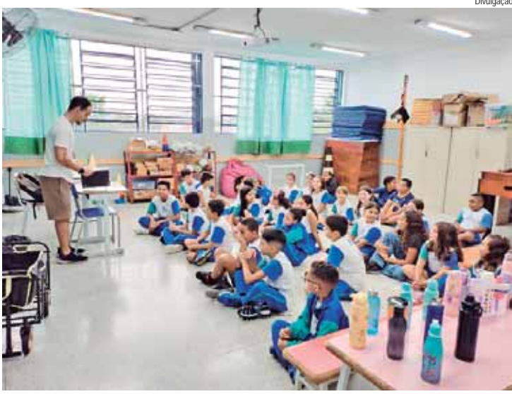
Profissionais devem assumir os cargos em 6 de março