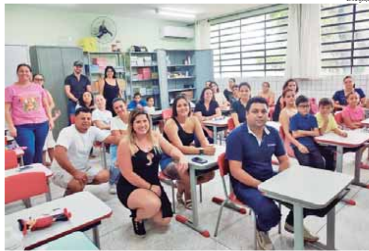
Encontro foi realizado segunda (3)

Especialistas em Educação enfatizam que a adaptação ao ambiente escolar é essencial para o desenvolvimento acadêmico e emocional das crianças, especialmente nos primeiros anos da edu-