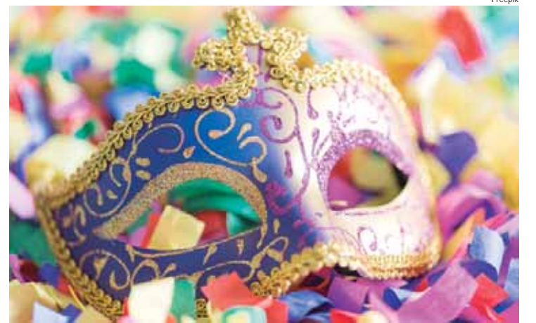
Ao menos oito agremiações cantarão temas ligados à África

Já em terras cariocas, a Unidos de Padre Miguel canta o samba “Egbé Iya Nassô”, a Imperatriz Leopoldinense, “Ômi Tùtu Ao Olùfon — Água fresca para o senhor de Ifón”, a Viradouro — atual cam-