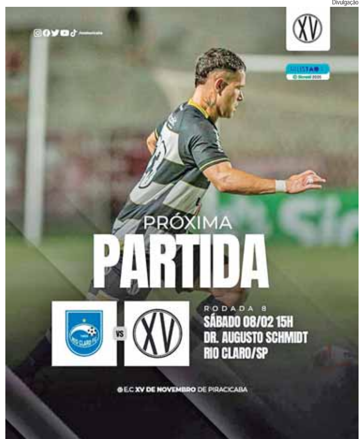
XV volta a campo neste sábado, 8, contra a equipe do Rio Claro

"Comemoramos vitórias e sofremos com as derrotas até a reapresentação no outro dia, assim que chegamos para trabalhar, nos