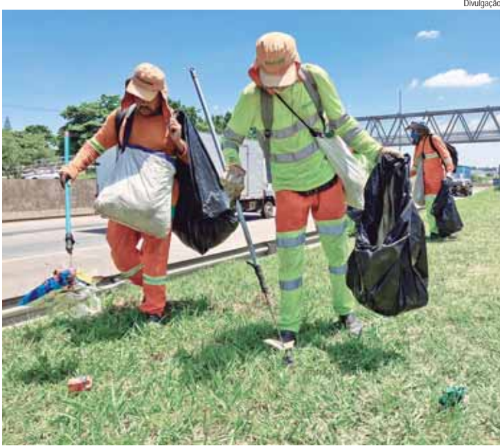
Em 2024 a Via Colinas retirou 698 toneladas de lixo das rodovias que administra

A Via Colinas, concessionária do grupo Via Appia, recolheu 698,3 toneladas de lixo e entulho das rodovias que administra ao longo de 2024. Esse número é praticamente o mesmo do ano passado, quando foram retiradas 699 toneladas de resíduos, entre garrafas, latas, embalagens plásticas, papel, papelão e sacolas plásticas.