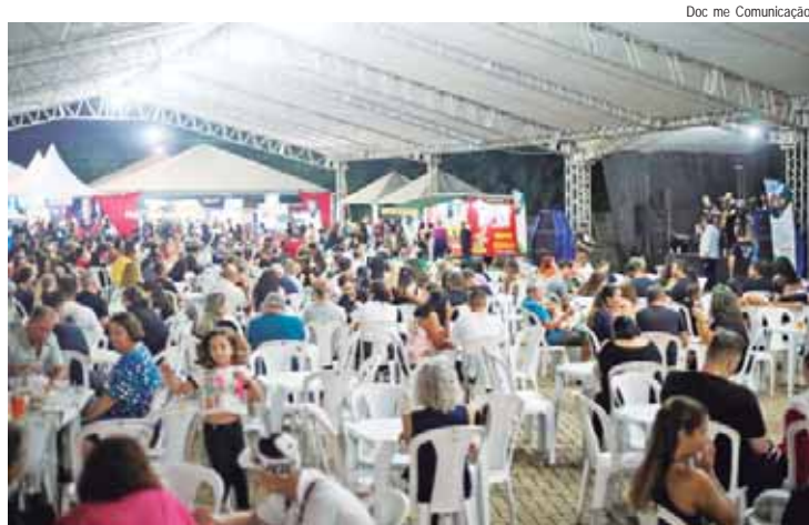
Evento é beneficente, organizado em prol da Associação Atlética Educando pelo Esporte