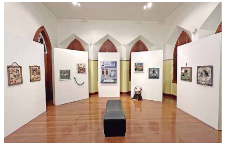
Exposição temporária O Livro, a História para Ler e Contar