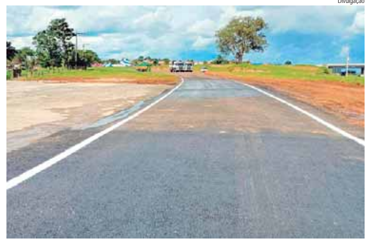
Trânsito na via de acesso à SP 304 voltou ao normal nesta quarta

nizada, a rede municipal de ensino de Saltinho reafirma seu compromisso com a qualidade da educação e o bem-estar dos estudantes, garantindo um início de ano letivo mais tranquilo, inclusive motivador para todos.