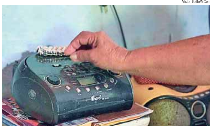
Ministério das Comunicações está com inscrições abertas para rádios comunitárias

O Ministério das Comunicações autorizou, na atual gestão, o funcionamento de 206 rádios comunitárias em todo o Brasil. O número é 275% maior que as 55 emissoras autorizadas nos dois primeiros anos da gestão anterior.