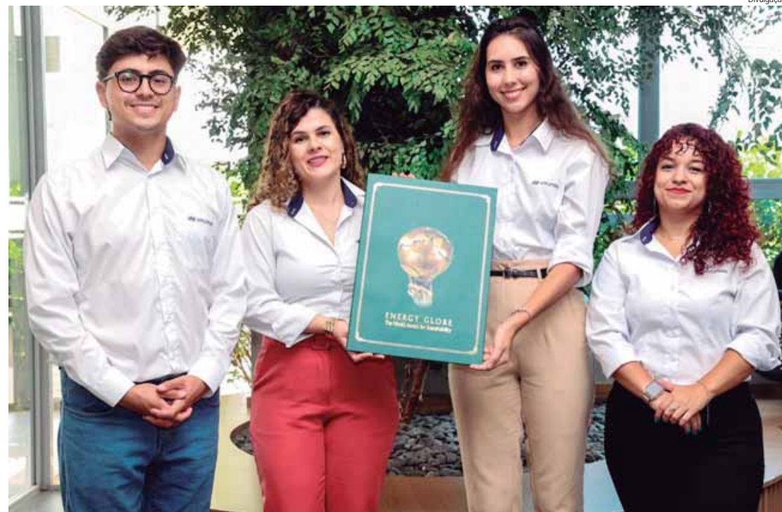
A Hyundai é a primeira montadora a conquistar a premiação no Brasil

National Energy Globe Award Brazil, dos principais do mundo, já avaliou desde 2000 cerca de 20 mil projetos apresentados por empresas de mais de 180 países