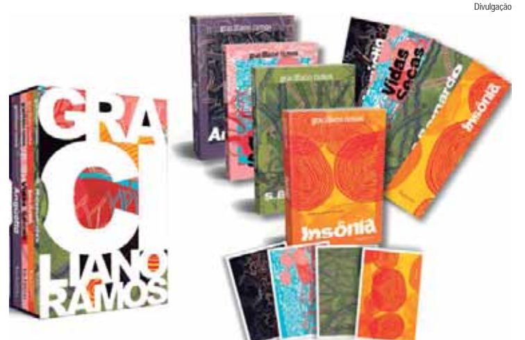
A coleção inclui Vidas Secas, uma narrativa poderosa sobre a luta pela sobrevivência no sertão

Para os amantes da boa literatura, o selo Via Leitura, do Grupo Editorial Edipro, reuniu em um box as obras mais marcantes de Graciliano Ramos, um dos maiores nomes da literatura nacional. Com uma escrita concisa e intensa, o autor alagoano desvela as contradições humanas, as injustiças sociais e os dramas existenciais que atravessam gerações.