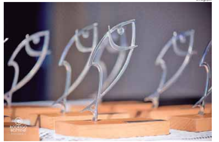
Os indicados incluem uma variedade de artistas de diferentes gêneros

Os resultados serão anunciados em uma cerimônia de gala,