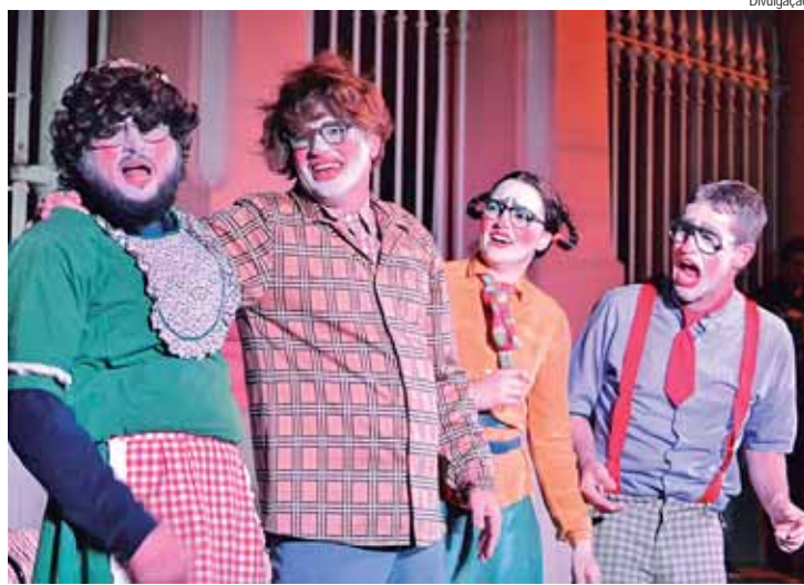
A Noiva do Defunto será apresentado na frente do Cemitério da Saudade