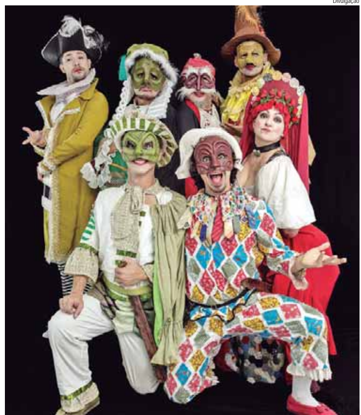
A commedia Dell'Arte A Arrombada, da Cia Metamorfose, tem entrada gratuita, hoje no Engenho

O Teatro Municipal Erotides de Campos, o Teatro do Engenho, recebe hoje, 31, às 20 horas, a peça teatral do gênero commedia Dell'Arte A Arrombada, da Cia Metamorfose, com direção de Carlos ABC e dramaturgia de Antônio Rogério Toscano. A entrada é gratuita e os ingressos devem ser retirados uma hora antes do início do espetáculo, na bilheteria do teatro.