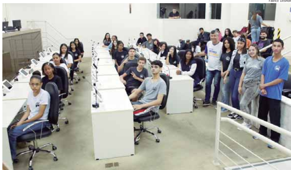
Estudantes participaram do programa Conheça o Legislativo a convite do vereador Pedro Kawai (PSDB)

Durante a visita, os alunos assistiram a palestras que abordaram a formação histórica das câmaras no sistema político brasileiro e a divisão dos poderes da República. Além disso, eles puderam simular a realização de uma reunião ordinária, com o objetivo de entender o trabalho dos vereadores e o funcionamento das atividades legislativas.