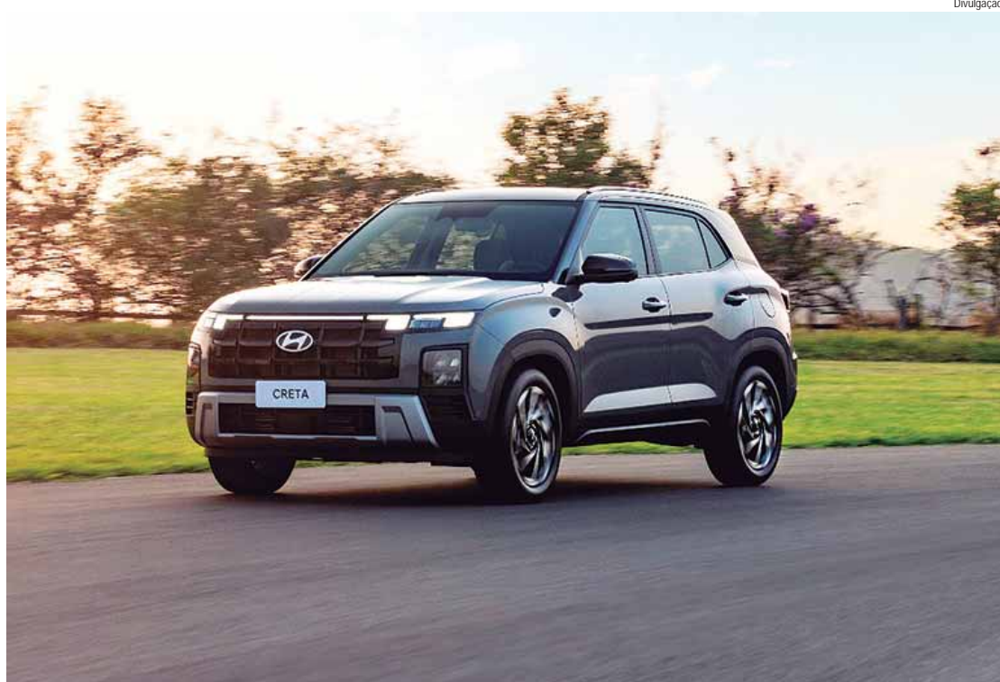
No Brasil, terá garantia padrão da Hyundai, de cinco anos, sem limite de quilometragem

HYUNDAI MOTOR BRASIL/ HYUNDAI MOTOR CENTRAL & SOUTH AMERICAS - A Hyundai Motor Brasil está presente no país desde 2012, quando inaugurou sua fábrica em Piracicaba (SP). Com 3,2 mil colaboradores, é responsável pela fabricação e comercialização da linha de veículos compactos HB20 e do SUV compacto Creta. Recentemente, passou a coordenar desde a importação até a distribuição final do portfólio completo de veículos da marca no Brasil. Também, gerencia a produção nacional de veículos da marca fabricados pelo Grupo CAO em Anápolis (GO). A partir do Brasil, a Hyundai administra as operações comerciais para a região das Américas Central e do Sul, exportando para países vizinhos como Argentina, Colômbia, Paraguai e Uruguai. Para saber mais sobre a Hyundai e seus produtos no Brasil, acesse hyundai.com.br . Acompanhe também o dia a dia da marca nas redes sociais: Facebook ( facebook.com/hyundai-br ), Instagram ( instagram.com/hyundaibr ), LinkedIn ( linkedin.com/company/hyundai-motor-brasil ), TikTok ( tiktok.com/@hyundaibr ) e no YouTube ( youtube.com/hyundaibr ).