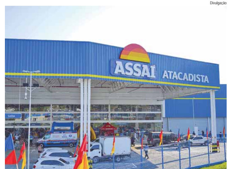
Assaí oferece remuneração e pacote de benefícios compatíveis com o mercado

O Assaí Atacadista, um dos maiores empregadores privados do Brasil, está com cerca de 80 vagas efetivas abertas para contratação imediata para as cidades de Limeira e Piracicaba – atualmente o Assaí conta com lojas em 24 Estados mais o Distrito Federal. Todas as posições são efetivas, inclusivas para pessoas com deficiência e abrangem diferentes áreas operacionais da companhia, entre funções de lideranças, técnicas e operacionais, além de oportunidades para quem quer iniciar o seu primeiro emprego e trilhar carreira no setor de atacado de autosserviço.