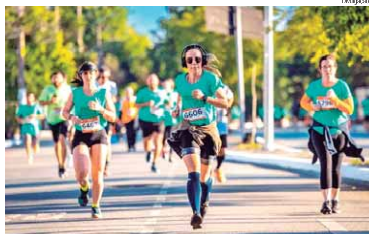
A expectativa é reunir cerca de 1.100 atletas neste domingo

A etapa Shopping Piracicaba do Santander Track&Field Run Series será realizada no próximo domingo, 3. Com percursos de 4 e 8 quilômetros, a expectativa é reunir cerca de 1.100 atletas. As largadas acontecerão às 7 horas para ambos os percursos. No ano em que completa 20 anos, o maior circuito de corrida de rua da América Latina em número de provas reforça a parceria com o mais completo centro de compras e entretenimento da região metropolitana de Piracicaba com a proposta de oferecer serviço e infraestrutura Premium aos competidores.