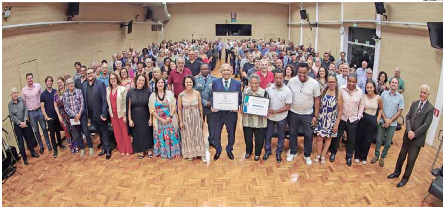
A cerimônia ocorreu na terça-feira (29), no salão nobre Helly de Campos Melges e foi transmitida ao vivo pela TV Câmara e redes sociais

ESTADOS E REGIÕES EM 2024 - Entre as Unidades da Federação, São Paulo teve maior saldo positivo entre janeiro e setembro de 2024, com criação de 561.042 novos postos. Em seguida aparecem Minas Gerais (204.187) e Paraná (152.898).