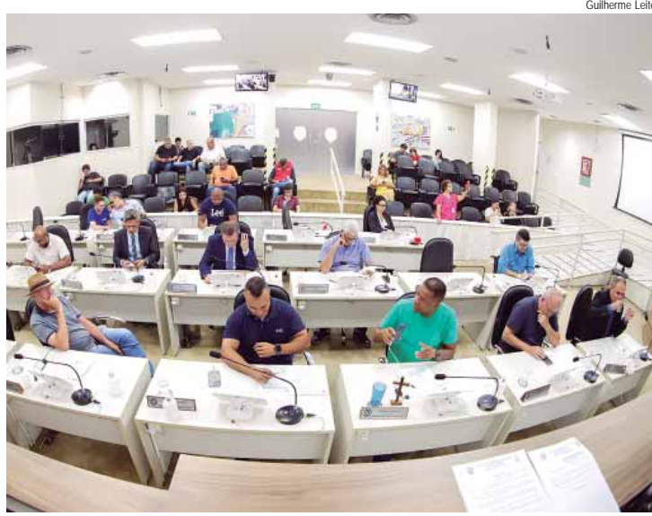
A 65ª Reunião Ordinária de 2024 acontece hoje, a partir das 19h