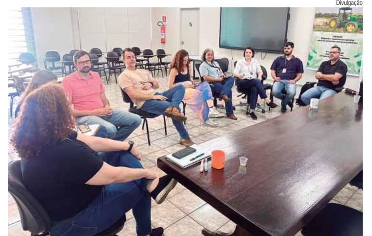
Reunião foi na Sema aconteceu na terça-feira (29)

Na terça-feira (29), a equipe da Sema (Secretaria Municipal de Agricultura e Abastecimento) esteve reunida com as equipes técnicas da Cati (Coordenadoria de Assistência Técnica Integral) e da Coordenadoria de Defesa Agropecuária de Piracicaba (CDA) para discutir os programas em parceria entre as instituições e correlacionar possíveis parcerias e ações conjuntas.