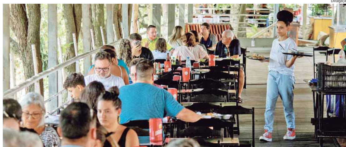
Setor de Serviço foi o que mais gerou vagas de emprego em setembro em Piracicaba

Piracicaba teve um saldo positivo de 647 postos de trabalho formais no mês de setembro, segundo dados divulgados ontem (30), pelo Caged (Cadastro Geral de Empregados e Desempregados) do Ministério do Trabalho. O setor de Serviço lidera a geração de empregos, com saldo positivo de 257 vagas. Desde 2021, Piracicaba gerou 24.211 postos de trabalho formais, segundo o Caged. Outros setores que tiveram saldo positivo em setembro/2024 foram Indústria, com 236 vagas, seguido de Construção, com 122 vagas, Comércio com 77 vagas, e Agropecuária com 45 vagas negativas. Em termos de perfil, entre os 647 novos postos de trabalho em Piracicaba, 229 são mulheres, e 418 homens. Por grau de instrução, a maioria das contratações foi de pessoas com o ensino médio completo, somando 410. A nível federal e estadual, o setor de Serviço lidera com a geração de 128.354 novos empregos no Brasil e 38.020 em São Paulo. A12