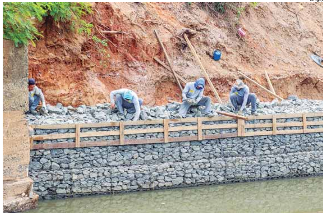
Muro de gabião na saída do Enxofre tem o intuito de conter o desassoreamento da margem e evitar o refluxo das águas do Piracicaba

O projeto de desassoreamento do rio Piracicaba contempla o trecho da saída do Enxofre até a ponte do Mirante (onde o córrego Itapeva deságua). Nesse trecho, ainda serão feitos a re-