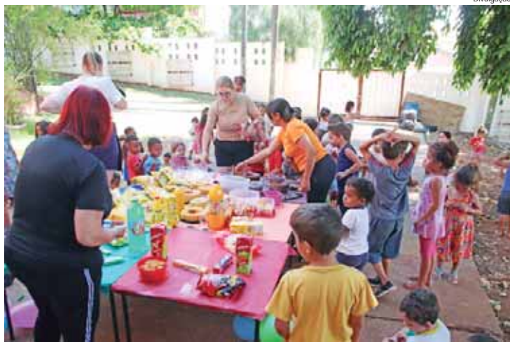
Escolas locais também se engajaram na criação de programações especiais

O mês de outubro contou com uma programação variada de atividades e eventos para crianças e adolescentes de Rio das Pedras. Entre os destaques esteve a tradicional Festa das Crianças, realizada no Estádio Municipal, que ofereceu diversas atrações e reuniu grande público. Outro evento de destaque foi a festa do Bairro Massud Coury, consolidando-se como uma das principais comemorações do mês na cidade.