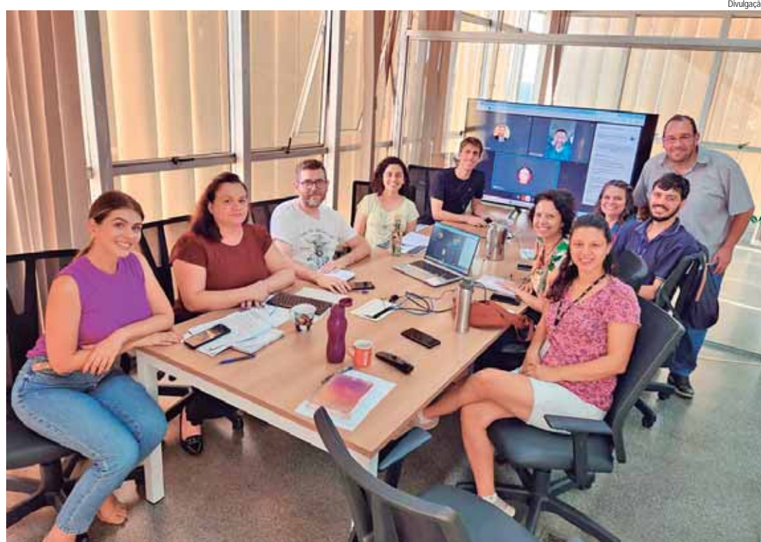
Reunião deu início aos trabalhos para a realização da Conferência Municipal do Meio Ambiente

Mais informações sobre a 5ª Conferência Nacional do Meio Ambiente estão disponíveis no site: https://www.gov.br/mma/pt-br/composicao/gm/5a-CNMA .