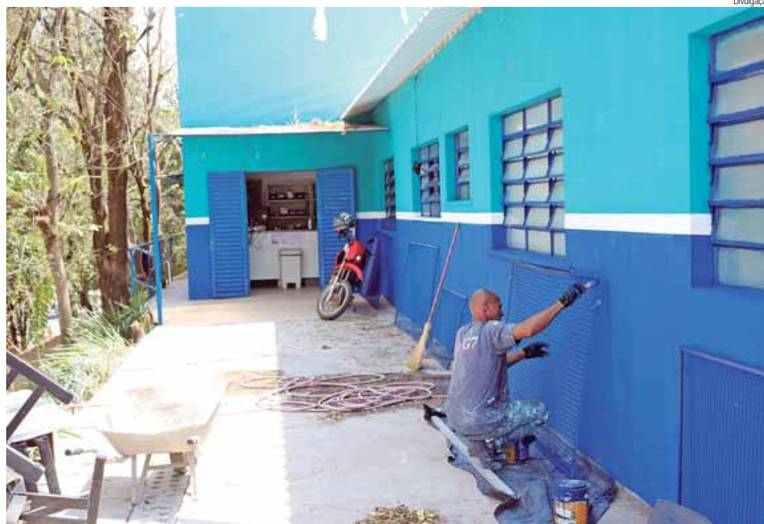
Na Unidade de Saúde da Família (USF) do bairro Tupi as obras estão 70% concluídas

Na USF Tupi as obras estão 70% concluídas. Já foi feita a substituição de todo o telhado por telhas metálicas, nova instalação de sistema de esgoto, sistema de drenagem, muro de divisa no fundo da unidade, embutimento de fiações, revitalização do piso de granilite, pintura interna, calçamento