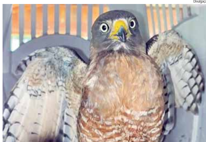
Divulgação Espécies como aves e pequenos mamíferos são as mais afetadas, muitas vezes chegando para atendimento em estado crítico

ORIENTAÇÃO PARA RESGATE - A recomendação tanto da Apass quanto da concessionária para a população é não tentar resgatar animais feridos por conta própria, evitando assim risco de ferimentos para a pessoa e de agravamento da lesão do animal. A orientação caso um animal seja encontrado ferido às margens da rodovia é acionar as autoridades competentes, como a Polícia Militar Ambiental (190), o Corpo de Bombeiros (193) ou a Eixo SP pelo serviço gratuito 0800 170 8998. A concessionária desloca-