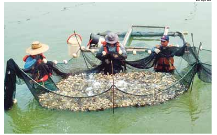
Programa de Manejo Pesqueiro prevê repovoamento anual de 2,5 milhões de alevinos de espécies nativas da região nos rios Tietê, Pardo, Grande e Mogi Guaçu