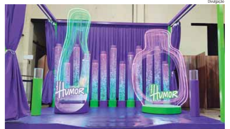
Novo lounge da Natura Humor está instalada no Engenho Central e conta com diversas atividades gratuitas

Desde o fim de semana, o 51º Salão Internacional de Humor de Piracicaba está com mais um parceiro. A rede de perfumarias Natura chega ao evento com diversas ações entre elas a experimentação dos produtos e fragrâncias da linha Humor em um lounge especial e instagramável. As atividades são gratuitas e acontecem aos sábados e domingos até o encerramento do Salão, previsto para novembro.