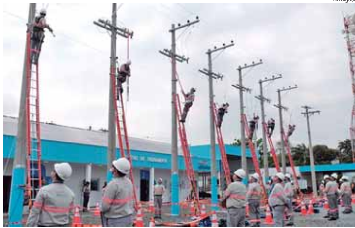
Rodeio de Eletricistas da CPFL Paulista foi realizado em Campinas

PESEPREMIAÇÃO - A competição reuniu 32 eletricistas experientes das diversas cidades atendidas pela distribuidora, que após atenderem aos pré-requisitos e passarem por uma prova teórica, foram clas-