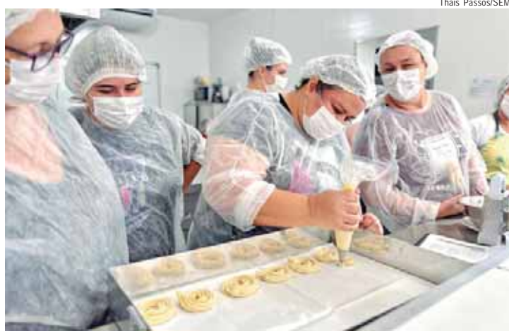
Curso ensinará receitas de biscoitos natalinos

Os interessados devem fazer a inscrição pelo link https://bit.ly/especialdenatal1 ou entrando em contato com a Sema, no telefone (19) 3437-4000. Serão oferecidas 12 vagas e a Sema entrará em contato por telefone com os selecionados.