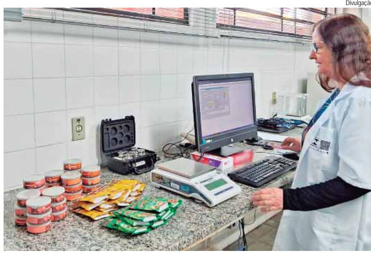
Foram analisados 20 produtos nos laboratórios da capital, e das cidades no interior