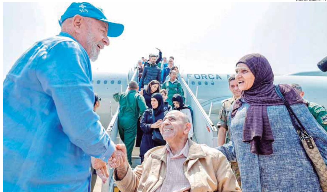
Presidente Lula na recepção aos brasileiros e familiares: mulheres, crianças e idosos tiveram prioridade na primeira lista

Cônsul Geral do Líbano em São Paulo, Rudy El Azzi agradeceu