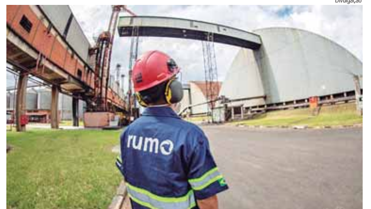
Candidatos podem se candidatar até 30 de outubro para ocupar uma das vagas espalhadas por quatro estados brasileiros

A Rumo, maior operadora ferroviária do Brasil, anuncia o lançamento do Programa de Trainee Rumo ao Futuro - o primeiro da companhia. As inscrições para as vagas com posições em Araraquara, Rio Claro, Itu e Santos foram abertas no último dia 30. Todo o processo de seleção será realizado pela Cia de Talentos, maior consultoria de educação para carreira da América Latina.