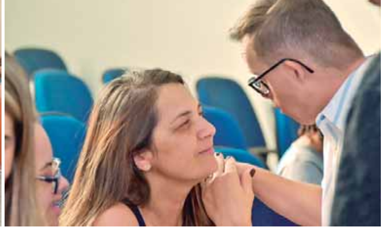
A entidade realizou três eventos com a participação de atendidos, familiares, OSC's e público em geral