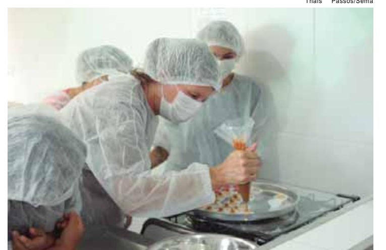
Serão ao todo oito aulas ministradas na Cozinha Experimental

Os interessados devem fazer a inscrição pelo link https://bit.ly/confeitariapref ou entrando em contato com a Sema, no telefone (19) 3437-4000. Serão oferecidas 12 vagas e a Sema entrará em contato por telefone com os selecionados.