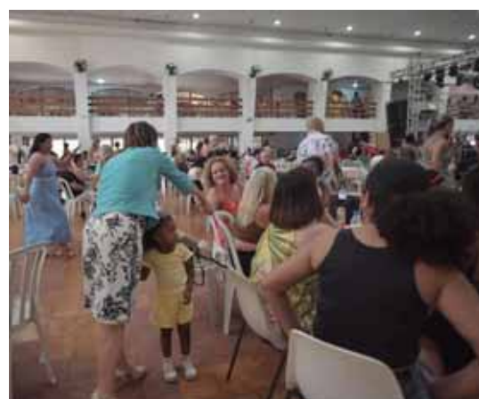
Por onde passa, a candidata Professora Bebel é muito bem recebida