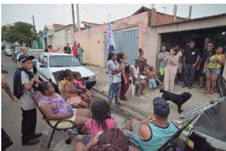
Bebel fala a famílias do seu programa de governo para Piracicaba, em atividade no sábado à tarde