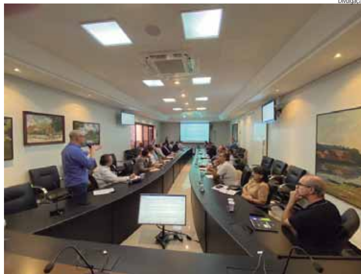
As 17 entidades reuniram as demandas prioritárias da cidade no documento que será entregue aos oito candidatos

No encerramento do Painel, os candidatos receberão um documento elaborado de forma conjunta pelas 17 entidades organizadoras do painel, contendo pedidos, sugestões e reivindicações relevantes para a cidade de Piracicaba. Entre os eixos integrantes deste documento estão Saúde, Turismo, Cooperativismo e Associativismo, Governança na Gestão Pública e Transparência, Empreendedorismo, Cidades Inteligentes, Educação, Desenvolvimento