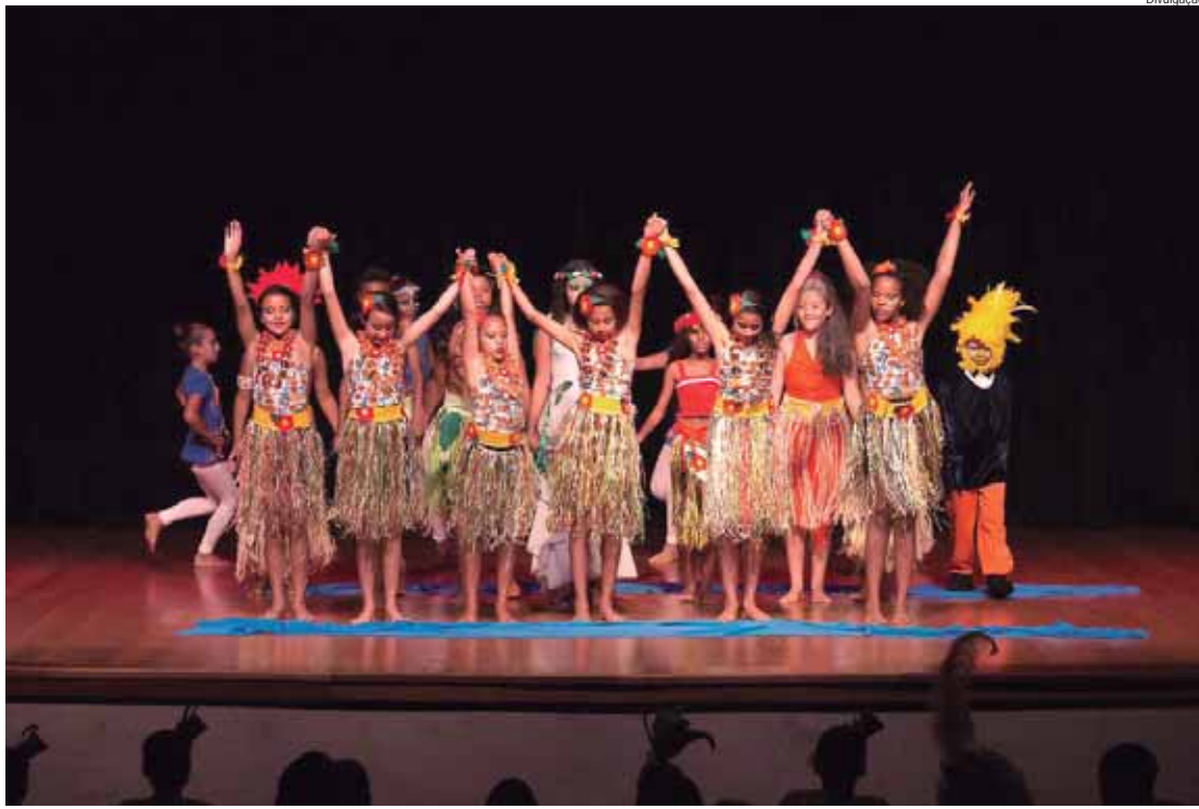
Temática das peças fica a critério dos grupos e com classificação livre; mostra acontece no mês de outubro

Este ano, a mostra ocupará palcos do Teatro Municipal Erotides de Campos, o Teatro Engenho,