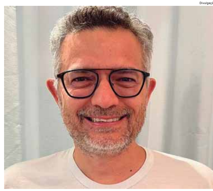
Um dos idealizadores do Vale do Piracicaba conta como o Empretec, do Sebrae-SP, mudou sua visão de carreira