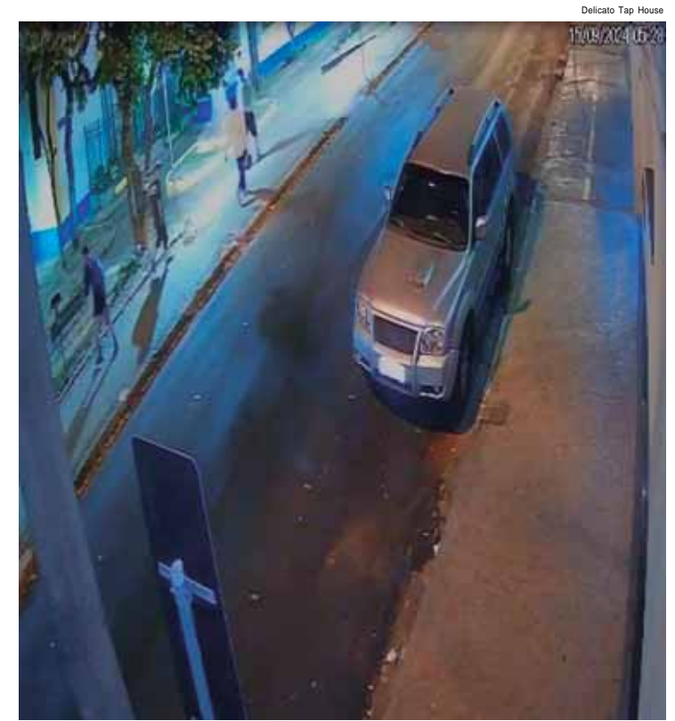
Vândalos destruíram lixeira e derrubaram busto de Prudente de Moraes