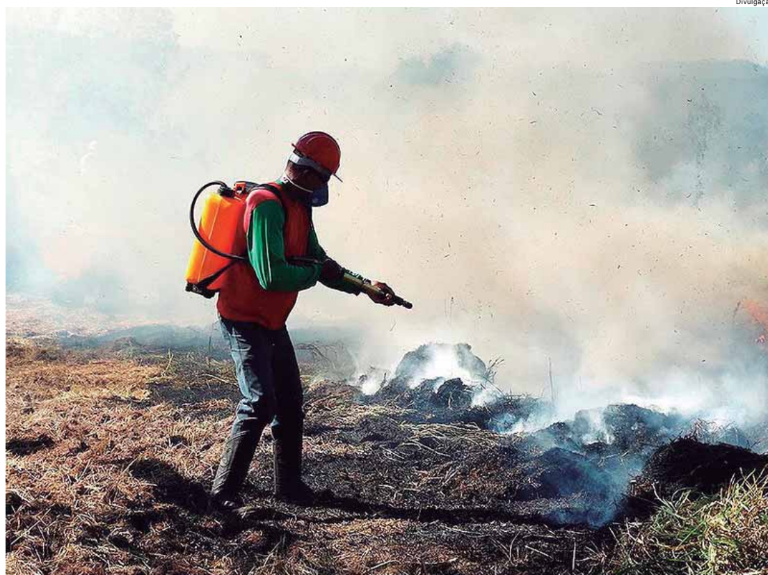
Área queimada nas Unidades de Conservação é de cerca de 700 hectares, o que corresponde a apenas 0,7% da área total protegida de mais de um milhão de hectares

A atual gestão do Governo do Estado adota uma série de medidas, desde o ano passado, com ações transversais e intersecretariais no combate aos incêndios. Em dezembro de 2023, foi lançado o programa São Paulo Sempre Alerta, que investe mais de R$ 1,8 bilhão em ações para minimizar o impacto das mudanças climáticas. Outra iniciativa implantada em