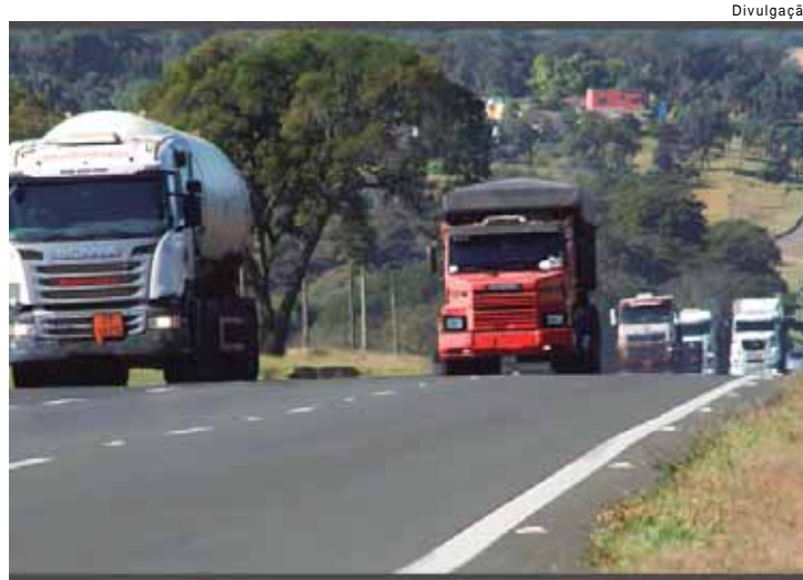
No dia nacional da categoria, concessionária reafirma seu compromisso de investir em soluções que façam diferença no dia a dia dos profissionais

O monitoramento das rodovias por câmeras inteligentes é outra medida que tem se mos-