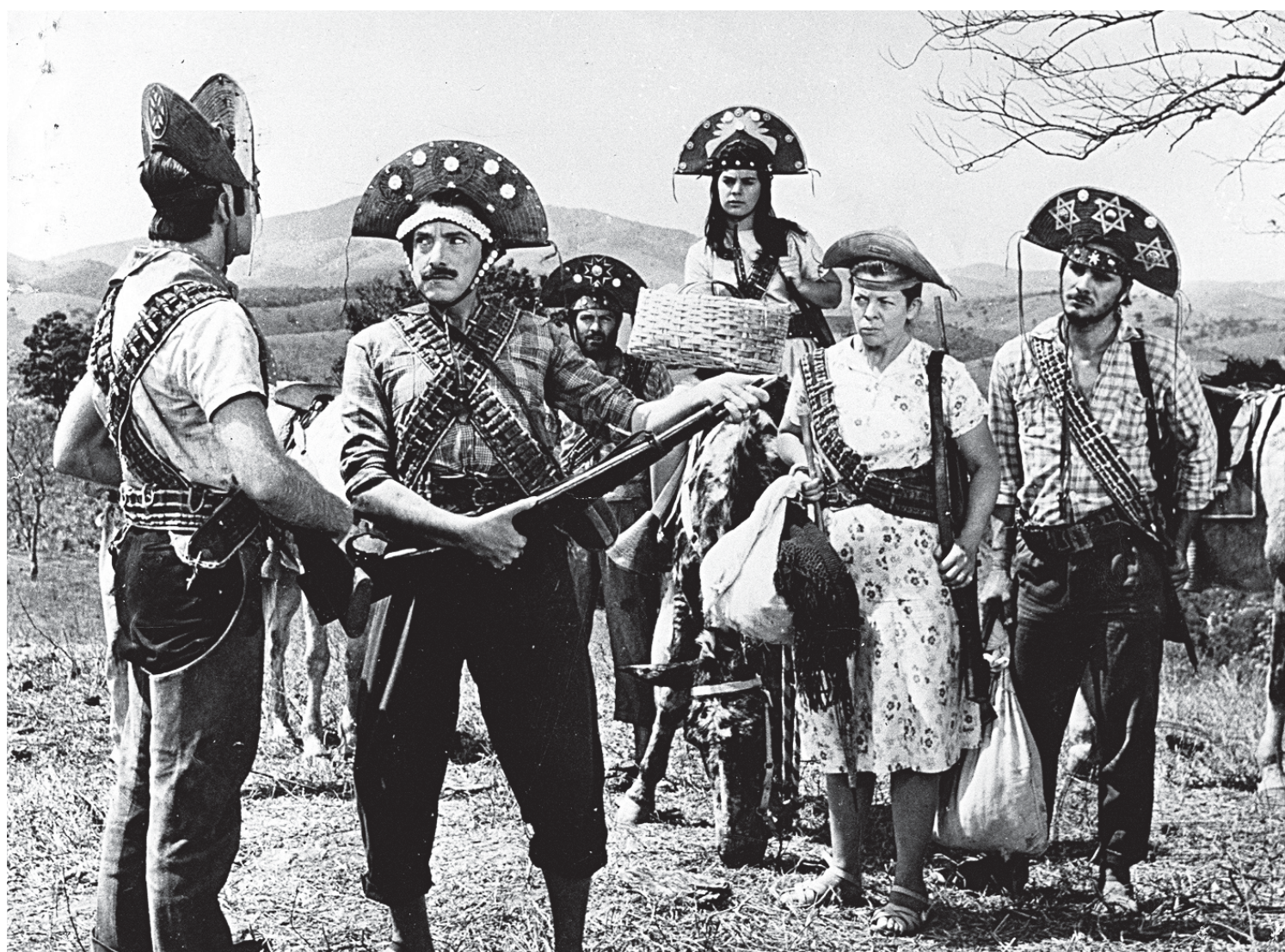
O Lamparina, de 1964, será exibido essa semana no bairro Cecap