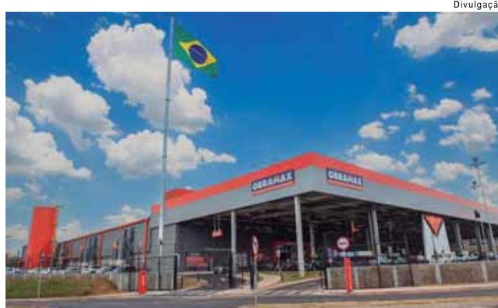
Unidade está com 13 vagas abertas que contemplam pessoas com deficiência

Por fim, a empresa busca também Vendedor Iniciante/Repositor Atendente e Vendedor Iniciante de Elétrica. Para esses cargos é necessário ter o ensino médio completo e conhecimento em Pacote Office. É desejável conhecimento em vendas e negociação, tendências de mercado, demanda e concorrência. Ter um bom relacionamento interpessoal, organização, ser dinâmico e ágil são importantes diferenciais.