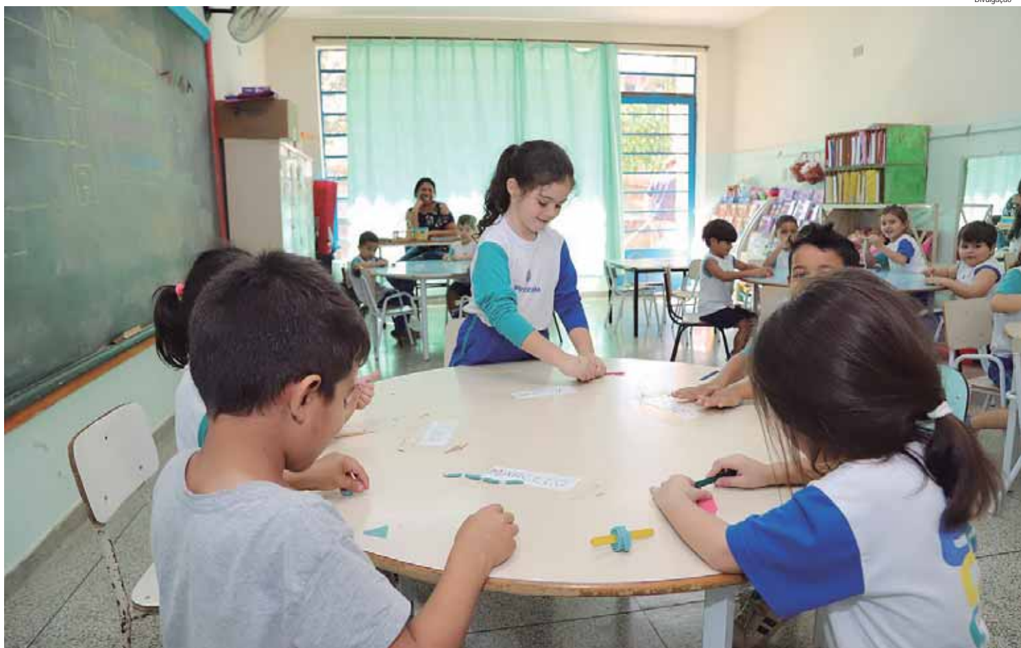
O agendamento será feito apenas para alunos que irão frequentar a Rede Municipal de Educação no próximo ano letivo

Os deputados estaduais Alex Madureira (PL) e Helinho Zanatta (PSD) disputam — e este perdeu — o uso da imagem do governador do Estado, Tarcísio de Freitas (Republicanos), em suas campanhas. A Justiça Eleitoral deixou claro isso, em decisão ontem (16), depois de representação de Madureira.