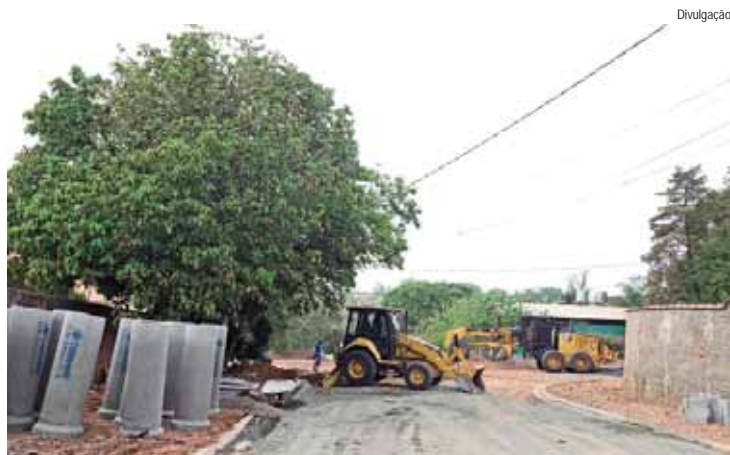
Além do asfalto, via também está recebendo galerias de águas pluviais e calçadas