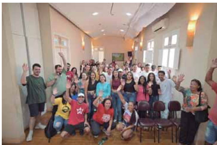
Bebel em encontro com a juventude, no sábado pela manhã