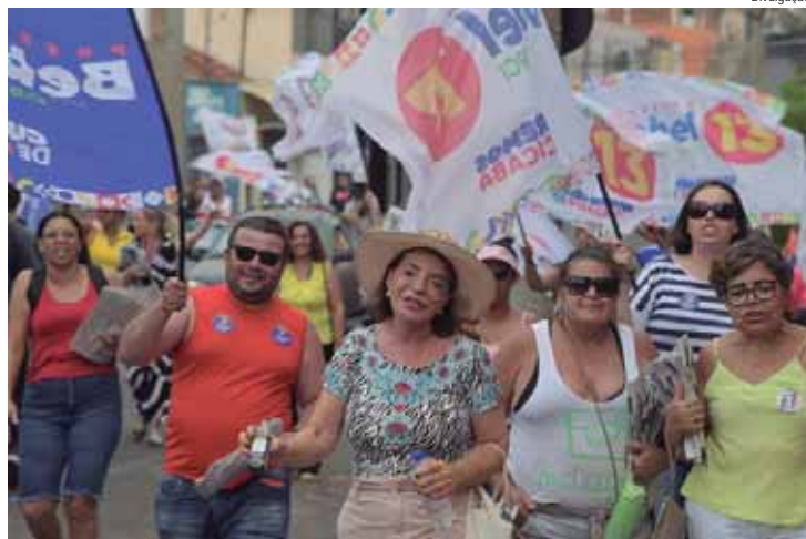
Bebel com apoiadores, em caminhada no domingo