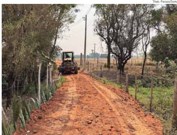
Motoniveladora da Sema faz aplicação de pedregulho em estrada de Anhumas