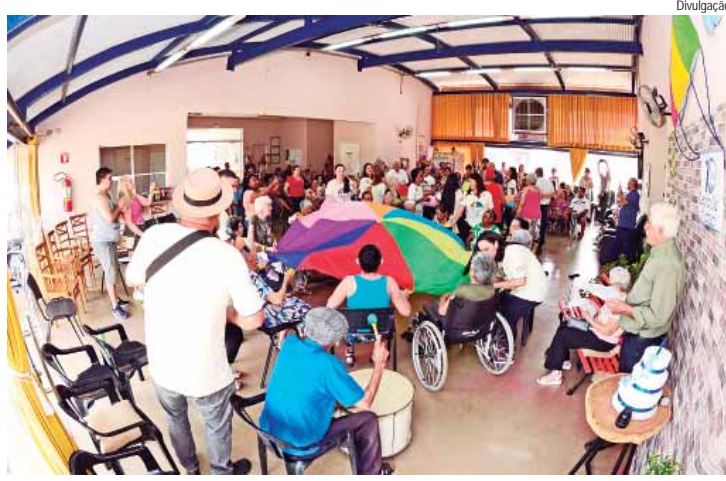
A solenidade contou com a participação de profissionais, familiares e amigos dos idosos atendidos