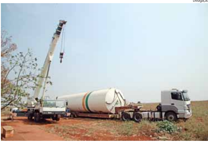
A nova caixa d'água foi colocada ao lado do poço artesiano e de outra caixa de menor porte já existente no bairro