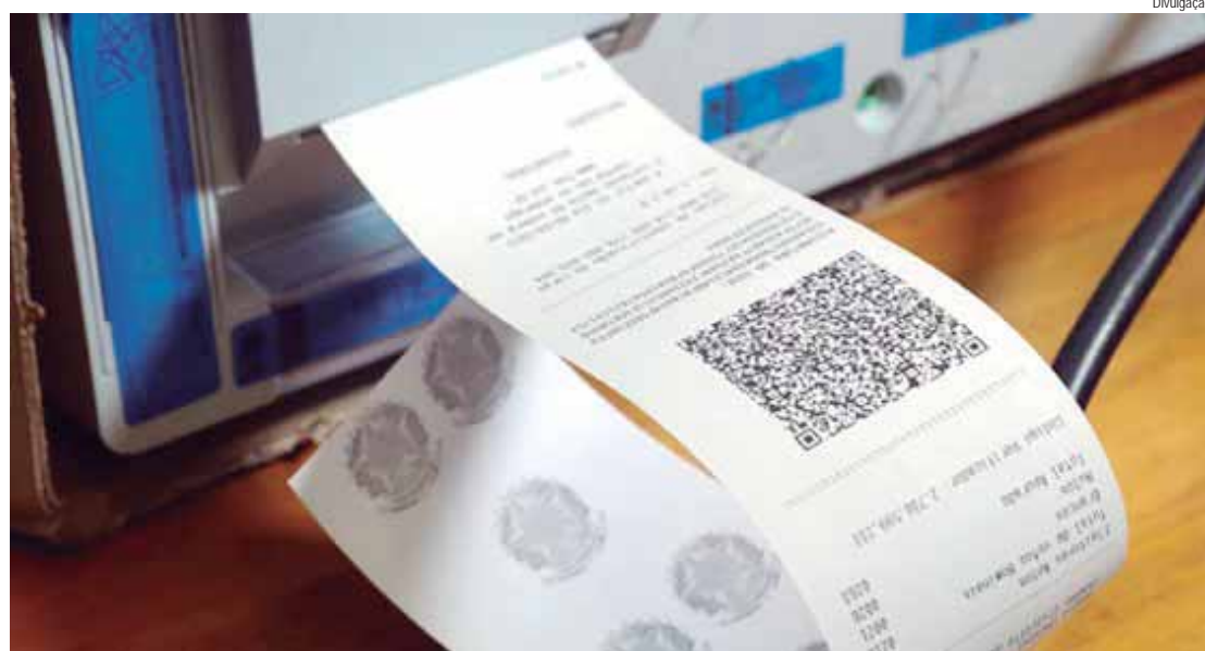
Os boletins de urna podem ser utilizados para a contagem manual