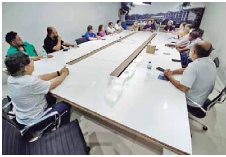
No encontro, os dirigentes sindicais do Instituto Sindical apresentaram os motivos pelos quais os trabalhadores decidiram elaborar uma carta de reivindicações