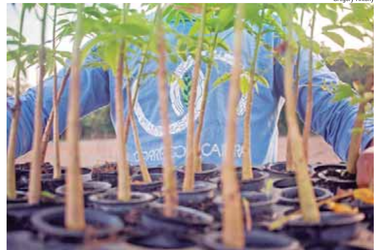
Iniciativa desenvolveu propostas para a recuperação de áreas degradadas na região

Para especialistas do projeto, é fundamental considerar políticas públicas voltadas à mitigação e adaptação às mudanças climáticas; as práticas de transição para uma agricultura sustentável e agroecológica; e a dinamização do fluxo entre a cidade e o campo, de