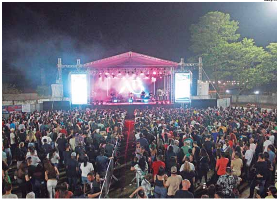
Um dos destaques da feira são os shows gratuitos, que atraem visitantes não só de Rio das Pedras, mas também de diversas cidades da região

A Feira Industrial e Comercial de Rio das Pedras (FIACOM), que teve início nos anos 1980, registrou recorde de público em sua edição mais recente. O evento, tradicional na cidade, oferece oportunidades para empresas locais exporem seus produtos e serviços, além de permitir que comerciantes vendam alimentos, bebidas, brinquedos e outros itens, contribuindo para a geração de empregos e movimentação da economia local.