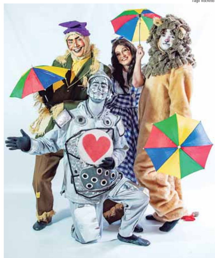
Companhia de Teatro Encanto apresenta o teatro infantil O Mágico de Oz

Uma livre adaptação voltada ao público infantil de O Mágico de Oz será apresentada pela Companhia de Teatro Encanto, neste sábado, 14, em dois horários: às 14 e às 16 horas, no anfiteatro da Biblioteca Municipal Ricardo Ferraz de Arruda Pinto. A entrada é gratuita.