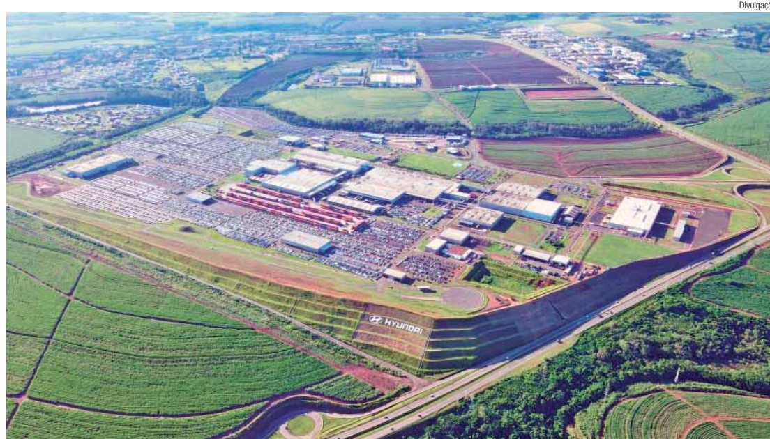
Sede da Hyundai Motor Brasil, em Piracicaba

"A Hyundai, com o firme propósito de criar um mundo melhor e mais íntegro para todos, está fortemente comprometida com sua Governança Corporativa e com seu Programa de Compliance, e espera o mesmo de seus parceiros comerciais e cadeia de fornecedores. Neste sentido, entendemos que a ética e o compliance são determinantes para direcionar nossas operações, criando, de maneira sustentável, um mundo melhor para as futuras gerações. Assim, temos o orgulho de anunciar mais um passo importante em prol da ética e integridade no ambiente de negócios, que é a adesão ao Pacto Empresarial pela Integridade e Contra a Corrupção do Instituto Ethos, assim reafirmamos nosso compromisso com o nosso Programa de Compliance e com a transparência nos negócios junto aos nossos clientes, colaboradores e parceiros