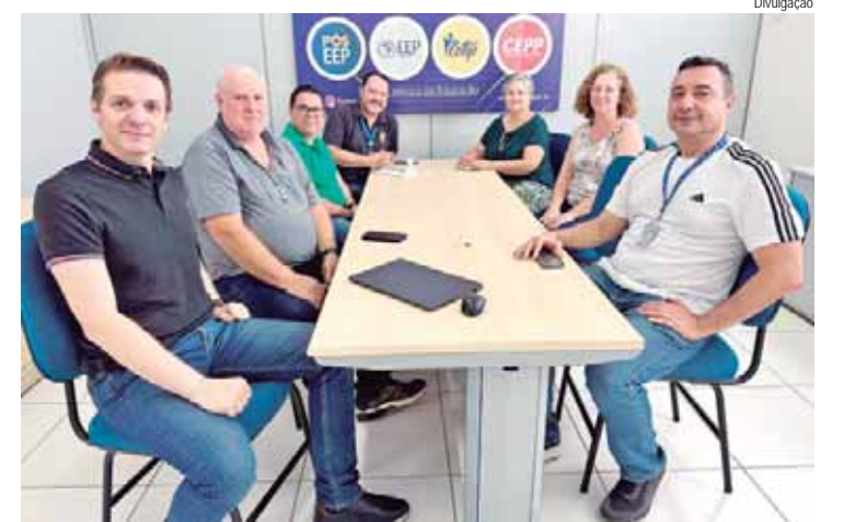
A comissão vai se reunir quinzenalmente; objetivo é iniciar as discussões sobre as estratégias de ocupação de vagas para os cursos de graduação

PROCESSO SELETIVO - O processo seletivo acontece por meio de análise de histórico do Ensino Médio. A EEP oferece oito