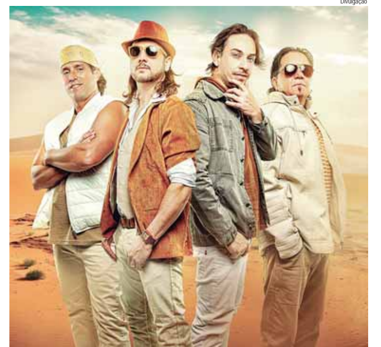
Falamansa se apresenta no domingo do dia 15 no Encontro

12º Encontro Nordestino de Piracicaba no Grande Pátio do Engenho Central, nos dias 13, 14, 15, 20, 21 e 22/09. Às sextas-feiras (13 e 20/09), das 18h às 22h; aos sábados (14 e 21/09), das 11h às 22h, e aos domingos (15 e 22/09), das 11h às 21h. Na avenida Dr. Maurice Allain, 454. Entrada gratuita. Informações: (19) 3403-2600 e (19) 9 5331-9000.