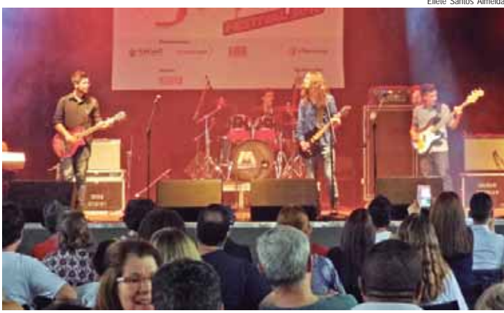
Programação do 24º Som Maior teve início no dia 6 e segue com atividades até novembro