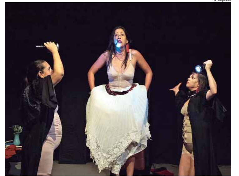
Desaparecidas é um projeto da Cia. Efêmera de Teatro de Piracicaba

Após apresentarem falarem das suas diversas propostas para governarem Piracicaba, tanto Bebel como o candidato a vice de Alex Madureira, se comprometeram a governar ouvindo os trabalhadores, através do Instituto Sindical, que tem uma história de mais de 40 anos em defesa da cidade e dos direitos dos trabalhadores.