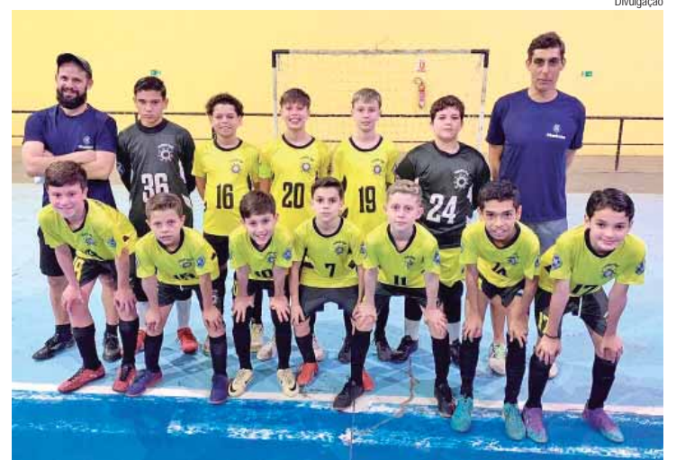
A equipe de futsal sub-12 do Programa Desporto de Base disputa a 41ª Copa Campinas

A presidente ainda reforça que, a falta de uma política de progressão na carreira da Polícia Civil, com critérios objetivos e transparentes, também desmotiva e leva às baixas na instituição. “Como já falado anteriormente, a evasão continua faz com que os policiais civis que estão em atividade sejam submetidos a uma alta sobrecarga de trabalho, o que também leva ao adoecimento de muitos profissionais”.