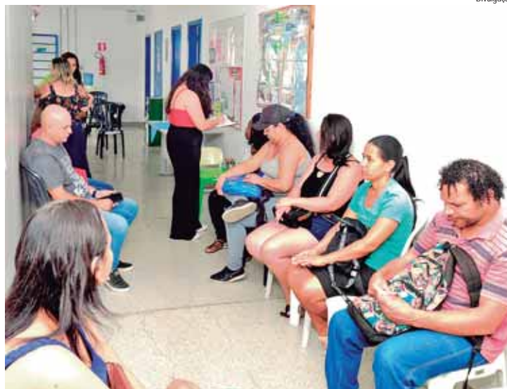
Candidatos às vagas de emprego, aguardam passar por entrevista no Cras Vila Sônia

Os Cras são considerados a porta de entrada da Assistência Social. Essas unidades públicas oferecem serviços, programas e benefícios para as famílias e pessoas em situação de vulnerabilidade e risco social e execução do Serviço de Proteção e Atendimento Integral à Família (PAIF). As famílias acompanhadas participam de