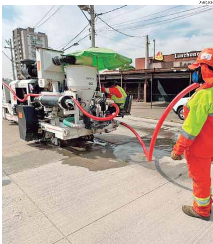
Máquina que realiza a remoção de ondulações no pavimento em concreto é de origem americana - qualidade no serviço

O Pavimento Urbano em Concreto tem alta durabilidade, com garantia de no mínimo 20 anos, contra danos causados pelos impactos no pavimento, tornando-se uma alternativa durável, com vida útil prolongada, econômica e eficiente.