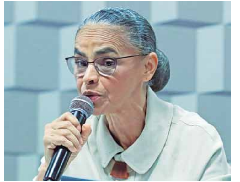
Ministra Marina Silva fala na CMA do Senado sobre queimadas no Brasil

Segundo ela, o governo tem se preparado para essa situação