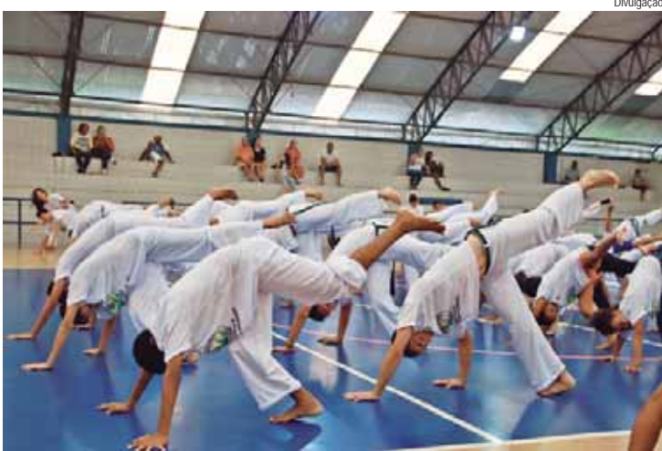
A programação começa às 9h, com uma "Berimbalada"