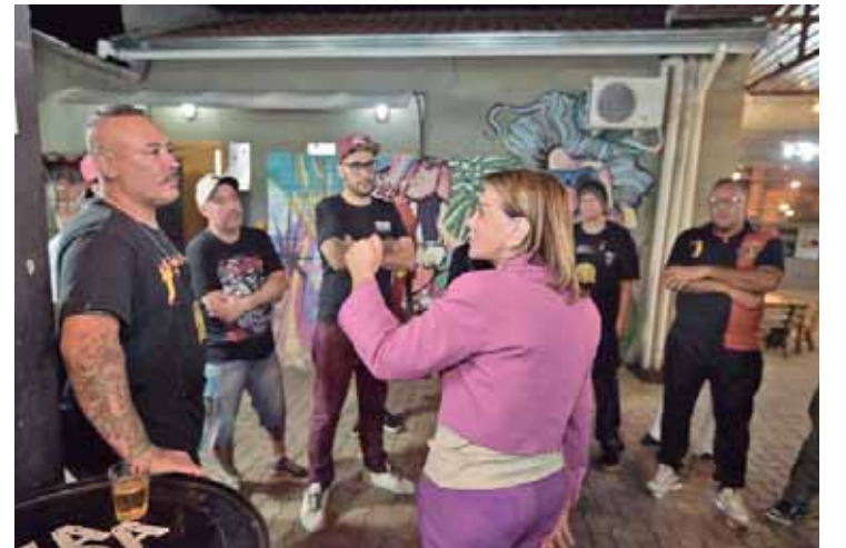
Bebel conhecendo conheci a Ambient Skate Shop, administrada pelo Japa, que ministra aulas de skate para crianças e adultos