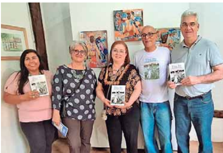
Representantes da Academia Piracicabana de Letras e dos grupos literários Clip e Golp