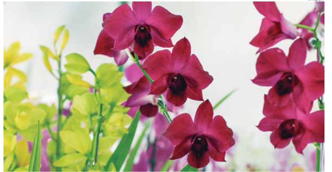
Evento gratuito reunirá 10 mil plantas, incluindo espécies exóticas, e contará ainda com palestras, praça de alimentação e shows culturais

Além da exposição e possibilidade de aquisição das flores ornamentais, cactos e suculentas a preços acessíveis, os visitantes encontrarão ainda palestras sobre cultivo, shows culturais e acessórios para jardinagem à venda, entre substratos especiais, vasos, insumos, cachepôs, adubos, fertilizantes, entre outros, em meio a uma feira de artesanato e praça de alimentação que também acompanham o