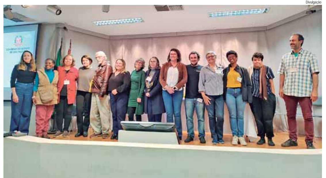
Evento contou com a participação de representantes de diversos municípios do estado de São Paulo

O evento contou com a participação de representantes de diversos municípios do estado de São Paulo no qual foram compartilhadas experiências,