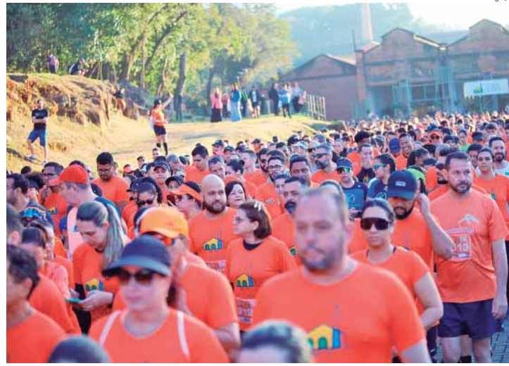
3ª Corrida ESG levou mais de 7 mil pessoas às ruas no domingo

O Pet Day ESG faz parte de uma série de eventos promovidos pela Expo ESG com objetivo de promover práticas responsáveis e conscientes tanto no ambiente corporativo quanto na comunidade, reforçando ações de sustentabilidade e responsabilidade social.