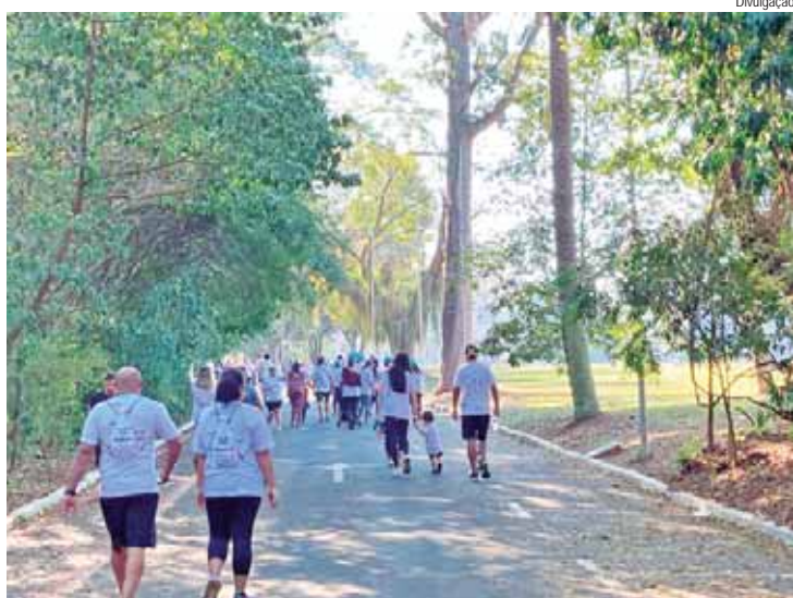
Caminhada Dourada aconteceu no último domingo (4), na Esalq