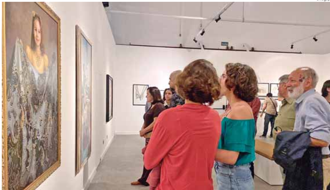
Público poderá visitar o 69 SBA até seis de outubro