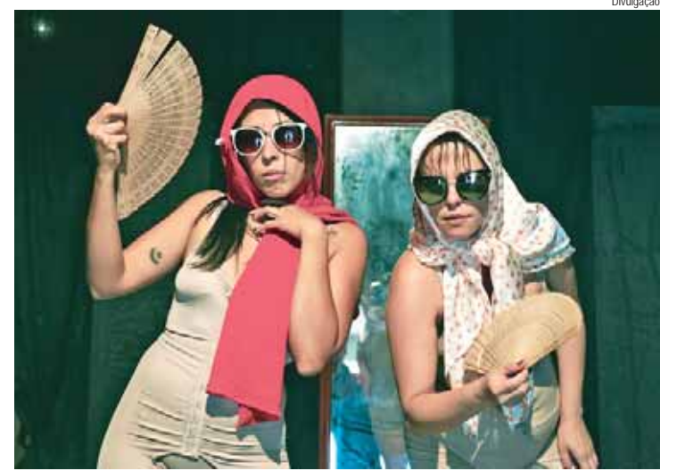
Tradicional mostra de teatro, realizada pela Ação Cultural, acontece no mês de novembro

vos da região, com distâncias de 5,5k e 10k, com a largada do Parque Engenho Central. Reforçando o caráter social do ESG do evento, todo o valor das inscrições foi destinado a instituições.