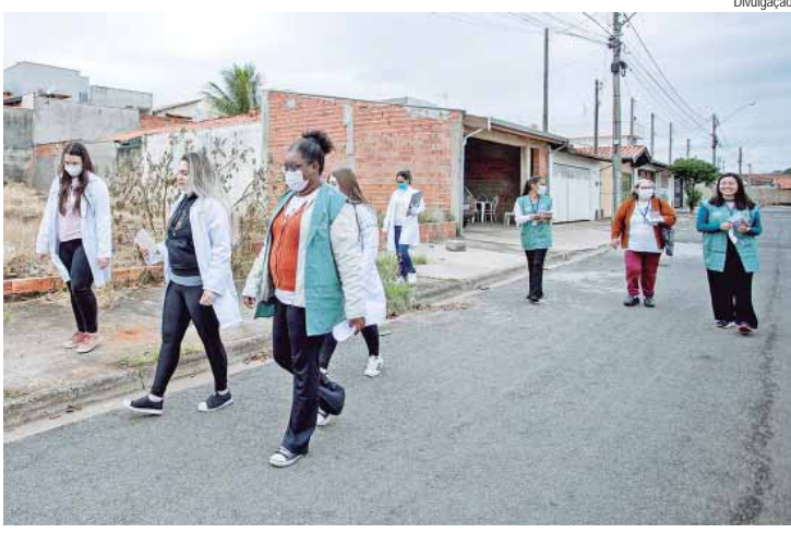
Equipes da Atenção Básica passarão casa a casa na área de abrangência das 74 unidades de saúde