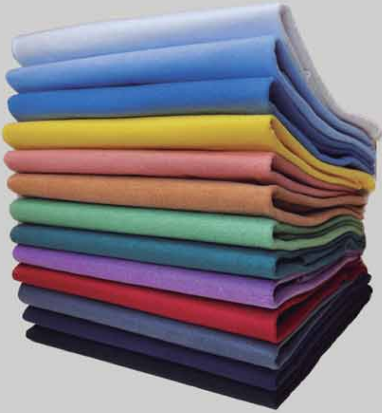
CAMISETA MASCULINA 100% ALGODÃO