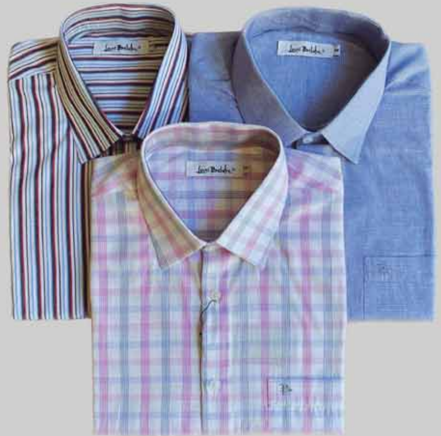
CAMISA MANGA CURTA EASY COTTON

1 a R$ 169,90 2 a R$ 159,90 3 a R$ 149,90