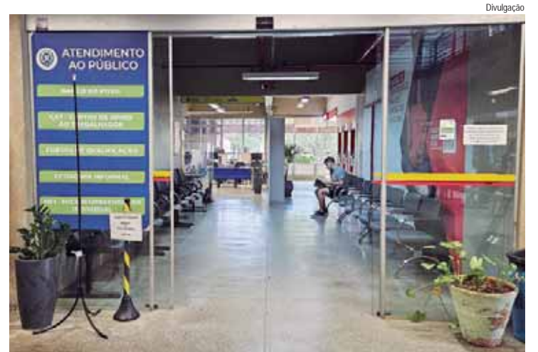
Banco do Povo estará fechado para treinamento amanhã (7)

O Banco do Povo de Piracicaba, setor da Secretaria de Desenvolvimento Econômico, Trabalho e Turismo (Semdettur), estará fechado amanhã (7). Buscando a melhoria no atendimento aos trabalhadores e empregadores de Piracicaba, o expediente será suspenso para treinamento dos servidores, voltando ao normal no dia seguinte, dia 8.