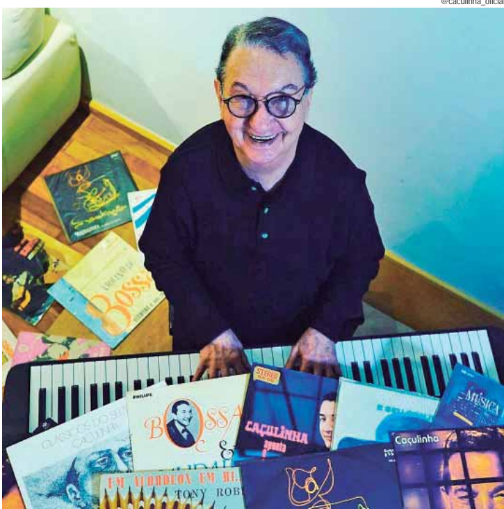
O apelido "Caçulinha" é uma referência ao início de sua trajetória na música