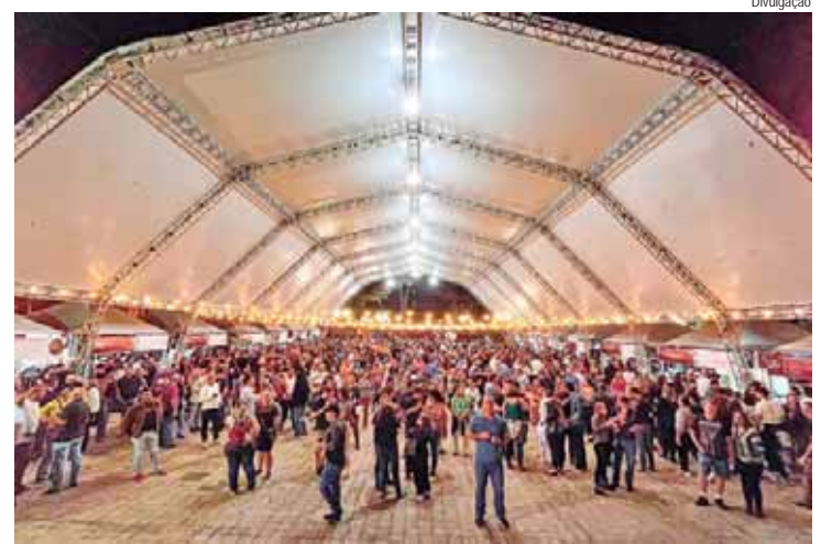
Comida na Rua teve público de 12 mil pessoas

69º Salão de Belas Artes de Piracicaba na Nova Pinacoteca Municipal Miguel Dutra, no Armazém 14A do Engenho Central. Acesso pela passarela Pênsil. Visitações de terça-feira a domingo, além de feriados, das 9h às 17h, até 6/10. Entrada gratuita. Informações: 3403-2600.