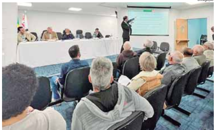
Em reunião, Associação dos Delegados de Polícia do Estado de São Paulo intensificou os esforços para defender as prerrogativas da Polícia Civil

"Temos desafios gigantes, com dispositivos em vigor que não estão sendo aplicados e direitos