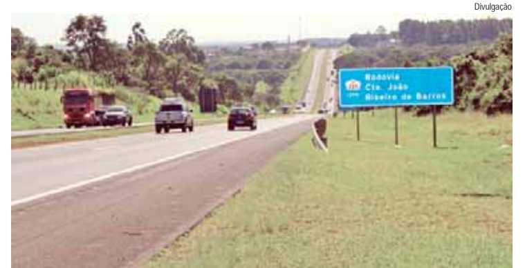
Equipamentos instalados em Bauru, Pederneiras e São Pedro começam a funcionar na próxima sexta-feira

A partir da próxima sexta-feira (9), três novos radares entrarão em operação no trecho administrado pela concessionária Eixo SP. Serão dois equipamentos na SP 225 - Rodovia Comandante João Ribeiro de Barros, na altura de Pederneiras e outro em Bauru. E um equipamento na SP 304 - Rodovia Geraldo de Barros, em São Pedro. Veja abaixo a localização de cada um dos novos aparelhos e as velocidades máximas permitidas nesses pontos.