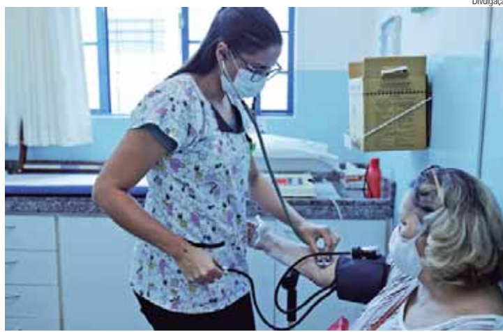
Vagas para áreas de enfermagem estão incluídas em novo concurso público da Prefeitura de Piracicaba

Os candidatos devem ficar atentos às convocações, cujas informações serão divulgadas no