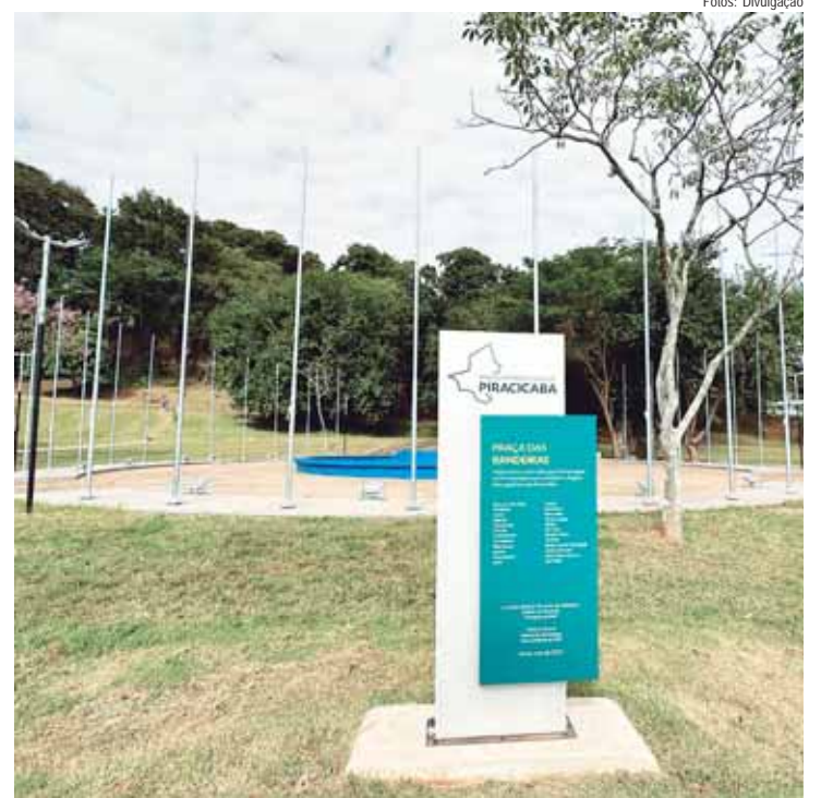
Monumento a ser inaugurado será um marco especial dos 150 anos dos italianos