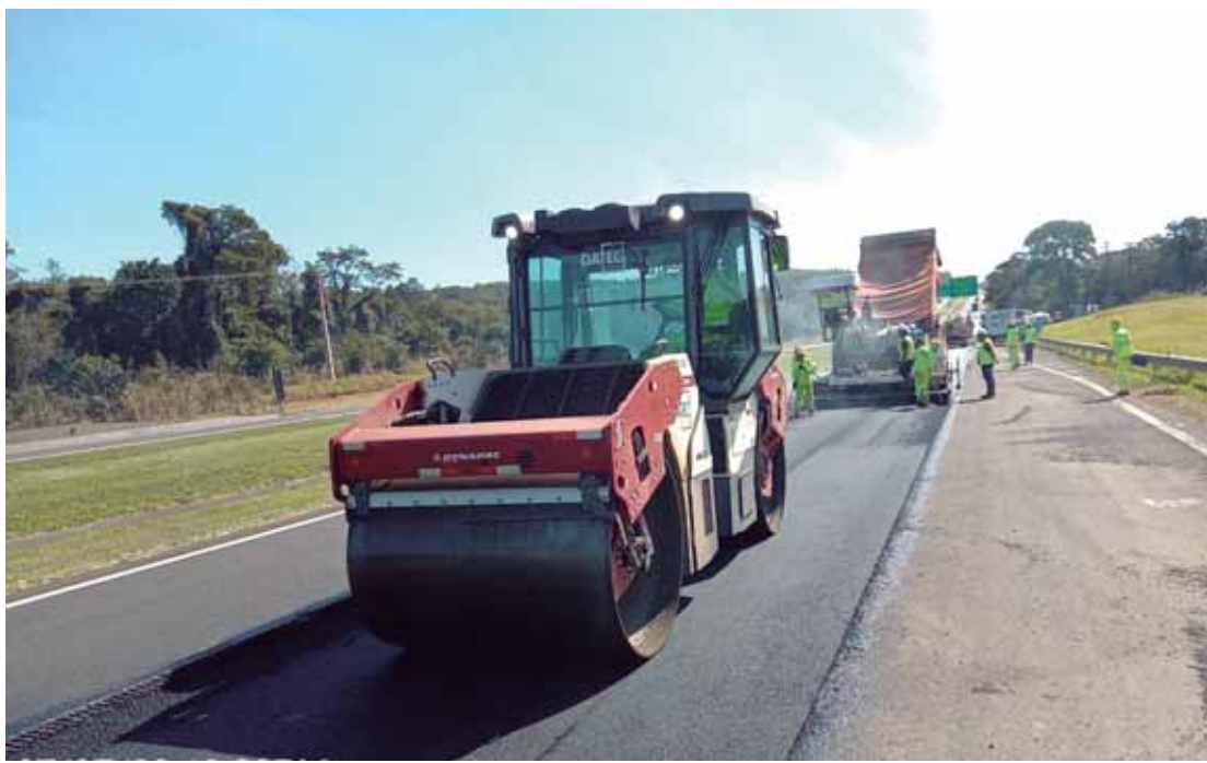
Equipes atuarão nos próximos dias em trechos da Rodovia Washington Luís em Corumbatai, Rio Claro e Cordeirópolis

Outra equipe iniciou os trabalhos nesta segunda-feira (29) no trecho que compreende o km 190 e o km 192, na pista sentido Interior, em Corumbatai. Neste caso, a interdição ocorrerá somente no período diurno, com início às 7h e liberação da via às 17h. De acordo com o cronograma, a obra deve seguir até o dia 5 de maio.