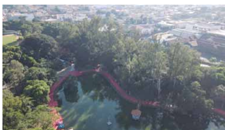
Reformado e com melhorias na infraestrutura, além de revitalização

longo da pista de caminhada, novo deck de madeira, piso intertravado na entrada e saída do parque, reforma do playground e a instalação de três bombas d'água para oxigenação da água do lago. Com a reabertura, o parque vai funcionar diariamente das 6h às 22h.