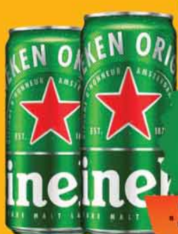
Cerveja Heineken LT Pure Malt 269ML