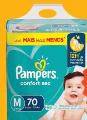
Fralda Pampers Conf. Sec Fortbag M-70/G-60/XG- 54/XXG-52/XXXG-44