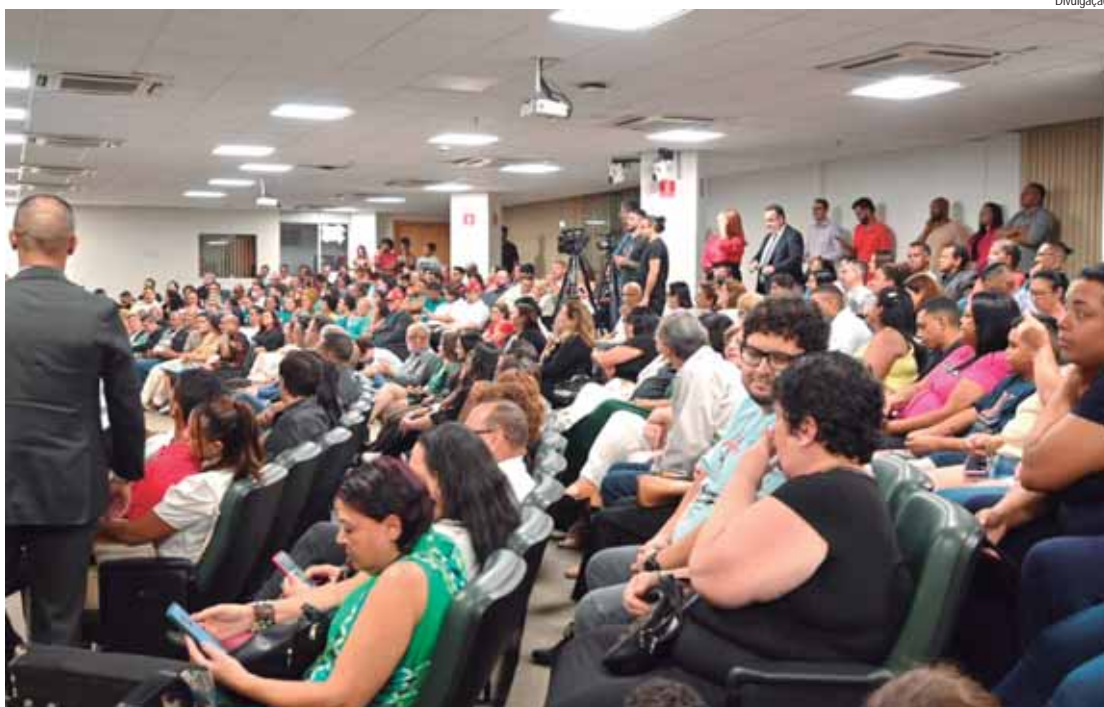
A solenidade de entrega do prêmio foi amplamente prestigiada por lideranças políticas e sociais

Atualmente, na Assembleia Legislativa, já apresentou mais de 170 proposições, entre projetos de lei, projetos de lei complementar, além de requerimentos, indicações e moções, visando sempre melhorar a vida da população do Estado de São Paulo e de Piracicaba, além de fazer forte embate com o governo estadual em defesa da mulher, dos idosos, da juventude, da população LGBTQIa+, da educação pública de qualidade e dos serviços públicos. Atualmente, preside a Comissão de Educação e Cultura da Assembleia Legislativa do Estado