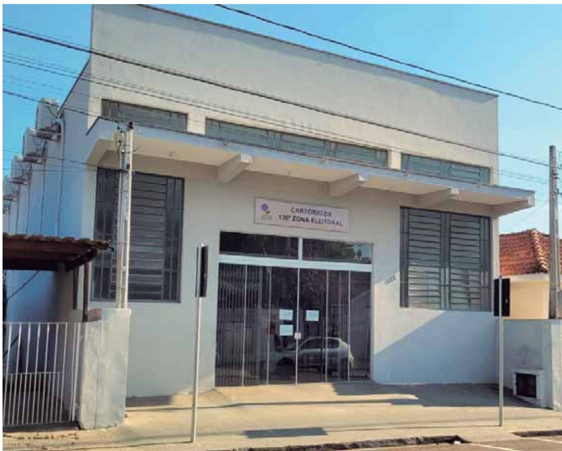
Nos dias 6, 7 e 8 de maio, das 9h às 17h, o atendimento no Cartório Eleitoral de São Pedro será feito por ordem de chegada, sem agendamento

Ainda segundo o TSE, mesmo que o eleitor que não tenha a bio-