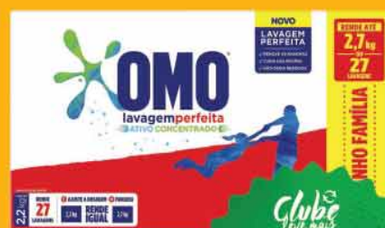
Lava Roupas em Pó Omo 2,2Kg (Proteção Antiodor/ Puro Cuidado)