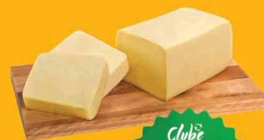
Queijo Muçarela Trad PC KG