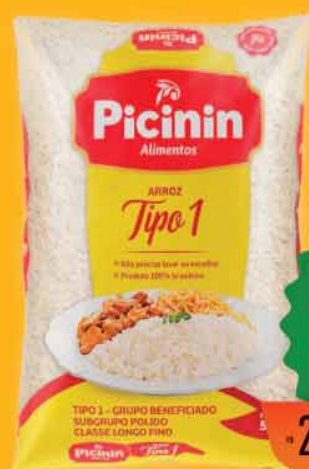
Arroz Tipo 1 Picinin 5Kg

CAMPANHA VÁLIDA SOMENTE PARA 3/5/2024 E 4/5/2024.