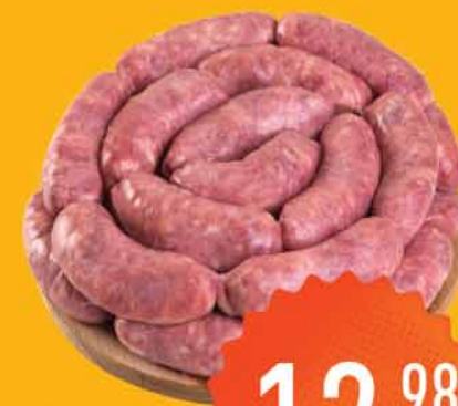
Ling Toscana Leve Mais KG