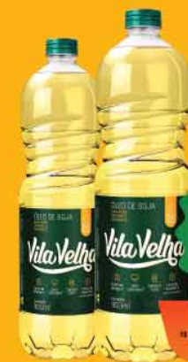
Óleo de Soja Vila Velha 900ml