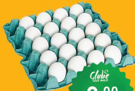
Ovos Brancos C/20 Extra PVC