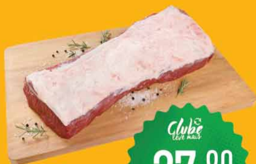
Contra Filé Bovino Peça Inteira* / Vácuo / Kg