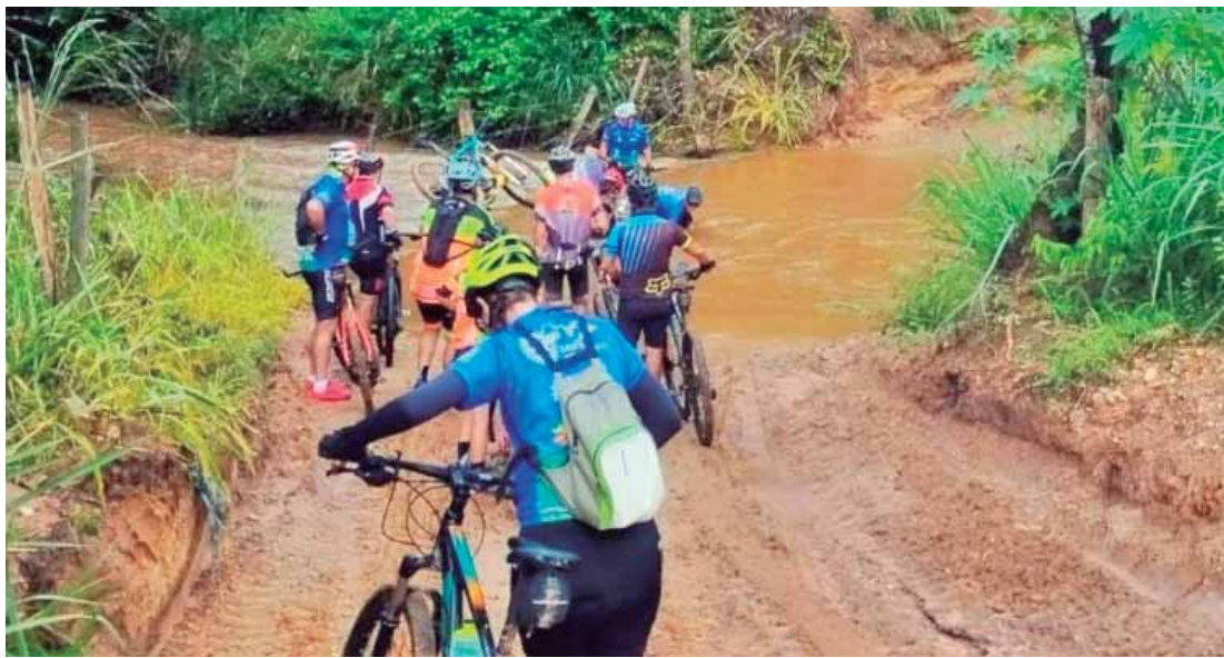
Trajetos em meio à zona rural e urbana são pensados especialmente para os ciclistas, dos iniciantes aos mais experientes

lado Ciclorrota, um percurso dentro da cidade que oferece maior imersão cultural na estância. "É uma rota tranquila que passa pelos principais parques, pontos turísticos, pela Praça Matriz e que pode ser feita até mesmo por adolescentes", comenta a guia de turismo.