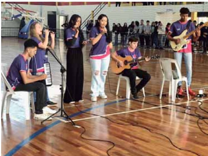
Show de Talentos Jogos Escolares em 2023