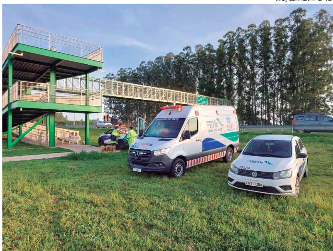
Café na passarela realizado em Lençóis Paulista, na Rodovia Marechal Rondon

O Maio Amarelo da Rodovias do Tietê ainda contará com a primeira edição da Via Segura, que acontecerá no dia 22, em Lençóis Paulista, onde serão oferecidos gratuitamente uma série de serviços gratuitos aos usuários que passarem pelo local. Por fim, uma ação chamada Acorda Motorista alertará os caminhoneiros que utilizam as rodovias durante as madrugadas.