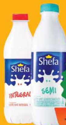
Leite UHT Shefa Int. Pet 1L