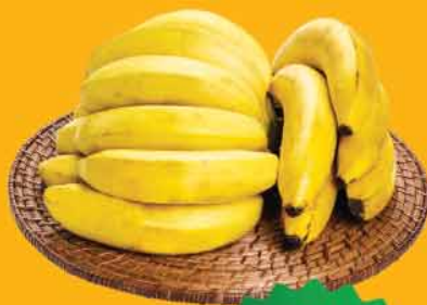
Banana Nanica • Granel/ Kg