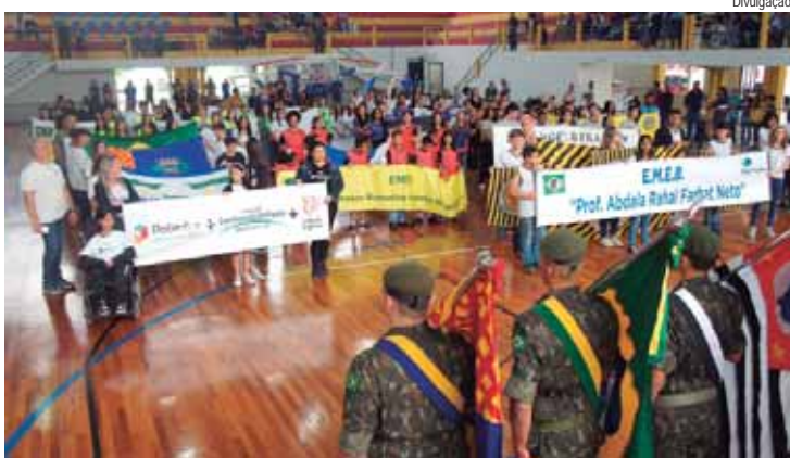
Jogos Escolares de São Pedro em 2023

A competição será dividida por categorias: C (alunos a partir de 2014, nos anos iniciais do ensino fundamental) e B (alunos a partir de 2009, nos anos finais do ensino fundamental). Os jogos da categoria C acontecerão entre os dias 13 e 24 de maio. Na categoria B, a competição ocorrerá no mês de agosto.