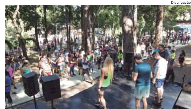
Com a reabertura, o parque vai funcionar diariamente das 6h às 22h

O JORNAL CERTIFICA AS PUBLICAÇÕES LEGAIS COM PONTUALIDADE E TRANSPARÊNCIA, GARANTINDO A SEGURANÇA JURÍDICA. AFINAL, O JORNAL É LEGAL.