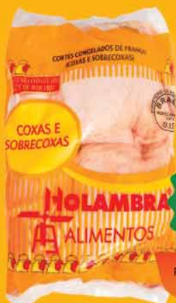
Coxa C/ Sobrecoxa Cong. Pct/ Kg