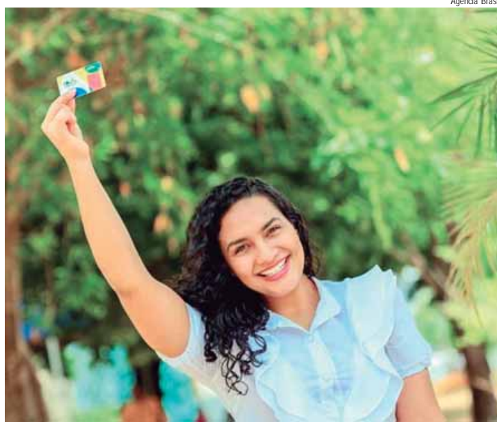
Agência Brasil Protagonismo: em abril, 83,5% das responsáveis pelas famílias no programa são mulheres, realidade comum a 17,4 milhões de famílias beneficiárias - Foto: Divulgação / MDS