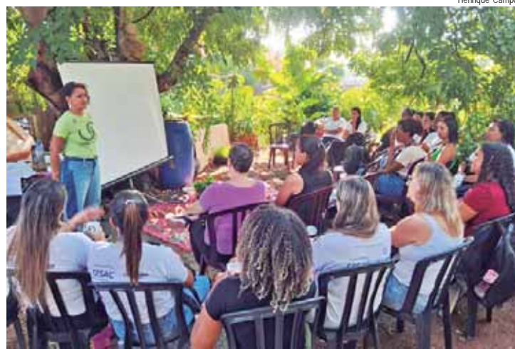
Corredor Caipira realiza e participa de ações educativas

EDUCAÇÃO, POLÍTICAS PÚBLICAS E COMUNICACÃO - Na área de educação, a iniciativa realizará diferentes ações. Serão seis cursos de formação, 32 atividades de forma-