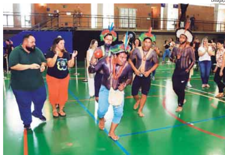
O segundo dia de atividades contou com intervenção dos indígenas da Reserva Guarani Rio Silveiras, localizada na cidade de Bertiooga (SP)

SMB - Pela lei municipal 8.903/2018, a Semana do Brincar faz parte do Calendário Oficial de Eventos Cívicos de Piracicaba. O objetivo é desenvolver ações gratuitas, promovendo atividades sobre o tema para os alunos da Rede Municipal de Educação.