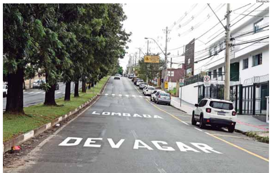
Avenida Antonio Pizinato Sturion sinalizada

VIAS ATENDIDAS - Avenida Raposo Tavares; Avenida Jus-