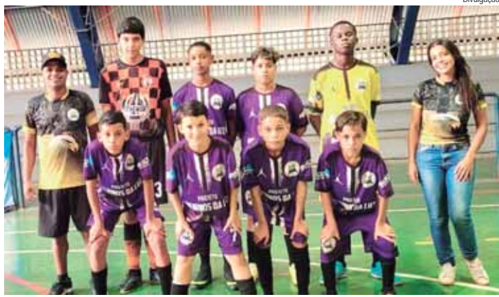
Equipe Vila Industrial do Projeto Meninos da Luz

A partir das 15h, entram em quadra o Sol Nascente diante do Cecap (sub-12) e o Bosque con-