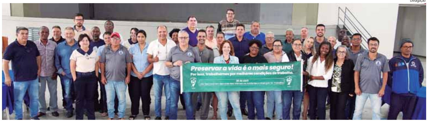
Dirigentes do Instituto Sindical que participaram do encontro Comitê Prevenção aos Acidentes de Trabalho, realizado no Clube dos Metalúrgicos