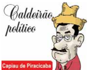
Capiau de Piracicaba

mentações contrárias à aprovação da PEC que retira R$ 10 bilhões da educação paulista. E venceu mais uma etapa. A9