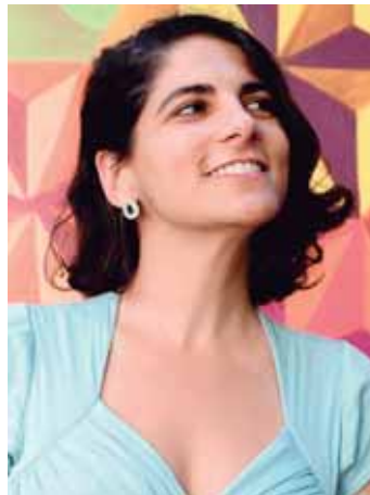
Lorena Kaz é escritora, ilustradora e quadrinista brasileira