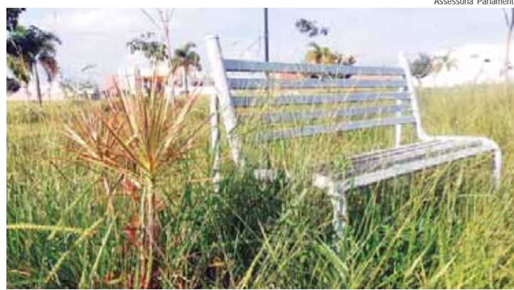
Indicações do vereador André Bandeira (PSDB) solicitam providências do Executivo para corte de mato e manutenção de praça, além de luminárias em praça do bairro

O vereador André Bandeira (PSDB) protocolou duas indicações: 1657/2024 e 1658/2024 que, respectivamente, solicitam providências do Executivo no corte de mato e manutenção da praça localizada na avenida Antônio Elias, nº 250, no bairro Terras di Treviso, além da instalação de iluminação pública nesta mesma localidade.