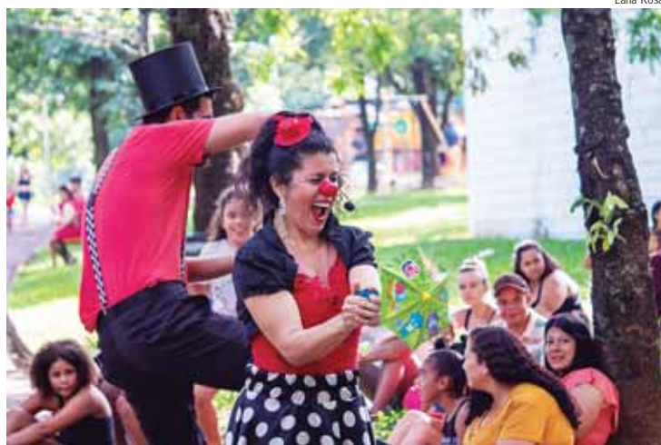
Palhaços divertem crianças; apresentação acontecerá às 15 horas

A Cia Atitude, que celebra seu 16º aniversário em 2024, desenvolve trabalhos educativos, culturais