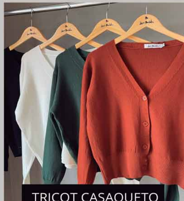
TRICOT CASAQUETO R$199,90