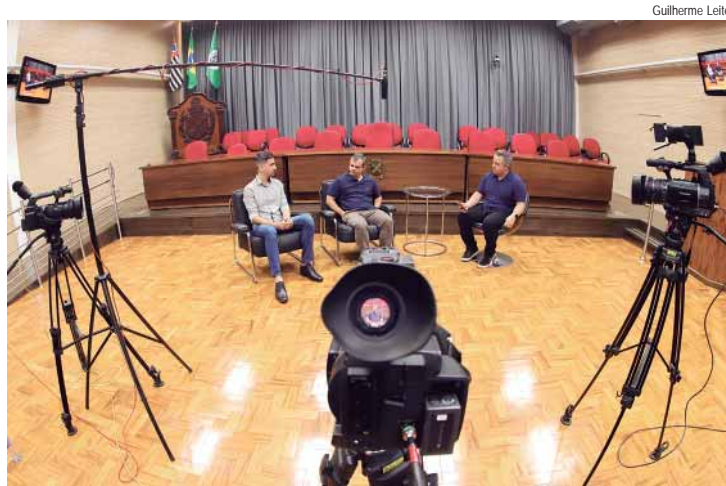
Programa "Câmara Convida" conversa com os servidores do Departamento de Tecnologia da Informação