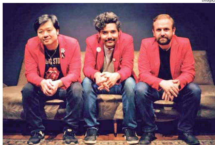
Os Londrinos se apresentam neste sábado (20)

Com apoio da Prefeitura, por meio da Semac (Secretaria Municipal da Ação Cultural), a praça José Bonifácio, no Centro, recebe o 1º FastFood da Catedral, que une gastronomia e música durante quatro dias. O evento começou ontem (18) e segue até domingo (21). Hoje e amanhã, é das 18h às 22h. No último dia, domingo (21), será das 12h às 20h.