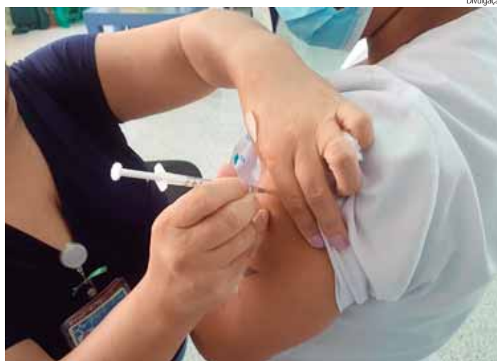
Campanha de vacinação contra gripe realizada na Santa Casa de Piracicaba em 2023