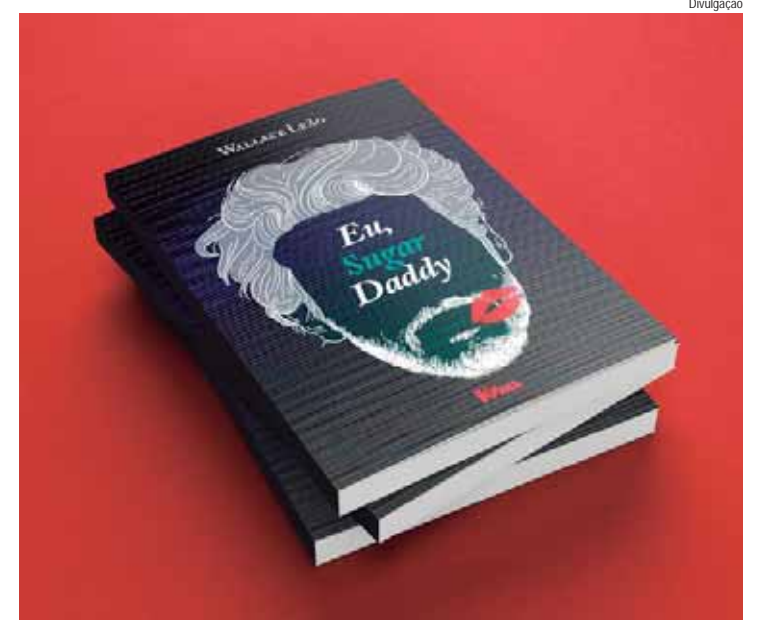
Atualmente, o Brasil possui cerca de 15 milhões de sugars (entre “babies”, “daddies” e “mommies”)

“Quando nos conhecemos, era como se fosse a materialização de sonho. Ela era idêntica à Audrey Hepburn, a protagonista do clássico Bonequinha de Luxo. Mas durante nosso primeiro encontro ela me revelou sobre seu câncer hereditário. A partir dali criamos uma intimidade única na vida. Quando contei sobre esse livro, ela fez questão de ver o manus-