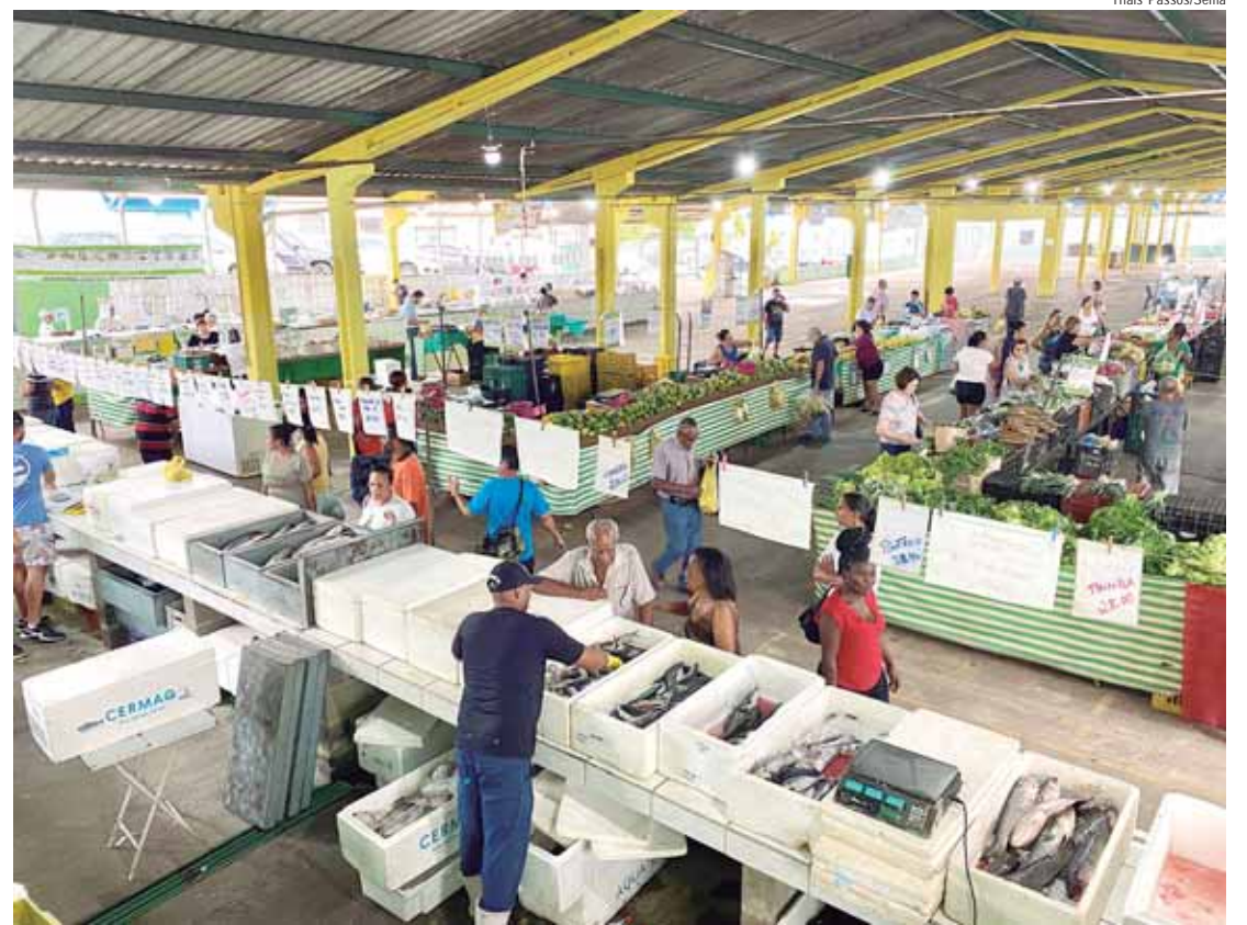
Reforma é uma demanda antiga do varejão, verificada pela Sema e permissionários