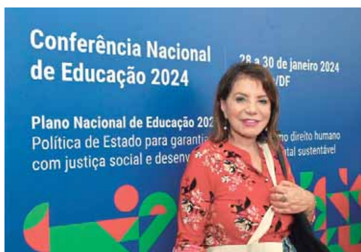
A deputada Professora Bebel na da 4ª Conferência Nacional de Educação, em Brasília, em janeiro de 2024

Para este ano, estão previstas novas unidades de supermercado e de drogarias, além de melhorias em infraestrutura e tecnologia, visando intensificar ainda mais os três atributos da marca: convivência, consciência e conveniência.