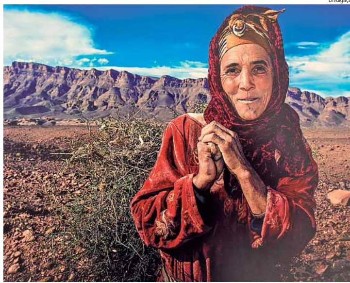
Pessoas comuns em Marrocos são foco da fotografia de Fran Camargo

Num processo de desaceleração do seu trabalho com o esporte, voltou seus sonhos, olhos