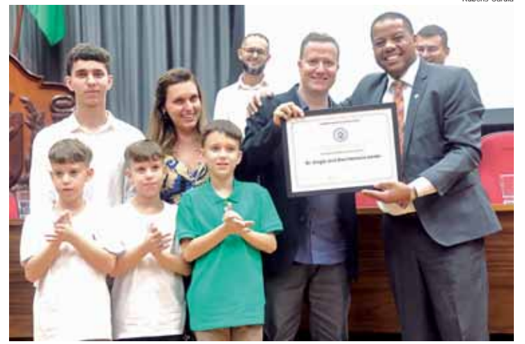
O homenageado nasceu em 26 de junho de 1977, em Sorocaba

terligado com situações reais, e todos os professores, sem exceção, aplicam em suas vidas aquilo que ensinam. A FAC foi reconhecida como a quinta melhor instituição de ensino privado do Brasil, conforme uma pesquisa de qualidade publicada no Guia da Faculdade, uma iniciativa conjunta do jornal O Estado de S. Paulo e da Quero Educação. Possui 112 polos distribuídos em 12 estados. A expectativa é alcançar 3200 alunos ativos em 2024.