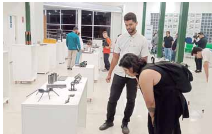
A exposição foi montada no hall da biblioteca