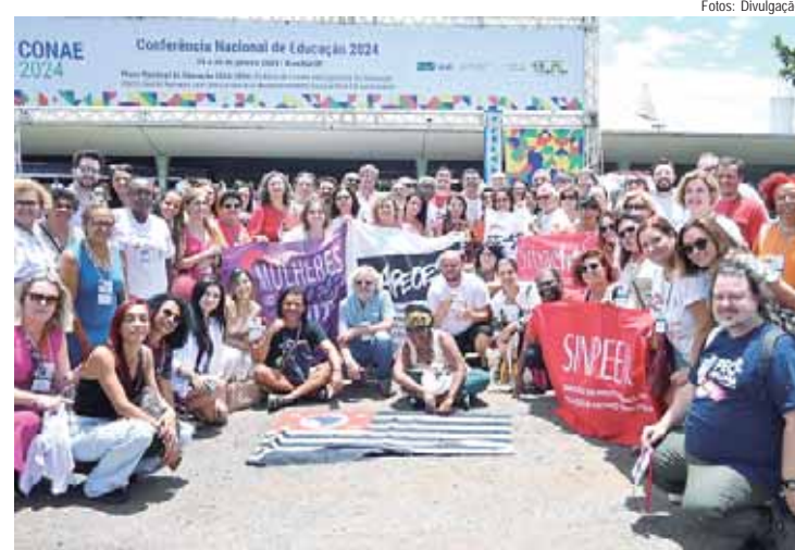
Os debates da Conae contou com a participação efetiva da Apeoesp e de educadores de diversas regiões do país