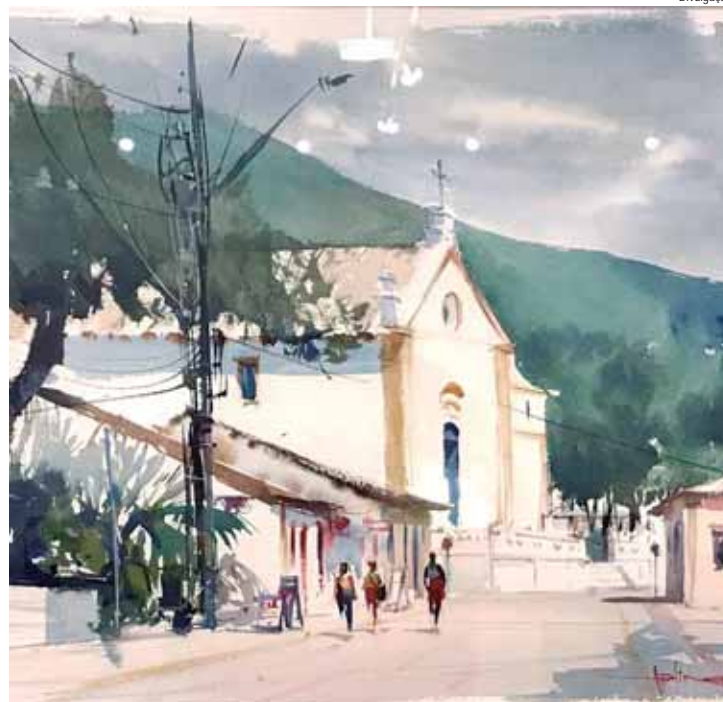
Em 2020, Carlos Avelino foi Prêmio Aquisitivo Prefeitura de Piracicaba com a obra Santo Antonio de Lisboa - Florianópolis

TÉCNICA – Aquarela é uma técnica de pintura na qual os pigmentos se encontram suspensos ou dissolvidos em água. Os suportes utilizados na aquarela são muito variados, embora o mais comum seja o papel com elevada gramagem. Isso porque é necessário que o papel seja mais grosso visto a utilização da água, fazendo com que não haja deformações no papel. São também utilizados como suporte o papiro, casca de árvore, plástico, cartolina, couro, tecido, madeira e tela.