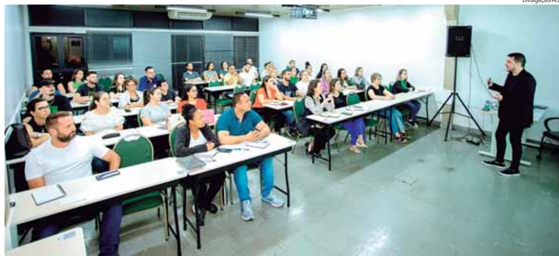
Até o dia 15 de abril, estão abertas as inscrições para o vestibular 2024 1.2 do Polo FAC Faculdade do Comércio da Escola de Negócios da Acipi

Os cursos de graduação e pós-graduação são oferecidos na modalidade EAD (Educação a Distância) e contam com nota máxima no MEC. Entre as opções de graduação estão Análise e Desenvolvimento de sistemas; Ciências contábeis; Gestão comercial; Gestão em logística; Gestão em Recursos Humanos; Sistemas para internet; Comércio exterior; Gestão financeira e Gestão em Marketing. Para quem deseja cursar uma pós-graduação, estão disponíveis os cursos de Comércio Exterior e Negócios Internacionais; Gestão de Projetos; Gestão Estratégica de Negócios; Gestão Finan-