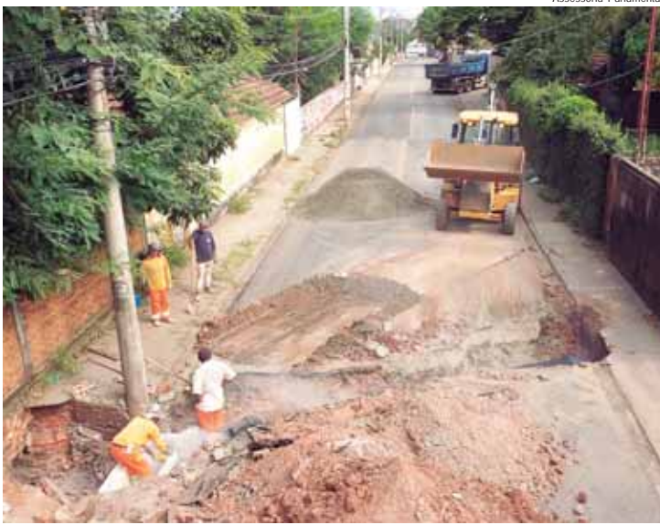
Trecho da rua Angelino Stella está interditado enquanto recebe adequações no sistema de drenagem