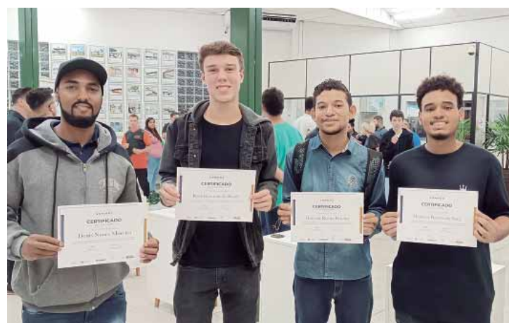
Alunos exibem o certificado de conclusão