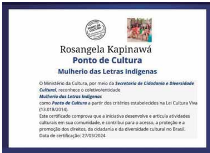
Roshina reside em Piracicaba e, agora, é Ponto de Cultura