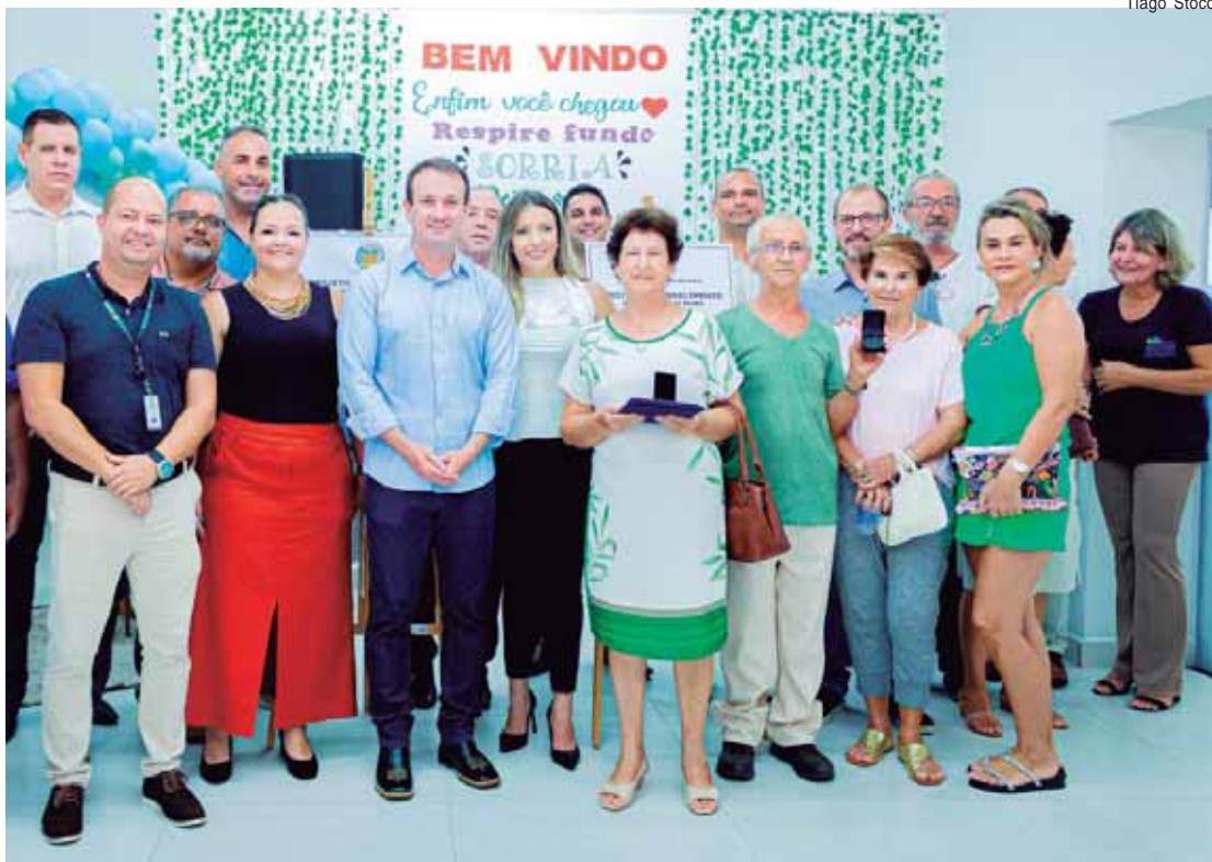
Projeto foi inaugurado no Fundo Socialmente de Solidariedade