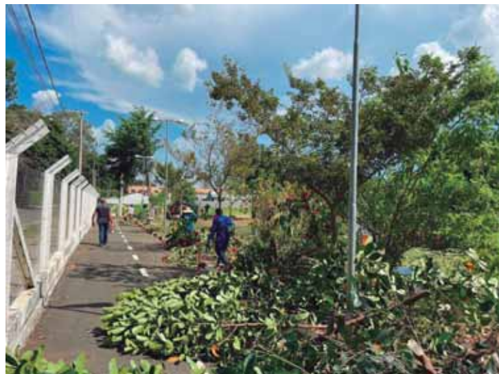
Manutenção da arborização e remoção de espécies invasoras