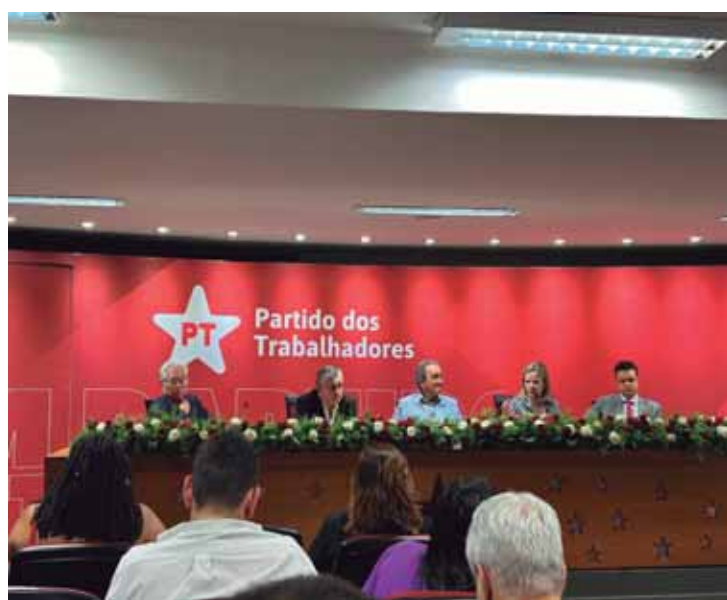
A abertura do seminário foi feita pela presidenta nacional do PT, Gleisi Hoffmann, e reuniu diversas lideranças do partido