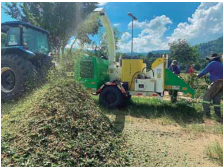
Triturador foi usado na ação