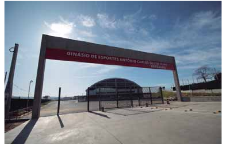
Bordadão, de São Pedro

Ao todo, 6 equipes divididas em 2 grupos se enfrentarão para disputar o título de Campeão. Confirmaram participação equipes de São Pedro, Barra Bonita, Rio Claro, Santa Gertrudes, Piracicaba e Brotas. Os eventos foram planejados para atrair toda a família e a entrada no Ginásio é gratuita.