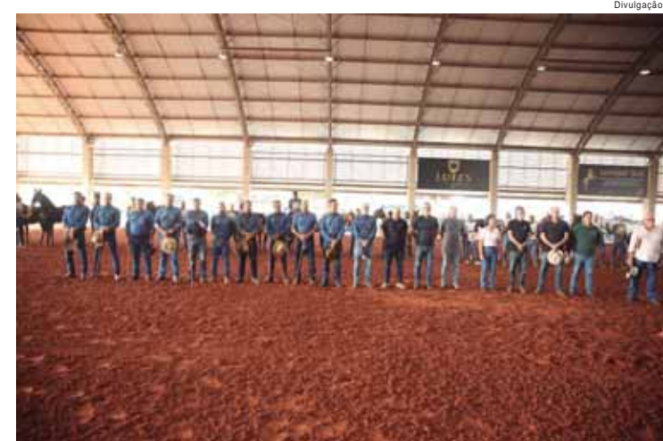
Evento acontece no Haras NSG, em São Pedro