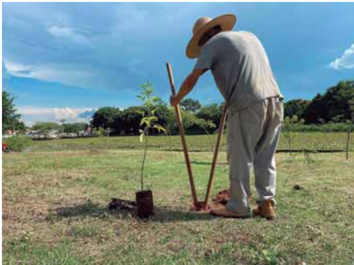
30 árvores nativas serão plantadas no Novo Horizonte

"Ao atender à demanda dos moradores do bairro Novo Horizonte, reforçamos nosso compromisso em garantir excelentes condições para o uso desses espaços verdes. É nossa responsabilidade assegurar a qualidade de vida da comunidade e a harmonia com o meio ambiente, mantendo os parques como locais seguros e agradáveis para todos desfrutarem," disse.