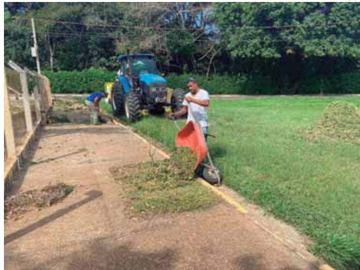
Material triturado sendo agregado no plantio