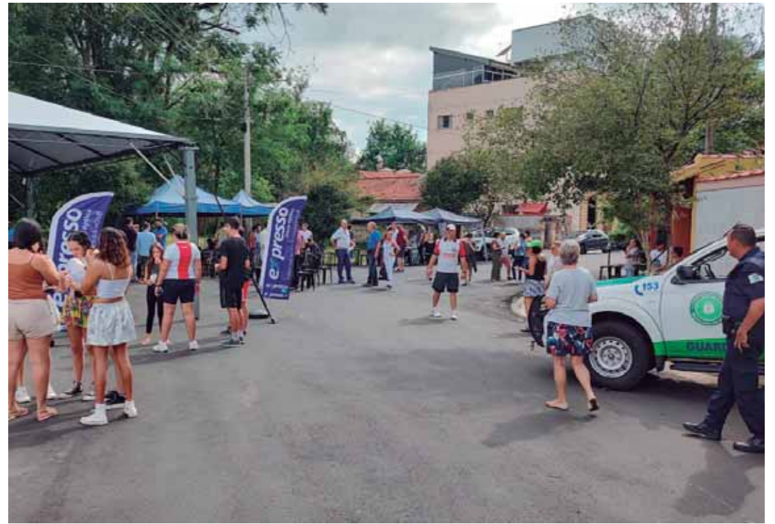
O ponto de atendimento será em frente ao Relógio do Sol

SEGURANÇA PÚBLICA - Tirar dúvidas e escutar as demandas da população